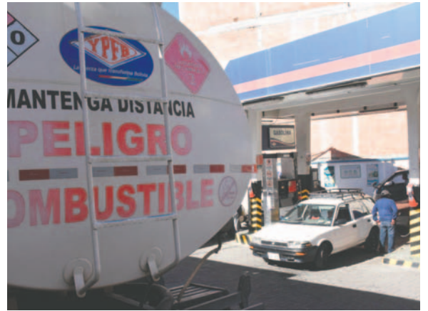
Un vehículo carga combustible en una estación de servicio