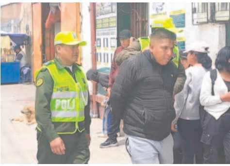
El autor del trágico accidente fue aprehendido por la División Especiales

su madre iba de camino al trabajo cuando ocurrió el accidente fatal. Asimismo, detalló que hallaron botellas de cerveza en el vehículo protagonista.