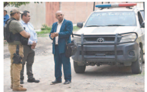
En operativo, aprehenden a adolescente por grabar a menores

“Una plataforma digital de almacenamiento masivo identificó la presencia de material de abuso sexual infantil, por lo que, de manera rápida, se realizaron todas las acciones pertinentes. Se ha realizado, en primera instancia, el rescate de las víctimas”, manifestó Canaviri. También se señala que en el registro del lugar del hecho se identificó que las imágenes coinciden con