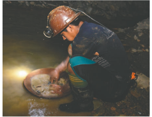
Un cooperativista minero extrae oro de un río de la provincia Inquisivi /REFERENCIAL

Sirpa no descartó que la estación de servicio pueda ubicarse más al Norte del departamento de La Paz, en poblaciones como Teoponte o Mayaya; sin embargo, la decisión depende del consenso que se logre entre todos los cooperativistas mineros auríferos. El Gobierno aprobó en noviembre pasado el Decreto Supremo 5271, que autoriza excepcionalmente a personas naturales o jurídicas privadas la importación de diésel y gasolinas para su comercialización