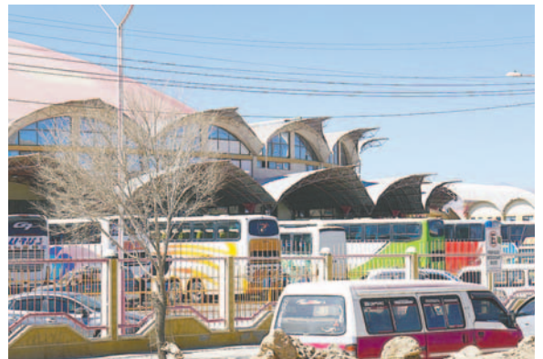
Los horarios fueron definidos con base en la lejanía de cada destino

En el caso de salidas internacionales, para el sábado 14 de diciembre solo se permitirán los viajes a Chile hasta las 16:00 horas, mientras que, a Argentina, los viajes también quedan suspendidos