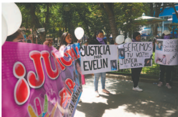
Con pancartas, exigen justicia y captura del autor del octavo feminicidio en Oruro

aseguró que cree en la justicia divina y que Dios juzgará al autor; no obstante, pidió que den con la captura del sospechoso.