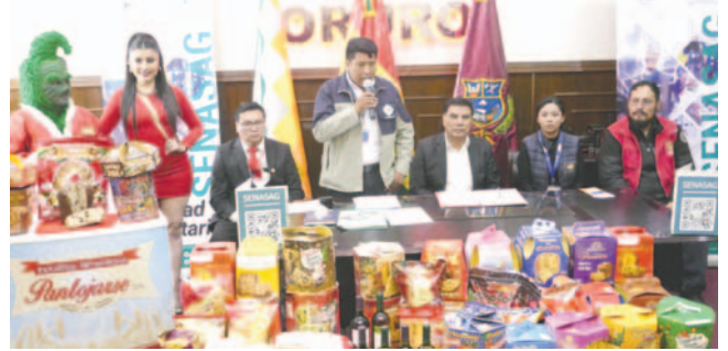
Presentan lista oficial de panetones y roscas para fiestas de fin de año

o algún producto no vigente, no duden en comunicarlo al Senasag y se realizarán las diligencias correspondientes para mantener la inocuidad de los alimentos", manifestó Huayllani.