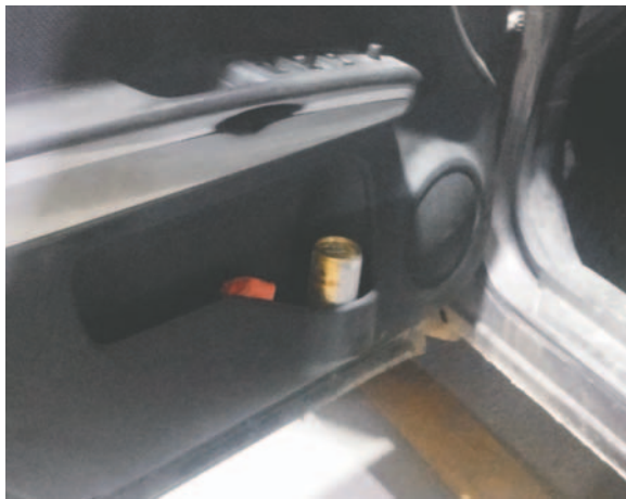
Hallaron cerveza dentro del motorizado; ambos ocupantes dieron positivo a alcohótest

Indicó que durante una revisión en el motorizado hallaron en la puerta del conductor una lata de cerveza con contenido. “Ambas personas han sido aprehendidas y el vehículo secuestrado y puesto a disposición del