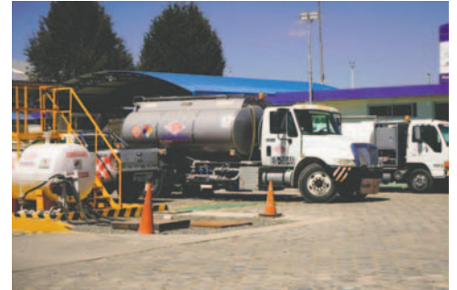
YPFB comunicó que el pago por suministro de combustible a aerolíneas no cambió

IATA, que representa a las aerolíneas internacionales, confirmó su conformidad tras una reunión con YPFB Aviación y la Dirección General de Aeronáutica Civil (DGAC). Además, la organización reafirmó su compromiso de trabajar con el Gobierno boliviano para garantizar la sostenibilidad del