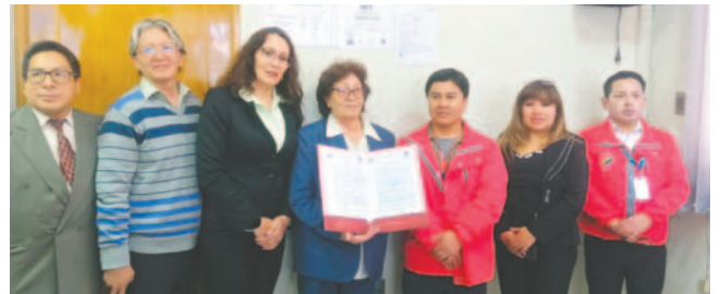
Personal de la Clínica Unior junto con la autorización del Sedes / UNIOR

"Hacemos llegar nuestra felicitación por culminar este largo recorrido, para cumplir con todos los requisitos, porque queremos que la