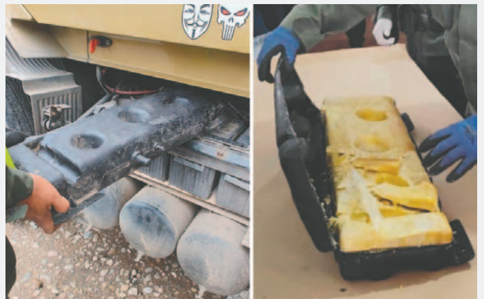
El conductor boliviano fue aprehendido tras ser sorprendido con sustancias controladas

Se efectuó la apertura del depósito y se corroboró la existencia de 14 kilos con 955 gramos de cocaína, informó la Gendarmería de Argentina. El rodado quedó decomisado tras la detención del conductor.