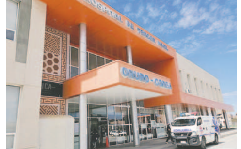
Avanza proyecto de la Segunda Fase del Hospital de Tercer Nivel Oruro-Corea

"No hay que confundir. Se va a concluir la Segun-