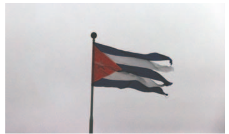
Fotografía de archivo donde se ve una bandera de Cuba ondeando en La Habana

Para designar a un país como patrocinador del terrorismo, la legislación estadounidense exige al secretario de Estado que determine que el Gobierno de dicha nación ha brindado apoyo