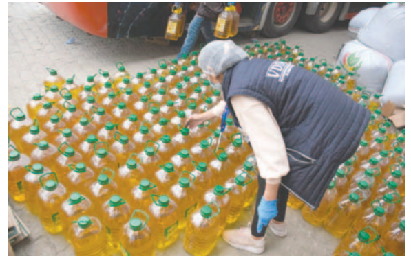
El aceite escasea y subió de precio en el país

En la reunión de este jueves, Caniob y el Gobierno acordaron realizar reuniones constantes y continuar con las visitas a las plantas productoras, aunque no proporcionaron una fecha específica para el siguiente