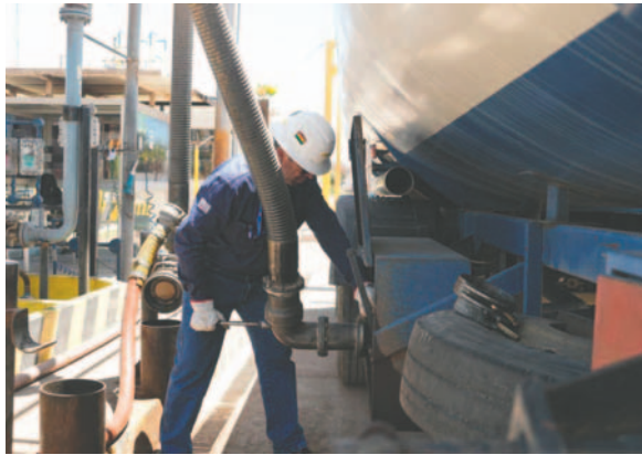
En Bolivia autorizaron a privados la importación y comercialización de combustibles /REFERENCIAL

za la normativa, se orienta a los interesados y se agiliza el trámite, que no debería demorar más de cinco días. Para la importación de carburantes, las personas naturales o jurídicas deben cumplir con los requisitos establecidos en el parágrafo II, artículo 3 del Decreto Supremo 28419 de 21 de octubre de 2005, modificado por el Decreto Supremo 5218 de 4 de septiembre de 2024.