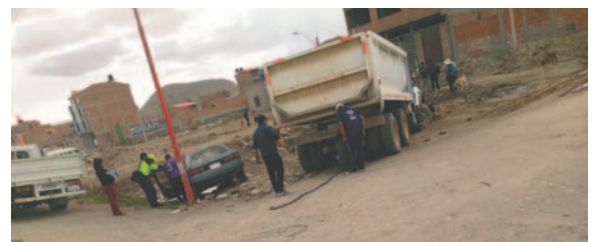
Los dos motorizados terminaron a un costado de la carretera, tras colisionar / TRÁNSITO

evitar el choque, efectuaron una maniobra evasiva, terminando a un costado de la vía, pero no impidieron el accidente.