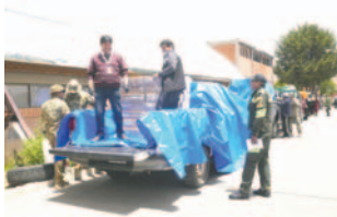
Salida de los vehículos del Centro Departamental Logístico hacia las provincias

“El personal está compuesto por el chofer por supuesto, un funcionario del TED Oruro que ha sido contratado como responsable de la ruta electoral, un funcionario policial y otro de las Fuerzas Armadas. Esta ruta no se va a separar hasta entregar al recinto electoral, al notario electoral y, por lo tanto, a los jurados electorales en las mesas que corresponden para la jornada electoral. Hay absoluta seguridad y forma parte de la cadena de custodia que se ha venido implemen-