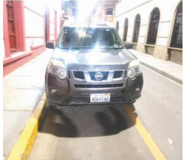
El coche de uso oficial fue secuestrado por la fuerza anticrimen

“Acá, juntamente con el fiscal, se realiza la prueba de alcotest con el siguiente resultado: para el conductor, 1,48 miligramos de alcohol por litro, y para la acompañante, 1,50”, señaló.