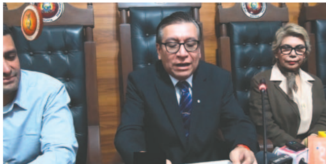
El presidente del Tribunal Constitucional Plurinacional, Gonzalo Hurtado, brinda una conferencia de prensa

Recordaron que el único órgano del Estado encargado de emitir una convocatoria a las elecciones judiciales es la Asamblea Legislativa, pero que “es evidente que no cumplió con los tiempos establecidos, menos aún con la sanción de una ley”.