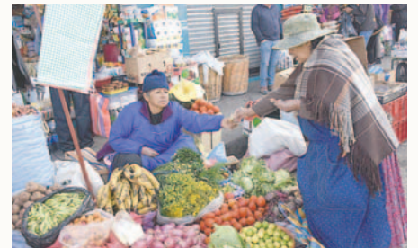
Venta de alimentos en el mercado Rodríguez de la ciudad de La Paz