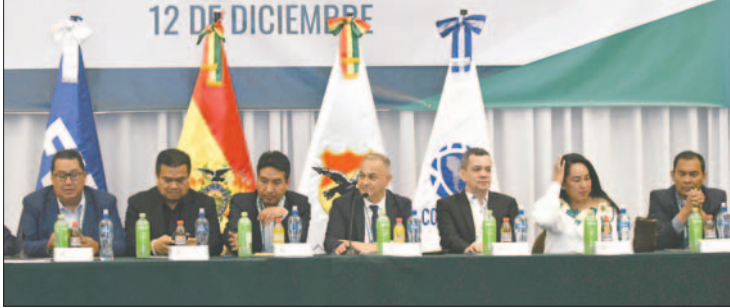
El Congreso de la FBF se realizó el jueves en La Paz