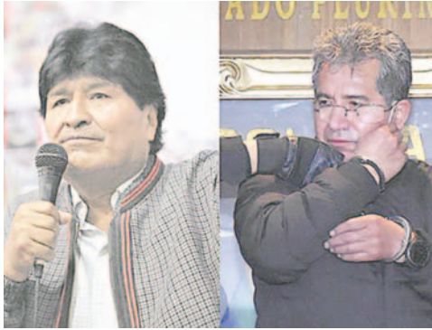
El expresidente Evo Morales y el exjefe antidroga Maximiliano Dávila

Evo Morales expresó su descontento en redes sociales: “Bolivia vuelve a ser una colonia de Estados Unidos. Los bolivianos son entregados al imperio norteamericano, violando los acuerdos internacionales, sin ser, primero, juzgados en su patria”. Además, instó a los “vendepatria” a