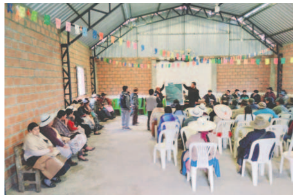
El objetivo de la fase deliberativa es informar sobre el proyecto minero a la comunidad

El proceso busca cumplir con el marco normativo establecido y respetar los derechos colectivos de las poblaciones involucradas.