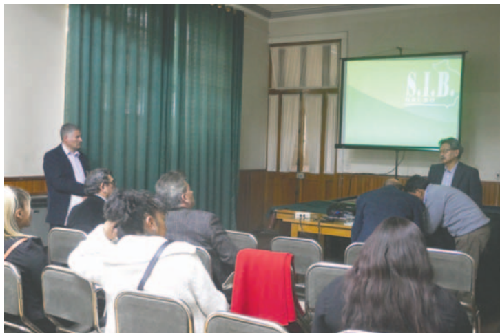
El evento se desarrolló el sábado 7 de diciembre

la participación de 22 profesionales que llegaron a la ciudad de diferentes regiones, como La Paz, Cochabamba, Santa Cruz y Potosí.