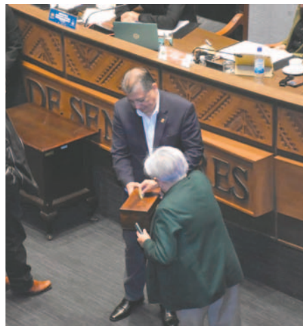
El Senado aprobó la minuta poco antes de la sesión de la ALP /APG

El PGE 2025 asciende a 296.566 millones de bolivianos, representando un incremento del 11,7% respecto al presupuesto anterior. Este plan económico proyecta un crecimiento económico del 3,51% y una inflación anual del 7,5%.