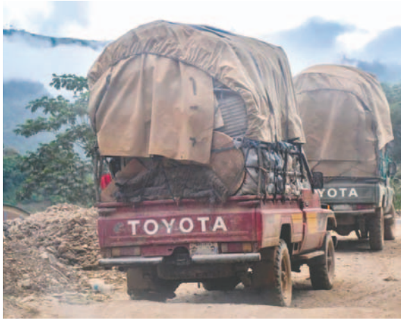
Dos camionetas del sector minero trasladan barriles de combustible en La Paz

En las próximas horas, este sector tomará decisiones orgánicas respecto a la falta de provisión de diésel. Los centenares de afiliados a Ferrec aún no han decidido la instalación de una estación de diésel en la localidad de Guanay o más al Norte del departamento de La Paz, destinada a mejorar la opera-