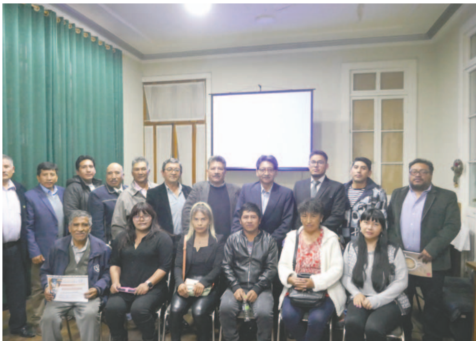
Varios profesionales en minería participaron del III Encuentro Nacional

la participación de 22 profesionales que llegaron a la ciudad de diferentes regiones, como La Paz, Cochabamba, Santa Cruz y Potosí.