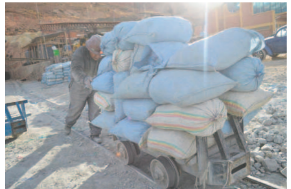
Destacaron que fue importante los controles para generar importantes ingresos /REFERENCIAL

una gestión enfocada en mejorar los ingresos departamentales mediante una supervisión más estricta.