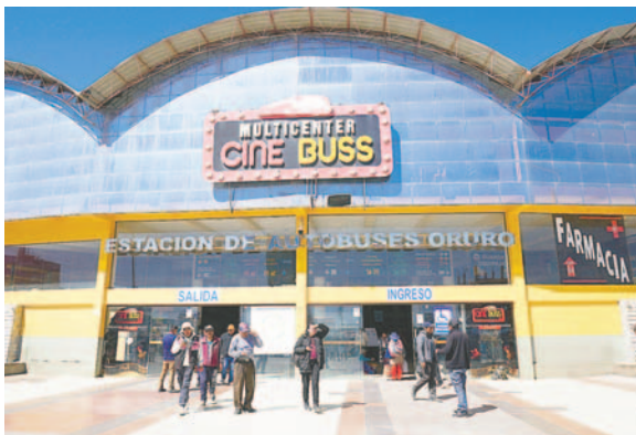
Últimas salidas para viajes desde la Estación de Autobuses Oruro serán el sábado 14 de diciembre

A La Paz, las salidas serán hasta las 18:00 horas; a Cochabamba hasta las 17:00; al igual que a Potosí y Uyuni. Con destino a Sucre, en cambio, el último bus debe partir a las 14:00 horas por la lejanía del destino.