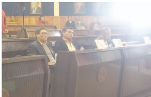
Los candidatos pudieron expresar sus ideas a la población

rán justicia, en ese sentido me parece una metodología acertada, porque una cosa son las leyes y otra cosa es la justicia. Yo creo que la justicia está en la capacidad analítica de un juez, en la capacidad de aplicar la realidad a la ley, no sólo aplicar la ley a letra muerta, debe entender lo que lee, revisar y conocer mucha filosofía, porque los grandes jueces no siempre han sido abogados, sino han sido gente formada en ciencias humanas", dijo el periodista.