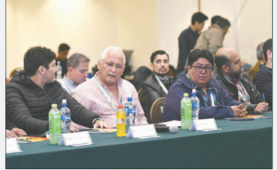
Dirigentes de los clubes de la División Profesional /APG