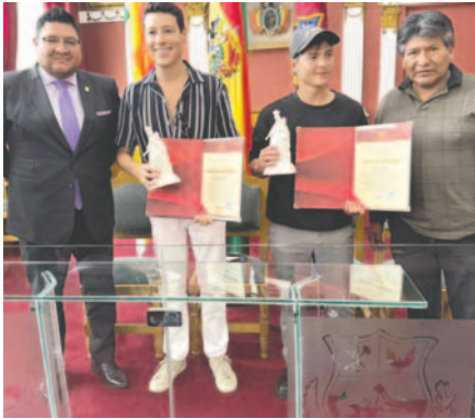
Los actores fueron reconocidos por el taller que dieron en Oruro