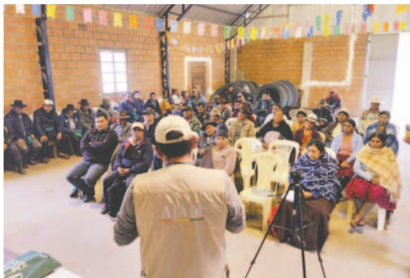
Las máximas autoridades comunarias junto a la población y el APM solicitante participaron de la reunión de deliberación

A convocatoria de la AJAM, las máximas autoridades comunarias, junto a su población base y el APM solicitante, participaron en la reunión de deliberación programada. En este encuentro estuvo presente el Servicio Intercultural de Fortalecimiento Democrático (SIFDE), dependiente del Órgano Electoral Plurinacional.