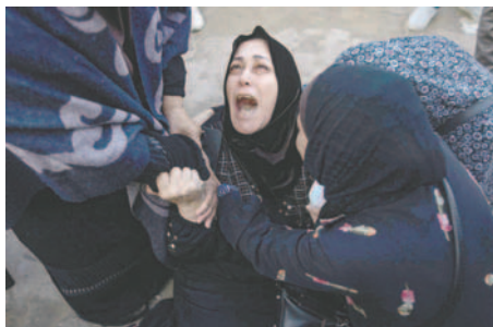
Los palestinos lloran junto a los cuerpos de sus familiares que fueron asesinados en un ataque aéreo israelí, al oeste de Khan Younis en el sur de la Franja de Gaza