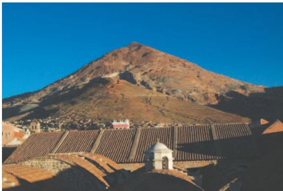
La Gobernación de Potosí planificó recaudar Bs. 710 millones pero ya colectaron cerca de 813 millones