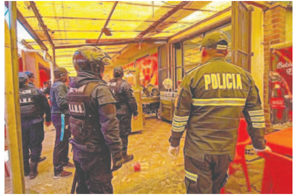
Por las elecciones judiciales, rige ley seca en Oruro

Según Canqui, estos controles se efectuarán no solo a actividades económicas con licencia de funcionamiento para expendir bebidas alcohólicas, sino también a las tiendas de barrio y centros de abasto que pretendan comercializar este tipo de productos.