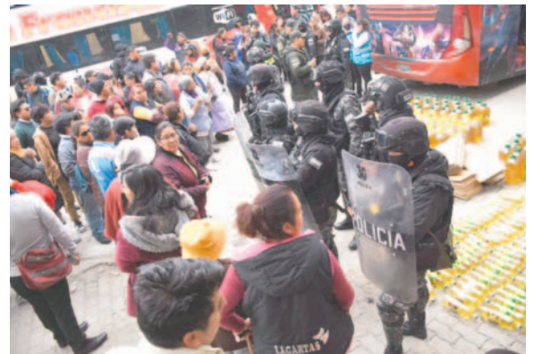
Varias personas se juntaron en el lugar

Se constató que el aceite no tenía registro sanitario. El producto fue decomisado y siete personas fueron denunciadas por su traslado sin el respaldo respectivo. Ante esta situación, las personas presentes comenzaron a reclamar