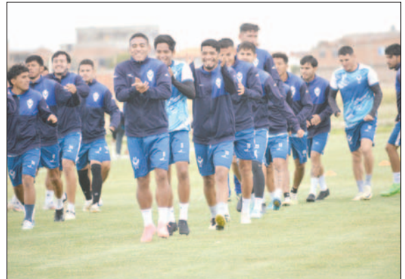
Reina el buen ánimo en los jugadores de GV San José / LA PATRIA

Bajo esa meta, el conjunto orureño realizó ayer un nuevo entrenamiento en el complejo "Húnga-