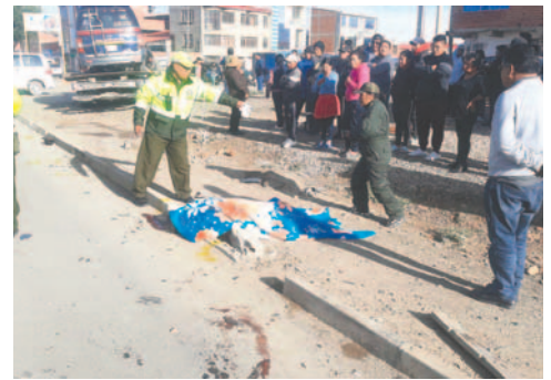
La mujer de 52 años murió al ir a su trabajo

El fiscal asignado a la investigación, José Luis Huarachi, confirmó que el conductor implicado dio positivo a la prueba de alcohol test y que será imputado por los delitos de homicidio, lesiones