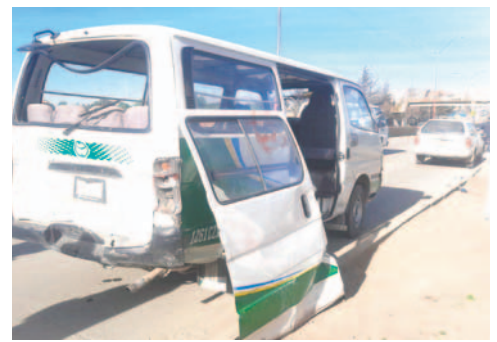
El minibus de servicio público registró daños materiales

graves y gravísimas en accidente de tránsito y omisión de socorro.