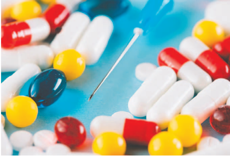
La industria farmacéutica pide acciones urgentes para que no falten medicamentos /REFERENCIAL

Cifabol señala que cuenta con la capacidad e infraestructura suficiente para ampliar la producción y diversificar la oferta