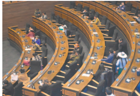
Lo más probable es que el presupuesto del Estado no sea tratado por la ALP