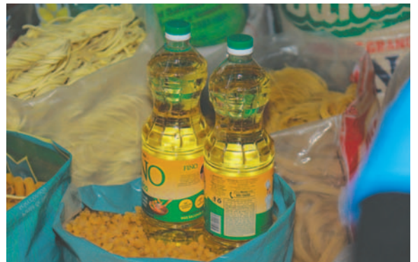
De momento sigue prohibida la exportación de este producto