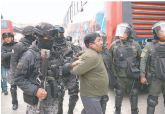
Tres personas fueron detenidas

Los aceites fueron encontrados en un bus que llegó a las 08:30 horas y los bidones estaban ubicados en los asientos. Se contabilizaron unos 700