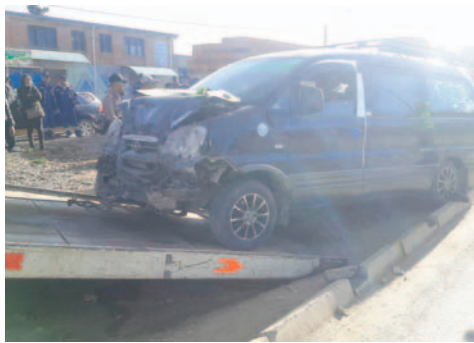
El auto del implicado fue secuestrado para fines investigativos