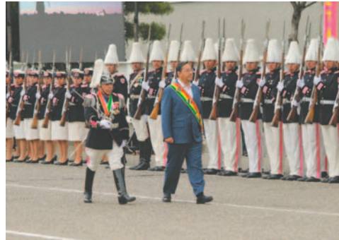
El Presidente participó del acto de aniversario del Ejército

En el evento, el Presidente también destacó la importancia de la modernización técnica y operativa de las Fuerzas Armadas. Instó a actualizar la doctrina militar, definiendo un pensamiento estratégico acorde con las necesidades actuales y libre de