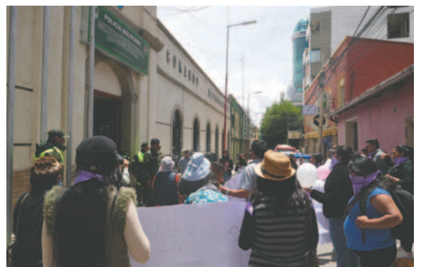
Marcha en el frontis del Comando de Policía; se reúnen con el director de la Felcv