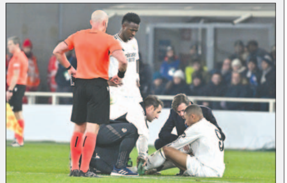
Kylian Mbappé salió lesionado en el partido contra el Atalanta

El club, le mantendrá de baja unos diez días, por lo que es baja segura para la visita a Vallecas este sábado para medirse al Rayo Vallecano y no está garantizada su presencia en la convocatoria para la Intercontinental del próximo miércoles.