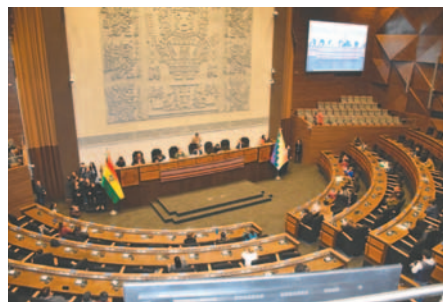
Los escaños en la ALP se definen por los resultados del censo y una ley que debe ser tratada

Creemos sostiene que el tratamiento de esta norma es prioritario para garantizar una representación justa de todas las regiones en el Legislativo y evitar retrasos en el proceso de asignación, además de ser vital para la democracia.