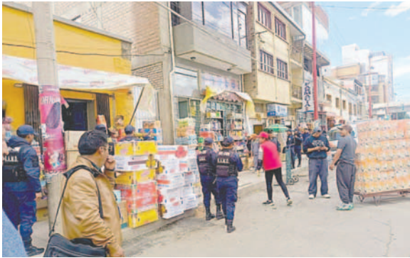
En la jornada electoral, la Guardia Municipal realizará operativos para el despeje de comerciantes

Debido al Auto de Buen Gobierno por las elecciones judiciales, que establece la prohibición de venta y consumo de bebidas alcohólicas que rige desde las 00:00 horas de este viernes, la Unidad de Defensa al Consumidor realizará los controles correspondientes en locales para el cumplimiento de la disposición.