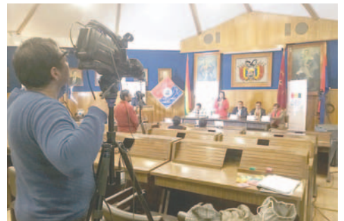
Los foros fueron difundidos por medios de comunicación

La propuesta de interacción de las candidaturas con los panelistas despertó el interés de la población, estableciendo una metodología distinta y