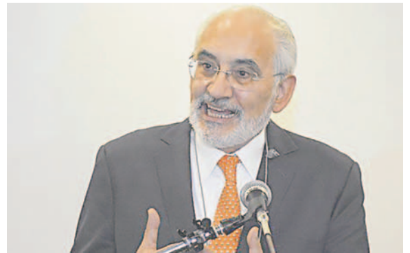
El expresidente y líder de CC, Carlos Mesa

Manifestó que el socialismo del siglo XXI es un ejemplo de lo que fue un gran fiasco histórico. Añadió que 14 años después de Morales y cuatro años después de Luis Arce, lo que hay es un desastre económico, una crisis de producción, una crisis institucional y una deconstrucción total de los valores esenciales de la sociedad. Comentó que países como Venezuela han traicionado los valores fundamentales de la democracia.