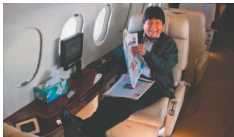
Evo Morales califica de ‘gasto innecesario’ el avión presidencial e insta a rechazar el Presupuesto del Estado

Morales instó a la Asamblea Legislativa Plurinacional a rechazar el proyecto, advirtiendo sobre las consecuencias negativas para los sectores