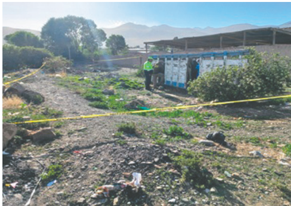
Buscan identificar al conductor que atropelló y mató a un hombre en Challapata / POLICÍA

“La persona que había fallecido se encontraba en un ambiente secundario,