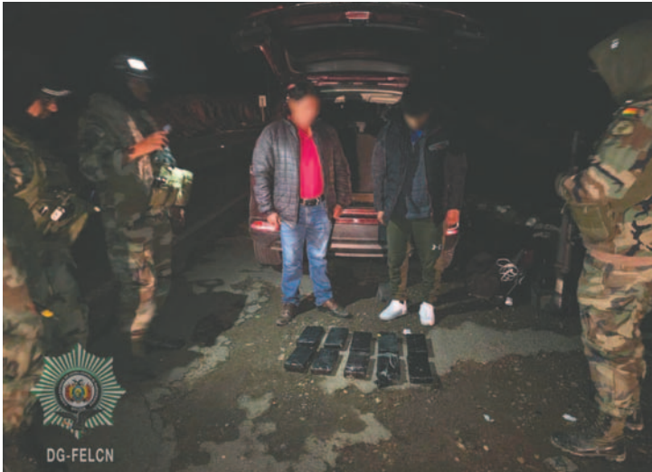
Dos personas fueron aprehendidas tras descubrir que traficaban diez paquetes de droga