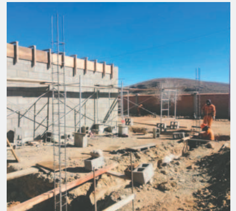
Construcción de la Planta de Prefabricados de Hormigón fue concluida