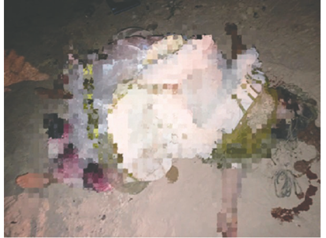
Una mujer de 66 años falleció después del trágico vuelco de campana

El incidente fue reportado a la Policía Rural y Fronteriza. Ambas