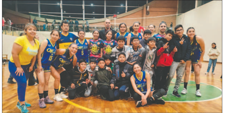
Alegría en las integrantes de Carl A-Z que se cobró revancha ante Tenis La Paz