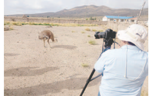
Los creadores de contenido conocieron a los tradicionales suris

El recorrido inició el viernes 6 de diciembre a la 09:00 horas, cuyo punto de partida fue Oruro y concluyó a las 17:00 con el