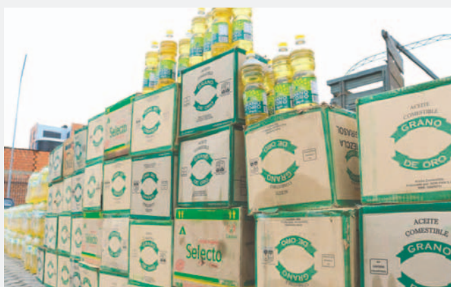
En un exitoso operativo, militares decomisaron 5.000 litros de aceite desviados a Perú

La autoridad aseguró que el producto incautado fue entregado a la Empresa de Apoyo a la Producción de Alimentos (Emapa), para su venta a precio justo.