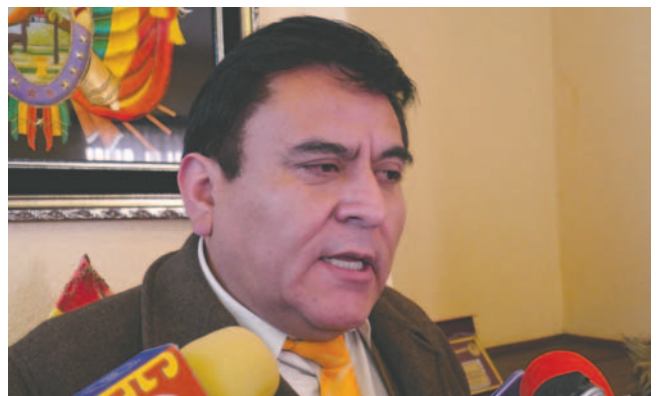
El fiscal Morales precisó que ya trabajan para identificar a los antisociales que perpetraron el robo

No obstante, la persona que atendía no se dio cuenta de que había un tercer sujeto que ingresó al lugar donde se realizan las mediciones y logró llevarse 2.000 dólares