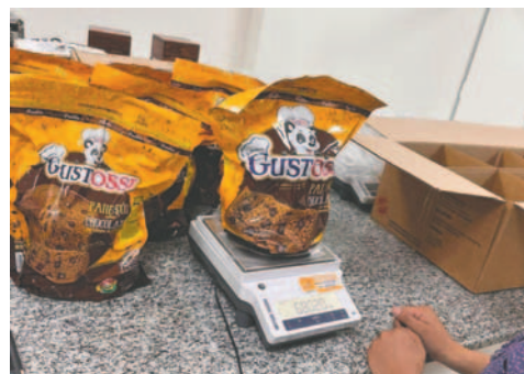
Ibmetro es la entidad encargada de realizar el control metrológico de productos envasados