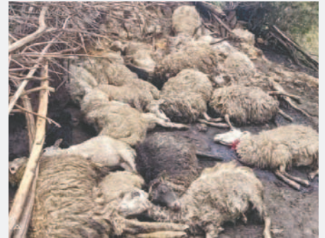
Las ovejas fueron víctimas de la caída de un rayo