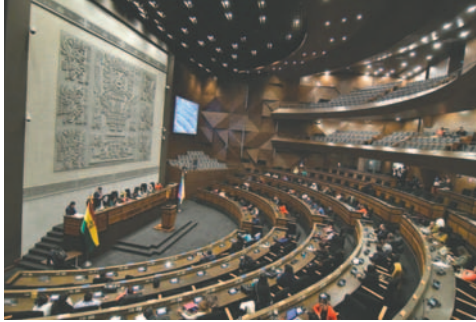
Se espera que entre miércoles y jueves se trate en sesión el PGE /APG

Yujra cuestionó a sus colegas, quienes presun-