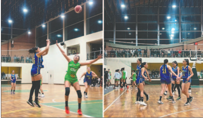
Las "guerreras" supieron apelar a su experiencia para llevarse la victoria

El tercer partido definitivo de la etapa semifinal se jugó el lunes en el coliseo La Florida de La Paz