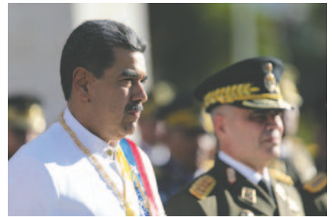
El presidente de Venezuela, Nicolás Maduro, durante un acto de condecoración a 21 venezolanos sancionados por el Tesoro de Estados Unidos

de Siria en Rusia confirmó que el depuesto presidente se encuentra en Moscú, donde habría recibido asilo junto con su familia.