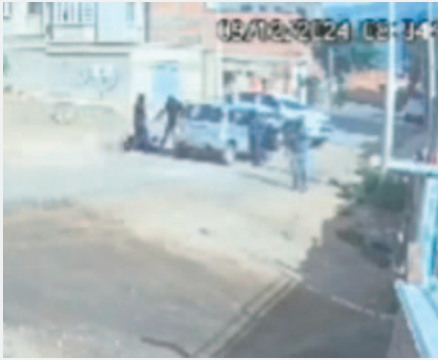
El momento del atraco en la avenida Siglo XX en Cochabamba