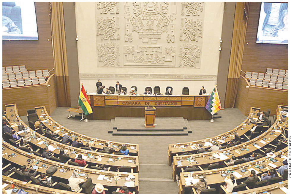
CÁMARA DE DIPUTADOS