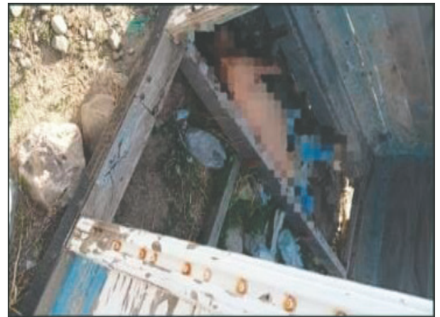
El cadáver fue descubierto en un lote baldío

Se están haciendo las indagaciones correspondientes para determinar con veracidad lo que habría ocurrido”, puntualizó.