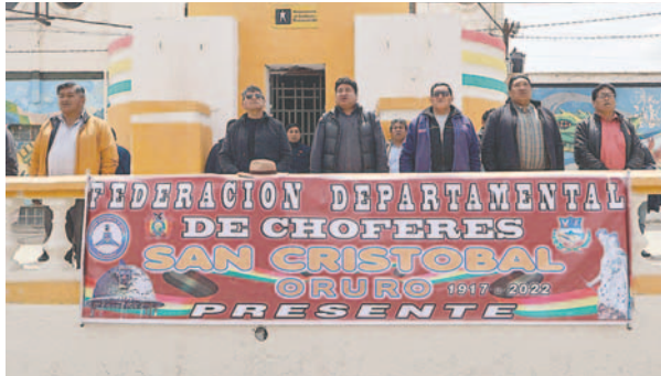
Ayer marcharon todos los sectores y sindicatos de la Federación de Chóferes San Cristóbal

“Se ha determinado que vamos a hacer una comisión, esto va a ser a nivel nacional del sector del transporte, nos vamos a organizar y concentrar en la ciudad de La Paz,