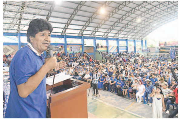
El exmandatario Evo Morales

Ajpi también mencionó: "Yo me puedo postular, ofrecerme, pero no es bueno ofrecerme, son las bases quienes van a elegir a su candidato". Resaltó la importancia de permitir que los jóve-