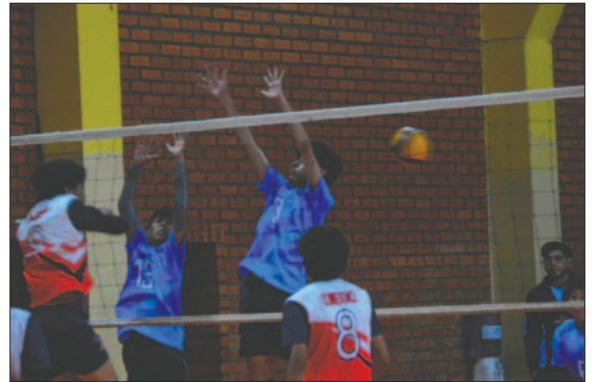
Ataque potosino en la acción, pero Oruro supo hacer mejor las cosas

partidos mejor disputados, Cochabamba se impuso a Santa Cruz por 2 sets contra 0, con los marcadores de 25-23 y 25-15.