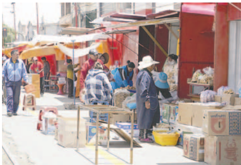
Ferias de temporada continúan asentándose en la Avenida 6 de Agosto

Este estudio, impulsado por la reciente promulgación de la Ley Municipal 274, busca ordenar el crecimiento de estas ferias y se espera que los resultados sean presentados en un plazo de 90 días.