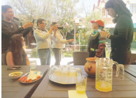
Degustación gastronómica en El Palomar

El primer punto de visita fue el Ingenio Machacamarca, el tercer estadio más antiguo de Bolivia, el cine patrimonial Americans, la chimenea de más de 100 años y se pudo ingresar a las instalaciones