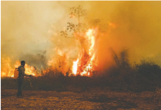
Los incendios forestales afectaron a varias familias en el país

El Gobierno de Luis Arce, en su último reporte sobre los incendios del 13 de octubre, informó que la superficie devastada por los incendios forestales era de 9,8 millones de hectáreas. Santa Cruz es la mayor región de Bolivia afectada por el fuego. Sin embargo, entidades como la privada Fundación Tierra reportaron que el