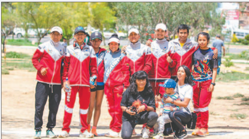
La delegación orureña obtuvo buenos resultados en el nacional Cross Country / FAB

A nivel de delegaciones, Cochabamba terminó en el primer puesto con 137 puntos, el segundo lugar le corresponde a La Paz con 62 puntos y Oruro quedó en el tercer puesto con 28. Luego estuvieron Potosí en cuarto lugar y Santa Cruz en la quinta casilla.