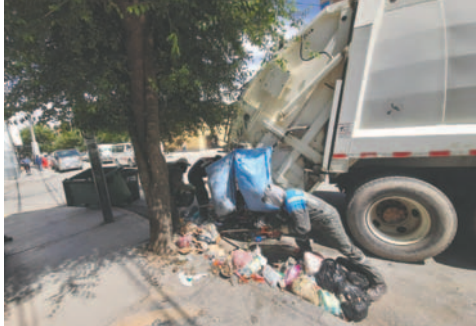
Retrasos en el recojo domicilio se agudizan por falta de diésel

“Es importante aclarar que estamos teniendo un retraso en el servicio, pero las rutas se cumplen; esto está pasando general-