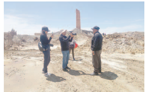
Se exploraron los lugares más emblemáticos de Machacamarca / JUAN SOLIZ