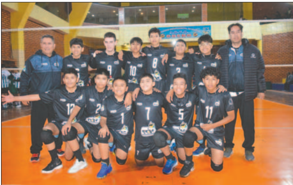
Cochabamba demostró tener un buen equipo, superó a Santa Cruz

En la primera fecha, estos fueron los resultados: Beni ganó a Chuquisaca por 2 sets contra 0, con parciales de 25-12 y 25-15; en el segundo partido, La Paz venció a Tarija por 2 sets contra 0, con anotaciones de 25-14 y 25-16; y en uno de los