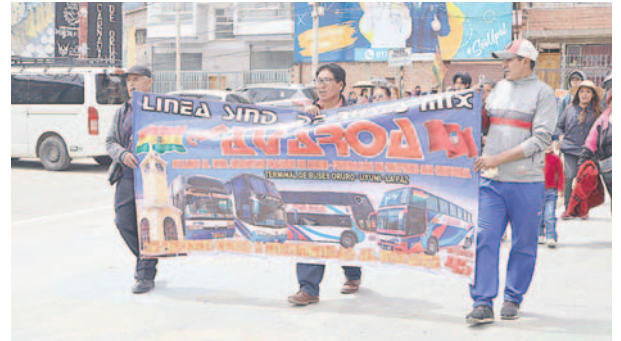
El sector teme que el próximo año la crisis de combustible sea peor

Representantes de varios sindicatos apoyaron la postura de movilizar-se hasta la ciudad de La