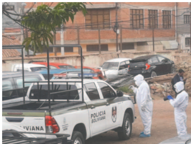
La patrulla en instalaciones de la Fiscalía. Peritos del litcup coleccionan indicios

Según datos preliminares, un uniformado fue arrestado por el crimen; sin embargo, por el hermetismo en las investigaciones, no se conoce cuál es su grado de responsabilidad. Se espera que hoy las autoridades de Policía y Fiscalía se pronuncien sobre el avance del caso.