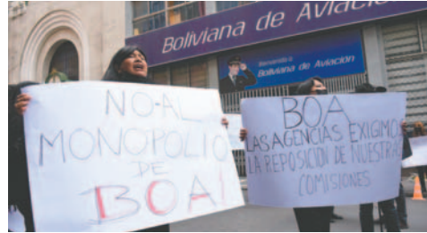
Protesta de las empresas de turismo

La vocal de la Asociación Boliviana de Agencias de Turismo Receptivo