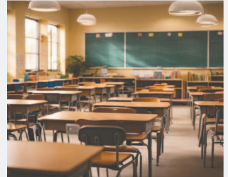
Ministro de Educación anticipa posible fecha de inicio de labores escolares