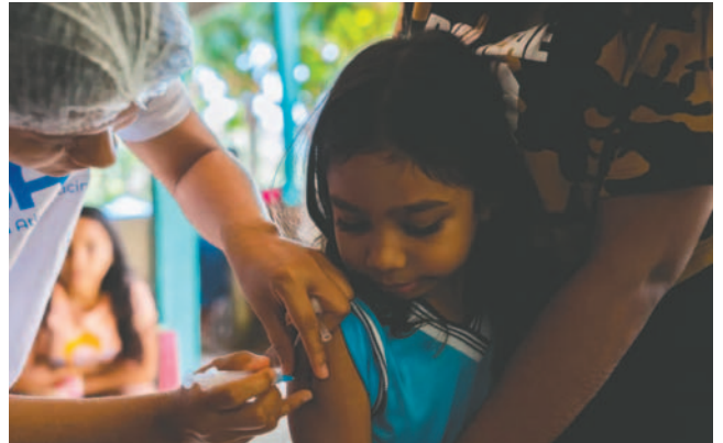
En Bolivia reportan 26 casos de tosferina

la tosferina en Santa Cruz es muy baja. Según datos oficiales, la cobertura de la vacuna pentavalente, que protege al menor contra la tosferina, alcanzó el 60,9% en su primera dosis a noviembre de este año; en tanto, la segunda dosis llegó al 57,8% y la tercera dosis al 54,5%. En Santa Cruz de la Sierra, el biológico pentavalente protege a los niños contra varias enfermedades y se han esta-