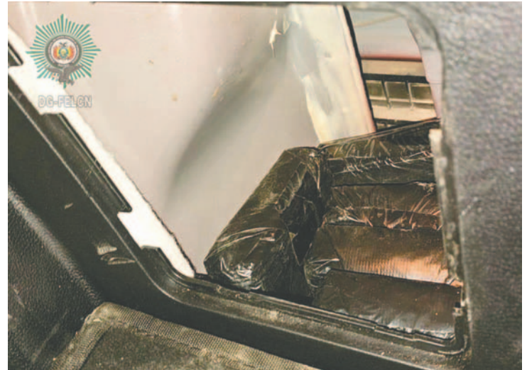
La sustancia estaba oculta en compartimientos secretos dentro el motorizado