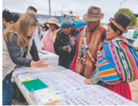
Preparativos para las elecciones judiciales 2024 / TED ORURO

En la misma publicación también se comunica que se tendrá el traslado de mesas de sufragio de los recintos electorales: