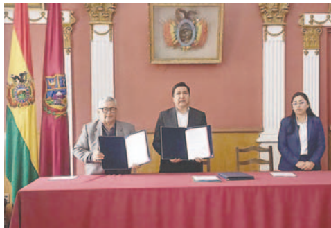
GAMO y UTO firman convenio para la elaboración de un estudio técnico para las ferias de temporada

con la Secretaría Municipal de Economía y Hacienda y la Dirección de Desarrollo Económico Local para llevar a cabo este estudio con el único objetivo de recomendar el lugar más adecuado para el asentamiento de las ferias que normalmente se ubican