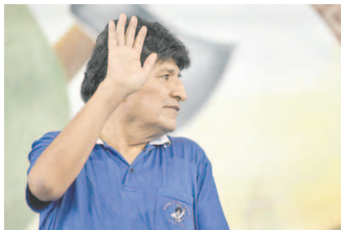
El expresidente de Bolivia, Evo Morales

“Si hasta ahora era instrumento político era MAS-IPSP, ahora vamos a cambiar el nombre del partido porque seguimos siendo el proceso de cambio, seguimos siendo de la revolución democrática cultural. El MAS-IPSP