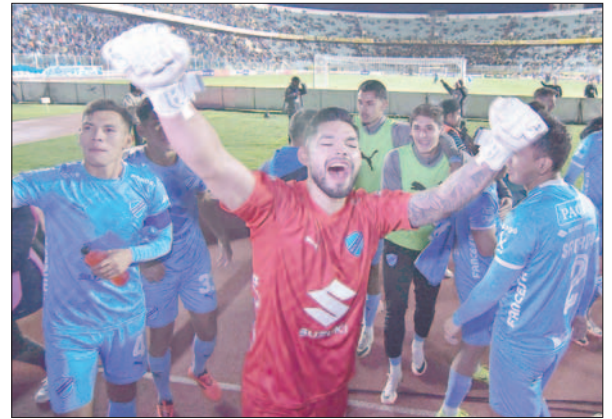
Jugadores de Bolívar celebran el triunfo ante los "atigrados"

Los celestes aprovecharon el descuido de su rival, anotando el 4-1, a los 59', con una definición de Fábio Gomes, sacando un remate de derecha, con la cara interna, superando a Viscarra en una falla en la defensa para cubrir su zona.