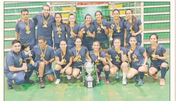
Las integrantes del equipo Víctor Muriel con el trofeo de campeón