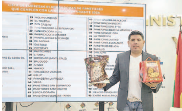
Pantojarse cumple normativas en la elaboración de panetones

Asimismo, se verificó el contenido de frutas brillantadas y almendras en los panetones, para