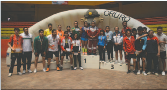
Los mejores del campeonato nacional de tenis de mesa