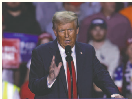
Fotografía de archivo del presidente electo de Estados Unidos, Donald Trump