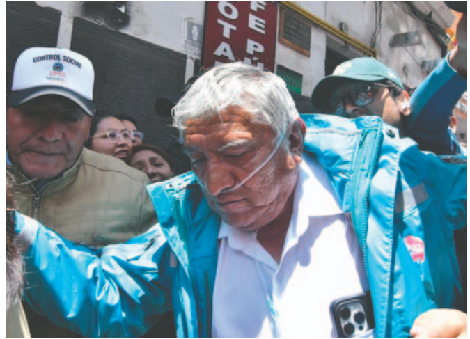
En una citación previa, el alcalde se presentó con un tanque de oxígeno

Rojas evitó confirmar si hay más personas investigadas en este caso,