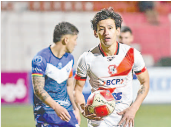
En la ida venció Nacional Potosí 2-1 en la Villa Imperial el 17 de agosto