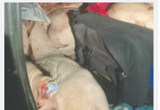
El valor del producto asciende a más de 30.000 bolivianos

Asimismo, agregó que efectivos del VLCC mantienen vigilancia permanente las 24 horas del día para controlar y combatir el contrabando en toda la línea fronteriza del país.