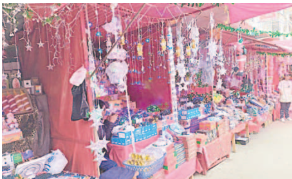
Comerciantes no pueden alquilar sus puestos de venta temporales

La Feria Navideña de la Avenida 6 de Agosto iniciará el 15 de diciembre, pero debido a la jornada electoral, los comerciantes de temporada comenzarán a realizar el armado de sus