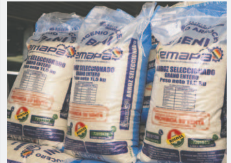
Las reservas de Emapa no fueron suficientes para abastecer al mercado interno