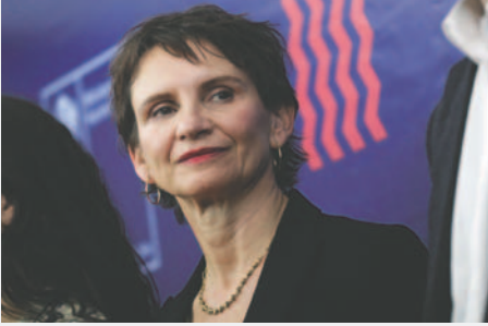
La ministra del Interior de Chile, Carolina Tohá