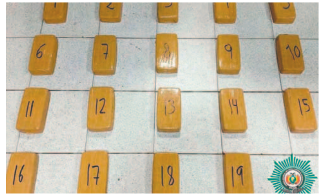
La droga incautada por la Fuerza Especial de Lucha contra el Narcotráfico / FELCN

La Felcn resaltó la importancia del operativo como parte de sus esfuerzos continuos para combatir el narcotráfico en la región. Los aprehendidos actualmente se encuentran en celdas policiales a la espera de su situación judicial.