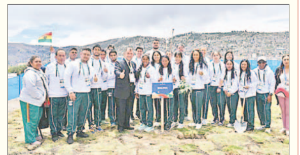
El equipo boliviano de E-Sport, muaythai y frontball

La delegación boliviana logró seis medallas de plata: cuatro por intermedio del muaythai, una de E-Sport y una de billar. Entre tanto, alcanzó 19 preseas de bronce, bajo el siguiente: wushu con cuatro, remoergómetro con cuatro, frontón con tres, muaythai con dos, ajedrez con dos, atletismo con dos, kárate con uno y levantamiento de pesas con uno.