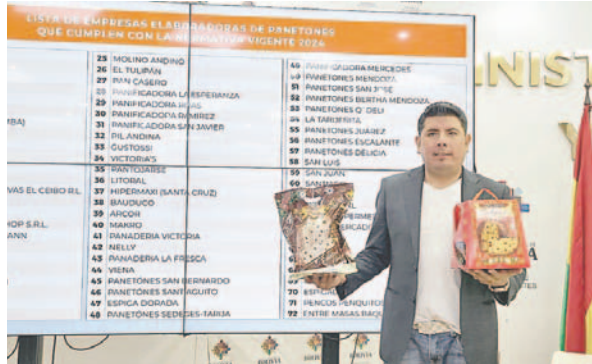
Pantojarse cumple normativas en la elaboración de panetones

Asimismo, se verificó el contenido de frutas brillantadas y almendras en los panetones, para