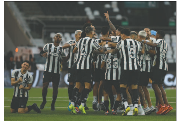
Jugadores de Botafogo celebran el título logrado en la Liga brasileña

rique, exjugador del Real Betis y gran figura de este Campeonato Brasileño, dio un recital de desbor-