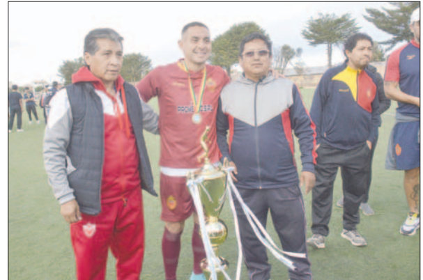
El capitán de CDT Real Oruro (centro) recibió el trofeo de campeón