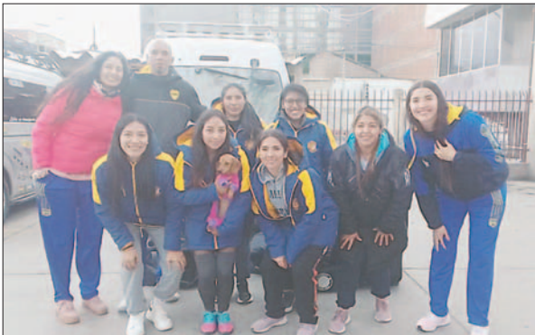
El cuadro orureño viajó con anticipación para llegar bien al partido

El partido no será nada fácil debido a que Club Tennis La Paz estuvo ensayando jugadas preparadas. Las jugadoras ya tienen la experiencia de haber clasificado a la final en temporadas anteriores, tienen el objetivo devolver a jugar una final.