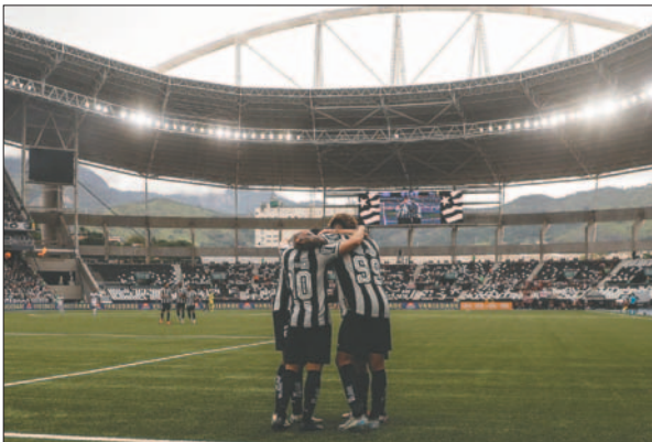
El equipo de Botafogo pudo celebrar este nuevo título en su estadio

Bajo su administración, el Glorioso construyó un proyecto galáctico que acaba el año con Liga y Libertadores.