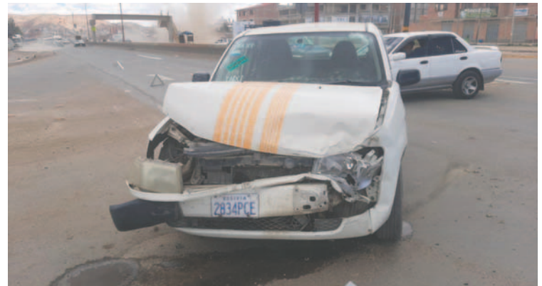
Vehículo afectado sufrió daños de consideración

De manera extraoficial, se conoció que al interior de la camioneta protagonista del hecho se encontraron explosivos y otros artefactos también denominados "miguelitos"; sin embargo, se aguarda un informe oficial del caso por parte de la Dirección Departamental de Tránsito.