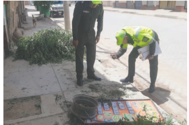
Vehículo provocó daños al ornato público

la Dirección de Tránsito realizó el trabajo de campo y, mediante un patrullaje correspondiente en el lugar del accidente, se identificó un domicilio donde el vehículo protagonista había ingresado; sin embargo, no se tuvo una respuesta positiva de-