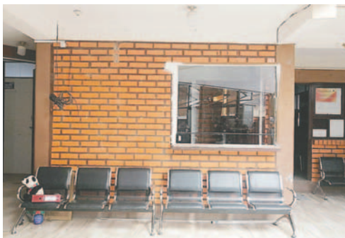
GAMO definirá el traslado de oficinas para alguna dirección edil

Oportunidades (DIO) a los ambientes del ex centro; sin embargo, debido a que las oficinas de dicha dirección se trasladarán al edificio “Mil Novedades”, recientemente recuperado por el GAMO, se hará el traslado de otra dependencia edil.