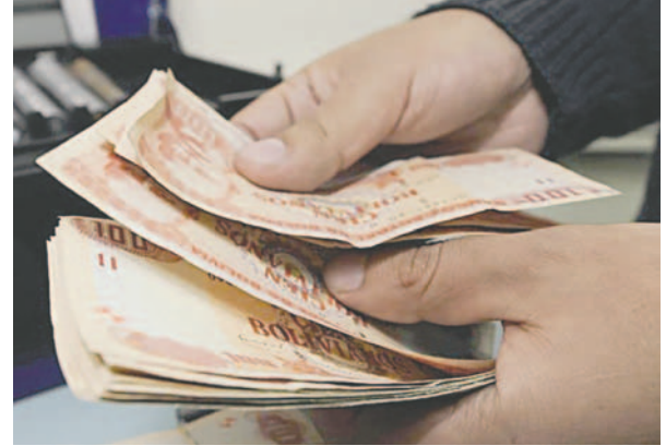
Algunos sectores advirtieron con dificultades para pagar el aguinaldo este año /REFERENCIAL

no está sujeto a embargo judicial, retención, descuento por concepto de impuestos o aportes. Debe ser pagado en su integridad según lo fijado por ley. Las empresas privadas y entidades públicas deben presentar ante el Ministerio de Trabajo las planillas de pago del aguinaldo a través de la Oficina Virtual de Trámites hasta el lunes 30 de diciembre.