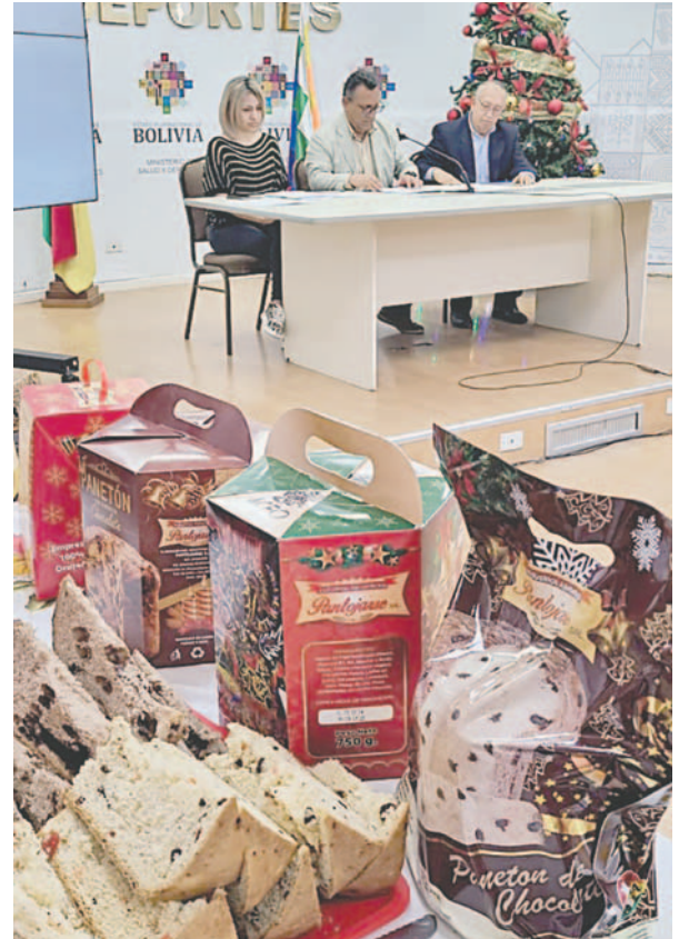
Panetones Pantojarse autorizados para la venta a nivel nacional

Dentro de la lista de productos de Pantojarse acreditados para esta Navidad se encuentran el panetón tradicional, el panetón de lujo en bolsa, el panetón premium en caja, el panetón con chispas de chocolate, el panetón con chispas de chocolate premium, además de la riquísima rosca navideña y la rosca con chispas de chocolate.