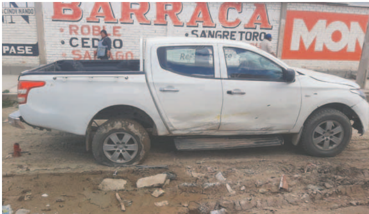
Camioneta provocó colisión