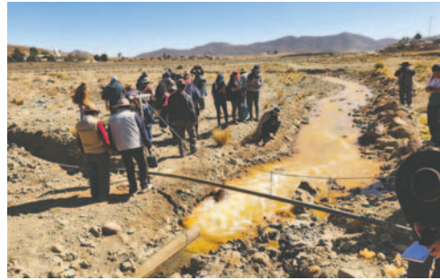
Las aguas con conpajira que bajan del río Huanuni en el ayllu San Agustín de Puñaca

“Lamentablemente es triste la realidad de muchas comunidades que viven debajo de las actividades mineras, porque tienen metales pesados, se han demostrado estudios de que los comuna-