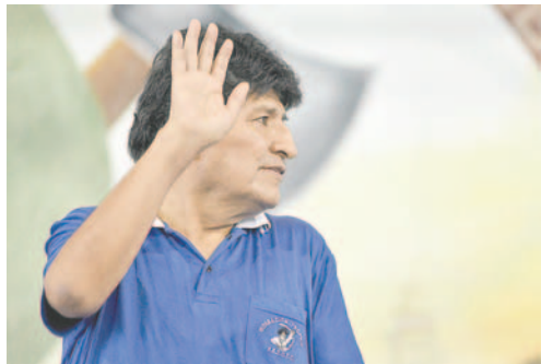
El expresidente de Bolivia, Evo Morales

“Si hasta ahora era instrumento político era MAS-IPSP, ahora vamos a cambiar el nombre del partido porque seguimos siendo el proceso de cambio, seguimos siendo de la revolución democrática cultural. El MAS-IPSP