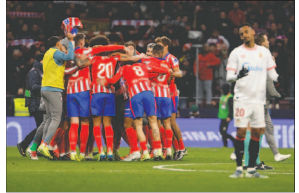
Gran victoria del Atlético de Madrid ante el Sevilla que ganaba 3-1

El Athletic sigue de dulce. Está atravesando el mejor momento de la temporada. Lleva once partidos seguidos sin perder. Este domingo