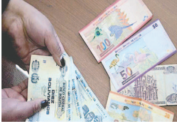
Instan a cumplir con el aguinaldo de Navidad hasta el 20 de diciembre

El cálculo del aguinaldo se realizará para aquellos trabajadores que tengan un mínimo