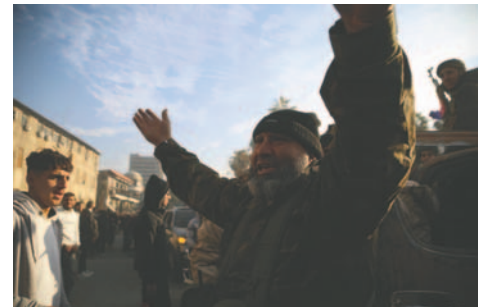
El pueblo sirio y los rebeldes celebran en las calles de Homs, Siria, la caída del gobierno de Bachar al Asad