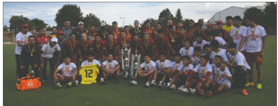
CDT Real Oruro celebró por doble partida, en el sector derecho los campeones de la Sub-19 "A"