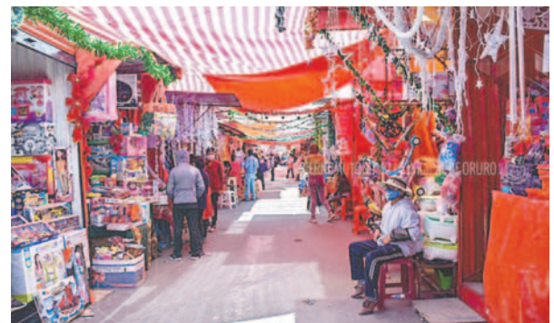
Feria Navideña se instalará en la Avenida 6 de Agosto

ró que los comerciantes de temporada de la feria no pueden mantener los puestos de venta cerrados; al mismo tiempo, no pueden alquilar los puestos y necesariamente el titular que solicitó el permiso para desarrollar dicha actividad económica tiene que estar presente en el lugar.