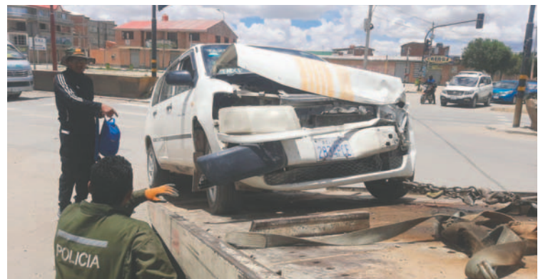
Hecho de tránsito se produjo en la Avenida 24 de Junio