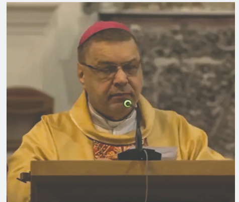
Monseñor Estanislao Dowlaszewicz durante la misa del domingo