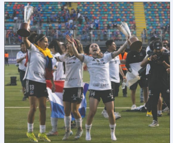
Festejo de las integrantes del equipo de Colo Colo

La final contó por segunda vez con el uso del VAR luego de haber sido utilizado en la definición de 2023, pero fue el primer y único partido de esta temporada en el que se usó la tecnología para la liga femenina.