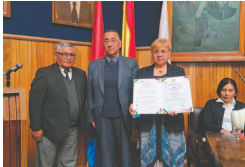
Entrega de la certificación de reacreditación a la carrera de Enfermería de la UTO

“Adicionalmente tiene una ventaja, que esta acreditación puede ser reconocida, homologada directamente por tener la acreditación inclusive na-