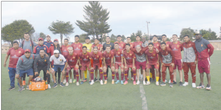
Integrantes del equipo de CDT Real Oruro bicampeón del fútbol orureño