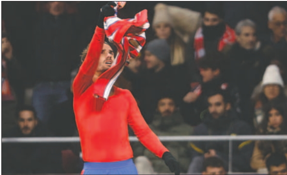
Antoine Griezmann artífice para la remontada del Atlético de Madrid

El Atlético de Madrid se levantó de la lona después de ir perdiendo ante el Sevilla por 1-3 en el segundo tiempo y, con empuje y fe y un gran Antoine Griezmann, remontó hasta el 4-3 para asegurar un triunfo en el Metropolitano que le permite seguir de pleno derecho en la pugna con el Barcelona y el Real Madrid.