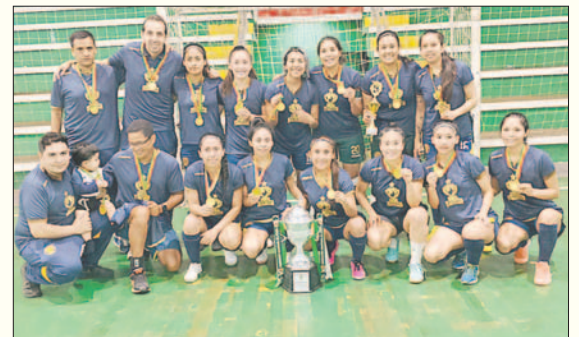
Las integrantes del equipo Víctor Muriel con el trofeo de campeón