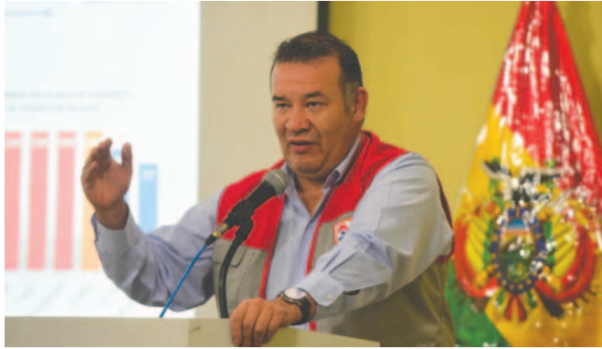
El director del Instituto Nacional de Estadística (INE), Humberto Arandía

Aunque aseguró que los precios están disminuyendo con el reabaste-