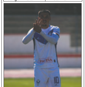
Brian Sobrero / LA PATRIA