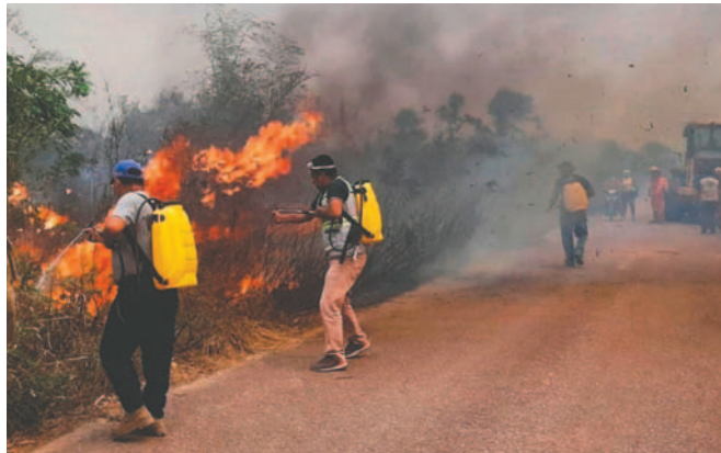
Al menos 10 millones de hectáreas se quemaron durante los incendios

nizó una agenda para la llegada del titular de la CIDH. En ese marco, indicó que este lunes a las 15:30 horas, las autoridades, Palummo y diversos actores nacionales se reunirán en ambientes de la Cancillería de Bolivia.