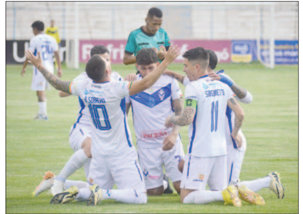
El conjunto quiere asegurar la clasificación a un torneo internacional