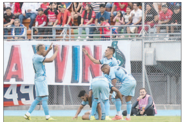
Celebren los de Aurora ante la mirada de los hinchas de Wilstermann