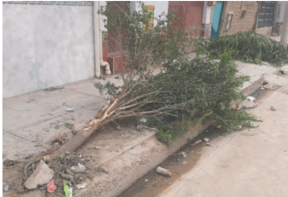
Árboles fueron derribados por un vehículo que se dio a la fuga

la división especial, un vehículo tipo vagoneta de placa no identificada se encontraba realizando su recorrido con dirección de Este a Oeste sobre la Avenida Santa Bárbara. Sin embargo, por causas que aún se investigan, el conductor del vehículo perdió el