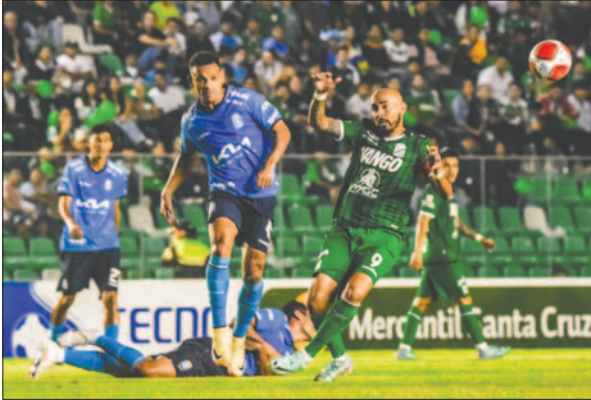
Una acción del partido que finalizó con el marcador en blanco

El cotejo que cerró la fecha 26 del torneo Clausura se disputó anoche en el estadio "Ramón Aguilera Costas"