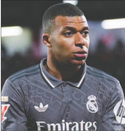
Kylian Mbappé no pasa por un buen momento en Real Madrid

“No he tenido períodos de descanso, he tenido decepciones deportivas”, añadió, antes de insistir en que los comentarios sobre una hipotética depresión “es hablar por hablar”. También aseguró que no tiene apo-