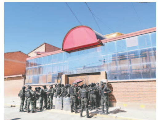
Predios del ex Centro de Salud Santa Lucía / LA PATRIA

La Sala Civil y Comercial N° 1 notificó al GAMO con un auto de vista número 564/2024, una resolución que ya define el tema sobre la propiedad de los predios que son de dominio municipal. Además, le indica al Servicio Departamental de Gestión Social (Sede-