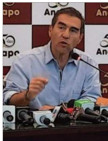
El gerente de Anapo.