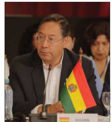
Arce durante su intervención.

En la primera jornada, hubo una reunión de cancilleres, en la que participó la ministra de Relaciones Exteriores boliviana, Celinda Sosa. A poco de su llegada, Arce se reunió con Luiz Inácio Lula da Silva, y ayer sostuvo una reunión con el presidente electo de Uruguay, Yamandú Orsi.