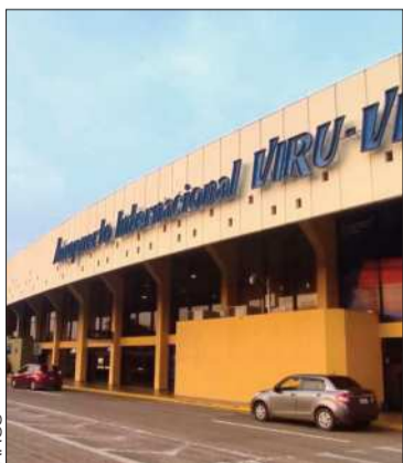
El caso sucedió en Viru Viru.

La ATT cuantificó un total de 8.087 pasajeros afectados por lo sucedido