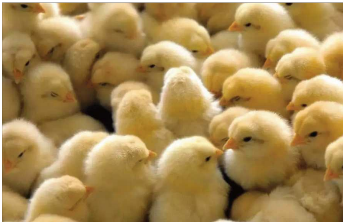
SANTA CRUZ. Los pollitos bebé se distribuyen a las granjas avícolas de esa región y de Cochabamba.

Aclaró que el objetivo no es competir con el sector privado cruceño, sino el de generar insumos como pollitos bebé y alimento balanceado para otras industrias avícolas. “El 77% de los pollitos bebés de todo el país se producen en Santa Cruz, el resto en Cochabamba (...) Pero esto nos va a servir para cuando haya grandes variaciones en los precios, como hemos tenido con los bloqueos”, añadió.