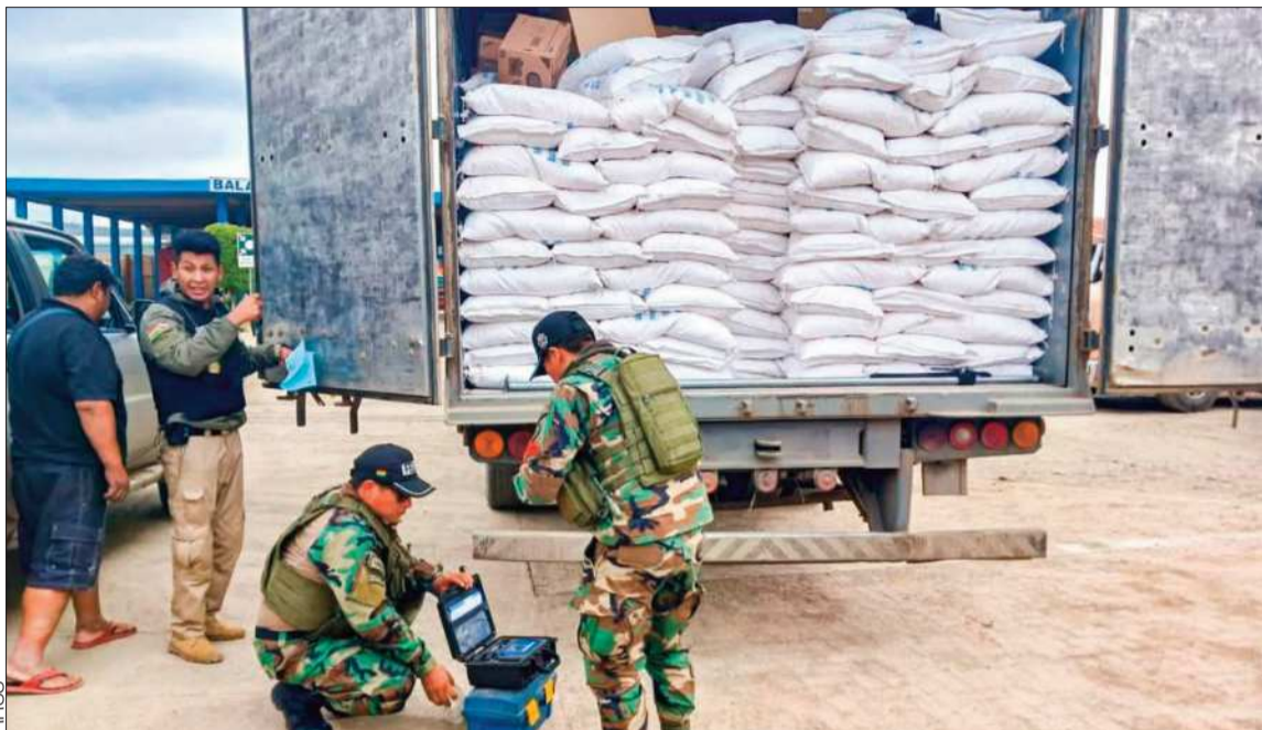
OPERATIVO. Los policías secuestran gran cantidad de quintales de arroz, ante la recepción de denuncias.