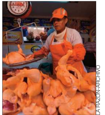
Venta de pollo en un mercado.

“Nosotros como productores a nivel nacional ya satisfacemos y proveemos a la población en referencia a la carne de pollo y huevo. Entonces creemos que no es necesario que el Gobierno esté incursionando en este sector y no por protegernos nosotros, sino porque trabajamos en función a la demanda nacional”, afirmó el representante del sector.