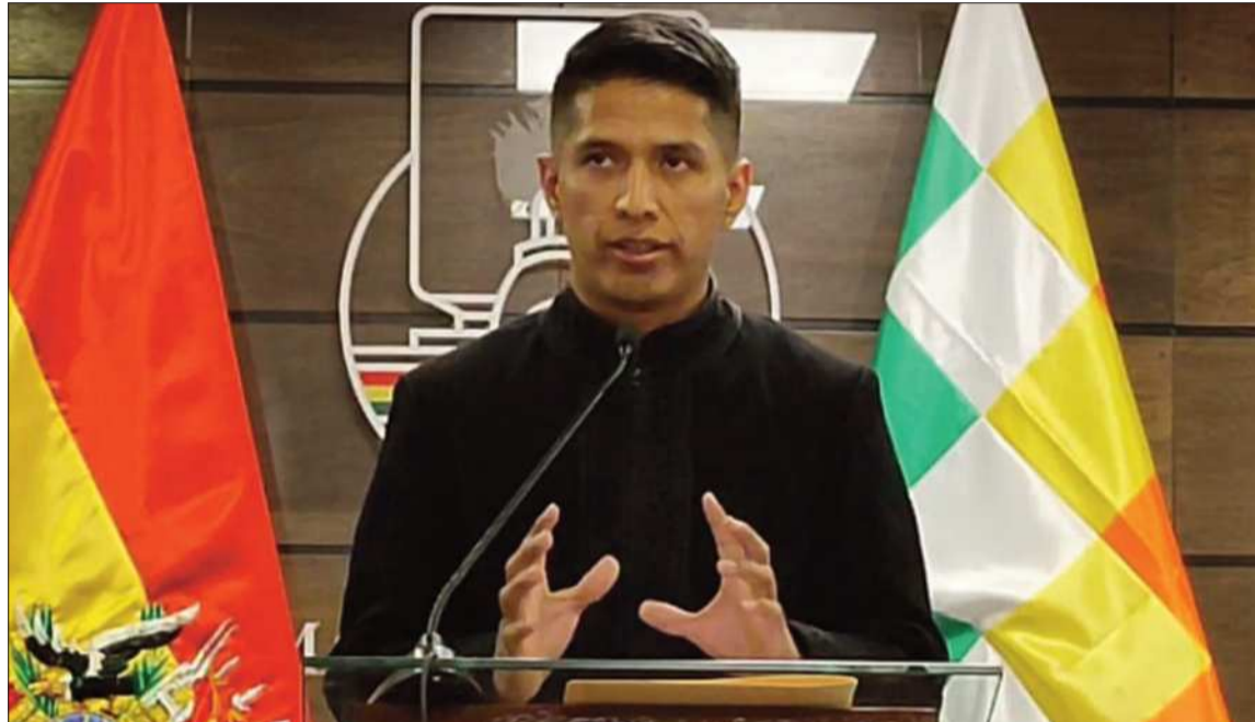
PRETENDIDO. El senador evista Andrónico Rodríguez, en conferencia de prensa reciente en La Paz.

El jueves, el nuevo presidente del MAS, Grover García, lo invitó a buscar la unificación del partido y evitar, en las elecciones generales de 2025, la división del voto. “Nosotros no invitamos para ser