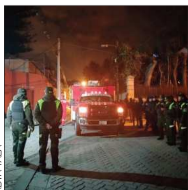
La Policía en la cárcel de Obrajes.

El traslado de una interna motivó a la protesta de las privadas de libertad