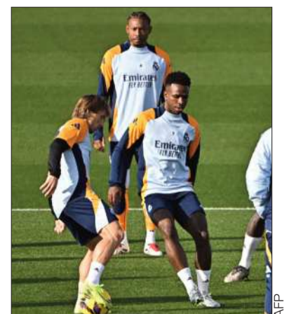
Vinicius regresó a las prácticas.

Como en cada rueda de prensa, Ancelotti respondió varias preguntas sobre Kylian Mbappé, de nuevo en el centro de las críticas tras fallar un penal en la derrota 2-1 del Real Madrid ante Athletic.