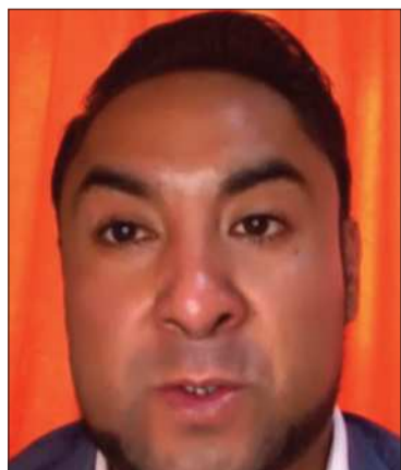
El viceministro Luis Siles.

El Gobierno invertirá Bs 608 millones en el complejo avícola