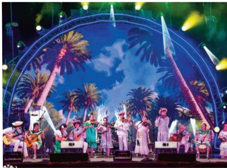
DELEGACIONES. Santa Cruz presente en el evento cultural.