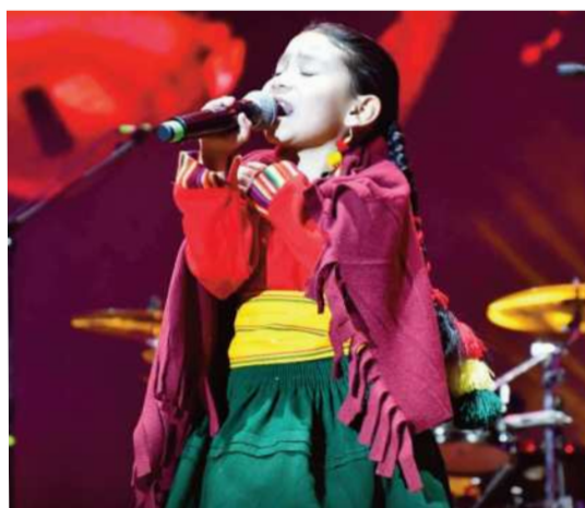
La niñez presente en el Aquí Canta Bolivia.

El ingreso al festival es un juguete. Lo recolectado será donado a niños de los 35 municipios de Oruro.