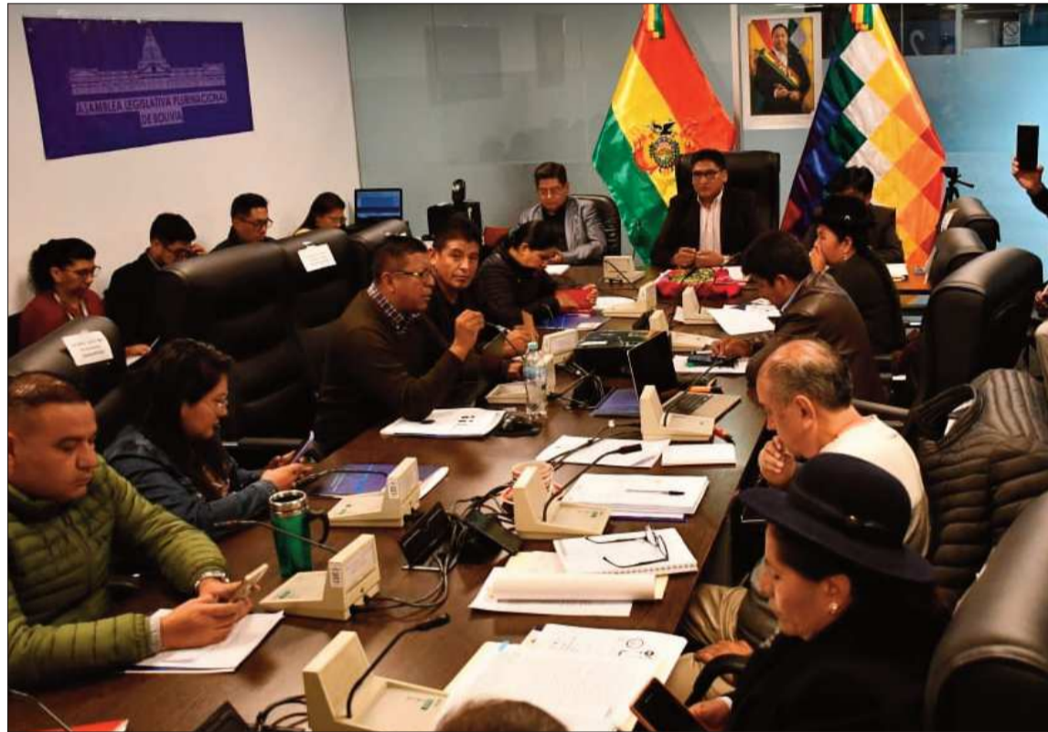
SESIÓN. La Comisión de Planificación de la Cámara de Diputados sesionó ayer sin mucho conflicto.