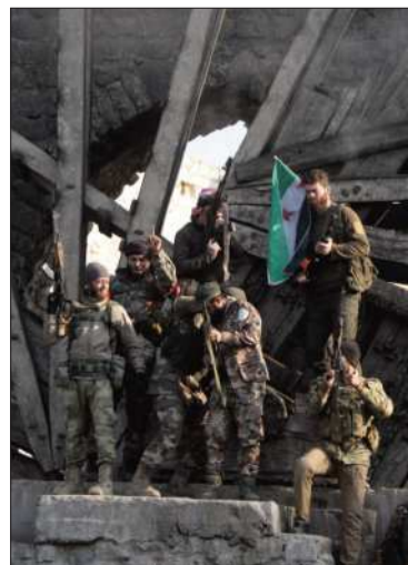
Los combates continúan.

El objetivo de su ofensiva es derrocar al régimen de Bashar al Asad.