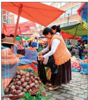
Puestos del mercado Rodríguez.

ECONOMÍA. La inflación de noviembre alcanzó 1,45%, menos 0,19% que octubre