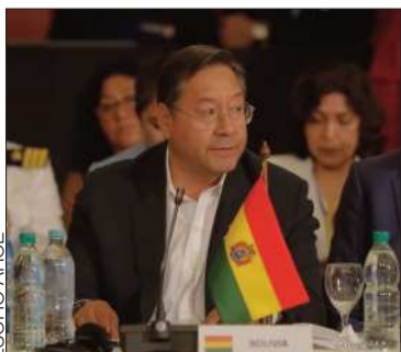
El presidente Luis Arce, ayer.

El Presidente de Bolivia denunció en el Mercosur afanes antidemocráticos