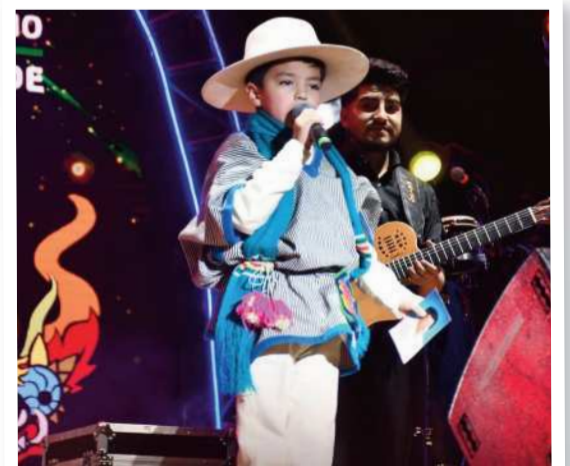
La actividad es un impulso para los nuevos valores.