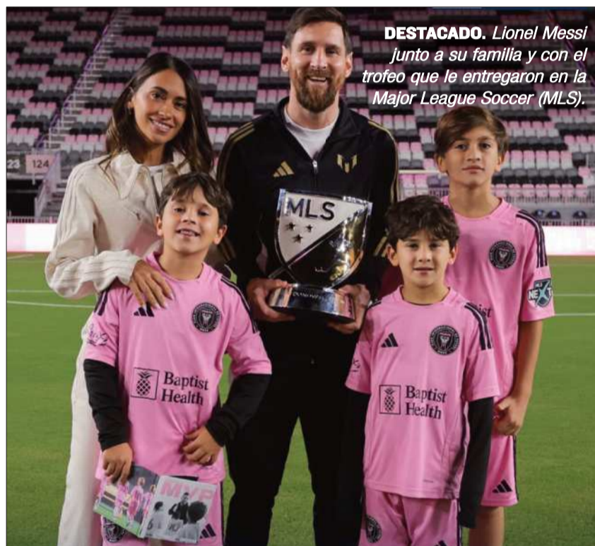
DESTACADO. Lionel Messi junto a su familia y con el trofeo que le entregaron en la Major League Soccer (MLS).

Messi, cuyo contrato termina al final de la temporada 2025, ha avanza-