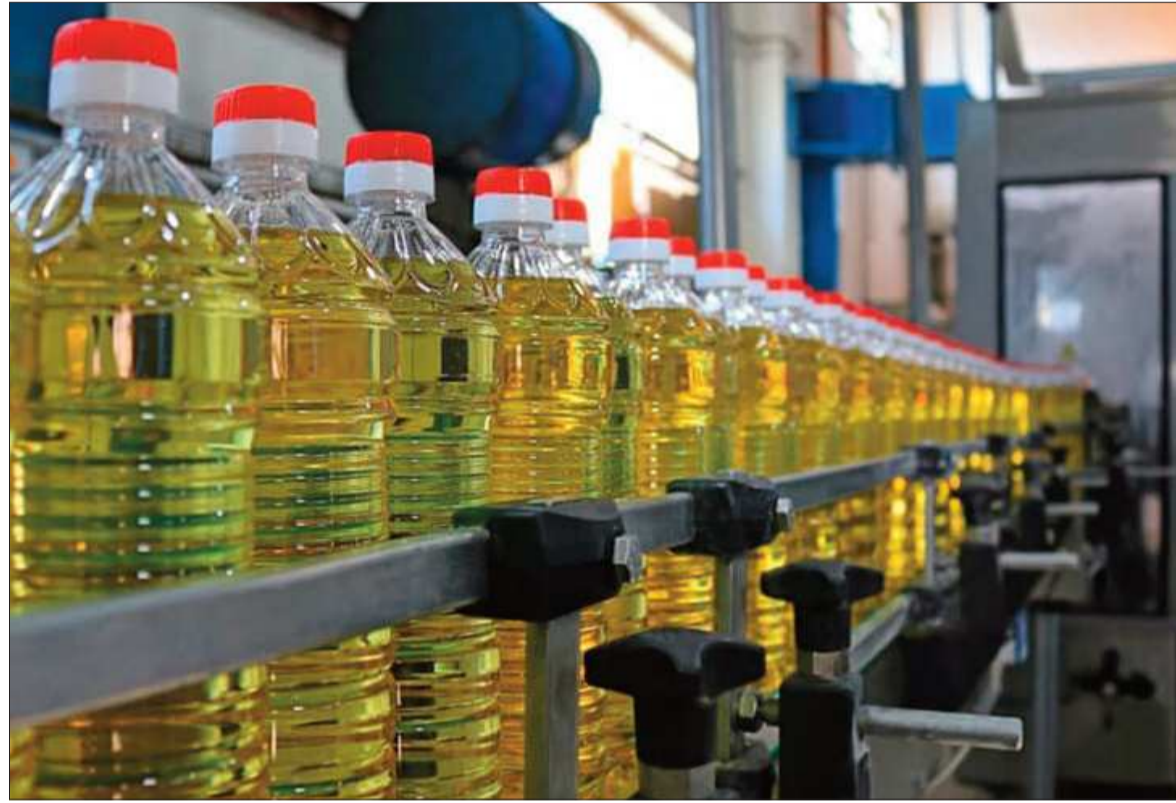
DETERMINACIÓN. El Gobierno decidió suspender de forma temporal la exportación de aceite comestible.

Caniob, Cadex, IBCE, CEPB y Anapo expresaron su preocupación y alarma ante la determinación del Gobierno de suspender las exportaciones de aceite comestible.