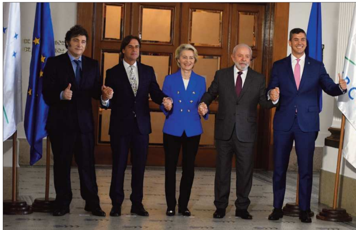
CELEBRACIÓN. La presidenta de la Comisión Europea, junto a los presidentes miembros del Mercosur.

La ministra francesa de Comercio Exterior, Sophie Primas, fue clara sobre el paso dado por el Mercosur y la UE: “Hoy no es claramente el final de la historia. Lo que pasa en Montevideo no es una firma del acuerdo sino simplemente una conclusión política