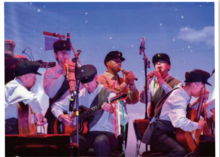
CONCURSO. Trece categorías están incluidas en el certamen.

no de Yuri Mijail y la Nueva Proyección que mostraron sus nuevas propuestas musicales.