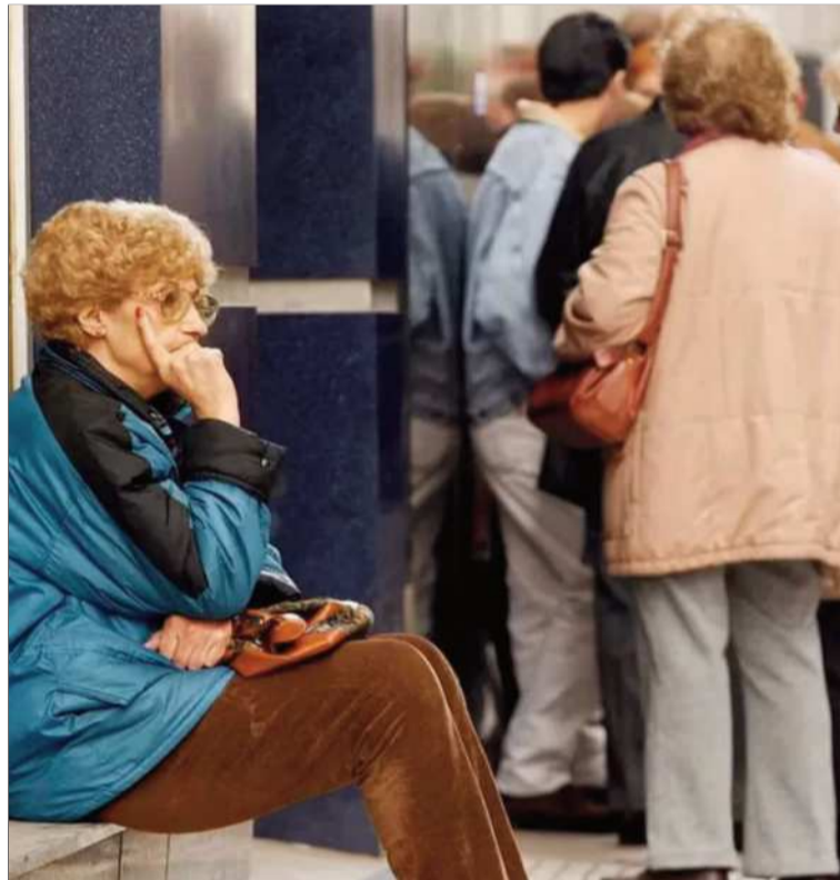
CRISIS. Los jubilados ven que su vida se achica como sus bolsillos.