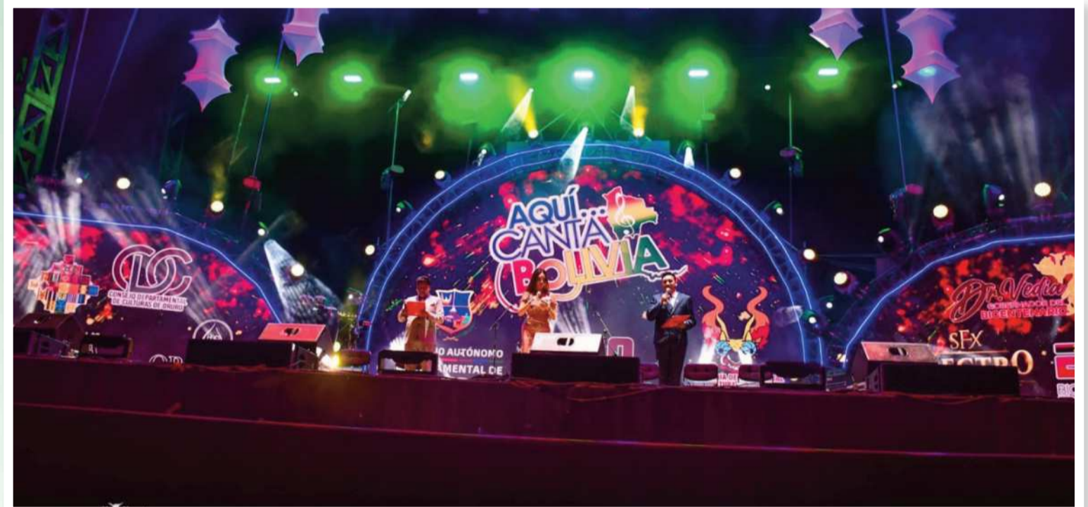
EVENTO. Oruro vive el Festival de la Canción Boliviana Aquí Canta Bolivia, que este año se celebra en su XXXI versión.

Del olvido, Te olvidaré y Hoy por ti fueron coreadas a viva voz por el público en la primera noche del festival junto a el grupo cochabambino Amaru. Luego fue el tur-