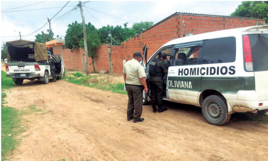
La Brigada de Homicidios de la Felcc acudió al lugar para levantar el cuerpo del colombiano