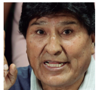
Evo en una rueda de prensa.

El ministro de Gobierno, Eduardo Del Castillo, manifestó que dentro del MAS se está buscando y trabajando por la unidad. “Lamentablemente quien sigue hablando de divisiones es una persona que no puede ser candidato”, dijo la autoridad nacional.