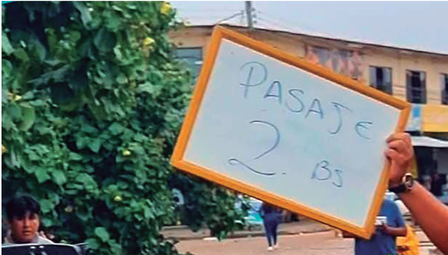
La gente protestó contra el incremento impuesto por los micreros y mostró letreros con la tarifa vigente