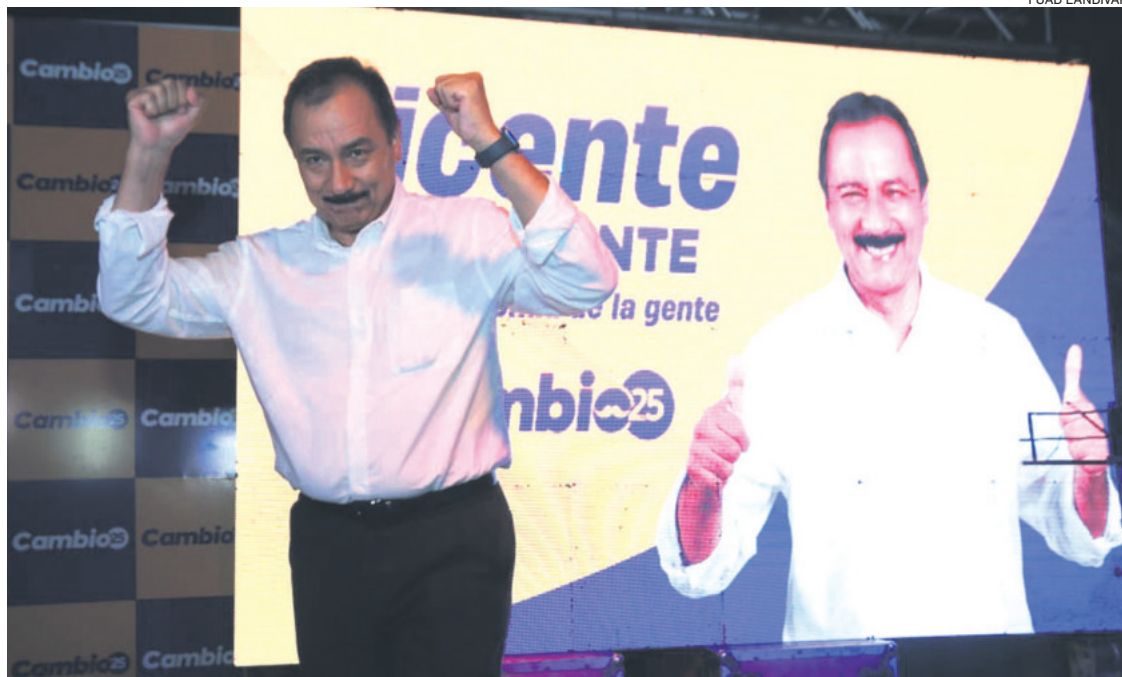
El rector de la Uagrm presentó su propuesta electoral con miras a los comicios nacionales de 2025