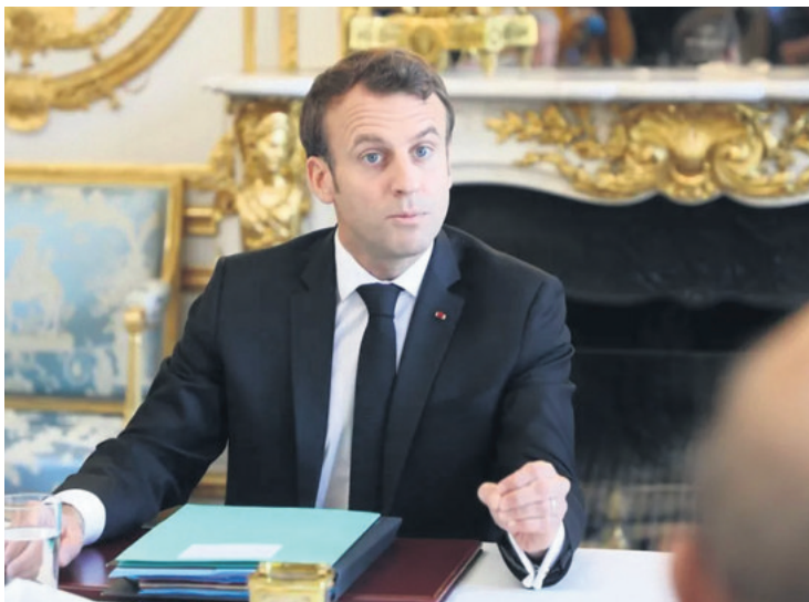
El mandatario francés busca acuerdos para nombrar primer ministro

La búsqueda de ese Gobierno de moderados pasa por un lado por fragmentar la alianza de izquierdas, con apelaciones a la responsabilidad, para dejar fuera a su componente más intransigente, La