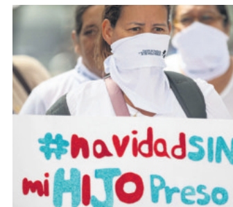
Protestas en Venezuela

Varios estados de Estados Unidos también están considerando la posibilidad de aplicar sus propios impuestos. Oklahoma ya cuenta con una ley que grava con 5 dólares las remesas inferiores a 500 dólares y con un impuesto del 1 % de todas las transferencias superiores a ese valor. Florida, Ohio y Pensilvania están estudiando propuestas similares