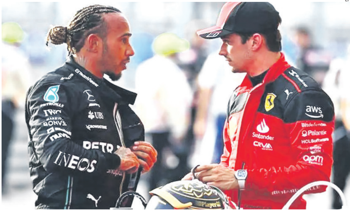
Hamilton fue uno de los principales pilotos que tuvo la Fórmula 1 en los últimos años. Sainz irrumpió como uno de los mejores del mundo

El hueco que dejará Sir Lewis en Mercedes -escudería en la que ha capturado seis de sus siete tí-