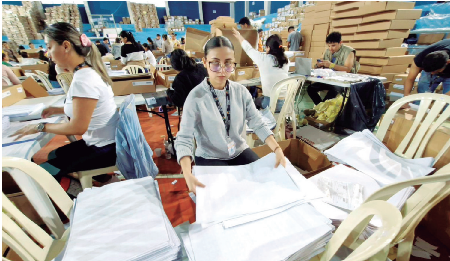
Las más de 2 millones de papeletas están en listas en las maletas, bajo resguardo en el Centro de Logística del Colegio Militar de Aviación.

LOS RESULTADOS OFICIALES SERÁN ENTREGADOS EN LA SEMANA