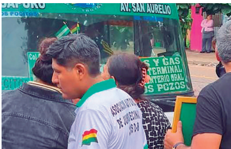
En el Plan Tres Mil se organizaron para evitar que cobren por demás

En el Plan Tres Mil, los vecinos se organizaron para controlar que no se cobre más de los Bs 2 establecidos por la normativa, argumentando que el Concejo Municipal no ha autorizado ningún incremento y que la decisión unilateral de los transportistas es ilegal. El sábado, la dirigencia del sector transporte llegó a un acuerdo con una fracción de la Fejuve para implementar el aumento, pero este pacto ha sido rechazado por otras federaciones