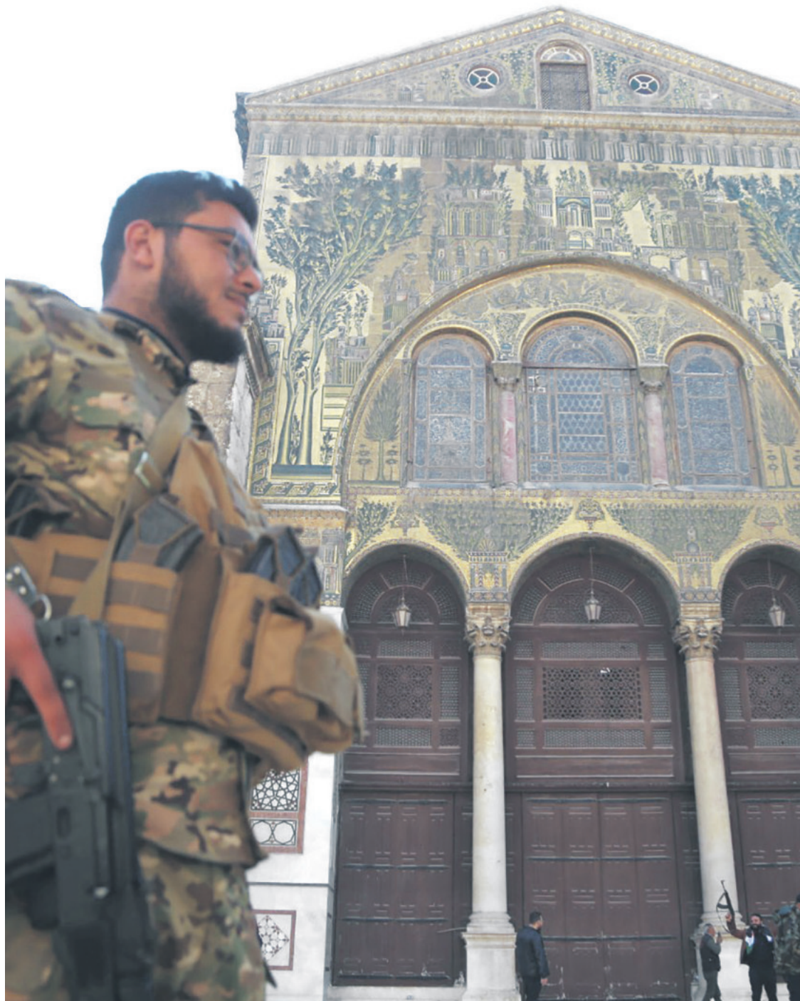
Un rebelde armado camina frente a la Mezquita Omeya en Damasco, luego de haber tomado la capital

Muhammad Bashir será el primer ministro de transición, según decisión de los milicianos que han prometido un gobierno representativo y tolerancia religiosa. Biden, Macron y Scholz ofrecen colaboración pero piden respeto a los DDHH