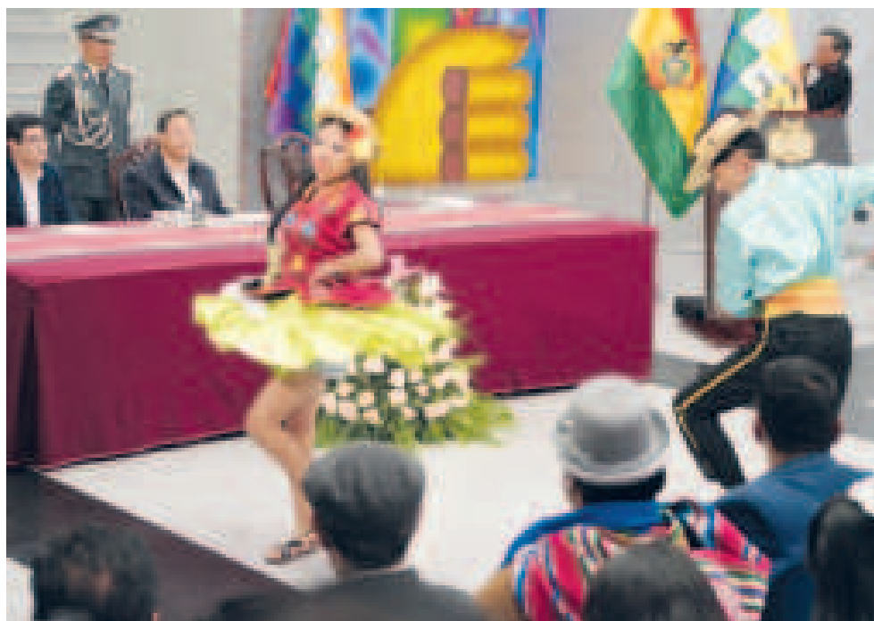
El evento fue amenizado con danzas interpretadas por los mismos estudiantes.