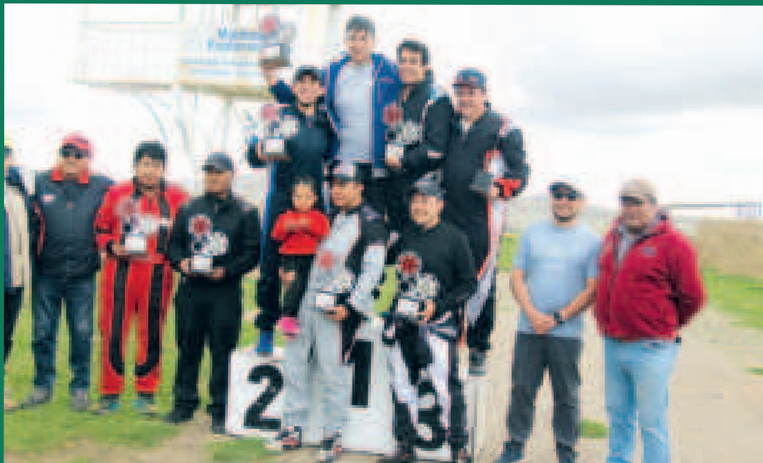
Los pilotos ganadores de la cuarta competencia Municipal de Circuito, que se disputó en el autódromo de Pucarani.

La quinta y última competencia del calendario se disputará en enero del próximo año, cuando se proclamará a los campeones de la gestión 2024.