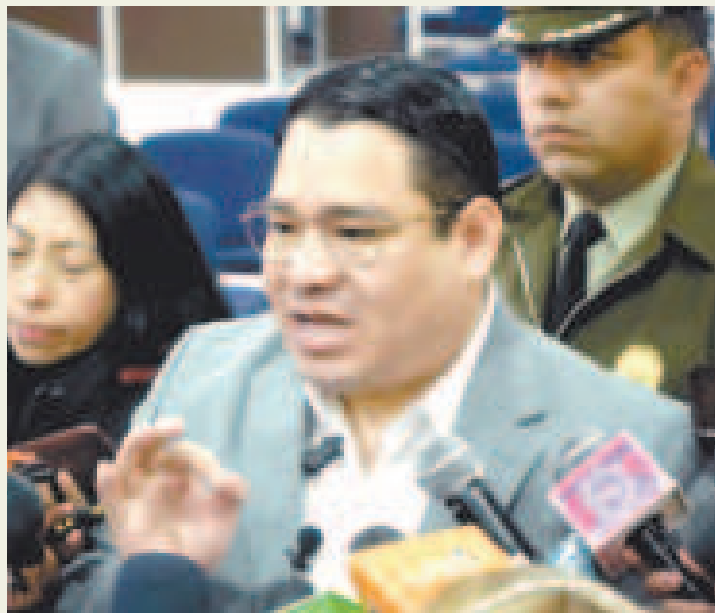
El fiscal general del Estado, Roger Mariaca, durante la rueda de prensa.

Durante el receso judicial, que suspenderá los plazos procesales, el Ministerio Público enfocará sus esfuerzos en resolver casos pendientes y emitir resoluciones concluyentes.