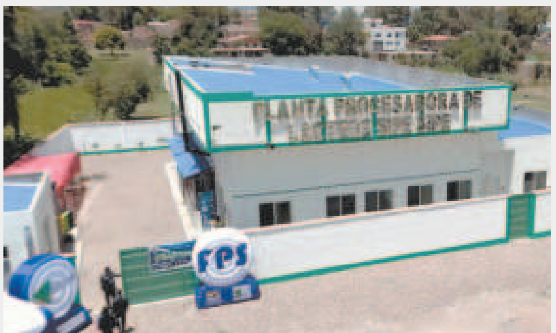
La Planta Procesadora de Leche en el municipio de Sipe Sipe beneficiará a más de 200 productores.

“Esta importante factoría que producirá leche