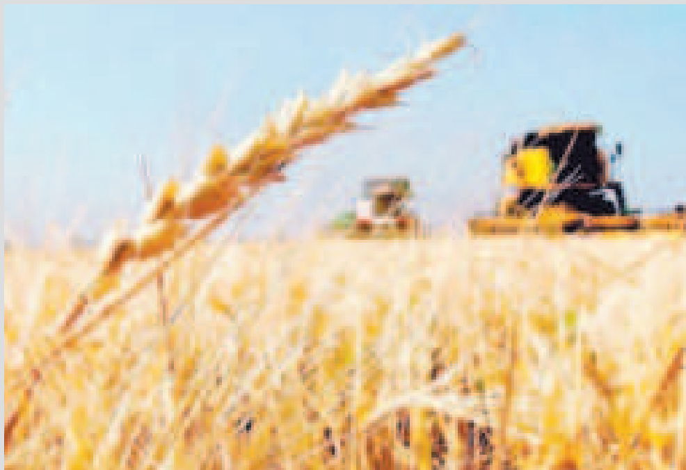
Gran parte de la inversión está destinada al fomento productivo.

El monto incluye el fortalecimiento en la producción y distribución del trigo, maíz y arroz para garantizar la seguridad alimentaria en el país.