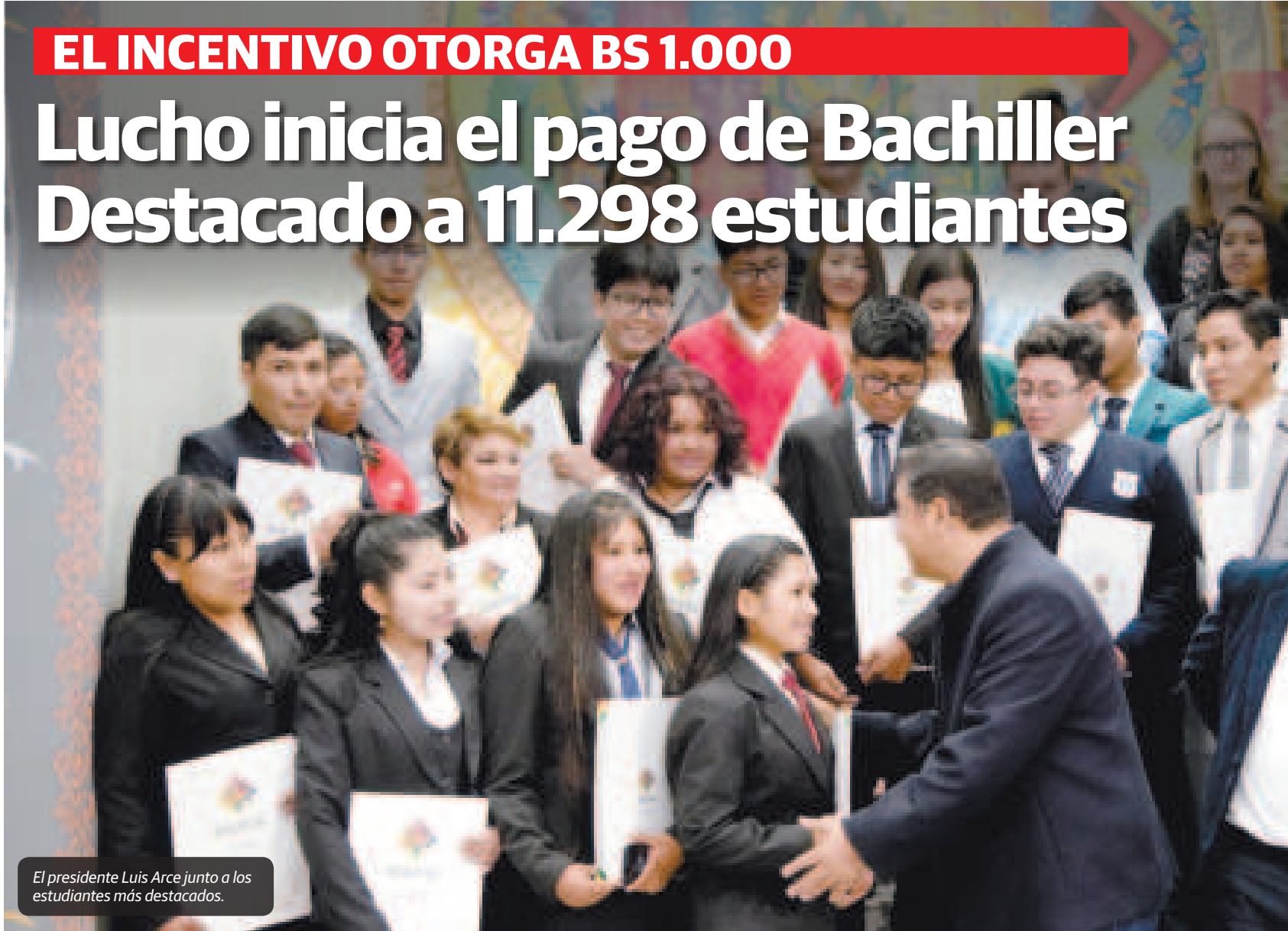
El presidente Luis Arce junto a los estudiantes más destacados.