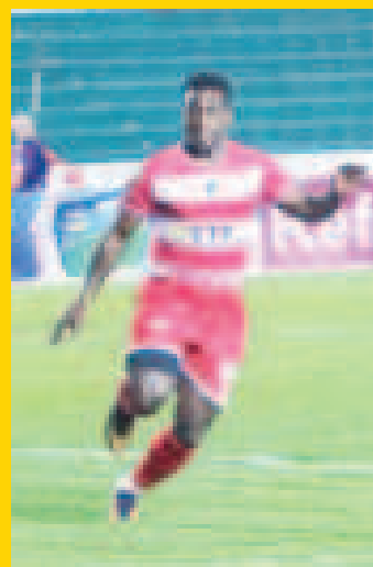
Poro anotó los tres goles de 'Inde'.

Con un triplete de Daniel Poro, Independiente venció por 3 a 2 a Universitario de Vinto y sigue con posibilidades de lograr la clasificación a un torneo internacional. El duelo de la fecha 27 del torneo Clausura se jugó anoche en el estadio Patria de Sucre.