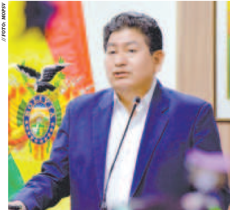
El ministro de Obras Públicas, Édgar Montaña.

Para ello indicó que existe un avance de proyectos de interconexión, por ejemplo con Brasil, como el puente binacional entre ambos países. “Con eso estaríamos totalmente conectados desde Brasil, desde el océano Atlántico hasta el océano Pacífico”.