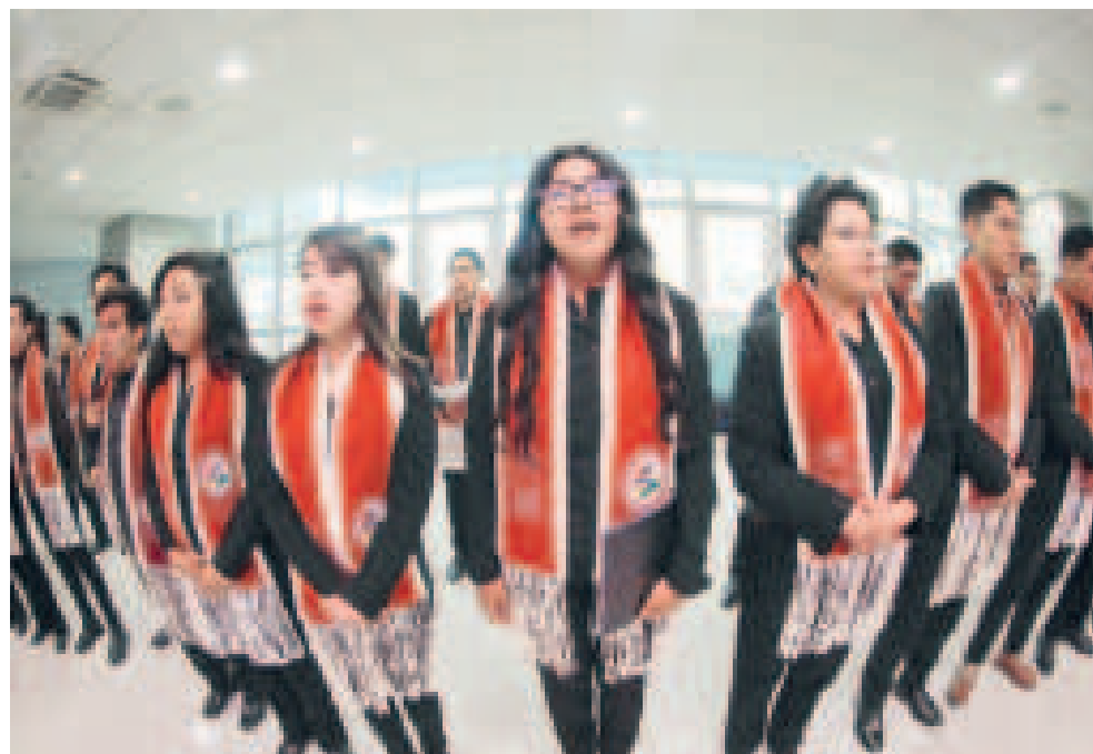
Los mejores estudiantes fueron condecorados y reconocidos.

► Este incentivo es parte de las políticas educativas implementadas por el Gobierno nacional, a través del Ministerio de Educación.