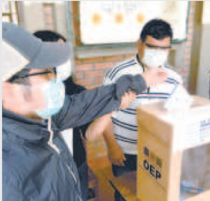
Una mesa electoral en las elecciones judiciales de 2018.

los departamentos de Cochabamba, Santa Cruz y Oruro.