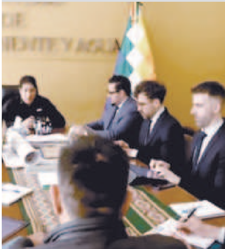
Autoridades de Medio Ambiente reunidas con la Relatoría Especial.