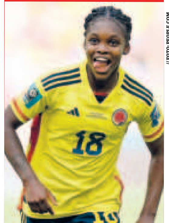
Linda caicedo, futbolista colombiana.

Barbra Banda (Shanghai Shengli/Orlando Pride, Zambia), Linda Caicedo (Real Madrid, Colombia), Lauren James (Chelsea, Inglaterra) y Marta (Orlando Pride, Brasil).