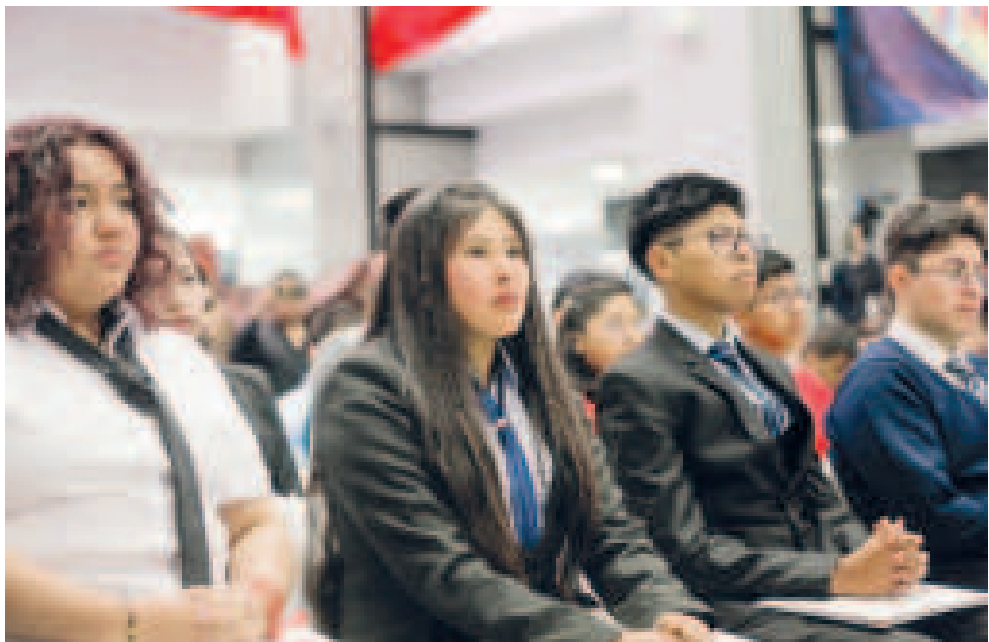
Los jóvenes en el hall de la Casa Grande del Pueblo.

“Este incentivo es un reconocimiento no solo al esfuerzo personal, sino también a la calidad de la educación que existe en Bolivia y al potencial de nuestros jóvenes. Espero que este reconocimiento sirva de inspiración a muchos jóvenes, sigan trabajando con dedicación y pasión por lograr sus objetivos”, manifestó.