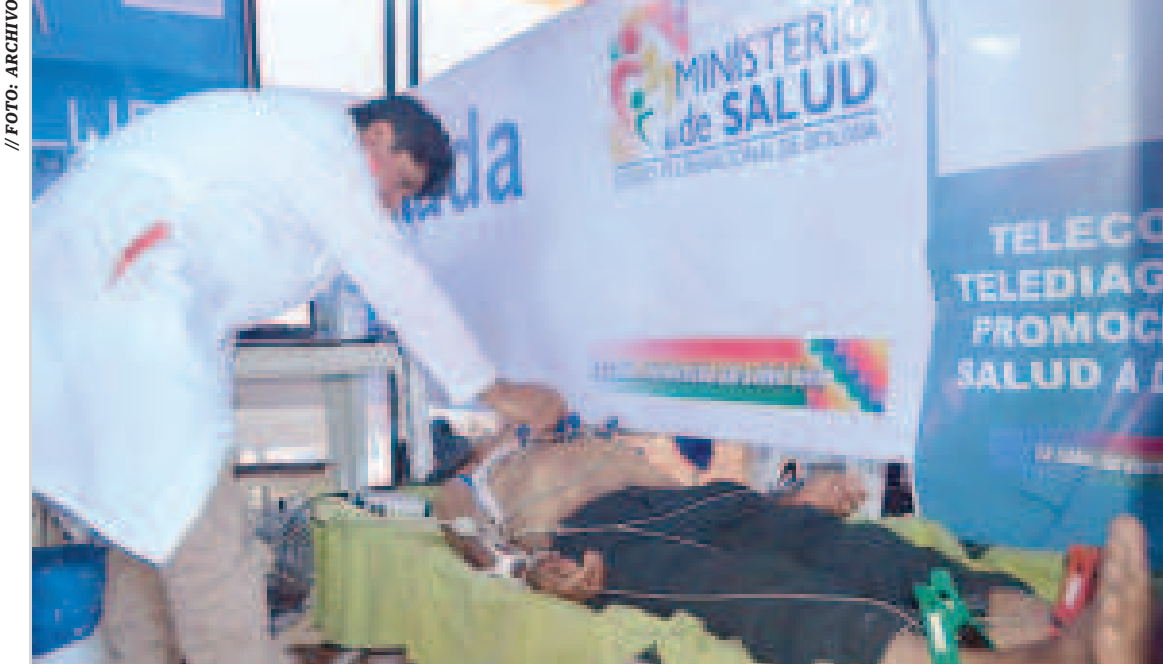
La atención de la salud es una política del Estado boliviano.