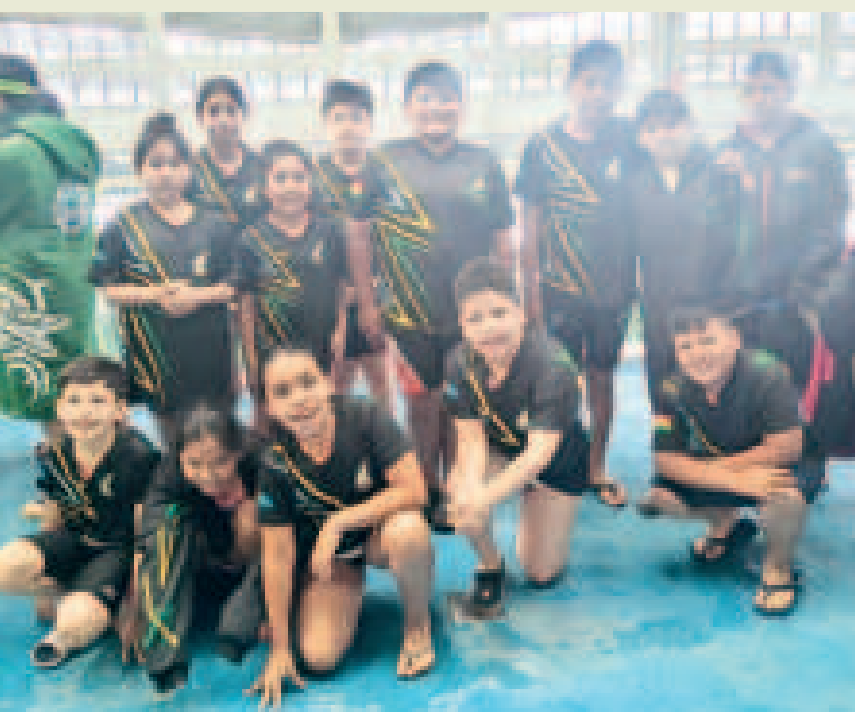
Integrantes del equipo cochabambino de Tiburones, que destacó en el torneo natatorio.