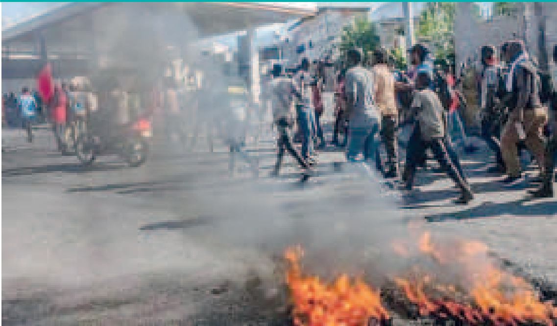
Violencia en Cité Soleil durante el fin de semana.