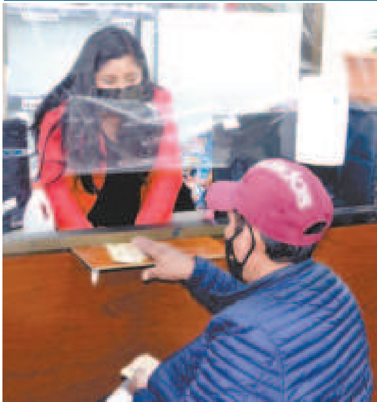
Estos ingresos llegan a personas con discapacidad grave y muy grave.