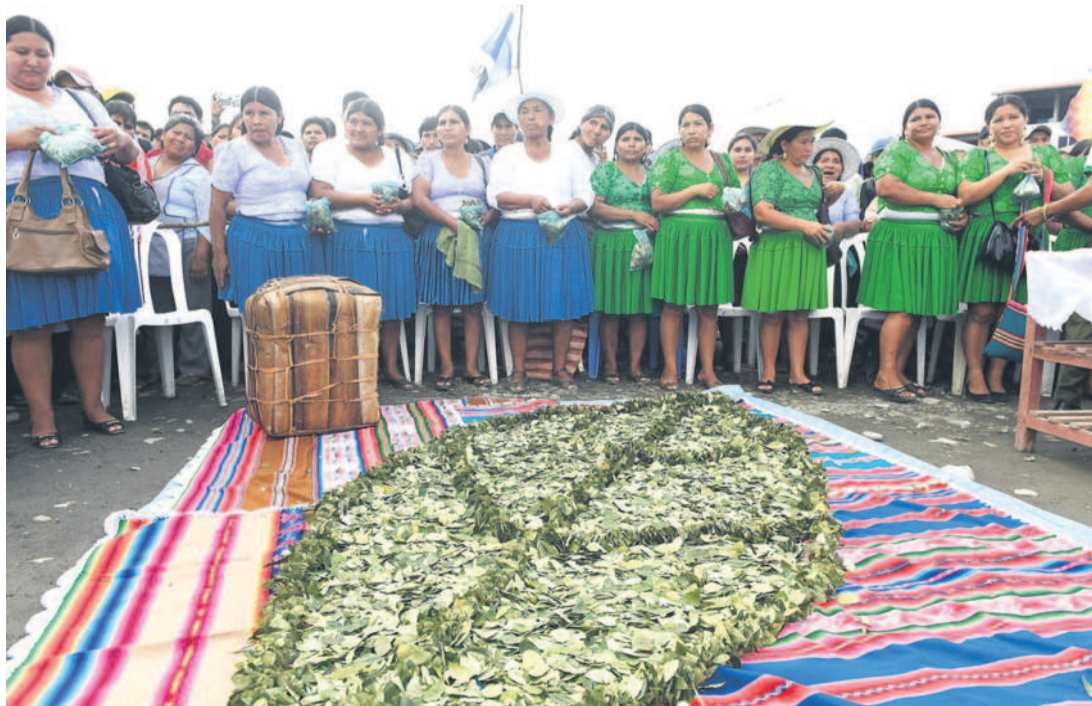
Comunarios de Paractito en un día de defensa del acullico prepararon una hoja de coca gigante.

“¿Usted vio esas series de narcos? ¿De Pablo Escobar? Allá es así. En Paractito hay fiestas de lujo, vehículos de lujo”, expresó el oficial policial.