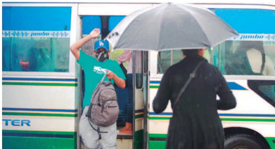
Los trasportistas insisten en que se necesita hacer un ajuste al precio del pasaje