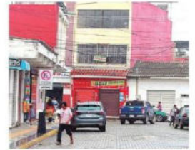
En Los Pozos hubo asaltos

para mostrar los resultados del modelo económico. El INE dice que el bloqueo evista afectó, pero hay críticas A10