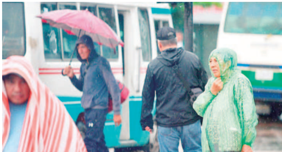
La gente esperó el paso de los micros en medio de la lluvia