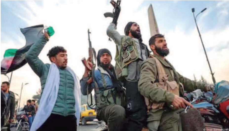
Las facciones rebeldes entraron la madrugada del domingo a Damasco