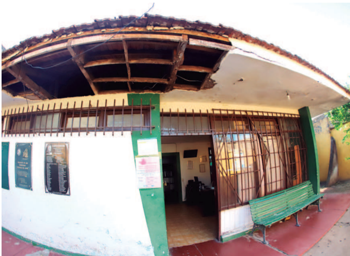
La sede de Fecrupdi está en malas condiciones por la falta de inversión pública en infraestructura