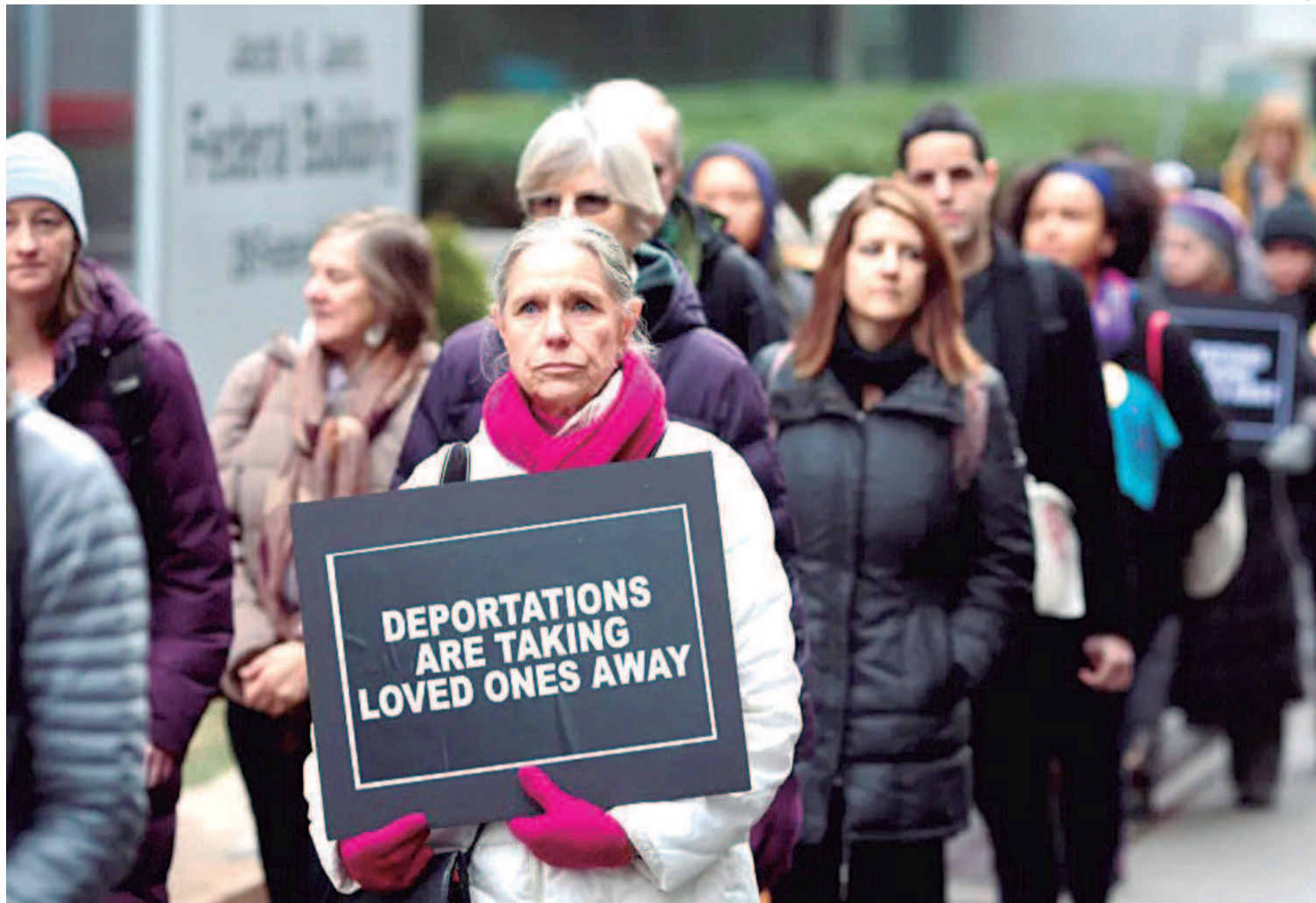
Una pancarta con un mensaje en contra de la política de deportación de Estados Unidos. Hay mucha incertidumbre