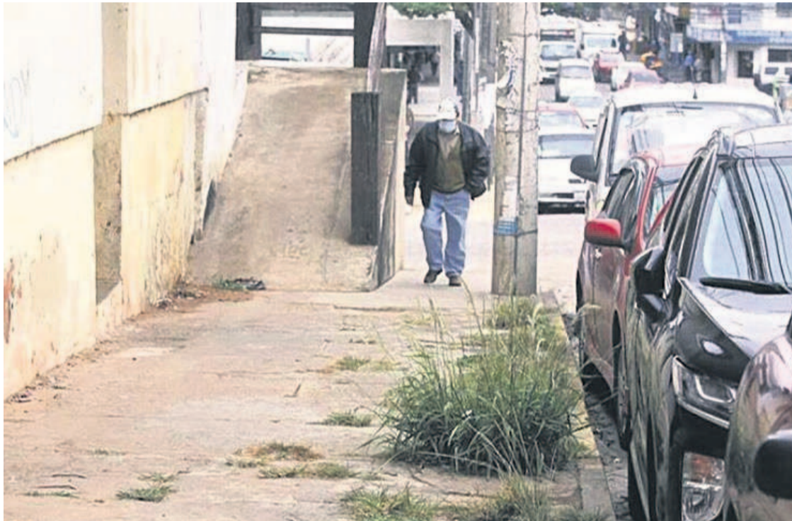
Las barreras arquitectónicas son uno de los grandes problemas con los que enfrentan cada día