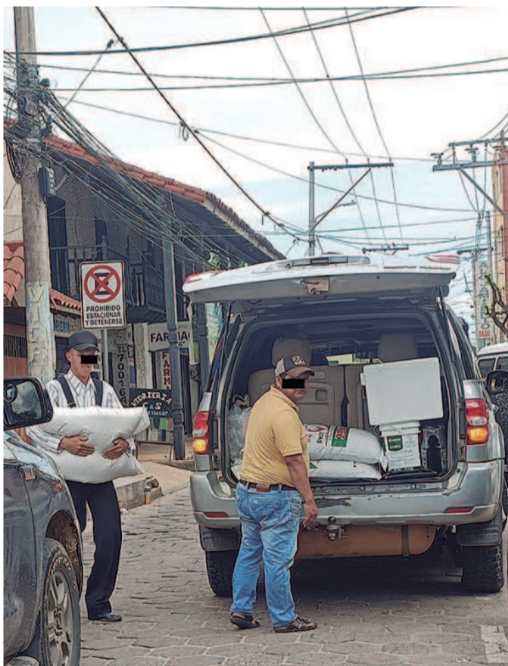
Personas compran insumos agroquímicos en la zona de Los Pozos

Landívar dijo que el decaimiento de población es notoria. "La gente se va a vivir a otros lados"