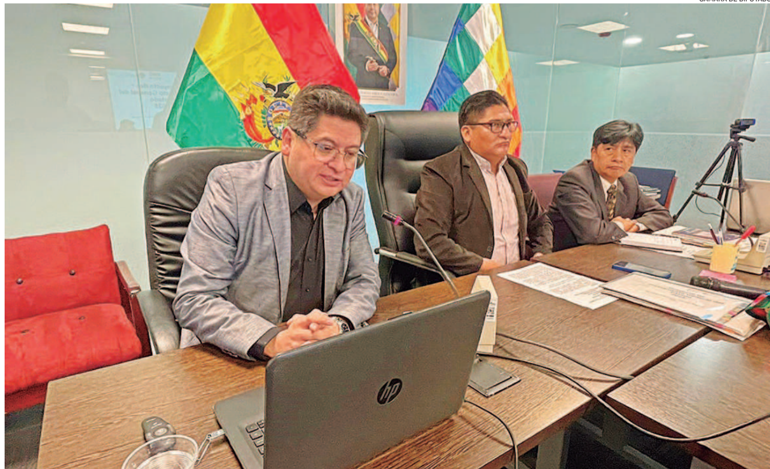
El ministro de Economía, Marcelo Montenegro, explicó los alcances de la Ley Financial a la Comisión de Planificación de la Cámara de Diputados.