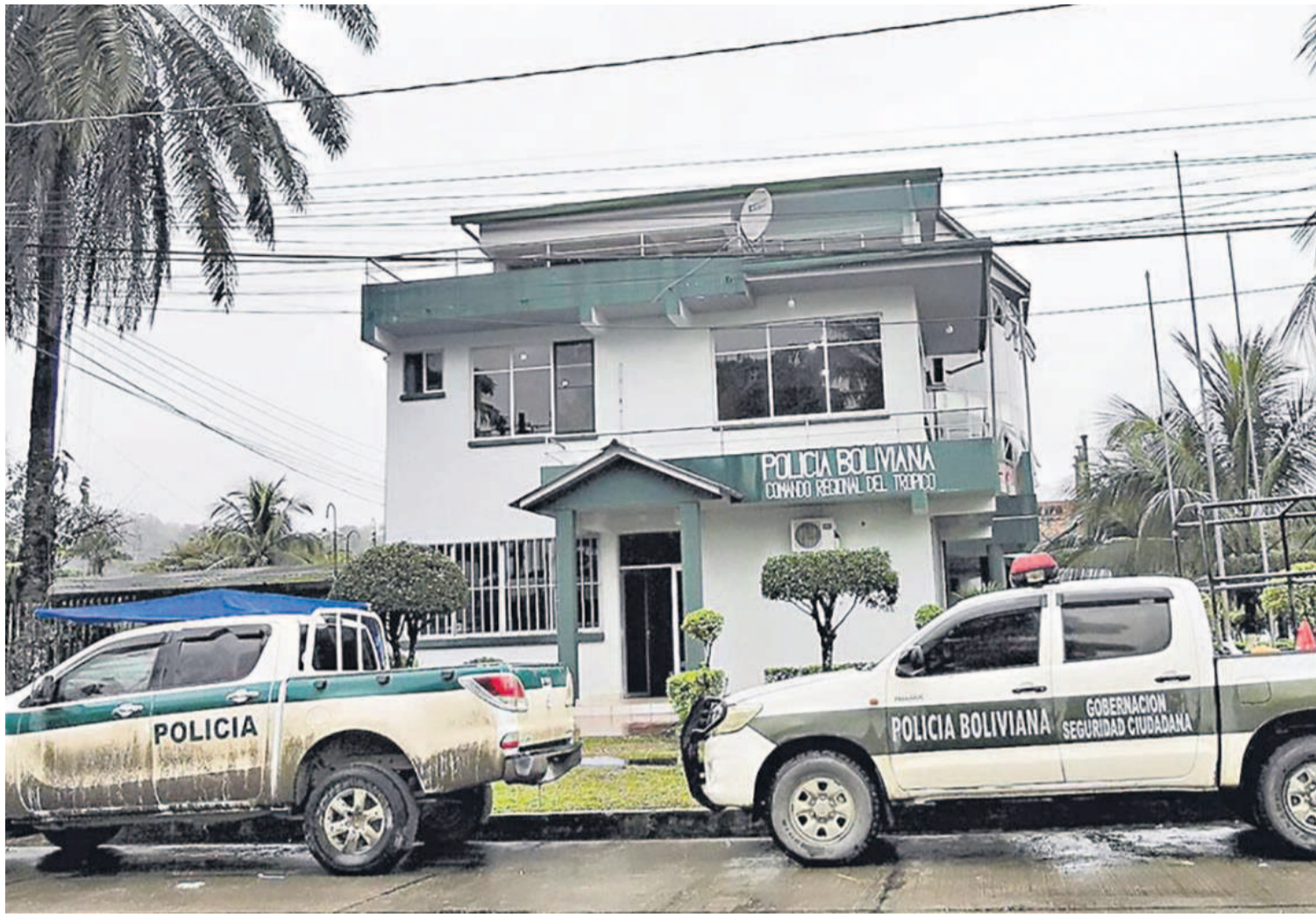
La Policía Boliviana no logró retornar al trópico de Cochabamba por falta de condiciones. En esa región dominan los grupos delincuenciales.