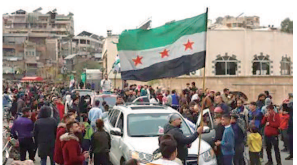
La gente flameó banderas y los refugiados sirios en Jordania se preparan para regresar