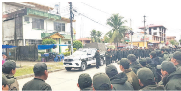
Los policías fueron expulsados y amenazados varias veces.