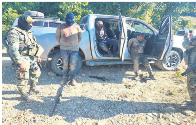
La Policía detuvo a dos personas que se dedicaban al sicariato.