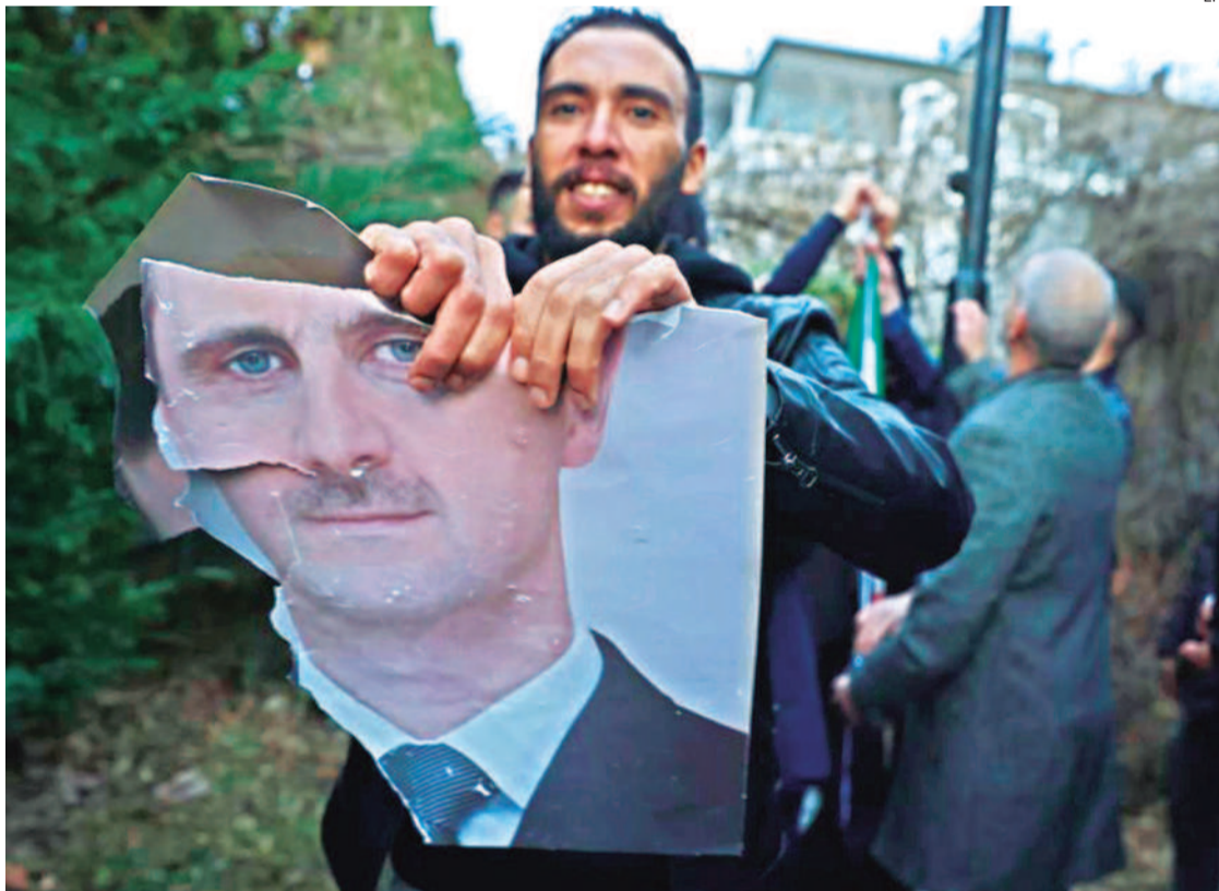
Un rebelde sirio destruye la fotografía del mandatario destituido, quien ya se encuentra en Rusia,

La misión de expertos de la ONU que desde 2011 investiga las violaciones de derechos humanos en Siria calificó la caída del régimen de Bachar al Asad como "un histórico nuevo comienzo para un pueblo que ha sufrido 14 años de atrocidades" y lo consideró una oportunidad para que se dé paso a una era más respetuosa con los derechos humanos en el país.