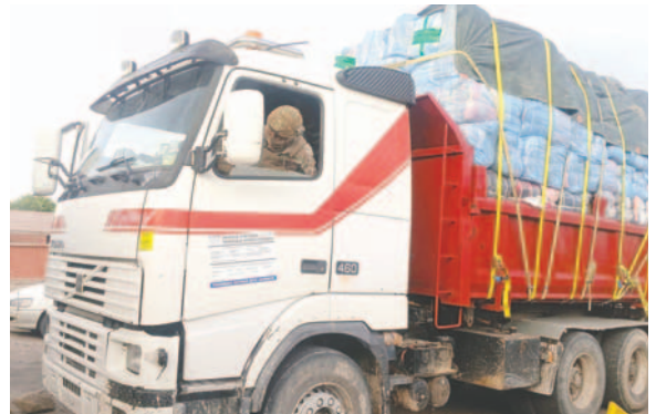
El camión con fardos de ropa usada fue trasladado a la Aduana

LCC) causando daños materiales. Tras los ataques se efectuó el repliegue de militares, logrando el traslado del camión a la Aduana de Oruro, con una afectación al contrabando aproximado de Bs 420.000.