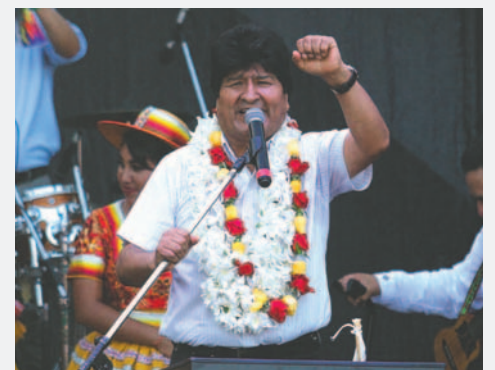
El exmandatario Evo Morales

Loza también mencionó que han visto la convocatoria del Pacto de Unidad y las seis federaciones del trópico de Cochabamba, lo cual refuerza el sentido de unidad entre los sectores afines al MAS en esta conmemoración.