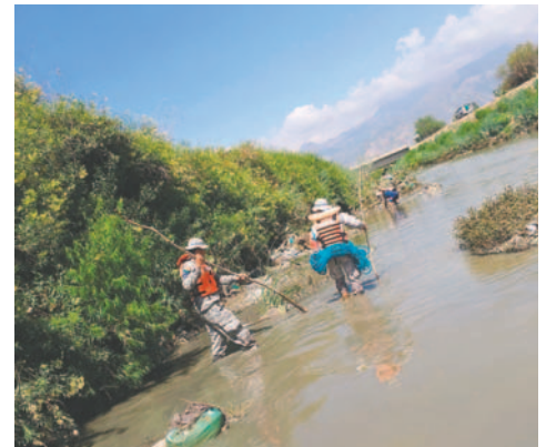
Personal de rescate, en la búsqueda de una mujer desaparecida

Las lluvias han generado un aumento en el caudal de los ríos, lo que ha llevado a situaciones similares en otras comunidades cercanas.