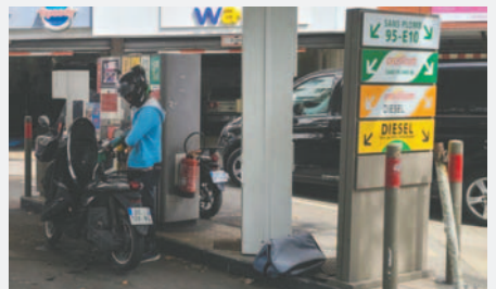
La OPEP+ ha decidido aplazar hasta el 1 de abril su plan para aumentar gradualmente la oferta de crudo