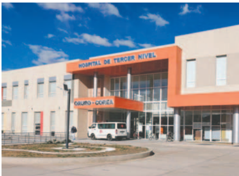
El sujeto está en terapia intensiva del Oruro-Corea tras reventarle un envoltorio con droga