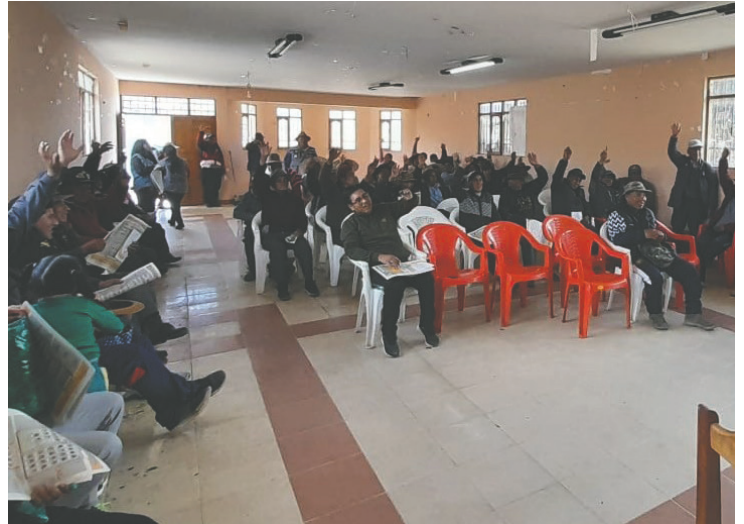
Comunarios escucharon las propuestas mineras en el marco de la Consulta Previa como derecho fundamental de los pueblos indígena originario campesinos y comunidades interculturales