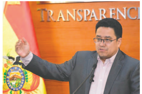
El ministro de Justicia, César Siles

En este caso, Morales es investigado por la presunta relación que mantuvo con una adolescente de 15 años. Dentro de las investigaciones, el padre de la presunta víctima fue aprehendido y encarcelado preventivamente en el penal de Morros Blancos. En su declara-