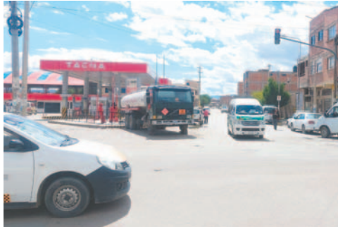
ANH garantiza normalización de despacho en combustibles líquidos

“Como se puede verificar, no existen filas para gasolina en todas las estaciones de servicio, no solamente de la ciudad, sino