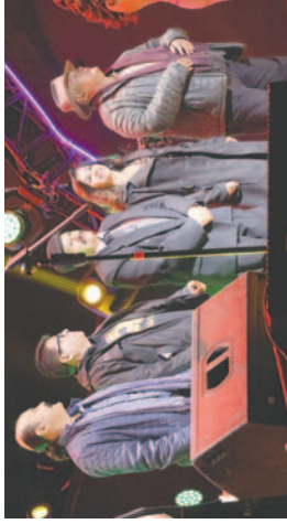
Jurados del festival recibieron la ovación del público

Los jurados calificadores del Festival Nacional de la Canción Boliviana "Aquí... Canta Bolivia" hicieron su paso por la alfombra roja, junto a representantes sindicales y organizaciones locales, incluyendo miembros de la Federación Sindical de Trabajadores Campesinos de Oruro y representantes de la Federación Bartolina Sisa.