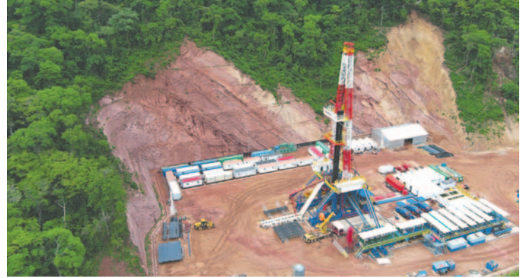
Los trabajos de perforación en el pozo Ñau-X3D comenzaron el martes precedente

El pozo Ñau-X3D está ubicado en el área Ñau, desplegada en la zona tradicional petrolera del país. El prospecto exploratorio está ubicado en el departamento