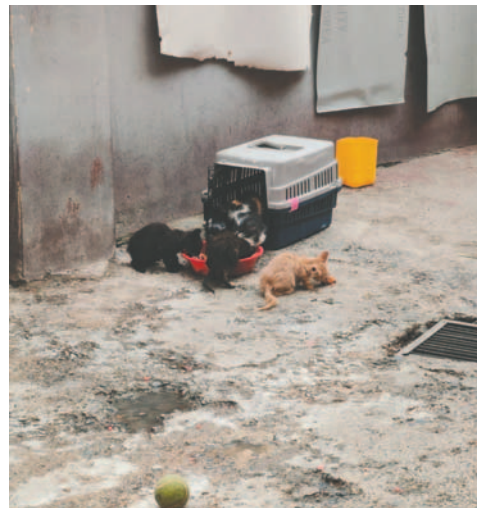
Allanamiento permitió rescatar a varias mascotas

“Ante la denuncia verbal, la Fiscalía hizo los primeros actos investigativos; entre ellos, se solicitó al juez de control jurisdiccio-