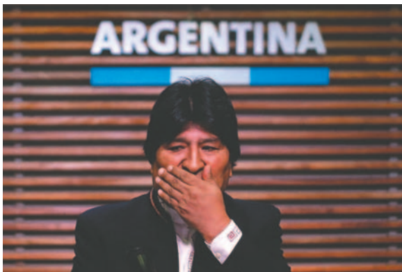
Evo Morales también enfrenta acusaciones en Argentina

El proceso penal tiene diferentes etapas; actualmente se está en la etapa preliminar porque aún no fue imputado.