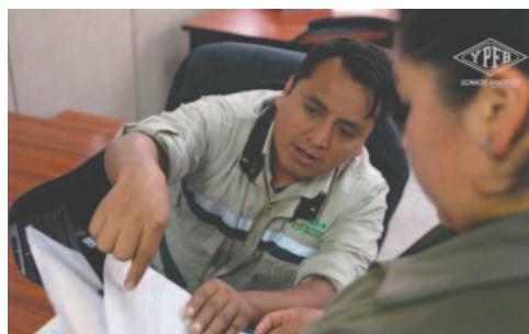
De momento la ventanilla única funciona en Santa Cruz y La Paz

En La Paz, la ventanilla está ubicada en el edificio de la calle Bueno, donde se han registrado 30 consultas y cinco inicios de trámite. En Santa Cruz, las cifras alcanzaron 200 consultas y diez trámites iniciados, según el gerente de Comer-