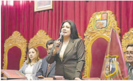
Decana del Consejo de la Magistratura, Sandra Soto /CMB