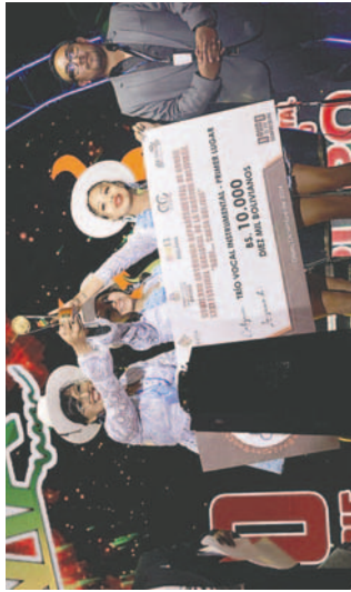
El Festival se realiza en su trigésima primera versión