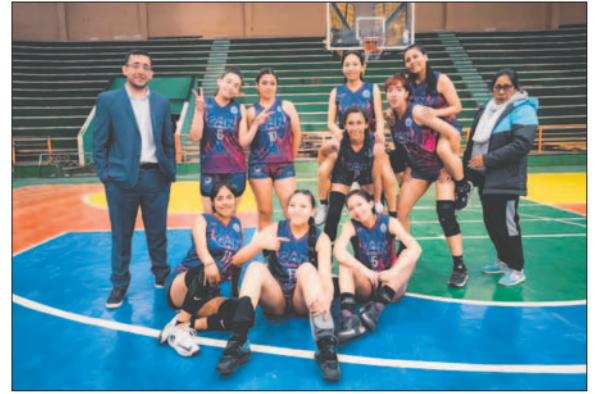
El equipo de CAN en busca de la clasificación a la final

Tarija Básquet llega con el "ojo en tinta" por la pérdida del invicto en casa, pero con la necesidad de revertir el panorama en la semifinal. Las tarijeñas ya conocen victorias en Oruro, un reducto que visitaron en dos ocasiones en la fase de grupos, logrando triunfos ante Uriona