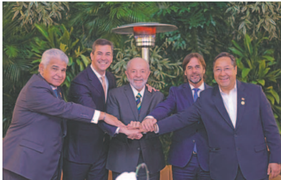
Bolivia participará por primera vez como miembro pleno

les, Arce dio a conocer que dejó el bastón presidencial al vicepresidente, David Choquehuanca, e informó sobre su partida a Uruguay para ser parte de la actividad. "Partimos rumbo a la hermana República Oriental del Uruguay para participar de la Cumbre de los Presidentes de los Estados parte del Mercado Común del Sur y cumplir una importante agenda de trabajo en favor del pueblo boliviano", escribió en su cuenta de X.