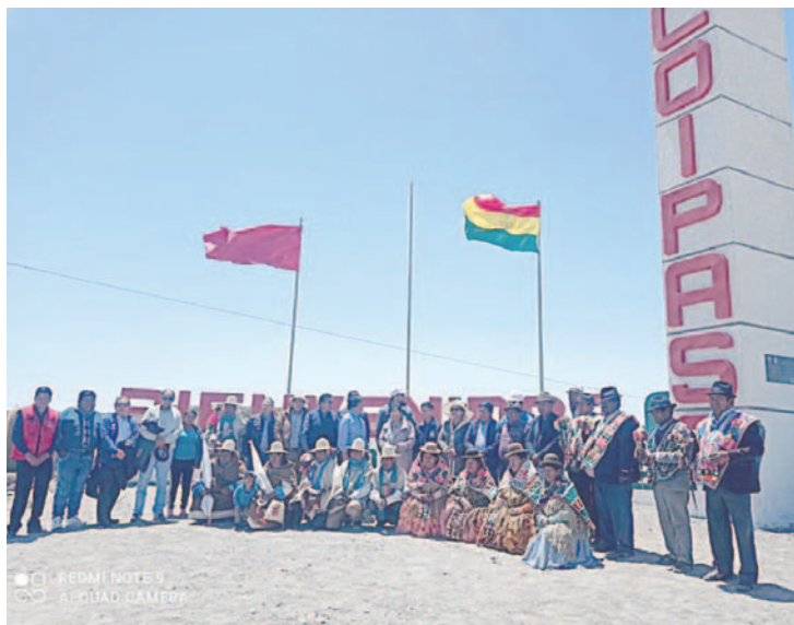
Se busca explotar los recursos evaporíticos en el Salar de Coipasa