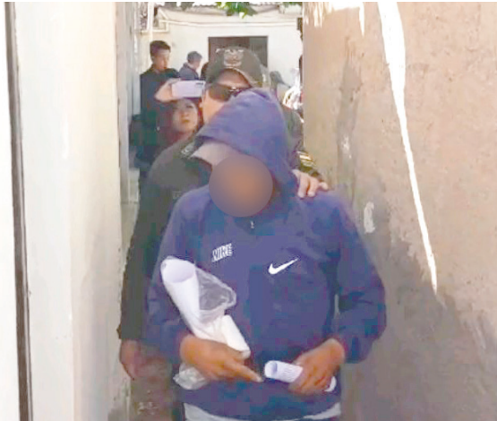
El imputado por abuso sexual en instalaciones de la Fiscalía

“En primera instancia, la víctima refiere que el tío se acostaba en la cama junto a la víctima y le procedía a realizar toques impú-