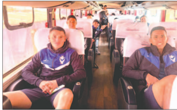
El equipo de GV San José viajó a La Paz en busca del triunfo / GV SAN JOSÉ