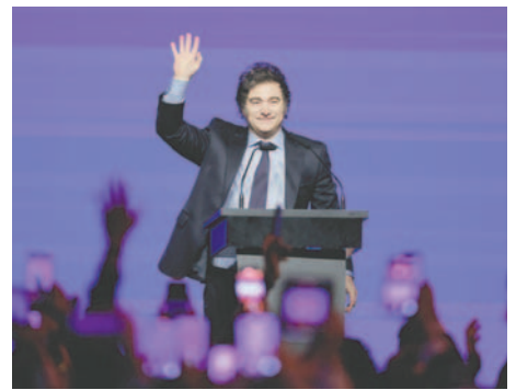
El presidente de Argentina, Javier Milei, habla durante la Conferencia Política de Acción Conservadora (CPAC) este miércoles, en Buenos Aires (Argentina)

“No cuenten con nosotros”, fue la frase de cabecera de Milei durante su intervención en la cumbre del G20 en Río de Janeiro, pese a que dio su visto bueno al documento final con observaciones en todos los puntos relacionados con los objetivos de Desarrollo Sostenible propuestos por la ONU.