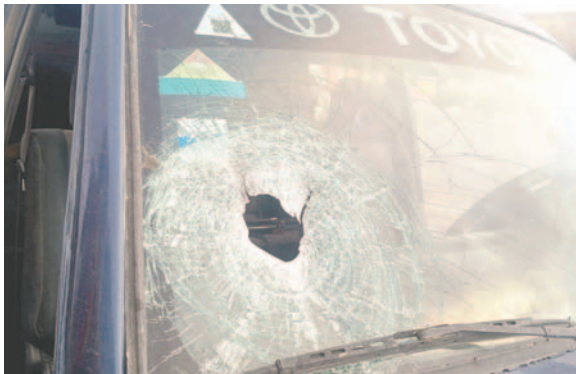
Uno de los vehículos del CEO terminó con daños materiales

so de otros camiones, la población se reunió en gran cantidad, lanzando cachorros de dinamita y piedras, logrando impactar en un vehículo del Comando Estratégico Operacional de Lucha Contra el Contrabando (CEO-