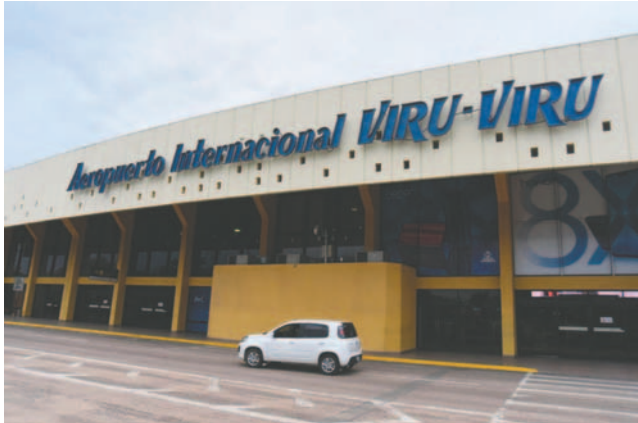
El Aeropuerto Internacional Viru Viru, en Santa Cruz /REFERENCIAL

La aeronave de TAB, con matrícula CP-2791, sufrió un incidente en el procedimiento de aterrizaje en el aeropuerto de Viru Viru. Esto obstruyó la pista 16/34 y perjudicó algunas operaciones de salida y llegada, tanto de vuelos nacionales como internacionales. "Son diez vuelos los que hemos tenido afectados: tres de salida y siete de llegada. La mayor afectación fue para vuelos internacionales", dijo el director regional de Navegación Aérea y Aeropuertos (Naabol) de