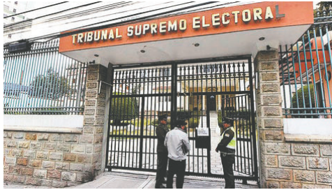
El TSE no mandó hasta ahora la solicitud de reposición

Dado que la sesión de la comisión fue realizada antes del cambio de directiva de la Cámara, todos los proyectos de ley que no se trataron o cuyo tratamiento fue inconcluso fueron devueltos a la secretaría de Cámara para que el proyectista reencause el tratamiento legislativo en la próxima gestión, es decir, la actual 2024/2025.