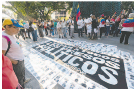
Foto de archivo de un grupo de personas en una vigilia en Caracas (Venezuela), familiares y amigos de los considerados “presos políticos”

Asimismo, indicó que “la pobreza” de estas madres, que ya manifestaban “el sacrificio que significaba llegar a Yare