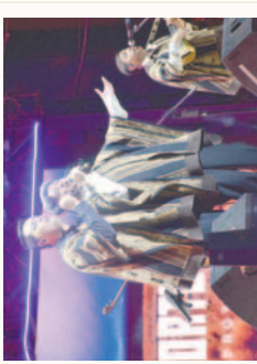
La Nueva Proyección conquista al público en el inicio del festival

Este festival. Los espectadores acompañaron la actuación cantando y aplaudiendo, creando un ambiente festivo. Este evento de competencia reunió a talentos de todo el país, quienes brillaron con su voz y arte en diversas categorías. La música folclórica fue el hilo conductor que unió a los asistentes en una celebración cultural. El Teatro Internacional Oruro se presentó como segundo grupo invitado, destacando su orgullo por estar nuevamente en Oruro y participar en la noche del festival.