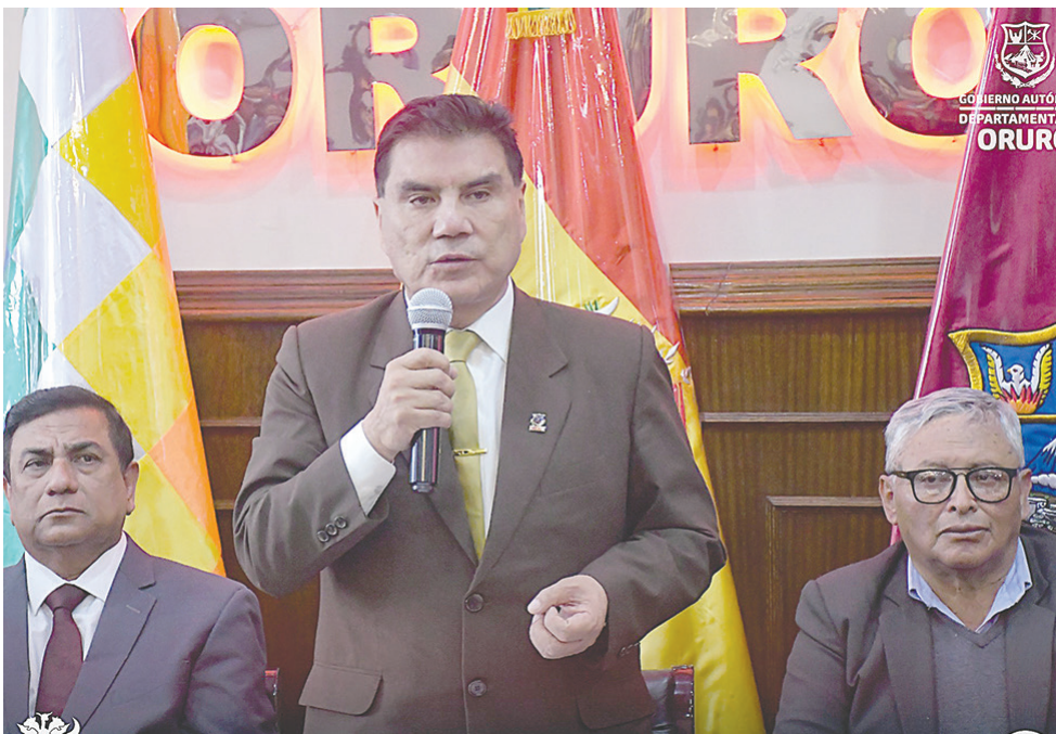
La firma de convenio se efectuó en la Gobernación /Gador

Las empresas internacionales EAU Lithium PTY de Australia y Alemania,