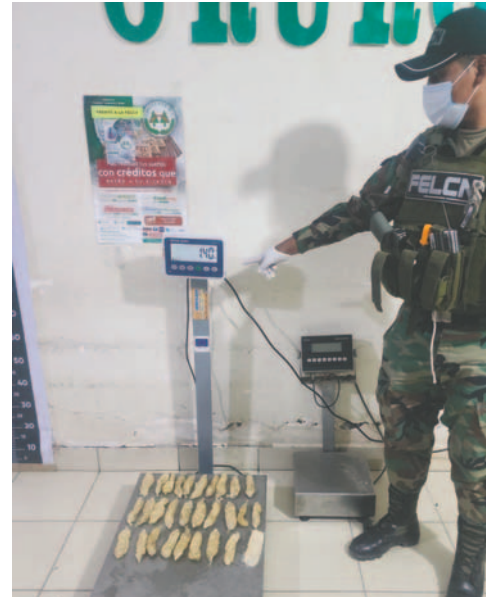
Hallaron 22 envoltorios en el organismo del sujeto, calificado como “tragón”

La situación pone de manifiesto los riesgos asociados al tráfico y consumo de drogas en la región. Las autoridades continúan investigando las circunstancias que rodean este caso para determinar redes de narcotráfico.