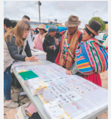
Capacitación a jurados de mesa para las Elecciones Judiciales 2024

Se proyecta que se capacitarán alrededor de 3.768 jurados electorales que corresponden a 628 mesas de sufragio.