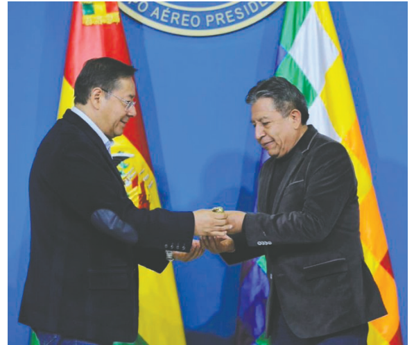
El Presidente Luis Arce entrega el Bastón de Mando al vicepresidente, David Choquehuanca, antes de viajar a Uruguay

Asimismo, la ministra de Relaciones Exteriores, Celinda Sosa, participó en la LXV Reunión Ordinaria del Consejo del Mercado Común (CMC), a la cual asistie-