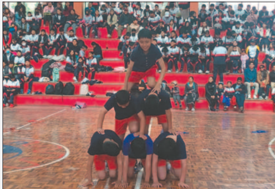
Los niños en su demostración formando algunas pirámides

"En primer lugar agradecer a Dios, en segundo lugar informarles que este año deportivo fue fabuloso, maravilloso, pero también indicar que el ejercicio corporal aprovecha para este momento deportivo, pero el ejercicio espiritual se aprovecha para esta y para la otra vida", señaló.