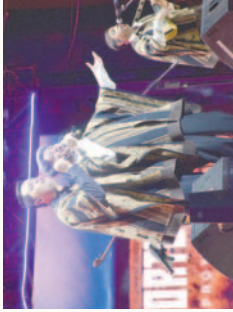
La Nueva Proyección conquista al público en el inicio del festival

Este festival. Los espectadores acompañaron la actuación cantando y aplaudiendo, creando un ambiente festivo. Este evento de competencia reunió a talentos de todo el país, quienes brillaron con su voz y arte en diversas categorías. La música folclórica fue el hilo conductor que unió a los asistentes en una celebración cultural. El Teatro Internacional Oruro se presentó como segundo grupo invitado, destacando su orgullo por estar nuevamente en Oruro y participar en la noche del festival.