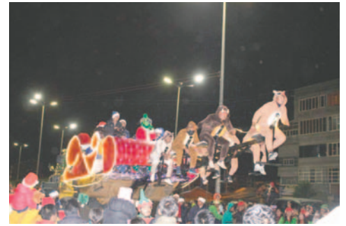
Por segundo año, renos voladores formarán parte de Caravana Navideña

Una de las empresas que formará parte importante de esta caravana será