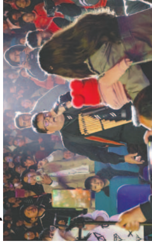
El vocalista del grupo interactuó con el público presente

El festival "Aquí Canta Bolivia" se lleva a cabo en el Teatro Internacional de Oruro, donde el Grupo Amaru deslumbra al público con su talento, destacando su exitoso tema "Cholita Cochabambina" y una vibrante presentación de Morenada, en una noche llena de ritmos folclóricos que hizo bailar a los asistentes los jueves 5 de diciembre.