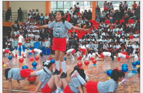
La actividad se realizó en medio de bastante expectativa

"Los estudiantes presentaron pirámides humanas por parte de