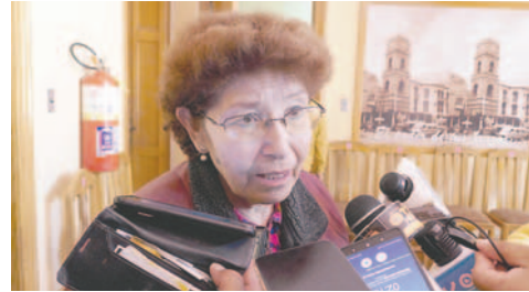
Asambleístas de la Carta Orgánica Municipal demuestran complacencia tras aprobación del proyecto