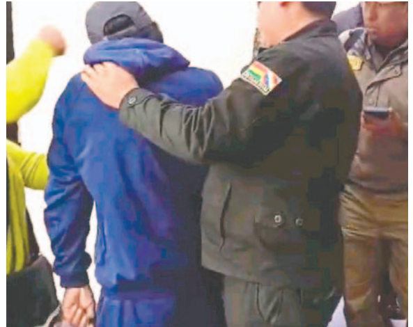
Cercanos a la víctima increpan y golpean al implicado

Tras la denuncia y en la etapa preliminar, dieron con el verdadero nombre del implicado, ya que la denuncia fue hecha con