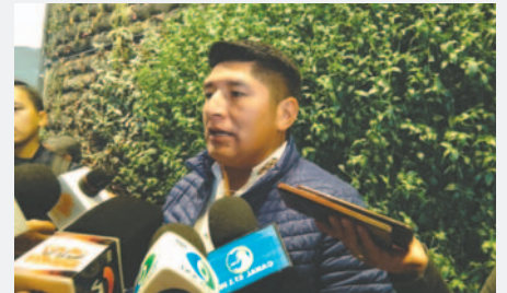
Diputado Hernán Hinojosa en contacto con los medios de comunicación