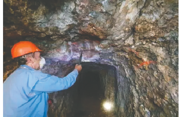
La empresa iniciará con trabajos de exploración en la región minera

Del pago en efectivo del primer año de $40.000 USD, la Compañía ya ha pagado $20.000 USD y el saldo debe pagarse dentro de los 15 días posteriores al cierre.