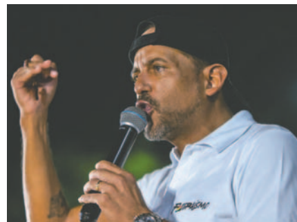
Fernando Camacho se pronunció mediante redes sociales en contra de las declaraciones de Arce