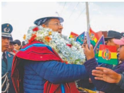
Las declaraciones de Luis Arce se dieron durante un acto en El Alto

Ante el reclamo, Arce respondió: “Otra vez como en 2007 y 2008, los cambitas nos están jugando sucio”, haciendo referencia a conflictos similares ocurridos durante el primer mandato de Evo Morales, cuando