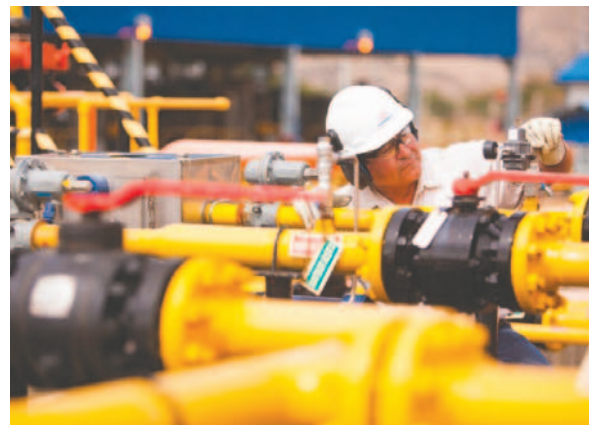
Ductos de gas bolivianos serán empleados para comercio entre Argentina y Brasil

Es de tal magnitud la reserva, que Argentina cerró un acuerdo con Brasil para venderle el produc-