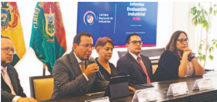
Representantes de la CNI presentaron su informe de 2024