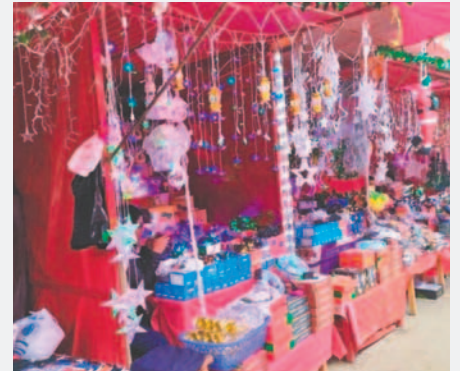
En ferias de fin de año, EMAO reforzará limpieza nocturna