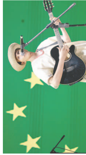
Mucho talento nuevo se vio en la primera jornada