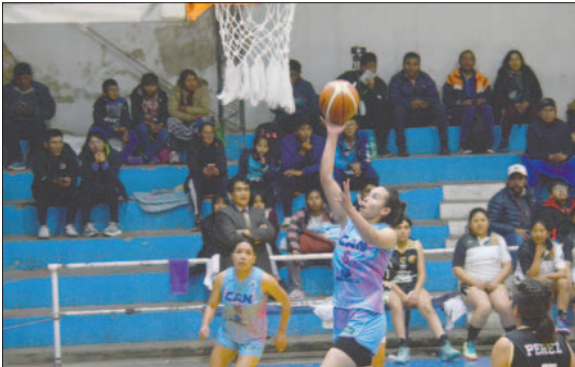
Las jugadoras están motivadas para conseguir la victoria