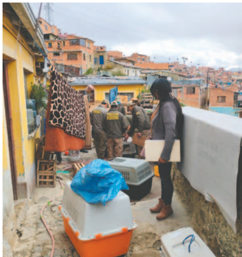
La propietaria es investigada por biocidio y tratos crueles