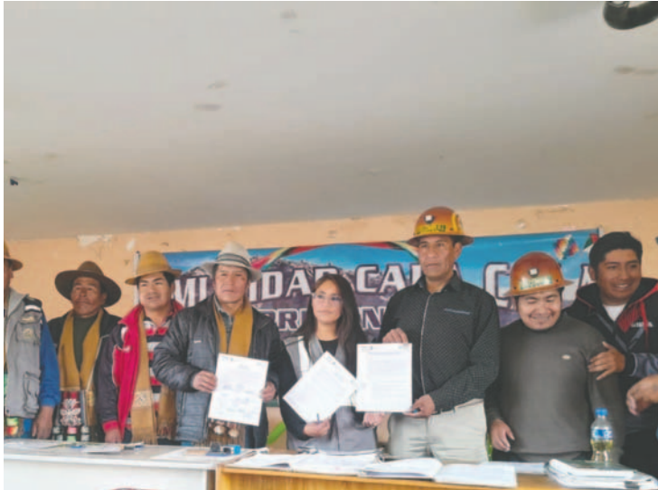
De la reunión deliberativa participaron autoridades originarias de Cala Cala, AJAM y APM