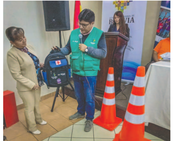
Unidades Educativas reciben mochila tras elaboración de planes de contingencia /ESTRELLA DEL SUR

En el acto de cierre del proceso, se realizó la entrega de material que comprende una mochila de emergencia, la cual contiene una serie de materiales para hacer prevención en unidades educativas, además de extintores y señalética.