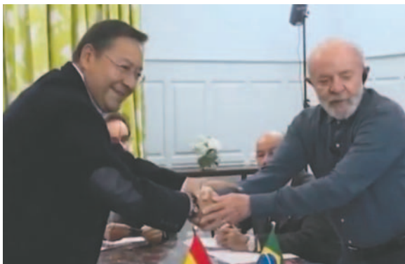
El presidente Luis Arce y su similar de Brasil, Luiz Inácio Lula da Silva, en Montevideo, Uruguay

De acuerdo con el Gobierno nacional, Bolivia captará un ingreso de más de $us 10 millones al mes por la exportación de gas de Argen-