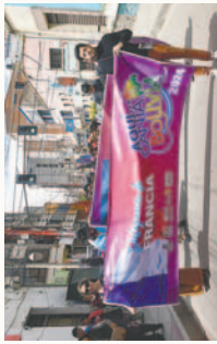
Delegaciones del Festival recorren las calles de Oruro en un desfile / ES/CON