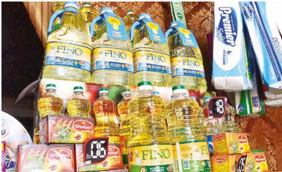
La distribución de aceite comestible en el mercado interno disminuyó. HERNAN ANDIA

La suspensión de exportaciones se complementa con un incremento en los controles de comercialización. El Vi-