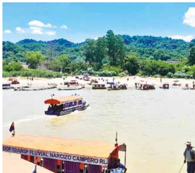
Imponente vista panorámica del río Bermejo.

secretario ejecutivo de la Federación Regional de Trabajadores Gremiales de Bermejo. Este auge representa un alivio para el comercio, que enfrentaba meses de bajo desempeño debido a la reducción de la actividad económica en la región.