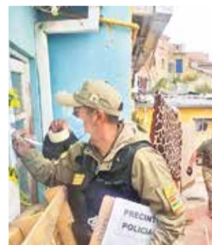
El allanamiento a la casa en La Paz ayer. APLAB

En el inmueble se encontró también animales vivos: 19 gatos y 25 perros. “(Hay que) hacer notar que estos animales estaban viviendo una situación completa-