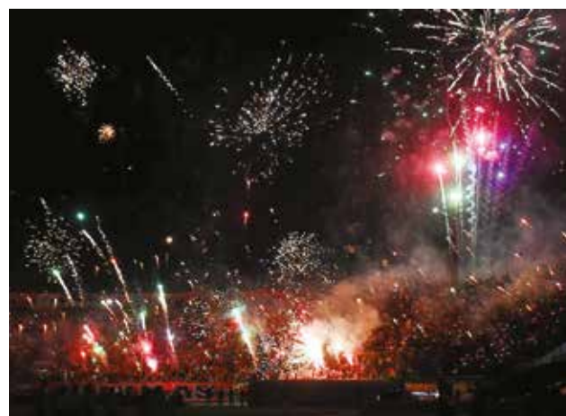
Recibimiento al Aviador con pirotecnia y juegos artificiales.