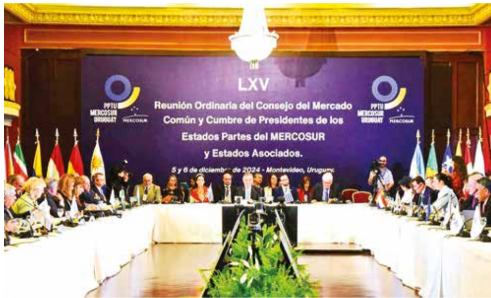
Reunión de los cancilleres de los cinco países del Mercosur, ayer en Montevideo.

Antes de la reunión, el canciller de Uruguay mantuvo una reunión bilateral con el comisario europeo de Comercio y Seguridad Económica, Maros Sefcovic.