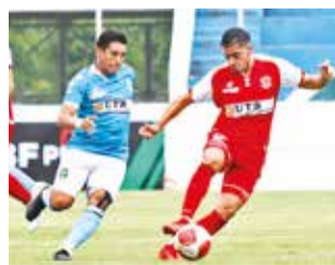
Duelo pasado entre San Antonio y la "U". APG

Sin embargo, ambos quieren mejorar su campaña: la "U"