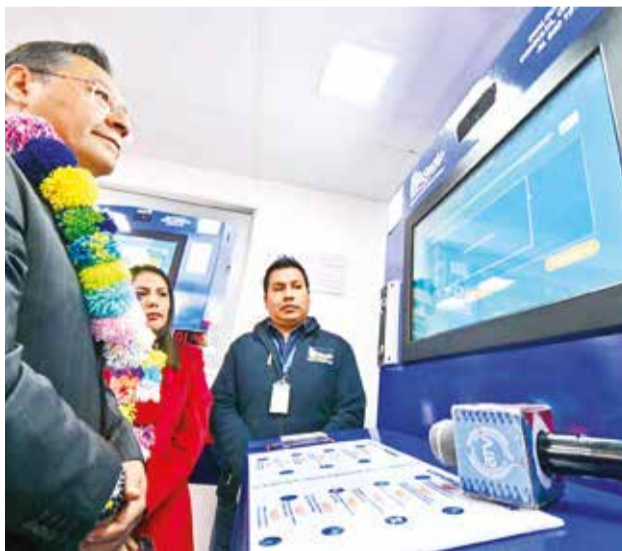
El presidente Luis Arce, en la apertura de la estación.

En tanto, el presidente Arce remarcó durante la