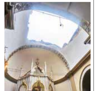
La cúpula del templo de Villa Rivero. CANAL 50

“Sabemos que su intervención es muy costosa. Vamos a ver la manera de apoyarles, tal vez, buscar algún