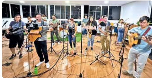
Uno de los ensayos del ensamble Rosquete.