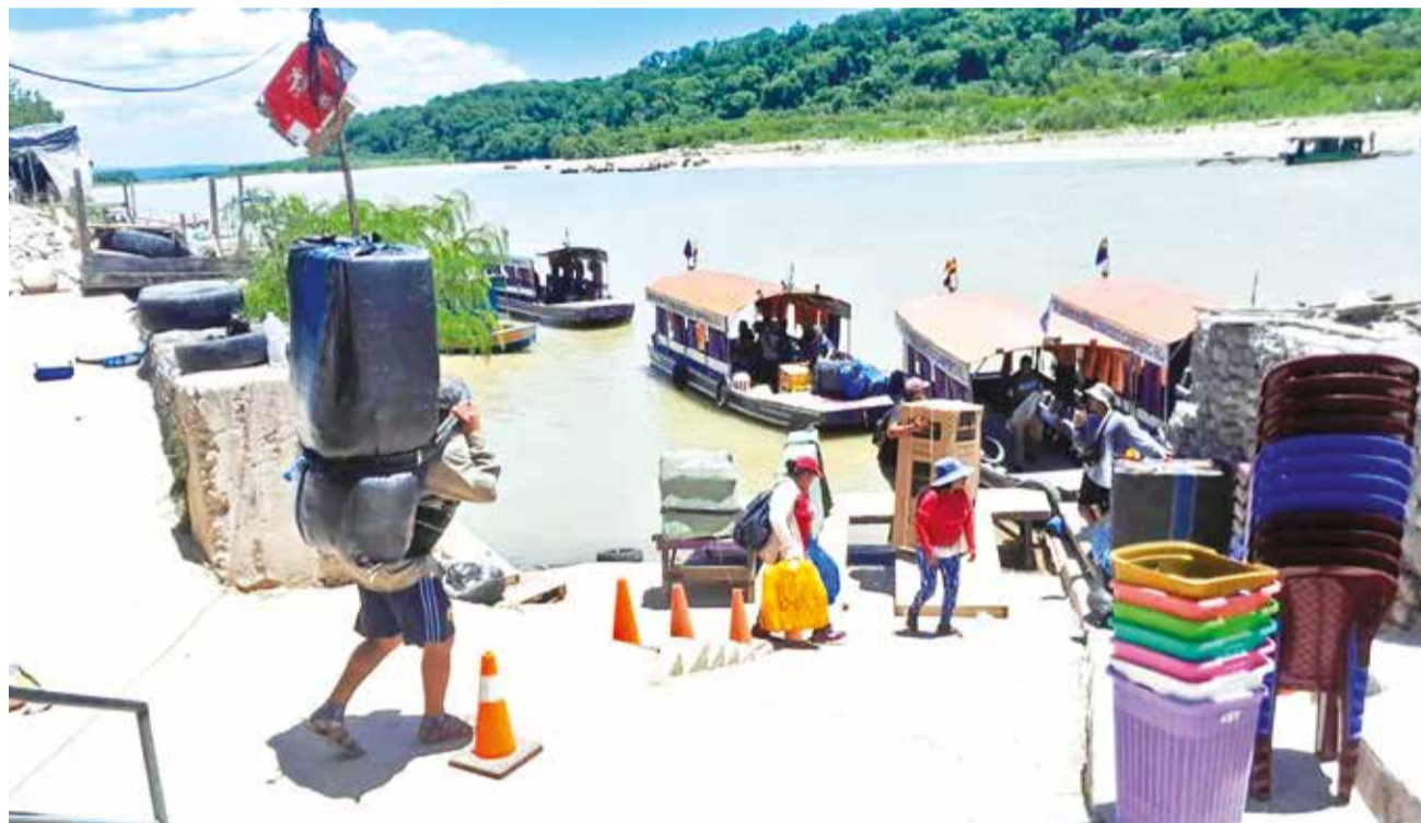
Un hombre transporta una bolsa de mercadería sobre su espalda, preparándose para cruzarla al lado argentino.