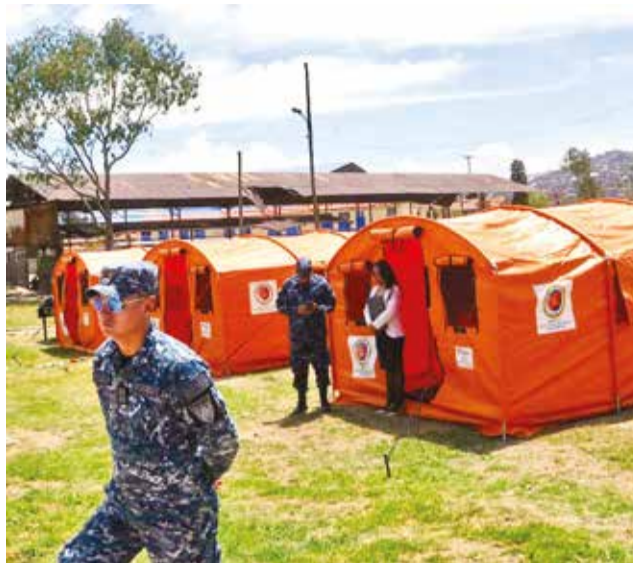
La entrega de carpas para grupos de rescate. HERNÁN ANDÍA