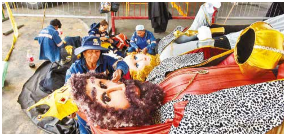
El armado de esculturas gigantes para el pesebre en Obras Públicas ayer.

Otro atractivo que preparan desde hace dos semanas los trabajadores de Obras Públicas son las esculturas de los personajes del Nacimiento del Niño Jesús, varios de ellos miden de dos a cuatro metros de alto. Estos serán instalados el próximo lunes.