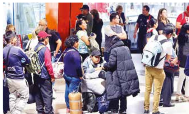
Pasajeros esperan tomar su vuelo en Viru Viru.

Afectación. Al menos 10 vuelos resultaron afectados debido a la paralización de operaciones de la terminal aérea cruceña