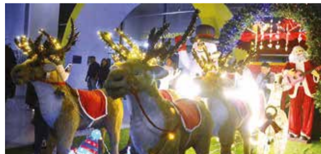
La inauguración de la Feria Navideña en la Fexco.

“Queremos consolidar a Cochabamba como la Ciudad Navidad. Esto va más allá de hacer un municipio hermoso, se pretende ser un referente