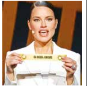
Sorteo del Mundial de Clubes, ayer.