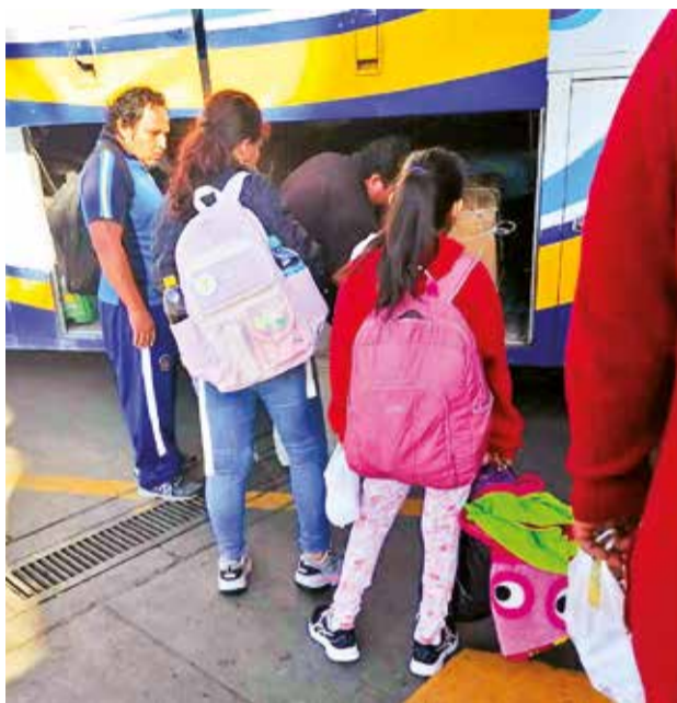
Los controles por parte de la Defensoría. LOS TIEMPOS

En ese contexto, la DNA habilitó 12 puntos para tramitar los permisos de viaje, estos están en la Terminal de Buses (de 6:00 a 22:00), en el