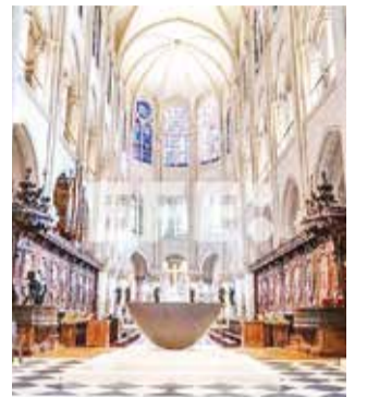
La catedral de Notre Dame, en París.

El turismo de París recupera a Notre Dame, que seguirá siendo gratuita