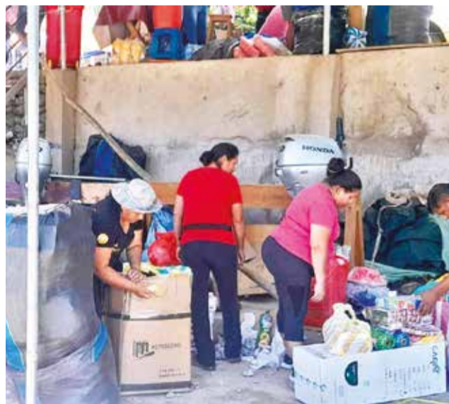
Comerciantes organizan y embalan mercadería.