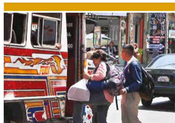
El transporte público en la ciudad. MAURICIO ZEBALLOS

didos ante la medida debido a que no fueron notificados si quiera del inicio del proceso coactivo y directamente recibieron una nota de su entidad bancaria con el anuncio de la retención.