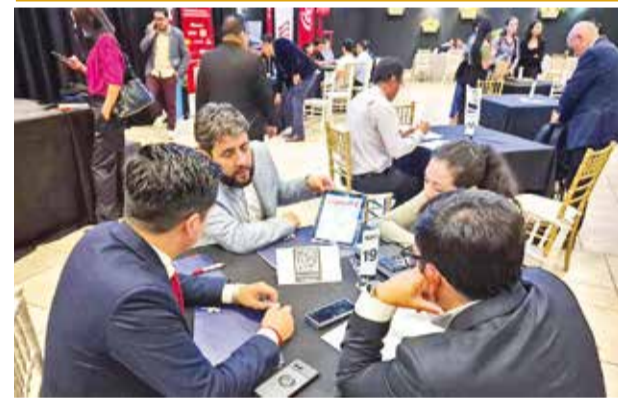
Empresarios negocian en el evento del martes. ICAM

El inicio de esta investigación subraya la necesidad de fortalecer la seguridad y eficiencia en el sistema aeroportuario boliviano. Además, genera expectativas sobre los hallazgos del informe de la DGAC, que será clave para determinar responsabilidades y prevenir futuros incidentes.