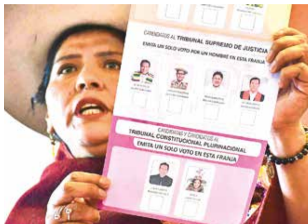
Las papeletas para las elecciones del 15 de diciembre.

"(Se debe) exhortar a todo juez, tribunal y Salas Constitucionales a cumplir lo dispuesto en la SCP 0770/2024-