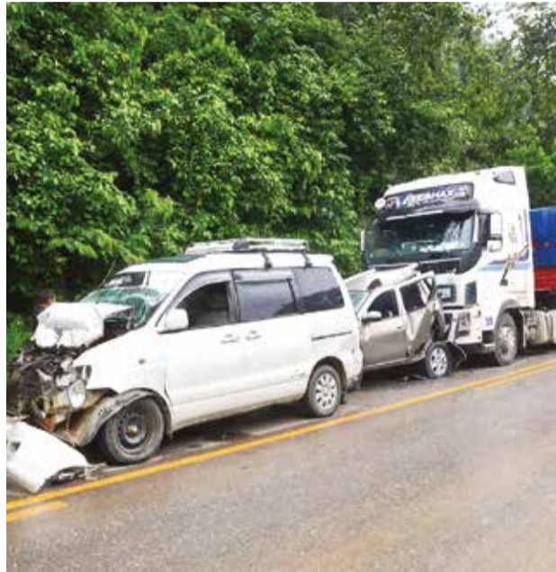
Autos afectados por un choque en Villa Tunari. H. ANDIA

Además, instó a no generar un manto de impunidad fren-