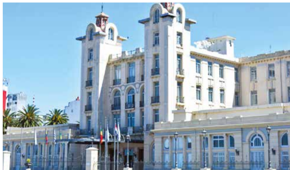
La sede del Mercosur, en Montevideo, Uruguay, donde se realiza la cumbre.

En la agenda de la reunión destaca la discusión sobre el acuerdo Unión Europea-Mercosur, considerado uno de los temas centrales. La cumbre comienza hoy con la reunión de ministros de Economía, Hacienda y presidentes de Bancos