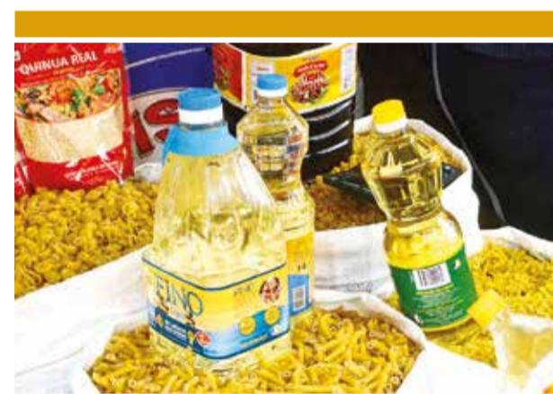
Venta de aceite en tiendas de abarrotes. HERNAN ANDIA

5. Repetición de políticas: Describió al PGE 2025 como una “copia” del presupuesto del año anterior, sin innovación para enfrentar los desafíos actuales.