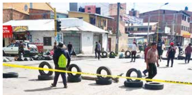
El bloqueo de vías contra el retiro de toldos, ayer.

Movilización. Los dueños de las viviendas del casco viejo bloquearon la avenida Blanco Galindo y otras calles ayer rechazando la disposición