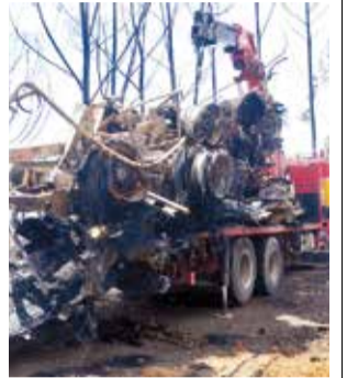
Los restos del cisterna que explotó. H. ANDIA

Además, Claire indicó que aún no lograron deter-