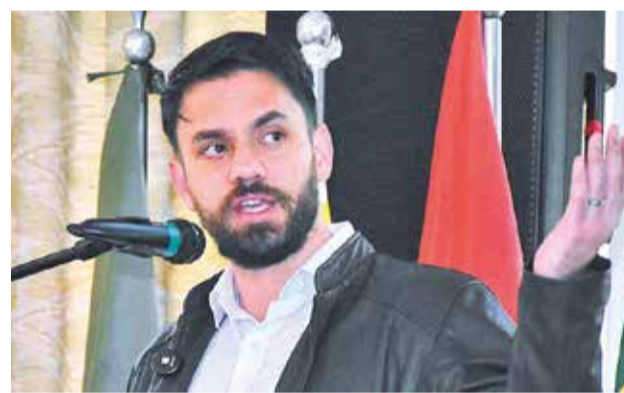
El ministro de Gobierno, Eduardo del Castillo. APG

La autoridad judicial determinó la suspensión porque Condori no tenía representación legal.