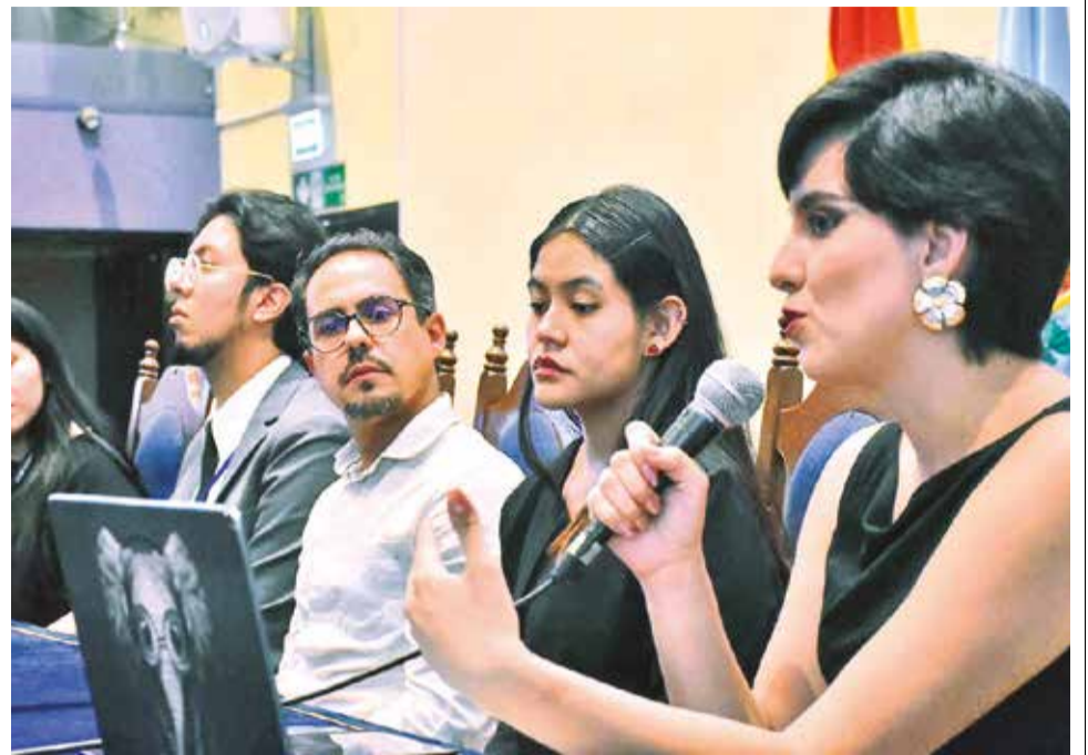
Investigadores que presentaron el estudio, ayer en la UCB.

Chacín señaló que hubo una deforestación en el territorio chiquitano para las prácticas ganaderas y agroindustriales destinadas a la exportación, son extensos terrenos donde se siembra soya y se reemplaza el bosque con pastizal para el alimento del ganado. “Cada año se deforesta 61 mil hectáreas para cultivar