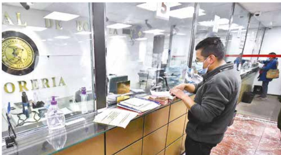
Una transacción en dólares en un entidad financiera del país. APG

El Banco Central de Bolivia (BCB) desempeñó un papel clave al atender la creciente demanda de dólares, contribuyendo a la estabilidad del siste-