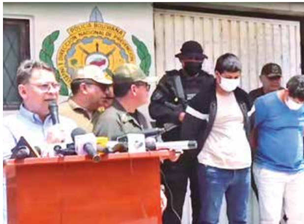
Presentación de los presuntos avasalladores. MIN GOB

La captura de las dos personas sucedió después de que el 29 de