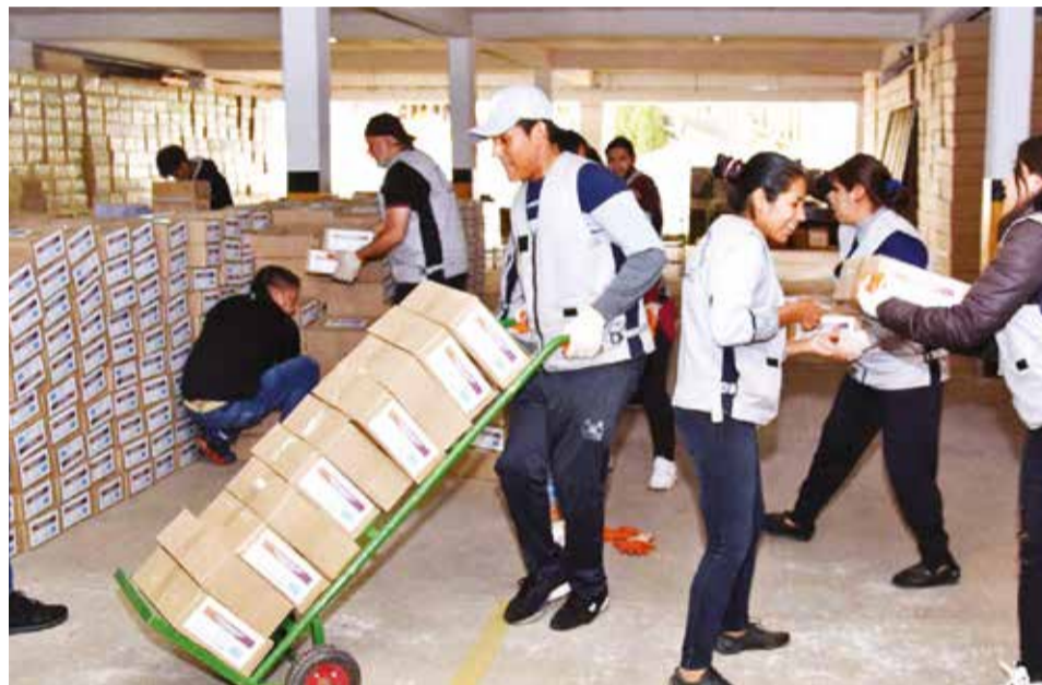
Recepción de material electoral para las judiciales, en el TED de Cochabamba. TED

Otro ciudadano señaló desconocer sobre las judiciales, pero enfatizó que es labor del TSE hallar los mecanismos para que la población se informe al respecto.