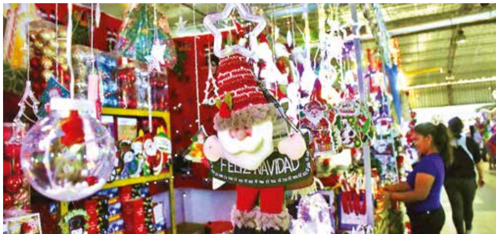
La oferta variada de productos en la Feria Navideña en el campo ferial.

Los visitantes también podrán encontrar trajes para el