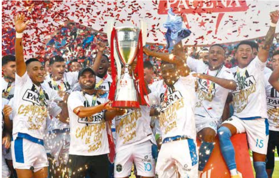
Festejos de los jugadores de San Antonio, el 5 de mayo pasado tras ganar el Torneo Apertura 2024. DANIEL JAMES

En caso de que se oficialice que se tendrá una final única entre los ganadores del Apertura y el Clausura, se deberá realizar una modificación al artículo 17 de la convocatoria