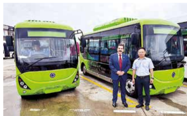
Uno de los prototipos de buses eléctricos.

Desde la Alcaldía de Quillacollo se informó que la intervención se hizo en base a la Resolución Ejecutiva 42/2024, que instruye el retiro de estructuras ilegales en las aceras porque atentarían contra “el libre tránsito peatonal de transeúntes” y pone en riesgo la seguridad pública de los peatones”.