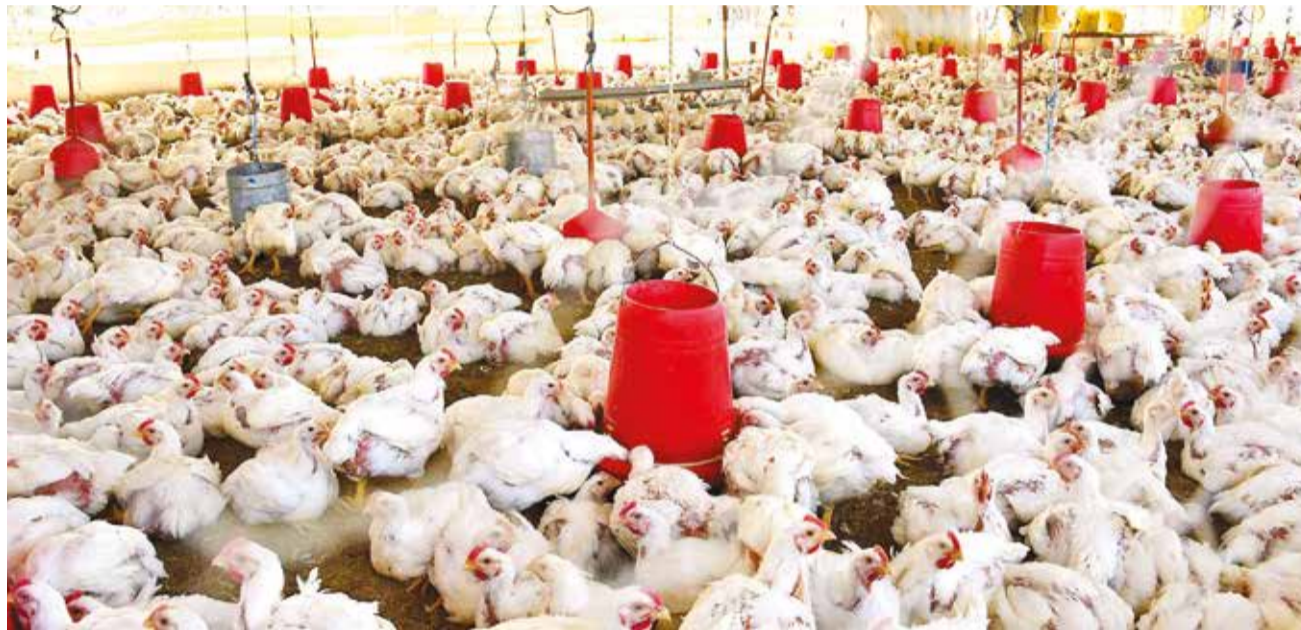
Una granja de pollos en el valle alto del departamento de Cochabamba. CARLOS LÓPEZ

- El Alto: un frigorífico industrial para almacenamiento y distribución de productos procesados.