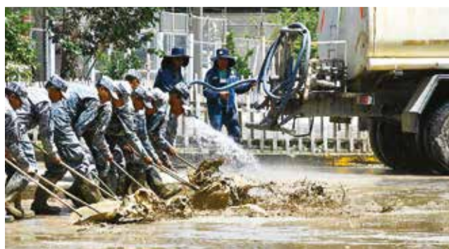
La limpieza de calles en Colcapirhua.

El Concejo aprobó ayer dos leyes y que fueron promulgadas por el Ejecutivo. Se trata de la Ley N° 498 de Declaratoria de Emergencia por Desbordes y la Ley N° 499, la misma aprueba la modificación presupuestaria a la Ley