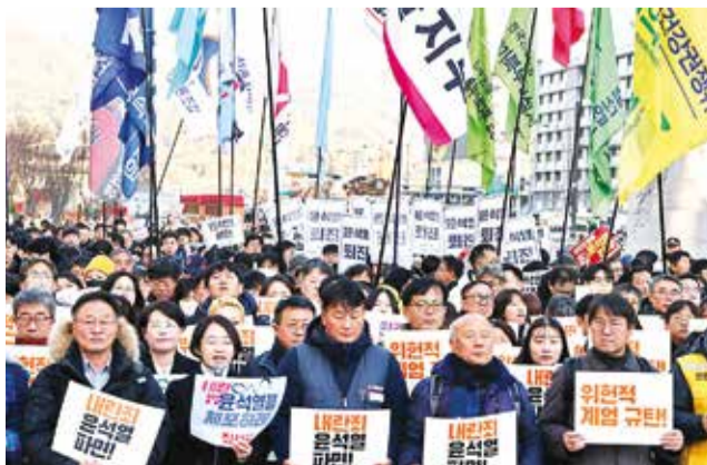
Protesta en Seúl contra el Presidente surcoreano, ayer.

La principal fuerza opositora de Corea del Sur, el Partido Demócrata (PD), y otras cinco formaciones presentaron ayer una moción parlamentaria para la destitución de Yoon, iniciando así el proceso que podría desembocar en la