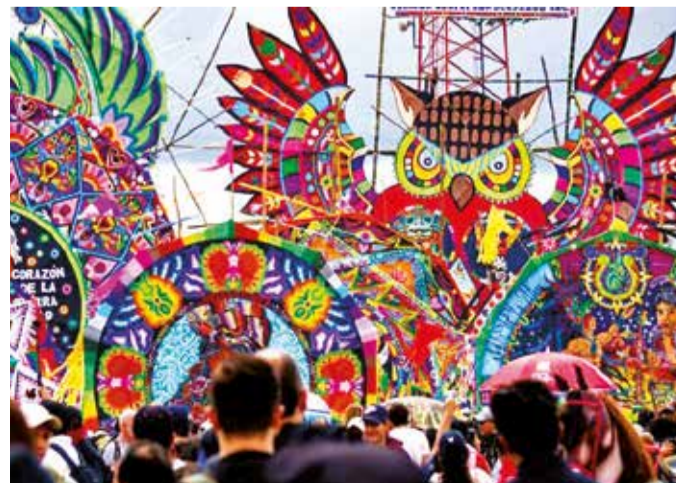
Los Barriletes gigantes de Sumpango durante el Día de Todos los Santos.

de la candidatura, en Santiago Sacatepéquez y Sumpango, niños, mujeres y hombres participan directamente en la elaboración de las cometas, quienes se organizan bajo la figura de “artesanos de cometas” que participan en todas las etapas del proceso, en el diseño, la elaboración y la exhibición.