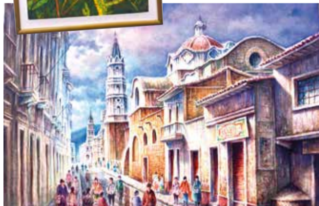
Algunas de las obras que se exhibirán en el salón Melchor Pérez de Holguín. EFRÁIN CHAMBI