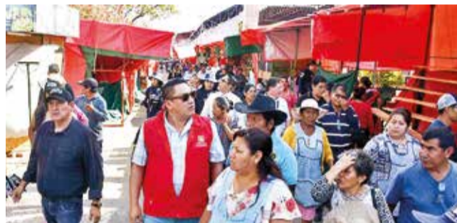
Autoridades municipales inspeccionan la Fexco, ayer.

Varios comerciantes señalaron que los artículos subie-