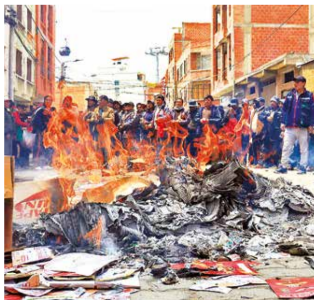
Marcha de choferes en la ciudad de El Alto, ayer.

La industria avícola es fundamental para la seguridad alimentaria del país, pero su desarrollo requiere un equilibrio que fomente una competencia sana entre los actores públicos y privados, evitando riesgos innecesarios para el Estado y el sector.