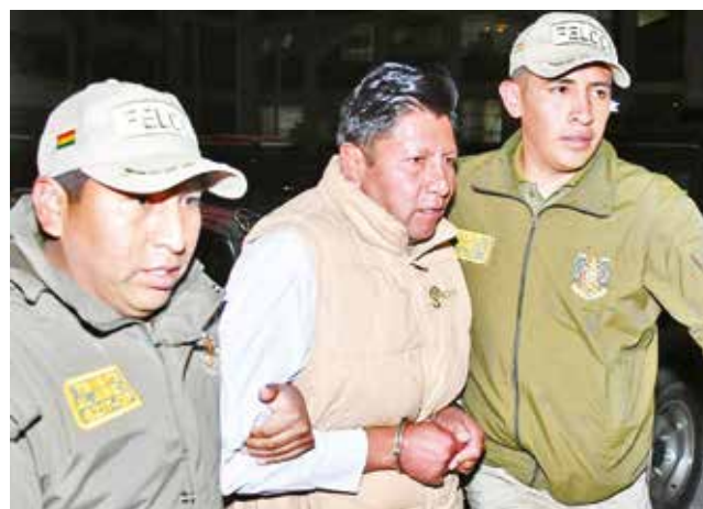
El alcalde de Achocalla, Manuel Condori.

Condori fue citado por la Fiscalía a declarar el 28 de noviembre en calidad de testigo. Tras varias horas de su comparecencia, abandonó esas insta-