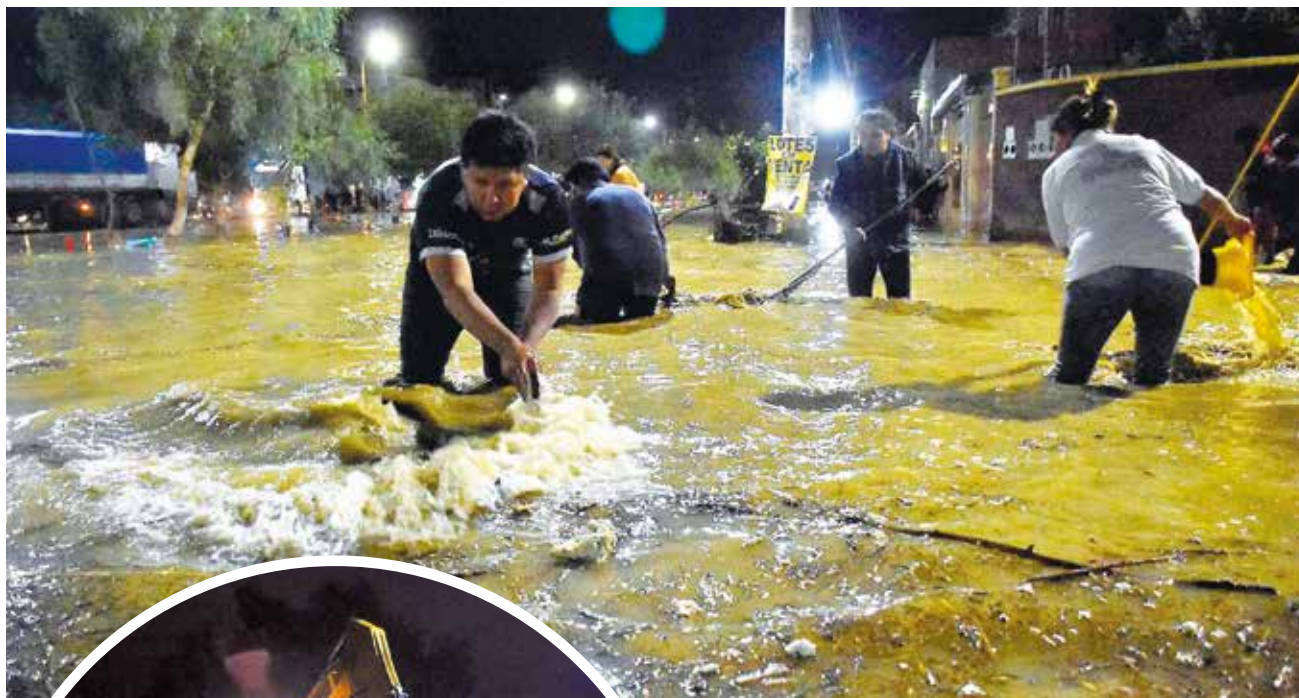
Viviendas y calles inundadas en Colcapirhua.

Datos. La Gobernación enviará vituallas para los damnificados en Avispas. Desde el Senamhi se pronostican lluvias hasta el jueves