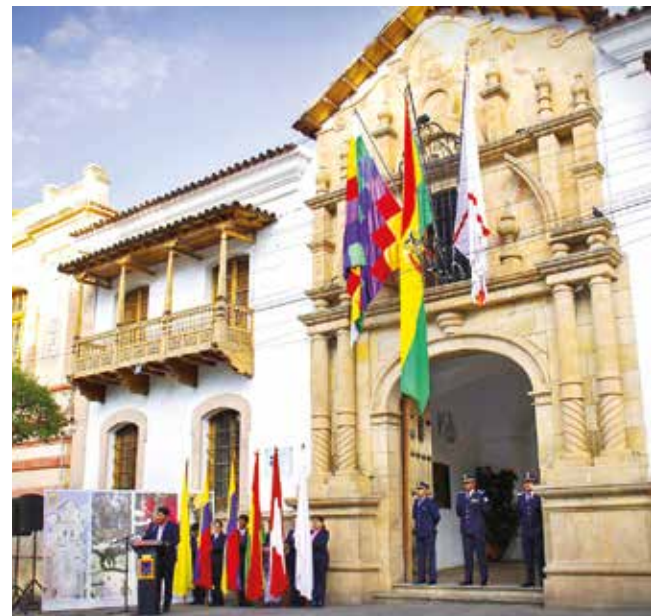
El acto que se celebró en la capital del Estado, ayer.

Asimismo, el gobernador de Chuquisaca, Damián Condori, reafirmó el compromiso de los chuquisaqueños de constituirse en los mejores anfitriones durante los festejos patrios, consolidando a Sucre como la capital del Bicentenario.