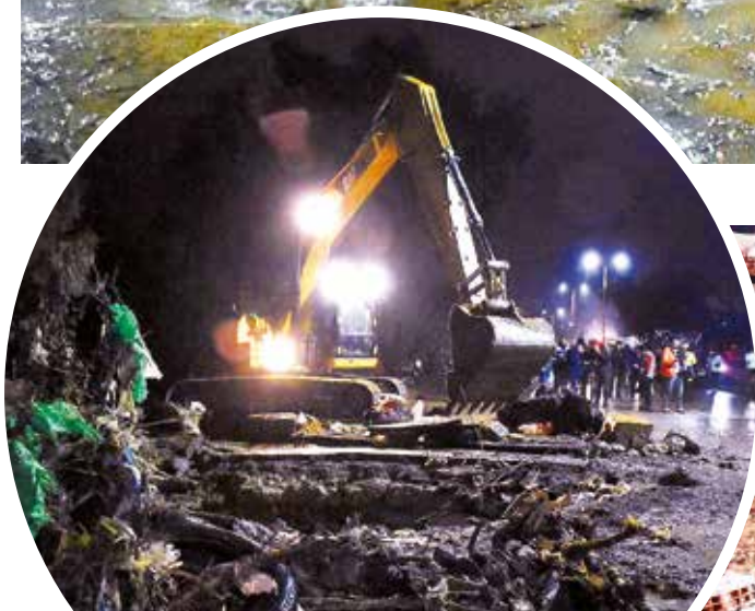
Los daños del desborde del río Chijllawiri.