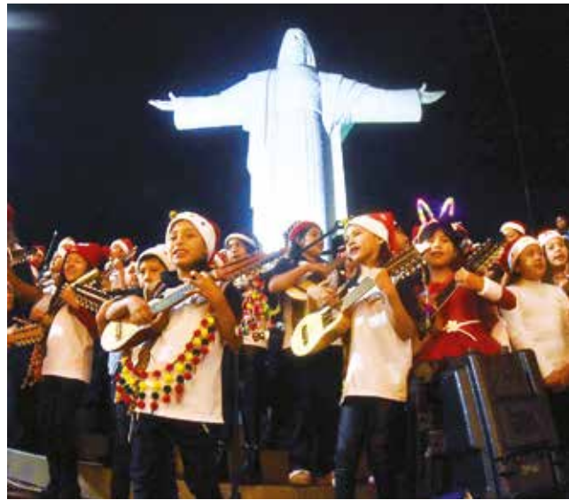
Un grupo de niños ameniza el acto en el Cristo.

El tren sufrió la rotura del vidrio de la cabina donde se encuentra el conductor y daños en la chapería de la parte delantera. No hubo personas heridas, sólo daños materiales. Se prevé que este martes se tenga un informe más detallado del caso.