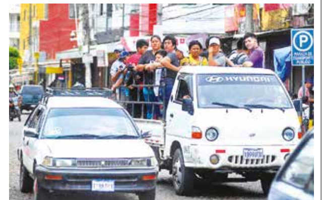
Micreros cruceños cumplen su primer día de paro.

Este conflicto ha puesto en el centro del debate la sostenibilidad del transporte público en la capital cruceña y el equilibrio entre las demandas de los usuarios y los transportistas. La decisión del Concejo Municipal será determinante para el futuro de la movilidad en Santa Cruz.