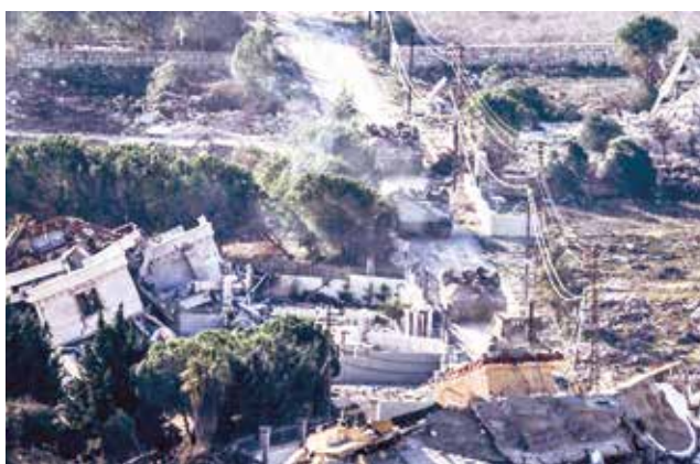
Tropas israelíes se movilizan en el sur del Líbano, ayer.

“Hace poco, la fuerza aérea israelí atacó a terroristas de Hizbulá, decenas de lanzacohetes e infraestructura terrorista en todo Líbano”, dijo el Ejército israelí en un breve comunicado, más de una hora después de anunciar que estaba