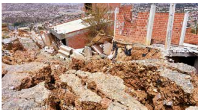
Casas afectadas por deslizamientos en Takoloma.

El alcalde Manfred Reyes Villa dijo ayer que las viviendas fueron edificadas de manera ilegal en estas zonas de riesgo. Sin embargo, se emitirá todos los informes al ni-