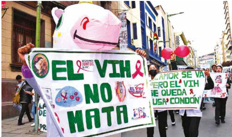
Marcha en La Paz conmemora el Día Mundial del Sida, el 1 de diciembre.

Dicen que es lo más cerca que el mundo ha estado de una vacuna contra el sida, aunque no lo sea. Se trata de una inyección que tuvo una eficacia del 100 por ciento en la prevención de infecciones por VIH en mujeres, y los resultados de un nuevo ensayo publicados la semana pasada muestran que funcionó casi igual de bien en hombres, según la agencia AP. La farmacéutica Gilead anunció que permitirá la venta de versiones baratas de ese medicamento en 120 países pobres con altas tasas de VIH. Todavía no habrá en América Latina.