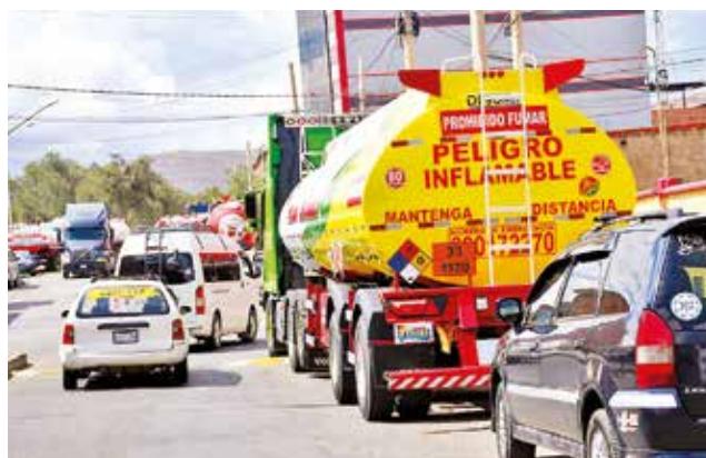
Cisternas transportan combustible importado. C. LÓPEZ

en Bolivia, marcando un cambio significativo en el mercado energético del país. Estas solicitudes se realizan al amparo de los decretos supremos 5218 y 5271, emitidos por el Gobierno para flexibilizar la importación y distribución de hidrocarburos.