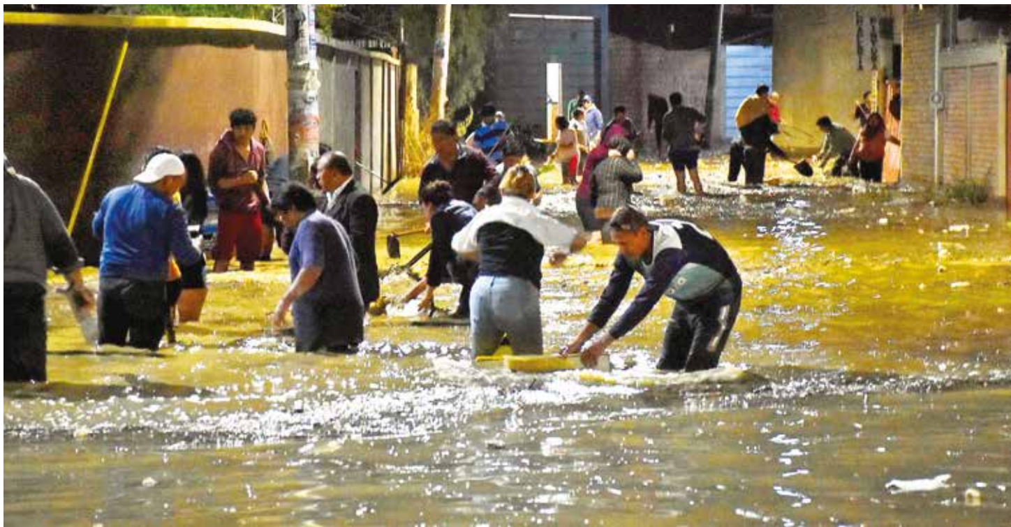
El turbión inundó barrios completos y obligó a los vecinos a meterse al agua para intentar salvar sus pertenencias en Colcapirhua.