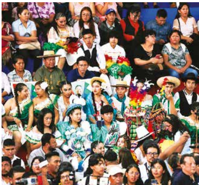
Participantes del Congreso Educativo, la semana pasada.

comisión que trabajó sobre el presupuesto para Educación, la misma que subió del 10 al 33 por ciento.