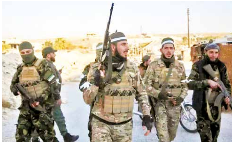
Patrulla de rebeldes en la ciudad de Maarat al-Numan, al norte de Damasco.

En total, según el Observatorio, los cazas sirios y rusos han realizado un total de 420 bombardeos para frenar la ofensiva de los rebeldes, unos ataques que se han concentra-