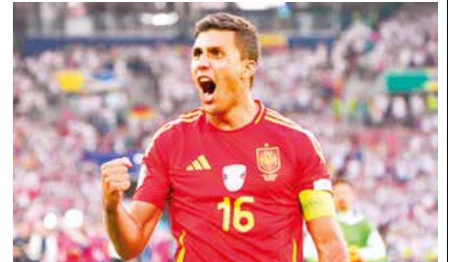
El futbolista español Rodrigo Hernández, con la camiseta de su selección.