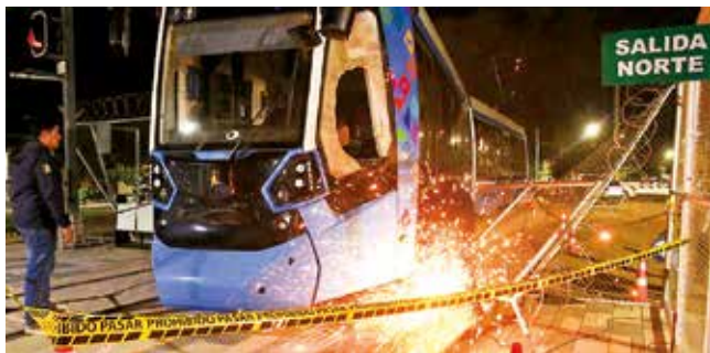
El descarrilamiento del tren en la línea verde.

Servicio. La operadora suspendió el traslado de pasajeros por el incidente y reportó daños en la chapería y el vidrio de la cabina del vagón