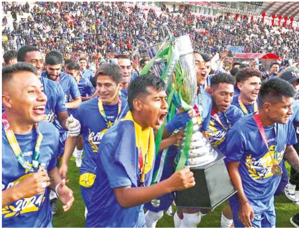
Festejo del equipo de ABB, campeón de la Copa Simón Bolívar 2024.

El principio de fomentar el fútbol entre niños, niñas y adolescentes de la sociedad