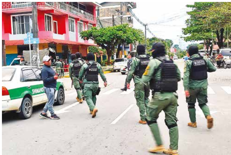
Un grupo de policías en las calles del trópico en 2023.

Dijo que el sector se encuentra preocupado, porque no hay reservas para fin de año, cuando en anteriores gestiones el movimiento era intenso.