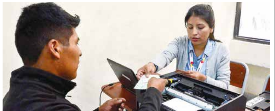
El pago del bono Juancito Pinto al padre de un estudiante beneficiario.

Asimismo, está previsto el desarrollo de un Festival Gastronómico y un concierto Navideño el 11 de diciembre en el teatro Achá.