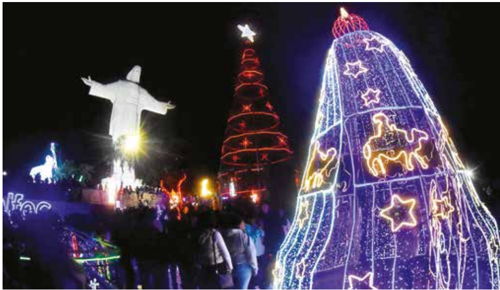
El encendido de luces del árbol de Navidad más grande del país, ayer.