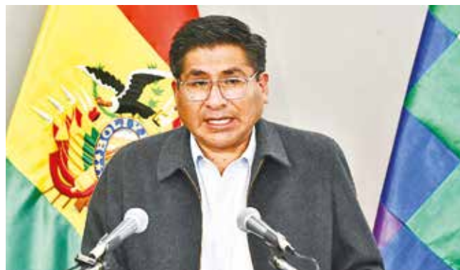
Néstor Huanca, ministro de Desarrollo Productivo, ayer.

Precios. Comerciantes minoristas denuncian que intermediarios entregan el producto en cantidades limitadas y a precios elevados