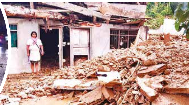
Casas afectadas por el deslizamiento en Villa Tunari. RKC

yor donde se encuentran asentados los sindicatos Buena Vista, San Pedro y Huayru Rumi, que forman parte de la Federación Yungas Chapare.