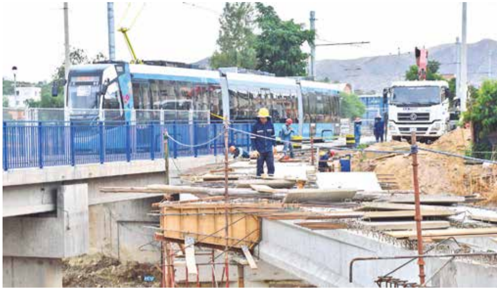
Los viajes en la línea verde del tren se realizan sin trasbordos, ayer.