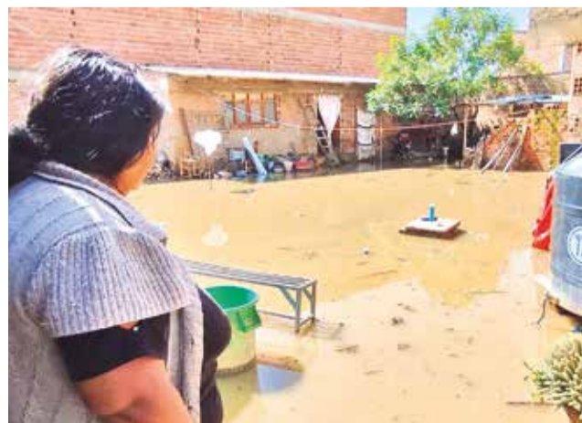
Viviendas inundadas en Cochabamba.