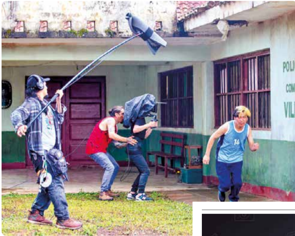
Rodaje de la película "Mano Propia", de Gory Patiño (izq.).

Para los proyectos de producción de largometraje, se destinarán seis millones quinientos sesenta mil bolivianos (6.560.000), es decir, para el rodaje de 14 filmes de ficción y documental de óperas primas,