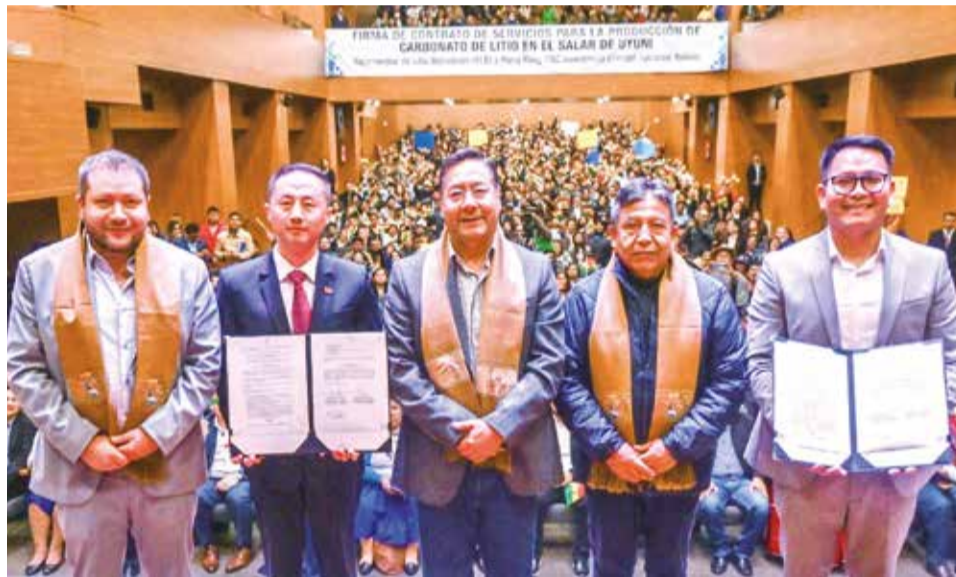
Autoridades bolivianas y el representante de CBC muestran el contrato, ayer.

“Bolivia está negociando con los actores más importantes de la industria del litio”, afirmó Arce y resaltó que