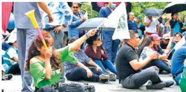
La protesta de los trabajadores de la CPS, ayer. JOSÉ ROCHA

Protesta. Los servicios de emergencia están funcionando con normalidad, pero las consultas externas fueron suspendidas