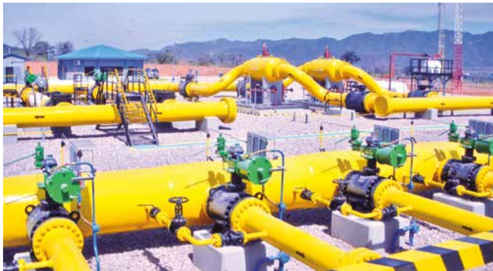
El sistema de gasoductos de Bolivia que transportará el gas argentino a Brasil. MHE

“Este esfuerzo conjunto de las tres empresas representa un paso crucial para dar inicio al suministro de gas natural desde Vaca Muerta y las cuencas argentinas hacia el mercado brasileño, promoviendo la integración energética regional”, destacó YPFB, en un comunicado oficial.