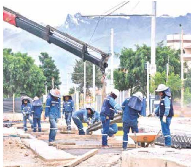
El avance de obras civiles en la línea amarilla.

Experiencia. El trasbordo realizado en un tramo de la ruta al valle bajo sentó las bases para agilizar la coordinación con los conductores del transporte público, a fin de dinamizar el servicio hasta 2025