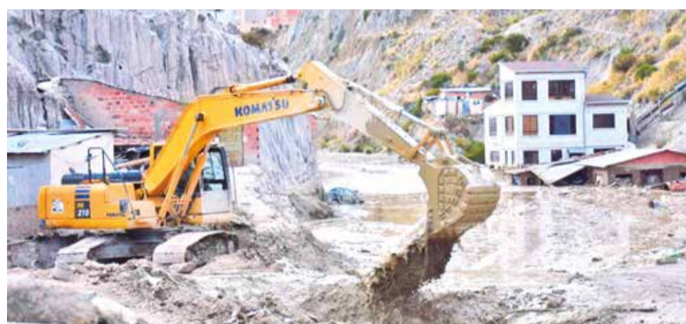
Continúan los trabajos en Bajo Llojeta.

Proceso. La Inmobiliaria Kantutani no tenía permiso ni de la Alcaldía de La Paz ni de la de Achocalla para hacer el movimiento de tierra