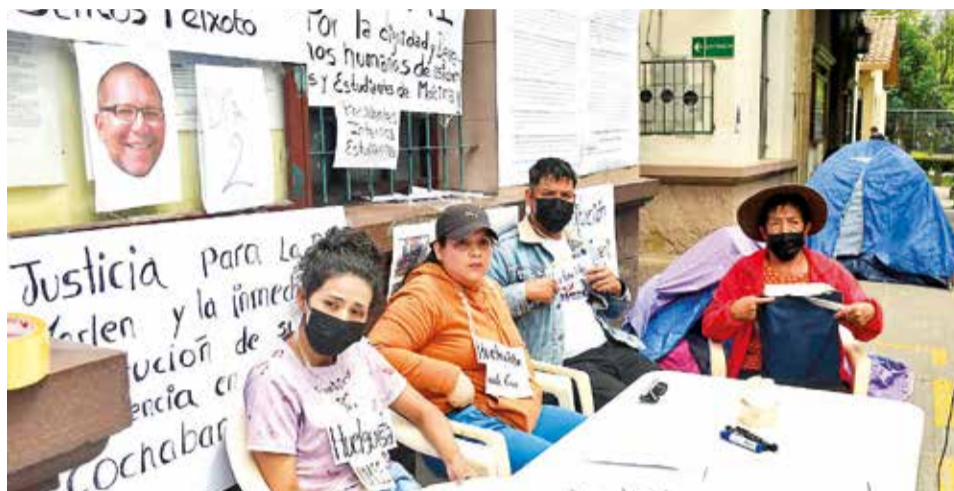
La huelga de residentes en la facultad de Medicina de la UMSS. CARLOS LÓPEZ

Sin embargo, estas disposiciones no se cumplen de acuerdo a varios testimonios de estudiantes, quienes se ven obligados a dormir en sillas o en el piso durante el turno. Tampoco se les permite el uso de baños.