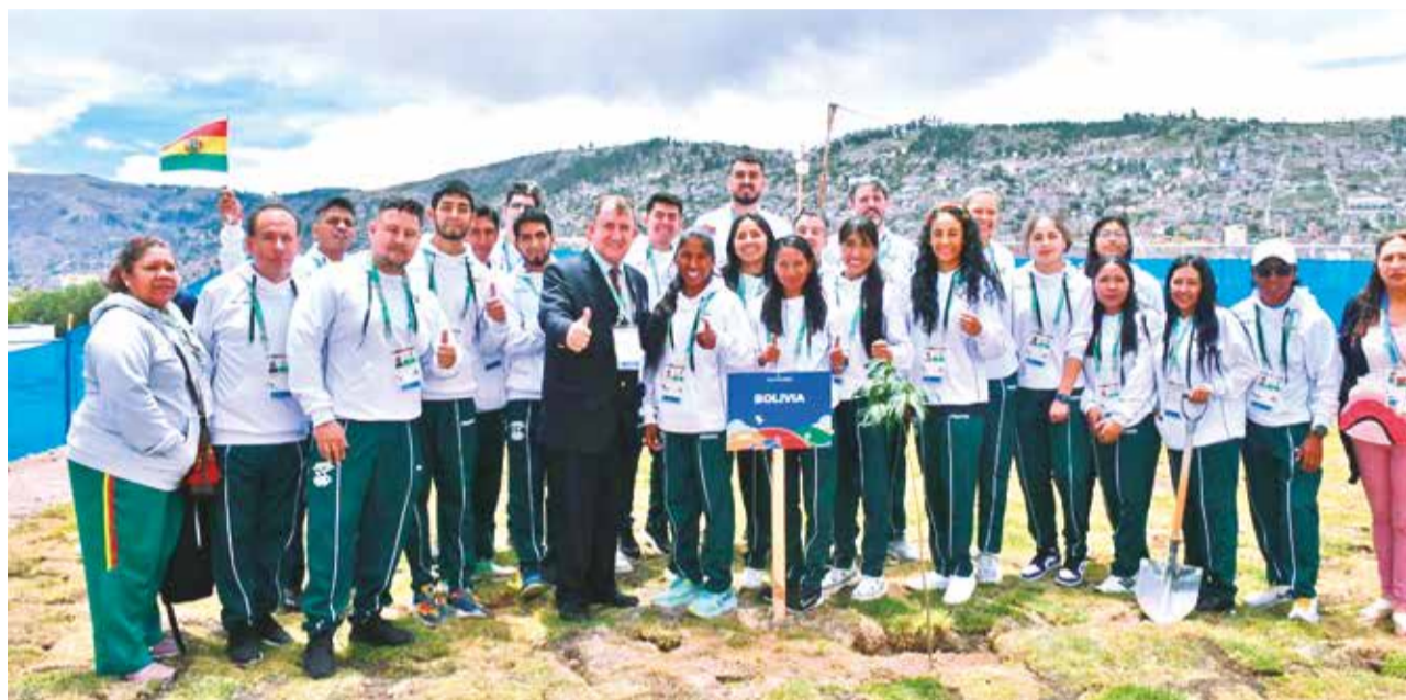
Deportistas nacionales son parte de la iza de la bandera boliviana en la Villa Bolivariana en Ayacucho, ayer. COB

Entre los deportes en los que Bolivia espera buenos re-