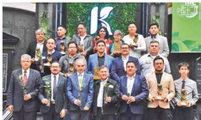
Ceremonia de entrega de los premios Kamay, ayer. J.ROCHA

Potencial. Estos proyectos no sólo demuestran el talento boliviano en innovación, sino que también destacan el potencial económico