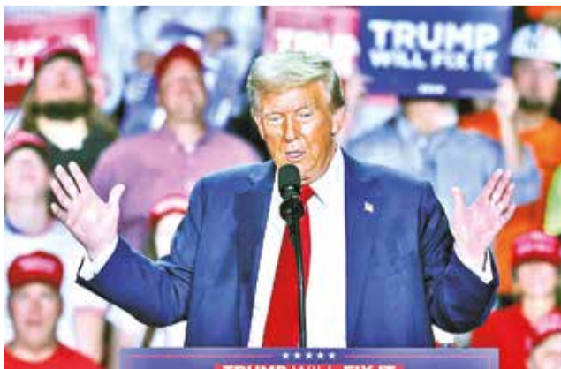
El presidente electo de EEUU, en un mitin, en octubre.

Trump dijo en Truth Social que ha mantenido “muchas conversaciones” con China sobre la ingente cantidad de droga, particularmente fen-