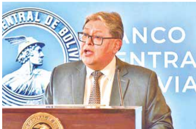
Edwin Rojas, presidente del Banco Central de Bolivia. APG

“Hemos dado continuidad al sistema de pagos hacia el exterior. Prácticamente, hemos cubierto más del 90% de la deuda externa programada”, afirmó Rojas