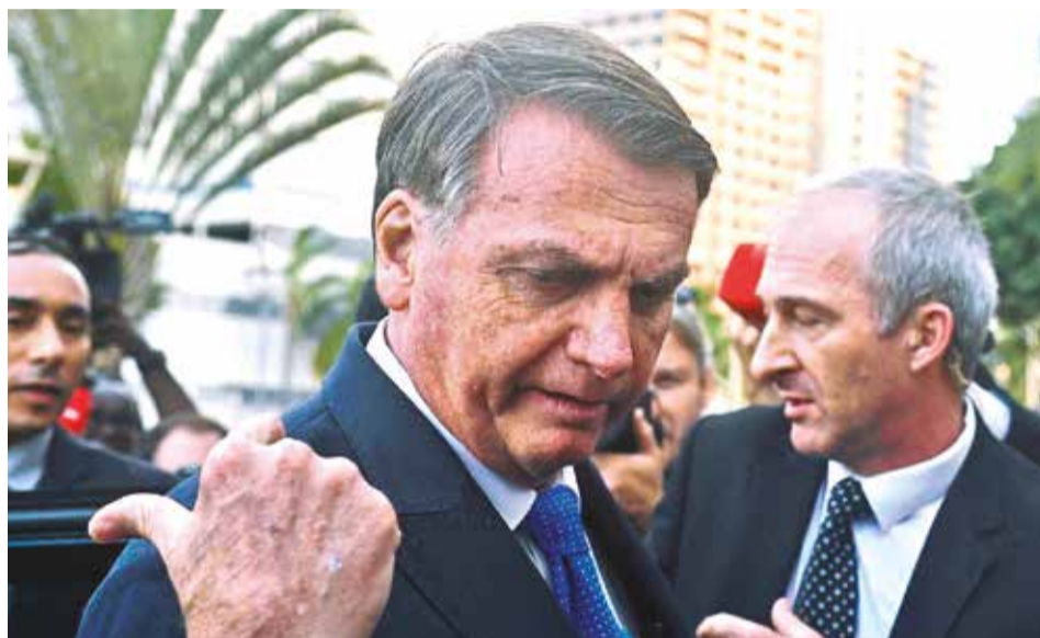
El expresidente brasileño Jair Bolsonaro, en una fotografía de julio de 2023.

Las autoridades brasileñas se basan en “los registros de entrada y salida de visitantes al