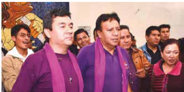
Las nuevas autoridades del rectorado de la UMSS.

Competencia. Nuevas autoridades tienen la facultad de designar a 10 directores, un asesor legal y un secretario general