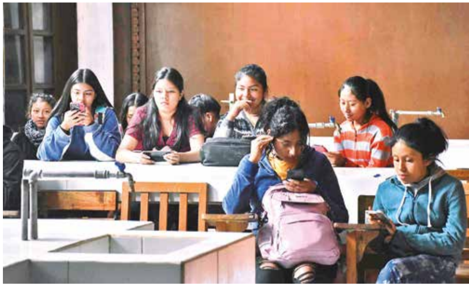
Estudiantes en la Universidad Mayor de San Simón. CARLOS LÓPEZ

Estos estudiantes no son capaces de localizar información explícita en textos ni reflexionar sobre el contenido. Esta limitación afecta su habilidad para desarrollar el pensamiento crítico y relacionar conceptos, lo que es