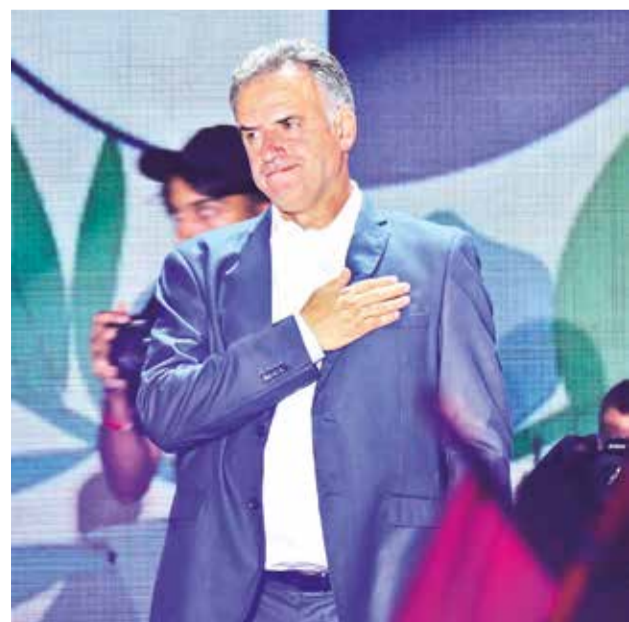
El presidente electo de Uruguay Yamandú Orsi.