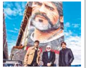
Tributo de Nápoles a Maradona, ayer.