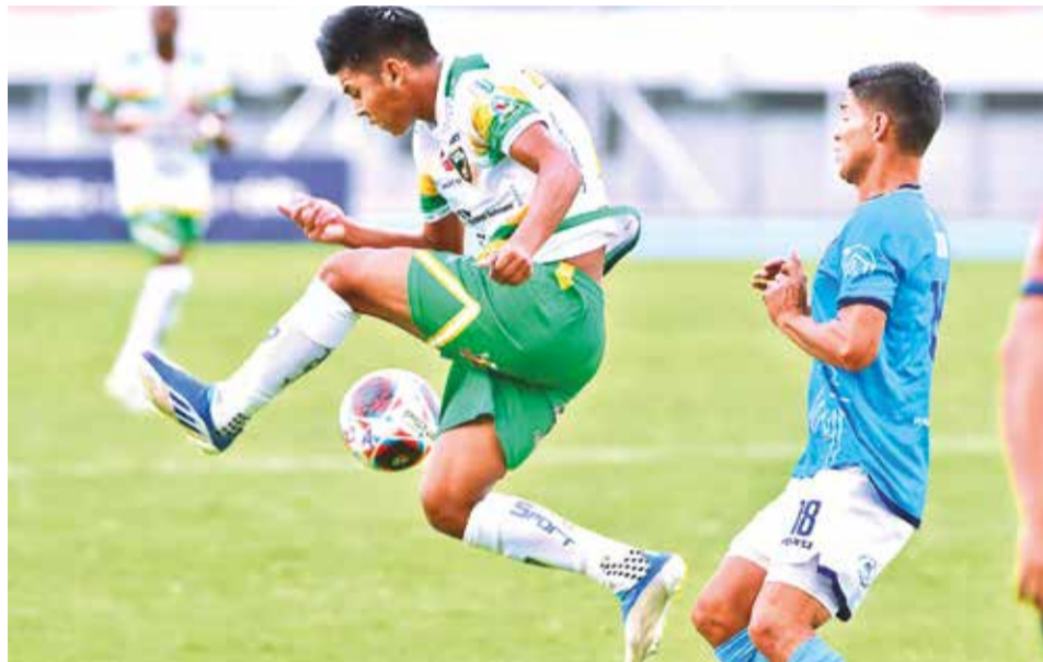
Partido por el ascenso/descenso indirecto 2023, entre San Antonio y Libertad Gran Mamoré, en el que el club trinitario perdió la categoría profesional.