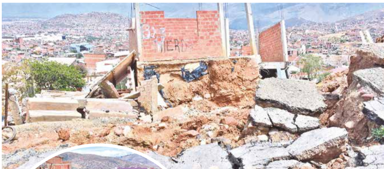
Casas afectadas por los deslizamientos en Takoloma, ayer.

Complicaciones. Los deslizamientos se agudizaron en 2022, varias viviendas están completamente destruidas por la inestabilidad del suelo. La Alcaldía analiza declaratoria de emergencia para tres zonas