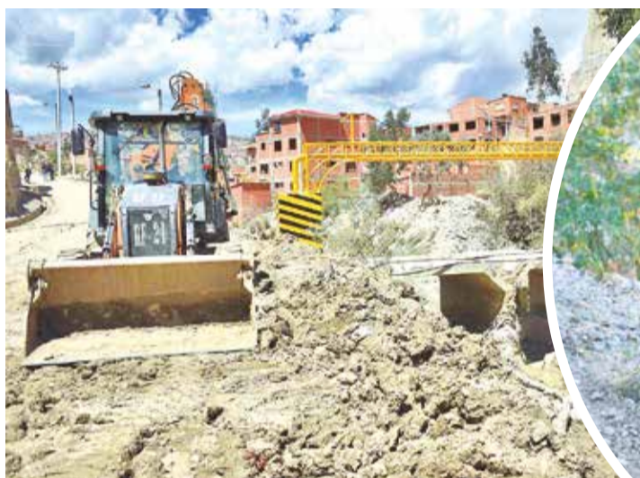
Maquinaria pesada en Bajo Llojeta. APG