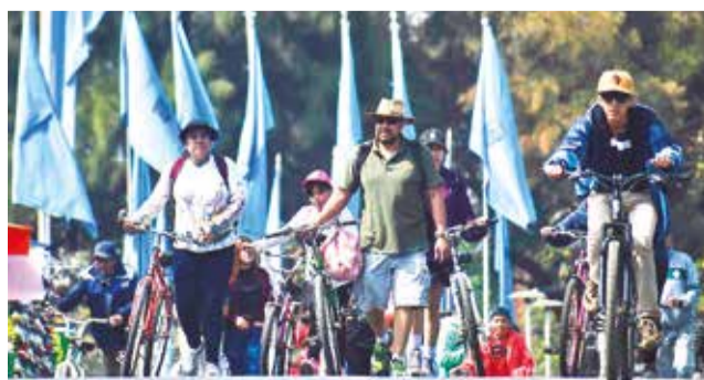
Familias pasean en las calles en un Día del Peatón.

y adjuntar su justificación. Rojas dijo que se prevé entregar 200 permisos de circulación para todo el municipio, sin embargo, se analizará cada caso con el fin de reducir esta cantidad. Aclaró que los vehículos que circulen este domingo, sin el distintivo emitido por la Alcaldía, serán sancionados y llevados a la posta y tendrán que pagar una multa por la infracción.