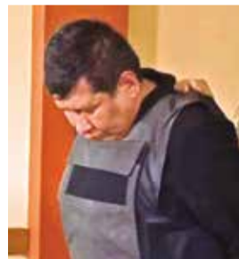
El policía que fue aprehendido. P. FIGUEROA