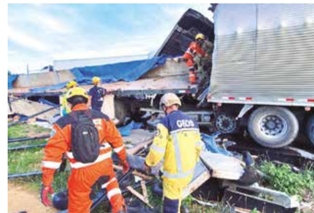
El camión que protagonizó el accidente.