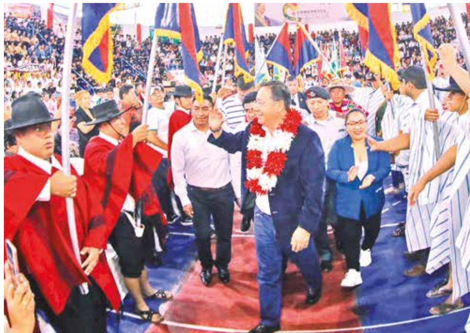
Luis Arce en el Congreso Nacional de Educación, en Tarija, ayer.

Además, criticó la práctica de la aprobación automática en primaria pese al bajo rendimiento, ya que no fomenta la autoexigencia en los estudiantes. Agregó que, pese a todos los cambios y los aportes que se puedan aplicar en la educación, nada resultará si los profesores no son exigentes con los alumnos desde el primer día de clases.