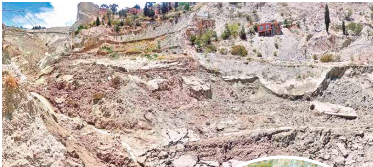
Material acumulado detrás del cementerio Los Andes.