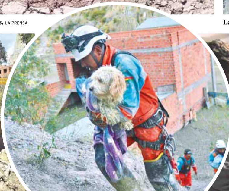
Rescatan una mascota de una vivienda. GAMLP