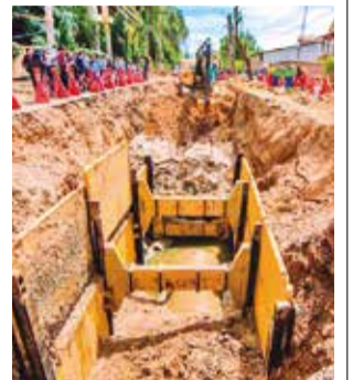
Los trabajos de refacción del emisario ayer. GAMC

Prudencio detalló que la intervención se realiza en 1.164 metros y que con estos