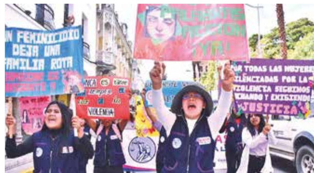
Marcha por el Día de la Eliminación de la Violencia. J. ROCHA

Campañas. Las instituciones y plataformas buscan generar conciencia para evitar más hechos de violencia de género