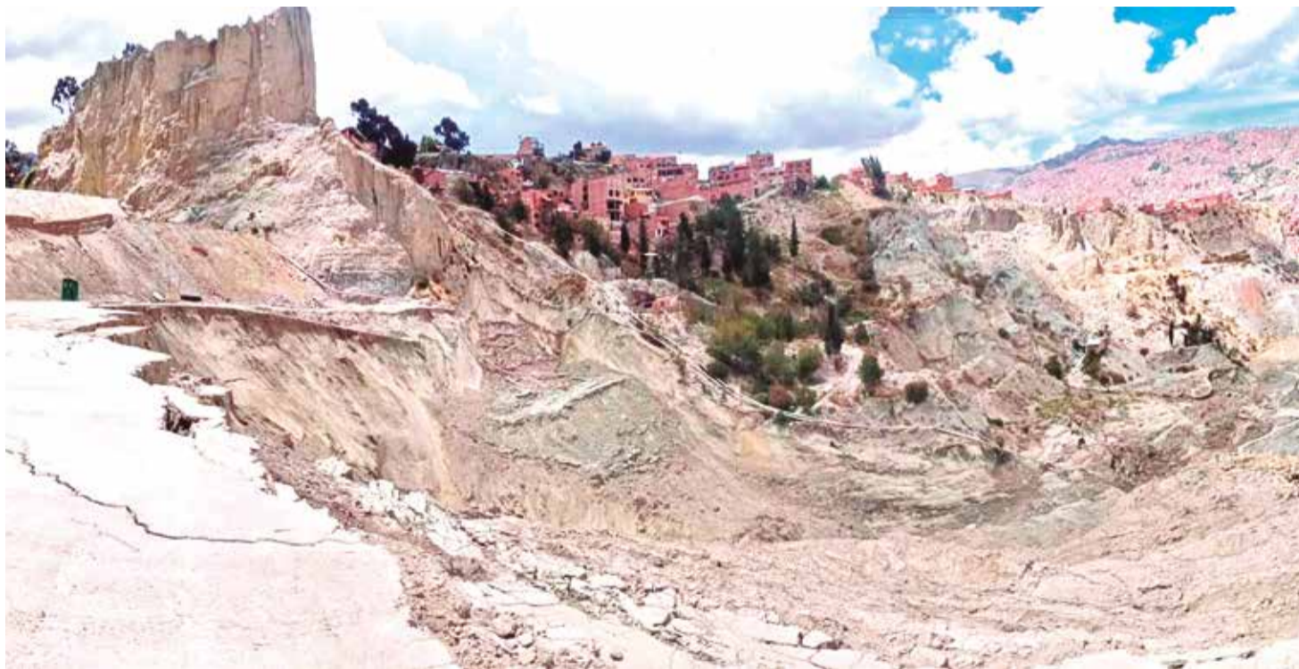
El sitio donde comenzó la mazamorra por el presunto movimiento de tierras y que afectó a Santa Cecilia y otros barrios, el sábado.

Drama. La mazamorra sepultó más de 30 casas y acabó con la vida de la niña Camila. El alcalde paceño pide investigar a fondo e incluir a la empresa del cementerio. Pág. 3