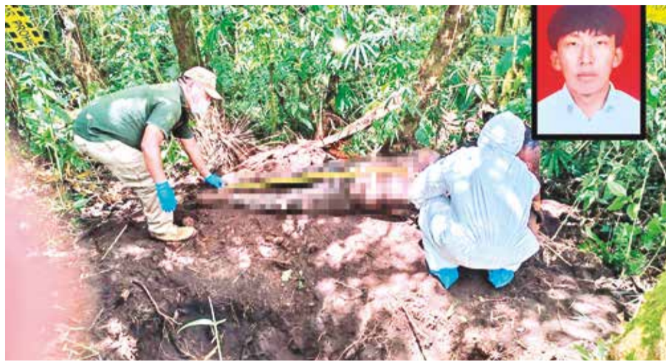
El momento de la exhumación del cadáver que fue arrojado a una fosa.