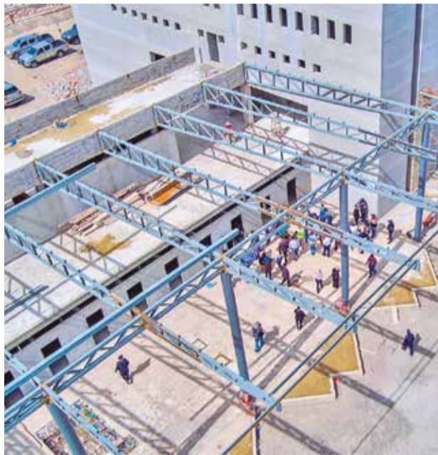
Los trabajos de la obra gruesa de la nueva terminal.