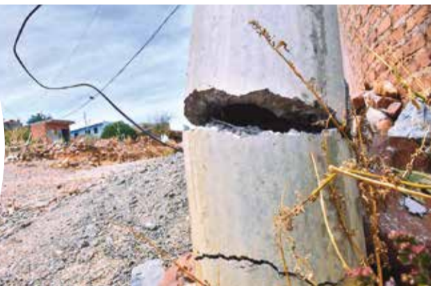
Un poste de luz a punto de colapsar sobre una vivienda.

miento más de lo habitual evacuarán inmediatamente a los vecinos.