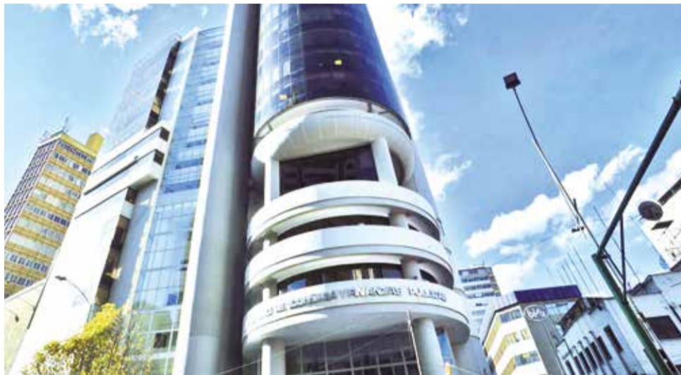
El edificio del Ministerio de Economía y Finanzas Públicas en La Paz. MEVFP

El PGE 2025 destina 4.024 millones de dólares a inversión pública, priorizando sectores estratégicos como hidrocarburos, electricidad y minería, que se destacan por su capacidad de generar excedentes. Asimismo, se prevé un importante flujo de recursos hacia infraestructura vial, mantenimiento de carreteras, comunicaciones,