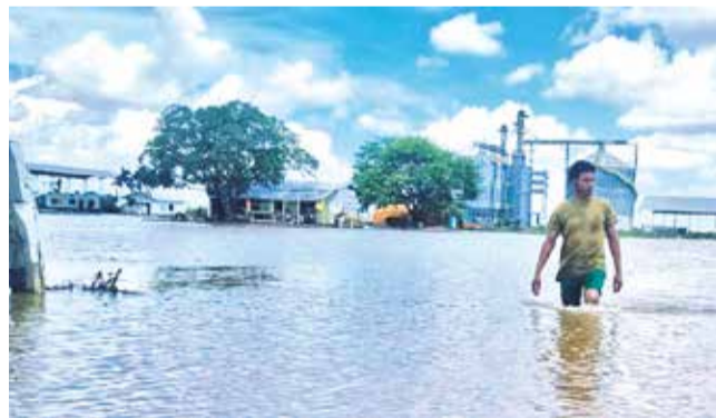
Inundación en San Julián, en Santa Cruz.

Senamhi. Informaron que el periodo de lluvias puede extenderse hasta mayo y alertan de crecida de ríos en los valles