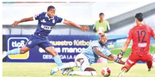
Compromiso jugado entre Aurora y San Antonio, el 30 de julio pasado.

Torneo Clausura. Tres de los cuatro clubes vallunos ingresan en escenario para dar vida a la fecha 23 del campeonato de la DivPro