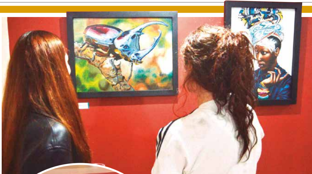
Un par de personas observan los lienzos en la muestra “Encuentros”. HERNÁN ANDÍA

“Esta es la segunda muestra colectiva de alumnos. ‘Encon-