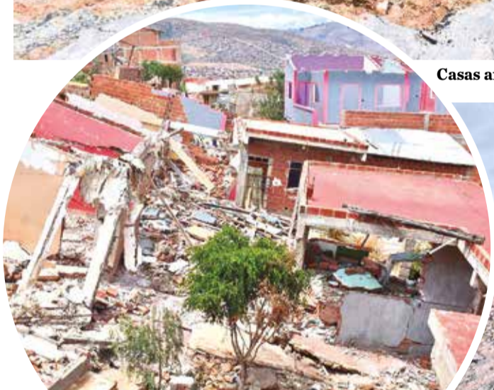
La inestabilidad del suelo se extiende por un barrio. J. ROCHA