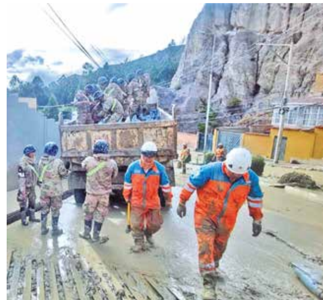
Las tareas de limpieza en Llojeta. FAB