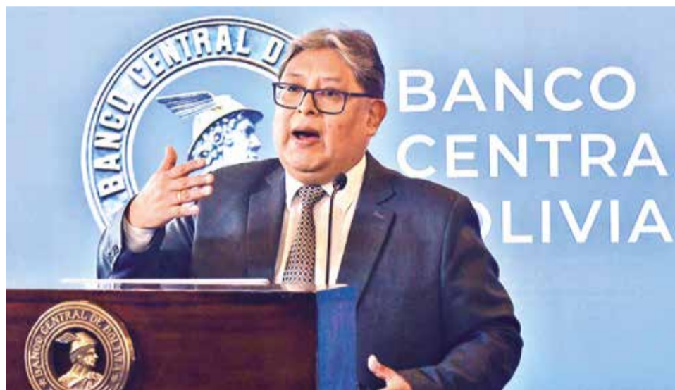
El presidente del Banco Central de Bolivia, Edwin Rojas, en rueda de prensa, ayer.

El mercado boliviano de criptoactivos mostró un notable dinamismo en el último año. Entre julio de 2023 y julio de 2024, el valor de las transacciones creció un 142%, pasando de $us 7,6 millones a $us 18,4 millones. Asimismo, el número de operaciones se duplicó, incrementándose de 155.333 a 432.880.