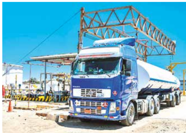
Una cisterna sale de la terminal portuaria de Sica Sica.

Apunte. Ya se han importado 25 millones de litros de diésel bajo el Decreto Supremo 5218, que simplifica los trámites