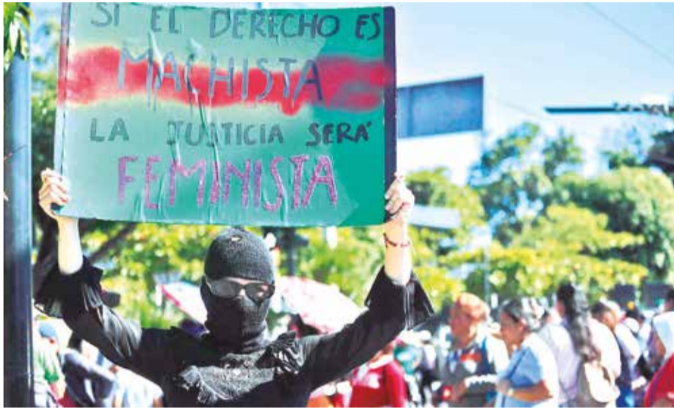
Mujeres protestan contra la violencia machista, ayer en San Salvador.

En cualquier caso, la ONU señala que más allá del ámbito en el que las mujeres son asesinadas por hombres, los motivos son los mismos. "Tienen su origen en normas y estereotipos sociales que consideran a las mujeres subordinadas a los hombres, así como en la discriminación de las mujeres y las niñas, la desigualdad y las relaciones de poder desiguales entre mujeres y hombres en la sociedad", diagnóstica la ONU.