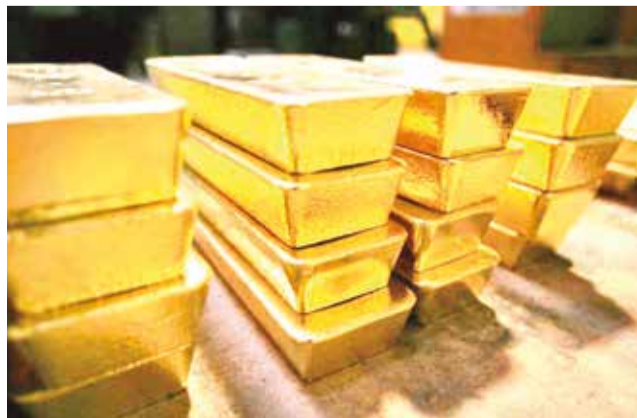
Las reservas de oro del Banco Central de Bolivia. RRSS

El monto representa un incremento significativo frente a los $us 1.709 millones registrados en diciembre de 2023. Sin embargo, al 7 de noviembre, las reservas