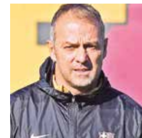
Hans Dieter Flick, DT de Barcelona.