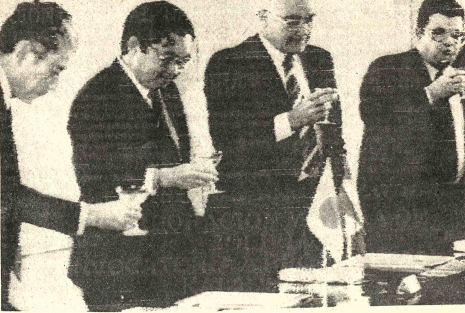
CRÉDITO PARA BRASIL. TOKIO (AP) - Funcionarios brasileños y japoneses durante la firma del documento que otorga un crédito japonés a Brasil por un total de $5 millones de dólares