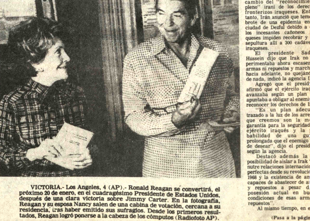
VICTORIA.- Los Angeles, 4 (AP).- Ronald Reagan se convertirá, el próximo 20 de enero, en el cuadragésimo Presidente de Estados Unidos, después de una clara victoria sobre Jimmy Carter. En la fotografía, Reagan y su esposa Nancy salen de una cabina de votación, cercana a su residencia, tras haber emitido sus sufragios. Desde los primeros resultados, Reagan logró ponerse a la cabeza de los cómputos