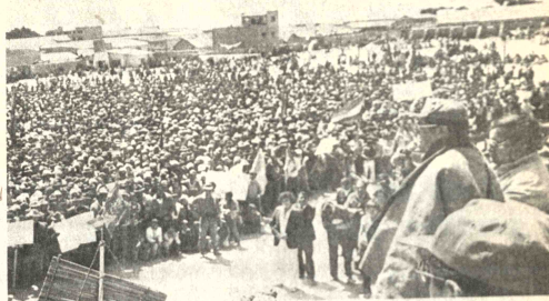
PRESENTE EN ACHACACHI. El presidente de la República, Gral. Luis García Meza, acompañado de la Junta de Comandantes, el Ministro de Asuntos Campesinos y Agropecuarios y los Prefectos y Alcaldes del país que se encuentran reunidos en esta ciudad, asistieron a la concentración de Campesinos de la zona de Achacachi. En la oportunidad, el Presidente dijo que "el Gobierno, sus Fuerzas Armadas, van a hacer que todos ustedes estén agudizados en torno a cooperativas, para lograr un mejor desarrollo agrícola de la zona" (Inf. página central).