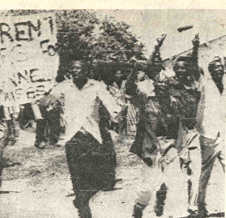
MANIFESTACION. Johannesburgo, 16 (AP). Grupos de manifestantes marchan por las calles de Soweto en protesta, entre otros temas, por el aumento de alquileres.