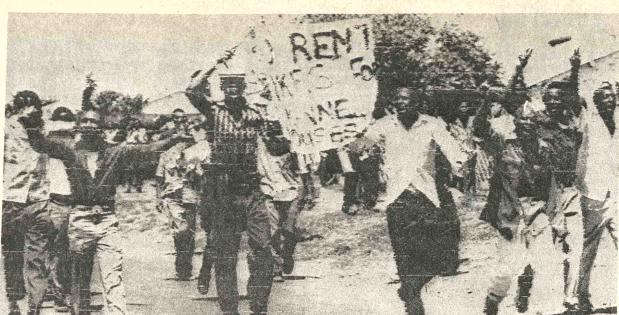
MANIFESTACION. Johannesburgo, 16 (AP). Grupos de manifestantes marchan por las calles de Soweto en protesta, entre otros temas, por el aumento de alquileres.