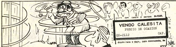
DANIEL EL TRAVIESO