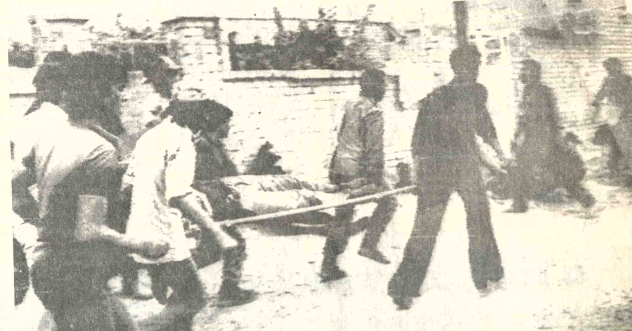
REGATE DE VICTIMAS, Bagdad, Irak, 30 (AP) - Cadrillas de rescate sacan a una víctima del escenario de un ataque aéreo iraní contra Irak...