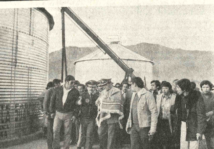
El Presidente Gral. Luis García Meza inauguró la semana pasada una batería de silos para granos, en la localidad de Betanzos, departamento de Potosí. Los silos son parte de un programa de incentivo al cultivo de granos, en las pampas de Lipezuela.

Una misión de alto nivel del Fondo Monetario Internacional (FMI) llegará hoy al país procedente de Washington, para evaluar la situación económica nacional. Según informaciones obtenidas ayer, de fuentes oficiales, la misión, compuesta por nueve delegados, luego de la evaluación efectuará proposiciones, las que posteriormente serán compatibilizadas por el gobierno.