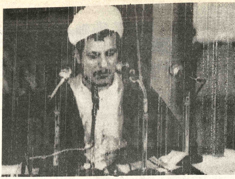
NEUVO PREMIER. Teherán, 8 (AP). El nuevo Primer Ministro de Irán Mohammad Ali Rajai, habla ante el parlamento de su país. Uno de los temas fue el de los rehues estadounidenses.

cumbre podrá no ser una alternativa a las negociaciones, dijeron las fuentes. Begin había dicho que la cumbre no se reunirá hasta diciembre después de las elecciones en los Estados Unidos, añadieron. Linowitz dijo ayer en una conferencia de prensa en Washington que los Estados Unidos han dado a Israel y Egipto un proyecto de propuesta para superar los obstáculos en las negociaciones, garantizando la autonomía a los millones de palestinos en la costa occidental del Jordán y la Faja de Gaza. Agregó que mientras el 80 por ciento de los asuntos ya han sido resueltos durante los 16 meses que llevaron las negociaciones aún quedan por resolver los temas más espinosos, como la cuestión de los asentamientos judíos y los arreglos de seguridad que los acompañarán a la autonomía propuesta.