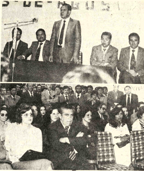
ANIVERSARIO. El Servicio Nacional de Caminos cumplió ayer su 25 aniversario, y el hecho fue recordado en un acto cumplido con la participación de autoridades de gobierno.

Se puede decir que los trabajadores del sector minero de Bolivia, en su totalidad responden al sexo masculino.