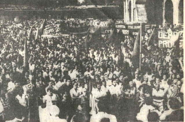
PROTESTA.- Roma 4 (AP).- Una inmensa multitud reunida frente al coliseo de esta capital asiste a un acto de protesta por la explosión ocurrida en la estación ferroviaria de Bolonia que causó la muerte de 76 personas...