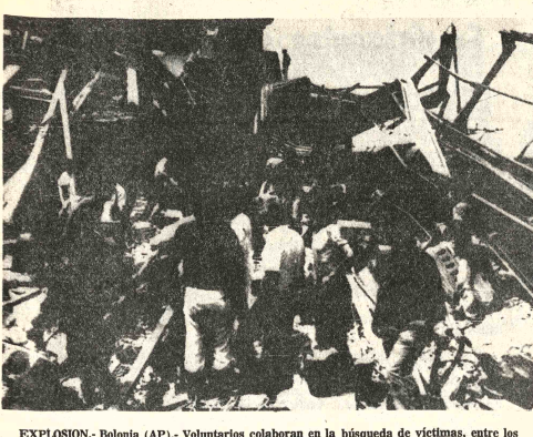
EXPLOSION. Bolonia (AP). - Voluntarios colaboran en la búsqueda de víctimas, entre los escombros de la estación ferroviaria de esta ciudad luego de la explosión de una bomba que causó casi un centenar de muertos y 180 heridos.