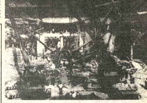
ESCOMBROS. Bolonia (AP). - Grúas y camiones remueven los escombros de un sector de la estación ferroviaria, luego de la explosión ocurrida la semana pasada.