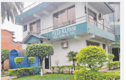
Instalaciones del Comando de Policía en el Trópico / OPINIÓN

Durante este periodo, se registraron enfrentamientos entre las organizaciones sociales que apoyan al expresidente Evo Morales y las fuerzas del orden. Estos incidentes resultaron en decenas de policías heridos, lo que ha llevado a cues-