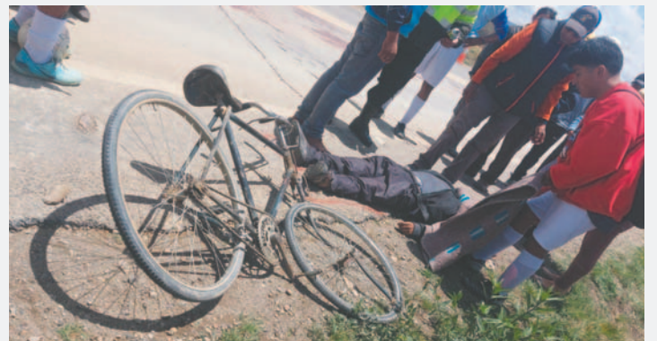
El adulto mayor falleció al momento de chocar el minibus