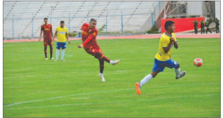
La esperanza de subir a la División Profesional sigue latente