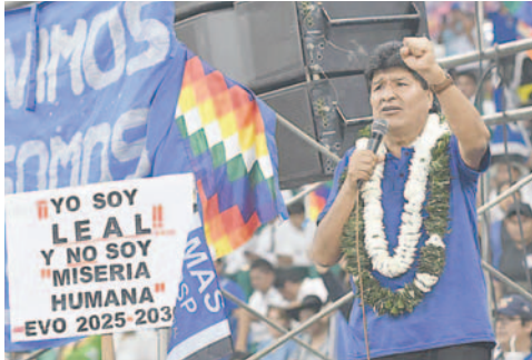
Afines a Evo Morales defienden su candidatura y liderazgo en el MAS

“Ratificamos categóricamente y contundentemente