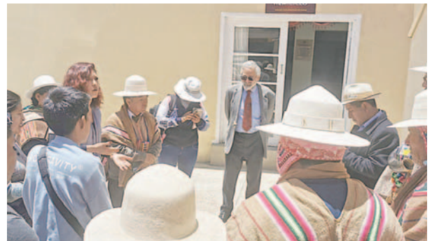
Luego de la audiencia donde se detalló datos de la Atlántida Perdida, los investigadores se reunieron con los pobladores de Pampa Aullagas