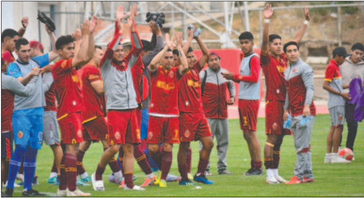
A pesar de la derrota el conjunto orureño aún tiene chances de ascender

En el caso de que la FBF acepte la solicitud de tres clubes cruceños para que no haya descensos, el cuadro orureño subiría automáticamente