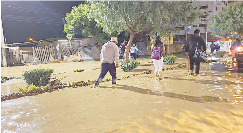
Los desbordes de ríos están generando problemas en diferentes departamentos