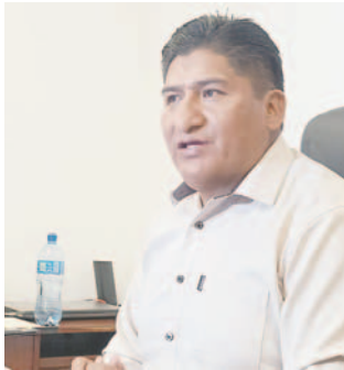
El diputado Flores aseguró que si Morales busca otra sigla para ser candidato sería una traición a su militancia

Flores indicó que sus declaraciones significan ambición de poder y que pensar en otra sigla es