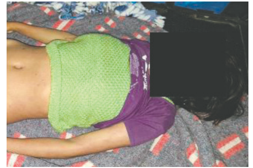
Un médico es investigado por la muerte de una joven tras practicarle un aborto clandestino

La autoridad policial precisó que, posterior a la tragedia, familiares de la víctima aprehendieron de manera particular al galeno y lo entregaron a la