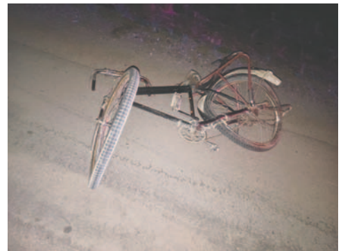
La bicicleta terminó muy dañada tras el accidente / TRÁNSITO

El cadáver fue trasladado a la morgue del Cementerio General y en los trabajos de campo se