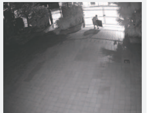
Cámaras captan a uno de los implicados robando un televisor