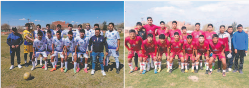
"Chivatos y realistas" se medirán en un partido decisivo por la Sub-19 "A" / LA PATRIA

En caso de que el partido termine sin un ganador, según reglamento, cuando dos equipos igualan en puntos en el primer lugar, no se toma en cuenta el gol diferencia y se programa un partido extra para dirimir al campeón.