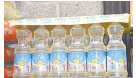
Autoridades realizan controles en mercados