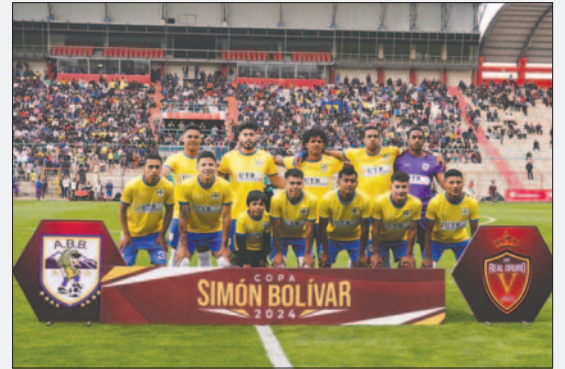
Le fue muy bien a ABB jugado en el estadio Municipal de El Alto