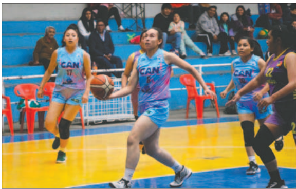
CAN con el objetivo de frenar a las tarijeñas en el coliseo "Gualdaquivir"

trabajo metódico, partido tras partido han logrado una cohesión en todas sus líneas, con una mezcla de juventud y experiencia que las convierte en un rival difícil para cualquier oponente.