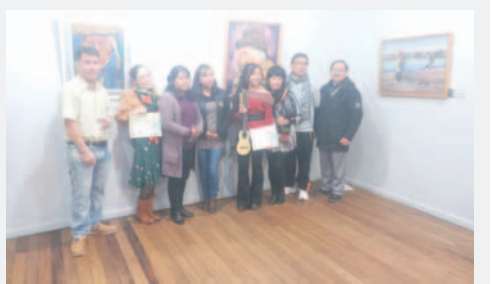
Noche de la inauguración, las artistas posan con sus maestros y otros invitados / CORTESÍA.

El presidente de la Asociación Boliviana de Artistas Plásticos (ABAP)