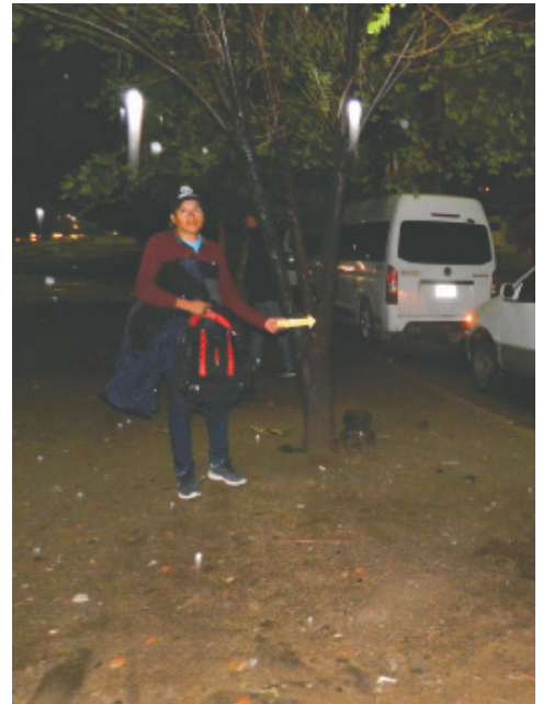
La Felcc investiga el robo millonario perpetrado en la feria autoventa /POLICIA

El coronel descartó el uso de armas de fuego y el inicio de investigaciones por robo agravado; detalló que llevan las pesquisas para identificar el vehículo que utilizaron y aprehender a los antisociales.