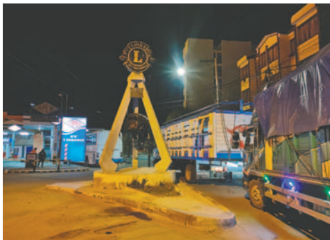
Las filas en surtidores disminuyeron para la gasolina, pero continúan para el diésel

"Particularmente en el tema de la gasolina, hay un nivel de solución no vamos a desconocer eso, pero en el caso de diésel las filas continúan, el Presidente