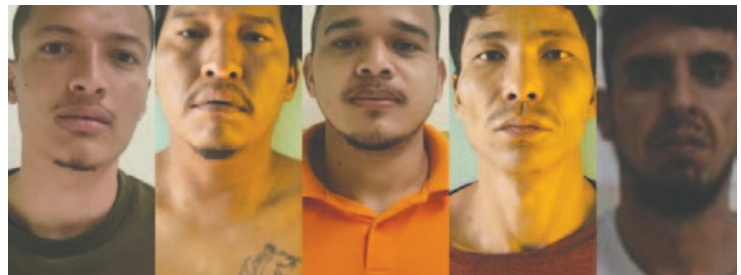
Cinco personas fueron halladas culpables por el asesinato de un efectivo policial / EDUARDO DEL CASTILLO

Meneses, conocido por sus antecedentes de fugas en Brasil y Bolivia, fue trasladado al hospital bajo el pretexto de una atención médica urgente. Allí, sus cómplices organizaron un operativo que incluyó disparos contra los custodios y el uso de motocicletas para la huida.