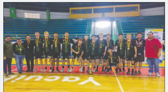
Integrantes de la selección cruceña, ocuparon el primer puesto del torneo