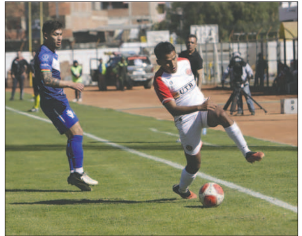
En la ida empataron 1-1 en el estado Municipal de Quillacollo el 07/08/2024

deberán ganar todos los partidos que les restan y esperar otros resultados.