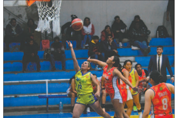
Carl A-Z busca sorprender en La Paz ante su "eterno" rival

Sin embargo, las de CAN tienen la misma aspiración y gracias a un