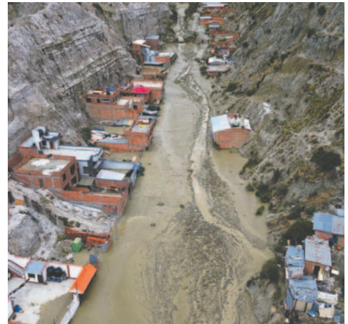
La mazamorra en la zona de Bajo Llojeta, en La Paz, afectó a 40 viviendas y provocó la muerte de una niña de 5 años

La aprehensión de Condori se produjo después de que el alcalde de-