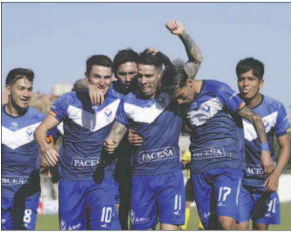
Los jugadores de GV San José ahora van por el triunfo ante FC Universitario

FC Universitario tiene actualmente la posibilidad de jugar la Copa Sudamericana gracias al subcampeonato obtenido en el campeonato Apertura. Los "doctos" cuentan con 44 puntos en la tabla acumulada y, si pretenden mejorar su premio,