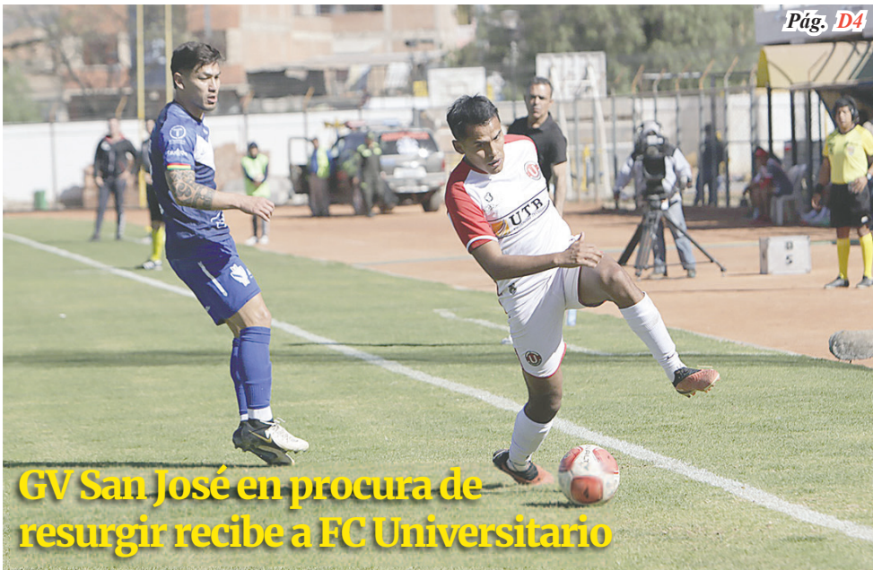
GV San José en procura de resurgir recibe a FC Universitario