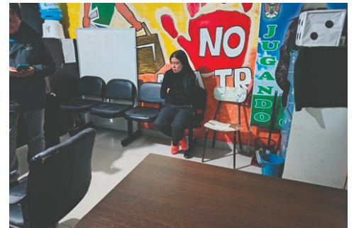
La víctima en instalaciones del “verde olivo”

“Se ha puesto en conocimiento de la Embajada de Colombia, con lo cual se