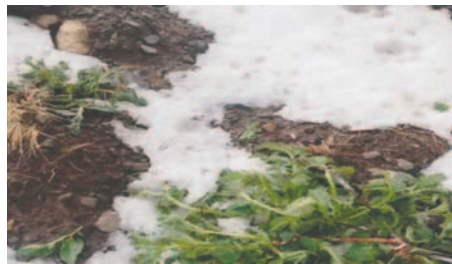
Los cultivos fueron afectados por el granizo casi en su totalidad

La Alcaldía de El Alto reportó llamadas de emergencia ante la caída de fuertes lluvias con granizada el pasado sábado en la zona de Milluni Bajo del Distrito 13. La Dirección de Emergencias de la Alcaldía de El Alto informó de manera preliminar que al menos 20 familias resultaron perjudicadas tras la afectación a cultivos de papa