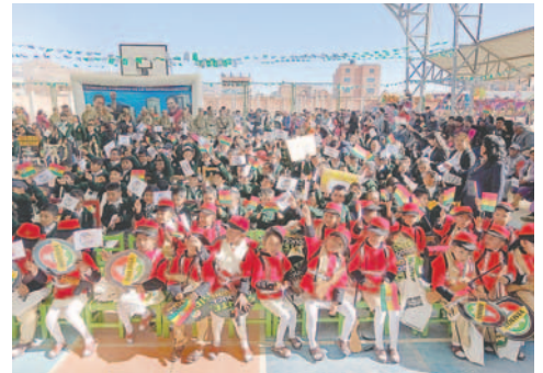
Estudiantes pueden acceder al beneficio hasta el 14 de diciembre

Por otro lado, Cardozo ratificó que este viernes 6 de diciembre concluye el avance curricular del tercer trimestre en las unidades educativas y que a partir del 9 de diciembre están previstos los actos de promoción, además de los