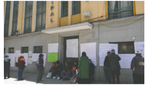
Dueños de locales se movilizaron