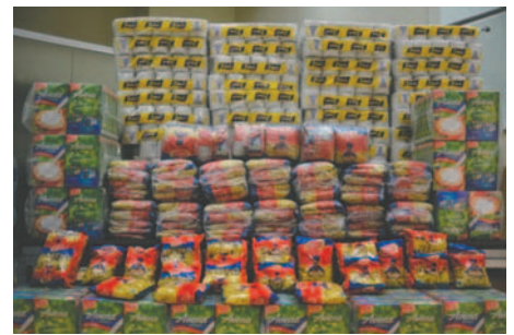
La industria boliviana preocupada por el PGE y la posibilidad de incautación de productos

La CAO ha señalado que las amenazas y restricciones generan mayor inseguridad y desánimo entre los productores. Recordó que con restricciones previas se desaceleró el crecimiento de algunos rubros, obligando a Bolivia a importar grandes cantidades de productos como arroz y maíz. La CAO