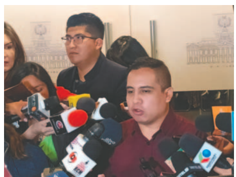
El diputado opositor criticó el PGE presentado por el Gobierno

La situación ha generado preocupación entre los ciudadanos respecto a cómo se destinarán los recursos públicos. Los diputados han manifestado su intención de discutir propuestas y modificaciones al presupuesto presentado. Se prevé que las diferentes bancadas participen activamente en esta discusión para asegurar que se prioricen las necesidades de la población. El diputado Astorga enfatizó que "el irresponsable, el que está yendo en contra de la población en plena crisis económica, es Luis Arce por estos gastos insulsos". También advirtió que "tal como está la oposición, no vamos a aprobar este presupuesto general del Estado", subrayando así la necesidad urgente de revisar y modificar varios aspectos del mismo.