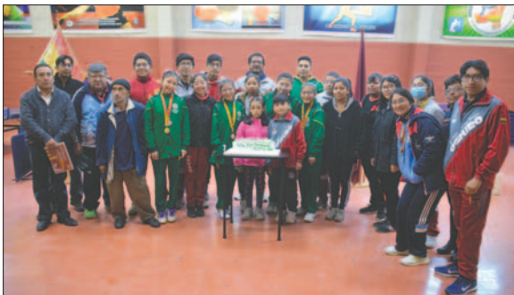
Los tenismesistas orureños tendrán una semana intensa de competencia

A nivel de Oruro, ya se tiene el seleccionado que participará en el torneo nacional. El equipo ha estado practicando de forma intensa para hacer prevalecer el nombre de Oruro y buscar los primeros puestos y ganar medallas.