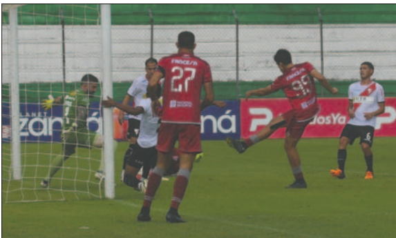
Guabirá tuvo ocasiones para anotar pero sus integrantes no fueron efectivos

El partido que se jugó la tarde del martes en Montero abrió la fecha 25 del torneo Clausura