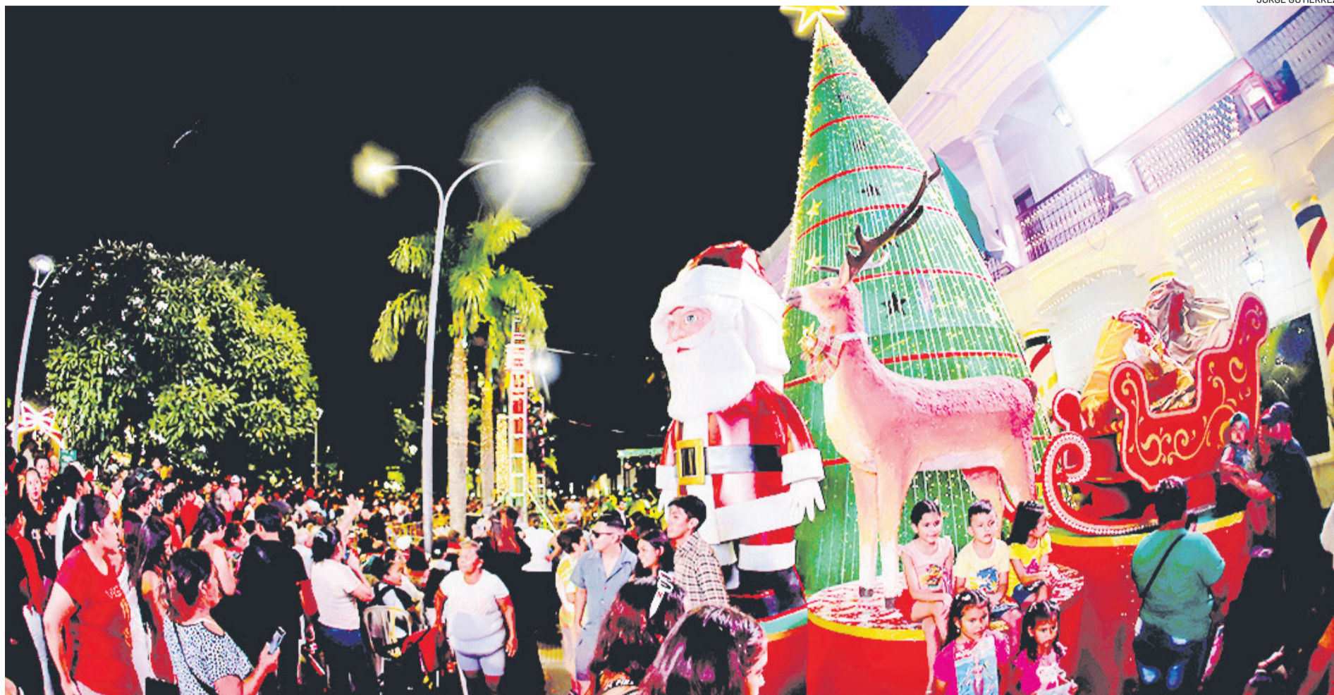
PERSONAJES. Miles de personas llegaron anoche a la plaza 24 de Septiembre para participar del encendido de luces y la inauguración de los arreglos en los que invirtió este año la alcaldía de Santa Cruz.