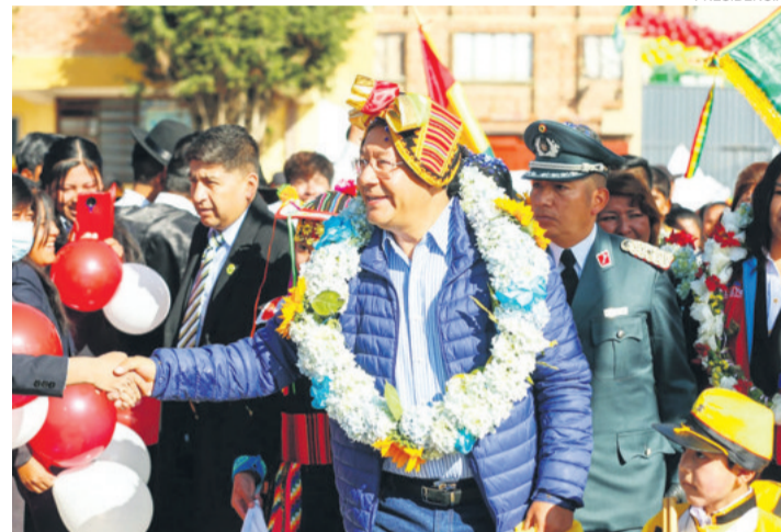
El presidente Luis Arce saluda a la ciudadanía.

El acoso y violencia política contra las mujeres busca silenciarlas y muy pocas hacen la denuncia.