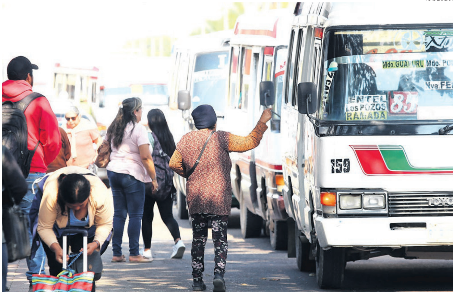
Las autoridades municipales piden a los transportistas someterse al reordenamiento del sistema antes de exigir un ajuste del pasaje

el servicio, la ley es muy clara: se le suspende la autorización para operar en Santa Cruz de la Sierra”, sentenció Fernández que se reunió este domingo con su gabinete para analizar el tema del transporte y la crisis financiera.