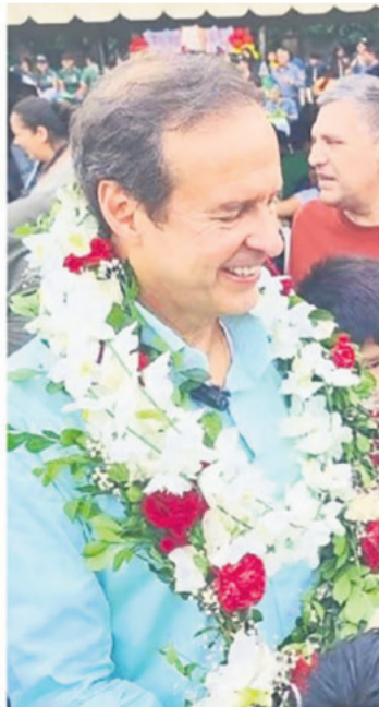
Tres políticos de amplia experiencia: Samuel Doria Medina, Manfred Reyes Villa y Jorge Tuto Quiroga.