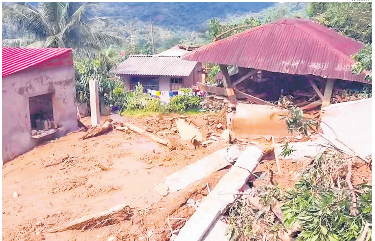
La comunidad de Siete Curvas del municipio de Villa Tunari en el trópico de Cochabamba fue golpeada por la mazamorra ayer en la madrugada

El Viceministerio de Defensa Civil reportó afectaciones en al menos cinco departamentos del país, mientras se esperan nuevas como intensas precipitaciones en territorio nacional a partir del jueves de esta semana. Hubo susto en La Paz y Sucre