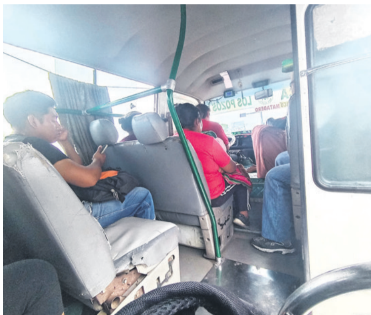
Algunas unidades necesitan mantenimiento urgente

La Alcaldía anuncia controles para sancionar a las líneas infractoras