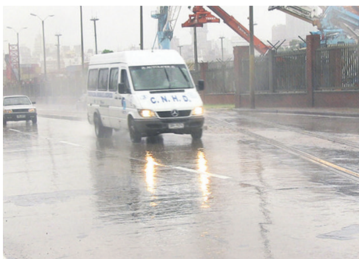
Gran parte del territorio uruguayo sufrió con fuertes tormentas

La alerta de nivel rojo, el de mayor gravedad, registrará desde