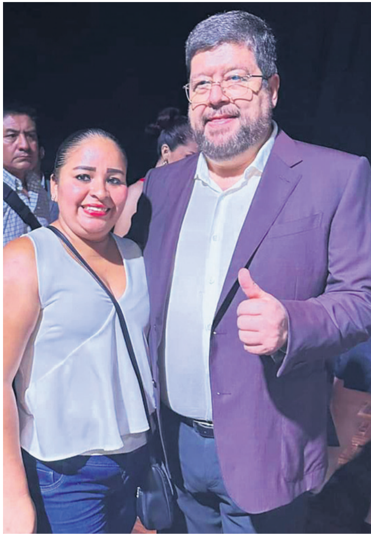
Samuel Doria Medina y Manfred Reyes Villa están en una intensa campaña para promocionarse.