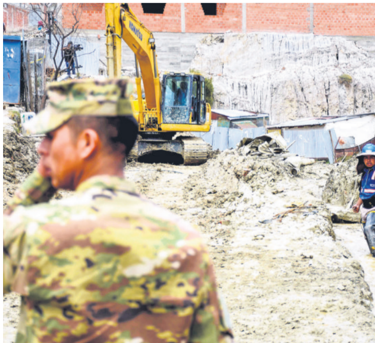
Militares y maquinaria en los trabajos realizados en Bajo Llojeta.

Al menos cuatro regiones del país están afectadas por las intensas lluvias