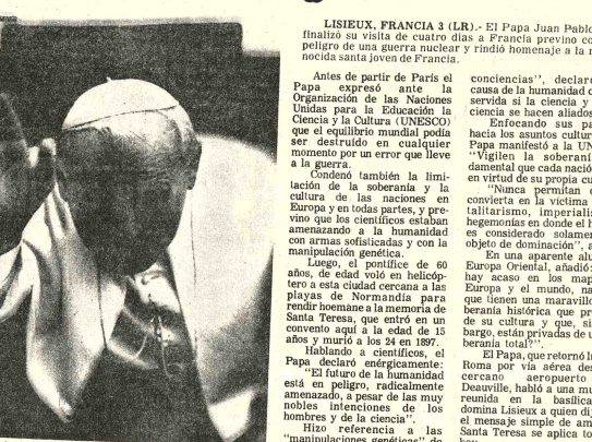
ADIOS A FRANCIA. - Liseux, Francia. (AP). El Papa Juan Pablo II se despide de los franceses después de su visita de cuatro días. La foto fue tomada el lunes (Radiofoto AP).