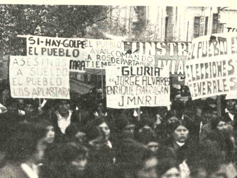
CARTELONES. El cortejo fúnebre fue cerrado por la militancia de la UDP, pensando a las fuerzas contrarias a ese frente político. Ningún incidente, afortunadamente, empañó la solemnidad del acto fúnebre, cuyo duelo fue compartido por toda la población.