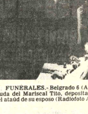
FUNERALES. Belgrado 6 (AP) - Jovanka Broz viuda del Mariscal Tito, deposita una corona al pie del ataúd de su esposo.

El cadáver de Tito, una de las personas más populares de la historia de Yugoslavia, yace expuesto en un capilla ardiente en el edificio del Parlamento Federal.