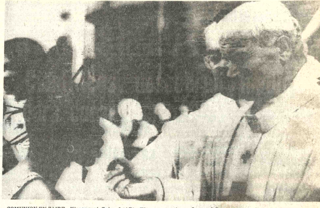
COMUNION EN ZAIRE. Kinsangani, Zaire, 6 (AP) - El papa Juan Pablo II de la comunión a una joven de Zaire. Tras una misa al aire libre ante la catedral de Kinsangani y frente al río,

La Corte Nacional Electoral, mediante Resolución de Sala Plena 09/80, modificó su acuerdo de 20 de abril y dispuso la ampliación de plazo para la inscripción de nuevos ciudadanos, hasta el 30 del presente mes. Tal ampliación, prevista inicialmente sólo hasta el día 20, fue dispuesta en aplicación del artículo 5.º transitorio de la Ley Electoral, que autoriza la apertura de nuevos registros para aquellos ciudadanos habilitados constitucionalmente. Esta decisión fue tomada luego de que las Cortes Departamentales, en la reunión que fue clausurada ayer, expresaron las dificultades emergentes de un plazo pequeño de diez días para inscribir a los nuevos ciudadanos. En dicha reunión hubo un análisis de los aspectos jurídicos vinculados con las elecciones del 29 de junio próximo y se decidió esperar la promulgación, por el Poder Ejecutivo, de las modificaciones propuestas por la Corte Nacional Electoral, de tres artículos de la Ley sancionados ayer por el Legislativo. Las Cortes Departamentales, por su parte, presentaron en cada uno de los departamentos, para cubrir las necesidades de cada distrito, pero se tropezó con la dificultad de que la Corte Nacional no cuenta con los recursos suficientes para las elecciones, las conductas departamentales. En principio, se acordó destinar un millón de pesos bolivianos a cada Corte, como asignación inicial para cubrir los primeros gastos.