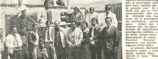
CAMINOS VECINALES.- Con la presencia de autoridades del norte de Potosí, representantes de CORDEPO entregaron dos tractores y dinero para la ejecución de trabajos camineros en esa importante región.

acompañado de personal técnico y equipo pesado, el presidente de CORDECO expresó su satisfacción de iniciar esta obra, hecha en un importante centro productor, y manifestó su propósito de emprender obras de utilidad que puedan beneficiarse en tiempo breve.