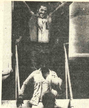
REFUGIADOS.- Base Eglin, Florida, 6 (AP). Un refugiado cubano levanta los brazos al desembarcar con un grupo de 128 compatriotas en esta base donde se alojarán provisionalmente mientras se tramitan sus casos.

El Consejo de Estado, según mandato de su estatuto constitutivo, elaborará una nueva Constitución Política y una nueva ley electoral.