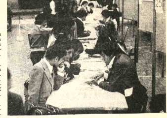
FERIA DEL LIBRO BOLIVIANO. - Con el auspicio del Instituto Americano, en días pasados se realizó en el Círculo Cerrado del citado Instituto una feria del libro boliviano. En la reunión participaron un más de treinta autores nacionales, quienes dialogaron con los estudiantes. Una experiencia que debería repetirse en otros establecimientos del país.