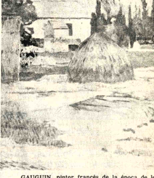
GAUGUIN, pintor francés de la época de los impresionistas, logró obras maestras como la que aparece en la fotografía.

del copamiento comunista de Saigón. 1979. Los británicos eligen al segundo conservador de Margaret Thatcher. NATALICIOS DE LA FECHA: Nicolás Maquiavelo, reformista político italiano (1469-1527). José Mariano de la Riva Agüero y Sánchez Boquete, político peruano (1873-1858). Léopoldo y Planes, jurista, militar y poeta argentino (1785-1861). Golda Meir, estadista israelí (1898-1978). PENSAMIENTO DE HOY: "Con un médico ignorante, pierdes la salud; con un imán incompetente pierdes la fe" (proverbio turco).