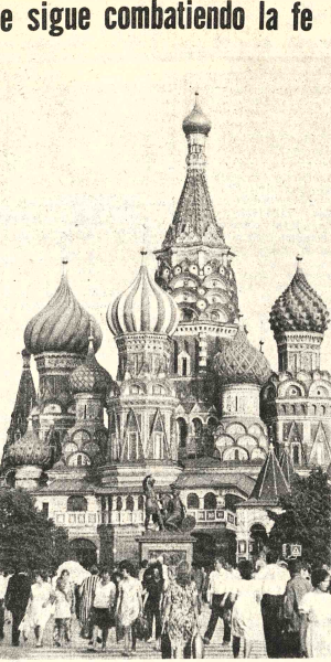
Los doce millones de católicos que viven en la URSS se encuentran en situación muy difícil. En la foto una Iglesia ortodoxa.