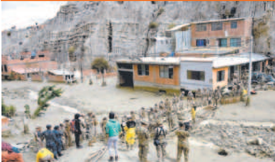
Apoyo a las familias damnificadas por el deslizamiento en Bajo Llojeta.