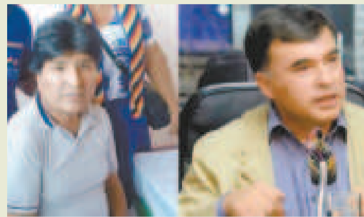
Evo Morales y su exministro Juan Ramón Quintana.