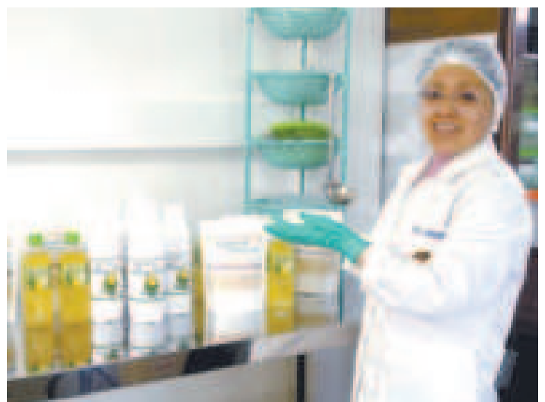
Cada vez más emprendedoras acceden al programa Mujer BDP.

caza, silvicultura y pesca recibieron un menor porcentaje.