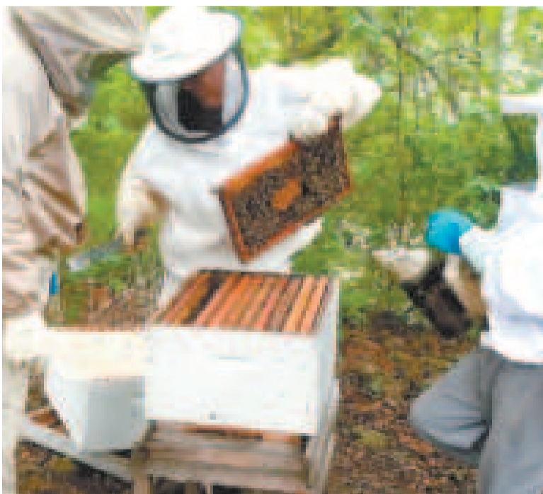
El objetivo es incrementar el volumen de la producción de miel en Chuquisaca.