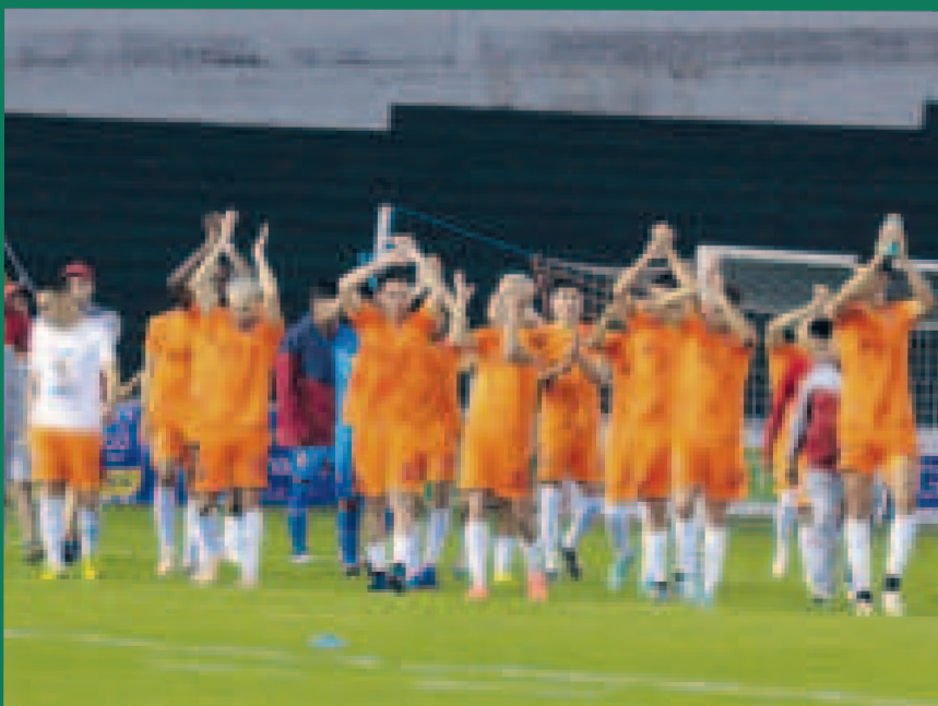
El equipo de Totorá Real Oruro quiere hacer historia y llegar a la División Profesional.

Más atrás, cerrando el top 5, Inglaterra, que vapuleó a Grecia con un 3 a 0 en el Estadio Olímpico de Atenas y que días más tarde hizo lo propio con un 5 a 0 sobre Irlanda en el Estadio de Wembley, y Brasil, que si bien no pudo ganarle a Venezuela en Maturín y a Uruguay en Salvador Bahía (ambos fueron empates 1 a 1), seguirá quinto.