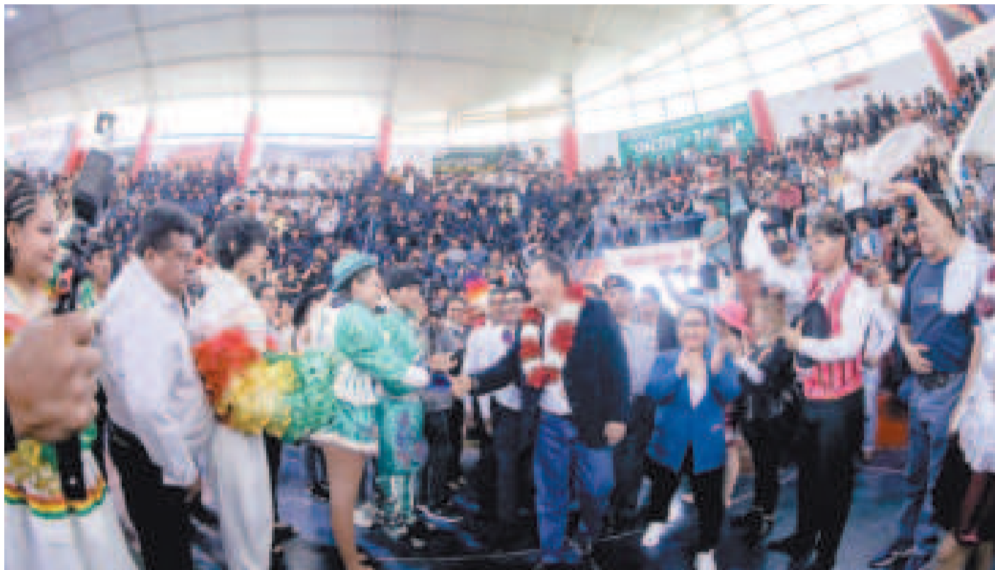
El presidente Luis Arce inauguró el Congreso Plurinacional de Educación en Tarija.