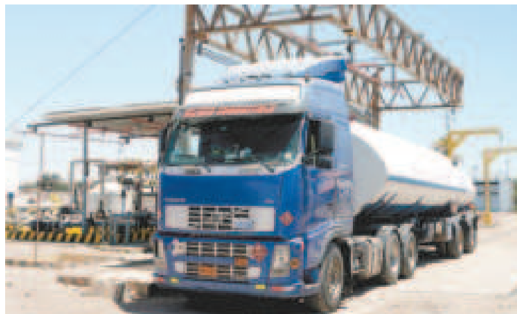
Un camión cisterna que transporta carburantes.

El Decreto 5218 fue promulgado en septiembre de este año, y estableció un marco normativo que permite a sectores privados la importación de combustibles para el consumo propio. La norma también beneficia a productores pequeños y medianos. “Organizaciones sociales, gremios productivos e incluso empresas gestionan sus trámites, y hemos dado toda la orientación necesaria”, añadió.