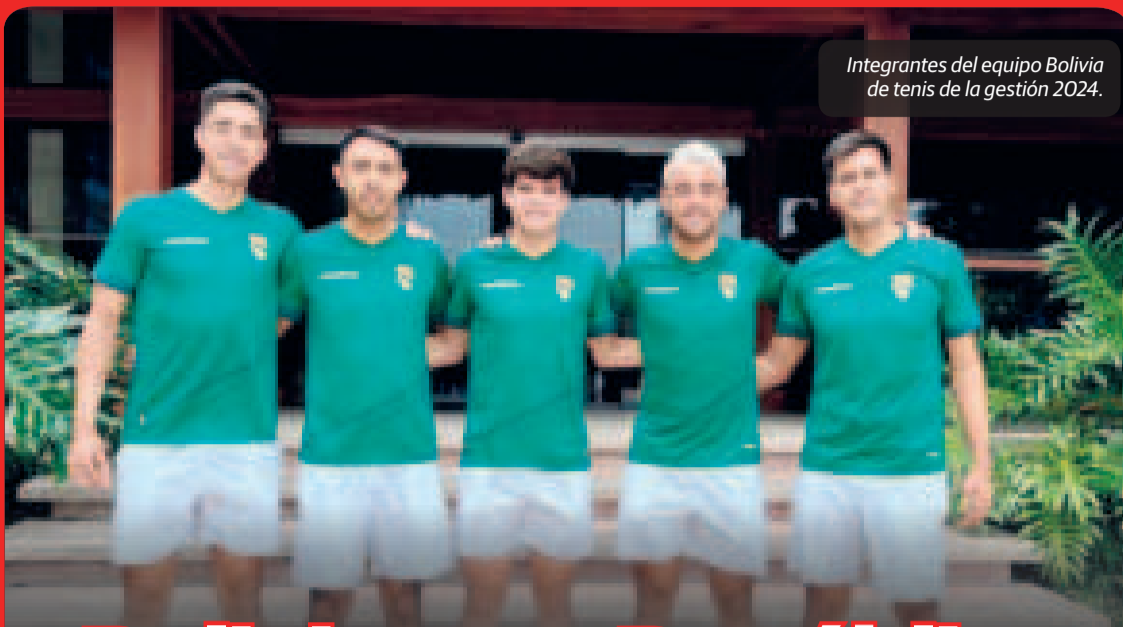
Integrantes del equipo Bolivia de tenis de la gestión 2024.