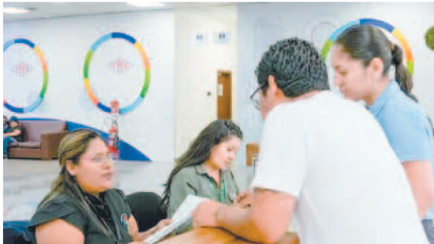
Atención en la ventanilla única para las importaciones de carburantes, en oficinas de YPFB Santa Cruz.

Respecto a ciertos argumentos de que algunos privados “temen” hacer inversiones para la importación y venta de combustibles en el país debido al tiempo de vigencia del decreto,