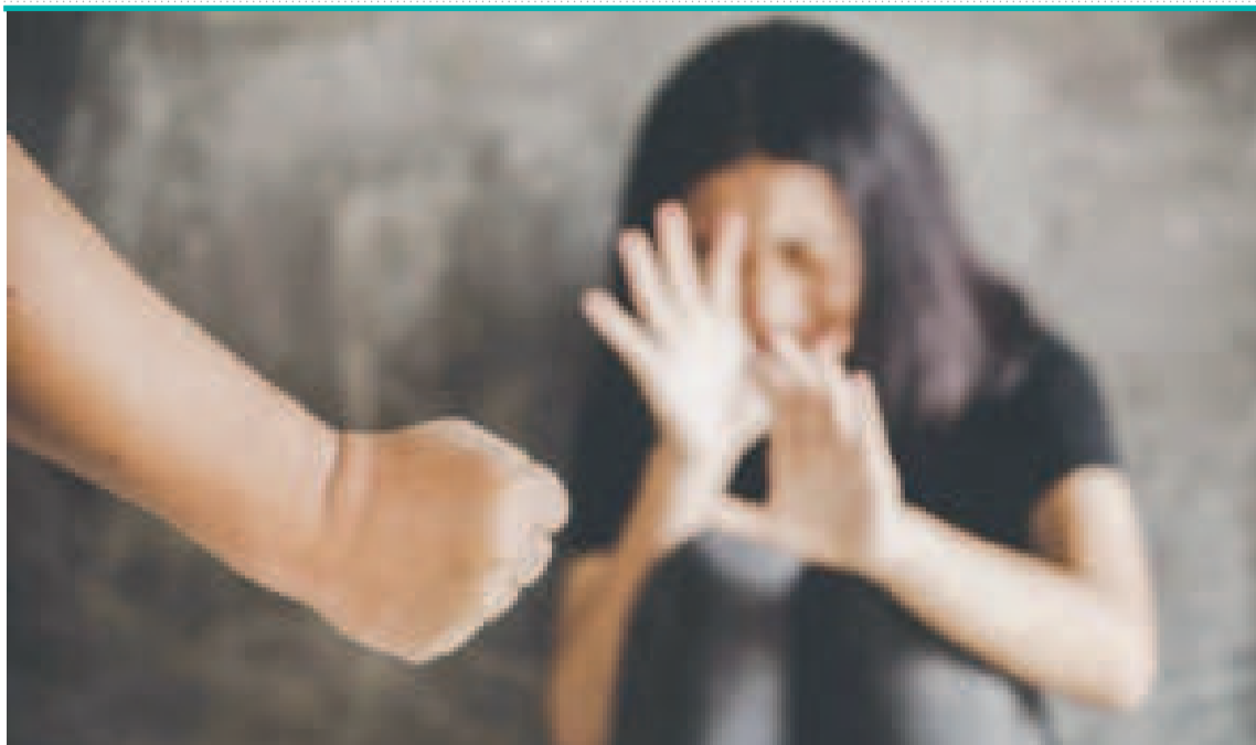
El feminicidio es la principal causa de muerte para las mujeres.