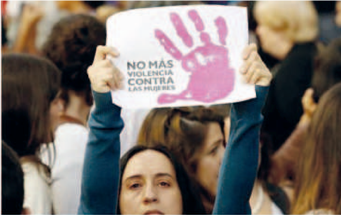
Protesta en La Paz en contra de la violencia contra las mujeres.