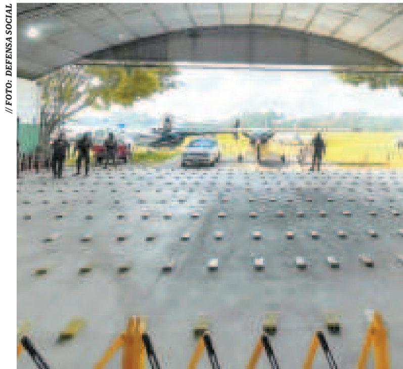
Droga incautada por efectivos de la FELCN.

Además de los esfuerzos bilaterales, Bolivia fortaleció su participación en programas globales liderados por la Oficina de las Naciones Unidas contra la Droga y el Delito (UNODC), por sus siglas en inglés.