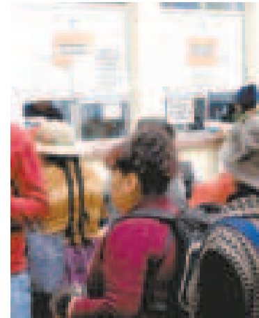
La fila para las excusas.

"El Chapare debe librarse de la dictadura de Morales. Conocemos cómo gente del Chapare ha sido obligada a bloquear, nosotros como alteños nos hemos liberado y pronto deben hacerlo ellos", dijo.