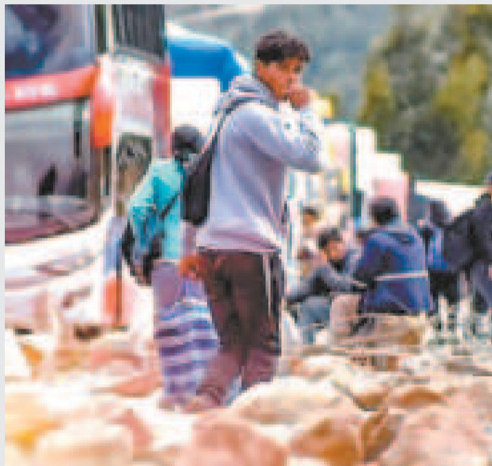
La gente camina en un bloqueo en Cochabamba.

cio de una nueva movilización será un "fracaso" y que solo son los últimos "pataleos de ahogados".