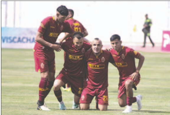
El equipo de CDT Real Oruro va con todo para lograr la clasi- ficación

Otro aspecto que no deja de ser interesante, es que los integrantes de CDT Real Oruro, están motivados, pues en días recientes logra- ron coronarse campeones del tor- neo oficial de la AFO en la catego- ría Primera "A", en realidad con-