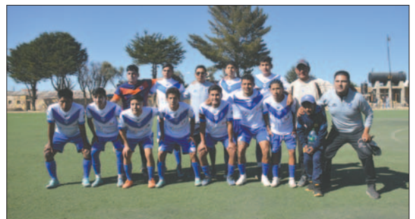
San José batallará hasta el último por subir a la Primera "A"

La definición del campeonato de la Primera "B" se aclarará bastante este domingo cuando se juegue la penúltima fecha del torneo. En el caso de San José, con 21 puntos en su haber, se encuentra estancado en la quinta casilla del torneo, por lo que le urge una victoria ante el conjunto de VHSR Oruro, que con 28 unidades ya es considerado como uno de los elencos que el 2025 estará jugando en