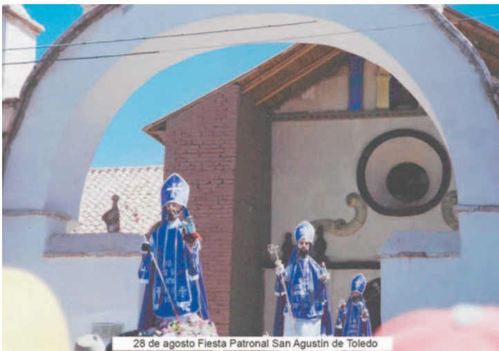
Fiesta patronal de San Agustín