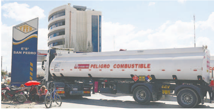
Chóferes federados piden controles de combustible y su calidad

“El problema continúa, filas por todo lado y sobre llovido mojado, porque en nuestro departamento qué ha pasado con la calidad de combustible, hemos