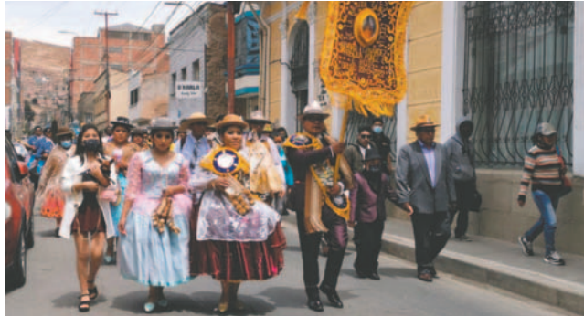
Músicos festejaron su día con varias actividades

Poco antes del mediodía, los músicos de bronce, amenazados por la Banda Espectacular Bolivia, se concentraron en la Playa del Estacionamiento "Abel Ascarrunz", donde realizaron minutos después una retreta de varios temas no sólo nacionales, sino también de piezas latinoamericanas que marcaron