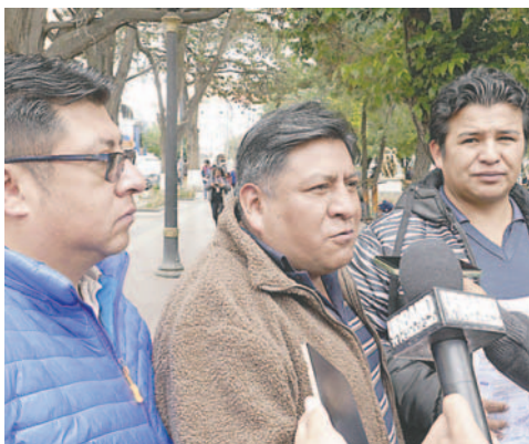
Organizaciones convocan a la marcha de la orureñidad

Asimismo, se tomó en cuenta la falta de gasolina que afecta el desarrollo productivo y al transporte, además de la desaparición