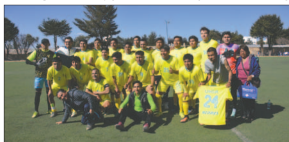
VHSR Oruro quiere sepultar las esperanzas del "santo"

Con todo este panorama adverso, el cuadro de San José quiere concluir el torneo de la mejor manera y conseguir en cancha los puntos necesarios que le permitan soñar con el posible retorno a la división Primera "A". Sin embargo, VHSR Oruro se muestra como un rival de peso que ya logró derrotar al cuadro "santo" en el encuentro de ida, el pasado 15 de septiembre, por la cuenta de 3 goles contra 1, sin duda será un encuentro bastante intenso.