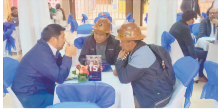
La Fedecomín fue protagonista durante la rueda de negocios de Expoteco

Estos resultados nos complacen y nos comprometemos a seguir trabajando por mejorar la experiencia de todas las empresas que confían en Oruro, detalló