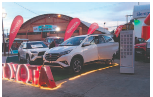
Los autos exhibidos llaman la atención de los visitantes a la feria

“Toyosa siempre trayendo novedades. Ahora presentamos en Expoteco las versiones 2025 de nuestros vehículos. Seguimos con la Hilux, marca reconocida y solicitada a nivel nacional, Raizze, que ha tenido