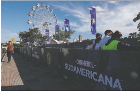
Asunción ya vive la pasión del fútbol con la final de la Copa Sudamericana

El equipo que levante la Copa Sudamericana 2024 recibirá seis millones de dólares como premio y el subcampeón dos millones de dólares. Esta competencia destinó este año 300.000 dólares por partido de primera fase y un premio adicional de 115.000 por juego ganado. En los dieciseisavos de final del torneo se elevó el premio a 500.000 dólares por partido, 600.000 en los octavos de final y 700.000 en los cuartos de final. En semifinales el monto por encuentro fue de 800.000 dólares.