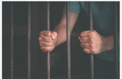
El Implicado aceptó su culpabilidad y solicitó someterse a procedimiento abreviado /REFERENCIAL

Cuando la niña volvió a su casa, relató lo sucedido a su madre, quien acudió a la Policía para denunciarlo. Días después, el agresor fue aprehendido y puesto a disposición del Ministerio Público. Según las investigaciones realizadas, se determinó que la niña habría sido agredida en repetidas ocasiones.