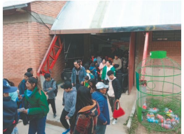
Gran cantidad de gente paseó por los distintos pabellones del campo ferial