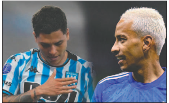
Racing-Cruzeiro ambos van por su primer título en Copa Sudamericana

Hace cinco años, la Copa Sudamericana dejó 28,8 millones de dólares a Paraguay, según estimaciones MF Consulting, citadas por la Confederación Sudamericana de Fútbol