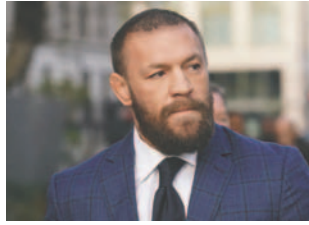
El peleador de artes marciales mixtas Conor McGregor fuera del Tribunal de Dublín

"Es una mentira completa entre muchas mentiras", dijo cuando se le preguntó sobre la acusación de la llave de estrangulamiento. "¿Cómo alguien podría creer que yo, siendo una persona orgullosa, destacaría mis deficiencias?"