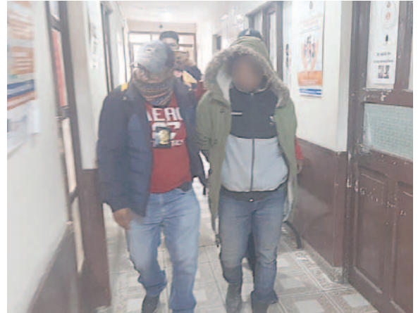
Agentes del DIC de la Felcv custodian al implicado hasta instalaciones del Ministerio Público

Entre los actuados preliminares se descartó otras víctimas, tras la valoración forense y entrevistas psicológicas a otras de sus hijas. “Ya se ha colectado todos los elementos indiciarios que ha