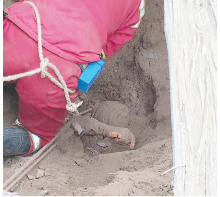
Bomberos coadyuvaron en la búsqueda y rescate del cadáver del “jucu”

Detalló que el cadáver fue hallado a tres metros de profundidad en el Posokoni, tras remoción de tierra y piedra en un sector inestable del cerro. Se presume que Alfredo,