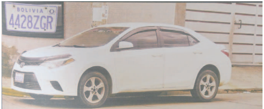
Con el dinero que habían robado, compraron un vehículo que fue secuestrado por las autoridades