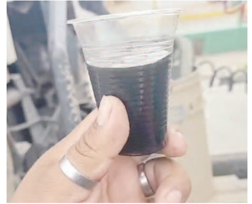
Conductores sacaron diésel de sus vehículos y denunciaron que fue adulterado

cuando en otrora teníamos el combustible por lado chileno, posteriormente una vez que ha asumido Evo Morales ha importado diésel venezolano, entonces como chóferes hemos hecho comparaciones e hicimos funcionar un motor con diésel chileno y otro venezolano, se ha hecho