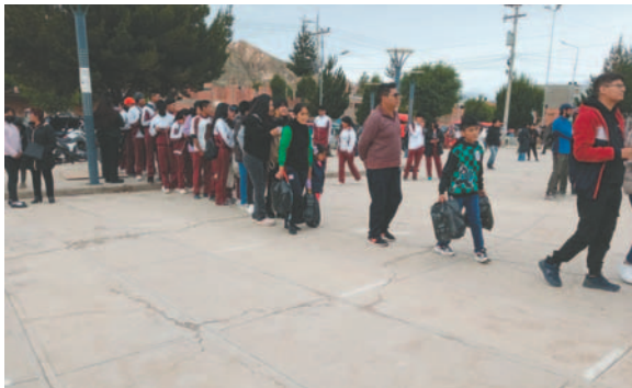
Las familias orureñas acudieron masivamente a Expoteco ayer

En muchos stands, donde se ofrecían dinámicas de juego y regalos, se formaron largas filas