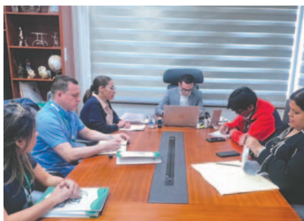
Buscan sanciones drásticas contra quienes cometan delitos ambientales