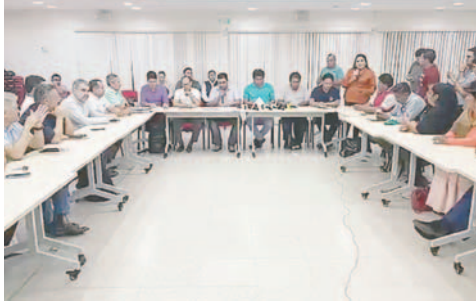
Representantes del sector ganadero, Gobierno y Contracabol reunidos /CAPTURADO EN VIDEO

Como consecuencia del compromiso, se "regulari-