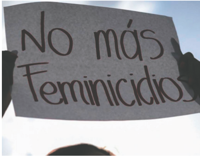
El principal implicado se dio a la fuga tras perpetrar el crimen

“Se están iniciando las investigaciones correspondientes de este caso; lamentablemente, habrían sido testigos