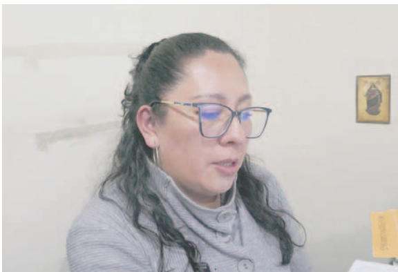
La fiscal Landaeta indicó que la víctima se encuentra delicada de salud y que podría perder al bebé

estado de gestación, existe riesgo de perder el bebé. El sujeto ahora se encuentra detenido en la cárcel de San Pedro de Oruro, ya que la víctima refiere que en varias oportunidades habría sido agredida por el mismo sujeto.