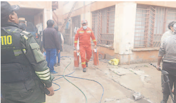
Sofocaron el incendio mediante el uso de extintores

mentó personas heridas. Las autoridades continúan investigando las causas del incendio para prevenir futuros incidentes similares en la zona.