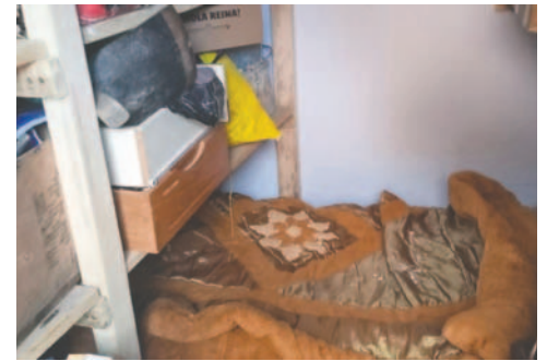
La víctima vivía en condiciones precarias tras ser vendida por su padre