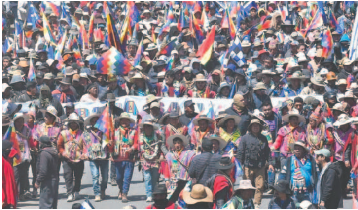
“Evistas” ya marcharon a La Paz este año