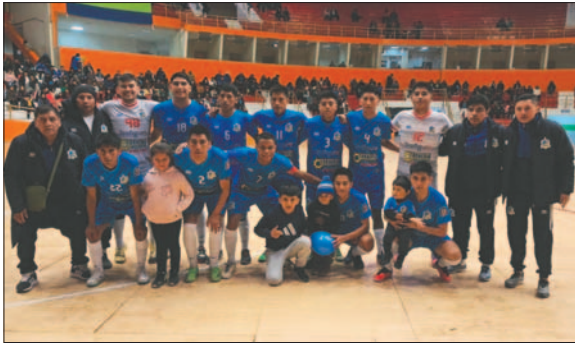
Córdoba con el objetivo de sumar su primer título en la Liga Nacional de Futsal

Por su parte, Córdoba ha preparado a su mejor equipo para encarar este partido, son conscientes que al ser locales tienen la obligación de ganar para no complicarse y así encaminarse rumbo a lo que sería su primer título. La vuelta se jugará en Oruro el viernes de la siguiente semana.