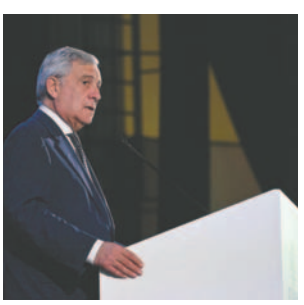
Imagen de Archivo del jefe de la diplomacia italiana, Antonio Tajani

LA PATRIA Los ministros de Exteriores del G7 se reunirán el próximo lunes 25 de noviembre en Fiuggi, Italia, para discutir la orden de arresto emitida por la Corte Penal Internacional (CPI) contra el primer ministro israelí Benjamín Netanyahu, en un encuentro donde también se abordarán las implicaciones legales y políticas de esta decisión. Antonio Tajani, anfitrión y jefe de la diplomacia italiana, afirmó: "Respetamos y apoyamos a la CPI, pero estamos convencidos de que lo que debe hacer es tener un papel jurídico y no político". Además, agregó: "Examinaremos los documentos para entender qué motivaciones han llevado al Tribunal a tomar esta decisión". El lunes comenzará la reunión de dos días de los ministros del G7 (Canadá, Estados Unidos, Gran Bretaña, Japón, Francia, Alemania e Italia).