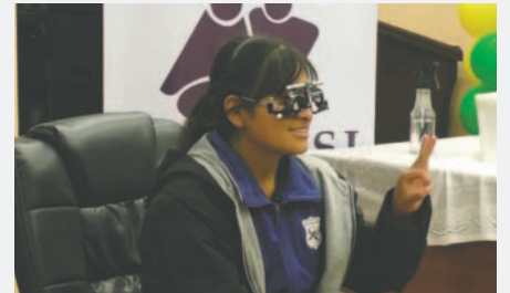
Personas con discapacidad se beneficiaron de la campaña