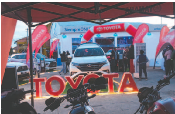
El stand de Toyosa se encuentra en el área externa de exposición del Campo Ferial

“Para nosotros, es un reconocimiento importante y sentimos que al apostar por nuestra feria, apostamos a que más familias conozcan la variedad de vehículos que tenemos para ellos. La feria nos abre muchas oportunidades y, sobre todo,