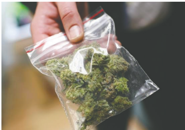
Ambos individuos son procesados por tráfico de sustancias controladas / REFERENCIAL

Indicó que de manera provisional ambos fueron imputados por el delito de tráfico de sustancias controladas y se ha solicitado la detención preventiva de ambos en San Pedro mientras continúa la etapa preparatoria.