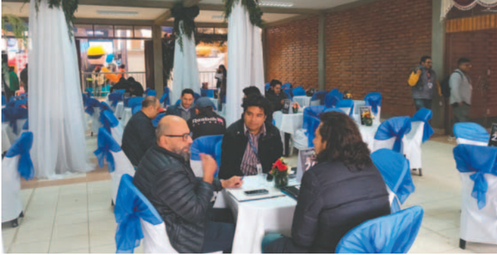
La rueda de negocios de este año superó las expectativas