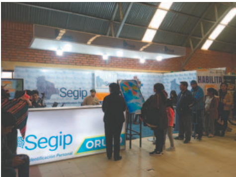
Mucha gente aprovechó para obtener su cédula de identidad y licencia de conducir en el stand de Segip

Para la emisión de cédula de identidad solo se debe presentar en efectivo los 17 bolivianos, para evitar hacer filas en las entidades financieras.