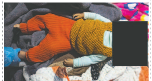
El infante falleció por asfixia luego de que sus padres consumieran alcohol en exceso

Ambos padres deben cumplir las medidas sustitutivas impuestas, que incluyen la prohibición de consumir alcohol y presentarse periódicamente ante las autoridades, mientras continúa la investigación para esclarecer completamente los hechos.