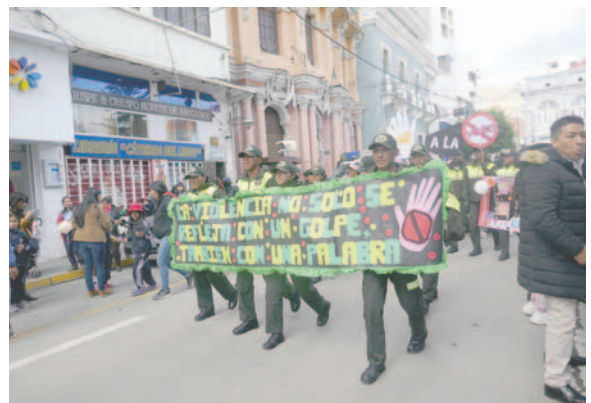
La marcha comenzó en el Parque de la Unión y culminó en la Plaza principal