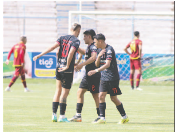
En el partido de ida empataron 2-2 en Oruro el sábado 16 de noviembre

quistaron el bicampeonato. La de- legación orureña, viajó con anti- cipación a la sede del partido, de manera que llegaron a Sucre ano- che, descansaron bien y están a la espera del partido.