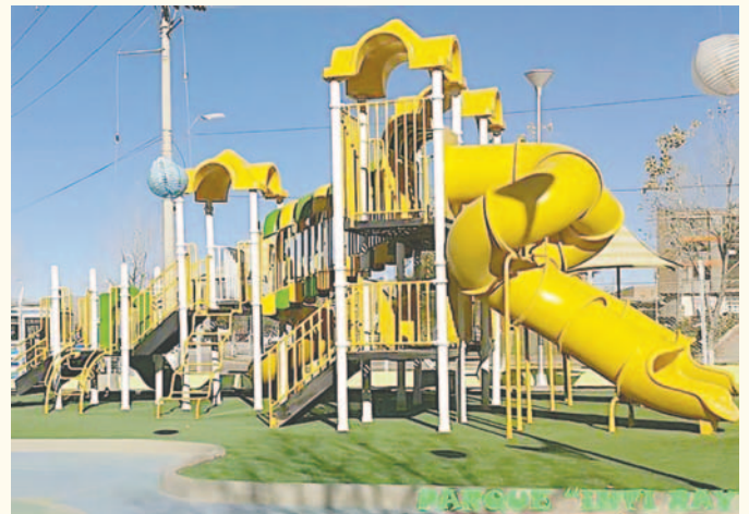
PARQUE INTI RAYMI