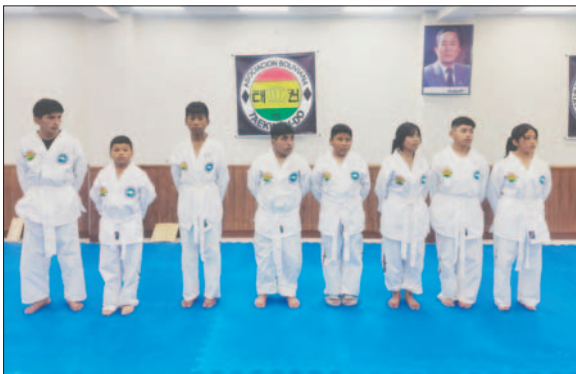
El nivel de este deporte va en aumento en el departamento de Oruro

El balance general de la compe- tencia fue positiva, ya que los depor- tistas mostraron muchas mejoras en relación con los últimos controles, lo cual les brinda mejores herramien- tas para sobresalir en futuros even- tos a nivel nacional. Oruro fue un buen animador en competencias en otras regiones, trayendo importan- tes preseas en beneficio del departa- mento. El objetivo es seguir elevan- do el nivel de los deportistas para que continúen en alta competencia.