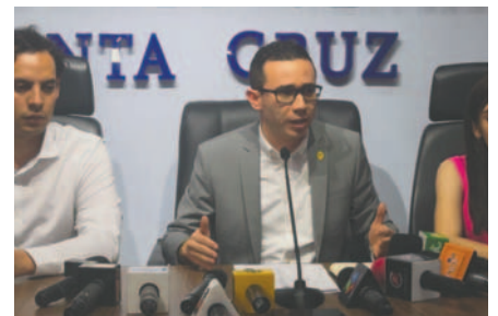
El fiscal Zeballos (c) detalló que el implicado fue remitido a la cárcel tras presentar indicios en su contra

Se presume que el sujeto grabó con la niña videos de contenido sexual desde la gestión 2023. Gracias al trabajo coordinado del Ministerio Público, no solo se logró identificar al agresor, sino también aprehenderlo en la zona de la terminal Bimodal. Además, se secuestraron los dispositivos móviles en los que se tienen las pruebas de los delitos.