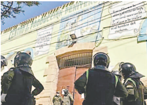
La Fiscalía solicita su prisión preventiva en el penal de San Pedro de Oruro

Se presume que pretendía darse a la fuga para evitar enfrentar a la justicia. Se espera que en esta jornada sea remitido ante un juez cautelar que defina su situación jurídica.