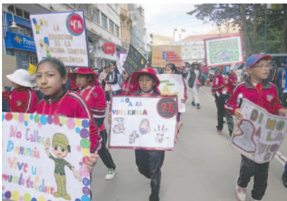
Niños y jóvenes se sumaron a la marcha para exigir fin a la violencia

“El propósito es sensibilizar a nuestra población, que sepan que son muy importantes para nosotros. Tenemos que entender que los niños, los jóvenes y