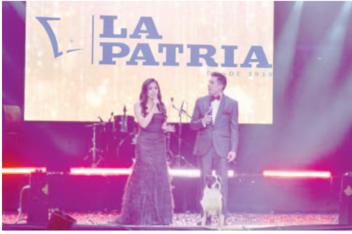
Los presentadores de la noche de moda junto a una "invitada" especial