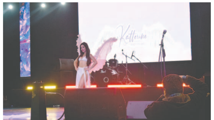
Las modelos de Katterine Beauty Skin Care brillaron por su llamativo atuendo