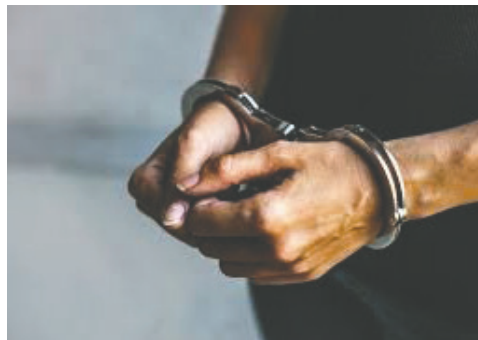
La víctima contó que su padrastrado la agredía física y sexualmente /REFERENCIAL