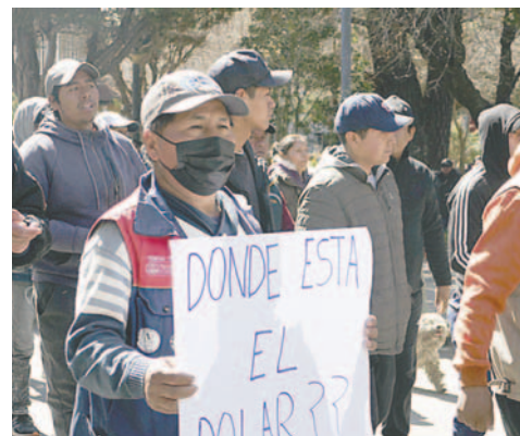
Sectores exigen atención de las autoridades nacionales

Febrero y llamaron a toda la población, así como a instituciones y organizaciones sectoriales, a sumarse a la gran marcha de cacerolas vacías en defensa de la economía. La marcha se realizará este 25 de noviembre y partirá