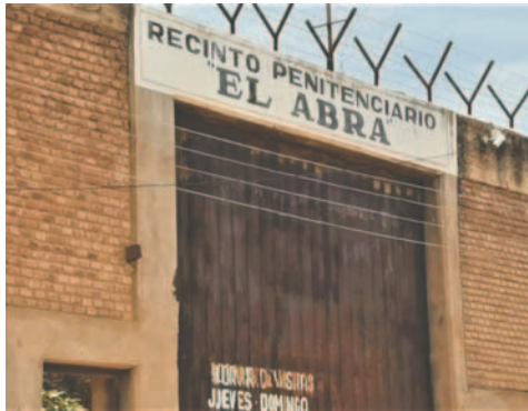
El uniformado deberá cumplir los años de condena en el penal El Abra