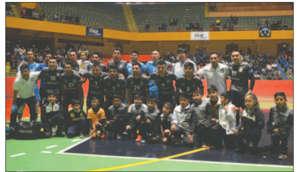
Fantasmas Morales Moralitos quiere comenzar ganando la serie final