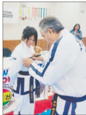
Los mejores lograron el ascenso / LA PATRIA