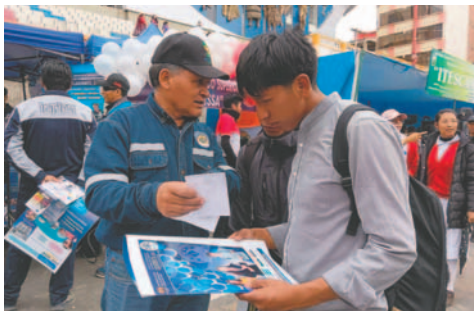
Institutos mostraron su oferta académica