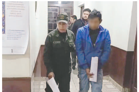
El ahora imputado fue enviado a San Pedro por dos meses

El sujeto obligó a la víctima a tener relaciones sexuales sin su consentimiento, a pesar de ser su concubina. En la audiencia de medidas cautelares se solicitó la detención preventiva del agresor, dado que representa un peligro efectivo para la víctima y sus hijos, quienes también fueron testigos del acto