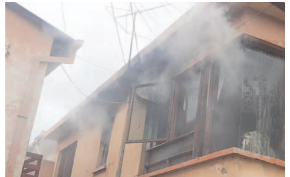
El incendio se generó en el primer piso de la casa causando daños materiales

Después de controlar el fuego, se realizaron trabajos de remoción de los objetos dañados. En el cuarto donde se registró el incendio se encontraban libros, cuadernos, algunas computa-