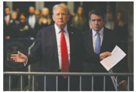
Fotografía de archivo del presidente electo de EE.UU., Donald Trump (L), cuando asistió a su juicio en la Corte Suprema del Estado de Nueva York, Estados Unidos

El juez Merchan también aceptó posponer la emisión de su decisión sobre la inmunidad presidencial hasta después de revisar los documentos de las partes. Los abogados de Trump han reclamado que se le aplique el fallo sobre inmunidad presidencial del Supremo de EE.UU. o, en su defecto, se considere que sus derechos como presidente electo son a estos efectos