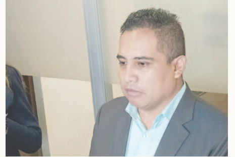
El diputado de CC, Alberto Astorga