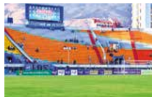
Vista del estadio Félix Capriles. CARLOS LÓPEZ

El partido de este domingo (15:00) entre Universitario de Vinto y Always Ready, por la fecha 22 del Torneo Clausura 2024, finalmente se jugará en el estadio Félix