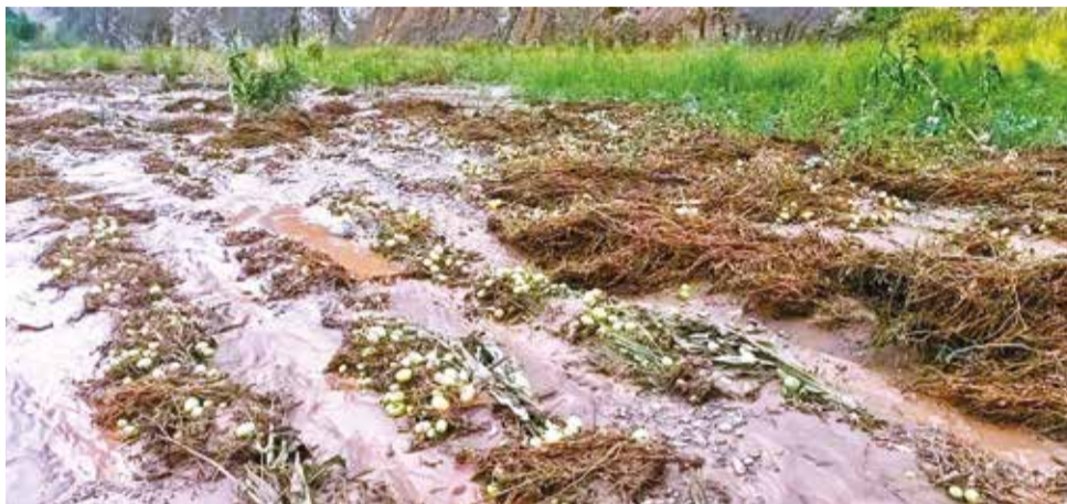
Cultivos de hortalizas dañados en Luribay. SILVIO ROSALES

“Han caído algunas plataformas, ha habido crecida de ríos. No podemos sacar nuestros productos. Por eso necesitamos maquinaria pesada,