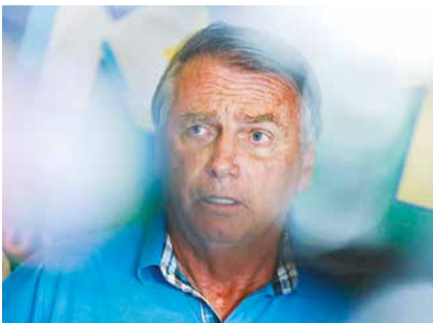
El expresidente brasileño, el 22 de octubre de este año.

Las sospechas también se basan en llamadas, mensajes y movimientos bancarios de los investigados.