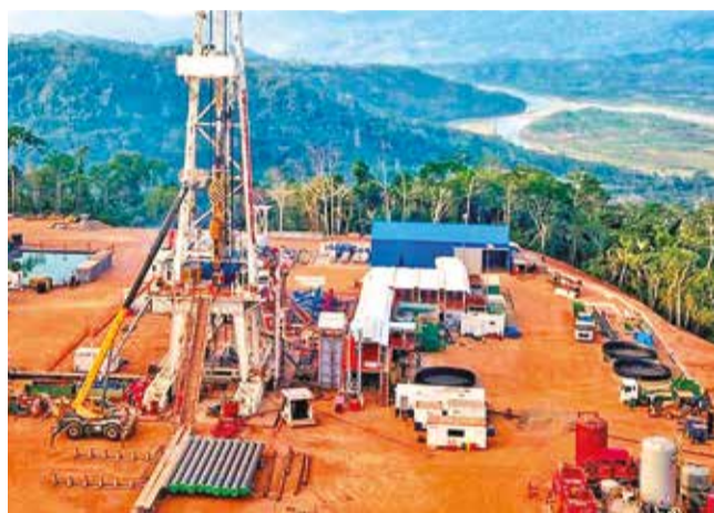
El pozo Mayaya en el norte de La Paz. YPFB

Para 2032, se estima un incremento a 54,2 MMmcd, gracias a proyectos exploratorios exitosos y la ejecución