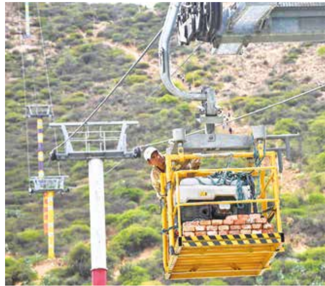
El traslado de material para obras complementarias.

Se estima que los resultados se den a conocer alrededor de las 21:00, pero este detalle puede variar.