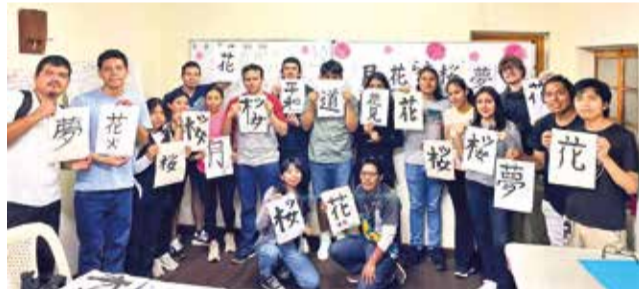
Un breve repaso de la trayectoria de la Asociación Cultural Boliviana Japonesa.

La asociación comenzó en un momento de adversidad. El 11 de marzo de 2011, Japón sufrió uno de los desastres naturales más devastadores de su historia: un terremoto de