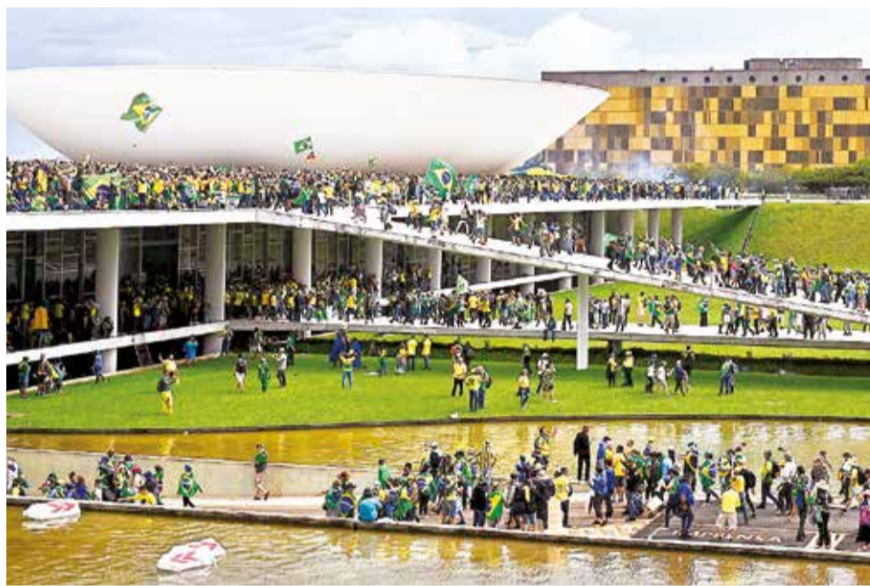
El asalto de bolsonaristas a la sede de los poderes del Estado, el 8 de enero de 2023.

Además de Bolsonaro, en la lista de acusados figura Walter Braga Netto, general de la reserva y antiguo ministro de la