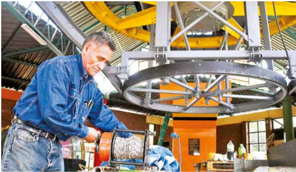
Los trabajos de mantenimiento en la estación del teleférico, ayer.