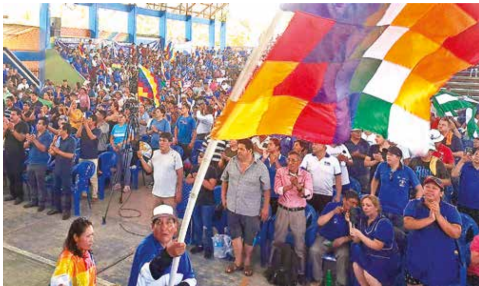
Congreso del MAS evista en Lauca Ñ en octubre de 2023.

“Según comentan, cada sentencia tiene un costo de 50 mil dólares (...) Lucho Arce no necesita ningún órgano del estado, de la Asamblea, nada, sólo con dos personas puede gobernar”, expuso.