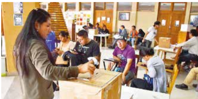
El sufragio durante la primera vuelta electoral. H. ANDÍA

Ingreso. Desde las 8:00, los universitarios pueden acudir a sufragar. Se habilitaron cuatro accesos y reforzó la vigilia en el campus