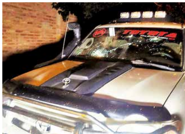
La camioneta retenida por los vecinos. LOS TIEMPOS

Según algunos de los vecinos, desde una camioneta la pareja se enfrentó con personas que se encontraban en otro motorizado, estas lograron huir.