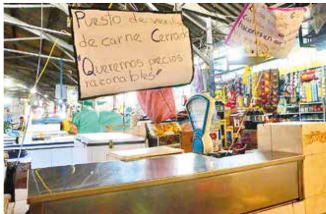
Uno puesto de venta de carne en Cochabamba, cerrado. H.A.

El conflicto se originó por la exigencia de Contraca-