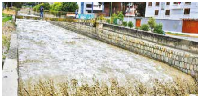
Sube el caudal en Choqueyapu, en La Paz. RR55

En la ciudad de La Paz, de acuerdo con el sistema de monitoreo de la municipalidad, las recientes precipitaciones causaron el incremento de caudal de tres ríos que cruzan el municipio. “Estamos monitoreando cons-