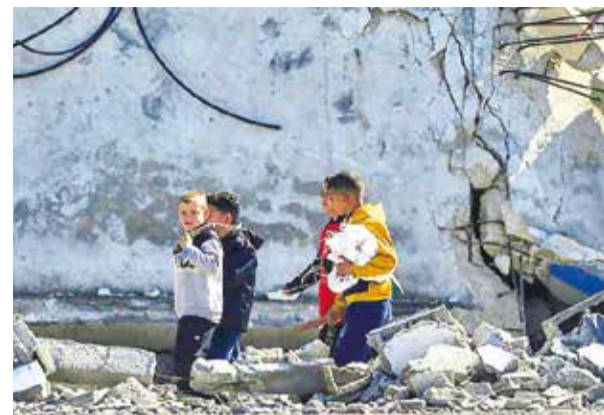
Niños palestinos en un campo del sur de Gaza.

En el comunicado, Bolsonaro dijo que la acusación ahora tendrá que ser analizada por la Procuraduría General de la República, ante la cual sí tendrá la oportunidad de defenderse.