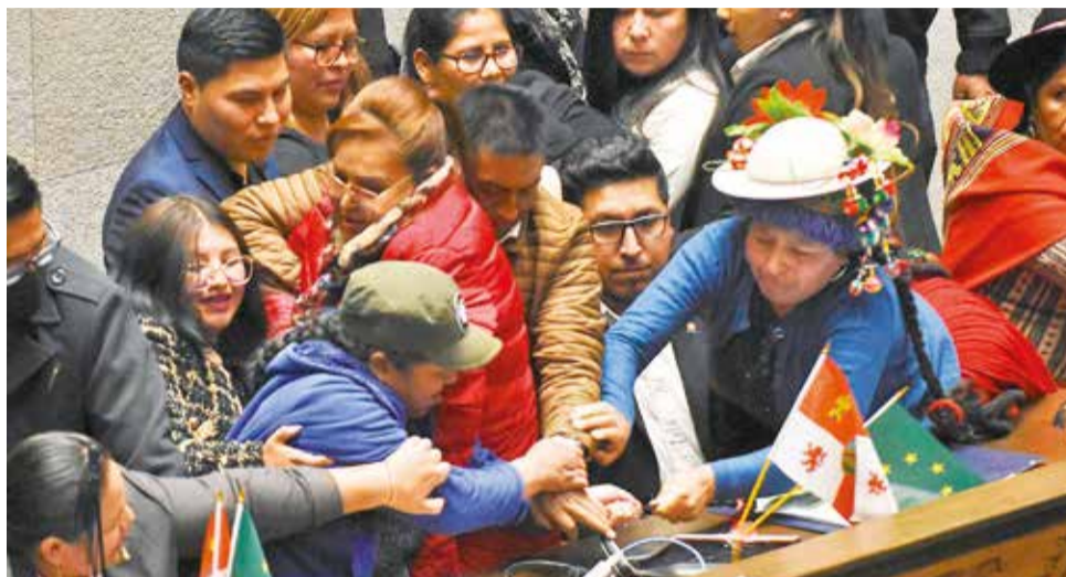
El presidente de Diputados, Omar Yujra, es agredido por evistas.

Si bien la testera estuvo rodeada esta vez por personal de seguridad para evitar que suban los asambleístas por los costados, los “evistas” se dieron formas para llevar adelante su protesta. Los “evistas” arremetieron a empujones y gritos. Incluso algunas parlamentarias se subieron a la testera impulsadas por sus compañeros. Rechazan que Yujra sea presidente de Diputados, porque consideran que su elección fue ilegal y que se posesionó de manera irregular, a puertas cerradas.