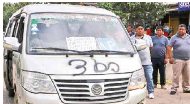
Choferes bloquean las vías en Santa Cruz, ayer.