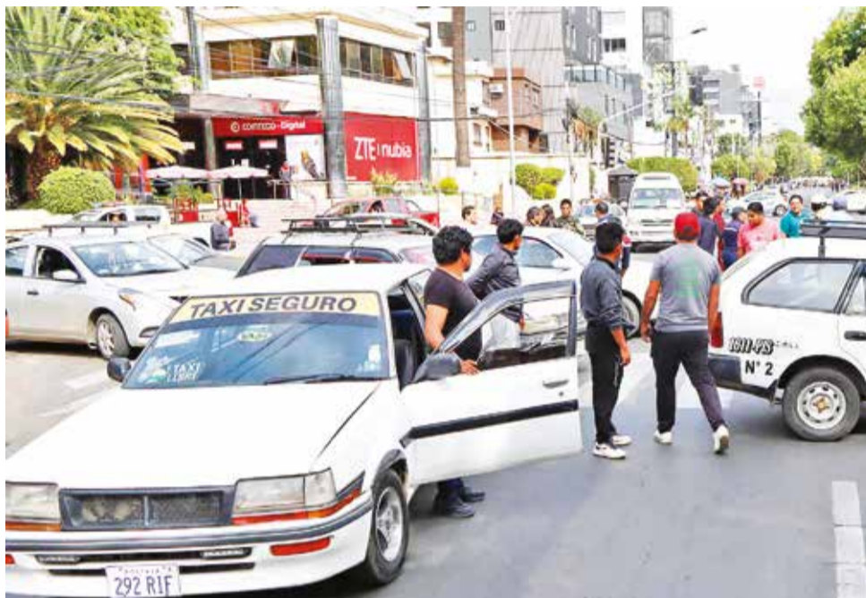
El bloqueo de los conductores de radiotaxis en la avenida Ballivián, ayer. MAURICIO ZEBALLOS

creto Supremo 5199, que dispone la creación del Registro Nacional de Aplicaciones Digitales para Transporte de Pasajeros (ATP).