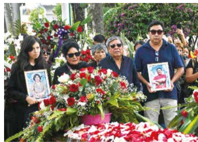
Amigos y familiares se despiden de víctimas. CARLOS LÓPEZ