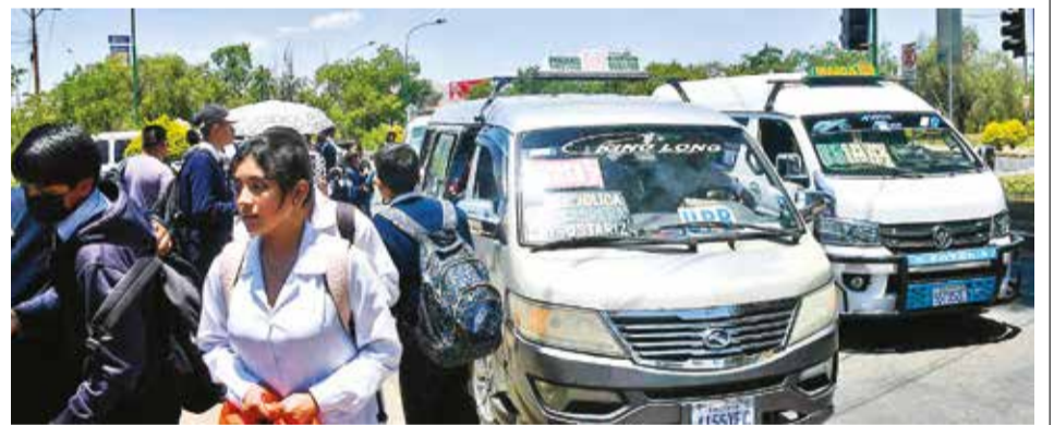
Pasajeros se aglomeran para tomar trufis ante ausencia de micros. CARLOS LÓPEZ

Mientras se aguarda la llegada de lo requerido, se hacen otros trabajos en el teleférico, como el mantenimiento de las cremalleras de las cabinas, las articulaciones, se extrajo las pinzas de sujeción, se pintó la infraestructura de la plataforma móvil, se cambiaron los teflones y los 12 pilares. Aún se realizan otras obras complementarias.