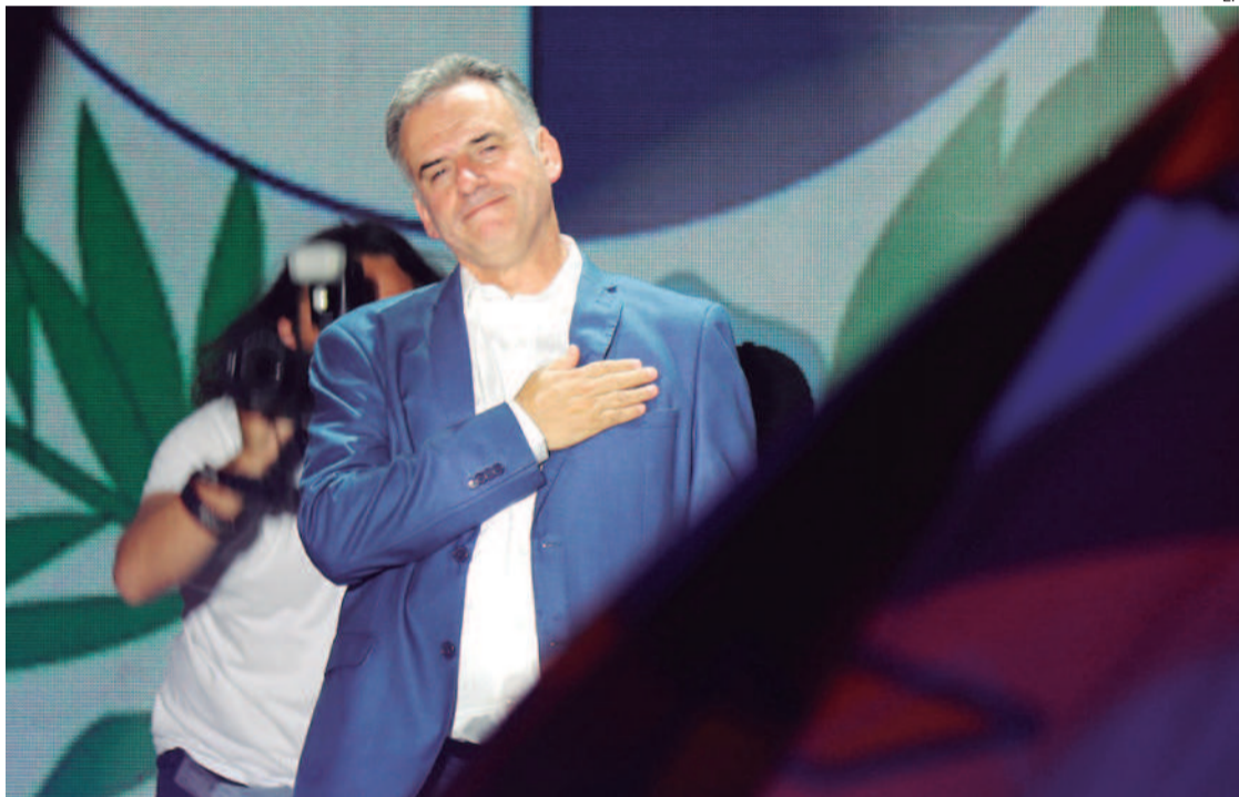
Yamandú Orsi se comprometió a ser el presidente que convoque una y otra vez al diálogo nacional