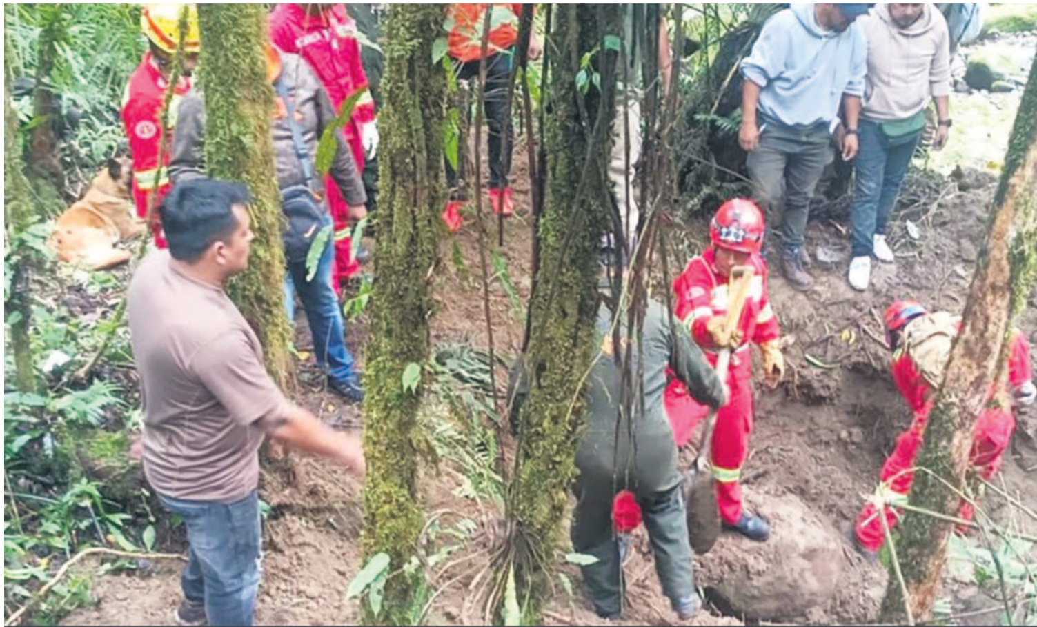
La fosa común donde enterraron cuatro cuerpos en Corani Pampa. Antes, los comunarios torturaron a las víctimas y dispararon en la cabeza.