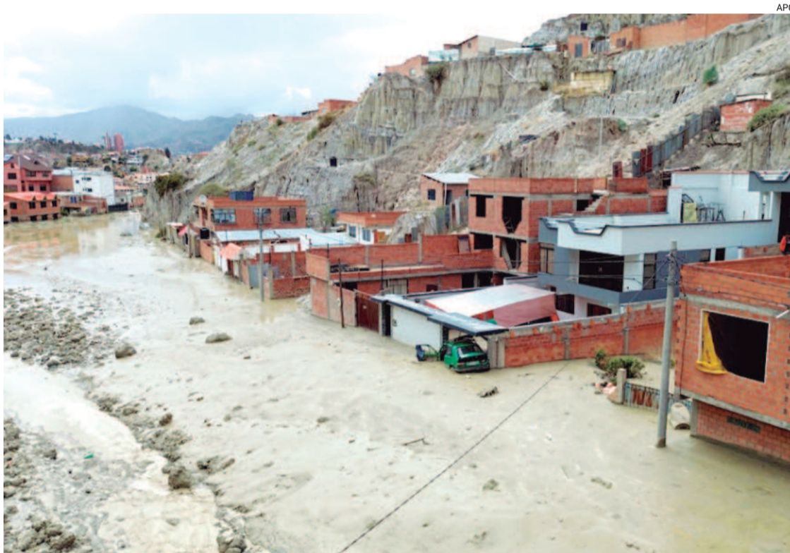
Casi medio centenar de viviendas fueron afectadas por el lodo, se habla de tres inhabitables

Pidió paciencia a la población porque se trata de lodo, que requiere maquinaria especializada para las tareas que demanda la emergencia, ya que el equipo tradicional podría hundirse de-