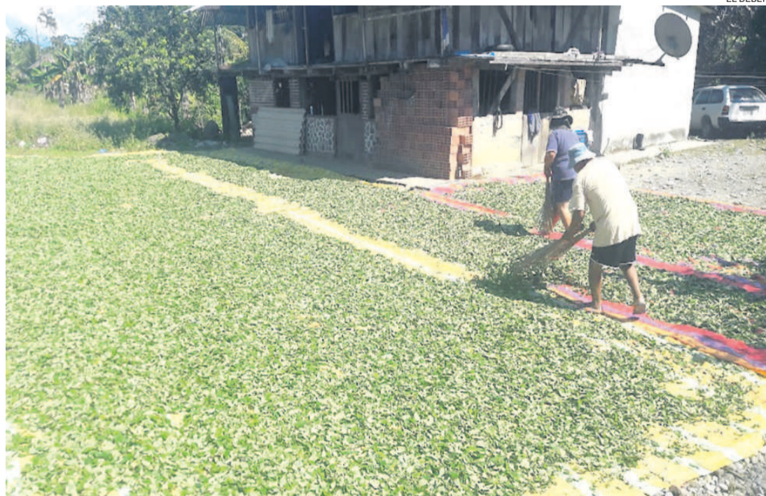
Los cocaleros del Chapare secan su coca en sus domicilios y desconocen dónde va su producto.

La autoridad dijo que el único detenido hasta ahora -quien confesó haber matado a cuatro personas- es dirigente de las federaciones cocaleras del trópico de Cochabamba. Lo mismo que otros participantes de este macabro hecho.