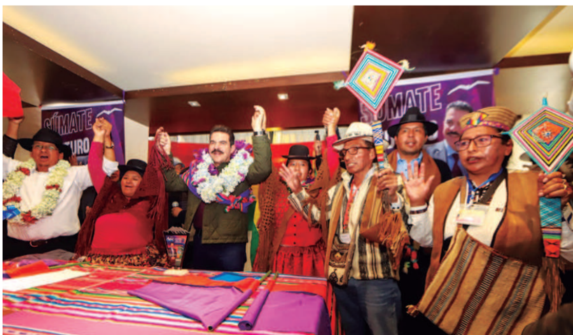
Manfred Reyes Villa, con su mejor sonrisa, posa con los alteños que se subieron al tren de Súmate.

siempre ha sido El Alto, siempre han utilizado a El Alto (...) Lo que no han hecho desde 1825, desde la fundación de Bolivia, ahora lo vamos a hacer, vamos a ser un país rico, con gente con oportunidades, con gente con trabajo", dijo Reyes Villa en su discurso.