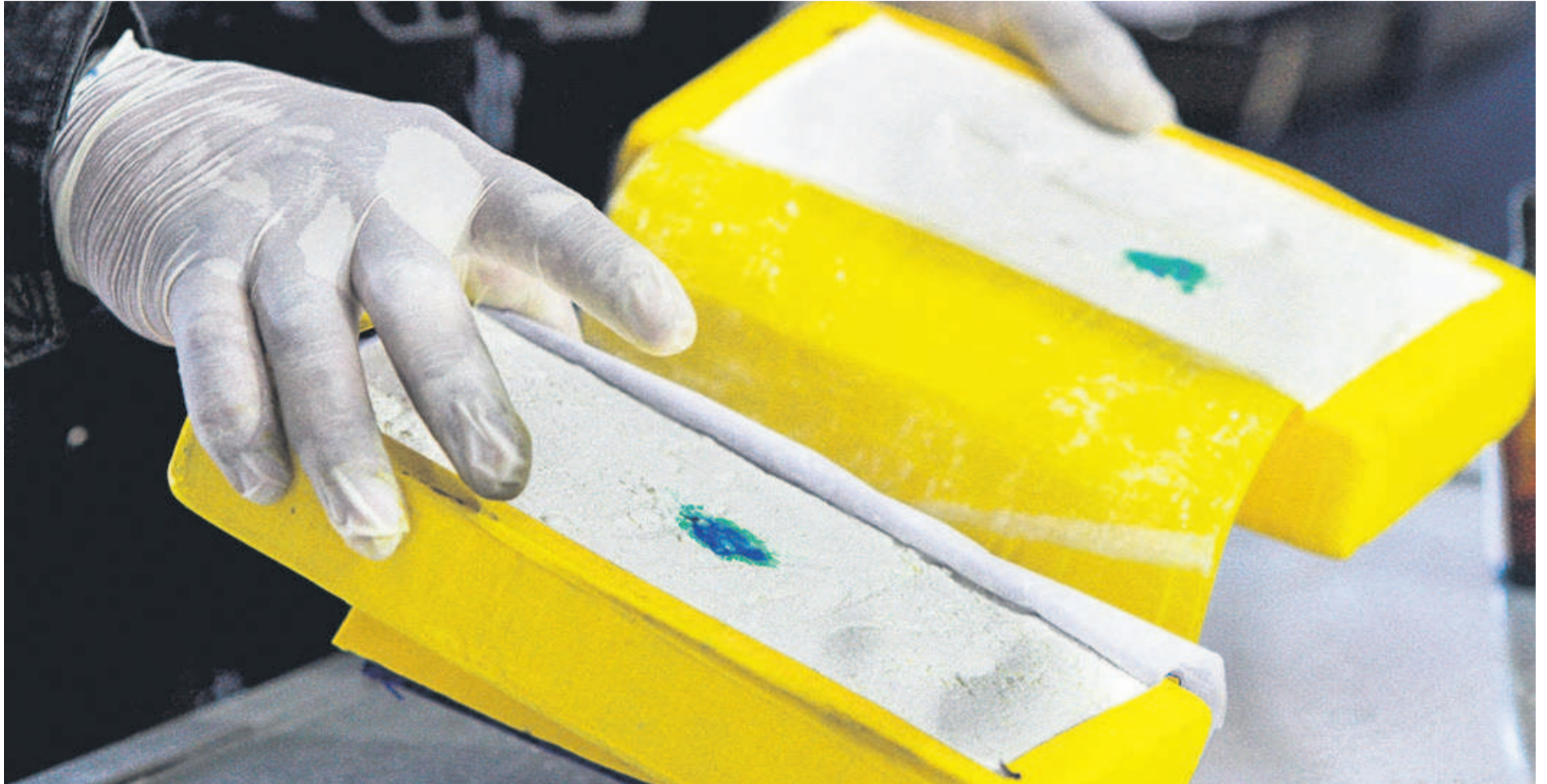
La reciente incautación de media tonelada de droga tenía el logo de un delfín que, para los investigadores, se trata de una organización poderosa que opera en Bolivia y tres países.

LOS EXPERTOS CUESTIONAN LA EFECTIVIDAD DE LOS RADARES