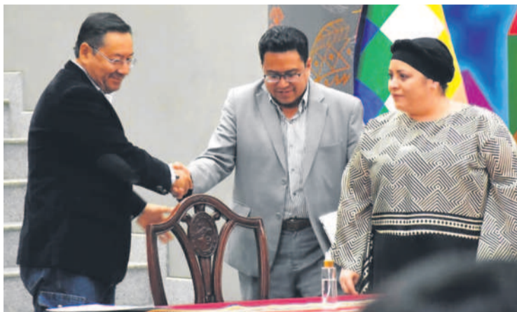
El presidente Luis Arce junto sus ministros César Siles y Nela Prada.