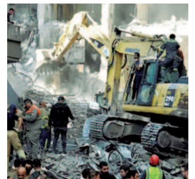
Laborios de rescate (EFE)

Mientras tanto, la UE pidió más presión sobre Israel y Hezbollah para alcanzar un acuerdo/Clarín.