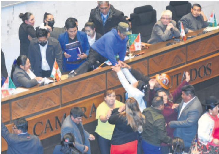
Diputados evistas y arcistas se golpean y dañan bienes públicos.