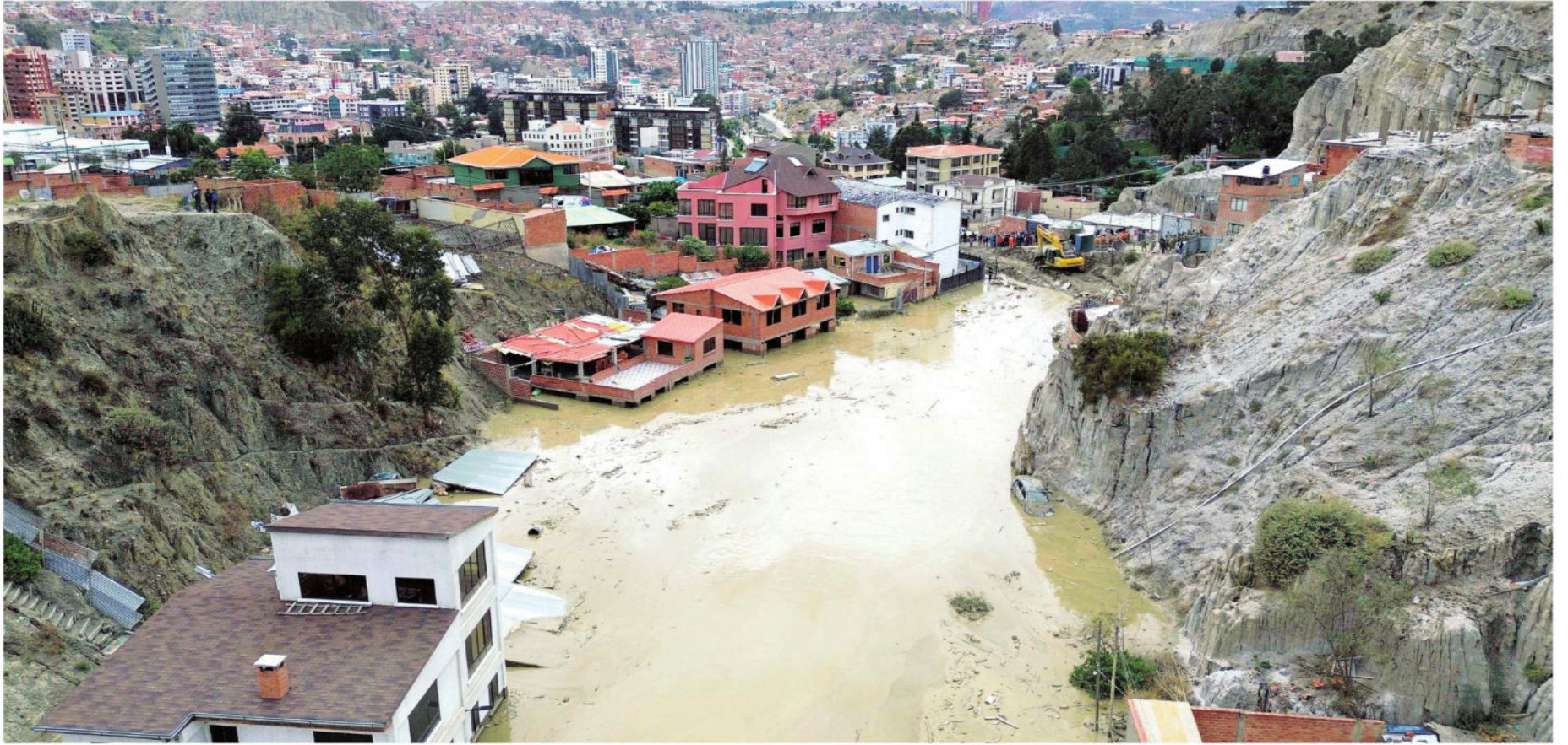
Una intensa lluvia registrada el sábado provocó la crecida del río Pasajahuira que después se convirtió en una riada con lodo que llegó a dos urbanizaciones de Bajo Llojeta

DETERMINACIÓN. EL PRESIDENTE LUIS ARCE EXIGE UNA INVESTIGACIÓN