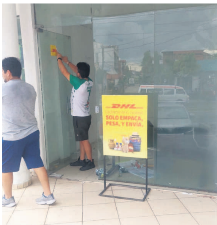
Esta fue una de las sucursales que cerró hace un par de semanas

Es la disminución en el porcentaje de remesas entre los meses de agosto y septiembre de este año