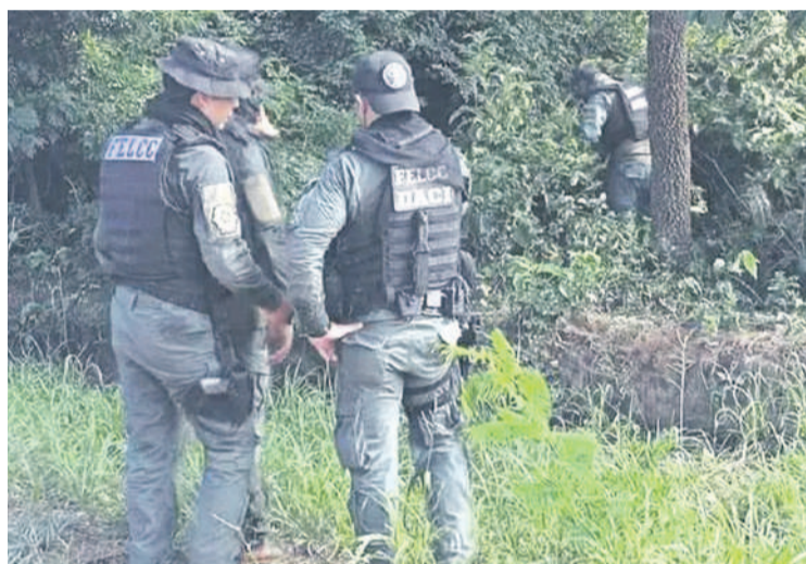
La Policía hizo un trabajo de investigación para hallar los cuerpos.