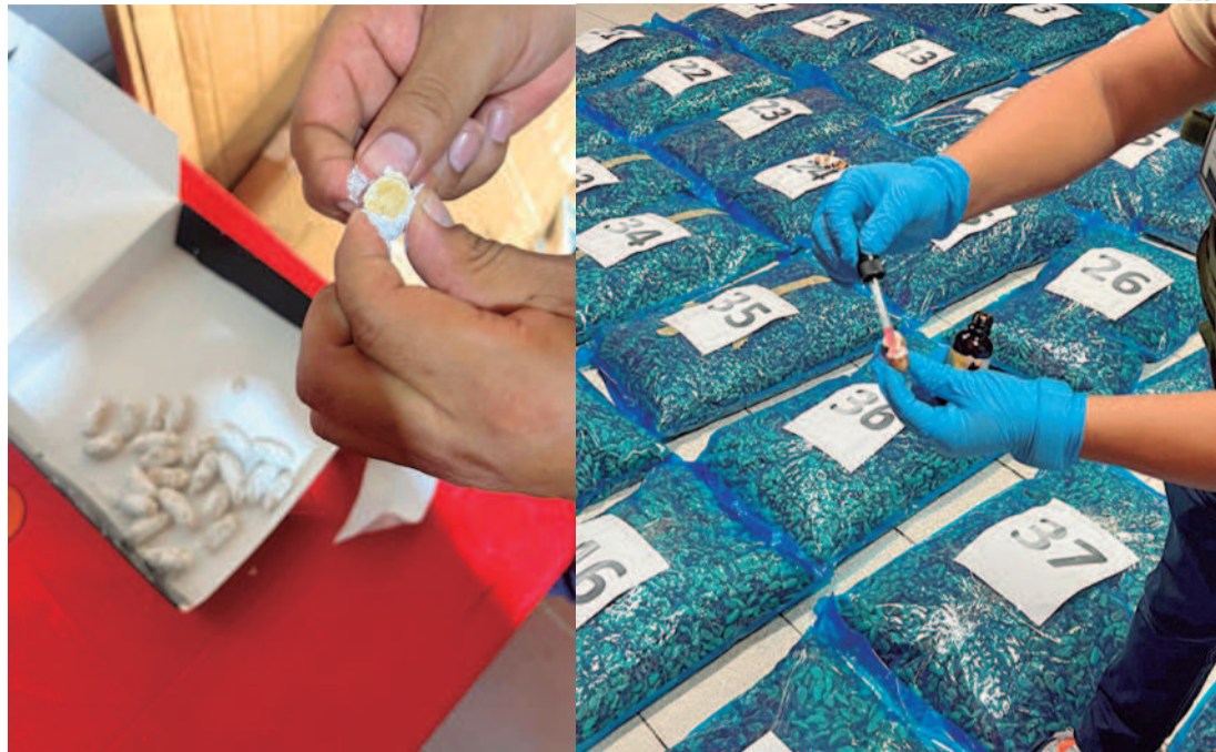
En las almendras de exportación camuflaron hábilmente más de una tonelada de cocaína pura

La Policía señaló que detrás del intento de asesinato de Erland García, estuvo el PCC, en una disputa de ruta