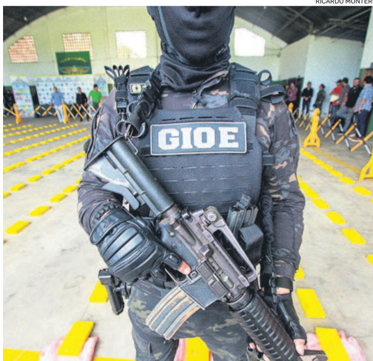
El GIOE confiscó casi media tonelada de droga en la provincia Velasco

Amazonía de la Fuerza Especial de Lucha Contra el Narcotráfico (Felcn), los Diablos Rojos y el Comando de Seguridad y Defensa del Espacio Aéreo (Codesa) en la provincia Velasco, permitió el hallazgo de una base donde operaban narcotraficantes. El sitio estaba distante a 45 kilómetros de la frontera con Brasil.