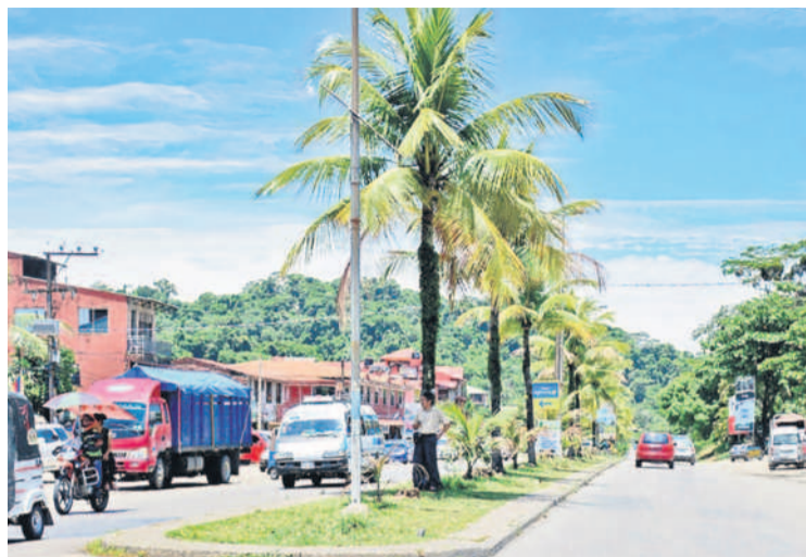
Corani Pampa, en Colomi, es la puerta de ingreso al Chapare.