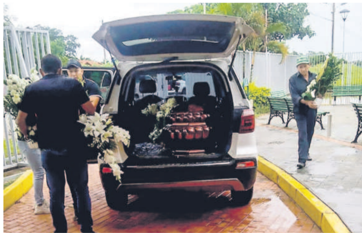
Sus restos fueron trasladados a Vallecito de Samaipata

Ese día, los amigos de don Samuel; otros librecambistas, así