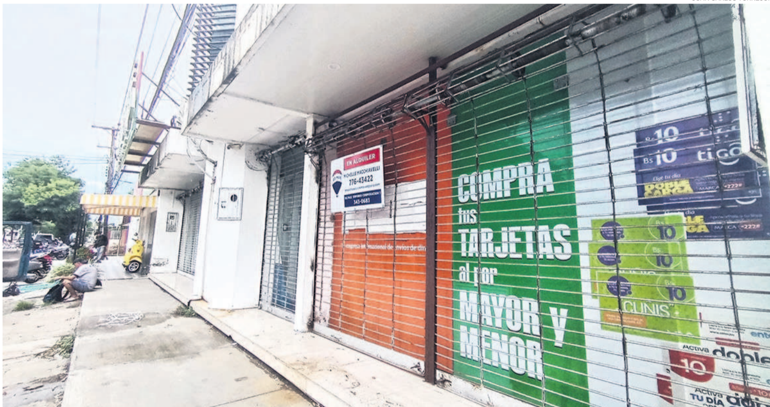
Los cambios en el servicio y la menor tasa de cambio provocan que los migrantes busquen otras alternativas para el envío de remesas.