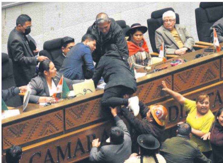
Una diputada masista trepa a la testera con apoyo de sus colegas.