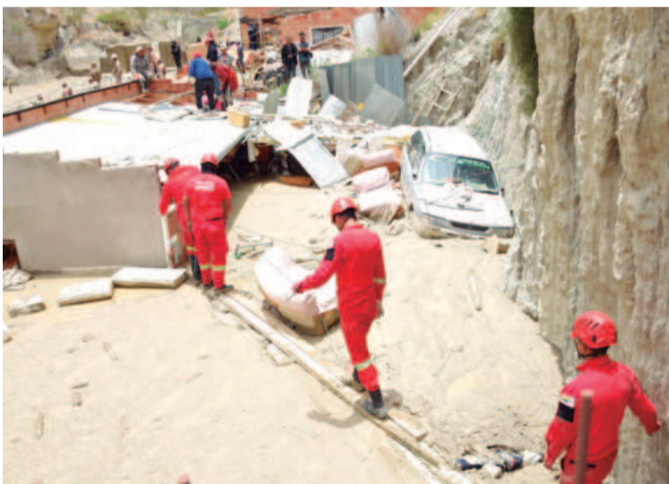
Unas 500 personas trabajan en las operaciones de emergencia