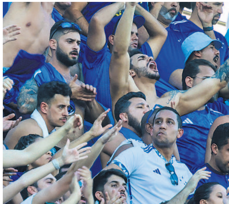
Los brasileños coparon una de las gradas. Se fueron tristes luego de la derrota por 3-1