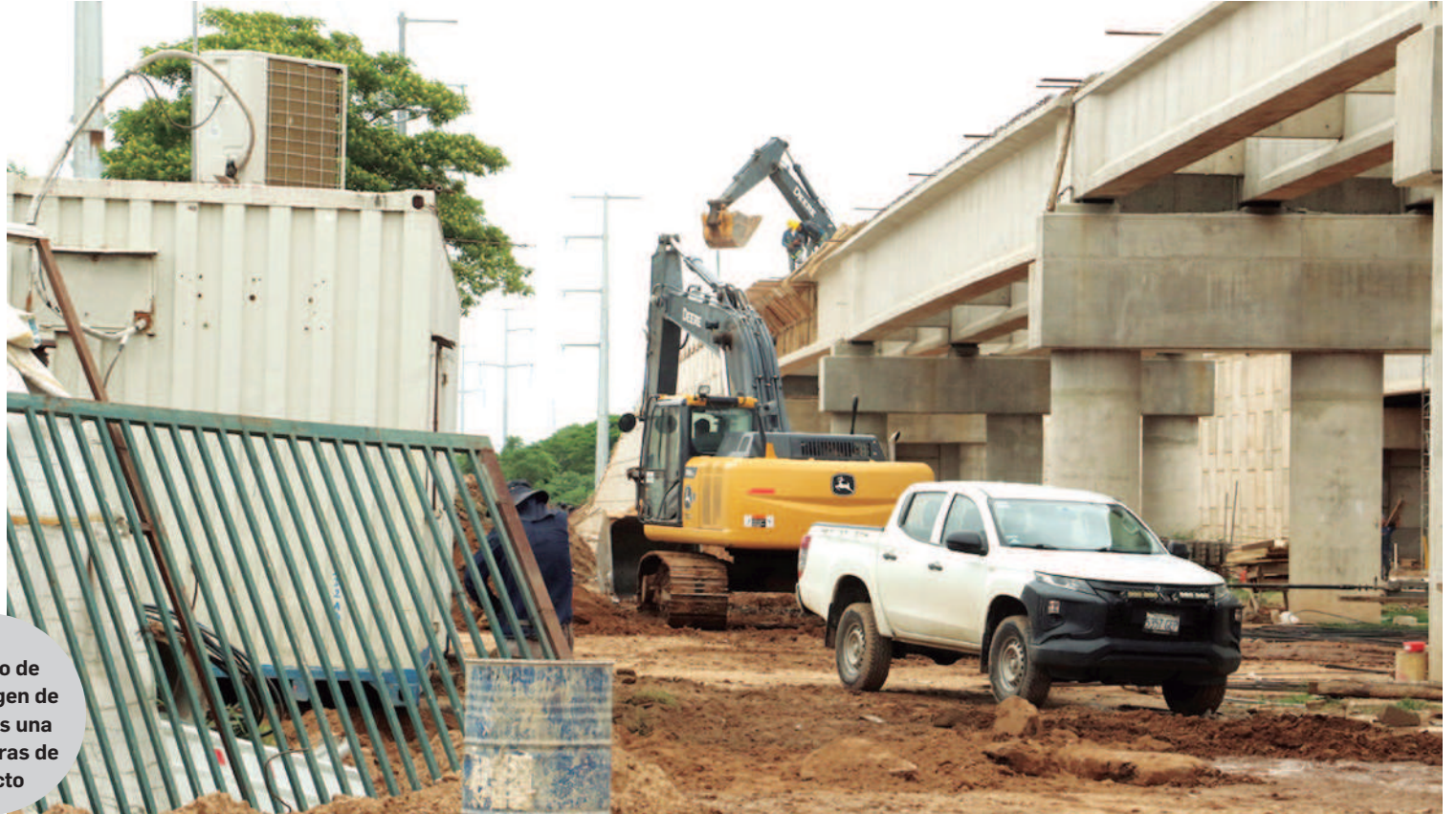
El viaducto de la av. Virgen de Cotoca es una de las obras de impacto