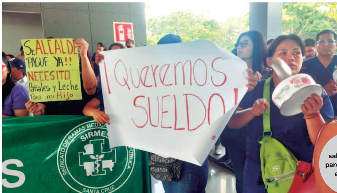
El sector salud cumplió paros exigiendo el pago de sueldos

que toda esta crisis refleja la mala administración del Ejecutivo, que se ha visto envuelto en el escándalo de desvío de las recaudaciones por la manipulación informática y otros hechos de corrupción.