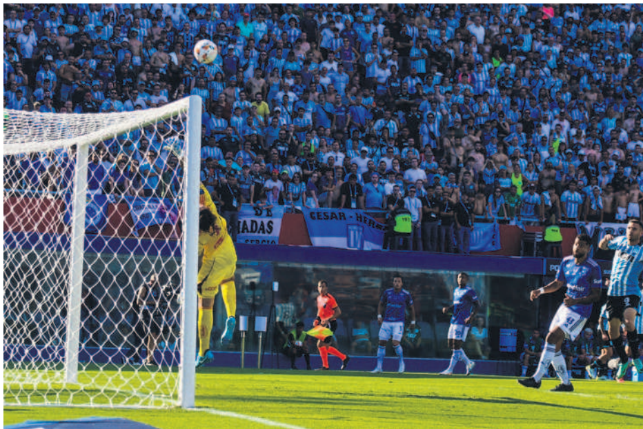
Golazo de Martirena. El volante sorprendió a Cassio con un centro que se clavó en el ángulo