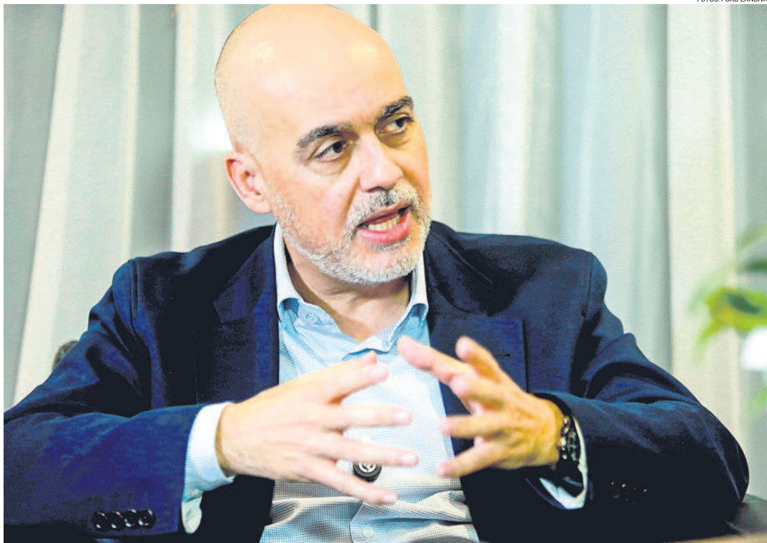
El embajador de la UE estuvo en las instalaciones de EL DEBER para compartir sus impresiones sobre la coyuntura nacional y la cooperación

Llegó hace dos meses y medio mientras el fuego consumía bosques y pastizales de Santa Cruz y la región amazónica del país. Exhorta a evitar que esta tragedia se repita