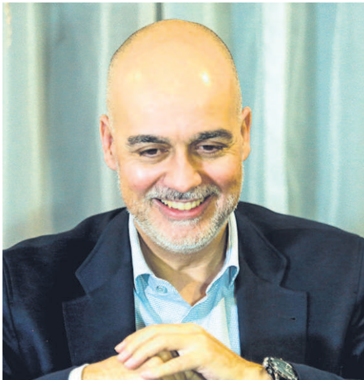
Dice que si se lo piden enviará una misión para observar elecciones

padrón electoral; hay otros cooperantes que sí, nosotros no; nosotros hemos apostado por fortalecer las capacidades de los órganos electorales y enfocarnos en lo que llamamos el ciclo electoral. No se resuelve todo el día de la elección; tenemos que trabajar para que, cada vez, sea un proceso más transparente y más inclusivo.