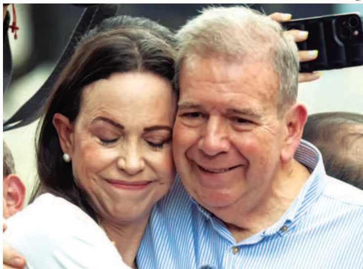
Hasta la fecha, la oposición no logra coronar su triunfo en actas

Machado se refirió a los 114 días que lleva en la clandestinidad, una decisión que tomó luego de que, sin todavía mostrar pruebas, Nicolás Maduro se adjudicara el triunfo de las presidenciales