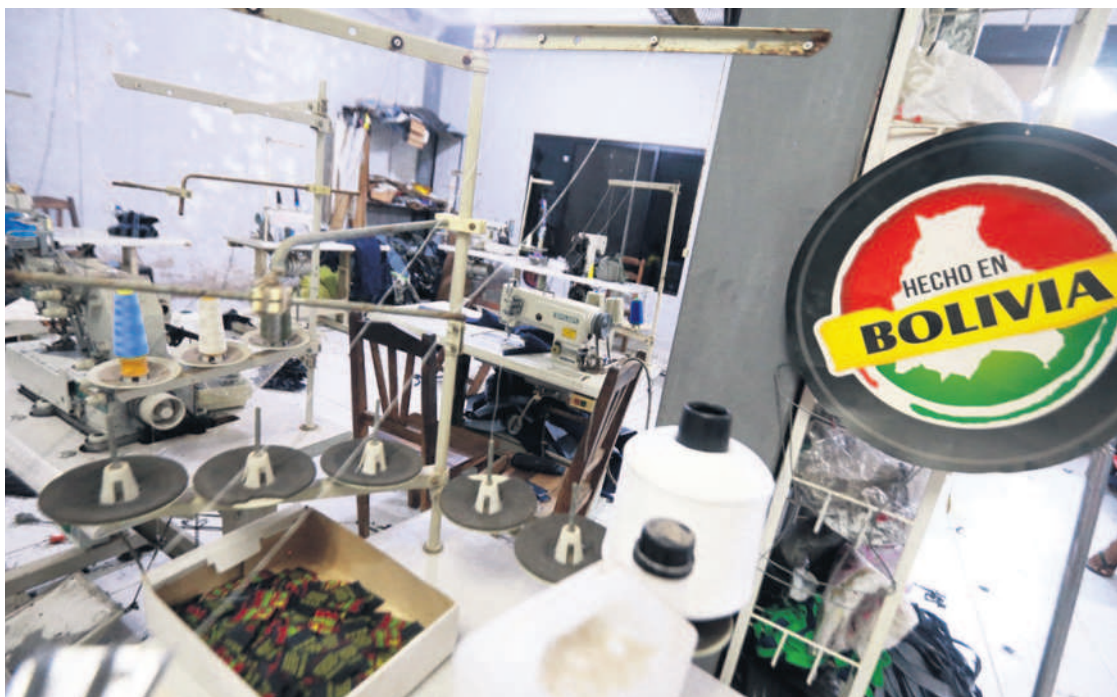
El sector de la micro y pequeña empresa es muy importante porque genera más del 80% del empleo en el país