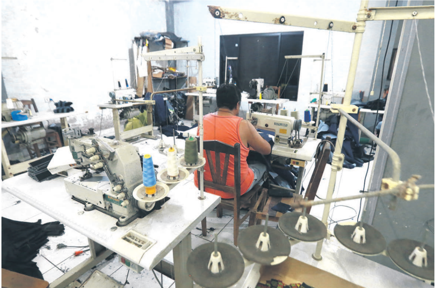
Algunos talleres de confección sostienen que trabajan a media máquina porque tuvieron que reducir el personal, otras directamente cerraron

Entre las principales recomendaciones, destacó la necesidad de ponerse en el lugar del cliente y ajustar la oferta según las nuevas prioridades que surgen tras una crisis. También hizo hincapié en “liberarse del peso muerto”, refiriéndose a procesos, productos o áreas que no generan resultados.