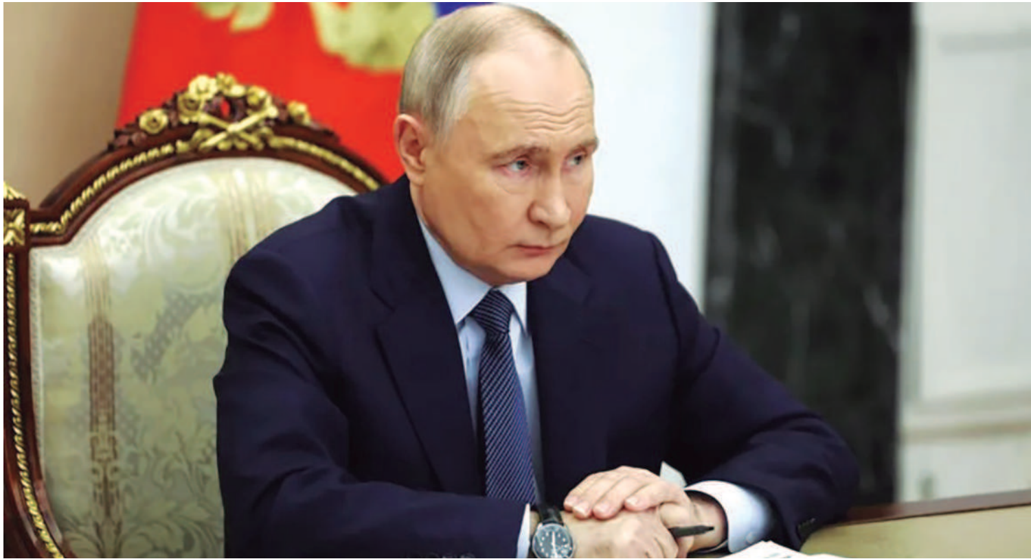
Aparecen en escena nuevas armas en la guerra entre Rusia y Ucrania. La OTAN se movilizó para analizar esta nueva crisis