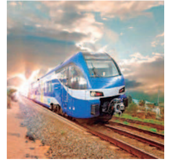
Se busca unir la Amazonía

Si bien falta una reglamentación para este tipo de exportaciones, estamos seguros que por la necesidad de generar más divisas para el país, las autoridades nacionales agilizarán los mecanismos que sean necesarios para que podamos consolidar estas exportaciones.