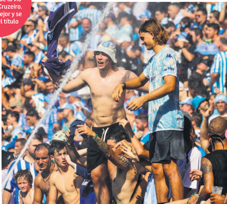
Lo de los hinchas de Racing fue sensacional. El aliento fue conmovedor en todo el partido