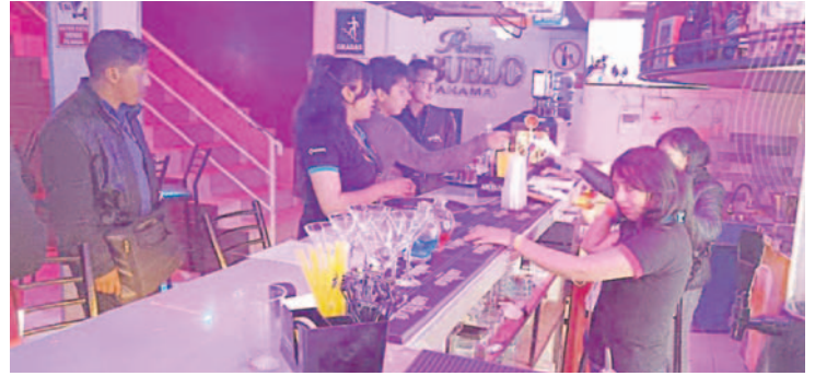
Locales de consumo de bebidas alcohólicas se rigen bajo el Decreto Municipal 114 /GAMO