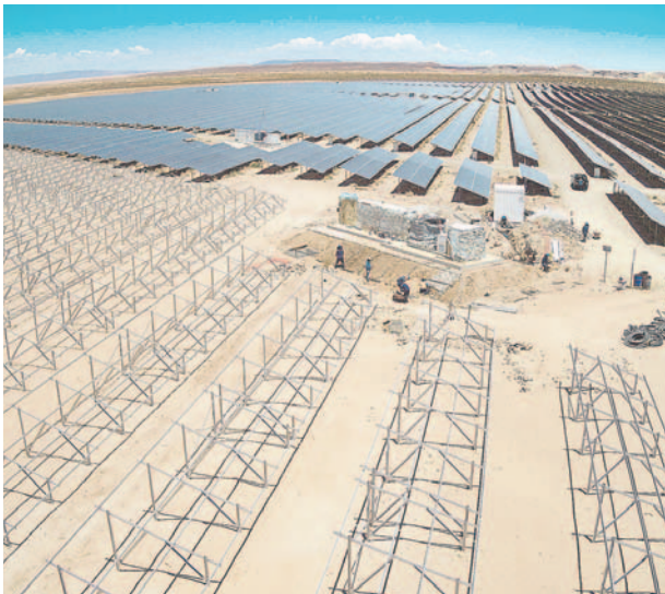
La Planta Solar Fotovoltaica Uyuni tiene el objetivo de consolidarse como una de las principales fuentes de generación de energía limpia en Bolivia.

El proyecto está a cargo de ENDE Guaracachi y se enfoca en la conclusión de las obras civiles, que incluyen vías, bases, movimiento de tierra, cámaras y zanjas. De manera paralela, se ha avanzado significativamente en las obras mecánicas, incluyendo la instalación de estructuras