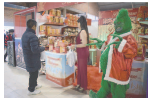
Pantojarse espera a la población en su stand de Expoteco

"Hemos invitado a las niñas del hogar Penny a pasar una tarde muy bonita. Hemos recorrido el