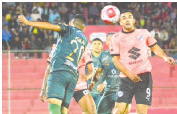
Real Tomayapo y Bolívar tuvieron la ocasión de ganar, al final empataron