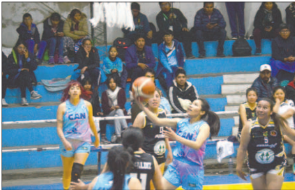
CAN terminó jugando con gente de su banca para dar confianza a las juveniles

El resultado final fue de 112 a 52 en favor de CAN, con anotaciones de 30-12, 29-15, 28-8 y 25-17. A las "caninas" les resta un encuentro en la primera fase, será frente a Ingavi en el municipio de Llallagua el domingo 24 de noviembre desde las 16:00 horas; las celestes quieren sumar un nuevo triunfo para así sellar su pase a la próxima instancia.