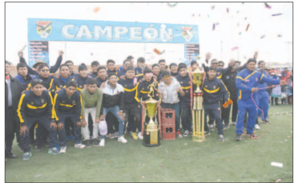
La celebración de Central Cocanis campeón de la Primera de Honor