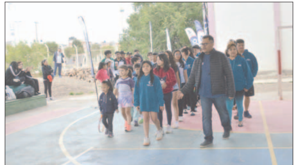
Durante el desarrollo del acto inaugural con la participación de las delegaciones

Antes de mediodía llevó a cabo el acto inaugural, donde estuvieron presentes las delegaciones, además