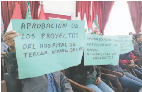
Sector salud solicitó la aprobación de la carpeta

Por su parte, Anabel Chambi indicó que debido a que la carpeta fue presentada para disposición, no llegó a las comisiones y no se dio el tiempo para revisar.