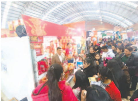
Las niñas del Hogar Penny fueron las invitadas especiales de Pantojarse en Expoteco

Las niñas y adolescentes pudieron disfrutar de todo lo que Expoteco ofrecía. Tras su recorrido, la empresa compró obsequios para las menores, además de compartir una cena. También se brindó una charla motivacional para animarlas a que sigan estudiando y luchando por alcanzar sueños y metas en la vida.