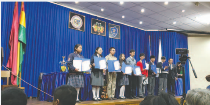
Acto de Premiación de la VII Olimpiada de Ciencia y Tecnología de la FNI

También se reconoció a los profesores y tutores que acompañaron a los estudiantes en el proceso de formación y preparación para las olimpiadas.