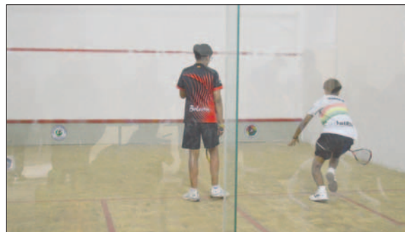
El torneo se desarrollará hasta el domingo

Aprovechó la oportunidad para dar a conocer que se está impulsando el proyecto de creación de más canchas de squash en ese sector, para lo cual se necesita una inversión de 500 mil bolivianos, y se espera que las autoridades ediles puedan dar respaldo a dicho proyecto.