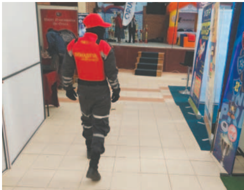
Los guardias hacen rondas constantes por los pabellones

que regula el financiamiento de este tipo de emprendimientos. Además, otorgan periódicamente capacitación estratégica al personal para contar con efectivos preparados y de rápida reacción en el servicio que prestan a diario en el resguardo de instituciones públicas y privadas.