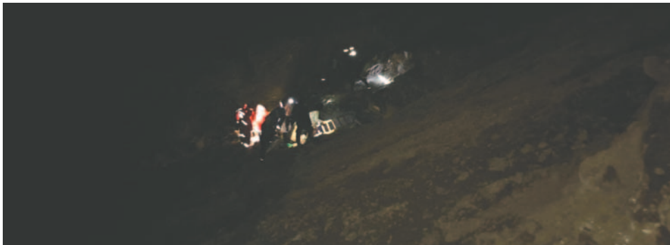
Anoche continuaban los operativos de salvamento

mayor detalló que la zona se encuentra inestable, lo que dificulta el trabajo. Los uniformados del "verde olivo" continuaron las labores de salvamento y rescate hasta el cierre de la presente edición.