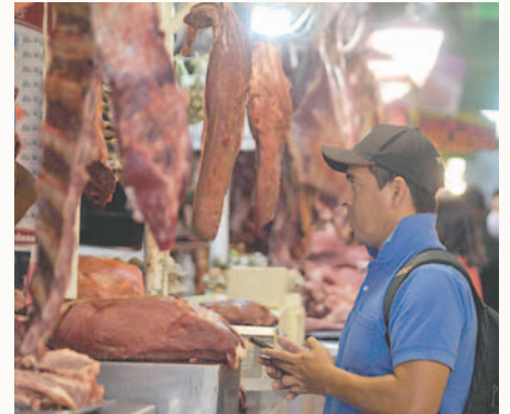
La carne de res se volverá a vender en los mercados /REFERENCIAL