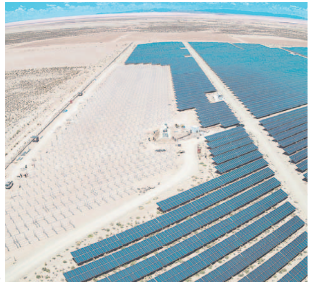
La Planta Solar Fotovoltaica Uyuni registra una ejecución física del 50%.

una importante inversión en infraestructura energética que beneficiará a diversas comunidades al proporcionar acceso a energía limpia y sostenible.