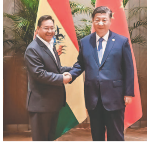
Los presidentes de Bolivia, Luis Arce, y de China, Xi Jinping

Ya en julio, los gobiernos de Bolivia y Brasil acordaron reimpulsar este Co-