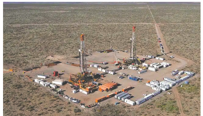
Yacimiento Vaca Muerta, en Argentina.

El grupo de trabajo analizará posibles rutas para que el gas llegue a Brasil, incluyendo la inversión del flujo del gasoducto de Bolivia, una ruta que pase por Paraguay y otra por Uruguay, dijo una fuente, que agregó que los países también analizarán la posibilidad de una