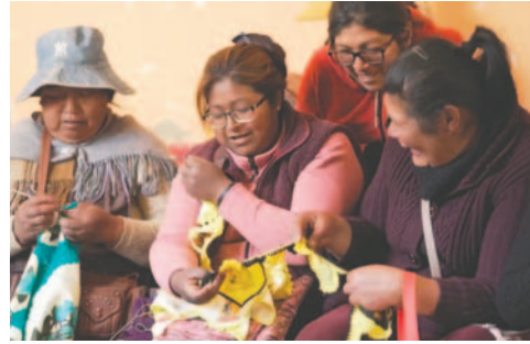
Las mujeres han creado una red que ha pasado incluso a otras comunidades cercanas de Bolívar

Además de su función como defensoras de la comunidad, las amas de casa han impulsado el desarrollo de los jóvenes de Bolívar. El colegio Vicente Donoso Torres, en colaboración con Sinchi Wayra, se ha destacado en eventos deportivos y culturales, gracias a un