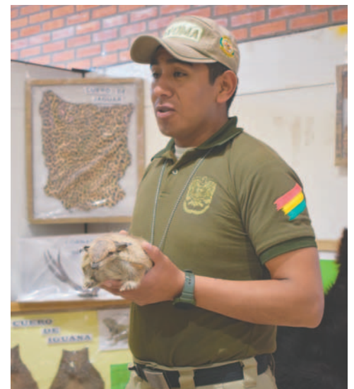
A pesar de las recomendaciones una matraca de quirquincho fue incautada recientemente

El efectivo policial detalló que, a pesar de las muchas actividades de socialización y concientización que se realizan, recientemente en la entra-