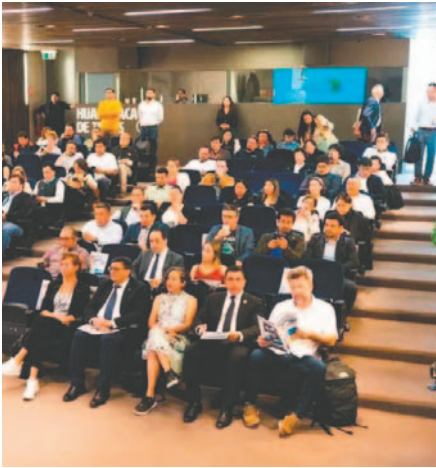
Los resultados fueron presentados durante un conversatorio realizado en el auditorium de las Ruinas de Huanchaca. VISIÓN SUSTENTABLE