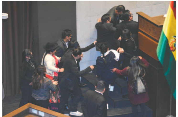
De nuevos los “evistas” provocaron altercados en la sesión

Quispe anunció que presentaron una acción