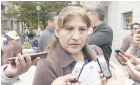
Proprietarios de locales rechazan nueva ley

Asimismo, aclararon que el sector trabaja con el Decreto Municipal 114 de Reglamento de Control al Expendio y Consumo de Bebidas Alcohólicas del órgano Ejecutivo en el Gobierno Autónomo Municipal de Oruro (GAMO), por lo que resaltaron la decisión del alcalde de observarla.