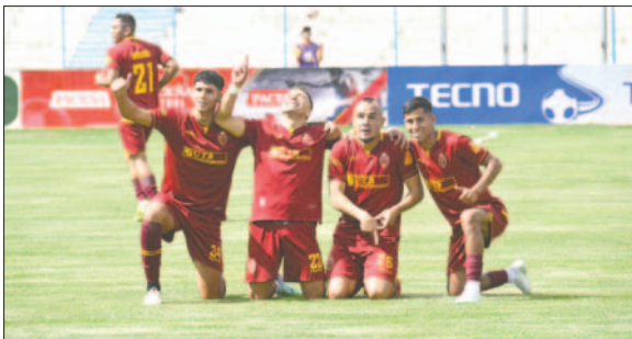
Los jugadores consideran que con entrega se puede ganar en Sucre

El conjunto orureño emprenderá viaje este viernes a Sucre, donde el sábado desde las 17:00 horas en el estadio Patria, se disputará el encuentro. Se sabe que Universitario espera a CDT Real Oruro, con toda su estantería para buscar la clasificación a la próxima instancia del certamen. Por todas esas características que envuelven este encuentro, el mismo está catalogado como de pronóstico reservado.