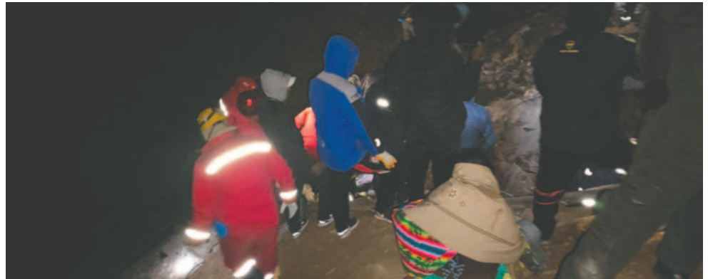
Bomberos y familiares del afectado iniciaron las labores de rescate

Uniformados de la Policía, junto a familiares, efectuaron las labores de rescate, pero no tuvieron buenos resultados. Ya cerca del mediodía, funcionarios de Bomberos "Calama" coadyuvaron con las labores de salvamento. El director departamental de Bomberos "Calama", ma-