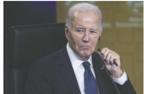
El presidente de Estados Unidos, Joe Biden

La CPI no tiene una fuerza policial para arrestar sospechosos, pero sus 125 Estados miembros, entre los que están Reino Unido y