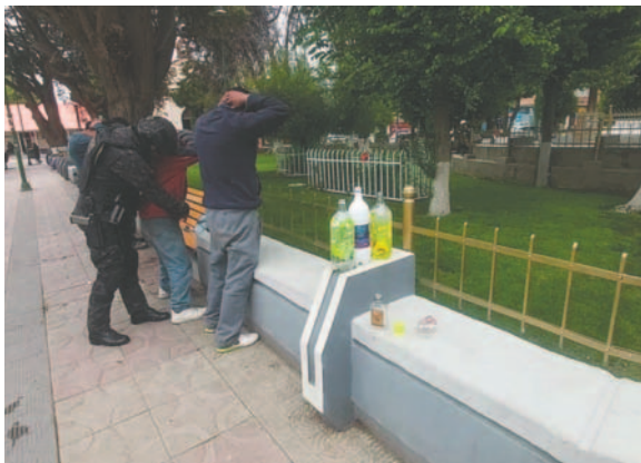
Agentes del GTS intervinieron en varios sectores de la urbe oreña

Mediante el Patrullaje Preventivo Motorizado del Equipo Especial de Reacción Inmediata “GTS”, se llevaron a cabo cuatro intervenciones en cumplimiento a las instructivas del Comando Departamental de Policía. Aproximadamente a las 08:55 horas, sobre las avenidas Ejército Nacional y 6 de Agosto, se procedió a retirar a seis bebedores consuetudinarios que molestaban a los transeúntes y conductores. Se les instó a limpiar el lugar donde ingerían bebidas alcohólicas antes