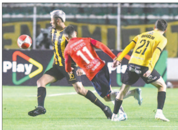
The Strongest reaccionó a tiempo y pudo revertir ante Wilstermann