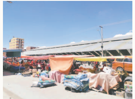
GAMO emprende tareas para ordenar el mercado Kantuta