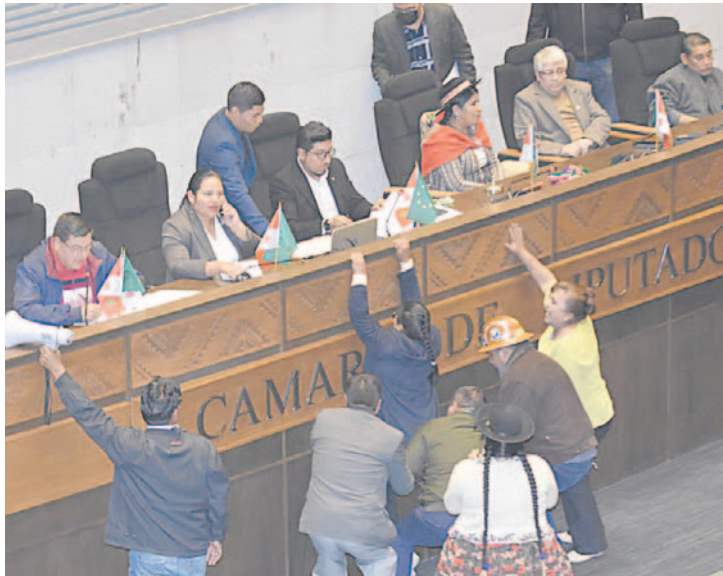
Ayer se registró un nuevo intento de toma de testera durante la sesión

La parlamentaria indicó que el reglamento de la Cámara de Diputados prohíbe a los legislado-