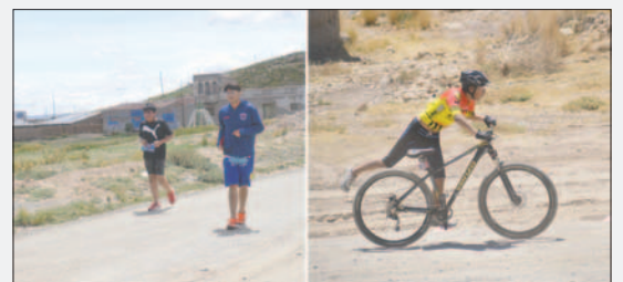
Los triatletas se estuvieron preparando para lograr los primeros puestos

La dirigencia del triatlón orureño viene ultimando detalles para que el evento sea todo un éxito y que la gente que llegue de diferentes regiones del país pueda sentir el cariño de la población orureña.