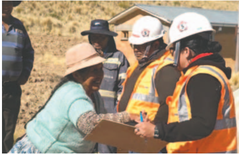
Las amas de casa de la región son parte fundamental de esta sociedad minera

Como integrantes de la Confederación Nacional de Amas de Casa Mineras (CONACMIN), estas mujeres no solo gestionan el hogar y la crianza, sino que