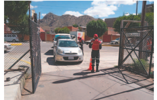
Las puertas del campo ferial son bien custodiadas

La reacción inmediata con la que trabajan los personeros de Dinastía permitió que menores que se habían separado de sus padres durante su recorrido por Expoteco pudieran reunirse en el menor tiempo posible con sus progenitores. Asimismo, se evita el ingreso de personas en estado de ebriedad y se