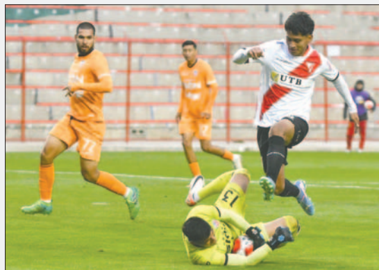
El "millonario" le pasó por encima a Royal Pari en El Alto