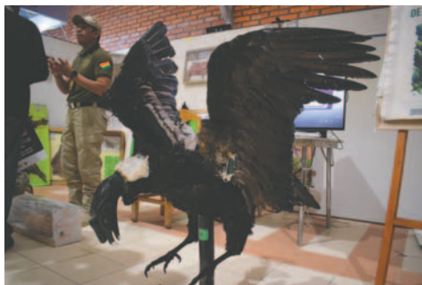
Un cóndor disecado que fue decomisado el pasado carnaval

Actos de Crueldad y Maltrato Animal, la Ley 553 para Control de Razas Peligrosas y la Ley 1525 que protege al cóndor andino y a todos los animales silvestres del país.