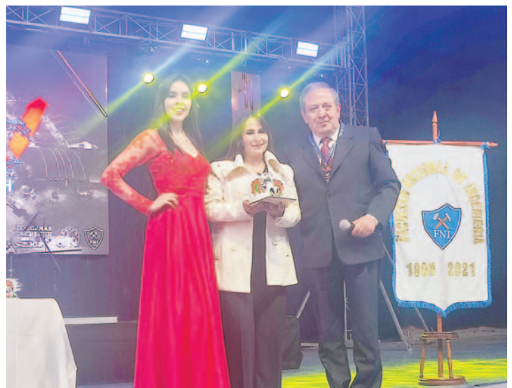
La representante de Toyosa recibió el reconocimiento a Promoción Empresarial