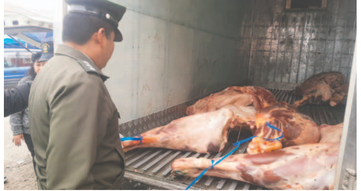
Incautaron la carne en descomposición tras operativo en el centro de abasto

Si bien no hubo personas aprehendidas, “Se va a solicitar el informe pertinente a la Policía, en virtud de que se tiene conocimiento de que habrían sido trasladados a la Felcc (Fuerza Especial de Lucha Contra el Crimen)”, sostuvo.