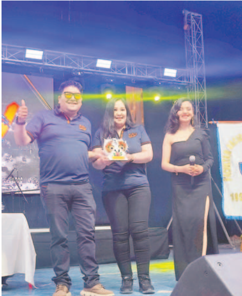
Mundo Plomero fue reconocido como Mejor Innovación

CALIDAD , inversión e innovación fueron premiadas en Expoteco