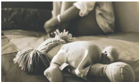
La justicia determinó que el joven cumpla la sentencia en Palmasola