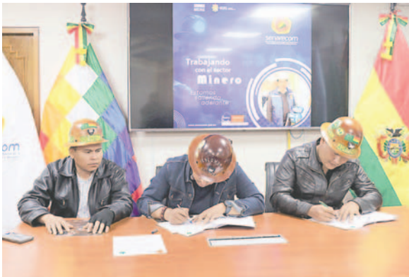
El convenio pretende mejorar los procesos de registro y control de la comercialización de minerales y metales

lucradas. Esto incluye potencialmente mayores ingresos para las cooperativas y un fortalecimiento del tejido social en la región.