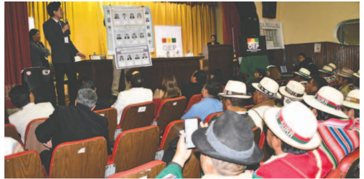
Foros informativos salen de la ciudad y llegan a otros municipios

El 15 de diciembre en Oruro se elegirá magistradas y magistrados para el Consejo de la Magistratura, Tribunal Agroambiental, Tribunal Supremo de Justicia y Tribunal Constitucional Plurinacional.