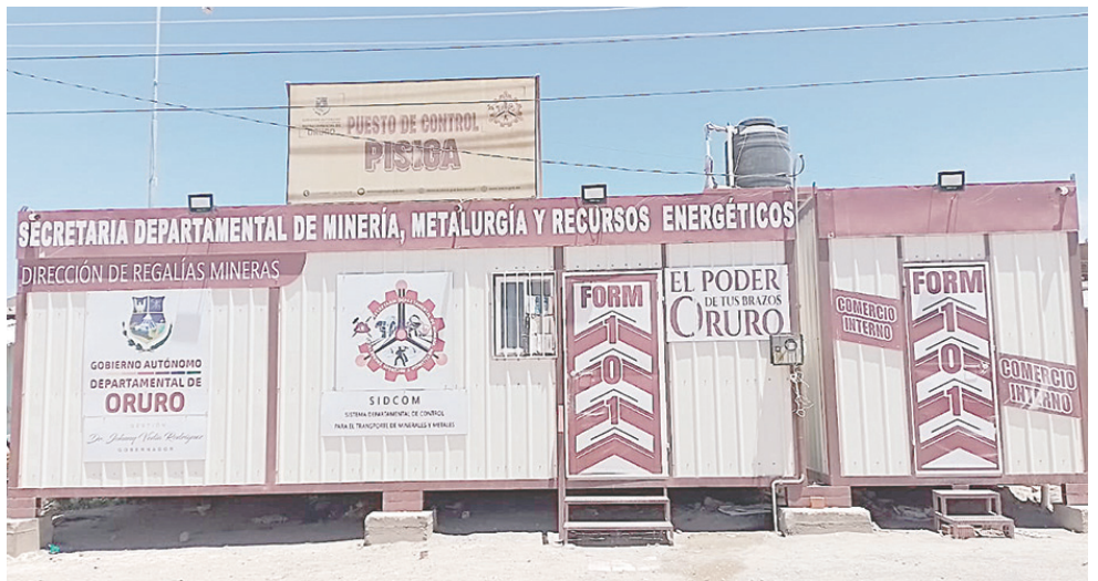
La Gobernación estableció seis puntos de control en Oruro, entre ellos en Pisiga /Gador

Entre las estrategias para obtener un mayor ingreso por regalías mineras está optimizar los controles a los actores mineros mediante los nuevos decretos departamentales que se aplicarán desde el 1 de enero de 2025, que se suman a