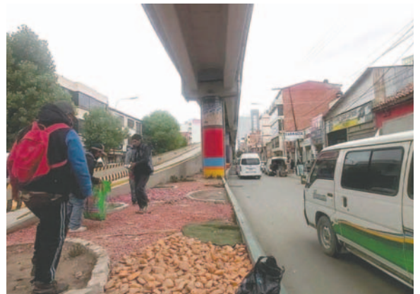
Los bebedores consuetudinarios cumplieron tareas de limpieza

Asimismo, a las 11:10 horas, en la zona Sur, se interceptó a cinco bebedores consuetudinarios sobre la Plaza Luis Mendizábal, frente al Cementerio General y la U.E. Ignacio Sanjinés I. Tras recibir recomendaciones, fueron retirados por seguridad de los asistentes al Camposanto y estu-