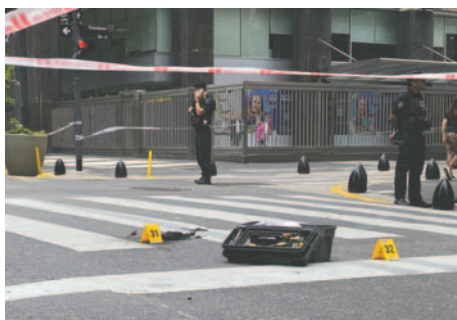
Fotografía de un cordón policial alrededor de un dron caído frente a la Embajada de Israel (al fondo), este jueves en Buenos Aires (Argentina)

Un dron de uso doméstico cayó y se incendió ayer a unos 30 metros de la Embajada de Israel en Buenos Aires, desencadenando un amplio operativo policial. La ministra de Seguridad, Patricia Bullrich, confirmó que el incidente no fue un ataque, sino resultado de la imprudencia de un usuario particular.