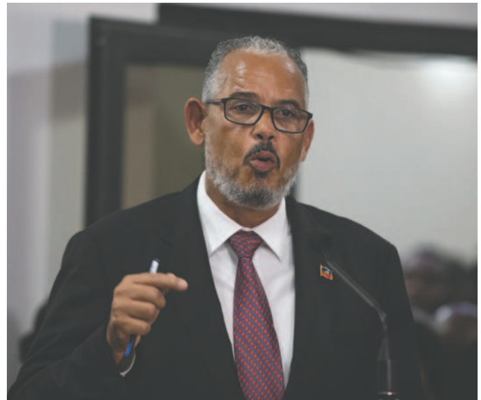
El primer ministro de Haití, Alix Didier Fils-Aimé

El primer ministro, que toma estas medidas en momentos en que los grupos armados han lanzado una nueva ofensiva destinada a sembrar el terror en todo el país, animó a los ciudadanos a participar "en la labor de estabilización de la paz social".