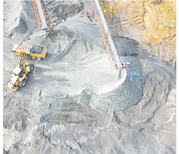
La firma establece mecanismos de colaboración que buscan optimizar los procesos relacionados con la comercialización en el sector minero.

La colaboración entre Senarecom y Fedecomín Beni R.L. es vista como un paso importante hacia