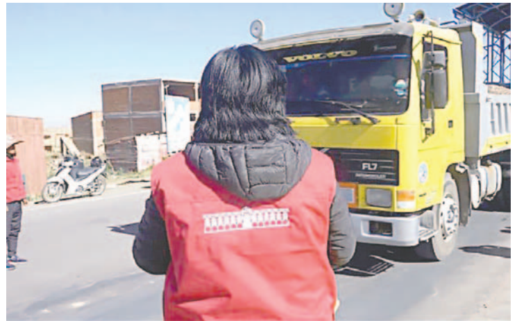
Pretenden optimizar los controles para lograr mejoras sustanciales en ingresos por regalías mineras /Gador