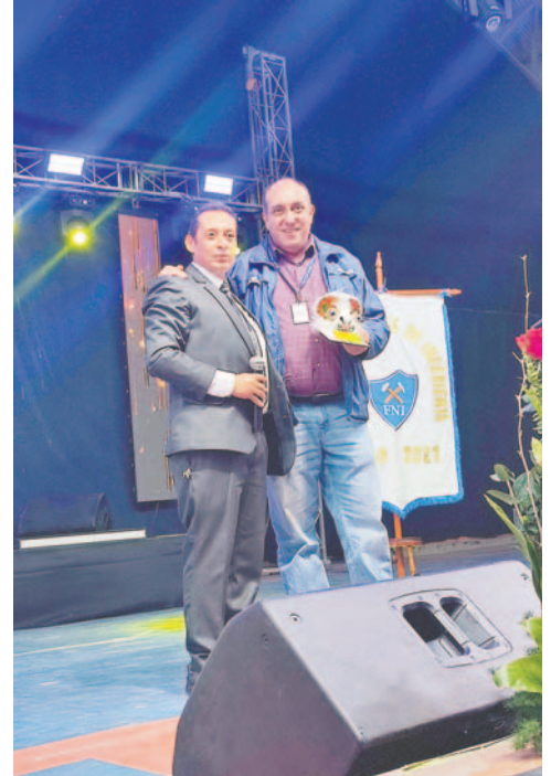
El matutino LA PATRIA fue premiado por su trayectoria en Expoteco

Los ganadores en las diferentes categorías son: Mejor stand automotor: Donnel Motors S.R.L.; Mejor stand de telecomunicaciones: Empresa Nacional de Telecomunicaciones (Entel); Experiencia familiar: Empresa Pública Productiva Cementos de Bolivia (Ecebol); Mejor experiencia de moda y estilo: Boutique Kolla; Stand interactivo: Empresa estatal Cartones de Bolivia (Cartonbol); Bien social: Aldeas