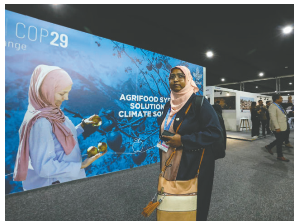
La cumbre del clima en Bakú es un espacio lleno de color e innovación donde se presentan iniciativas globales contra el cambio climático

Árboles de plástico reciclado, tapices multicolores y mosaicos asiáticos adornan este evento que busca salvar el planeta. Un pasillo decorado con fotos enormes da paso al pabellón internacional más concurrido.