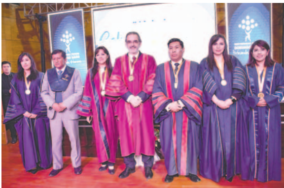
Autoridades regionales y nacionales estuvieron presentes en el acto

De la Facultad de Ingeniería fueron 12 los graduados de la carrera de Ingeniería en Redes y Telecomunicaciones; de Ingeniería en Gestión Ambiental fueron tres y cuatro de Ingeniería Industrial.