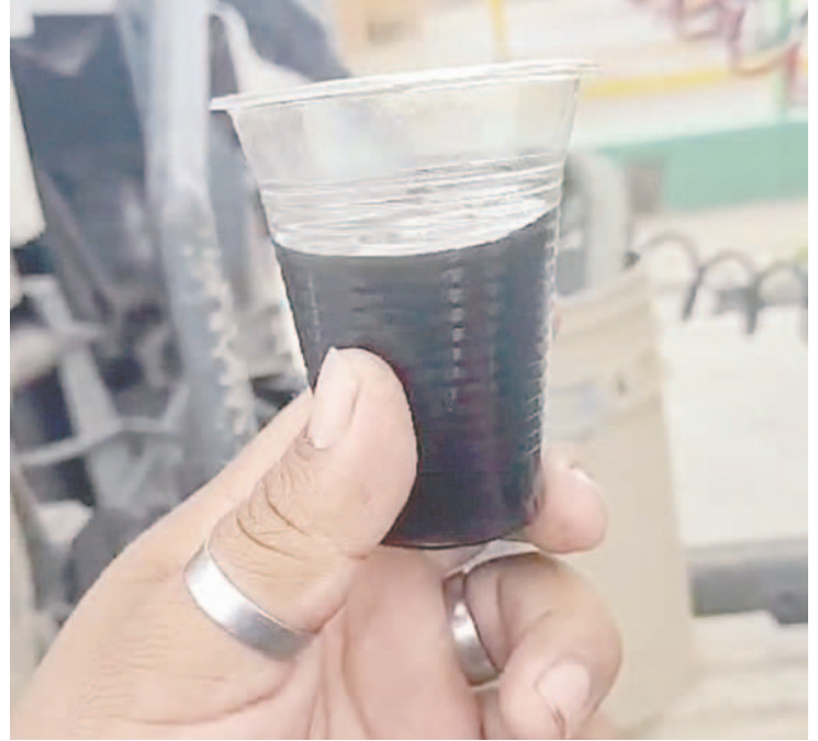
Conductores sacaron diésel de sus vehículos y denunciaron que fue adulterado

El sector tendrá un ampliado nacional para determinar las medidas con relación a la escasez de combustible y la venta