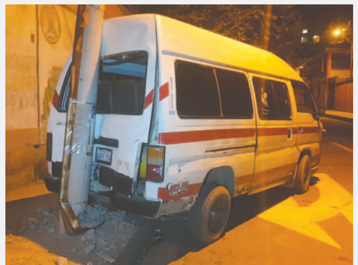
El vehículo fue encontrado de esta manera

Según versiones preliminares, presuntamente el conductor festejó durante el aniversario de los minibuses y aparentemente manejaba en estado de ebriedad.