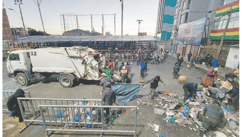
Los carros recolectores se retrasan por falta de diésel /EMAO

LA PATRIA La escasez de combustible en estaciones de servicio, afecta el recojo domiciliario que hace la Empresa Municipal de Aseo Oruro (EMAO), principalmente los lunes, miércoles y viernes que son días que suelen esperar varias horas para hacer el carguío, lo que retrasa su trabajo.