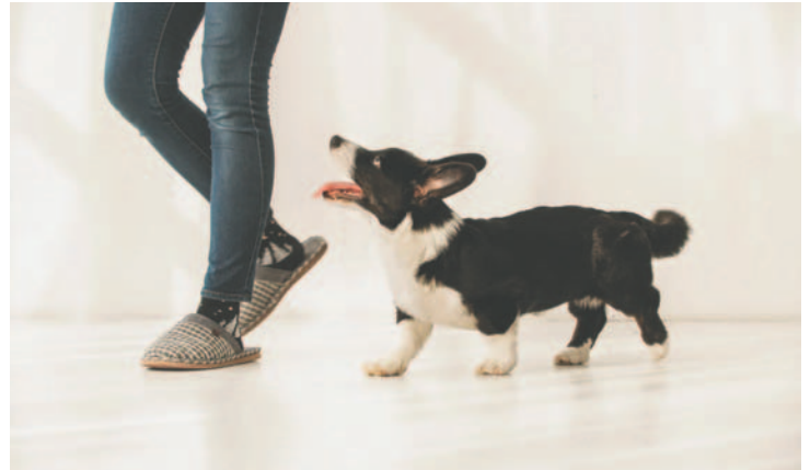
Este comportamiento en muchos casos debe ser corregido

noticiasambientales.com Los perros son considerados grandes amigos y compañeros de los humanos, por lo que no resulta nada extraño que una vez que se forme el vínculo entre ellos, estos animales de compañía no dejen de seguir a sus amos por cada rincón de la casa.