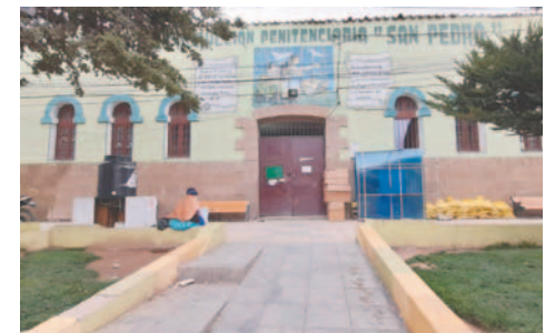
Ambos fueron enviados a San Pedro tras ser aprehendidos con más de cinco kilos de droga

La autoridad fiscal detalló que ambos implicados refirieron tener su domicilio en la localidad de Eucaliptus,