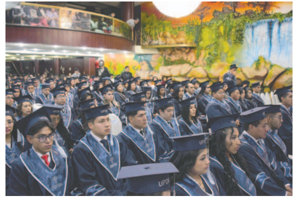
85 nuevos profesionales están listos para aportar a la sociedad

"A estos nuevos profesionales les diría que se capaciten constantemente, independientemente de la situación del país, porque va a pasar, las crisis son cíclicas, es complejo, pero va a pasar y será por personas como ellos que creen en la educación, en su ciudad y su país. Actúen siempre primando los valores que trajeron de casa y que no-