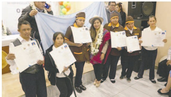
Entrega de certificados de competencia a estudiantes con discapacidad

En el acto, la viceministra manifestó que a nivel nacional se realizaron la entrega de 250 certificados de competencia en varios