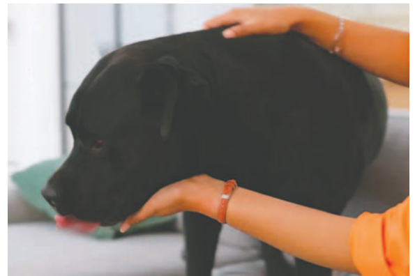
Los canes tienen fuertes emociones hacia sus dueños

En resumen, que los perros sigan a sus dueños por todas partes es una muestra de afecto y confianza, pero también es importan-