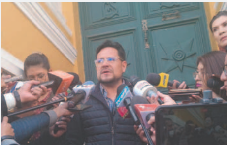
El diputado de CC; Marcelo Pedrazas

En su carta, Pedrazas solicita agendar el tema en la siguiente sesión "al amparo del derecho a la Petición (Art. 24 de la CPE) y el Art. 48 (Comisiones Especiales) del Reglamento General de la Cámara de Diputados". La semana pasada, la directiva determinó convocar a sesión ordinaria