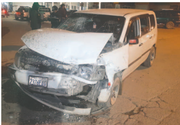
El chofer de la vagoneta manejaba en estado de ebriedad cuando se reportó la múltiple colisión