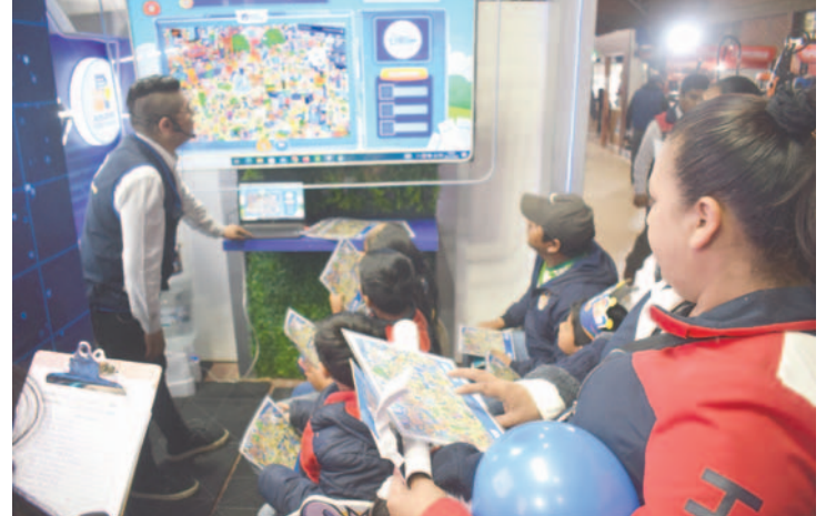
Varias instituciones apostaron por juegos para que participen todos los asistentes

“Nos encantaría poder reconocer el trabajo y esfuerzo de cada una de las empresas que han participado, pero son muchas, y tenemos que escoger a más de una quincena de premios que serán entregados en la tarde dorada”, detalló la ejecutiva.