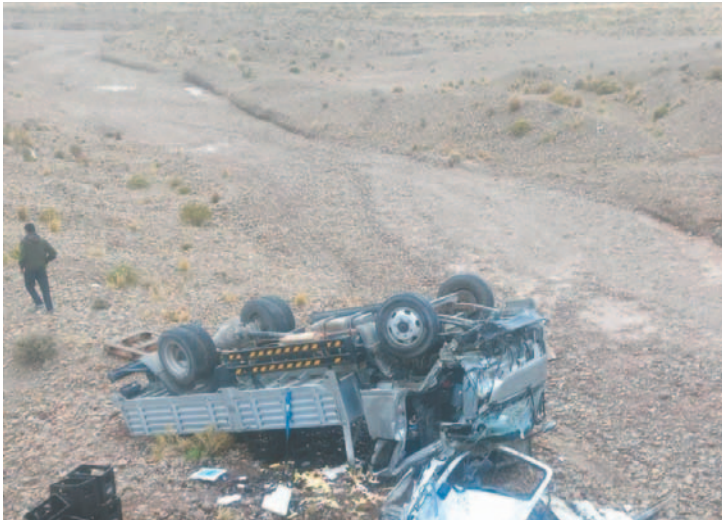
Tras chocar la baranda metálica, el vehículo volcó en tonel