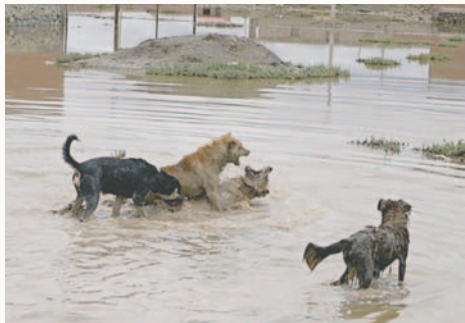
Canes abandonados generan preocupación