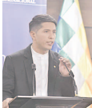
El presidente del Senado, Andrónico Rodríguez

Siles recordó que existe el auto constitucional 0250, que declaró nulos los actos realizados en la séptima sesión ordinaria de la Asamblea Legislativa Plurinacional (ALP), donde fue aprobada la Ley 075 de cesación de