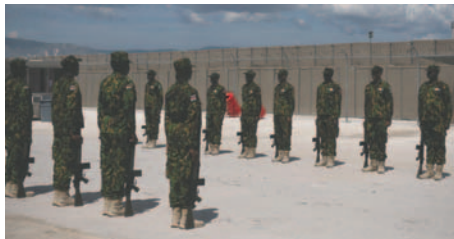
Archivo, agentes de la policía keniana formando en la base de la Misión Multinacional de Apoyo a la Seguridad (MMAS), en Puerto Príncipe (Haití)

La propuesta de transformar la Misión Multinacional de Seguridad en una fuerza de paz clásica de cascos azules en Haití fue rechazada por Rusia y China durante una sesión del Consejo de Seguridad de las Naciones Unidas, impidiendo así su implementación a corto y medio plazo. La oposición se basa en la falta de legitimidad del actual Gobierno haitiano y las lecciones negativas de misiones anteriores, como la Minustah, que dejó un legado de abusos y crisis sanitaria. La formación de una Misión Multinacional de Seguridad para apoyar a la Policía haitiana ha sido insuficiente, ya que solo han llegado al país 400 agentes de los 2.500 previstos debido a la falta de financiación.