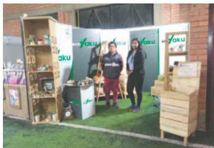
Eco Yaku apuesta por el compostaje y los huertos urbanos /LA PATRIA

"El compostaje ayudará a tener huertos urbanos, donde se producirán alimentos como acelga, orégano, frutillas, choclos y hoja de laurel, entre otros", aseguraron.