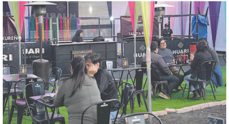
Huari armó un stand dedicado a su cerveza Premium y la gastronomía orureña