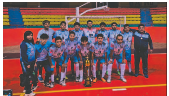
Buena campaña de Urus 2000 en el futsal de Primera de Ascenso

El partido más emocionante fue el que se jugó por el tercer lugar del torneo, donde Deportivo Chasqui y Comunicación Social se enfrentaron