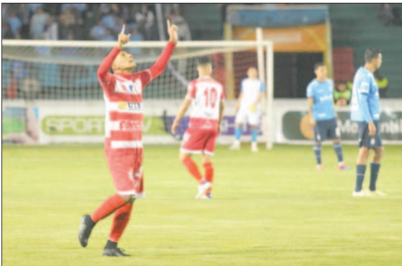
Independiente no desaprovechó las opciones de gol que se le presentaron