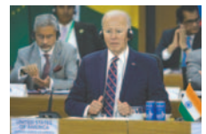
Fotografía del 19 de noviembre del presidente de Estados Unidos, Joe Biden

presidente de la Cámara de Representantes, el republicano Mike Johnson, decidió vetar el acceso a los baños de mujeres del Congreso a la primera legisladora trans, Sarah McBride. Su comunicado indicó que el uso de los baños del Capitolio está reservado para los individuos conforme "a su sexo biológico". En un comunicado, McBride, que fue elegida en las elecciones del pasado 5 de noviembre de 2023, dijo que acatará la norma aunque