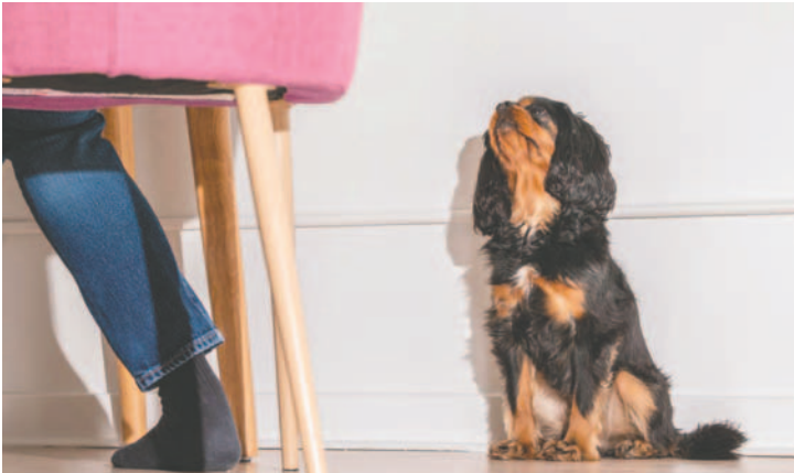
Los perros suelen seguir a sus dueños a todas partes