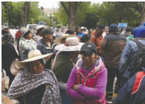
Padres de la Unidad Educativa Bolivia Vinto se movilizaron