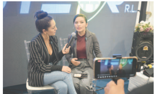
La gerente del Campo Ferial en una entrevista en el stand de Coteor