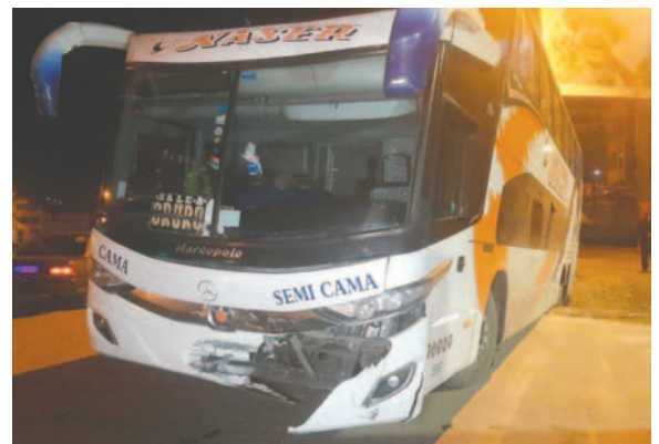
Dos ómnibus resultaron con daños materiales por la impericia del conductor de la vagoneta

a Norte y, por su falta de precaución y su estado de embriaguez, provocó la colisión contra el ómnibus Mercedes Benz. Por el impacto, este chocó un tercer vehículo. “A consecuen-