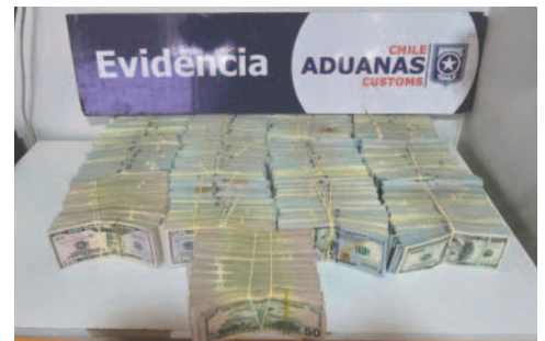
Aduanas incautaron más de un millón de dólares escondidos en un bus que cubría la ruta Cochabamba-Calama

El dinero decomisado en este operativo fue contabilizado y entregado a Carabineros del país vecino bajo estricta cade-