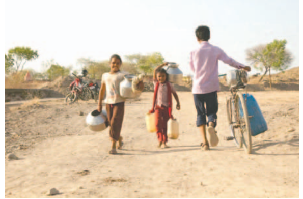
La crisis climática no espera y está afectando a más de 600 millones de niños en el sur de Asia

en la década de 2050, el número de niños en el sur de Asia expuestos a olas de calor será cuatro veces mayor que en el decenio de 2000, el doble en inundaciones fluviales extremas y 1,2 veces mayor en incendios forestales extremos.