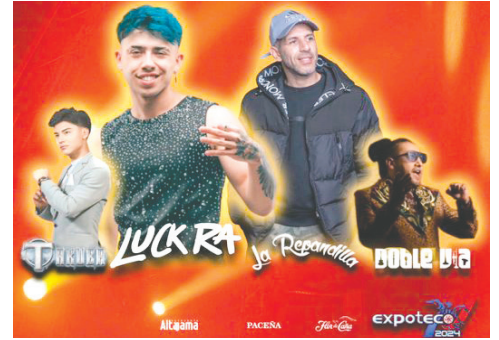
El evento de cierre de Expoteco 2024 será de lujo

Aún existen manillas o entradas a la venta en el restaurante Milamores,