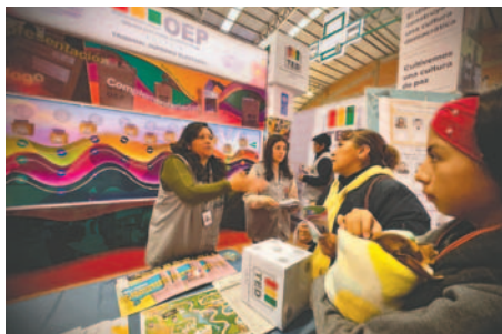
Personal del TED Oruro durante la socialización de elecciones judiciales en distintos espacios