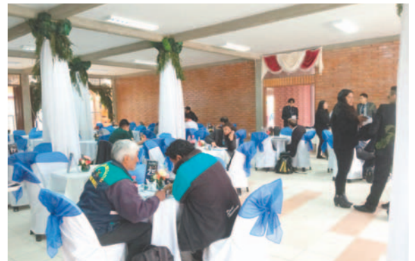
El alcance de la Rueda de Negocios será más adelante cuando se tabulen todos los resultados

“La idea es ayudar a las empresas a conectar, negociar y crecer”, dijo Rodríguez, a tiempo de detallar que se deben hacer mejoras en el manejo de la rueda de negocios.