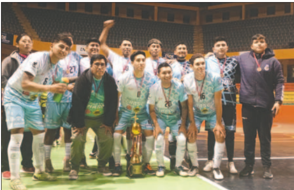
Deportivo Chasqui batalló por su ascenso a Primera de Honor