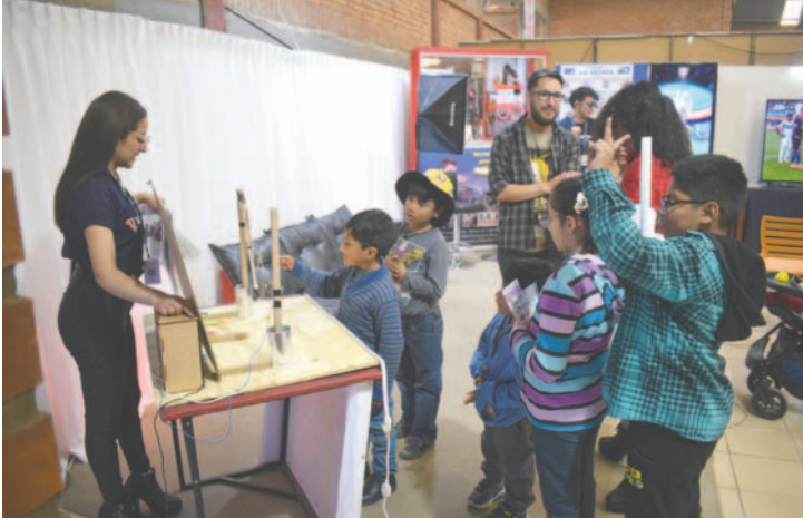
El stand de LA PATRIA fue visitado por varias familias