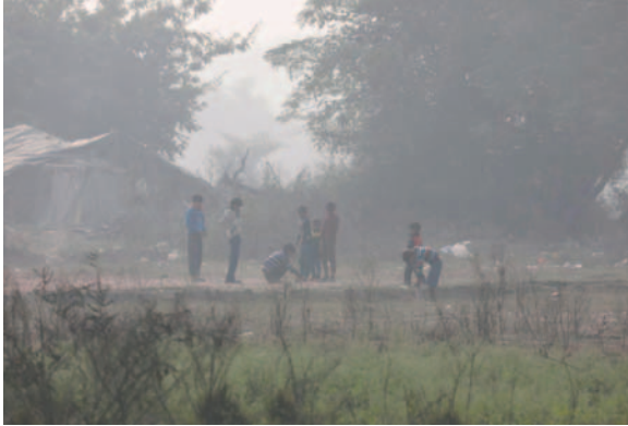
Un nuevo análisis revela que el sur de Asia es cada vez más vulnerable al cambio climático

"La zona de donde vengo en Pakistán es propensa a desastres climáticos frecuentes. El cambio cli-