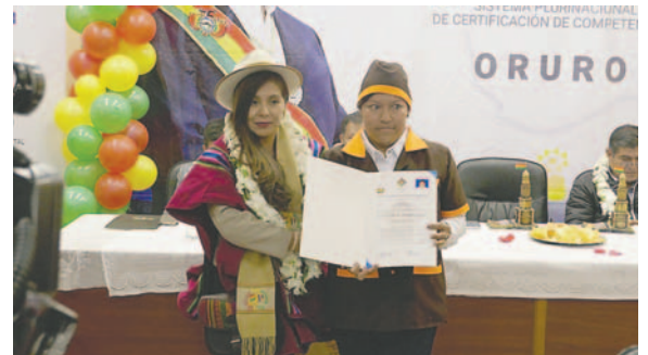
Estudiantes de educación especial se destacan en diversas áreas

que los estudiantes de educación especial demostraron un notable esfuerzo por superarse en diversas áreas ocupacionales, con el objetivo de integrarse de manera efectiva en el campo laboral.