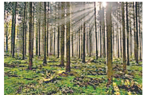
Ambicioso reto se planteó Dinamarca con la plantación de millones de árboles

Cuidar los bosques solo es cuestión de llevar adelante las siguientes acciones: