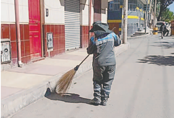
A pesar de los problemas EMAO hace el esfuerzo por cumplir sus tareas /EMAO