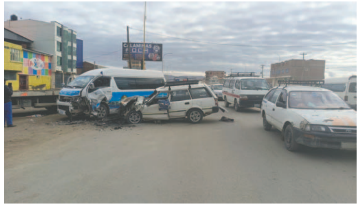
Ambos vehículos terminaron con graves daños materiales

En tanto, ambos conductores dieron negativo al alcoholtest realizado por la Policía. “Está en investigación y puesto a conocimiento del Ministerio Público”, añadió Valdez.