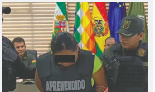
Las cámaras de seguridad grabaron cuando la administradora agredía al menor