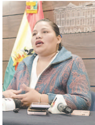
La primera vicepresidente de la Cámara Baja, Deisy Choque

“Creo que es momento de poner un alto a esas actitudes vandálicas que se vienen repitiendo dentro de la Asamblea y que no