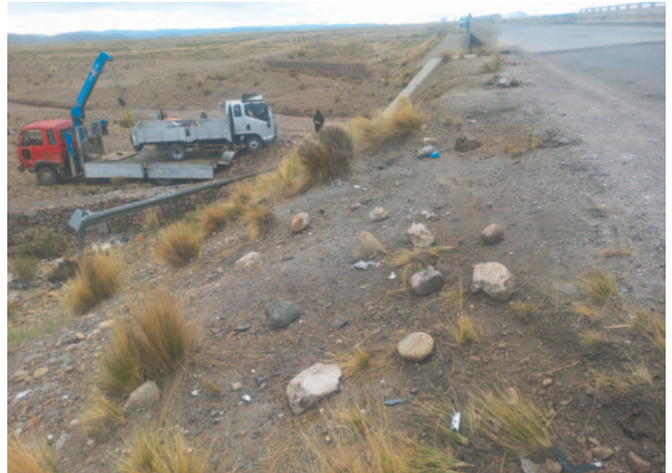
El conductor no salió lastimado tras el accidente vial