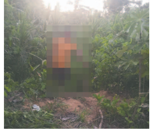
Padre y madre fueron enviados a la cárcel por el infanticidio de la bebé de tres meses /FGE

Los progenitores Ángel y Laura habrían cegado la vida de su hija, que estaba enterrada a unos 300 metros de distancia de su vivienda. Por lo tanto, se procedió a su aprehensión.