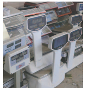
Balanzas decomisadas por Defensa al Consumidor

En ese sentido, la autoridad aseveró que, posterior al decomiso de balanzas que se realice, también se hará la destrucción y, de identificarse la reincidencia de este tipo de falta, se procederá a la imposición de