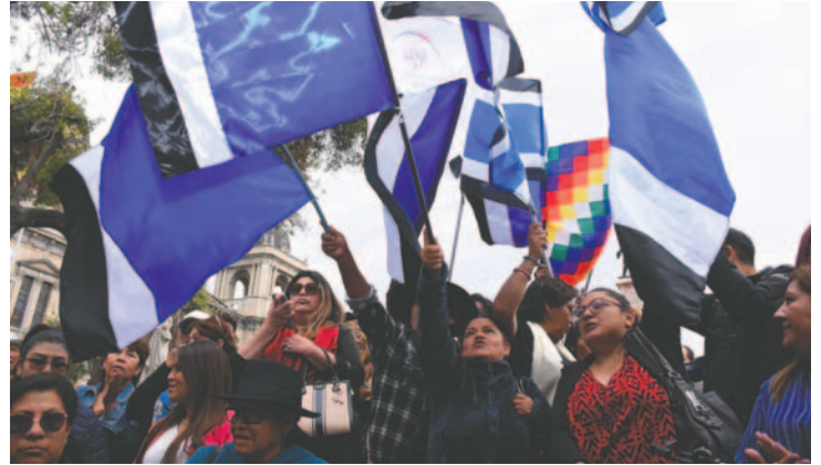
El MAS arcista convocará a congreso para revisar estatutos