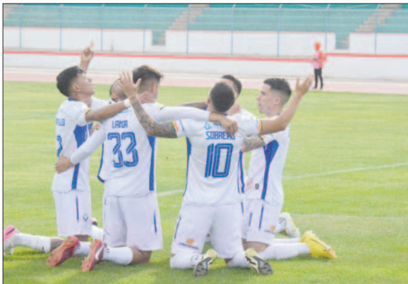
Contundente triunfo del plantel orureño en el reinicio del torneo

En cuanto al tema económico, fuentes allegadas a la dirigencia señalaron que se canceló al primer plantel un porcentaje del monto adeudado, por lo que el equipo hizo una práctica liviana el sábado por la mañana antes de encarar este encuentro, aunque algunos jugadores que prefirieron no ser identificados, aseguraron que la mayoría no están de acuerdo ya que el monto que se les canceló es insuficiente.