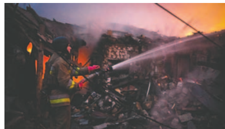
Un nuevo ataque masivo por parte de Rusia ha dejado a varias regiones ucranianas sin electricidad, incluyendo Kiev y Donetsk

"Se está produciendo otro ataque masivo contra el sistema eléctrico. El enemigo está atacando las instalaciones de generación y transmisión de energía en toda Ucrania. El operador