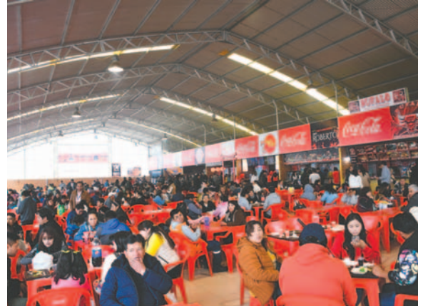
El expendio de comida a tope durante el fin de semana /LA PATRIA

Este 19 y 20 de noviembre se desarrollará la Rueda de Negocios de Expoteco 2024, desde las 10:00 hasta las 17:00 horas, con más de 90 participantes confirmadas entre empresarios, mi-