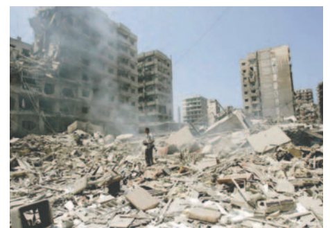
El bombardeo israelí ha dejado como resultado la muerte del portavoz de Hizbulá, Mohamed Afifi, y varios heridos en Beirut

Este ataque específico se produce en la misma jornada en la que Israel ha lanzado una serie de ataques desde las 6:00 hasta las 12:00 horas contra varias localidades en el Sur del Líbano, que han dejado al menos 11 víctimas mortales. El Partido Baaz defiende una ideología nacionalista, de unificación y socialismo panárabe, así como presenta una postura antiimperialista.