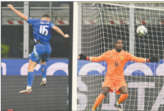
Los italianos no pudieron lograr un buen resultado jugando como local

derrota y mantuviera el liderato. Kean fue el que más cerca estuvo, pero Maignan sacó una mano providencial. Pero el premio a héroe de la noche estaba reservado para otro. Rabiot brilló. Y Francia se quedó el liderato.