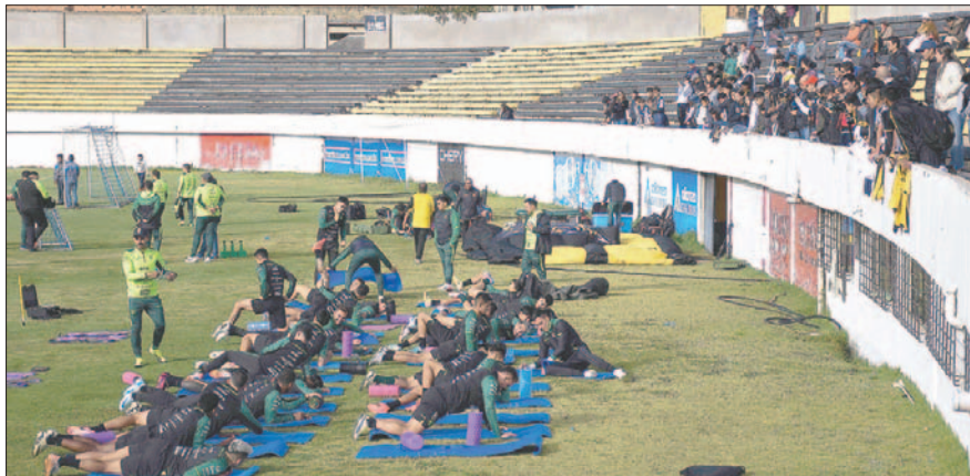
La práctica dominical se realizó en el estadio "Rafael Mendoza Castellón"