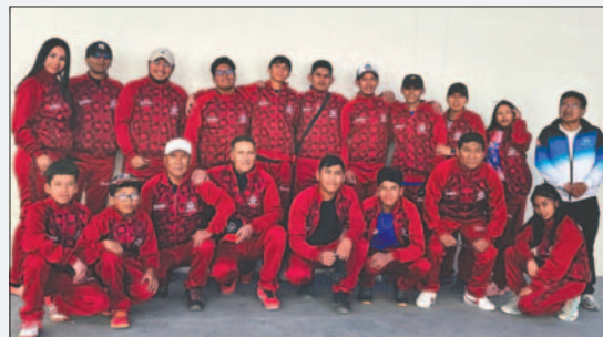
Oruro nuevamente quiere brillar en un torneo nacional de raqueta frontón

Se conoce que Oruro tiene representantes en todas las categorías y la intención es llegar a los primeros lugares. Felizmente, se contó con el apoyo del Gobierno Autónomo Municipal de Oruro (GAMO) para cubrir algunos gastos necesarios para la indumentaria deportiva del equipo y también prever el viaje hasta la capital tupiceña. La delegación tendrá un número aproximado de 30 personas, según indica el reglamento de campeonato.