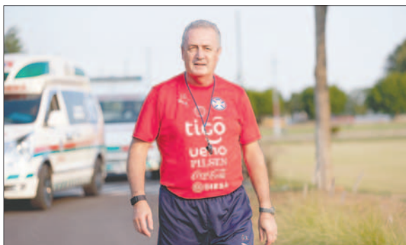
El seleccionador de Paraguay, Gustavo Alfaro

Alfaro, que arrancó su andadura al frente de la Albirroja en agosto pasado, acumula tres victorias seguidas en casa (Brasil, Venezuela y Argentina) y dos empates sin goles ante Uruguay y Ecuador.