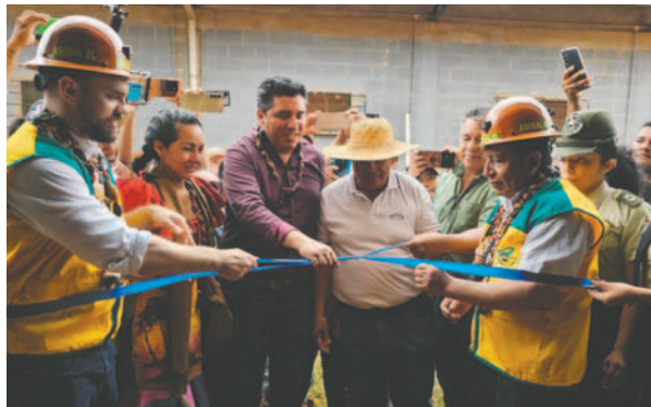
Se inauguró el Centro de Reinserción Social Productivo con el objetivo de mejorar la calidad de vida y reducir el hacinamiento en las cárceles

"Algunos necesitan más ayuda que otros, y nosotros, como Gobierno, tenemos que pensar en todos... Este lugar es un centro para corregir, para ayudarles a los que han cometido errores", señaló