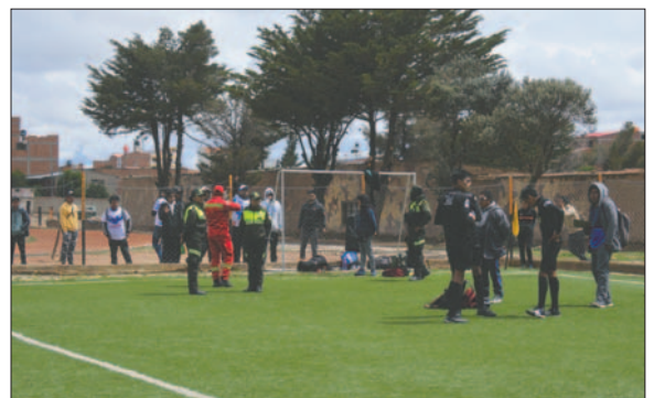
Los hinchas de San José expresaron su molestia con los árbitros