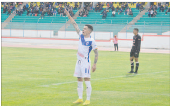
Sanguinetti siempre vital en la estructura del cuadro orureño

Hrs. 20:00.- Santa Cruz: Oriente Petrolero vs. Real Santa Cruz