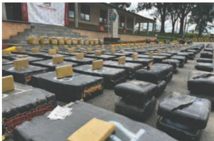
Las autoridades colombianas han logrado incautar siete toneladas de marihuana en el departamento del Cauca, marcando la mayor confiscación desde 2017

Las autoridades han intensificado sus esfuerzos para combatir el narcotráfico en Colombia debido al aumento significativo en los cultivos y la producción relacionados con la cocaína.