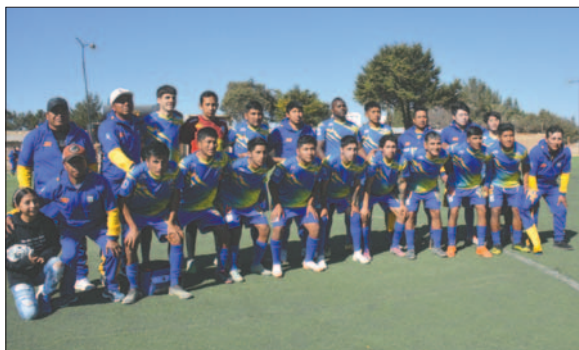
El equipo de EM Huanuni volverá a la Primera "A" el siguiente año

El resultado final del encuentro fue de 2 goles a 0, con lo cual el conjunto del "corazón de estaño" sumó 39 unidades, siendo inalcanzable, por lo tanto, campeón de la temporada 2024, aunque aún no recibió su premio debido a que el torneo debe proseguir por dos fechas más.