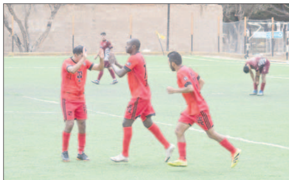
AFIZ de estar comprometido con el descenso, clasificó a Copa "Simón Bolívar"

AFIZ fue la revelación del campeonato. De estar último, se reivindicó llegando a clasificar al certamen nacional.