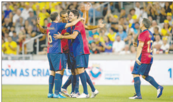
Los exjugadores de Barcelona celebran el triunfo