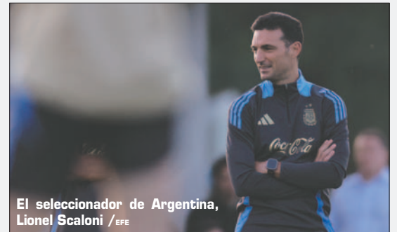
El seleccionador de Argentina, Lionel Scaloni

La Albiceleste recibirá el martes a la selección incaica en el MAS Monumental de Buenos Aires