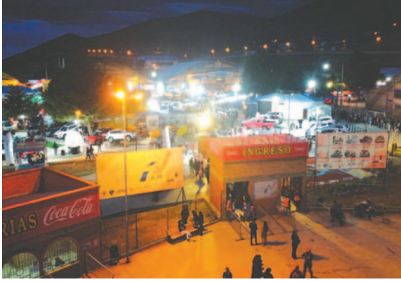
Esta semana hay bastantes promociones para el ingreso a la feria

El miércoles, todos los niños menores de 12 años no pagarán entrada, esto con el fin de promover la tarde familiar. El jueves tendrá ofertas para el público femenino con ingreso gratuito; además, se desarrollará la Tarde Dorada, donde se premiará a los mejores stands. Seguidamente,