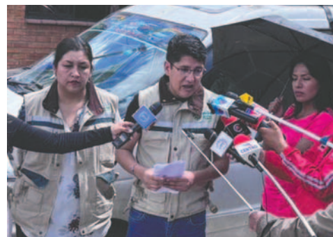
Autoridades de la ANH dan a conocer la información

"En los últimos cuatro días hemos evidenciado gran cantidad de vehículos que están generando acopio de carburantes, esto asciende desde el jueves a más de 40 vehículos (...). Ahora por diferentes tipos