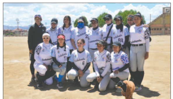
Cochabamba mantiene supremacía en el softbol damas / LA PATRIA

En cuanto al campeonato, el seleccionado de Cochabamba volvió a