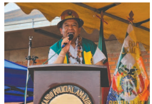
El centro busca mejorar la calidad de vida de los internos

las personas privadas de libertad. La iniciativa busca transformar las antiguas instalaciones carcelarias en