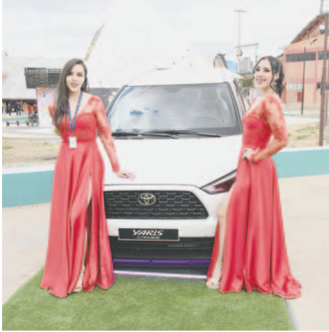
Toyota Yaris Cross 2024, uno de los autos más interesantes del stand