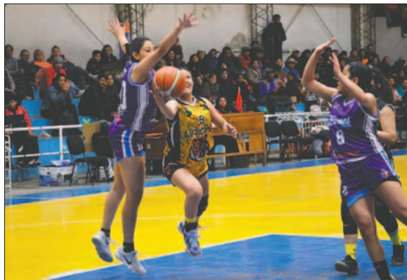
Uriona queda último dentro de su grupo

De momento, el encuentro entre Club Atlético Ramallo Lafuente (Carl A-Z), que debía jugarse ayer en Oruro, sigue suspendido sin fecha definida. Se prevé que el encuentro dará cierre a la primera parte del campeonato para conocer a los semifinalistas.