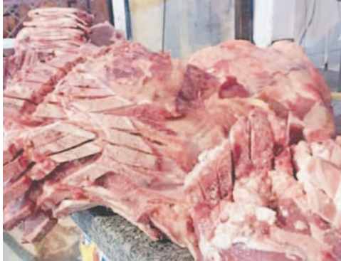
Carne de res estará escasa desde hoy /REFERENCIAL

En la ciudad varios compradores adquirieron el producto en mayor cantidad con la intención de congelarlo o resguardarlo