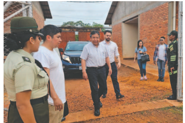
Las autoridades de Gobierno participaron del acto especial /VPEP

En el marco del 182 aniversario de creación del departamento de Beni, esta obra refleja un compromiso gubernamental con la rehabilitación y reintegración social de