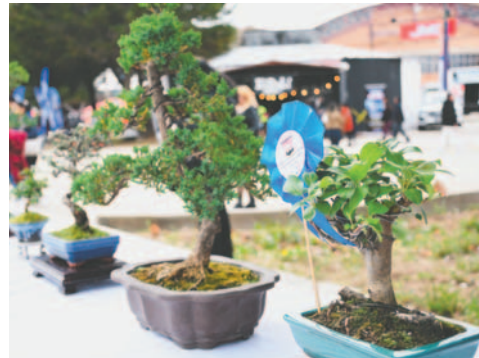
Los pequeños ejemplares cautivaron a los visitantes

El arte del Bonsái tiene su origen en China; nació