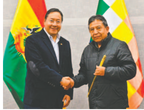
El presidente Luis Arce entrega el Bastón de Mando a David Choquehuanca y viaja a Brasil para participar de la Cumbre del G20

Arce destacó al G20 como "uno de los foros económicos más importantes del planeta y que representa grandes oportunidades para Bolivia". A la cita asistirán varios líderes, mientras que el mandatario ruso, Vladímir Putin,