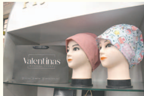
El stand ofrece amplia variedad de productos para el sector salud

La marca trabaja con centros hospitalarios de la ciudad de La Paz, así como con las regionales de la Caja Nacional de Salud (CNS) de Uyuni y Atocha, además de otros departamentos.