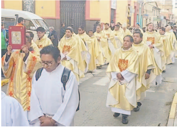
Procesión por el Centenario de la Diócesis de Oruro