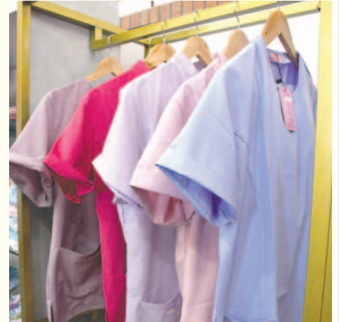
La indumentaria está hecha del mejor material

"Somos una empresa orureña, con un año en el mercado local y nacional. Gracias a la aceptación de la gente, hemos podido expandirnos y lograr ampliar nuestro mercado con una sucursal en la