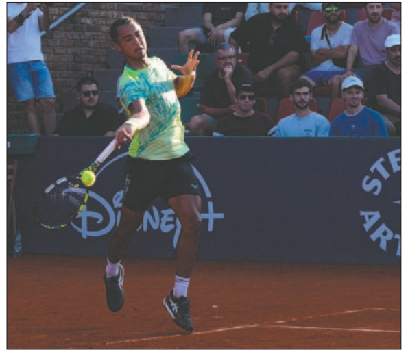
El tenista Boliviano Hugo Dellien no pudo alcanzar el título como en el 2021, finalizó con un digno subcampeonato

Por salir subcampeón del Uruguay Open, Dellien ganó 50 puntos para el ranking ATP y se embolsó 10.730 dólares.