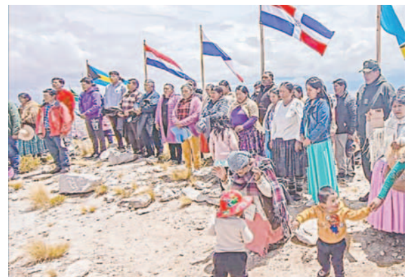
Varias personas subieron hasta el cerro para participar de esta actividad

Los organizadores dieron a conocer trabajos previos realizados para la iza de banderas de