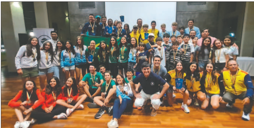
Los equipos participantes en la Copa Cosat, certamen internacional realizado en Santa Cruz

Por el lado femenino, México rivalizó con Brasil y ambas selecciones también mostraron un juego equilibrado, pero las aztecas salieron victoriosas por 2-1.