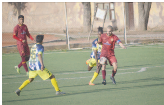
El cuadro realista logró el puntaje necesario para coronarse campeón

Ya por el conjunto Pelé Pequeno Príncipe actuaron exastros brasileños que jugaron con la Canarinha y de otros países que fueron figuras en sus selecciones, como Cafú, el argentino Andrés D'Alessandro y el uruguayo Diego Lugano, que fueron dirigidos por el técnico Mano Menezes.