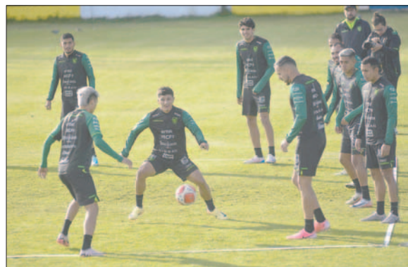
Los integrantes de la selección boliviana durante el entrenamiento de ayer

Una vez más, la práctica de este domingo comenzó con demora. En esta ocasión, el cronograma fue alternado por las inclemencias del clima y hubo un cambio de escena-