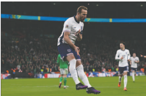
Harry Kane aportó con sus goles para el triunfo de Inglaterra

Grecia, en el otro partido del grupo, también ganó a Finlandia (0-2), pero al tener perdida la diferencia de goles particular contra Inglaterra queda segunda y tendrá que acudir al 'playoff' para estar en la máxima división.