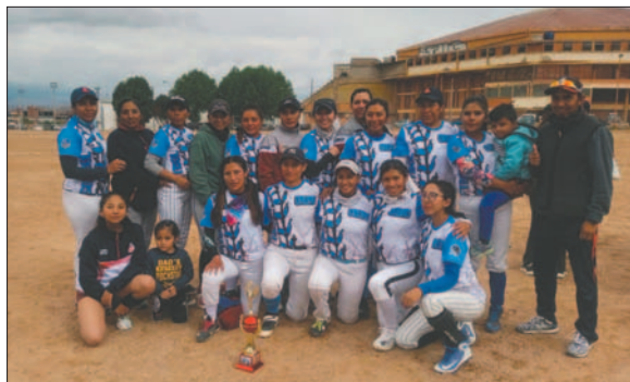
Buena campaña del cuadro orureño, faltó poco para el título

Se tiene la confianza de que el nivel deportivo de las demás selecciones irá en aumento con este proceso que está llevando a cabo la federación boliviana de este deporte. En el caso de Oruro, la entrenadora japonesa estará en el mes de diciembre, por lo que se quiere aprovechar al máximo sus conocimientos.