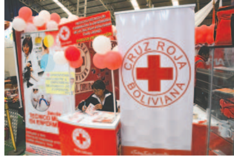
El stand muestra todo el trabajo de voluntariado de la institución

La responsable de la Unidad de Socorro y Desastres de la Cruz Roja Boliviana filial Oruro,