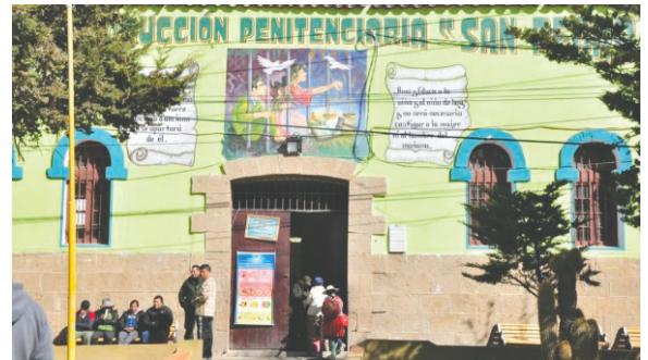
El militar está con detención preventiva en el penal de San Pedro

Preliminarmente, surgió la duda sobre cuatro militares que