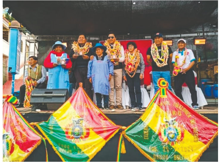
Acto de inauguración del Calvario

Con mucha fe y esperanza, se inauguró ayer la Tradicional Feria Cultural