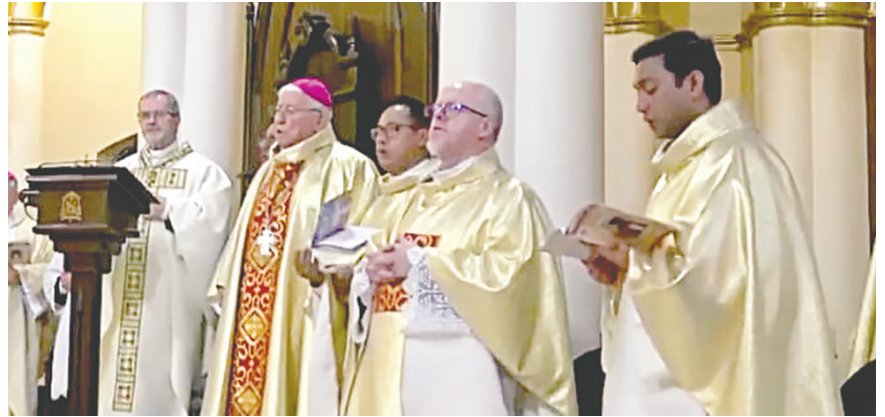
Celebración eucaristía