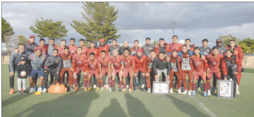
Jugadores de CDT Real Oruro al final del partido, son bicampeones del torneo de la AFO