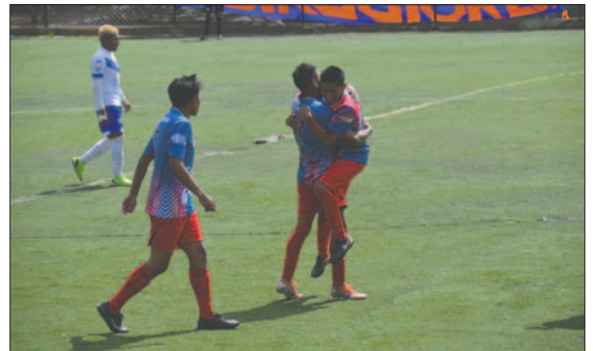
Universidad le quitó a San José la chance del ascenso a la Primera "A"