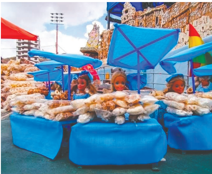
Artesanos del Calvario invitan a la población a asistir

considerado Obra Maestra del Patrimonio Oral e Intangible de la Humanidad.