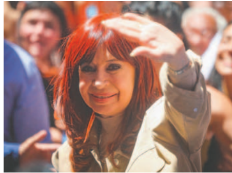
El Gobierno de Javier Milei ha suspendido las pensiones a Cristina Fernández por presunta falsificación de residencia.