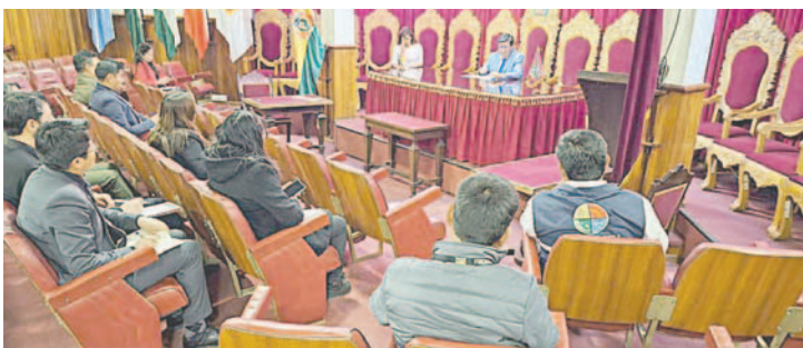
Se confirma la tercera visita carcelaria para el 29 de noviembre