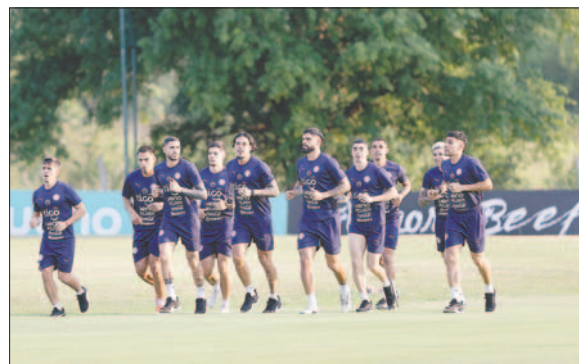
El equipo paraguayó entrenó ayer antes de viajar a Bolivia

En ese sentido, admitió que por ello quiere bajar "los decibeles y po-