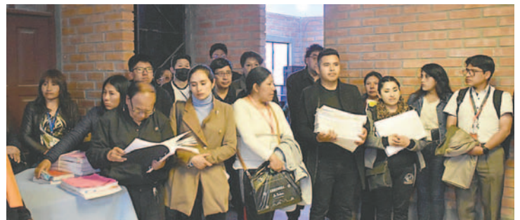
Personal judicial escuchará las solicitudes de los privados de libertad

El alto índice de hacinamiento en el penal de San Pedro es motivo de preocupación para las autoridades, pues hasta el momento el recinto penitenciario alberga a más de 1.500 personas privadas de libertad.