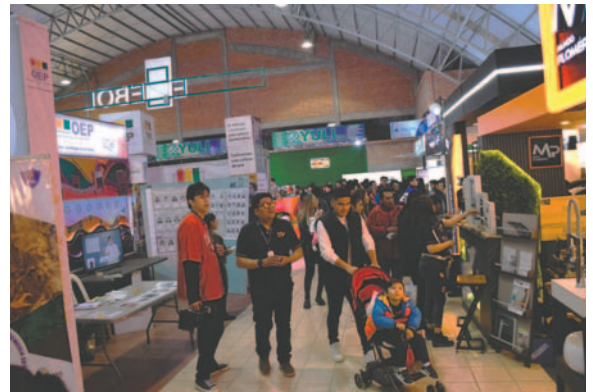
La feria registró pabellones llenos de gente

croempresarios, entidades financieras y lo más destacado de esta gestión: la presencia de inversionistas extranjeros que llegan de Chile y España. Se debe resaltar