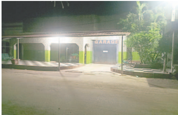
Un librecambista fue víctima de un intento de robo en Guayamerín donde dispararon tres veces sin lograr herirlo

El fiscal departamental del Beni, Gerardo Balderas Arteaga, informó que el Ministerio Público abrió un caso relacionado con este incidente. En la etapa preliminar se colectaron varios elementos, entre ellos el acta de registro del lugar de los hechos y un arma de fuego. “En la etapa preliminar de