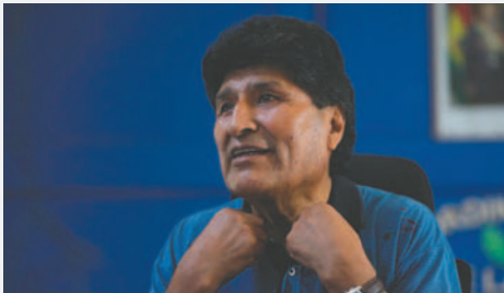
El futuro político está en juego: Según Evo Morales, la próxima reunión nacional definirá mucho más que solo direcciones partidarias

“Para mí, es el segundo golpe a nuestra revolución, a nuestro proceso de cambio, a nuestro modelo económico, pero es sospechoso que sea implementado por el gobierno de Lucho Arce; antes era el imperio o la derecha. Tenemos una lucha ideológica programática, pero hay diferencias de carácter ético en