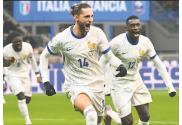
Doblete de Adrien Rabiot para el triunfo de Francia en su visita a Italia

Consiguió la 'Azzurra' neutralizar la inercia francesa en la segunda mitad, pero tampoco consiguió imponerse en un duelo igualado. Y en esas, entre idas y venidas, en una jugada aislada, llegó el tanto de la sentencia, el doblete de Rabiot. Fue