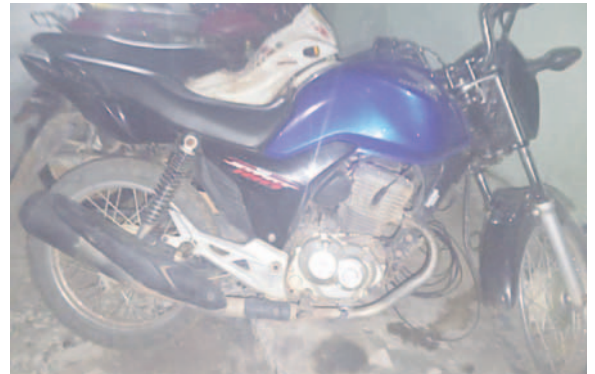
La motocicleta donde se encontraban los dos antisociales

yana Jorge, dio a conocer que el hecho se registró aproximadamente a las 22:30 horas. El librecambista fue interceptado por dos personas a bordo de una motocicleta. En ese momento, el acompañante se bajó y le apuntó con un arma de fuego exigiéndole que le entregara la mochila. Ante la negativa,