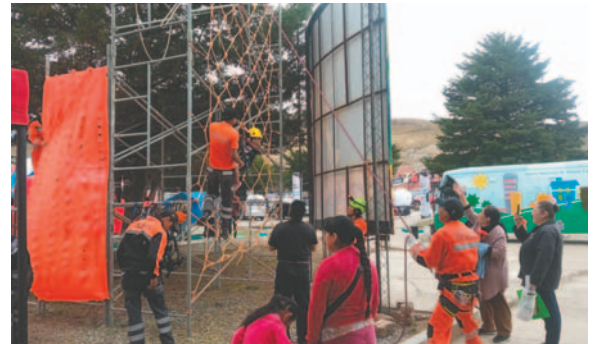
La gente pudo disfrutar de actividades extremas

Al margen del stand en el Pabellón Quirquincho, tienen un espacio en exteriores donde los visitantes pueden escalar, también tienen una tirolesa y descenso de rapel, donde los volun-