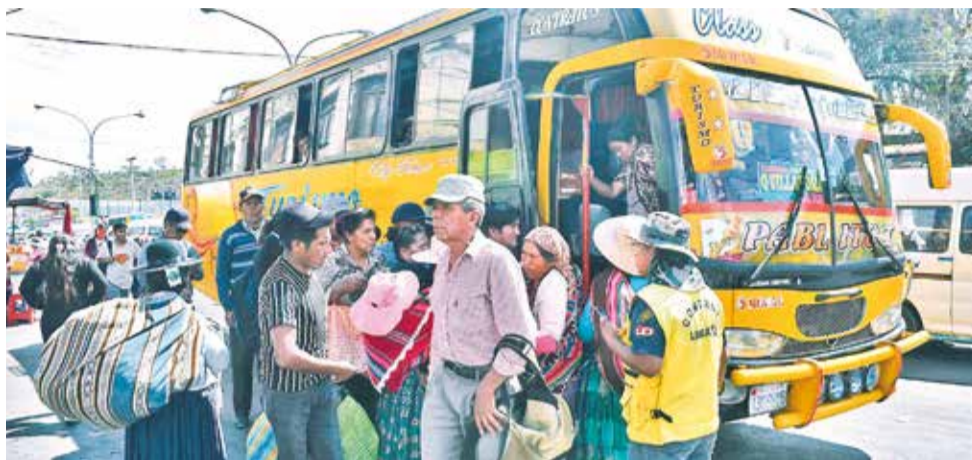
Pasajeros hacen fila para tomar un micro ante la limitación del servicio.

Por su parte, el dirigente de la línea 3V, Tito Vallejos, explicó que sus afiliados no se beneficiaron con la transformación a gas natural vehicular, porque sus motorizados funcionan a diésel por el modelo y para que el motor tenga una vida útil más larga.