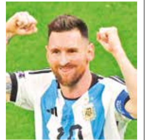
Lionel Messi, figura de Argentina.