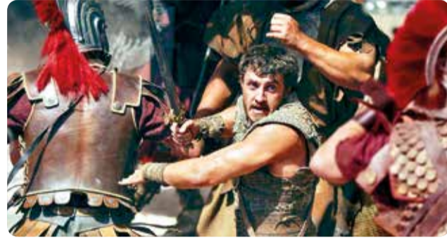
Una escena del filme Gladiator II.