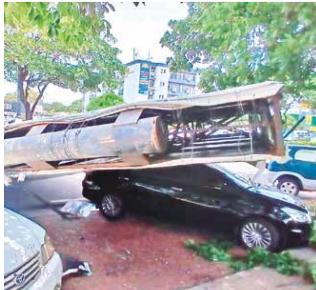
Ventarrones en Santa Cruz ocasionaron desastres.