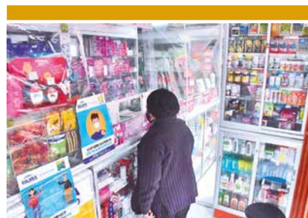
Venta de medicamentos en una farmacia.

La implementación de esta medida será observada de cerca en los próximos meses, ya que será fundamental para determinar si logra estabilizar el suministro de carburantes en el país, tal como anticipan las autoridades y analistas.