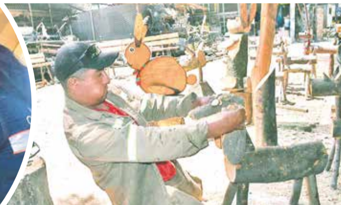
Renos y conejos de Navidad hechos con material reciclado.