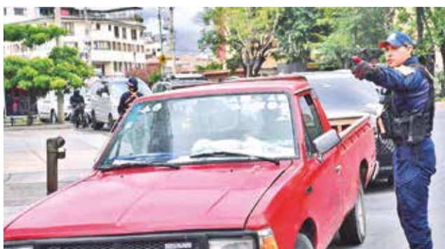
El control de la guardia municipal en un surtidor.