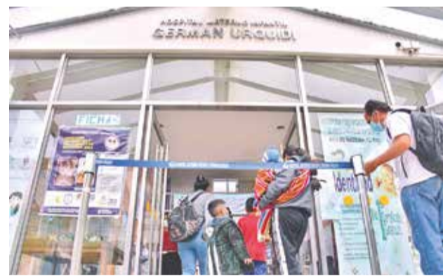
Los ambientes del hospital pediátrico.