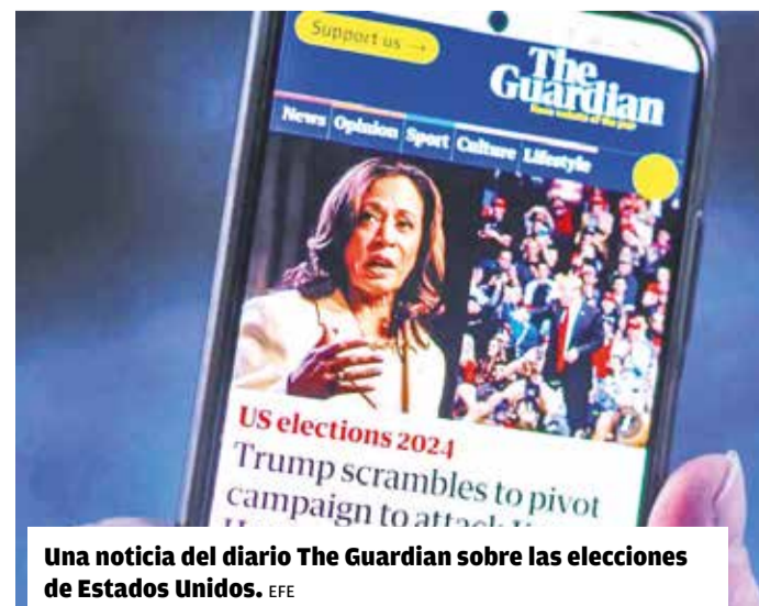
Una noticia del diario The Guardian sobre las elecciones de Estados Unidos.

The Guardian agrega que la reciente campaña electoral en Estados Unidos previa a las elecciones del pasado día 5, que ganó el republicano Donald Trump, “sirvió sólo para subrayar lo que hemos considerado desde hace tiempo: que X es una plataforma tóxica y que su pro-