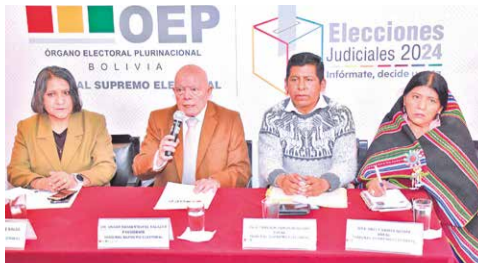
El presidente del TSE, Óscar Hassenteufel, junto a vocales.

El TSE ya había asumido otras medidas legales como una solicitud de aclaración y enmienda al TCP, misma que fue respondida esta jornada con la ratificación del proceso.