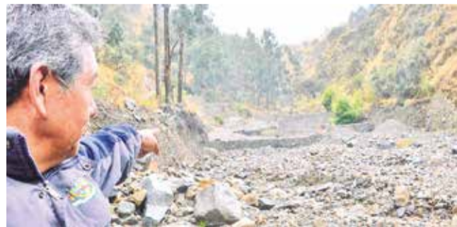
La inspección a las obras en el río Taquiña, ayer.

Inspección. Una comitiva de autoridades municipales verificó el estado de tres cuencas en Tiquipaya por las alertas vigentes