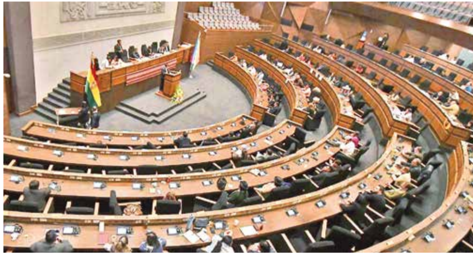
La Asamblea Legislativa Plurinacional, en sesión plenaria. APG

Lo que equivale a decir que los assembleístas tienen un mandato de cinco años que puede extenderse a otro periodo similar de manera continua, no siendo posible pretender, posterior a ello, volver a candidatear y menos ejercer dichas funciones por un tercer periodo