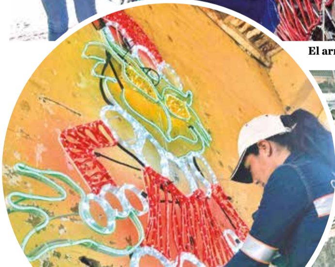
La elaboración de adornos con luces navideñas.