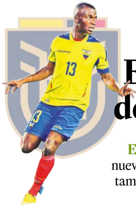
Enner Valencia, referente del ataque de Ecuador.

Eliminatorias. La Verde, con varios rostros nuevos, jugará esta noche (20:00 HB) en Guayaquil, también pensando en el duelo del martes en El Alto ante la Albirroja