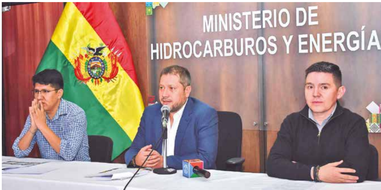
El ministro de Hidrocarburos y Energías, Alejandro Gallardo en conferencia de prensa en La Paz, ayer.