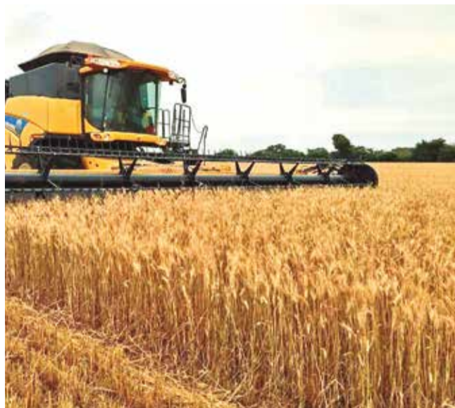
Plantaciones de trigo en el norte de Santa Cruz. EL DEBER

La escasez ha generado preocupación entre los panaderos, quienes dependen de la harina para producir el pan de batalla. En Cochabamba, los panaderos realizaron un paro de 48 horas para exigir al Gobierno un suministro estable de harina subvencionada. Sin embargo, la baja producción