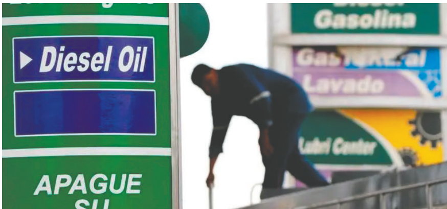
El Gobierno boliviano ha aprobado una nueva normativa que permite importar diésel y gasolina para enfrentar la crisis energética