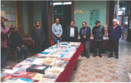
La Feria "Con Vida Propia" en el Hall de la Casa Patiño