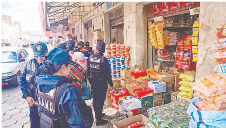
En operativo, se verificó el avance de puestos de venta

Tanto el jefe de la Unidad de Mercados como el de Defensa al Consumidor aseguraron que este trabajo será permanente y que en próximos días se realizará en las distintas calles de la ciudad con el objetivo de ordenar el comercio.