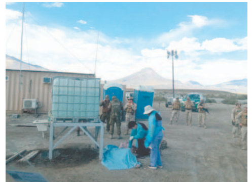
Indagan las causas de muerte de la venezolana en Colchane

Las causas del deceso serán investigadas por el Servicio Médico Legal en Iquique, a fin de determinar las circunstancias en que ocurrió y establecer si hubo responsabilidades de terceros en el deceso. Esta nueva muerte en la frontera reaviva el debate sobre la crisis migratoria