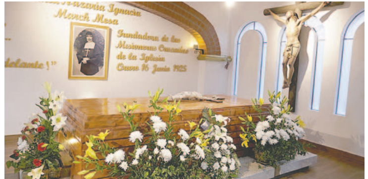
Cripta de Santa Nazaria Ignacia fue ampliada