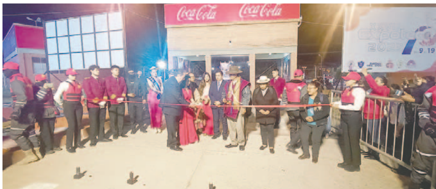
Las autoridades se juntaron en la puerta del campo ferial para cortar la cinta

El encargado del corte protocolar de la cinta fue el gobernador suplente, Ronmie Villca Altamirano, que destacó el alcance de Expoteco. "... siendo una plataforma importante para la promoción de productos regionales a nivel internacional, es importante reconocer el esfuerzo empresarial, lo cual genera un desarrollo económico importante para el departamento" mencionó a tiempo de hacer el brindis de honor y seguidamente al ritmo de la diablada la comitiva de autoridades se trasladó a puertas de Expoteco para el corte de cinta.