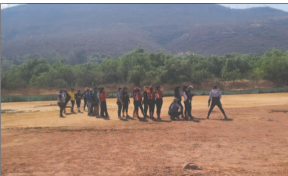
La selección de softbol se prepara intensamente para los Juegos Bolivarianos

La selección boliviana de softbol tiene planificado concentrar en Oruro este fin de semana para continuar con su preparación con miras a su participación en los Juegos Bolivarianos del Bicentenario Ayacucho 2024. A la par de esto, la capital del Pagador también será sede del torneo nacional de este deporte en la división Mayores, evento que se realizará simultáneamente con la concentración.