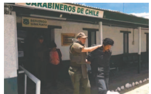
Por trata de migrantes, tres personas fueron aprehendidas, entre ellos un boliviano /CAPTURADA DE VIDEO

Tras el rescate de los migrantes, las autoridades del orden aprehendieron a tres personas, dos de nacionalidad chilena y una boliviana, quienes fueron posteriormente trasladados a dependencias policiales. Ahora los sindicados enfrentan un proceso