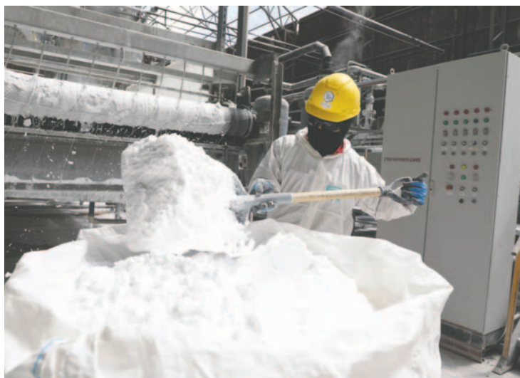
La empresa rusa Uranium One Group está encargada de emplazar la planta en Uyuni /NLB