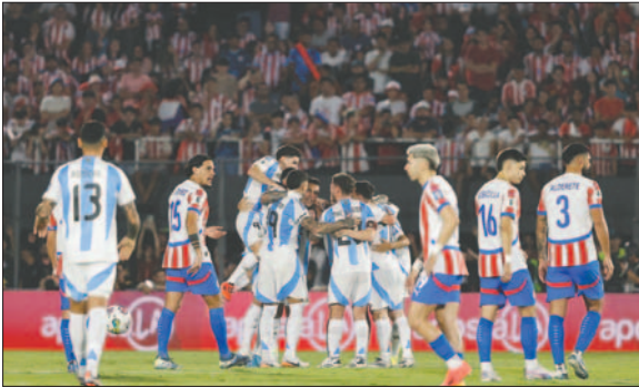
Argentina se adelantó, pero después Paraguay logró remontar

Paraguay superó por 2-1 a Argentina el jueves en Asunción, en un partido por la undécima fecha de la Eliminación Sudamericana al Mundial 2026 que confirmó el buen momento de los dirigidos por el entrenador Gustavo Alfaro, quienes acumulan ya cinco fechas sin derrotas.