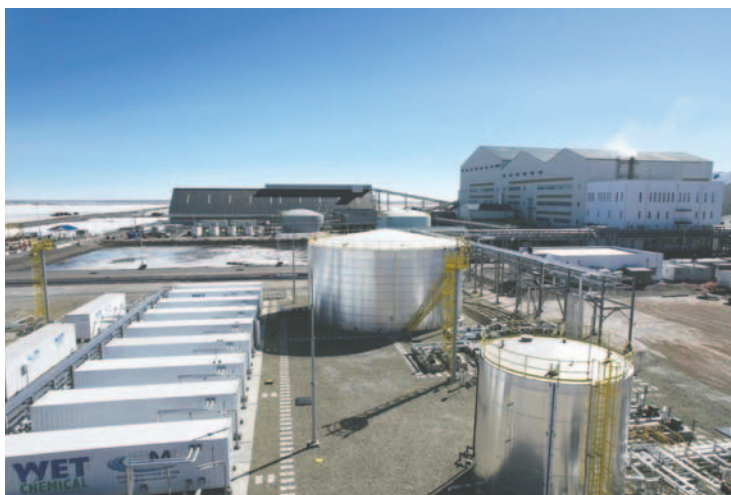
Desde YLB confirmaron que las utilidades por EDL será en un 51% para Bolivia y el restante para la empresa rusa /NLB