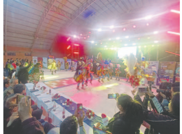
La Diablada Urus le dio color y carnaval al acto inaugural