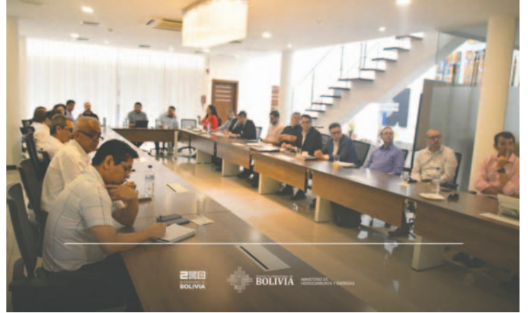
Reunión para modificar la Ley N° 767 /MHYE