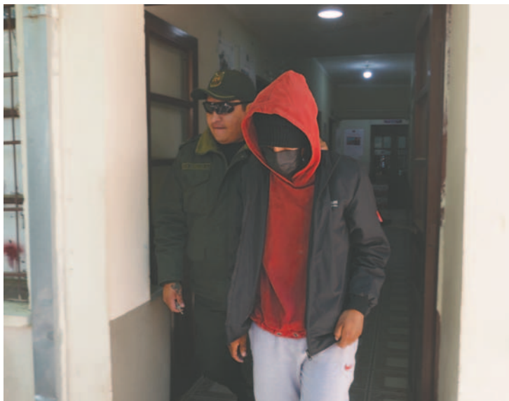
El individuo es investigado por violar a una adolescente quien abortó en días precedentes