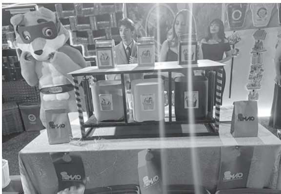
La empresa de aseo promueve acciones de cuidado ambiental y reciclaje

También detalló que en el marco de un convenio de cooperación interinstitucional entre el Campo Ferial y la entidad edil, participa en un stand, con el afán de promover acciones de