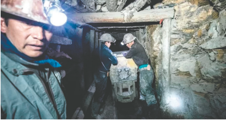
La minería podría generar más ingresos para el país