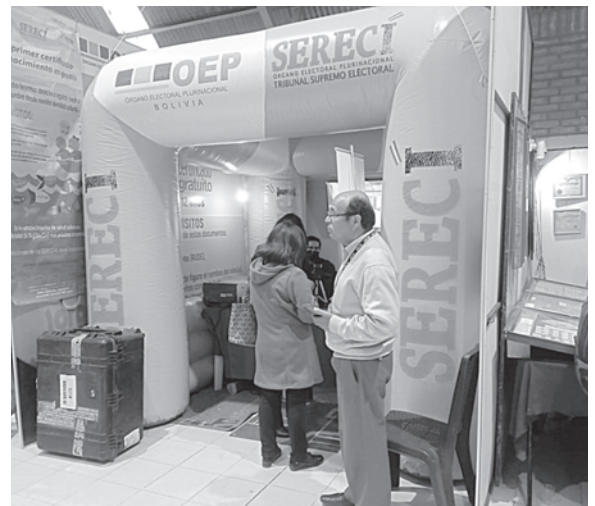
El stand del Sereci estará empadronando durante la feria

Uno de los objetivos principales es la emisión de certificado de nacimiento para menores entre los 0 y 12 años, de lunes a viernes en el horario de 16:00 a 20:00 horas, y fines de semana a partir de las 10:00 horas.