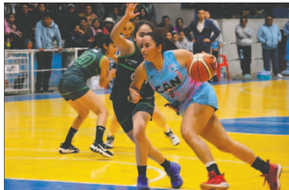
CAN en condición de visitante, buscará derribar a Tenis La Paz

La fecha se complementa desde las 18:00 horas en el coliseo "Villa de los Niños" de la Villa Imperial, donde Leones recibirá al conjunto de Uriona de Oruro.