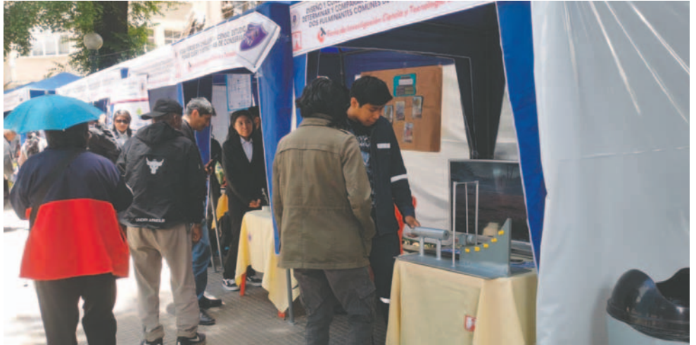
Feria de la UTO resalta investigación en varias áreas