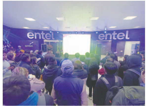
Ayer mucha gente se dio cita a la primera jornada de Expoteco; algunos aprovecharon de ver el partido de la selección