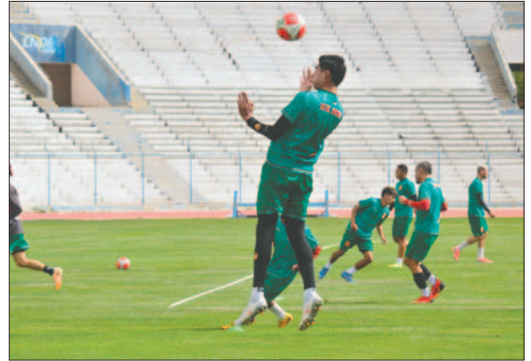
Durante el entrenamiento del cuadro realista en el estadio "Bermúdez"

derrama, hombre de contención, mencionó que el grupo está motivado y con las ganas de cumplir el objetivo, pero que se deben tomar los recaudos correspondientes para no cometer errores, ya que el rival también tiene experiencia en este tipo de lides.