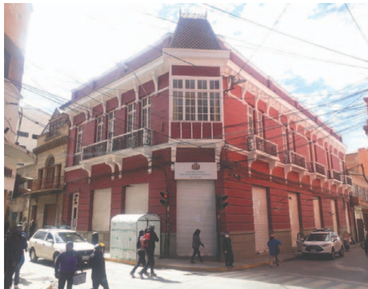
Desde la Fiscalía anunciaron la solicitud de prisión preventiva para el principal implicado