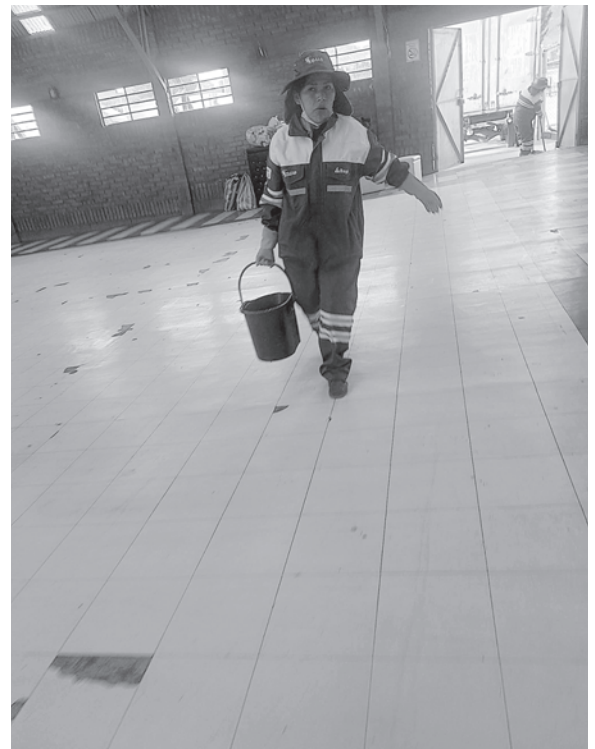
Desde hace algunos días EMAO ya viene realizando la limpieza del Campo Ferial

la disposición de residuos sólidos en el interior del Campo Ferial lo que garantiza un espacio higiénico y saludable para los visitantes.