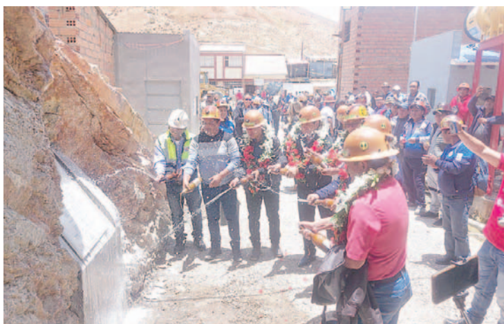
Presentan el proyecto de rampa subterránea en el Campamento San José /Abel Fernández