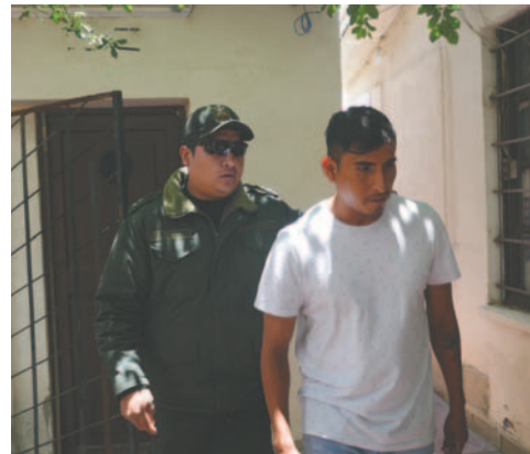
El sujeto en instalaciones de la Fiscalía

Precisó que el presunto autor del crimen sexual es investigado por el delito de violación a infante, niña, niño y adolescente y que se solicitará su detención preventiva en la cárcel de San Pedro.