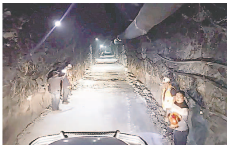
La rampa tendrá un ancho y altura de cuatro metros