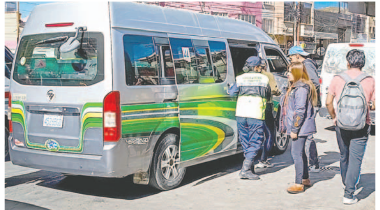
Controles serán más estrictos

El Decreto Municipal (DM) 354 establece la aplicación de nuevas tarifas desde el 2 de enero de 2025 con un cobro de Bs 2 para adultos en minibuses; microbuses Bs 1,50, universitario Bs 1, estudiantes de secundaria 70 centavos y de primaria 50. Para adultos mayores y personas con discapacidad será de