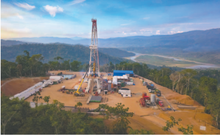
Buscan fomentar la exploración y explotación de hidrocarburos