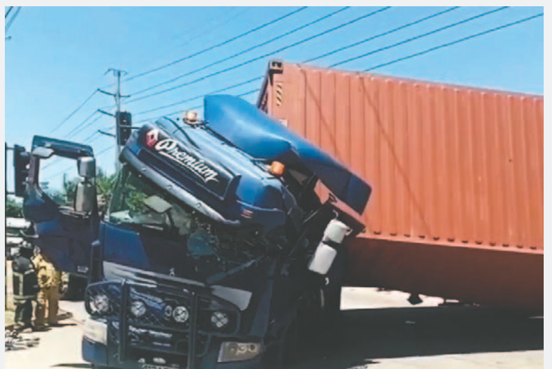
El conductor murió tras ser aplastado por el contenedor, su hijo se salvó

El contenedor impactó con la parte izquierda de la cabina y aplastó al conductor. Luego del hecho, transeúntes y otros conductores evacuaron el motorizado y comunicaron lo ocurrido a personal de salud.