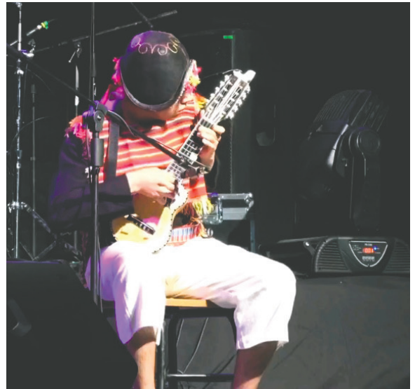
Inicia el Festival del Charango Aiquile 2024