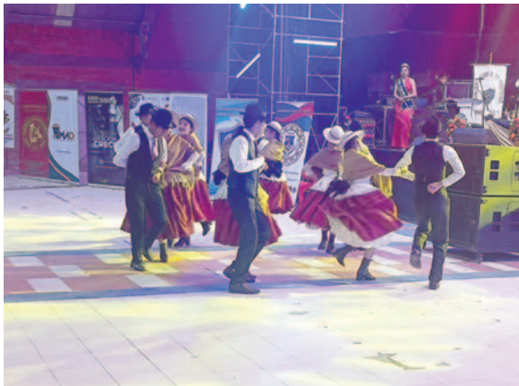
La danza también destacó en la jornada