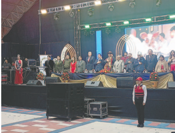
El acto de inauguración se efectuó ayer en el Pabellón Supay