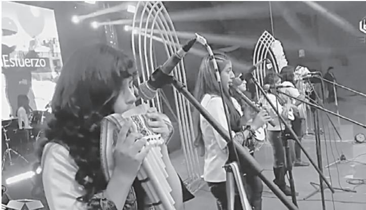
La música nacional marcó la noche inaugural organizada por Cartonbol