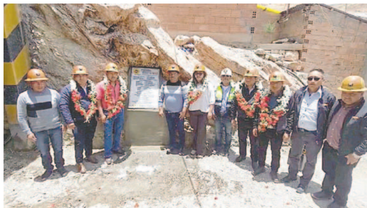
La inversión del proyecto ronda los 4 millones de bolivianos