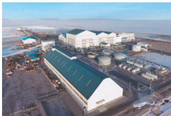
En la Rueda de Negocios se podrá descubrir los beneficios del carbonato de litio y otros subproductos esenciales para diversos sectores económicos

Asimismo, se facilitarán contactos comerciales con otros sectores y la posibilidad de cerrar acuerdos de compra y suministro. La