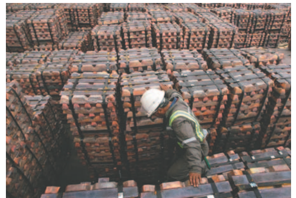
Trabajador supervisando un cargamento de cobre para su exportación a Asia en el puerto de Valparaíso, Chile

Bajo esa premisa, Lozano manifestó que los metales que se están exportando son principalmente el cobre, el zinc y el molibdeno. Destacó, por ejemplo, que el Perú, de acuerdo al Boletín Estadístico del Minem, es el segundo productor mundial de cobre y zinc, y el cuarto en molibdeno.