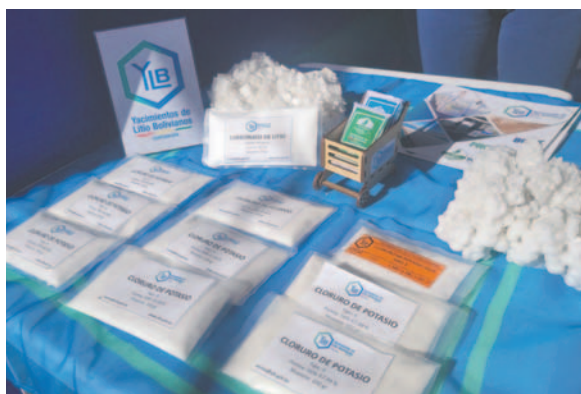
Los productos y subproductos obtenidos en el Complejo Industrial de YLB, ubicado al sur del Salar de Uyuni en Potosí /NLB

Además, YLB ofrecerá cloruro de potasio y cloruro de sodio,