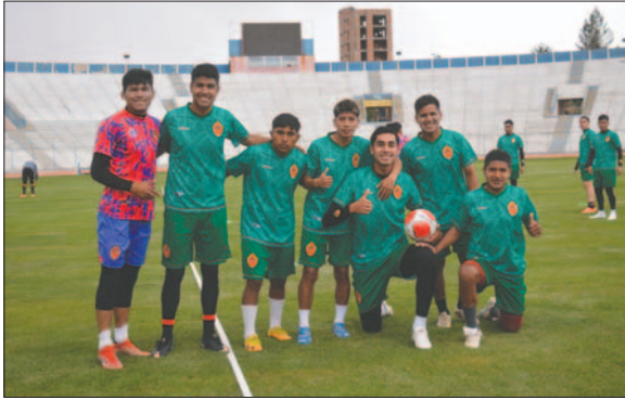
Jugadores de CDT Real Oruro, aguardan motivados el partido del sábado

Los jugadores también se encuentran deseosos de lograr un buen resultado en Oruro. Raúl Bal-