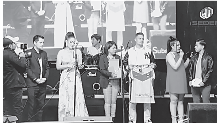
Jugadores de GV San José estuvieron presentes para sortear poleras y otros regalos