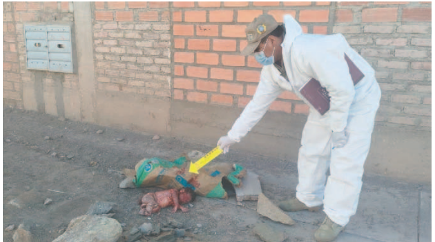
El cadáver fue hallado en la urbanización Santa Ana, zona Este de Oruro

Se aguarda para hoy un informe desde la fuerza anticrimen y si se confirma el inicio de investigaciones.