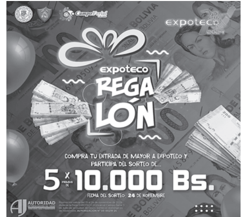
Una de las promociones más atractivas será el sorteo de 5 premios de 10 mil bolivianos al finalizar la feria /EXPOTECO

Si bien los fines de semana no tendrán promociones para el ingreso, sí tendrán mucha actividad y serán imperdibles, ya que se contará con las actuaciones de grandes artistas en el Pabellón Supay, con la presencia de músicos de renombre como Marilyn, Qmbia Juan, Quirquinña, Deszairé, además de las actuaciones especiales de Luck Ra, Luis Vega y la Repandilla.