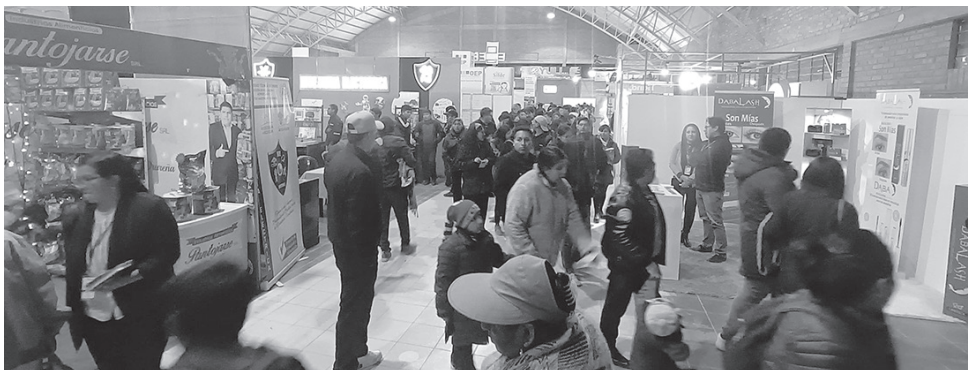
La feria inició ayer y se tuvo masiva afluencia; para los próximos días se aguarda a más gente