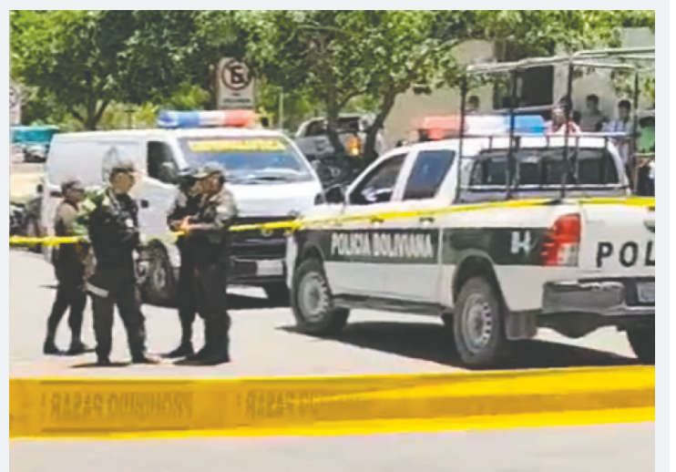
Uniformados acordonaron el sector tras asesinato a sangre fría