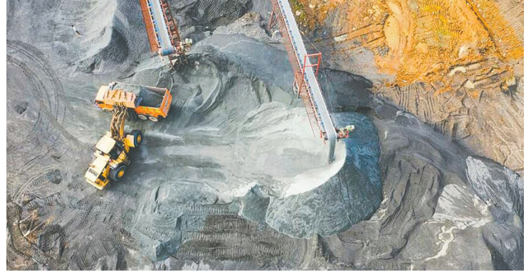
La propuesta es a largo y mediano plazo para mejorar la minería