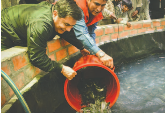
Se espera que los alevines ayuden a los pobladores de las dos comunidades