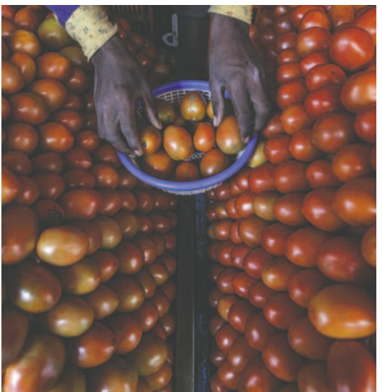
Los estudios demostraron resultados satisfactorios

Un artículo que también publica Nature, en el que se comenta el estudio, indica que “el trabajo representa un emocionante paso adelante en la comprensión de la partición de recursos en la fruta y sus implicaciones para la mejora de cultivos en todo el mundo”.