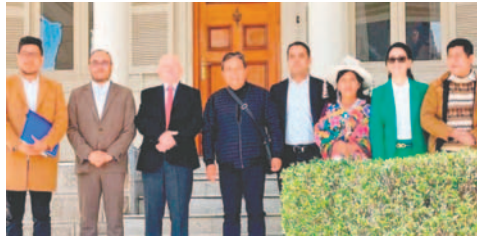
Los titulares del Tribunal Supremo Electoral

“La determinación es asumida porque, pese a los compromisos adoptados, no se han garantizado las condiciones necesarias