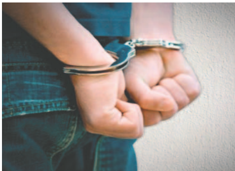
El antisocial es investigado por robo agravado

Eran aproximadamente las 13:30 horas cuando el implicado ingresó a un domicilio sin nadie dentro y procedió a robar distintos objetos. Esta acción fue observada por vecinos que lograron retener al ladrón.