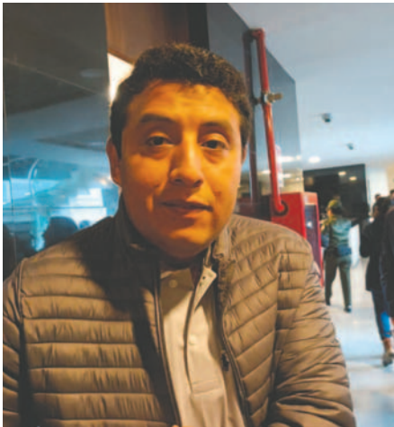
El senador del Movimiento Al Socialismo (MAS), Miguel Rejas

Bolivia está enfrentando una escasez de combustible debido a la baja producción local y a las dificultades para importar carburante. El senador del Movimiento Al Socialismo (MAS), Miguel Rejas, ha compartido su preocupación por la situación, indicando que no hay diésel ni combustible en todo el país, y no solamente en las ciudades capitales.