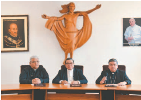
Los representantes de la iglesia pidieron diálogo para mejorar el país

Pesoa se refirió al reciente bloqueo de cami-