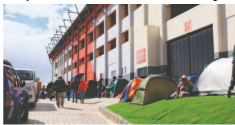
Centenares de personas hacen fila en el estadio de Villa Ingenio en busca de una entrada

Silva expresó que "algo raro está pasando" y cuestionó el proceso de venta.