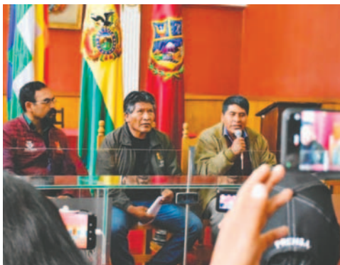
Autoridades de Cultura y la Iglesia Evangélica durante la presentación de la actividad

“Después de varios años de explotación del cerro San Pedro, este año recién se ha recuperado este bien patrimonial para los orureños y oru-