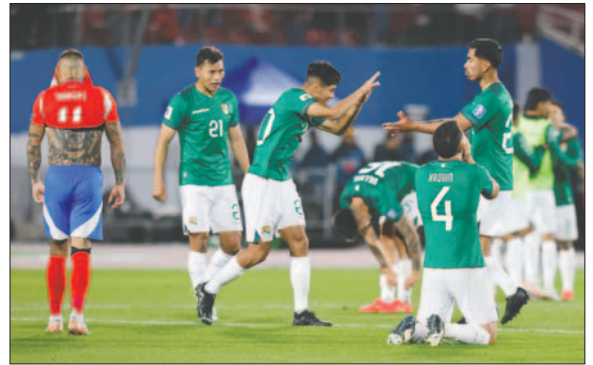
Los bolivianos quieren seguir sumando puntos para mantener la chance