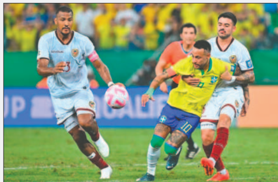
Brasil empató de local con Venezuela en la ida 1-1 el 12 de octubre de 2023

Este partido se ha programado para las 17:00 (hora boliviana) en el estadio Monumental de Maturín, con el arbitraje del colombiano Andrés Rojas.