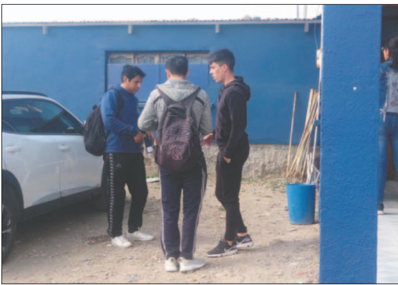
Los jugadores se presentaron en el complejo pero no entrenaron

económica y destacó que ya se está cerca de fin de año lo cual genera incertidumbre. Pidió una solución definitiva al pedido económico, especialmente considerando que están cerca de clasificar a un campeonato internacional, lo cual significaría ingresos para la institución.