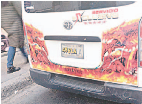
Algunos minibuses tapan sus placas para no ser identificados

De manera oficial, ningún conductor quiso hablar con LA PATRIA, pero algunos refirieron que continuarán con las