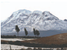
El volcán Chimborazo ubicado en la Cordillera Occidental de Ecuador, se calcula que el volumen de hielo del glaciar es de más de 2 km cúbicos

En 2024, según los datos de la ICCI, esta zona de mayor riesgo se convirtió en la primera región mundial de glaciares que se confirmó que era más pequeña que en