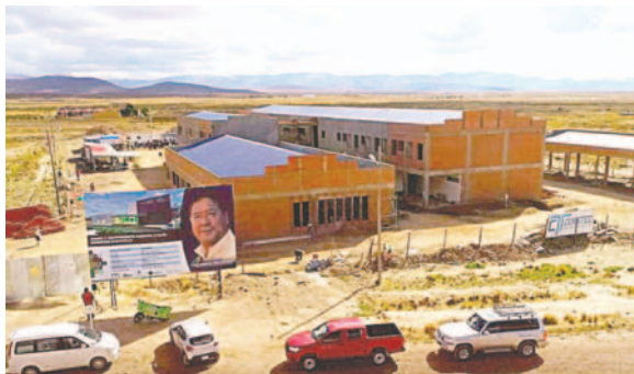
Proyecto del Hospital de Caracollo avanza en su construcción

de la Empresa Macbor, detalló que el proyecto hospitalario está emplazado en una superficie de construcción de 4.726 metros cuadrados, en planta baja y alta. El proyecto es financiado por la Unidad de Proyectos Especiales (UPRE) con un monto de 27.723.362,20 bolivianos.