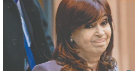
Fotografía de archivo del pasado 14 de agosto de la expresidenta de Argentina, Cristina Fernández (2007-2015), a su llegada a un juicio, en Buenos Aires (Argentina)