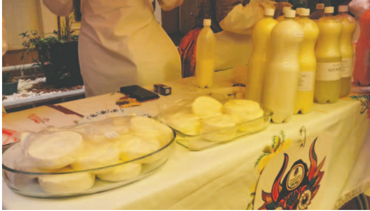
Exposición de productos lácteos fueron parte de la muestra final

“En el curso de capacitación en Tecnologías Lácteas se han capacitado 25 unidades productivas del municipio de Pazña, lo que los productores han aprendido primero es la elaboración de los diferentes tipos de yogurt, ya que ellos son promotores de lácteos”,