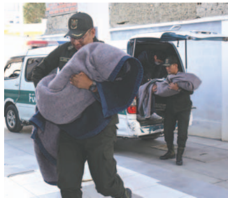
Ambos menores son trasladados a una morgue por agentes del orden

Posteriormente, fueron trasladados a la Caja Nacional de Salud, de la zona de Manco Kapac, donde un médico señaló que ya estaban sin vida.