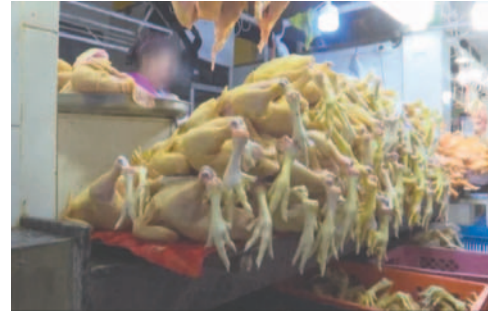
El pollo escaseará en los próximos meses /REFERENCIAL

Señaló que ha intentado comunicarse con el viceministro de De-