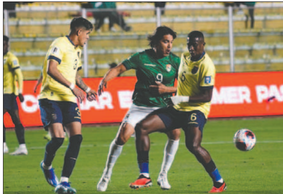
En la ida venció Ecuador 2-1 en La Paz el 12 de octubre de 2023

El plantel titular se quedó en La Paz para prepararse y esperar el juego contra Paraguay (19 de noviembre, 16:00), en el estadio Municipal de El Alto, donde tiene todas las cartas a su favor para retornar al Mundial.