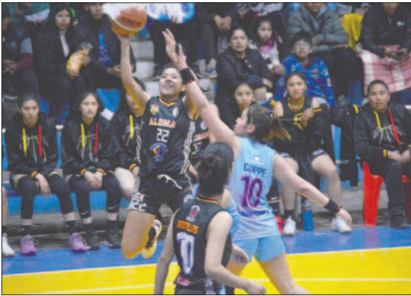
Alemán demostró buen juego pero le faltó potencia al final del partido

jugarse en La Paz el sábado, mientras que Alemán ese mismo día jugará en condición de local ante In-gavi de Llallagua.