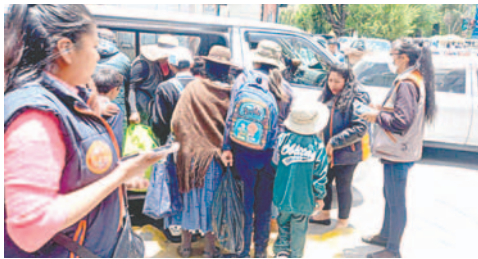
GAMO hará un estudio para implementar el transporte municipal escolar

Ante esa situación y la petición de la Junta de Distrito de Padres y Madres de Familia de Oruro