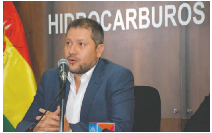
El ministro Gallardo anunció la determinación del Gobierno

Gallardo expresó que los sectores con los que estuvieron reunidos durante los pasados días so-