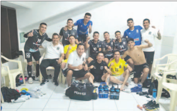
Festejo de los integrantes de Fantasmas Morales Moralitos en su camarín

Con la igualdad de 3-3 terminó el cotejo, dejando la llave abierta para lo que pueda ocurrir en Oruro este domingo 17 en el encuentro de vuelta. Los directivos esperan contar con el apoyo del público para acceder a la final.