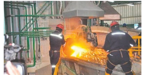
Sector fabril pide apoyo al sector privado para garantizar fuentes laborales /REFERENCIAL

Los fabriles pidieron la intervención de autoridades departamentales para