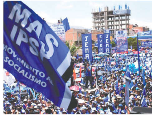
El MAS y otros partidos tienen plazo hasta diciembre para renovar directivas

En total son seis organizaciones políticas involucradas en este proceso electoral hacia 2025. La situación actual refleja tensiones internas significativas dentro del MAS y plantea interrogantes sobre su futuro liderazgo y cohesión ante las elecciones nacionales.