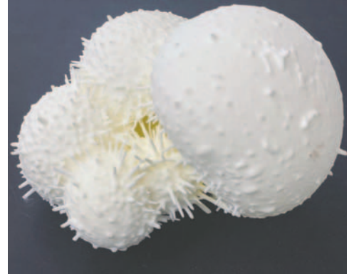
Imagen de un modelo 3D ampliado de un espécimen de plancton marino

Si estas preocupantes tendencias empeoran, habrá consecuencias muy rea-