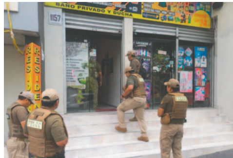
La Policía en operativo para rescatar a una adolescente

“Una vez que se conoció el hecho, de manera inmediata, el Ministerio Público en coordinación con la Policía se movilizó con la finalidad de poder encontrar a la joven. Actualmente se tienen a dos personas de sexo masculino aprehendidas que se encontraban junto con la