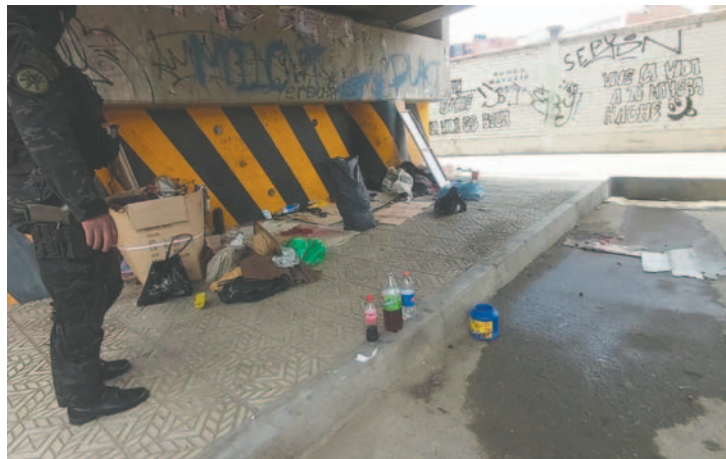
Los bebedores fueron desalojados del sector