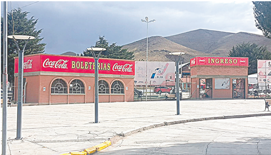
La feria está lista para recibir a sus visitantes /LA PATRIA