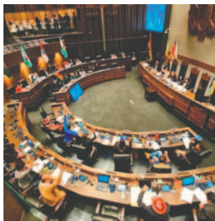
El pleno de la Cámara de Senadores