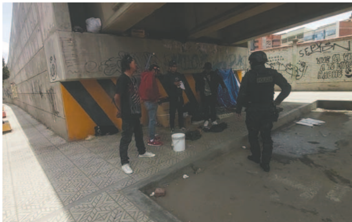
Agentes del GTS intervinieron en las peleas de cuatro bebedores frecuentes