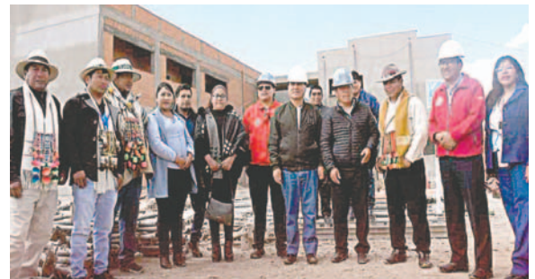
Autoridades inspeccionaron el proyecto hospitalario

“Está en proceso de construcción y, en el plazo previsto, nos van a entregar para beneficiar a muchas personas de la