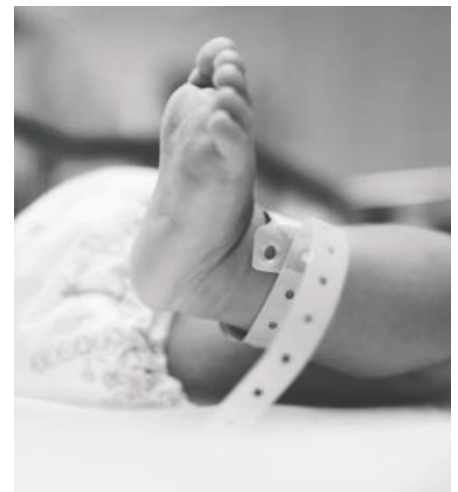
La autopsia determinará la causa de muerte

El hecho delictivo fue de conocimiento del Ministerio Público para continuar con la causa penal.