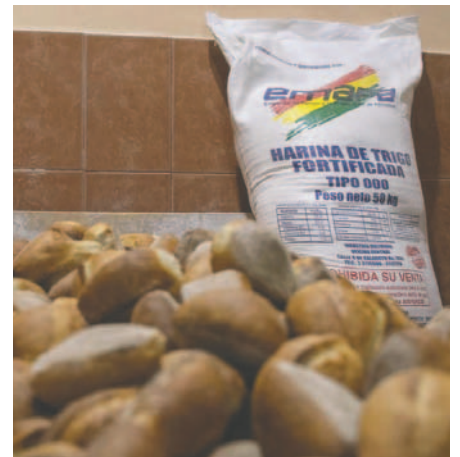
La harina se entrega para la elaboración del pan de batalla

Emapa tiene registrada cuántas bolsas de harina de 50 kilos han sido entregadas y a quiénes, destacando que hasta la fecha se han distribuido 1,7 millones de bolsas de los 2,4 millones planificadas para este año. “Aquel panificador que diga que no se ha entregado, definitivamente, está en una falsedad”, aseguró Flores.