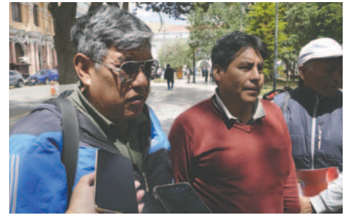
Comisión de Poderes de la Fedjuve emite una resolución para acreditaciones para el Congreso Ordinario

En la resolución, la Comisión de Poderes resuelve que, en caso de que las juntas vecinales no cuenten con este requisito para la acreditación, se deberá presentar el libro de actas, la certificación de la asociación comunitaria de su distrito y la certificación de