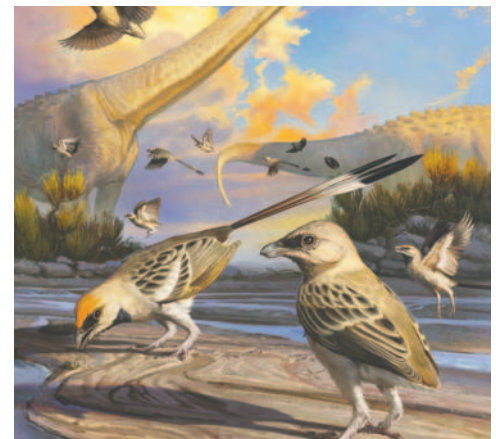
Impresión artística de Navaornis

ta el cráneo de Navaornis se parece al de una pequeña paloma, una inspección más detallada reveló que era un miembro de un grupo de aves primitivas denominadas enantiornitas o "aves opuestas".