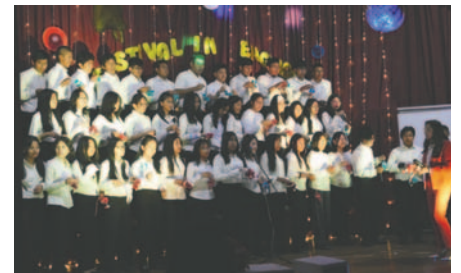
Con mucho éxito, se realizó el Festival de Inglés en la U.E. Santa Claudina Thevenet

La actividad no solo permitió a los estudiantes demostrar sus habilidades lingüísticas, sino que también fomentó un ambiente colaborativo entre ellos y fortaleció su confianza al hablar en inglés.