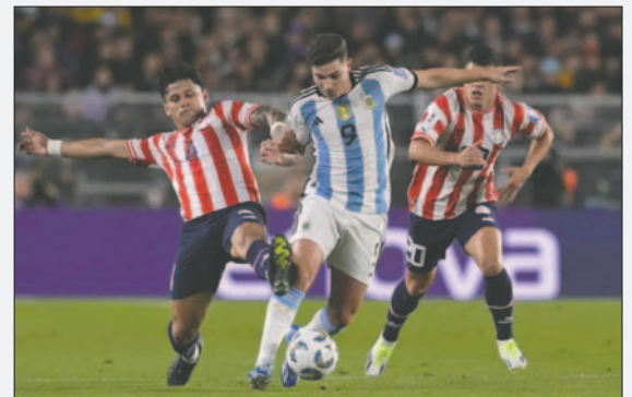
En la ida, Argentina venció de local 1-0 el 12 de octubre de 2023

La Albiceleste, campeona del mundo y que suma 22 de los 30 puntos posibles en la eliminatoria, venció en su pasada presentación por 6-0 a Bolivia, mientras que Paraguay batió por 2-1 a Venezuela, resultado que la catapultó al sexto lugar de la tabla, con trece unidades, que le asegura un lugar en la zona de clasificación directa.