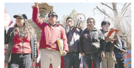
Fedjuve convoca a cabildo este lunes 18 de noviembre

“El municipio tiene autoridades que deben hacer cumplir este tema del transporte; tiene que haber sanciones drásticas a los transportistas, ya que ellos están convocando a la violencia dentro de las movildades”, manifestó.