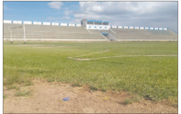
No se levanta el paro en GV San José a tres días del partido ante Guabirá