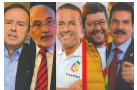
La oposición boliviana busca unidad, pero enfrenta retos internos

La oposición busca consolidar su fuerza ante un contexto político complejo y dividido.