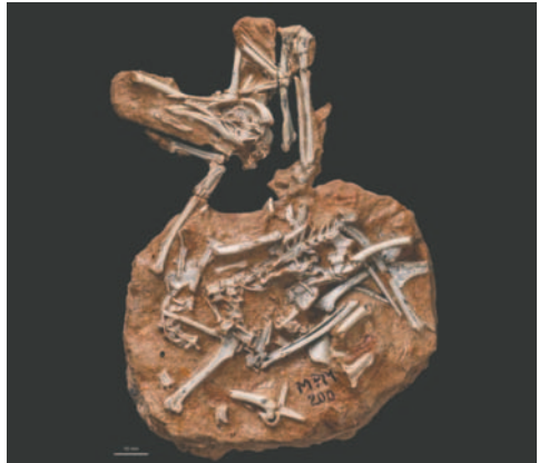
Esqueleto de Navaornis, un ave fósil de la era de los dinosaurios