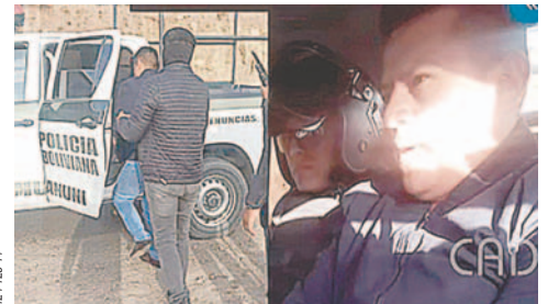
Los dirigentes al momento de su aprehensión