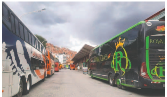
Buses parqueados en la Terminal de Buses de La Paz