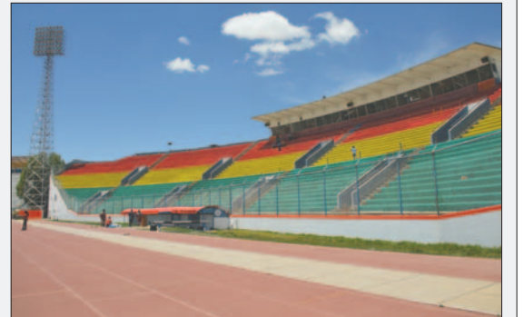
El estadio necesita modificar la ubicación de las casamatas

Agregó que se está buscando subsanar las demás observaciones efectuadas por Conmebol. Uno de los principales aspectos es el tema de luminarias, ítem en el que se necesita 12 millones de bolivianos. Para esto, se están buscando las fuentes de financiamiento y no se descarta pedir el apoyo de la Federación Boliviana de Fútbol (FBF) o de la misma Conmebol.