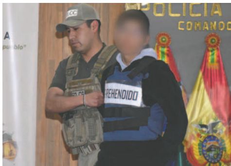
El implicado fue presentado por el Gobierno

El caso salió a la luz luego que internautas denunciaran que en las redes sociales circulaban las imágenes de una niña que era sometida a ultrajes sexuales por parte de uno de sus familiares.