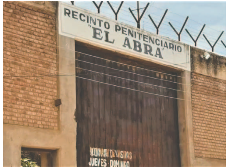
Ambos venezolanos cumplirán la pena en la cárcel de El Abra /REFERENCIAL

El fiscal departamental de Cochabamba, Osvaldo Tejerina Ríos, informó que se presentaron todas las pruebas colectadas en la investigación durante la audiencia de juicio oral. Estas incluyeron el protocolo de autopsia, el acta de levantamiento de cadáver y la declaración de testigos. El Tribunal de Sentencia N° 4 dictó condena sin derecho a indulto.