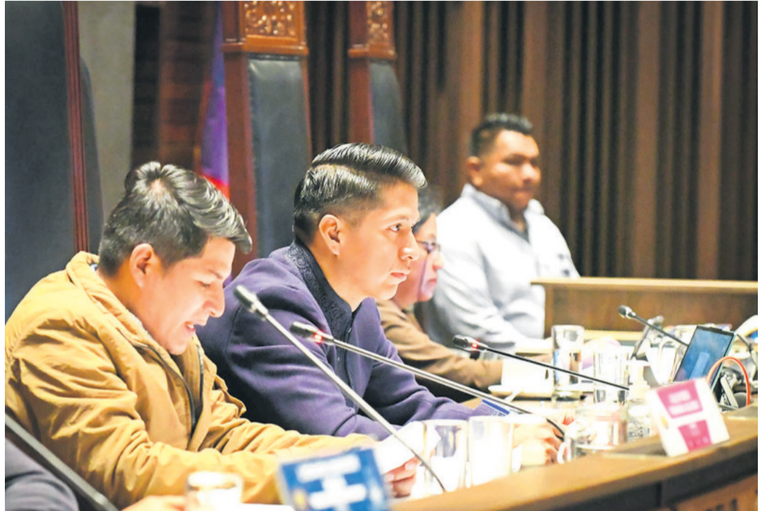
El senador Andrónico Rodríguez en una sesión de la anterior legislatura

Legisladores evistas del MAS advirtieron con procesar penalmente a los vocales del Tribunal Supremo si éstos no cumplen el principio de preclusión que establece la Ley 026 de Régimen Electoral.