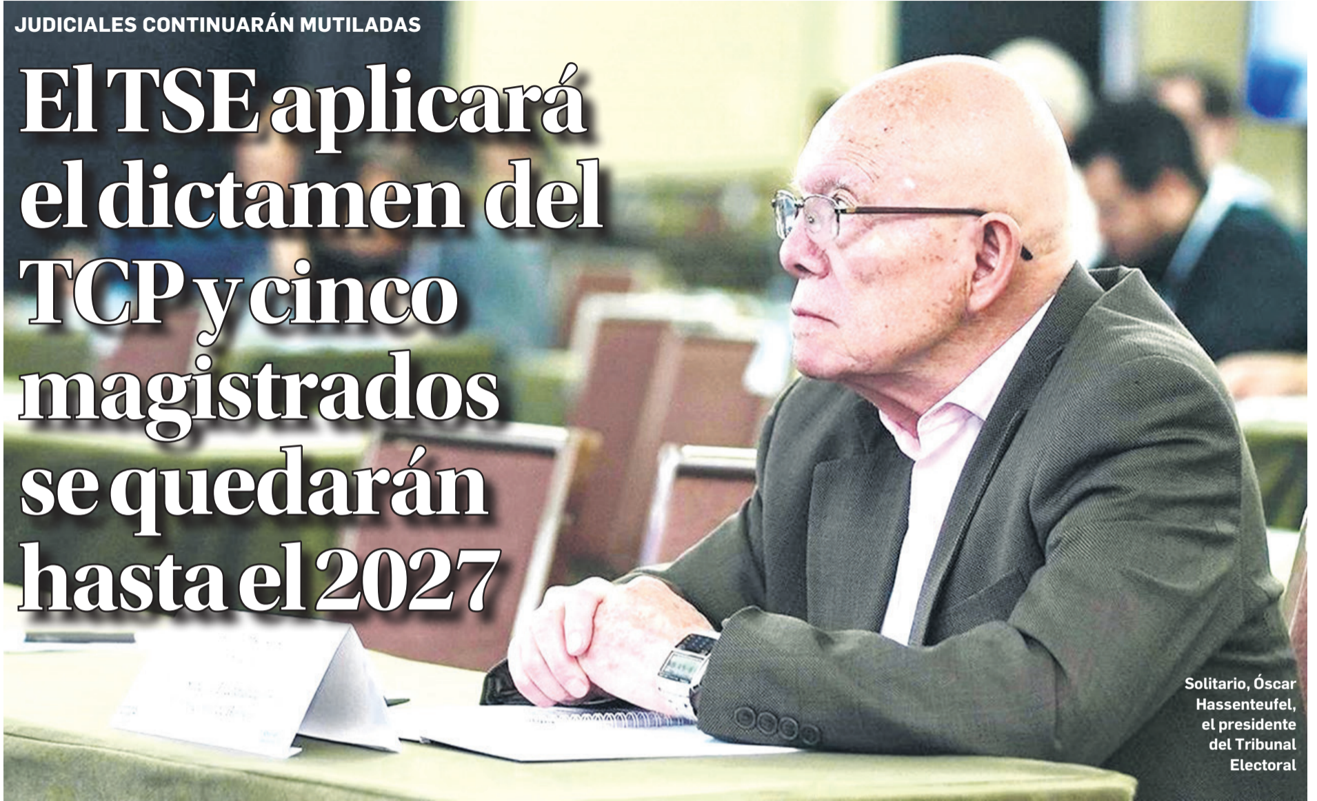
Solitario, Óscar Hassenteufel, el presidente del Tribunal Electoral

Administrará las elecciones parciales el 15 de diciembre. El Organismo Electoral reprochó al Ejecutivo y Legislativo porque le dejaron “prácticamente solo” a pesar de los compromisos. Evitarán procesos penales