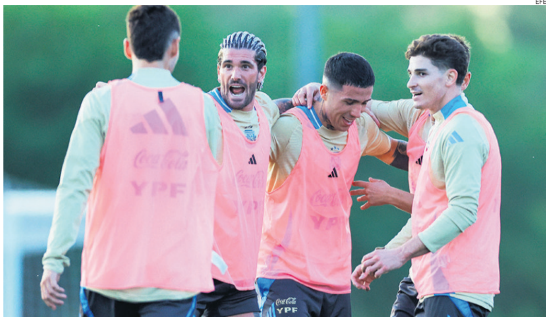
Jugadores de la selección argentina de fútbol en el último entrenamiento, antes de enfrentar a su similar de Paraguay en Asunción

El guardameta Emiliano 'Dibu' Martínez vuelve a la selección de Scaloni, puntera de las eliminatorias para el Mundial 2026