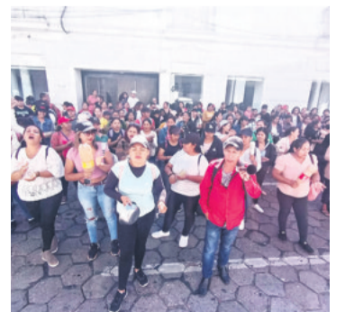
Salieron a protestar este miércoles