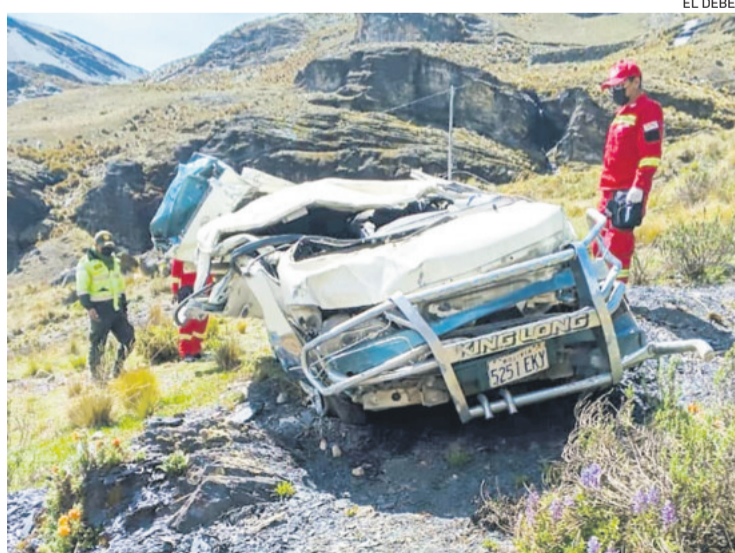
Así quedó el vehículo que se embarrancó con pasajeros en Oruro

Entre las personas que resultaron heridas de gravedad figuran