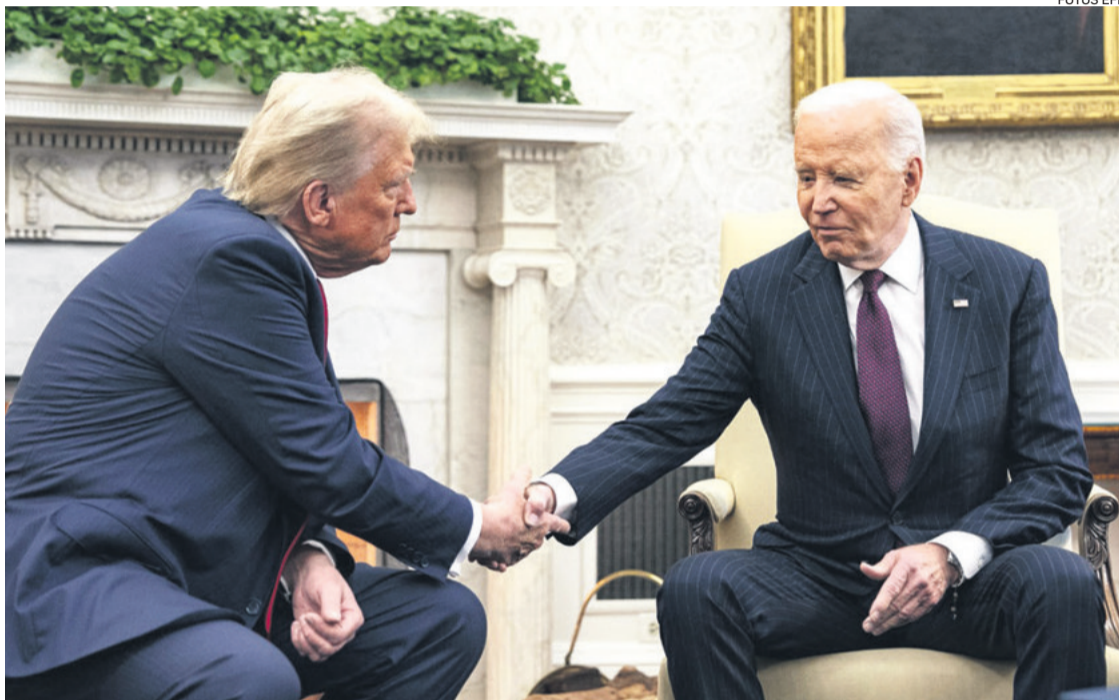
El presidente electo Donald Trump (izq.) estrecha la mano del mandatario estadounidense Joe Biden

A continuación, Trump tomó la palabra para afirmar: "La política es dura y, muchas veces, es un mundo complicado, pero hoy es un buen día en este mundo. Agradezco mucho que la transición esté siendo así de fluida y que siga así". Biden respondió con un escueto