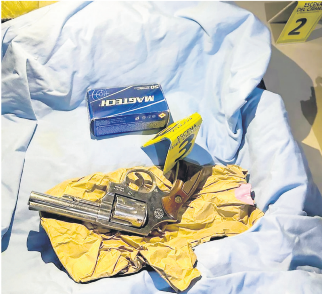
El arma homicida que fue encontrada por la Policía en poder de la enamorada del hijo del transportista

El autor material contó que disparó contra el hombre para cumplir la orden del hijo, que fue enviado a Palmasola al igual que su novia. La esposa tiene arresto domiciliario con escolta