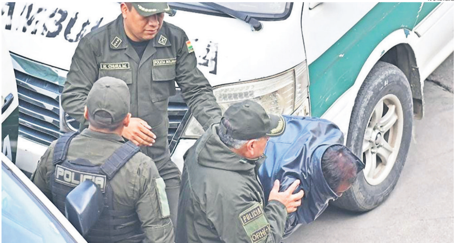
El dirigente evista es trasladado a las celdas de la FELCC de La Paz tras ser detenido en Cochabamba. Esta persona comandó los bloqueos

"Queda consolidada la ciudad de La Paz, como ámbito de jurisdicción procesal para el juzga-