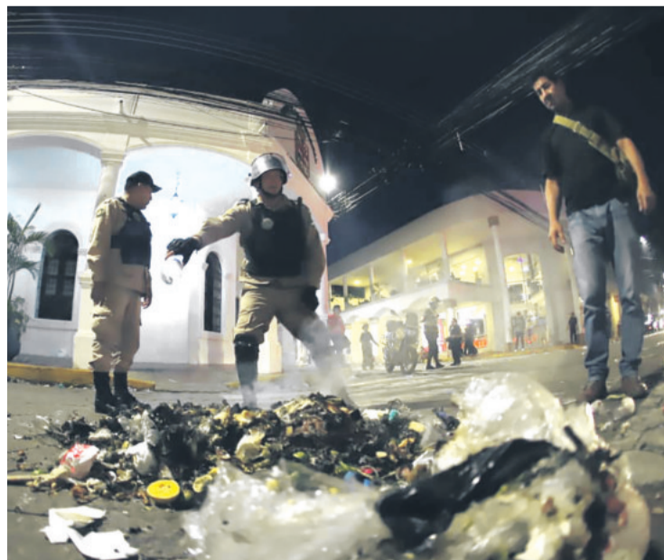
Así quedaron los accesos al Concejo después de la gasificación

Se continúa con los operativos para evitar que cobren más de Bs 2