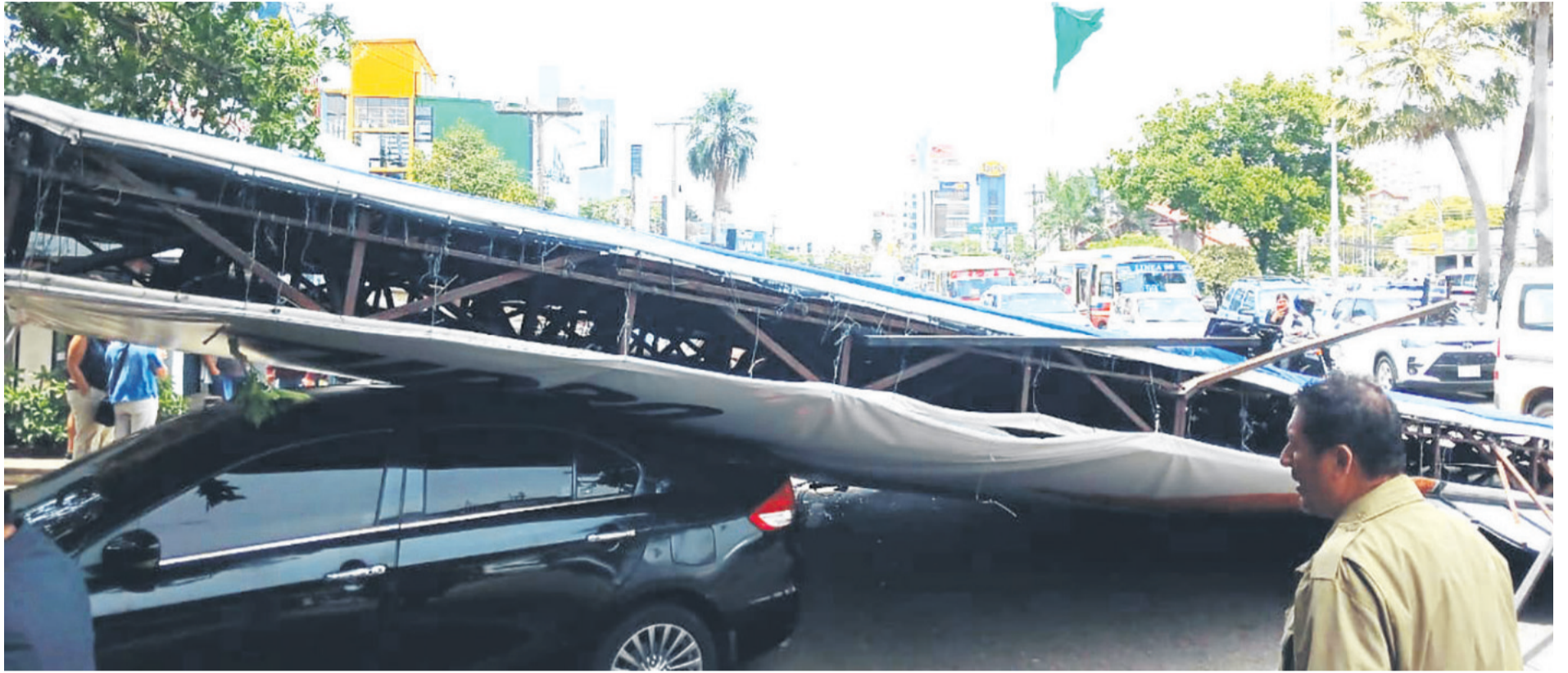
Los fuertes vientos que soplaron este martes provocaron estragos en distintos puntos de la ciudad, como la caída de esta valla sobre tres vehículos