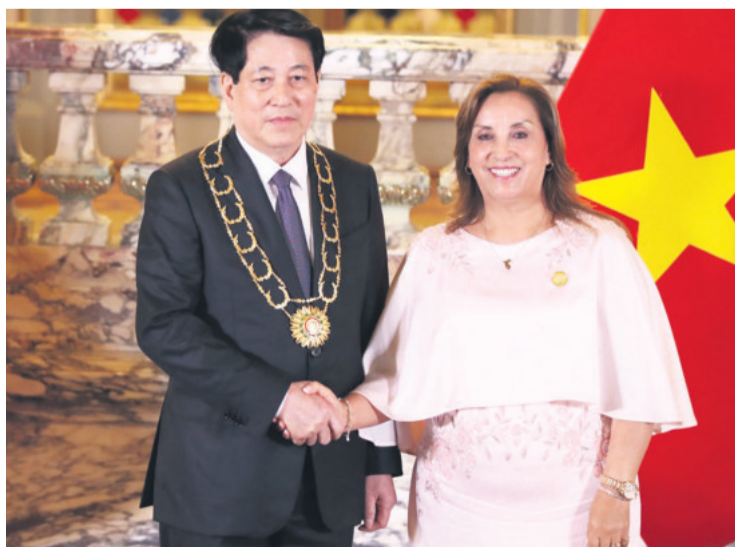
El mandatario vietnamita Luong Cuong y la presidenta Boluarte

Escortado por el jefe de protocolo y el jefe de la casa militar de gobierno, Cuong saludó a Boluarte con un apretón de manos y luego ambos se dirigieron a pre-