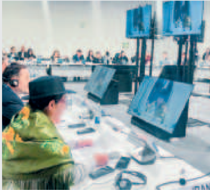
La canciller Celinda Sosa en su exposición en la COP29, en Azerbaiyán.

lizarse para una mejor comprensión y gestión de los recursos hídricos compartidos.