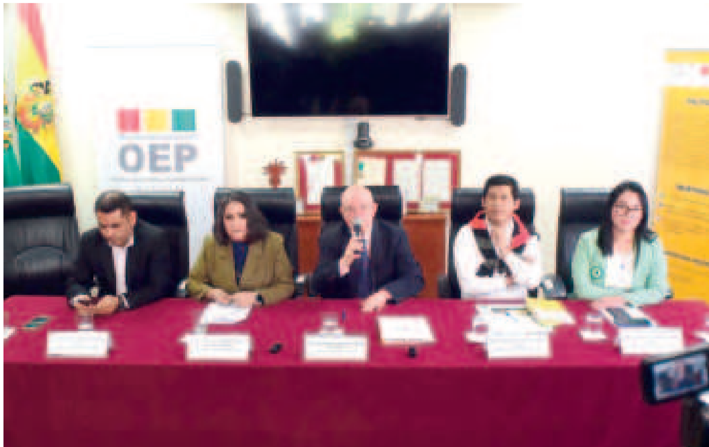
Vocales del Tribunal Supremo Electoral.

La elección judicial para la elección de magistrados del TCP también proseguirá en Chuquisaca, La Paz, Oruro y Potosí, según la más reciente resolución emitida por el TCP, con la que responde a la solicitud de complementación, aclaración y enmienda que presentó el Tribunal Supremo Electoral la semana pasada.