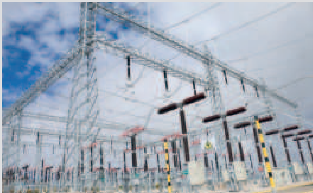
Una central eléctrica que opera la estatal ENDE.

El uso de la energía en los centros mineros redundará en menores costos operativos y genera más beneficios para inversionistas o cooperativistas.