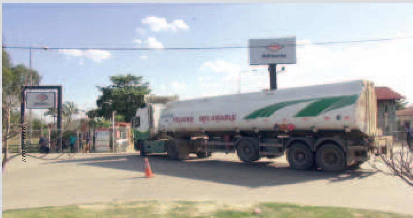
Un camión cisterna transporta combustible.

Se hace una “importación agresiva” para dar la certidumbre y garantía a la población de que se llegará a estabilizar el abastecimiento normal.