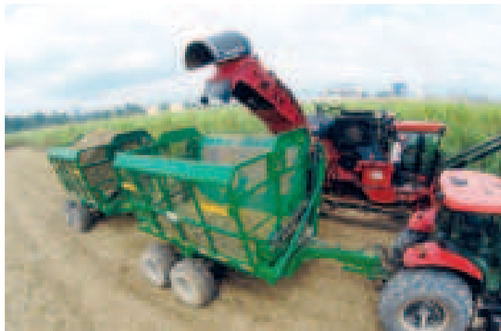
El gobierno de Arce fomenta la producción de caña.

Según el gerente, la colaboración con las comunidades ha sido fundamental para estos resultados. “Hemos trabajado muy