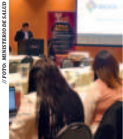
Taller de salud en La Paz.