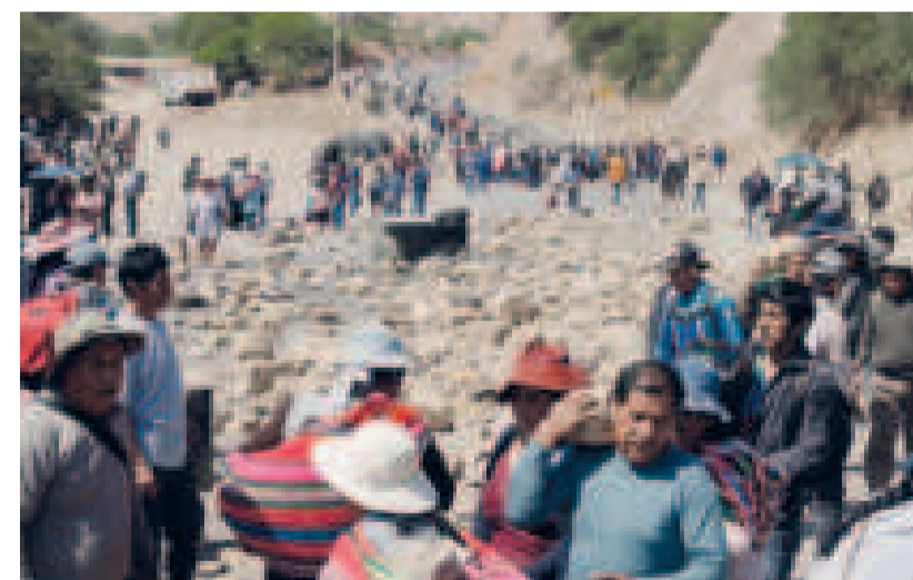
Bloqueo de caminos de los seguidores de Evo Morales, en Cochabamba.

condemna de Morales y detener los procesos por estupro y trata y tráfico de personas.