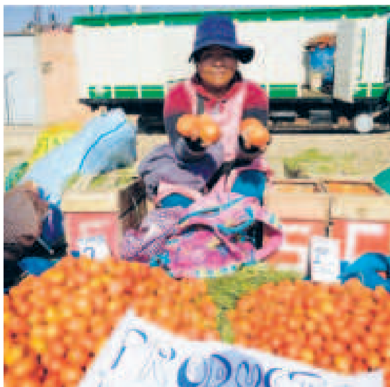
Los productores ofertan sus alimentos a precios justos.