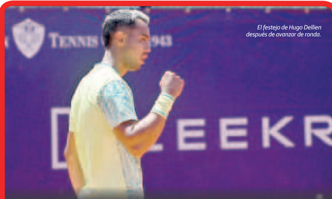
El festejo de Hugo Dellien después de avanzar de ronda.