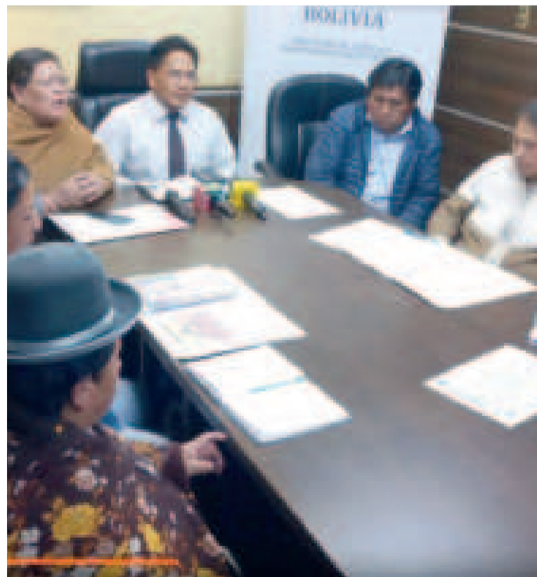
La reunión se sostuvo con los representantes de varias regiones del país.

También se comprometió a escuchar a todos los sectores involucrados en la cadena de producción y comercialización, para tomar decisiones informa-