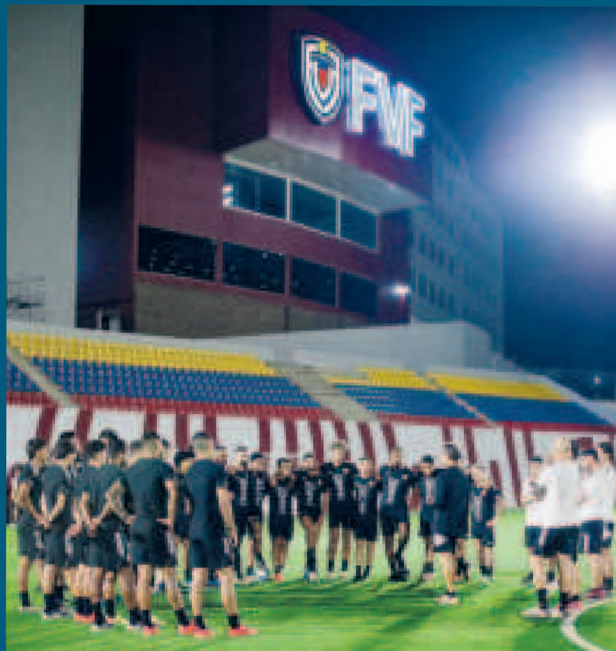
La selección venezolana en la charla técnica que ofreció el técnico Fernando Batista.