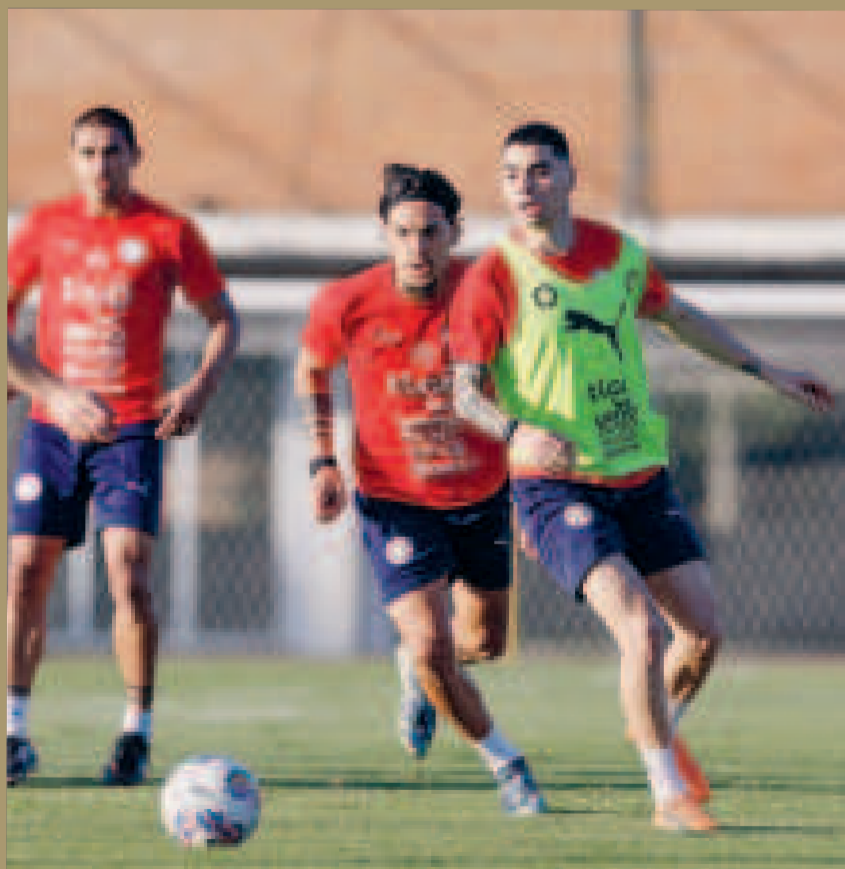
Jugadores del seleccionado paraguayo en el cierre de prácticas.

La selección argentina visitará a Paraguay por la fecha número 11 de las Eliminatorias Sudamericanas y el conjunto ahora entrenado por Gustavo Alfaro siempre fue un hueso duro de roer para la Albiceleste, que no consiguió demasiadas victorias ante la Albirroja por las clasificatorias.