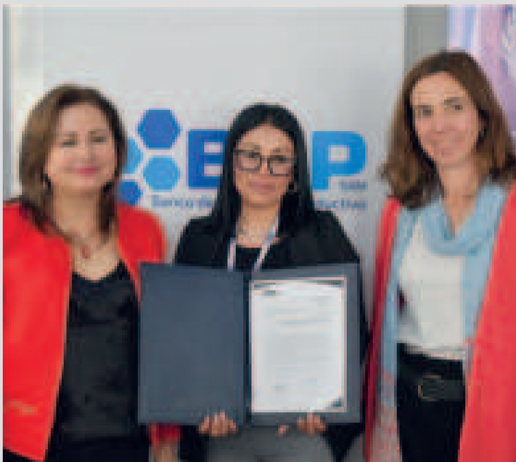
Las representantes de las entidades durante la firma del convenio.