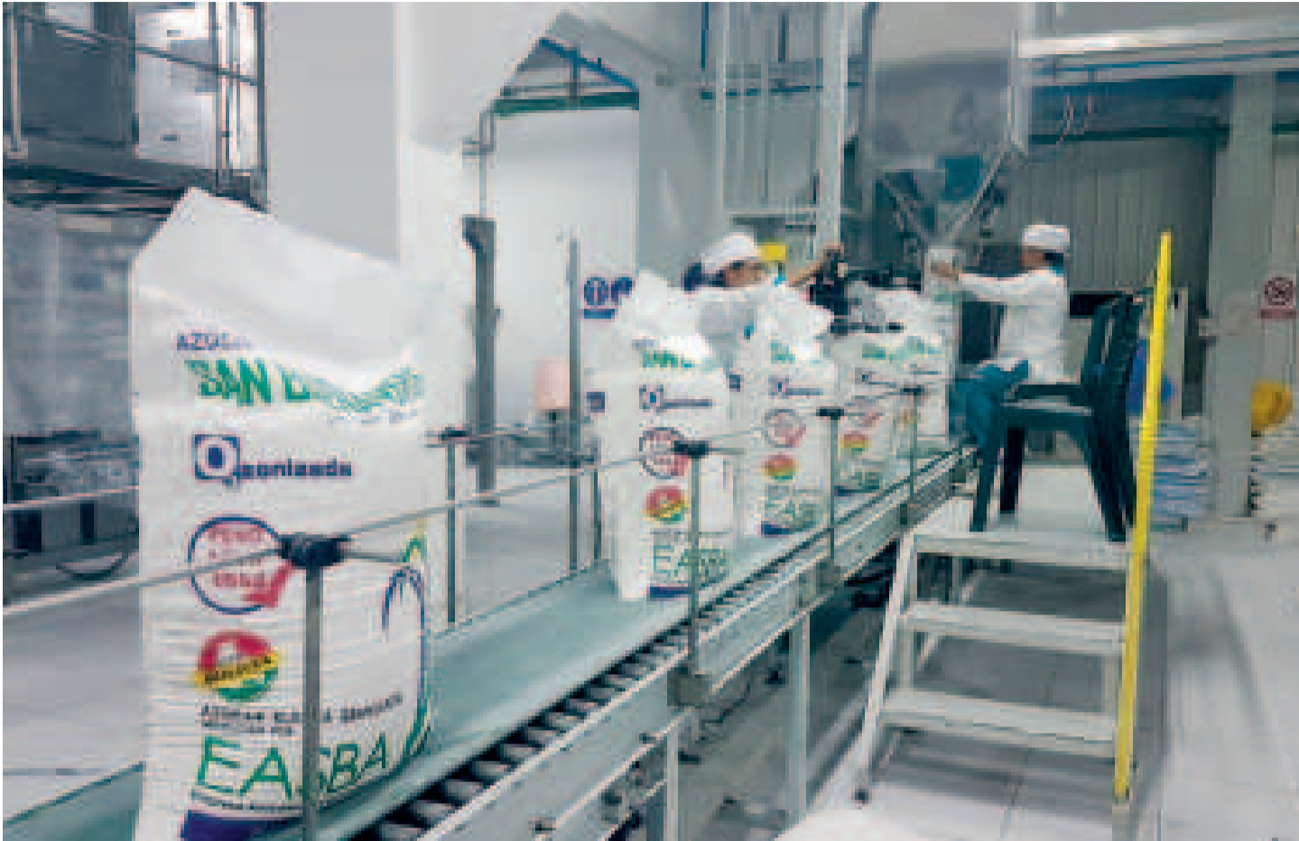
Producción de quintales de azúcar de la empresa estatal.