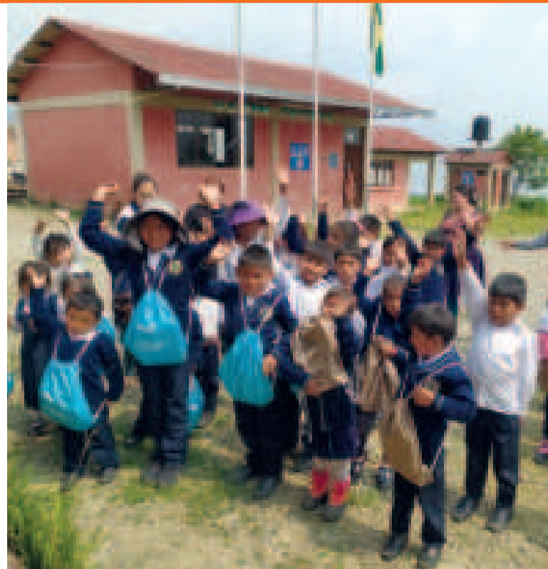
Niños que recibieron la capacitación de ENDE.