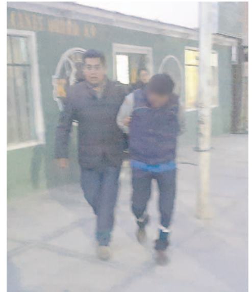
El conductor fue aprehendido por la Policía