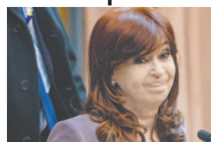
Fotografía de archivo en donde se ve a la expresidenta de Argentina Cristina Fernández (2007-2015)

LA PATRIA / EFE La expresidente argentina Cristina Fernández anticipó que este miércoles un tribunal de alzada confirmará su condena a seis años de prisión por irregularidades en obras viales, un fallo que ella considera una maniobra política para proscribirla. En un comunicado, Fernández denunció la falta de imparcialidad de los jueces vinculados al expresidente Mauricio Macri y defendió su inocencia en el caso conocido como "Vialidad", que investiga la concesión de 51 obras durante su gestión. Fernández aseguró que "todos ellos van a confirmar la condena del tribunal oral". El Tribunal Oral Federal 2 condenó en diciembre de 2022 a Fernández por el delito de administración fraudulenta de fondos públicos, pero la absolvió en los cargos por presunta asociación ilícita. La Fiscalía ha insistido en esta