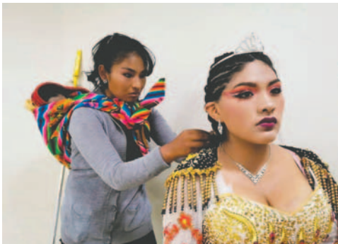
Mujeres se capacitaron en técnicas de maquillaje y peinado para Carnavales

El curso fue dirigido a mujeres orureñas emprendedoras en este ámbito, quienes, mediante