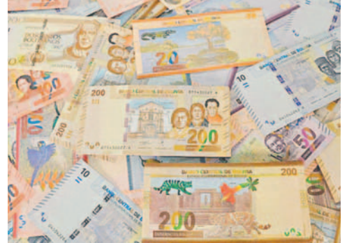
El nuevo dinero será introducido en el primer semestre de 2025 y a finales de 2026 / REFERENCIAL

El BCB destacó que las cantidades proyectadas en este proceso toman en cuenta criterios de banca central empleados a nivel mundial, dinámica sectorial, poblacional, crecimiento de la economía,