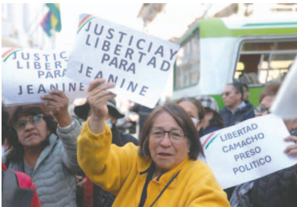
Simpatizantes de la expresidente interina de Bolivia, Jeanine Áñez

La opositora siempre reclamó un proceso especial como expresidente y en 2023 denunció al Estado boliviano ante la Comisión Interamericana de Derechos Humanos (CIDH) por negarle un juicio de responsabilidades.