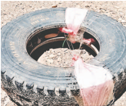
Detectaron artefactos explosivos dentro de neumáticos