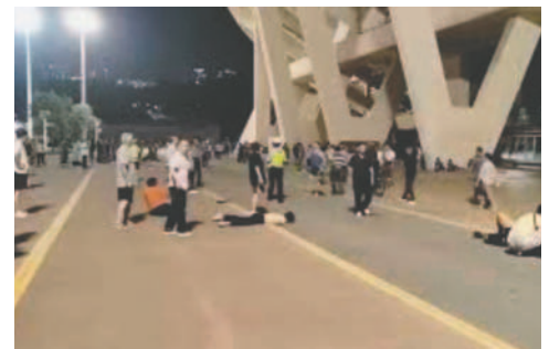
Un conductor arrolló con su vehículo a un grupo de personas el lunes por la noche en Zhuhai, China

Los videos mostraron a un bombero realizando RCP a una persona, mientras se decía a la gente que abandonara el lugar. Hasta el martes por la mañana,