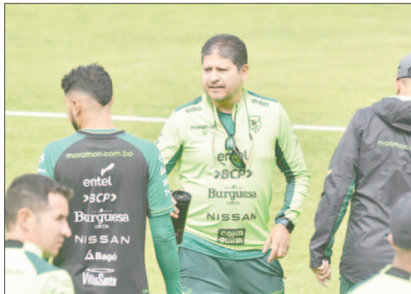
Óscar Villegas dirige a la selección boliviana de fútbol