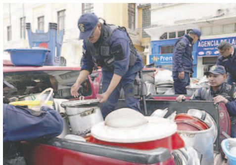
Defensa al Consumidor exhibió los utensilios decomisados