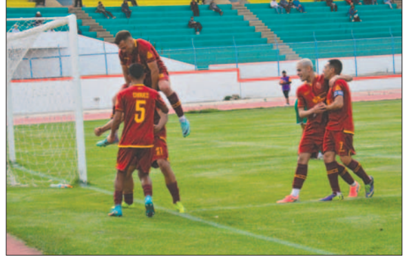
Los realistas esperan con todo al cuadro chuquisaqueño

Alianza Beni volverá a ser local en el encuentro de vuelta, que está programado para las 15:00 horas del domingo 24 de noviembre en el estadio Gran Mamoré de Trinidad.