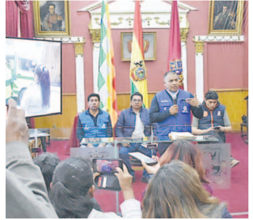
Autoridades municipales hacen conocer denuncias y piden al transporte urbano respetar tarifas

"La decisión de las tres instituciones ha sido de aplicar con relación a la fecha, el convenio que se ha firmado con organizaciones vecinales, gremiales y otras instituciones que han hecho conocer sus propuestas, al margen de los acuerdos que determinaba el 11 de noviembre, que ha sido rubricado por el alcalde, nosotros creíamos que se iba a decir 'estas son las nuevas tarifas', pero ha decidido desde enero. A la falta de cambios se va a originar problemas, si un niño cancela 70 centavos y paga Bs 1 y no hay cambio. Además, el pasaje de escolar no está bien a 50