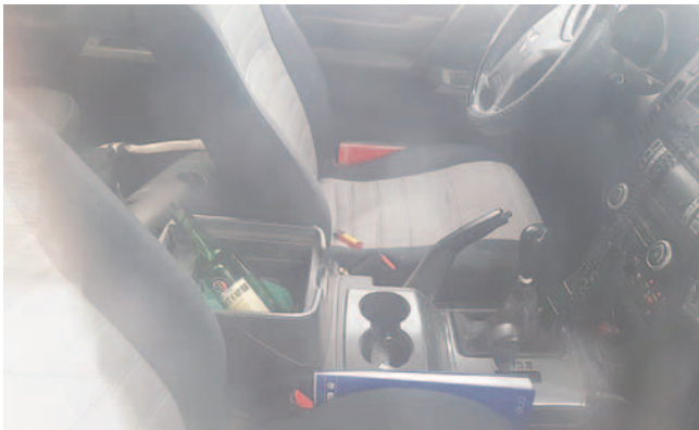
Dentro del motorizado se observó bebidas alcohólicas

Asimismo, el motorizado fue secuestrado para fines investigativos. “El vehículo se encuentra secuestrado en instalaciones del Comando Departamental, puesto que es una prueba evidente que demuestra que el vehículo es de uso oficial”, agregó.