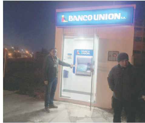
El jovencito, con ayuda de una piedra, trató de forzar un cajero y robar dinero

El fiscal Luis Antezana, indicó el martes 12 de noviembre que se realizará la imputación formal, considerando que se trata de un delito flagrante. Este proceso se remitirá ante el juez de la niñez