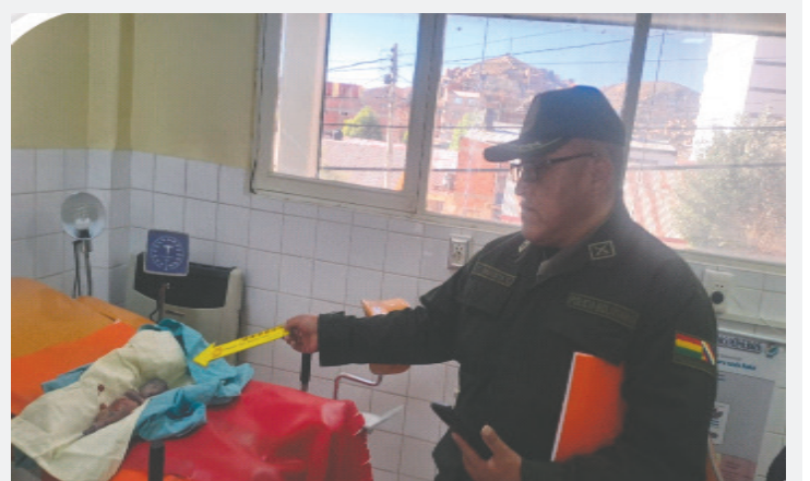
Efectivos policiales en el centro de salud

El jefe policial precisó que el personal de Laboratorio tomó muestras de tabletas cytotec. Asimismo, puntualizó que la mujer fue aprehendida y remitida al Ministerio Público para continuar con la investigación.