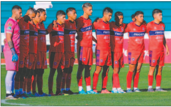
Universitario buscará sacar la ventaja en Oruro / CLUB UNIVERSITARIO