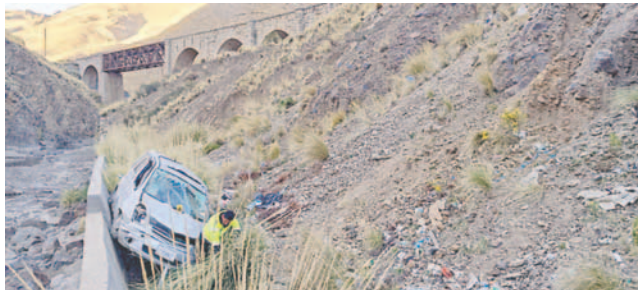
El motorizado reportó daños materiales en su estructura

La vagoneta marca Toyota de color plateado con placa de control 2358-BCF, de servicio particular, reportó daños materiales en su estructura, informó el responsable de la División Accidentes de Tránsito, Transporte y Seguridad Vial, teniente coronel Rommel Valdez.