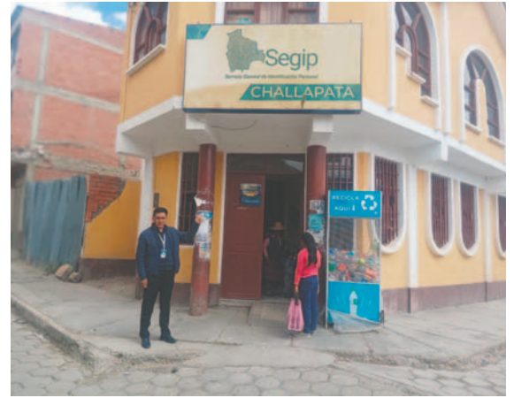
El incidente ocurrió en instalaciones del Segip en Challapata

"Él quería sacar un carnet con un primer apellido diferente al que ya tenía registrado. Es por eso que se apertura el caso; actualmente es de conocimiento del Ministerio Público", puntualizó Arequipa.