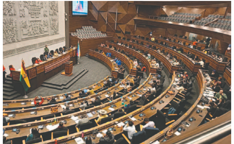
La Asamblea Legislativa Plurinacional (ALP)

con base en esta conformación, los asambleístas podrán trabajar con el pronunciamiento sobre el rechazo a la sentencia constitucional que declaró desierta la convocatoria para magistrados.