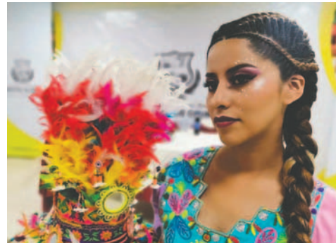
Mujeres demostraron su talento en el Curso de Emprendimiento en Maquillaje y Peinados

Para la clausura del curso, cada una de las participantes demostró todas las habilidades y técnicas aprendidas en una pasarela realizada por encantadoras señoritas que