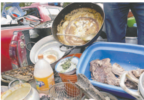
Utensilios y alimentos decomisados durante operativo en el mercado Fermín López y en un restaurante

“Vamos a hacer los controles correspondientes con la finalidad no de perjudicar al comercio, sino de que se generen mejores condiciones en la elaboración de alimentos cocidos y que se implementen medidas de protección correspondientes a la salud de los comensales”, aseveró Canqui.