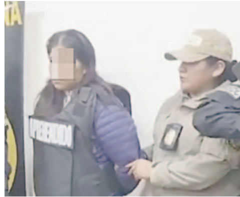
Una mujer de 30 años fue aprehendida en Potosí, acusada de raptar a una beba

“El Ministerio Público está atribuyendo la comisión del delito de Trata de Personas en su figura agravada, en virtud de que la víctima es una menor de edad. En ese sentido, hoy se está presentando, por parte de la Comisión de Fiscales asignados, la resolución de imputación formal y la solicitud de aplicación de la medida cautelar de detención preventiva”, indicó el fiscal departamental de Potosí, Gonzalo Aparicio Mendoza.