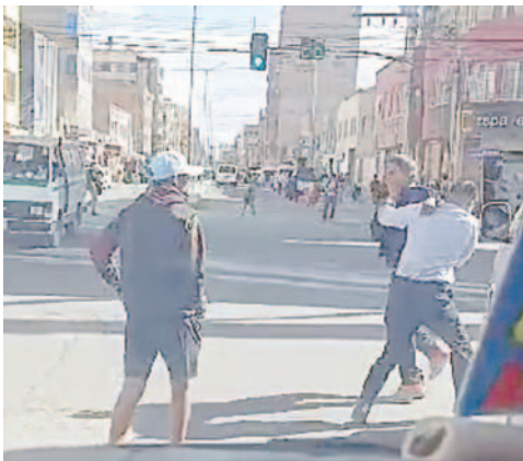
Captura del momento en que se registra una pelea en la calle