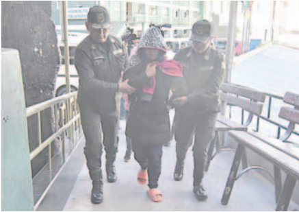
La mujer fue aprehendida el lunes