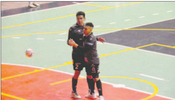
El equipo orureño no piensa en otra cosa que no sea ganar esta noche

Agregó que se están haciendo gestiones con el empresario para que puedan ser auspiciadores de una competencia similar en Oruro.