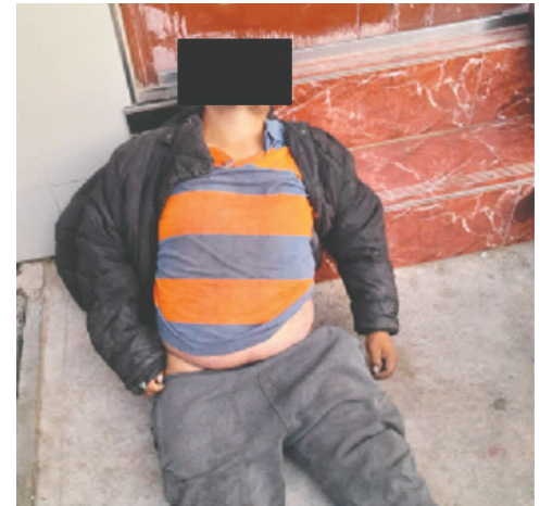
El ahora occiso fue encontrado muerto en vía pública

dáver a la morgue del Cementerio General de la urbe orureña. Por la valoración externa del cadáver no hallaron signos de violencia; sin embargo, se aguardan los resultados del protocolo de autopsia que establezca las causas de su muerte.