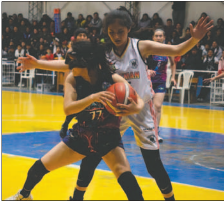
El partido CAN-Alemán se ha convertido en un clásico del baloncesto

La fecha del grupo "A" se complementará con el encuentro a jugarse en el coliseo 10 de Noviembre de Potosí, donde San Pedro tratará de frenar al conjunto de Club Tenis La Paz.