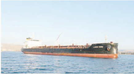
El buque Largo Eden descargó el fin de semana