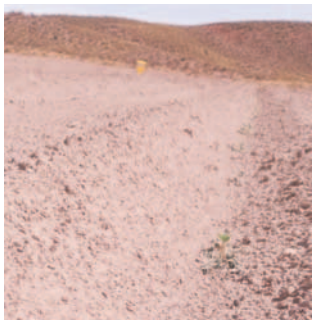
Denuncias afectación a parcelas de quinua en Puqui

“Estamos muy preocupados todos los productores de quinua, por lo que tenemos el único ingreso económico; con el alza de precios de la canasta familiar, así también el alza de precios en los materiales