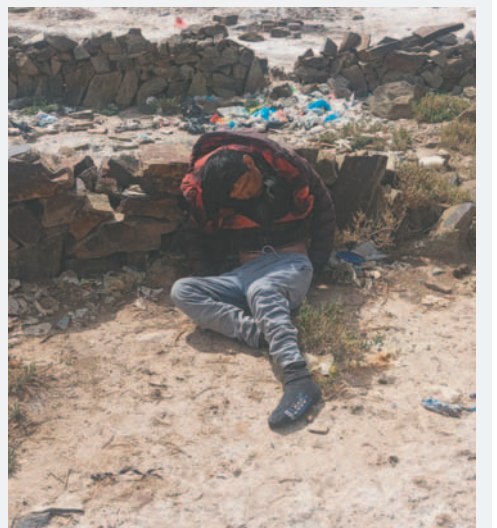
Según la Policía, el ahora hombre falleció por asfixia

por la postura en la cual se encontraba, habría sufrido una asfixia posicional. La investigación continúa y se espera obtener más información tras la autopsia correspondiente. En el transcurso de las indagaciones, se ha identificado a una persona con las iniciales A. A. L., cuyo nombre está sujeto a confirmación.