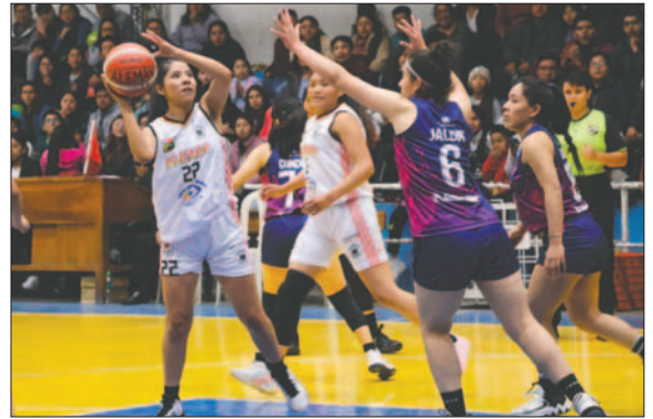
Alemán busca subir a la cima a costa de CAN

Alemán tuvo un comienzo arrollador en la primera rueda con dos triunfos notables; sin embargo, tras la pausa obligada del torneo, sufrió