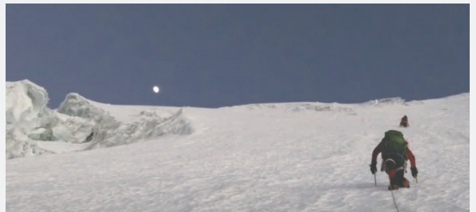
Personal de Bomberos rescató el cadáver del Huayna Potosí / REFERENCIAL

Un equipo de Bomberos se dirigió al lugar y procede a rescatarlo; posteriormente, será trasladado a la morgue judicial del Hospital de Clínicas. Según Tovar, por el momento no se logró identificar al fallecido, pero se conoce que es de mediana edad. El proceso de rescate demoró poco más de dos horas.