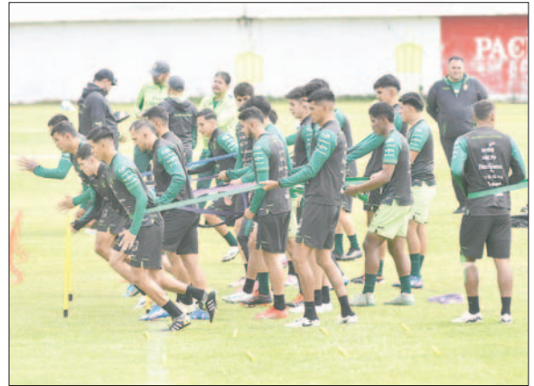
Durante el último entrenamiento en el país de la Verde previo al partido ante Ecuador