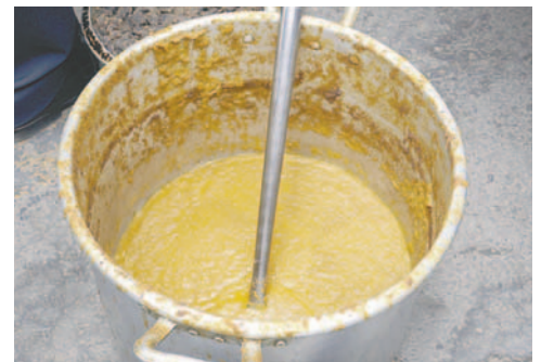
Por falta de higiene, alimentos fueron decomisados