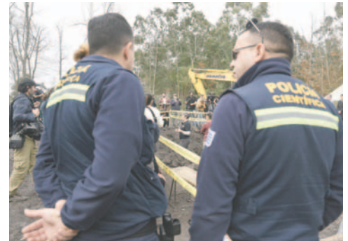
Autoridades uruguayas encontraron restos humanos en el Batallón No.14, en Montevideo

El pasado 30 de julio, durante una de las excavaciones llevadas adelante por el Grupo de Investigación en Antropología Forense (GIAF), que opera bajo la órbita de la Institución Nacional de Derechos Humanos (Inddhh), en el predio militar Batallón de Infantería Paracaidista 14, se produjo el último hallazgo de restos de un desaparecido uruguayo.