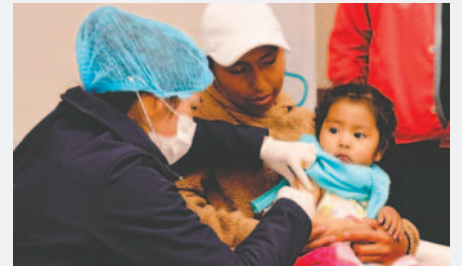
Enfatizan importancia de la vacunación en niños