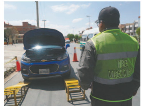
La Policía habilitó ocho puntos para la ITV en la ciudad de Oruro

exhortamos a todos los titulares y poseedores de vehículos motorizados apersonarse a estos puntos de inspección técnica, entendiendo que es una actividad directamente relacionada con seguridad ciudadana. Eso decimos en el entendido que un vehículo en condiciones de funcionamiento y de servicio, constituye una garantía en el transporte de pasajeros, peatones y conductores", dijo.