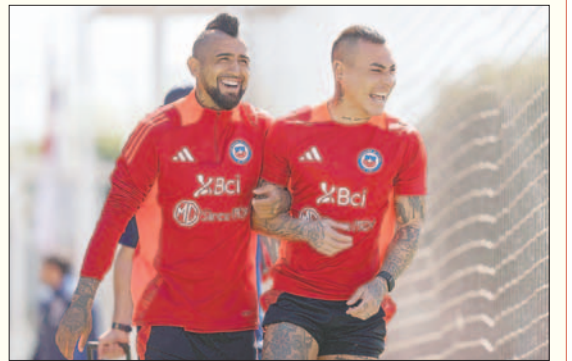
Arturo Vidal y Eduardo Vargas durante el entrenamiento de la selección chilena

En cuanto al duelo con Perú en Lima Vidal expresó que para Chile "es un clásico, un rival al que tenemos que ganarle y sumar como sea para meternos en carrera. El partido va a estar muy caliente, ellos necesitan ganar también".