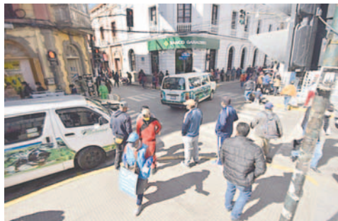
Algunas líneas de transporte urbano si incrementaron sus tarifas desde ayer

En esas líneas se colocaron letreros con tarifas que indicaban pasajes adultos a Bs 2, universitarios Bs 1,50 y escolares Bs 1. Lo que, en relación al DM 354 que debe aplicarse desde 2025, es mayor, ya que establece el pasaje a Bs 2 para mayores, microbuses Bs 1,50, universitario Bs 1, estudiantes de secundaria 70 centavos y de primaria 50. Para adultos mayores y personas con discapacidad será de Bs. 1 desde el año próximo.