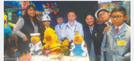
Los estudiantes mostraron sus aptitudes en el manejo del idioma