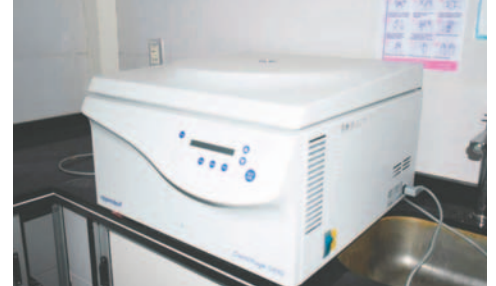
Equipos del laboratorio del Centro de Aislamiento Municipal están en desuso

En ese sentido, su autoridad envió una Petición de Informe Escrito (PIE) al Ejecutivo Municipal respecto al equipamiento del laboratorio, con el fin de conocer el tiempo de funcionamiento, su futuro y la posibilidad de traspasar el equipamiento a nuevos centros de salud que