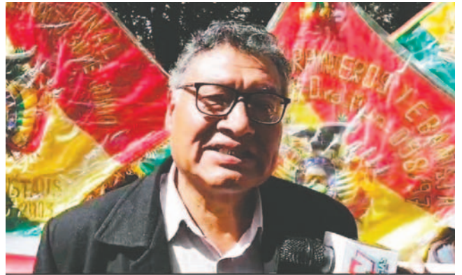
La Federación de Artesanos Trabajadores en Madera (Fatma) denuncia un drástico incremento en los precios que afecta a los carpinteros de El Alto

“Estamos sobreviviendo como carpinteros. Estamos pasando mo-