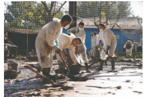
Voluntarios trabajan en las labores de retirada de lodo en el polideportivo de Masanasa (Valencia)

Albal ha informado a los vecinos en un bando que para extraer el lodo de los garajes deben ponerse en