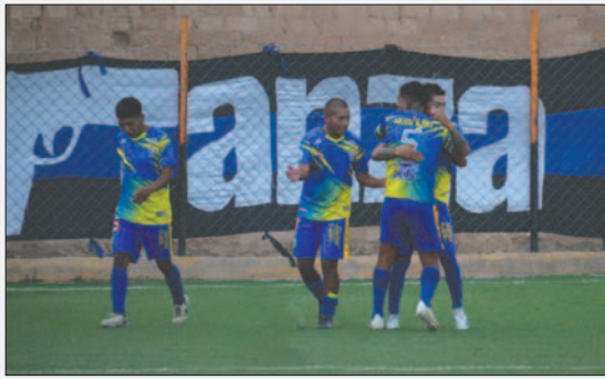
Con el triunfo, el cuadro “minero” retorna a la división Primera “A”

Cuatro partidos se disputaron el fin de semana en el marco del campeonato que regenta la Asociación de Fútbol Oruro (AFO) categoría Primera “B”. Los encuentros tuvieron lugar en la cancha “Gilberto Fiengo” de la Facultad Nacional de Ingeniería (FNI) y del Regimiento Camacho. Los resultados que se registraron, clarificaron el panorama de los equipos que ascenderán y además de los que in-