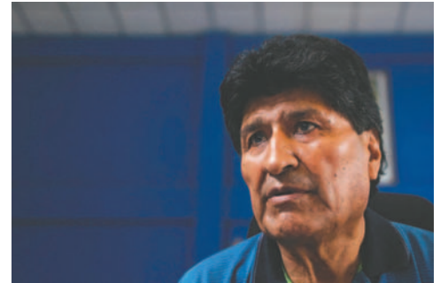
El expresidente Evo Morales anunció la marcha mediante sus redes sociales

El dirigente “evista” mencionó que será una protesta en la ciudad de Sucre para que las autoridades judiciales “se vayan a su casa”, tras las últimas resoluciones que emitió el Órgano Judicial.