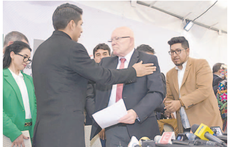
Todas las partes presentes firmaron el documento /APG