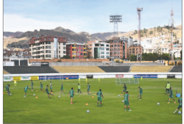
Durante el entrenamiento de los seleccionados en Achumani

que sus próximos rivales, Ecuador y Paraguay.