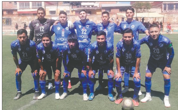
Deportivo Escara está a un paso de lograr la clasificación a Copa "Simón Bolívar"

Ingenieros no pudo ante Corque FC y cayó por 2 a 1; los "chivatos" se complicaron solos en su afán de llegar nuevamente al torneo nacional. Sportivo Euqueño dio la sorpresa y ganó a Deportivo Shalon por 3 a 1, eludiendo así toda posibilidad de