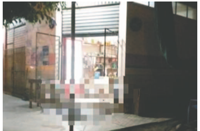
Investigan el asesinato de dos personas en una tienda

De acuerdo con el médico forense, cada persona recibió dos