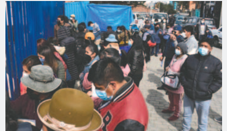
Padres de familia podrán hacer el registro en unidades educativas de alta demanda