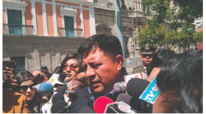
El ministro de Desarrollo Rural y Tierras, Yamil Flores

Flores también indicó que en esta reunión se abordarán los 17 puntos previamente discutidos en mesas de trabajo sobre temas económicos relacionados con el sector productivo.