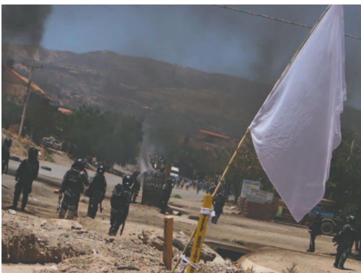
Los bloqueos se extendieron por más de 20 días