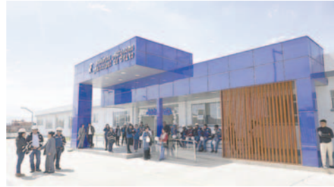
Centro de Salud Dios es Amor fue entregado

El área total del predio alcanza los 6 mil metros cuadrados, de los cuales el área construida es de 2.660 metros cuadrados. Se tiene un área de parqueo y aceras que están pavimentadas de 3.340 metros cuadrados y