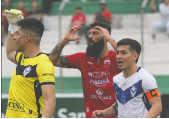
GV San José y Guabirá se enfrentarán este domingo en Oruro

La Federación Boliviana de Fútbol (FBF), a través de la Comisión