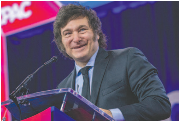
Imagen de archivo del presidente de Argentina, Javier Milei

El presidente de Argentina, Javier Milei, no asistirá a la XXIX Cumbre Iberoamericana que se llevará a cabo en Cuenca, Ecuador, el 26 y 27 de octubre, debido a su viaje a Estados Unidos para participar en la Conferencia de Acción Política Conservadora (CPAC) en Mar-a-Lago, donde se espera un encuentro con el presidente electo Donald Trump.