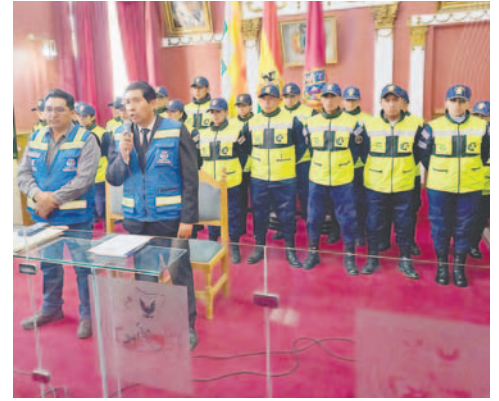
La Guardia Municipal del Transporte tiene 20 efectivos que harán controles

“La Ley del Transporte claramente establece algunos parámetros, hay solicitudes del transporte para el tema del precio y la ATM ha tomado la decisión, pero esto se aplica desde 2025, este año no hay incremento e igual tiene que ir acompañado de un mejoramiento del servicio, hay algunos ma-