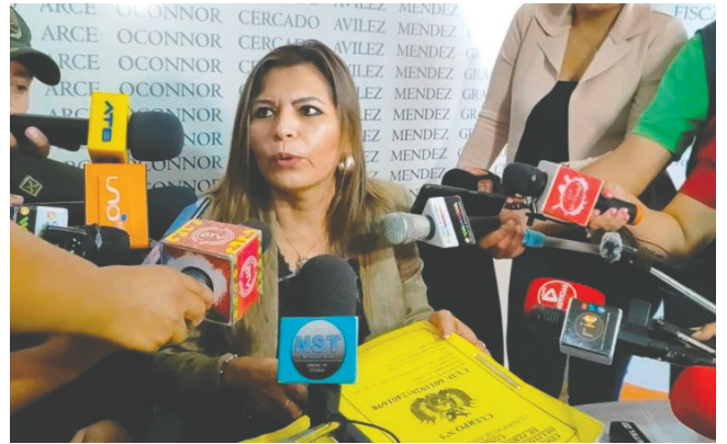
La fiscal departamental de Tarija

El dirigente cocallero no se presentó a declarar previamente ante la Fiscalía Departamental de Tarija, a pesar de que fue debidamente notificado. Esa instancia anunció que se