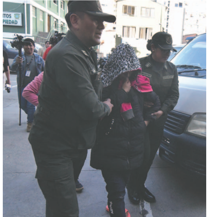
La mujer es escoltada por la Policía tras su aprehensión

Se aguardan los informes forenses, sostuvo el jefe de la División Homicidios de la Fuerza Especial de Lucha Contra el Crimen (Felcc), mayor René Tambo. La madre se encuentra aprehendida por el supuesto doble infanticidio y el caso está en investigación para establecer las causas que motivaron a la mujer a cometer los crímenes.