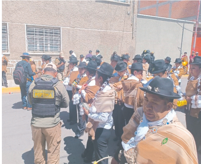
Funcionarios de Pofoma controlan en el ingreso del Primer Convite

El secuestro de las matracas se efectuó tras el control de verificación del código QR y el permiso que otorga el Ministerio de Medio Ambiente y Agua. El jefe policial adelantó que los danzarinés fueron citados a declarar y que el incidente fue remitido al Ministerio Público por vulnerar el