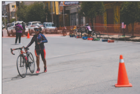
Se espera una buena cantidad de triatletas en el evento nacional

En este evento estarán tomados en cuenta los deportistas que participan en las categorías Súper Sprint, Sprint y Estándar.