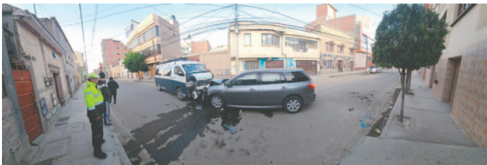
Ambos motorizados reportaron daños materiales / TRÁNSITO