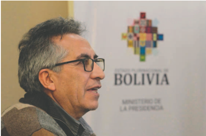
El viceministro Gustavo Torrigo