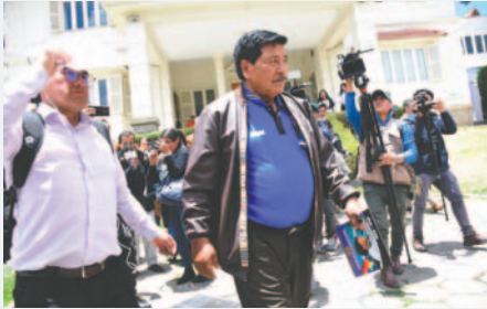
El vicepresidente del MAS salió antes de la reunión con el TSE