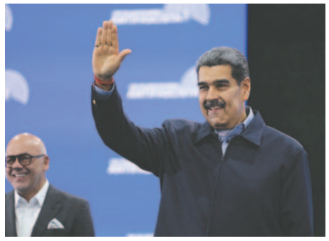
Fotografía cedida por Palacio Miraflores del presidente de Venezuela, Nicolás Maduro

LA PATRIA El presidente de Venezuela, Nicolás Maduro, llamó el lunes a los jueces del país y a la Fiscalía a revisar las detenciones registradas luego de las elecciones del 28 de julio, así como los procesos judiciales respectivos, para "rectificar" en caso de que haya habido errores. "Le hago un llamado al doctor Tarek William Saab, fiscal general, le hago un llamado a los jueces del país, como jefe de Estado, si hay algún caso que rectificar y revisar también que haya justicia", dijo el mandatario en su programa semanal de televisión. Aseguró que los 69 menores detenidos, que forman parte de los 1.836 presos