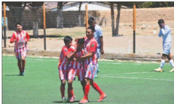
Corque FC frenó el "sueño" de Ingenieros de clasificar a Copa "Simón Bolívar"

rio como Rosario Central no sumen unidad alguna, algo que se torna por demás complicado. CDT Real Oruro es el candidato número uno al título; solo le falta un punto para lograr el bicampeonato.