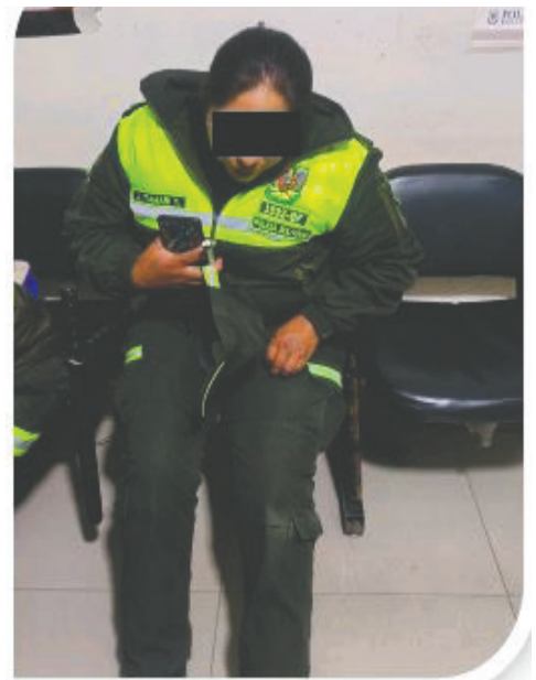
La uniformada tiene cinco días de impedimento médico legal