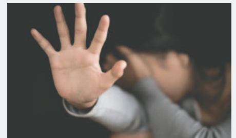
La víctima fue amenazada por su padre para que no denuncie el crimen sexual / REFERENCIAL