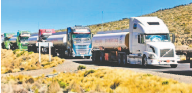
Las cisternas llegarán este martes

Delgadillo indicó que desde el domingo “se comenzó a despachar gasolina desde Sica Sica”