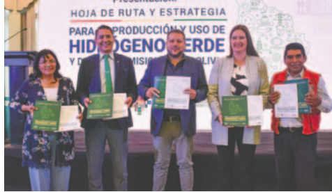
Autoridades buscan impulsar uso del hidrógeno verde

Hoja de Ruta presentada establece objetivos ambiciosos para desarrollar el hidrógeno verde como alternativa energética y analiza su potencial para 2050.