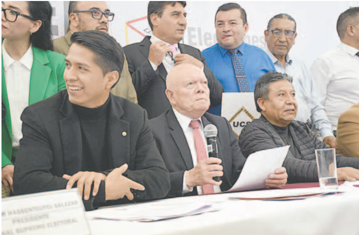
El presidente del Tribunal Supremo Electoral, Oscar Hassenteufel