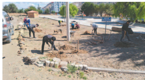
Docentes de la FNI trabajaron en la campaña de forestación frutal y de especies del oriente del mundo

Sin embargo, en un área, solo se pusieron acacias púrpuras, arce de Japón y otras más fueron puestas en el lugar, derivadas del país del oriente, ya que el proyecto es tener