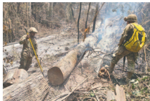
Efectivos realizan el apagado del fuego en el Madidi

"Hemos hecho sobrevuelos durante el sábado y domingo, no solamente con helicópteros, sino también con una avioneta que ha partido desde Cobija (Pando). El sector donde existía fuego está completamente controlado, no existe fuego ya en la zona", informó el viceministro Juan Carlos Calvimontes.