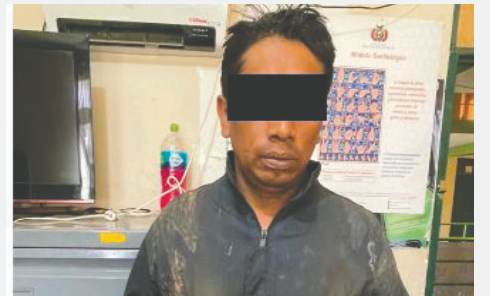
El implicado es investigado por hurto de mineral

Las acciones realizadas por los agentes del orden forman parte de un esfuerzo más amplio para combatir el hurto de minerales en la región, donde este tipo de delitos ha aumentado en los últimos años.