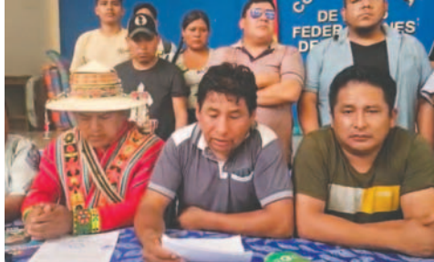
La convocatoria se realiza desde el Trópico de Cochabamba