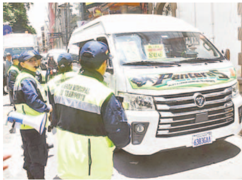
Controles realizados por la Guardia Municipal del Transporte en su primera jornada