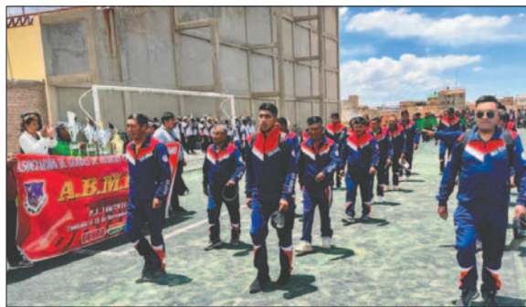
Durante el acto de inauguración del torneo de fútbol de los músicos profesionales

Los organizadores mencionaron que el torneo es una actividad tradicional de los intérpretes de los instrumentos de bronce, previo a la celebración de la festividad de Santa Cecilia, patrona de los músicos.