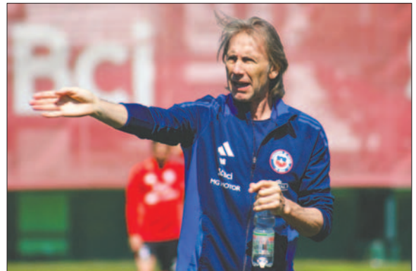
Ricardo Gareca dirige a la selección chilena de fútbol

En la actualidad, cierra el grupo de clasificación de Sudamérica para la próxima Copa del Mundo, con apenas cinco puntos, muy lejos de los puestos de acceso directo e incluso del repechaje.