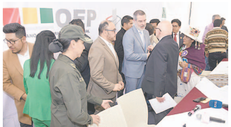
Participaron representantes de todos los órganos del Estado