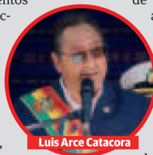
Luis Arce Catacora

Recientemente, el Presidente señaló que en Bolivia se entregaron, entre noviembre de 2020 y en lo que va de este año, 185 obras de infraestructura educativa con una inversión de Bs 900 millones, lo que permitió avanzar en el desafío de mejorar