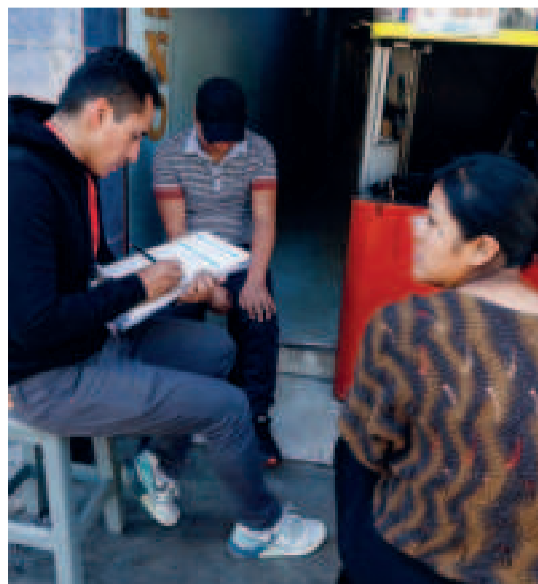
El Censo de Población y Vivienda, en marzo de este año.

El Primer Mandatario agradeció a los más de 500.000 censistas voluntarios que participaron activamente en la jornada censal del 23 de marzo en áreas amanzanadas y del 23 al 25 de marzo en áreas dispersas, que visitaron casa por casa para recabar datos a través del cuestionario censal en los nueve departamentos.