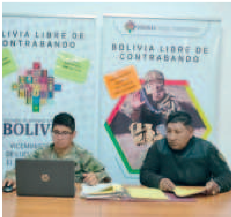
Coordinación de efectivos entre Bolivia y Chile para combatir el contrabando.