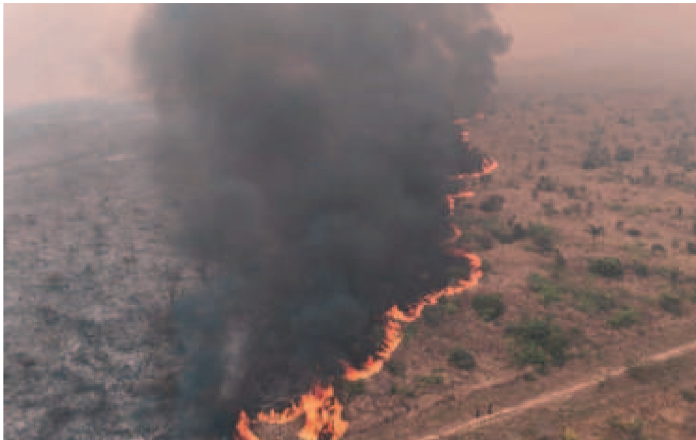
Incendio forestal registrado en la Amazonia boliviana.