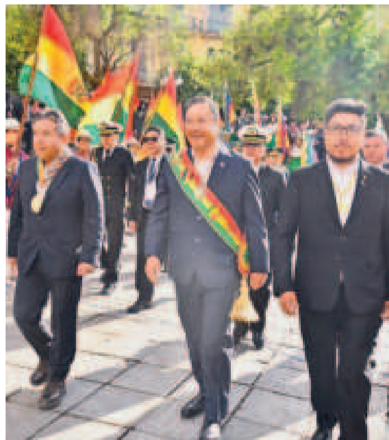
El presidente Luis Arce en los actos protocolares a los cuatro años de gestión de su gobierno.

Luis Arce Catacora Presidente de Bolivia