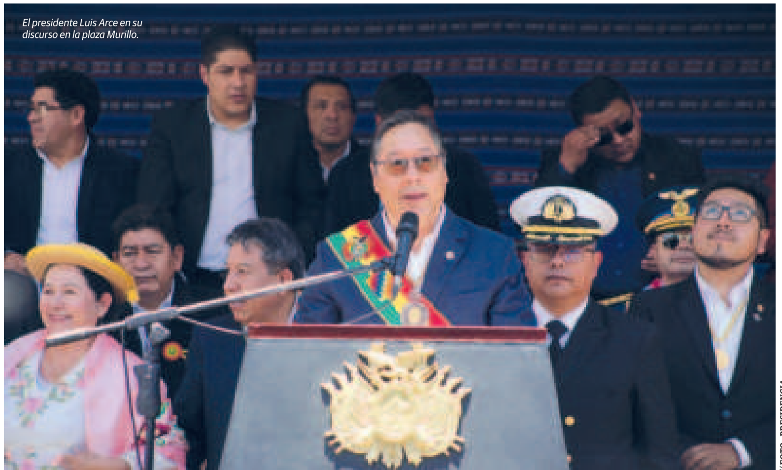
El presidente Luis Arce en su discurso en la plaza Murillo.

A esto se suma un contexto internacional desfavorable,