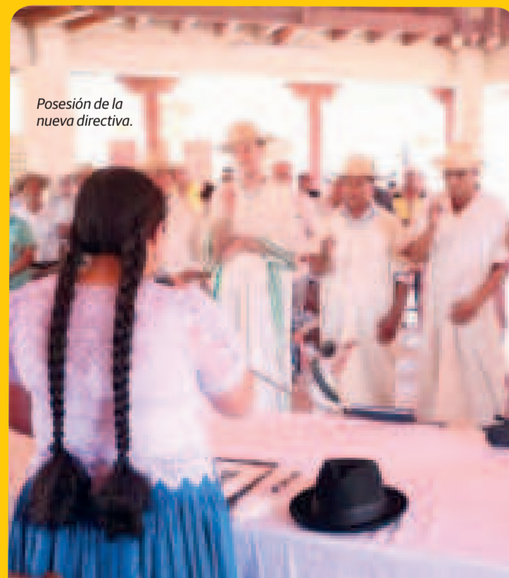
Posesión de la nueva directiva.

Esta festividad se caracteriza por incluir actividades referentes a músicas tradicionales, vestimenta colorida y diversas danzas que representan mitos y leyendas locales, es de gran importancia para la comunidad, ya que refuerza la identidad cultural, la cohesión social y la transmisión de tradiciones a las nuevas generaciones. En diciembre de 2012, la Organización de las Naciones Unidas para la Educación, la Ciencia y la Cultura (Unesco) declaró a la festividad Patrimonio Cultural Inmaterial de la Humanidad.