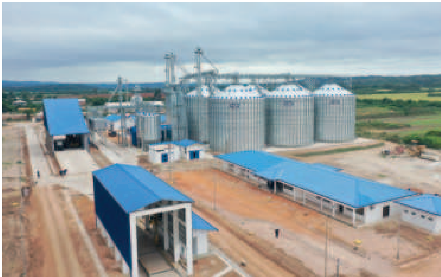
Las plantas industriales que construye el presidente Arce impulsan el potencial productivo de las regiones.

De acuerdo con el ministro de Desarrollo Productivo y Economía Plural, Néstor Huanca, la