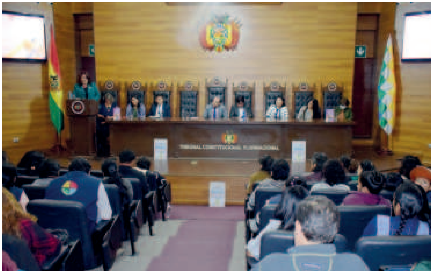
Autoridades del Tribunal Constitucional Plurinacional (TCP) durante un seminario en la ciudad de Sucre.