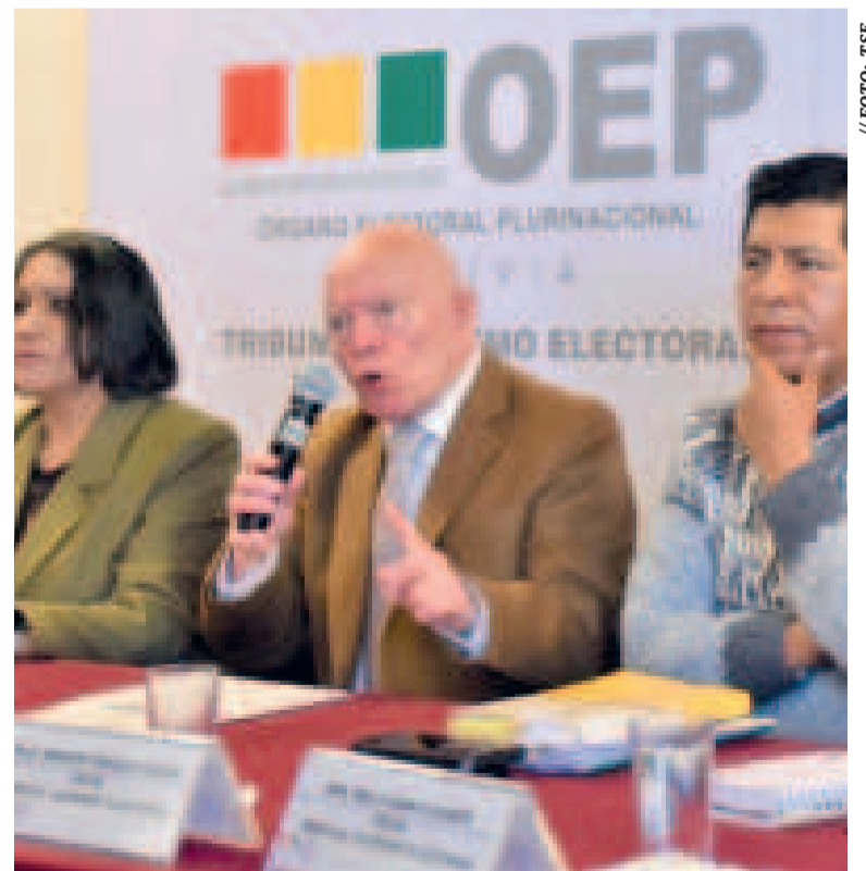
Hassenteufel en conferencia de prensa.

Óscar Hassenteufel Presidente del Tribunal Supremo Electoral