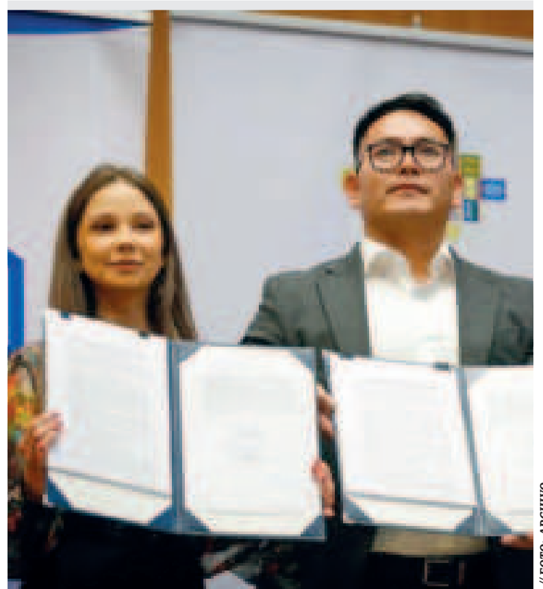
Los representantes de las empresas rusa y boliviana en la firma del contrato, en septiembre.