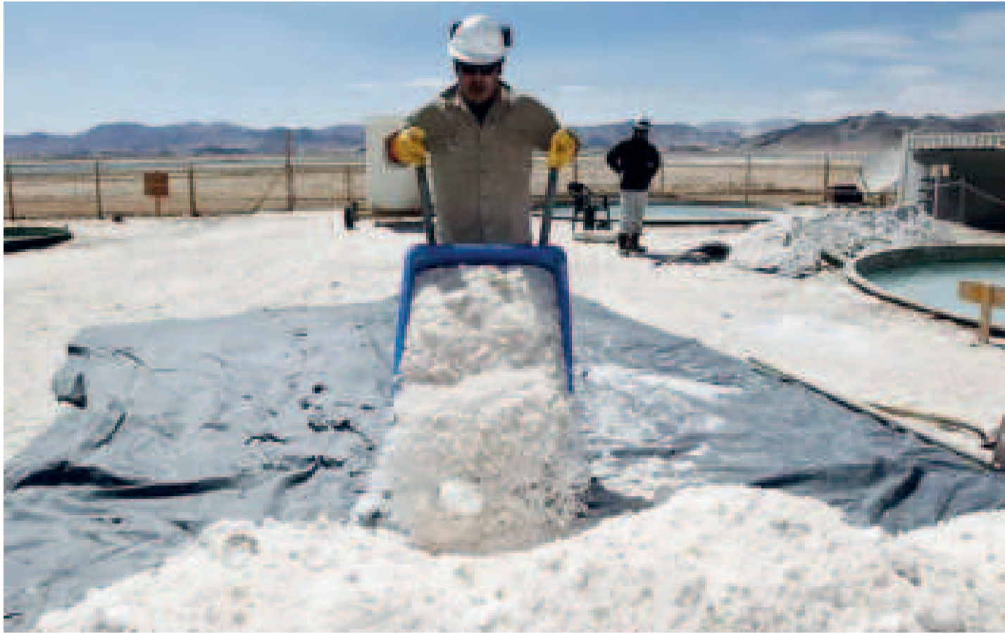
Trabajos en el salar de Uyuni.