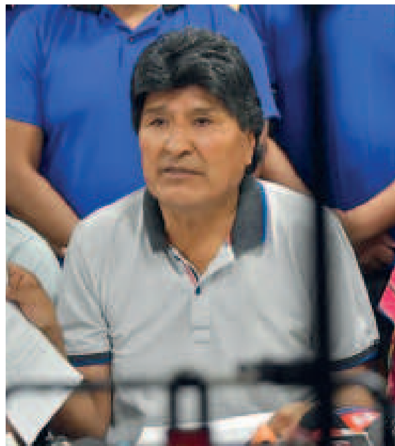
Evo Morales queda inhabilitado para postular a la presidencia.

Con el fin de garantizar su candidatura, impulsó un bloqueo de caminos entre el 14 de octubre y el 6 de noviembre para que se reconozca el congreso de Lauca Ñ y su candidatura, además de evitar un proceso por trata y tráfico de personas.