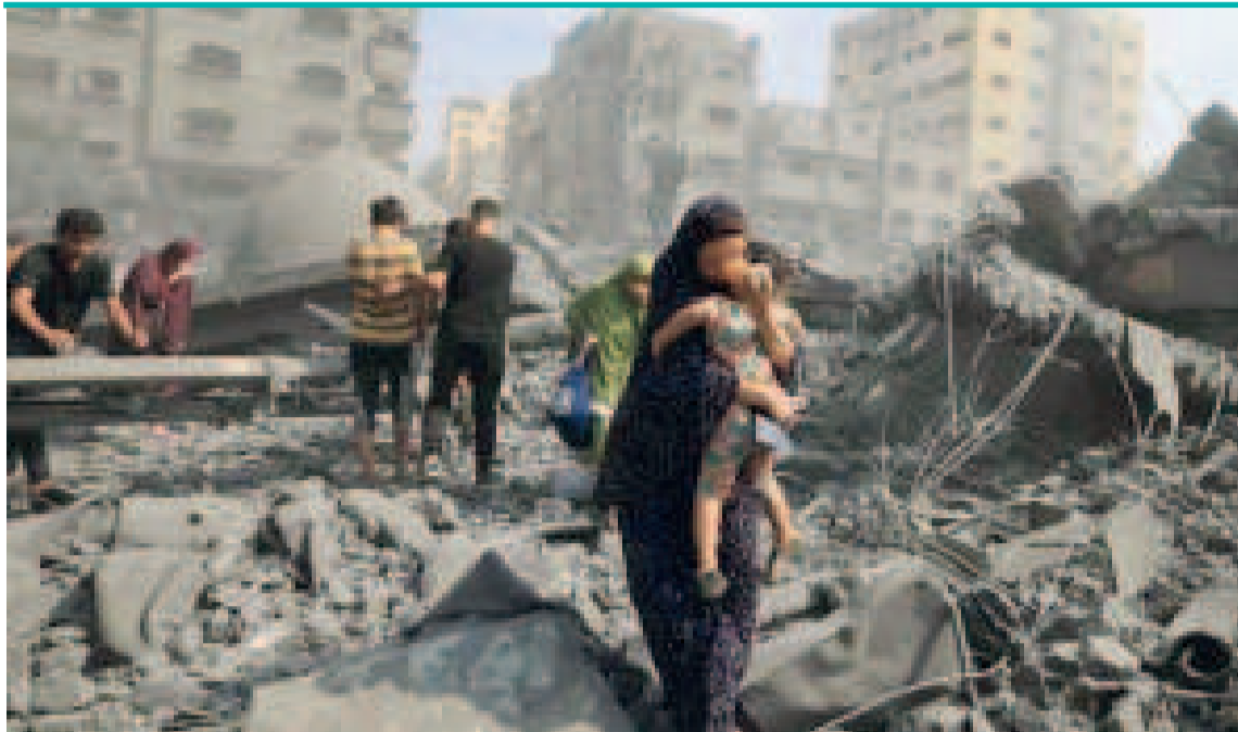
Lás víctimas son más del 70% mujeres y niños.