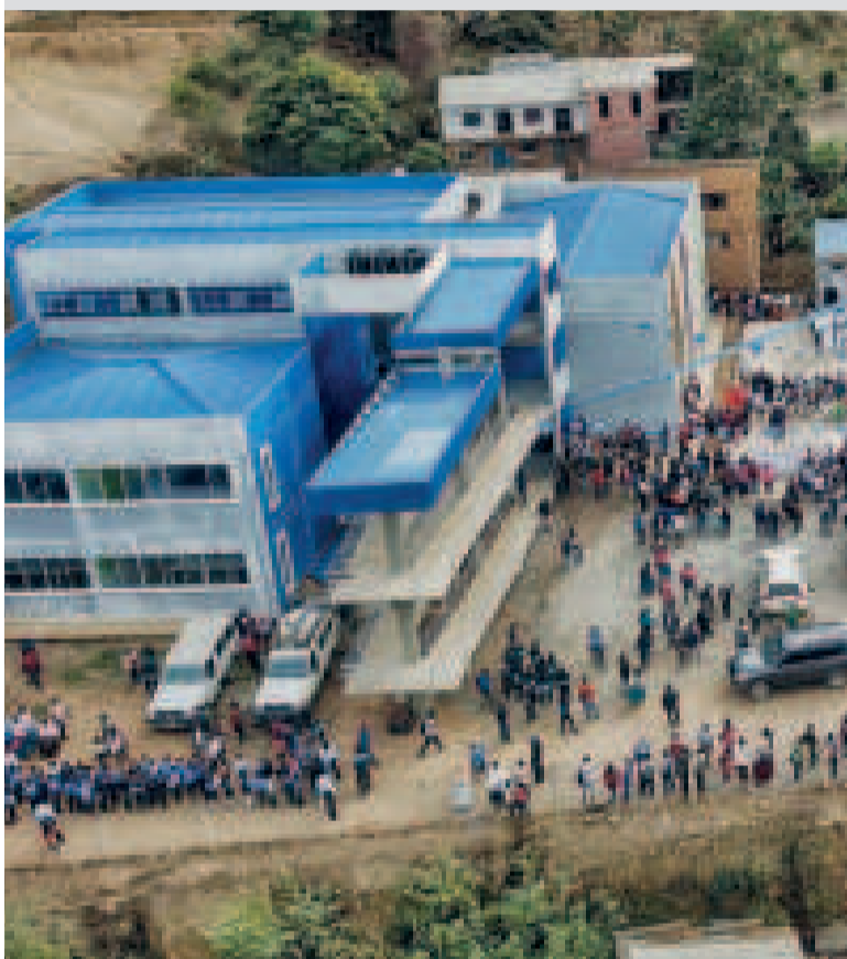
Una de las obras educativas entregadas mediante la UPRE.