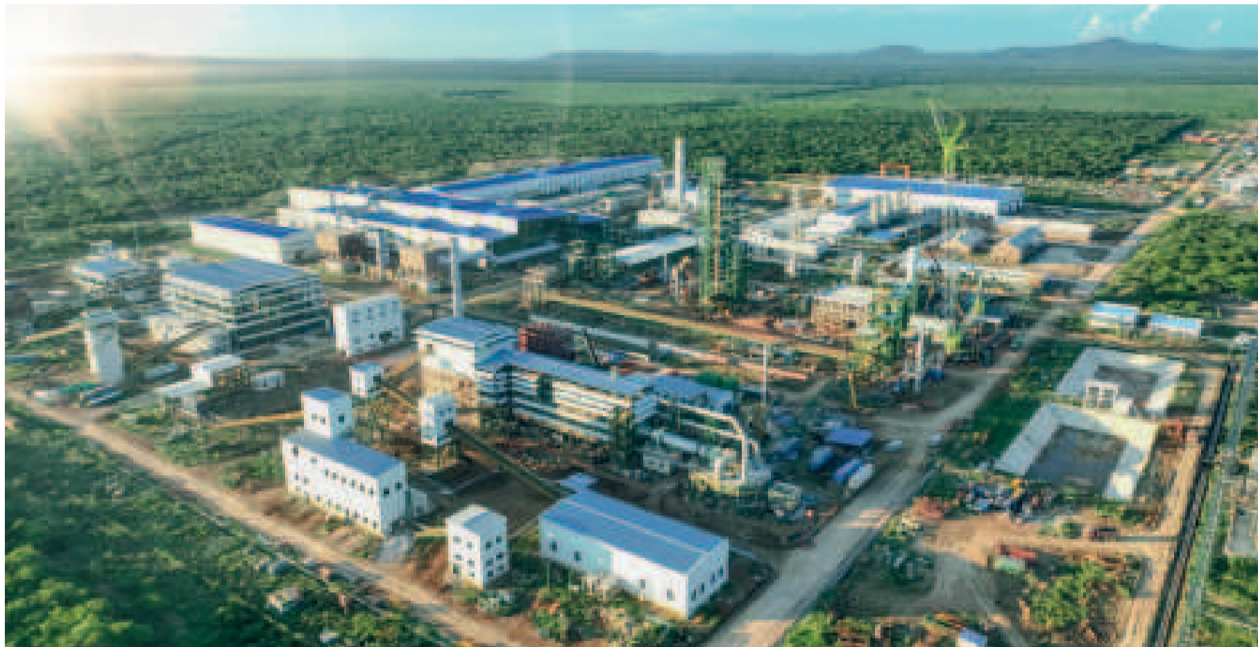
Vista aérea del Complejo Siderúrgico del Mutún, ubicado en Puerto Suárez, Santa Cruz.