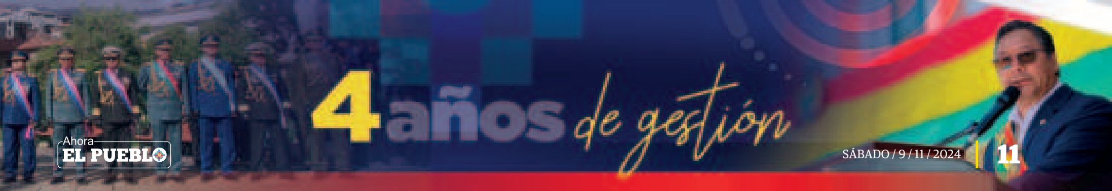
El presidente Luis Arce durante el informe de sus cuatro años de gestión.