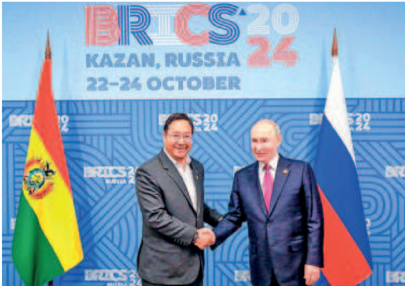
El presidente Luis Arce junto a su homólogo Vladimir Putin en la cumbre de Kazán.

Bolivia busca apoyo para acelerar la industrialización de los recursos naturales, por ejemplo el litio, con los Brics.