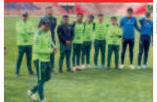
El DT Villegas da instrucciones a los jugadores Sub-20.

La Federación Boliviana de Fútbol programó para el martes 12 la venta de los boletos en físico en las boleterías del estadio de El Alto, a partir de las 10.00.