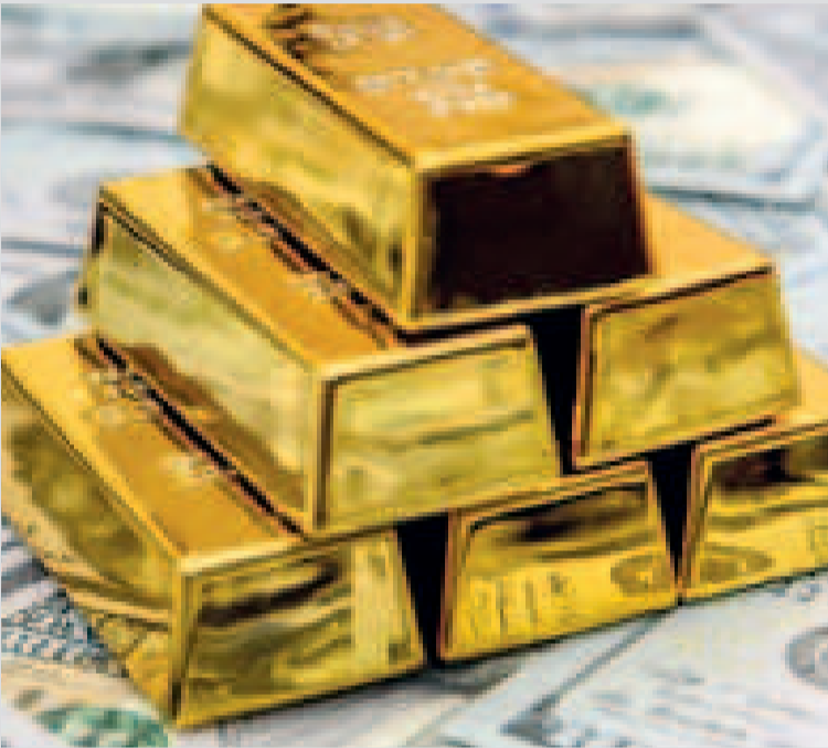
El BCB emitió una resolución para dejar sin efecto el cómputo de reservas de oro.