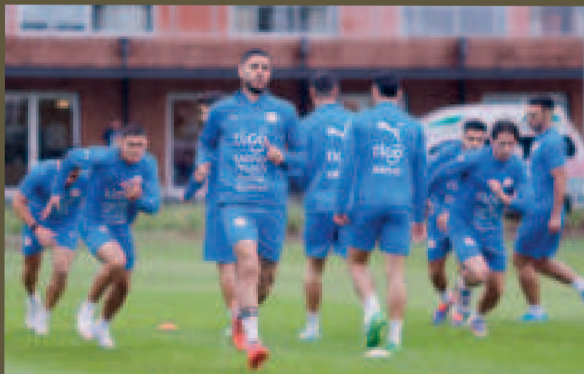
La selección paraguaya recibirá la visita de Argentina en el estadio Defensores del Chaco.

Para asegurar el cumplimiento de esta disposición, habrá una fuerte presencia de guardias en el estadio