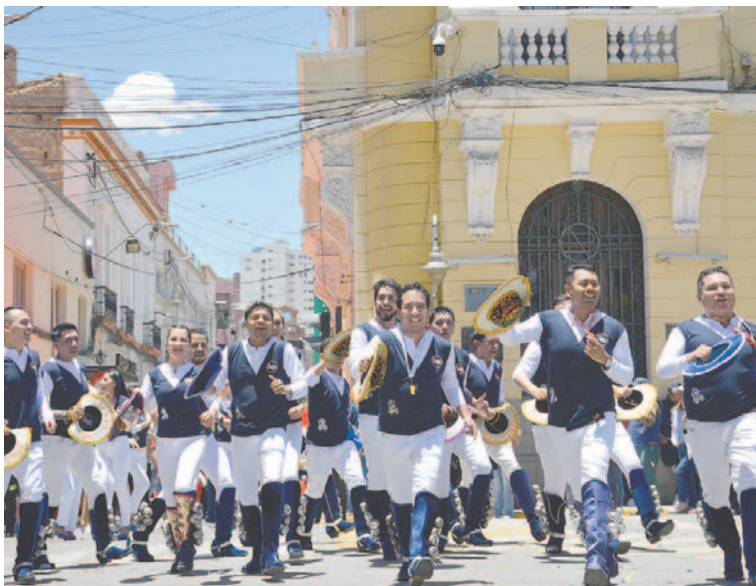
Los Caporales Centralistas hicieron vibrar la Plaza Principal