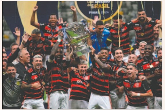
Jugadores del Flamengo con el trofeo de campeón de la Copa do Brasil

El ecuatoriano Plata, que había entrado por Michael, se escapó solo y superó al portero Everson con una medida vaselina cuando faltaban siete minutos para el final. El gol terminó de derrumbar al Mineiro, que ahora solo piensa en la final de la Libertadores.