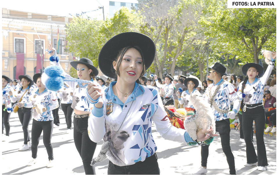
Las mujeres de la Llamerada mostraron la riqueza de la danza en el Primer Convite