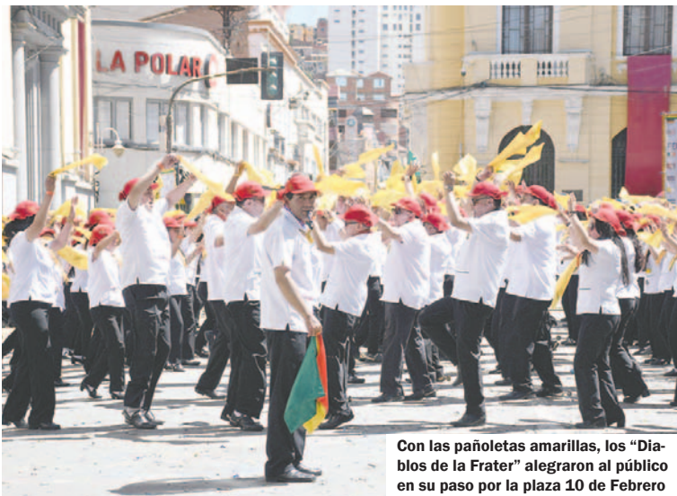
Con las pañoletas amarillas, los "Diablos de la Frater" alegraron al público en su paso por la plaza 10 de Febrero