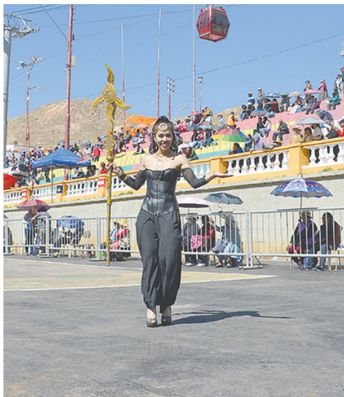
Belleza y elegancia en la danza de los Incas