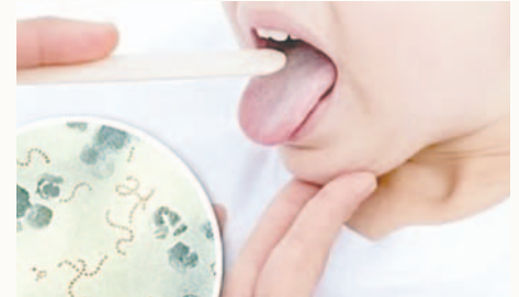
Por la enfermedad, dos menores fallecieron /REFERENCIAL