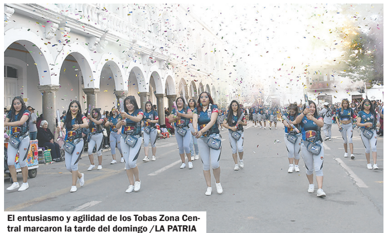
El entusiasmo y agilidad de los Tobas Zona Central marcaron la tarde del domingo