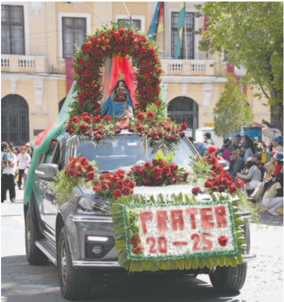
El vehículo de la Fraternidad Artística y Cultural La Diablada marca el inicio del paso de los "diablos" de este conjunto