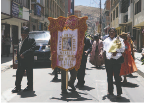
Pasantes encabezaron el recorrido por el día de los mercados

Ayer, como es costumbre, desde muy temprano, los pasantes de los diferentes mercados y ferias de la ciudad ofrecieron misas en varias parroquias de la ciudad para rendir su devoción a