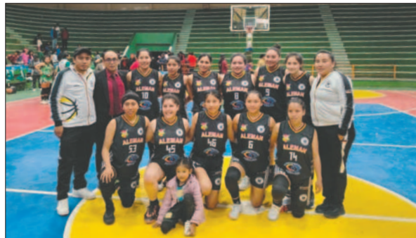
Alemán sigue en lucha por la clasificación a la próxima etapa

En la parte final del encuentro, Alemán se propuso sobrepasar la barrera de los 100 y logró hacerlo, ya que las jugadoras estaban muy