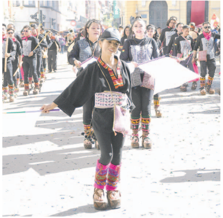
La belleza estuvo marcada en varios de los conjuntos del Carnaval de Oruro