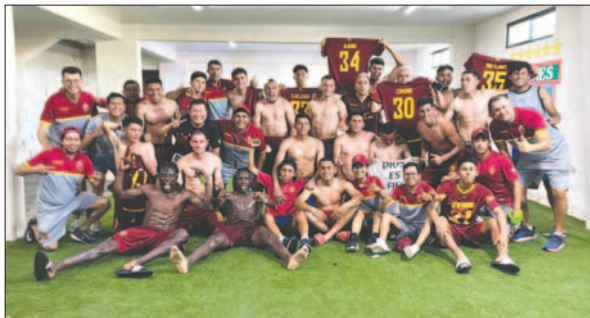
Jugadores del equipo realista celebran la clasificación

De los dos equipos orureño que llegaron a cuartos de final, solo uno pudo lograr el objetivo de seguir avanzando, CDT Real Oruro, venció a CD Nueva Santa Cruz por 4-0 en la ida y perdió 2-0 en la vuelta, de manera que con el global de 4-2 pasó a semifinales. Su rival Universitario, perdió en la ida ante Petrolero del Chaco en Yacuiba 3-0, en la vuelta en Sucre, venció 5-3, de manera que la llave se resolvió en los penales, tanda en la que los "estudiantiles" ganaron por 5-2.