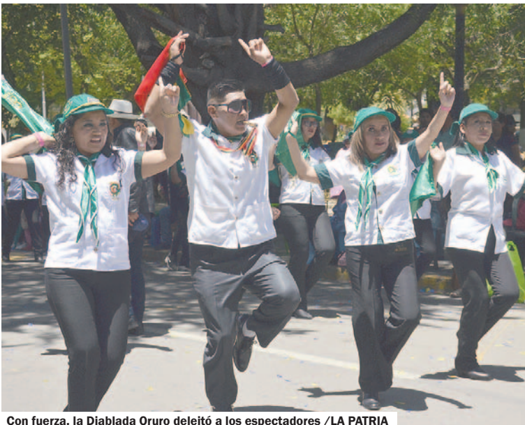
Con fuerza, la Diablada Oruro deleitó a los espectadores