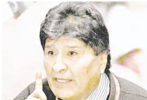
El expresidente Evo Morales, en conferencia de prensa

Señaló que la crisis del Estado central llevó a imponer un gasolinazo a medias, vendiendo com-