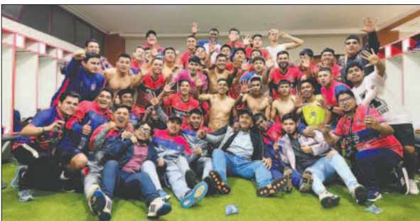
El plantel "estudiantil" festeja la clasificación a semifinales / CLUB UNIVERSITARIO

Está claro que los ganadores de la etapa semifinal, pasarán a la final, el campeón recibirá como premio, el ascenso a la División Profesional, mientras que el perdedor, al margen del título de subcampeón, jugará el ascenso indirecto con el penúltimo de la tabla acumulativa de la temporada 2024 en la División Profesional.