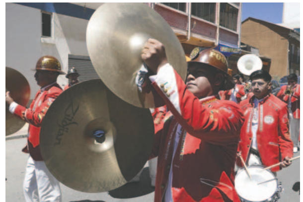
Bandas de música acompañaron el festejo de los comerciantes