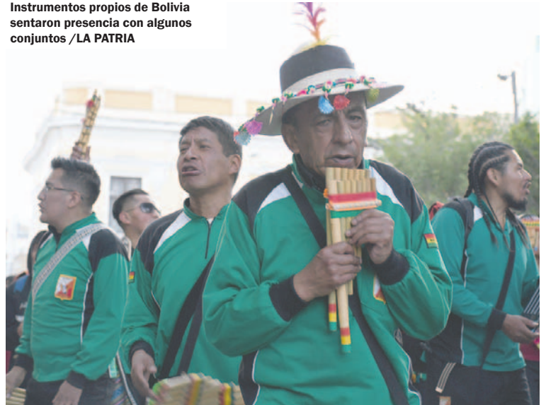
Instrumentos propios de Bolivia sentaron presencia con algunos conjuntos