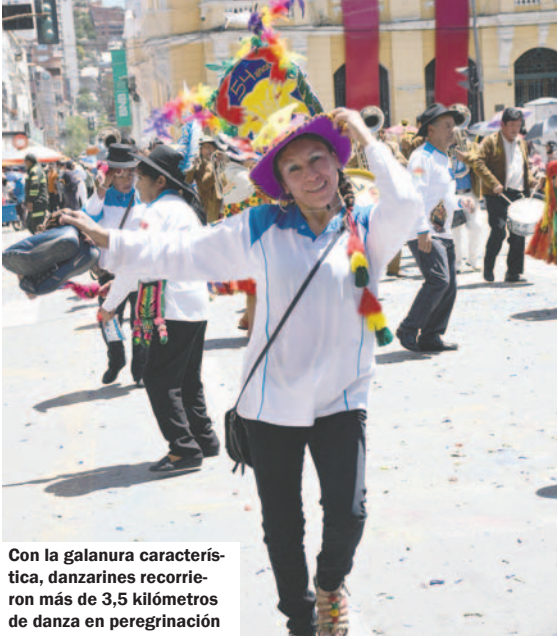
Con la galanura característica, danzarinas recorrieron más de 3,5 kilómetros de danza en peregrinación