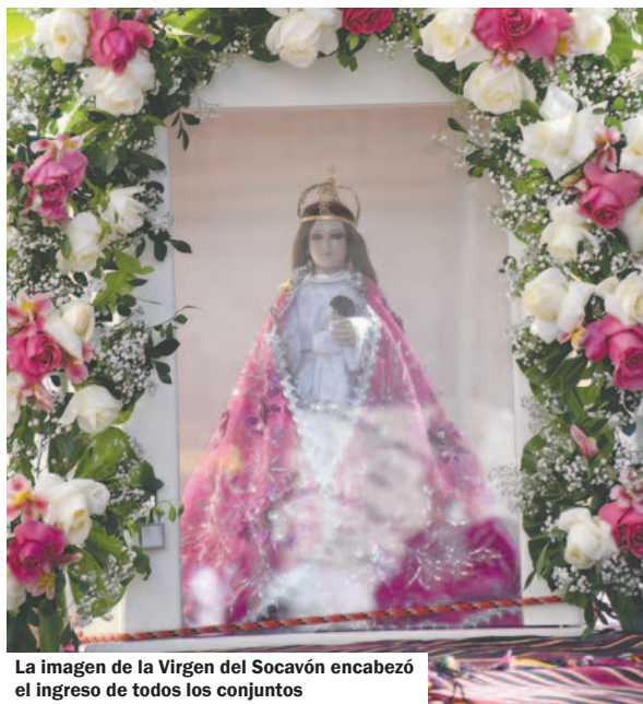
La imagen de la Virgen del Socavón encabezó el ingreso de todos los conjuntos