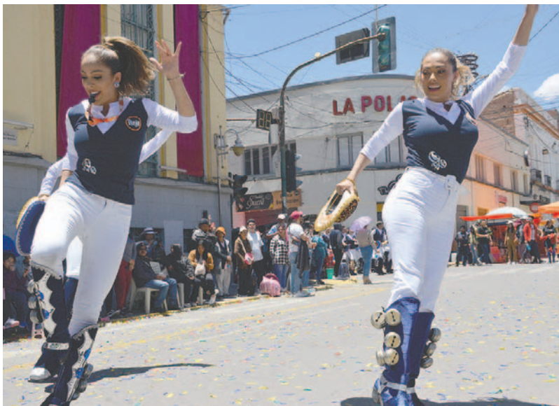
Gran agilidad de las machas de los Caporales Centralistas