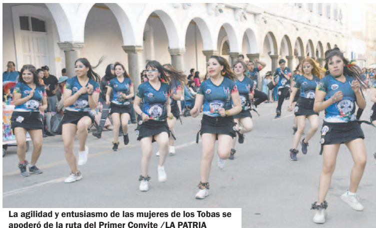
La agilidad y entusiasmo de las mujeres de los Tobas se apoderó de la ruta del Primer Convite