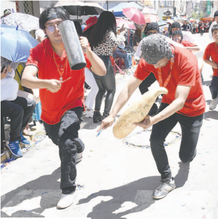
La alegría de los Negritos contagió al público presente