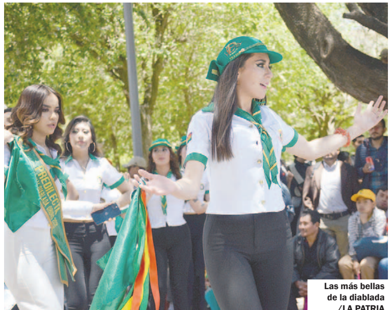
Las más bellas de la diablada