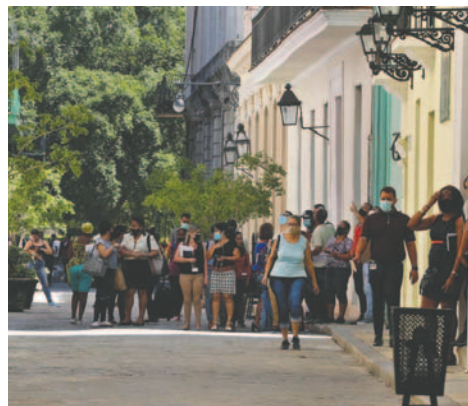
Fotografía de varias personas que esperan afuera de los edificios tras un sismo en Cuba

temblores de tierra se reportan en esta falla Oriente, ubicada a lo largo de la costa sureste de la isla. En 2018 se produjeron 15 movimientos perceptibles solo en esa zona.