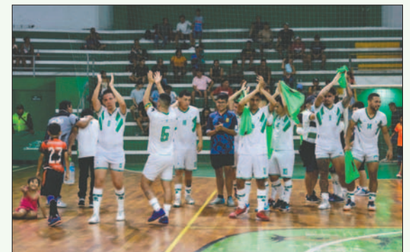
CRE de Santa Cruz será el rival de Fantasmas Morales Moralitos en semifinales

Enfrente tendrán a Petrolero, que, en la ida, y de local, ganó 2-1 al cochabambino Víctor Murriel. Mientras que, en la vuelta, disputado el sábado en el coliseo "Evo Morales", los yacuibeños ganaron por 1-3 con un resultado final de 5-2.