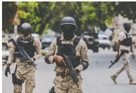
Fotografía de archivo que muestra a policías haitianos vigilando una calle en Puerto Príncipe (Haití)

de duración y fechado este domingo, "Barbecue" también se refiere al conflicto entre el Consejo Presidencial de Transición (CPT) y el primer ministro, Garry Conille, que ha desembocado en su destitución y su sustitución por el empresario Alix Didier Fils-Aime, como se publicará el lunes en el diario oficial, Le Moniteur.