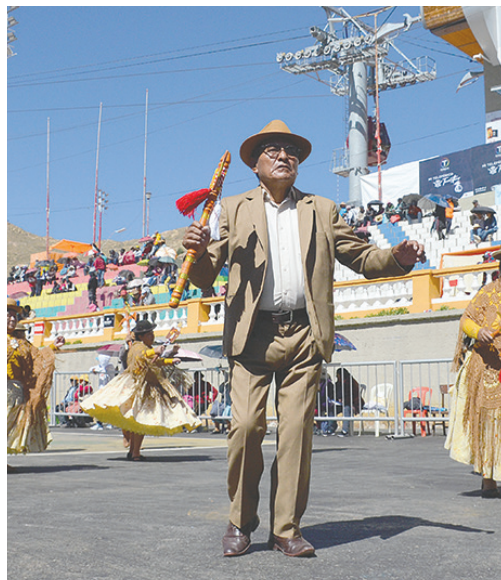
La danza de los Incas representa la adoración al sol