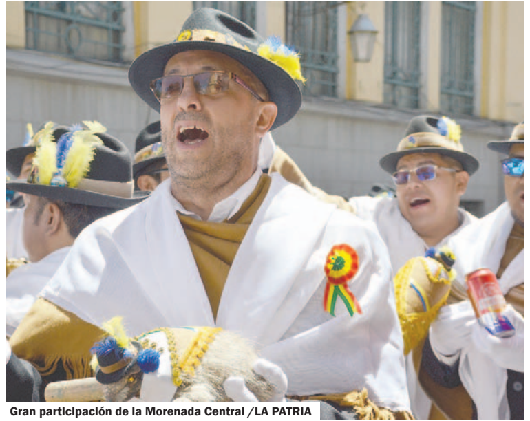
Gran participación de la Morenada Central