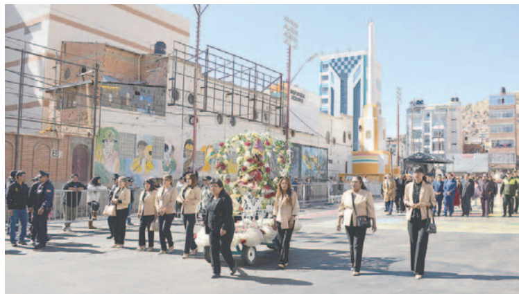
La imagen de la Virgen del Socavón fue llevada por la cofradía de la ACFO