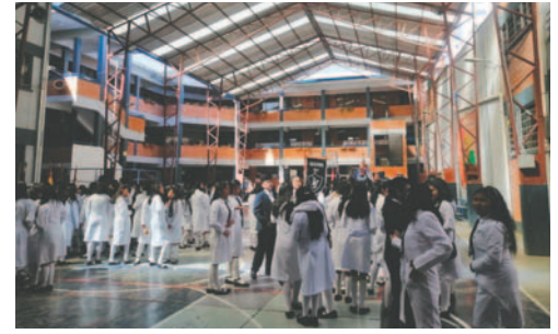
Hoy inician preinscripciones en unidades educativas de alta demanda

Del 25 al 26 de noviembre se realizará específicamente la preinscripción para herma-