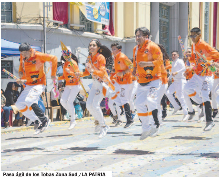
Paso ágil de los Tobas Zona Sud