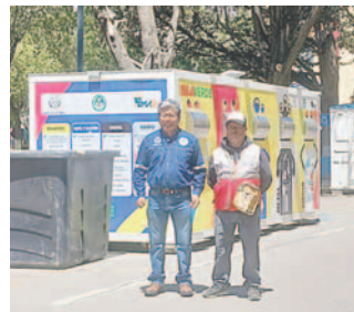
Se puso mayor cantidad de contenedores y rejas de acopio en la ruta del Primer Convite

Los contenedores, islas verdes y puntos de acopio, fueron puestos en toda la ruta del Primer Convite