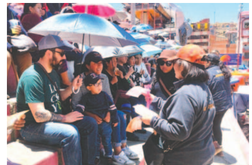
Personal de la DIO se desplazó por la ruta del Primer Convite

Para el desarrollo del Primer Convite, el 100% de la Guardia Municipal fue desplazada para el control correspondiente en la ruta de la entrada, acción que fue coordinada con el Comando Departamental de la Policía para coadyuvar en las tareas de seguridad ciudadana.