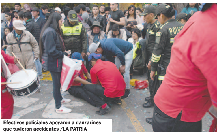
Efectivos policiales apoyaron a danzarines que tuvieron accidentes