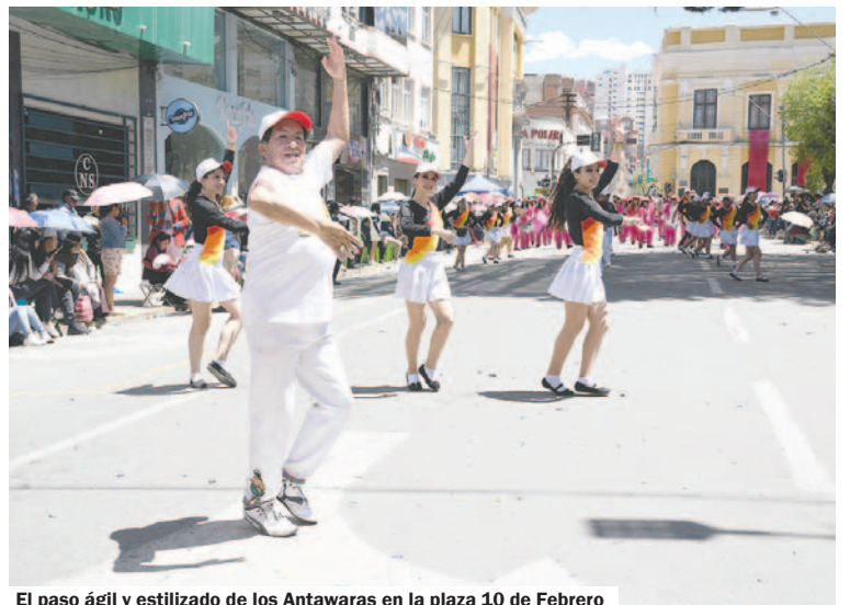
El paso ágil y estilizado de los Antawaras en la plaza 10 de Febrero