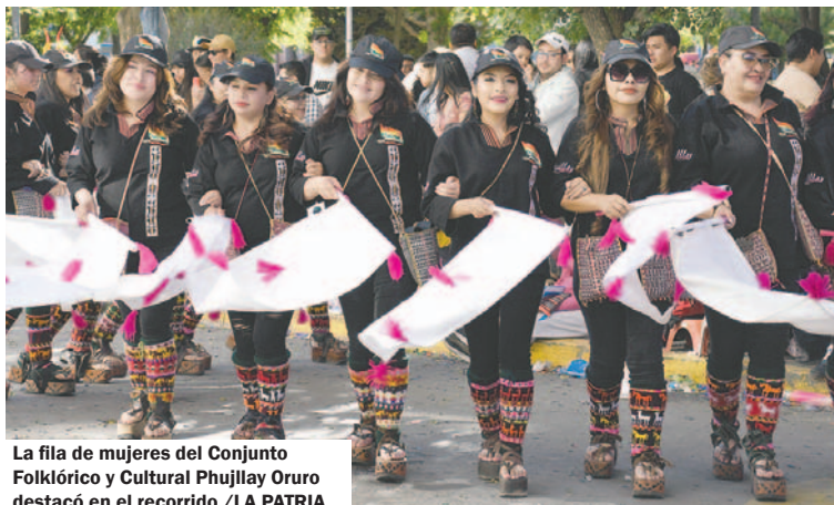
La fila de mujeres del Conjunto Folklórico y Cultural Phujllay Oruro destacó en el recorrido