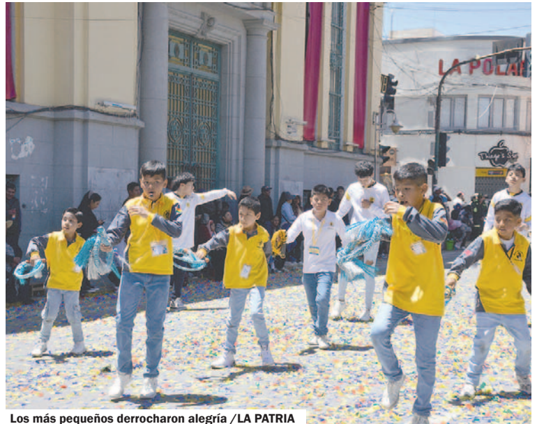
Los más pequeños derrocharon alegría