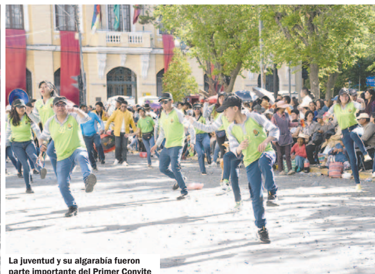
La juventud y su algarabía fueron parte importante del Primer Convite