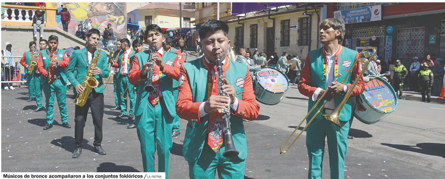
Músicos de bronce acompañaron a los conjuntos folklóricos