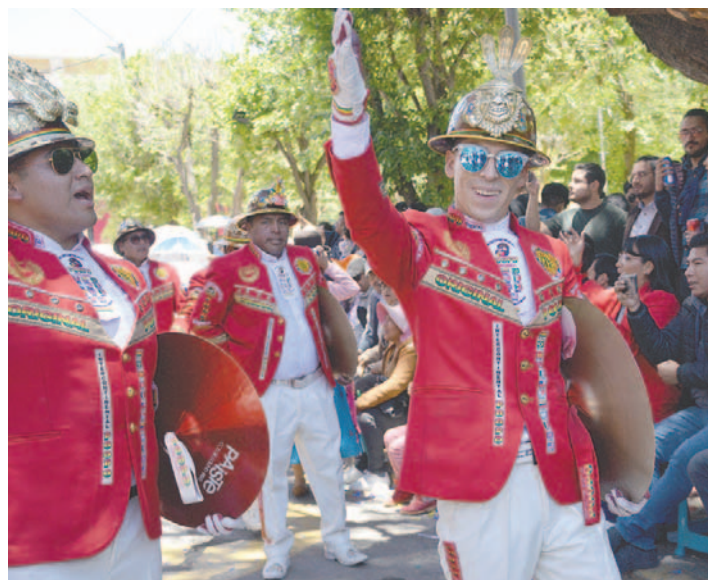
La Banda Intercontinental Poopó brilló con espectacular presentación