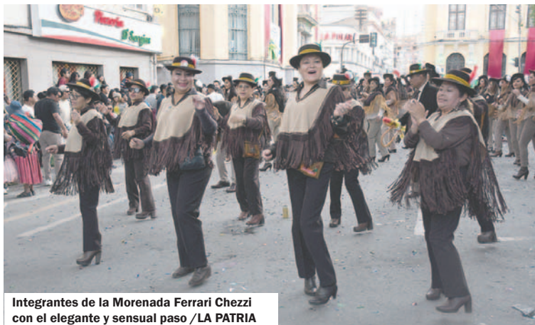
Integrantes de la Morenada Ferrari Chezzi con el elegante y sensual paso