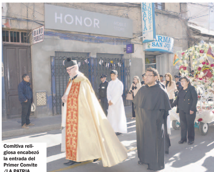
Comitiva religiosa encabezó la entrada del Primer Convite

Durante la entrada del Primer Convite rumbo al Carnaval de Oruro, Obra Maestra del Patrimonio Oral e Intangible de la Humanidad 2025, danzarines demostraron su fe ante la Virgen del Socavón.