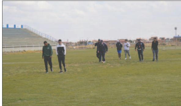
Los jugadores no entrenarán hasta que se arregle el tema económico