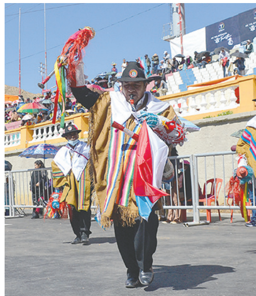
La Morenada Zona Norte, la más antigua del mundo