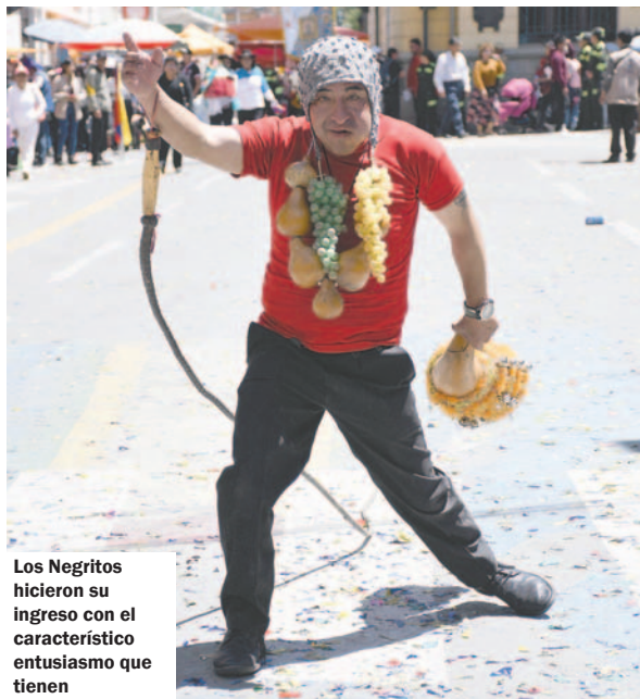
Los Negritos hicieron su ingreso con el característico entusiasmo que tienen