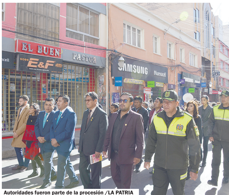
Autoridades fueron parte de la procesión