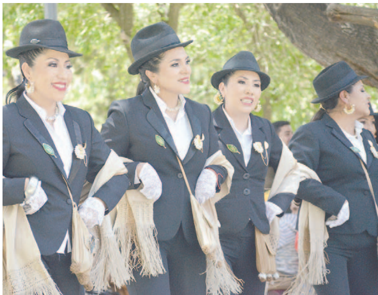
Con gran entusiasmo, la Morenada Cocani demostró su fe ante la Mamita del Socavón