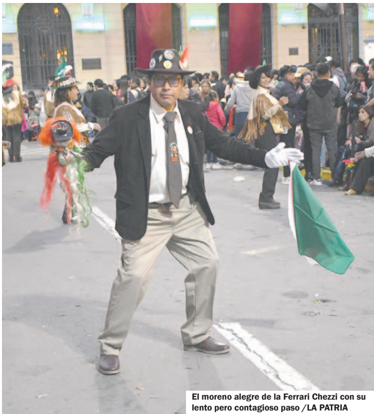
El moreno alegre de la Ferrari Chezzi con su lento pero contagioso paso