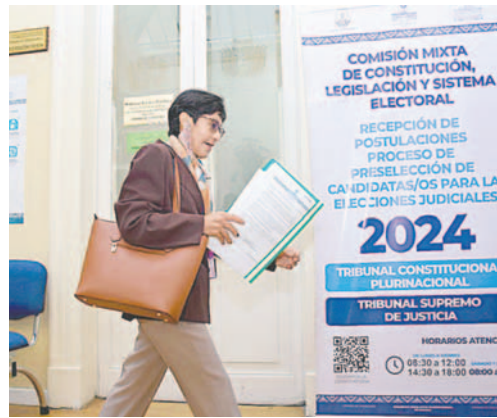
Analizarán soluciones para garantizar las elecciones judiciales