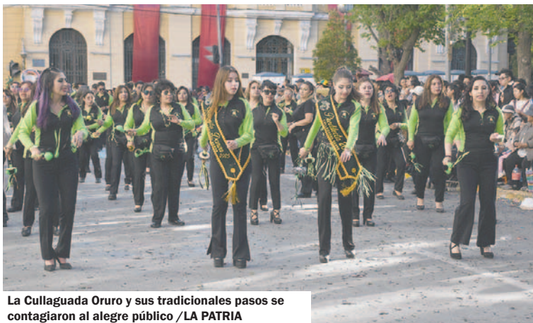
La Cullaguada Oruro y sus tradicionales pasos se contagiaron al alegre público