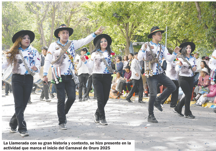
La Llamerao con su gran historia y contexto, se hizo presente en la actividad que marca el inicio del Carnaval de Oruro 2025