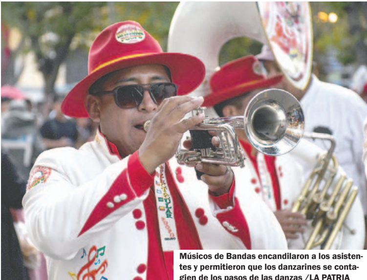
Músicos de Bandas encandilaron a los asistentes y permitieron que los danzarines se contagien de los pasos de las danzas