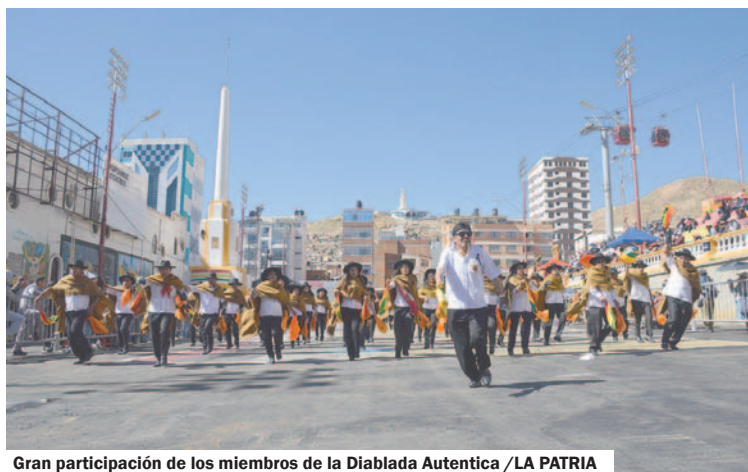
Gran participación de los miembros de la Diablada Auténtica