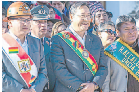
Presidente Arce en los actos por la efeméride cívica de Potosí