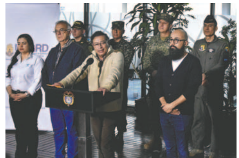
El mandatario Gustavo Petro (3-i) junto al ministro de defensa Iván Velásquez (2-i) y el director de la Unidad Nacional para la Gestión de Riesgo de Desastres (UN-GRD), durante una declaración este domingo en Bogotá (Colombia)

El mandatario añadió que la vulnerabilidad climática en Colombia "viene agravándose por impactos que tienen que ver con la deforestación, las economías ilícitas y, en el caso de Bogotá, en mi opinión, por una