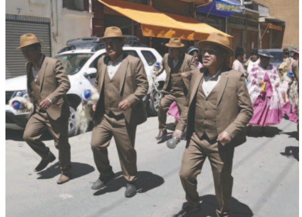
Comerciantes celebraron su día a lo grande

A pesar de la difícil situación que atraviesa el país y el gremio debido a la crisis económica y al alza de los precios en la canasta familiar, los comerciantes pidieron a sus santos de devoción que nunca falte el trabajo ni la salud.