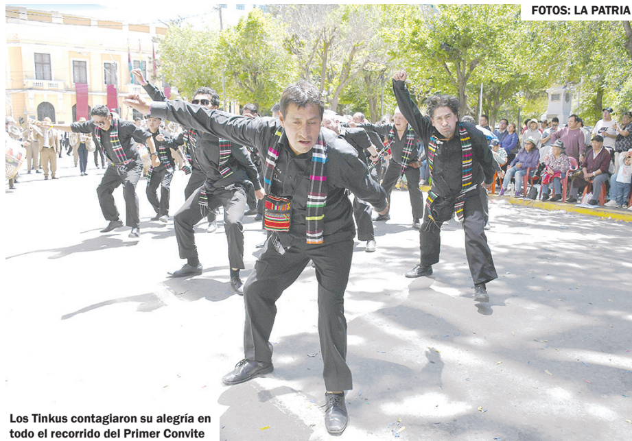
Los Tinkus contagiaron su alegría en todo el recorrido del Primer Convite