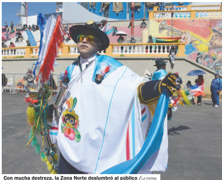
Con mucha destreza, la Zona Norte deslumbró al público