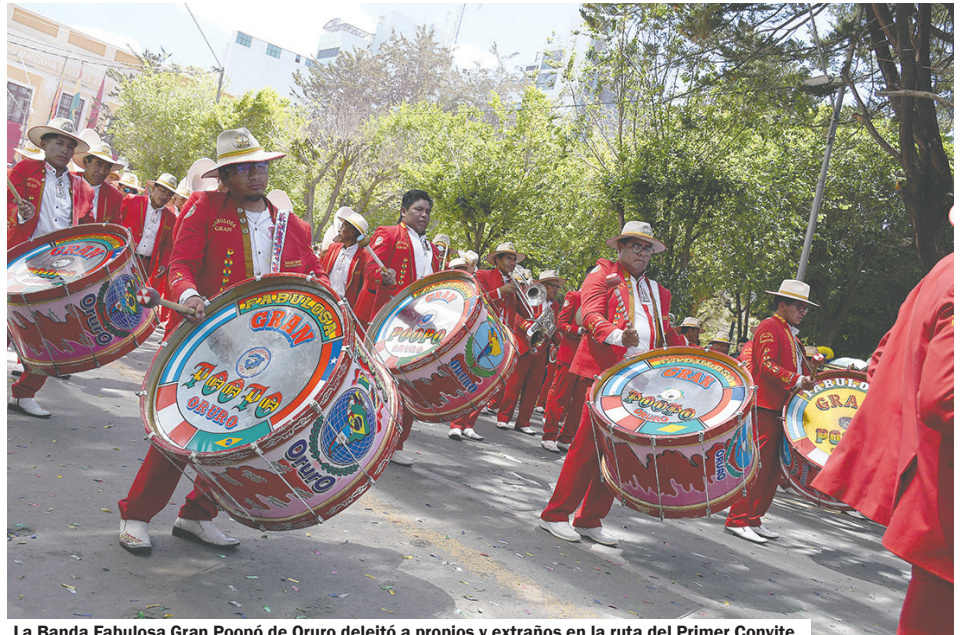
La Banda Fabulosa Gran Poopó de Oruro deleitó a propios y extraños en la ruta del Primer Convite