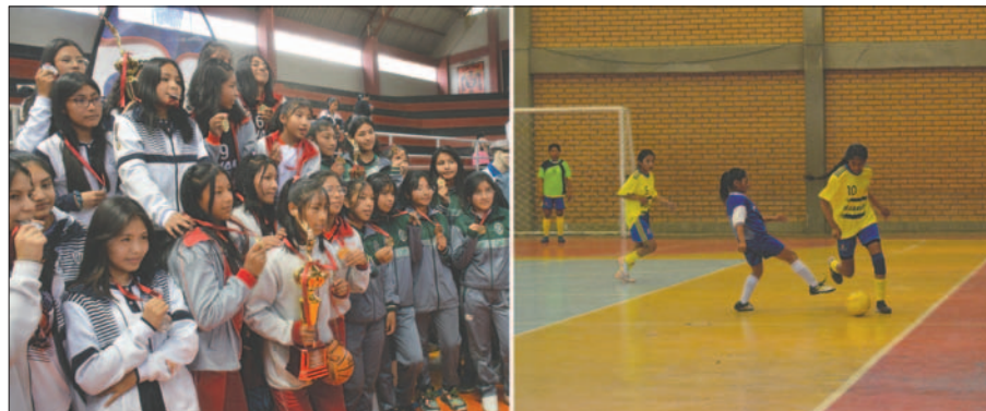
La delegación orureña estaba a la espera de la realización de la tercera fase

Otro aspecto que se observa es que los Juegos Sudamericanos Escolares, que se realizará en Bucaramanga (Colombia), tendrán lugar entre el 2 y el 9 de diciembre. En consecuencia, se tiene poco tiempo para cumplir con la fase nacional, además los ganadores de esta etapa deberán tener un espacio de tiempo para hacer sus trámites para salir del país, ya que se trata de menores de edad. En gestiones pasadas, deportistas orureños que asistieron a este certamen internacional, enfrentaron estas dificultades, que no son fáciles de subsanar.