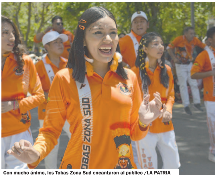
Con mucho ánimo, los Tobas Zona Sud encantaron al público