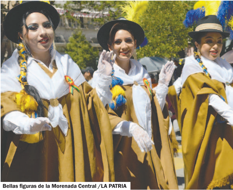
Bellas figuras de la Morenada Central