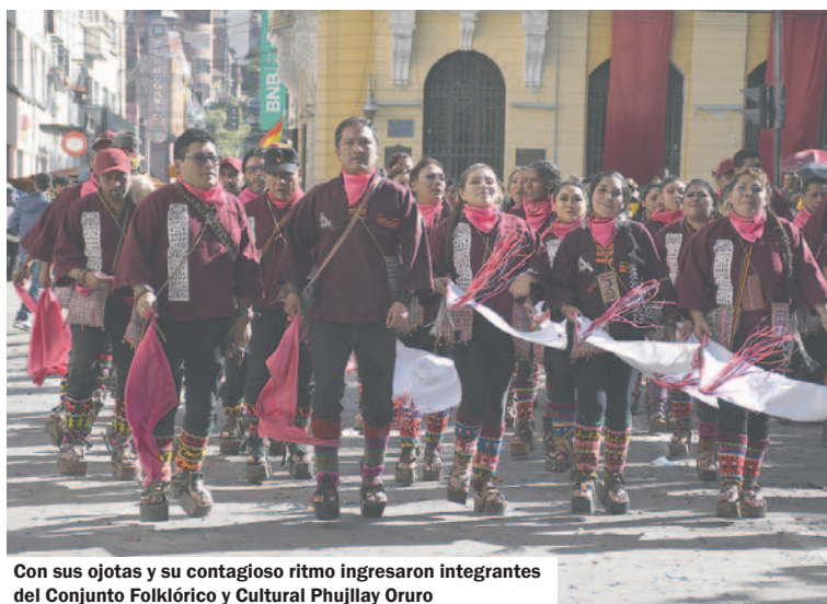
Con sus ojotas y su contagioso ritmo ingresaron integrantes del Conjunto Folklórico y Cultural Phujllay Oruro