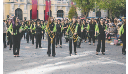
Colorido se destaca en el Primer Convite

Otros productos muy característicos del Carnaval de Oruro y sus fechas importantes se pudieron apreciar en cercanías del Campo Mariano donde se