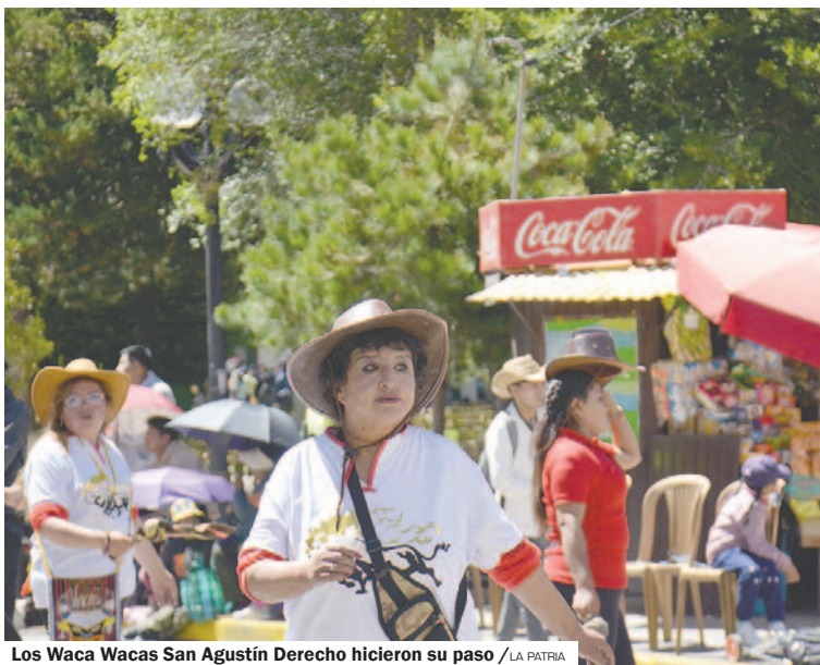
Los Waca Wacas San Agustín Derecho hicieron su paso / LA PATRIA