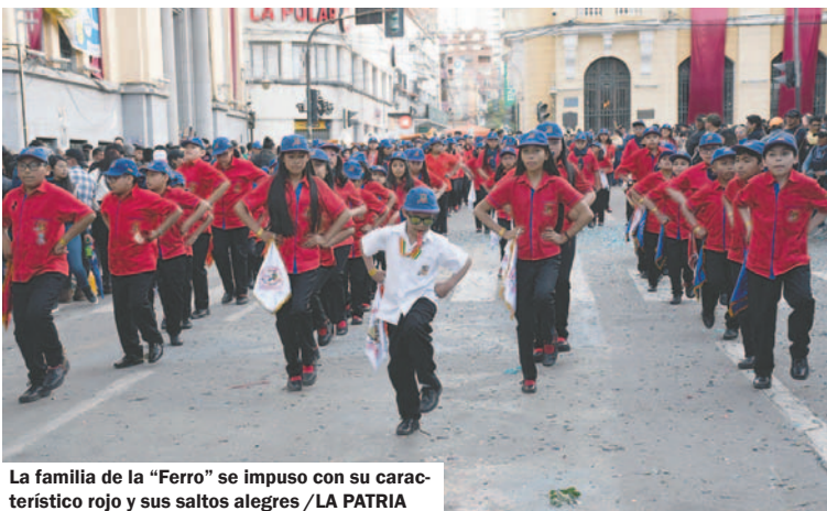
La familia de la "Ferro" se impuso con su característico rojo y sus saltos alegres