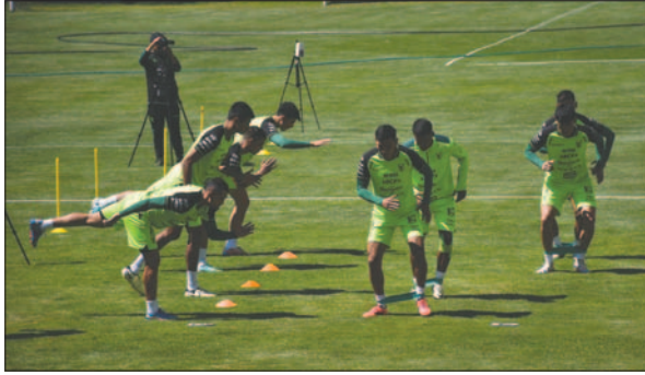
El equipo boliviano realizó su preparación ayer en la cancha de Mariscal Braun