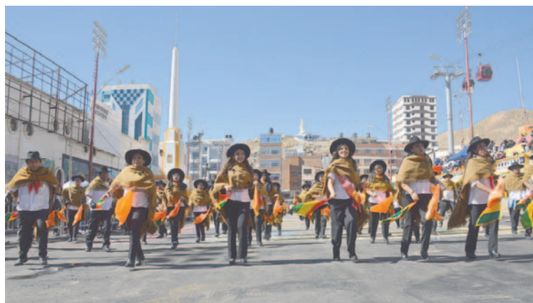
La Gran Tradicional Auténtica Diablada Oruro abrió la participación de los conjuntos