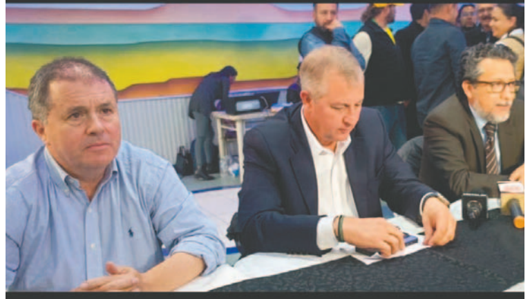
La ceremonia del lanzamiento del nuevo partido se realizó en la ciudad de La Paz

“Queremos que entre todos le presentemos a la