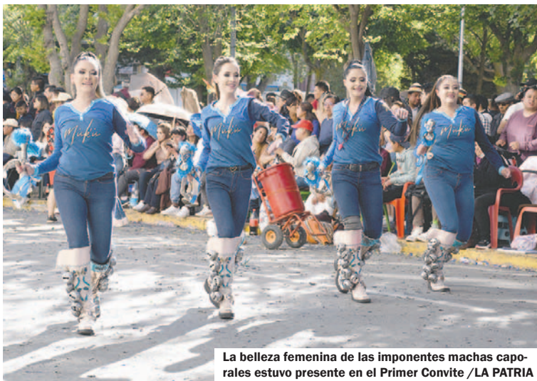
La belleza femenina de las imponentes machas caporales estuvo presente en el Primer Convite