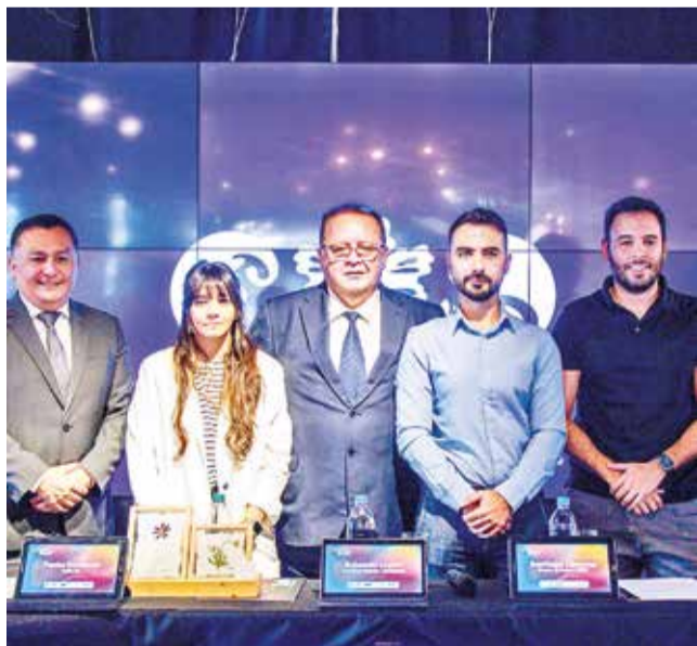
Lanzamiento del II Foro de Economía Naranja, ayer.