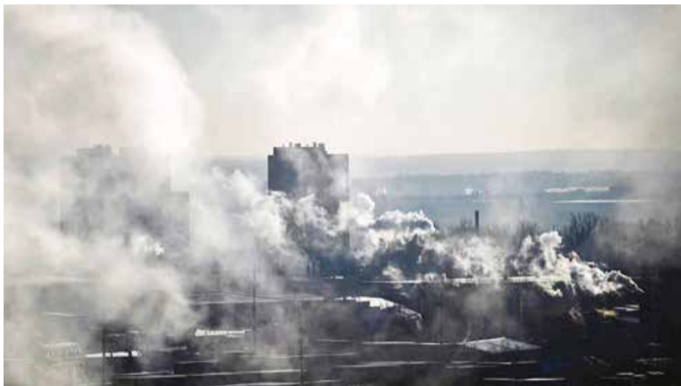
Emanaciones de dióxido de carbono CO2, el gas que provoca el calentamiento global.

La anomalía de la temperatura media para el resto de 2024 tendría que descender hasta casi cero para que 2024