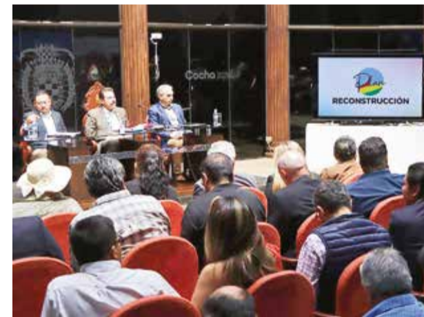
Reunión de la Sala de Reconstrucción Económica. M.Z.