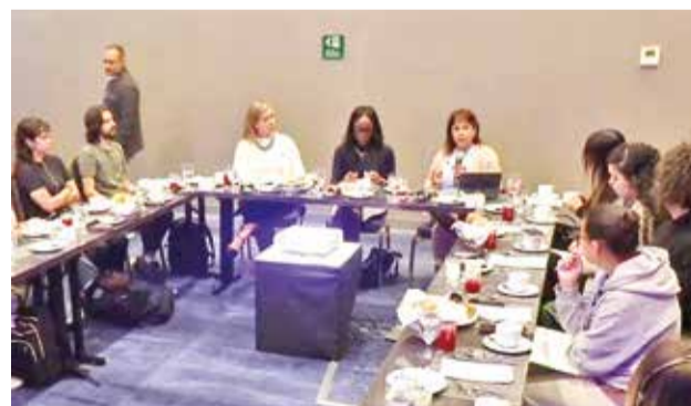
Reunión preparatoria del encuentro en Bogotá, ayer.