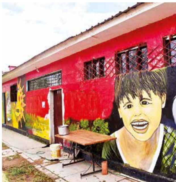
Los ambientes del centro de infractores Cometa. C. LÓPEZ

El hecho de infanticidio en grado de tentativa ocurrió el martes 5 de noviembre de este año, en la zona de Uspha Uspha. La abuela denunció el hecho. Ella se percató de que la niña fue envenenada e intentó reanimarla con jabón y al no lograrlo la trasladó al