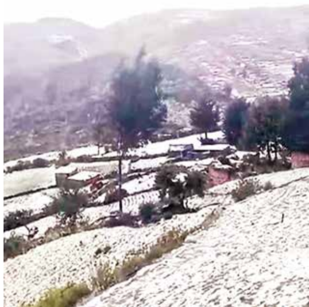
Los cultivos dañados por granizada en Tapacarí. RR.SS.

Tiraque se sumó a la lista de los municipios con declarato-