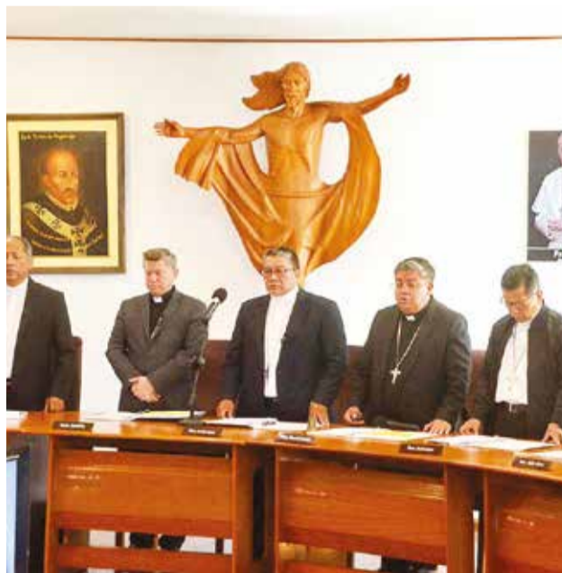
Obispos reunidos en asamblea, ayer. Hernán Andía. H.A.

En el mismo sentido se refirió a los bloqueos que asfixiaron al país: “¿Tienen corazón los que se han mantenido en sus ideologías políticas y económicas, sabiendo que llevaban al país al desastre en el que estamos? (...) ¿Tienen corazón los que bloquean los caminos, viendo cómo lloran nuestros campesinos, nuestros empresarios y nuestro pueblo, sin sentir ni un poco de compasión?”, agregó.