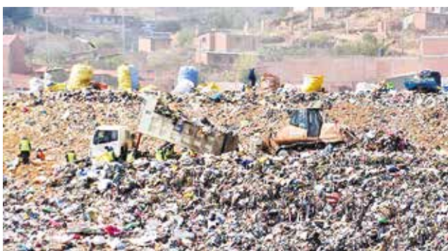
El depósito de basura en el relleno de K'ara K'ara.

El representante del Distrito 15, Evert Quispe, indicó que ante el incumplimiento de la empresa Colina, en el manejo de la basura, el lunes presentarán un in-