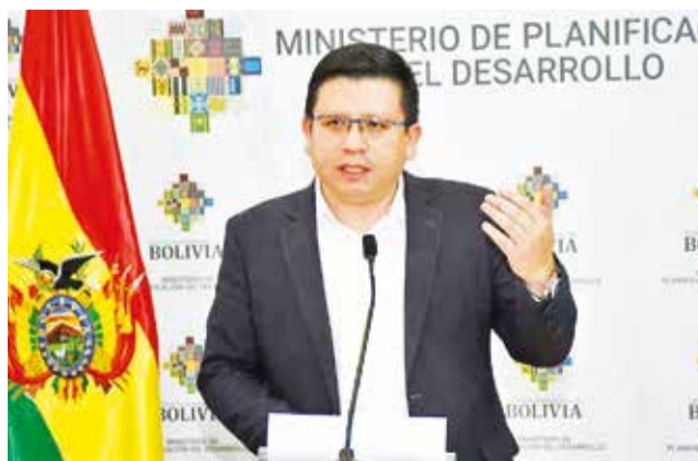
El ministro Sergio Cusicanqui en rueda de prensa, ayer.

De acuerdo con el informe, la inflación mensual de octubre fue del 1,64%, un incremento inusual que Cusicanqui atribuye a las restricciones de suministro derivadas de los bloqueos promovidos por sectores afines al evismo. "Esta inflación mensual está expli-