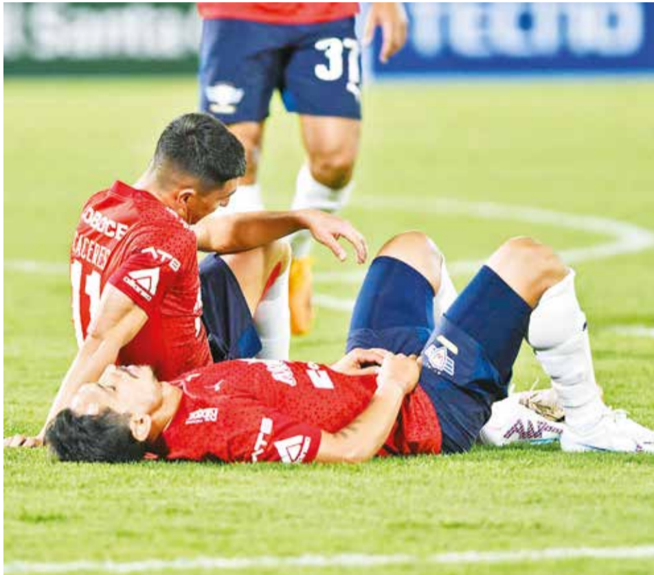
Jugadores del plantel de Wilstermann, tras un partido del torneo profesional. c.l.

“Mañana (por ayer) no nos vamos a presentar, no vamos a entrenar hasta que aparezca el dinero, ya no podemos aguantar más”, le