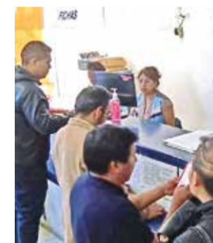
El pago de impuestos en Cochabamba. C. LÓPEZ

El director de Recaudaciones recordó a la población que puede cancelar sus adeudos tributarios en cualquier entidad bancaria, en las instalaciones de recaudaciones, ingresando a simat.cochabamba.bo , o a través de la apli-