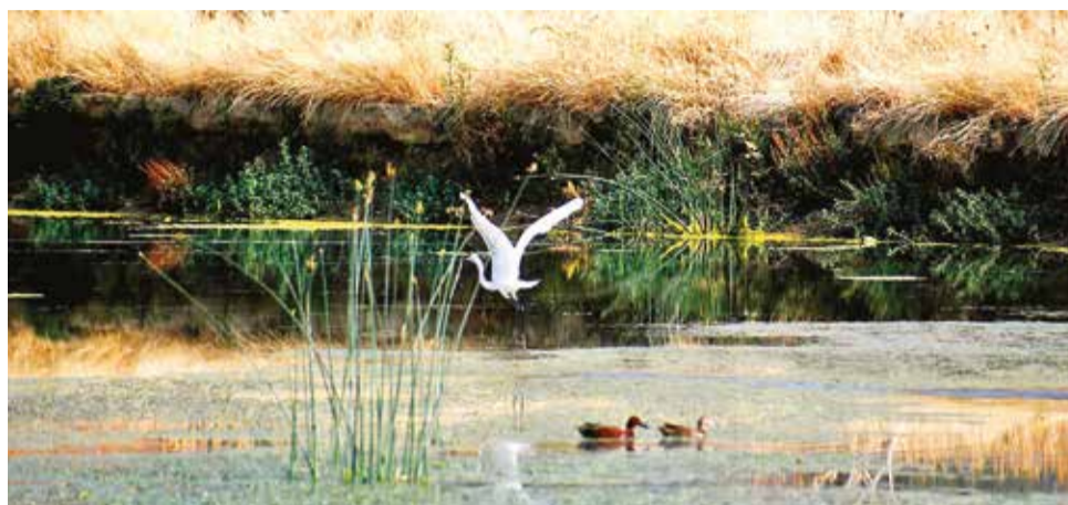
La laguna Alalay con mayor caudal de agua y diversidad de aves migratorias. CARLOS LÓPEZ

Entre las aves que regresan al humedal están la tringa solitaria, calidris, tringa flavipes, flamencos y otras especies, detalló.