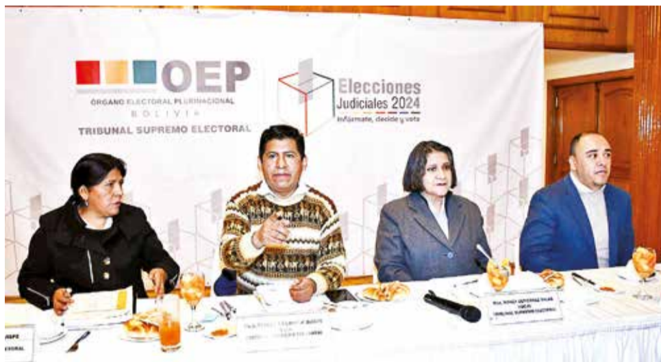
Vocales del Tribunal Supremo Electoral en conferencia de prensa.

El calendario electoral para las justas judiciales marca el periodo de difusión de méritos de los postulantes. En 2011 y 2017, la mayoría de electores votó nulo y blanco en rechazo a los procesos, al considerarlos manipulados por la mayoría legislativa del MAS. El mandato de los elegidos en 2017 culminó a principios de 2024, pero, como las elecciones en 2023 no prosperaron, en diciembre pasado, los magistrados del TCP extendieron su propio mandato y el de los jueces de las otras cortes, alegando que así evitaban un “vacío de poder”.