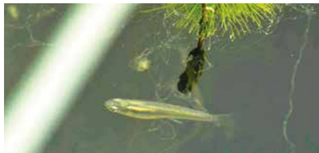
El pez platincho en el humedal urbano, ayer.

Antes del dragado, un estudio reveló que en todo el espejo de agua había más de 100 especies de aves migratorias, muchas de ellas se quedaron y anidaron. Balderrama anunció que próximamente se rea-