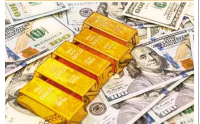
Las reservas de oro internacional. (Ilustrativa) RRSS

La economía creativa, que abarca sectores como la moda, la artesanía y el desarrollo de software, representa una oportunidad para diversificar la economía boliviana y crear valor mediante la innovación y el talento local.