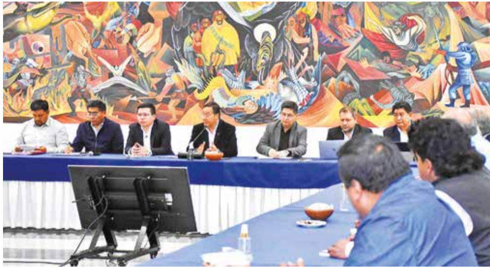
Reunión del presidente Luis Arce con sectores productivos del país, ayer.

Para restablecer la normalidad, el Gobierno anunció un plan de distribución directa y ágil de combustibles, eliminando trámites innecesarios que entorpecen el suministro y elevan los costos logísticos. Este enfoque permitirá a los transportistas de carga contar con un suministro continuo de diésel, lo que beneficiará la distribución de alimentos