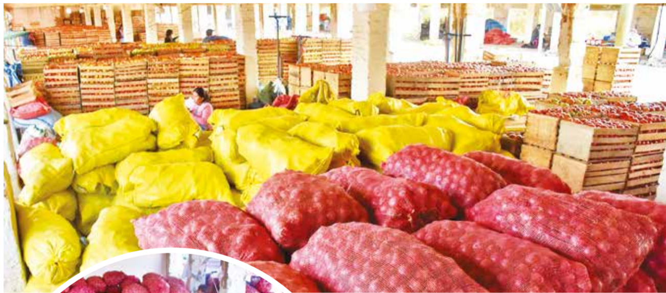
Agricultores ofrecen tomate en mercado Integración del Sur.

Precios. Los agricultores rematan sus productos en el mercado Integración del Sur después del cuarto intermedio en los bloqueos. Los visitantes pueden adquirir también frutas y hortalizas.