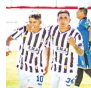
Festejo del primer gol de Oruro Royal, ayer.