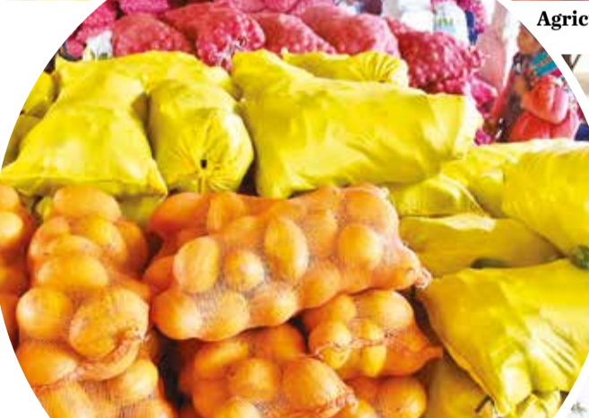
Las cargas de frutas y verduras del cono sur. JOSÉ ROCHA