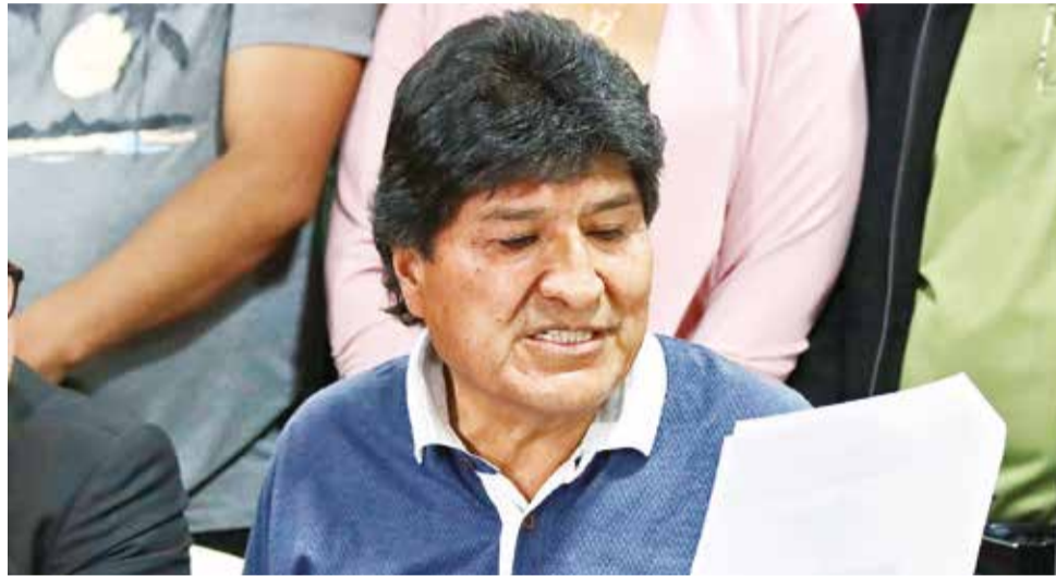
El expresidente Evo Morales fue denunciado en Argentina por presunto abuso sexual.

Orias señaló que existen varios tratados internacionales