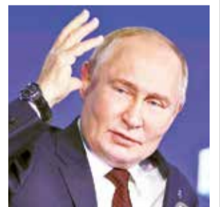
El Presidente de Rusia.

“Aprovecho la ocasión para felicitarle por su elección al puesto de presidente de EEUU”, dijo al intervenir en el Club de Debate Valdái que tiene lugar en el balneario de Sochi (mar Negro).