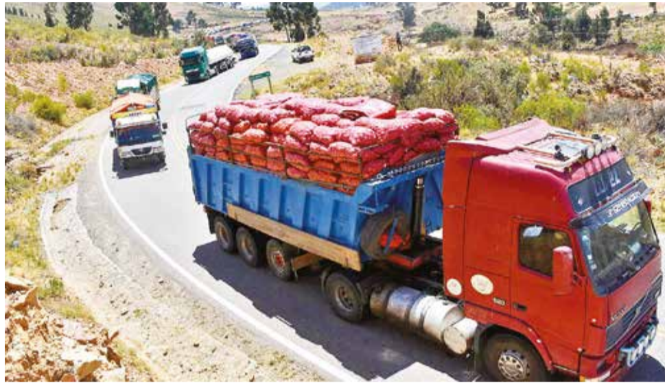
Carros transitan con regularidad tras desbloques.