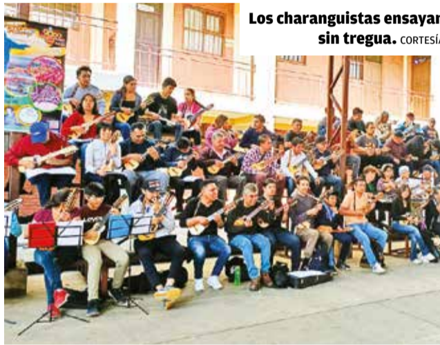
Los charanguistas ensayan sin tregua.

“El conjunto charango más numeroso estuvo compuesto por 1.157 participantes en un evento denominado ‘La Orquesta de