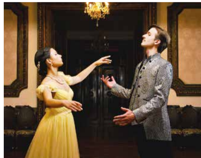
La fotografía del programa oficial de Vals. OFC

No todas esas cuatro academias enseñan el mismo tipo de danza ni todos los vals que ejecutará la OFC son del mismo tipo. “Interpretaremos una variedad de vals, de distintos