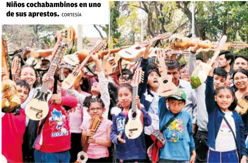
Niños cochabambinos en uno de sus aprestos.