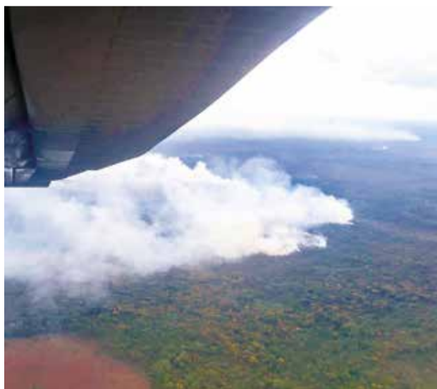
Militares se desplazan al Madidi.

“Ya partieron bomberos forestales de las Fuerzas Armadas junto con el Sernap. También se desplazó un helicóptero equipado con una bomba de mil litros de capa-