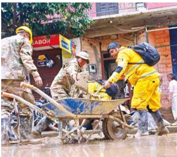
Militares y funcionarios limpian las casas.

Si bien la municipalidad ofreció albergues, las familias