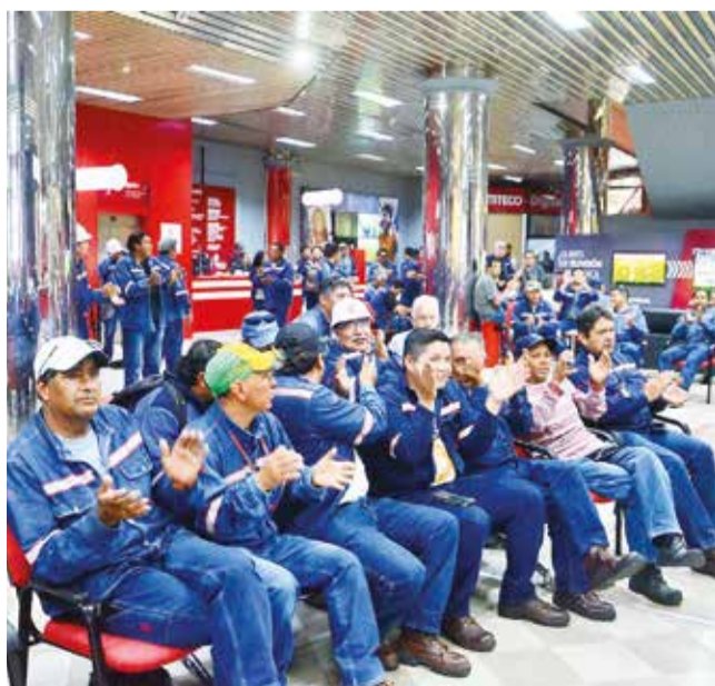
Trabajadores de Comteco exigen pago de salarios, ayer. H.A.

Según analistas, la prolongada escasez de diésel en Bolivia amenaza a sectores clave, como la agricultura y la minería aurífera. Si la crisis persiste, el país podría enfrentar no sólo pérdidas multimillonarias en exportaciones y empleos, sino también una disminución en la seguridad alimentaria para la población. Tanto productores como cooperativistas instan al Gobierno y a YPFB a tomar medidas inmediatas para restablecer el abastecimiento de diésel.