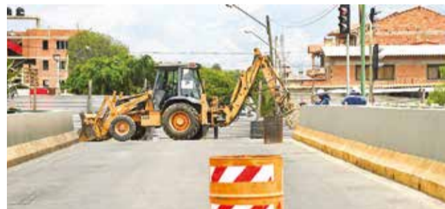
El cierre temporal del puente de la av. 6 de Agosto.