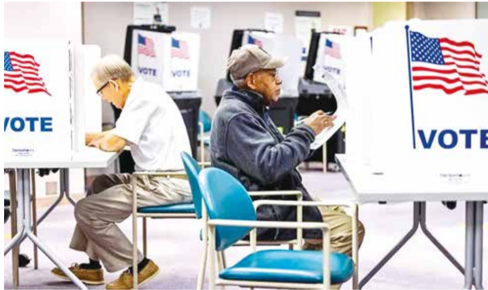
Estadounidenses sufragando en el condado de Fairfax, estado de Virginia ayer.

En todas las entrevistas, Harris trató de conectar con los votantes indecisos, explicando sus propuestas económicas para reducir el coste de los alimentos y la vivienda, así como su intención de reformar el sistema migratorio y unir al país tras años de polarización.