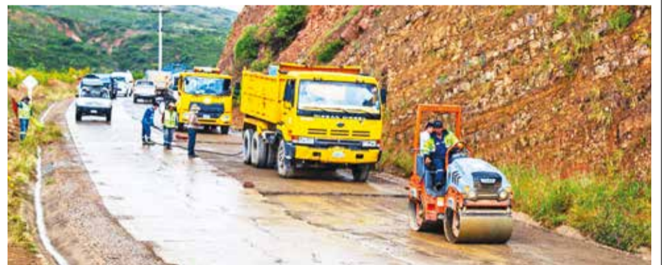
El mantenimiento de una vía interprovincial. GADC

En medio este panorama ayer un numeroso contingente de policías y militares lograron desbloquear la vía hacia los municipios de Aiquile y Mizque.