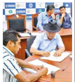
La firma de convenio para las perforaciones. GADC

Cochabamba tiene 20 municipios que se declararon en desastre por la escasez de