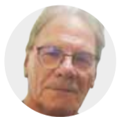
RENZO ABRUZZESE El autor es sociólogo

Finalmente Evo Morales pidió que se levante el bloqueo, sin duda persuadido por el omnipresente sentimiento de rechazo que la medida generó en prácticamente todos los estratos de la sociedad boliviana, pero además, porque al observar quienes se enfrentaban (al menos discursivamente) quedó claro que la visión evista del poder ha quedado anclada solamente en los estratos del trópico de Cochabamba, los indígenas de profunda raigambre rural y los grupos prebendales que construyó a lo largo de los últimos 20 años.