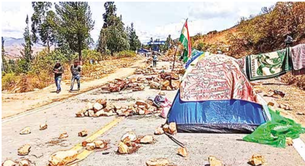
Un punto de bloqueo en la carretera antigua que une Cochabamba con Santa Cruz.