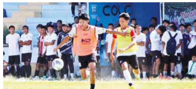
Entrenamiento de la selección sub-19 de Cochabamba.

VEA LOS DETALLES AQUÍ: Escanee este QR o ingrese a nuestro sitio web www.lostiempos.com