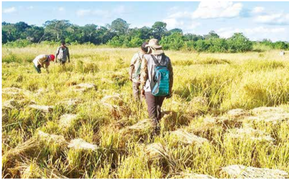
Cultivos de arroz en el Norte Integrado del departamento de Santa Cruz.