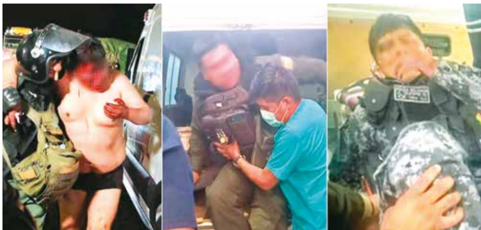
El policía que fue secuestrado y otros heridos.

“Se ha desplegado todo el contingente policial, incluso, se coordinó una búsqueda aérea. Se han cerrado todas las vías de acceso para evitar la