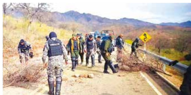
El desbloqueo en la carretera al municipio de Mizque. DTV

Modalidad. En el 96% de las escuelas las clases son presenciales, pese a los bloqueos. Los maestros podrán abastecerse