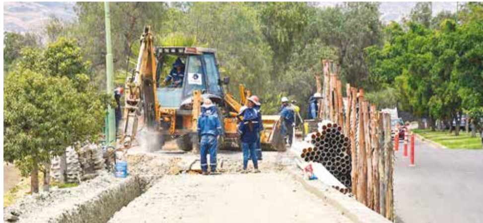
Los trabajos de la construcción de la línea amarilla del tren en la ciudad. CARLOS LÓPEZ

ción a los conductores cuando pasen por este lugar y reducir su velocidad”, recomendó.