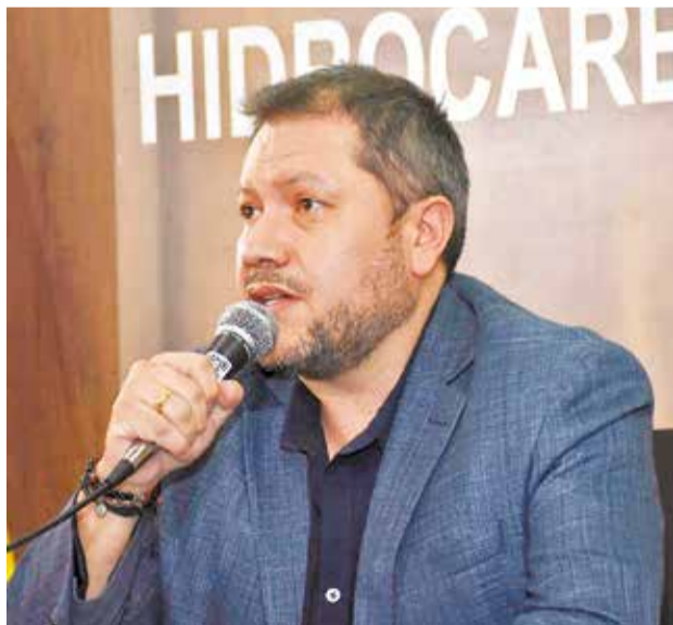
El ministro Alejandro Gallardo en rueda de prensa.

En medio de la crisis, Asosur declaró el “estado de emergencia nacional”, debido a la insuficiencia de combus-