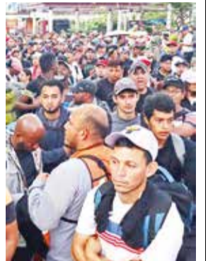
Son más de 2.500.