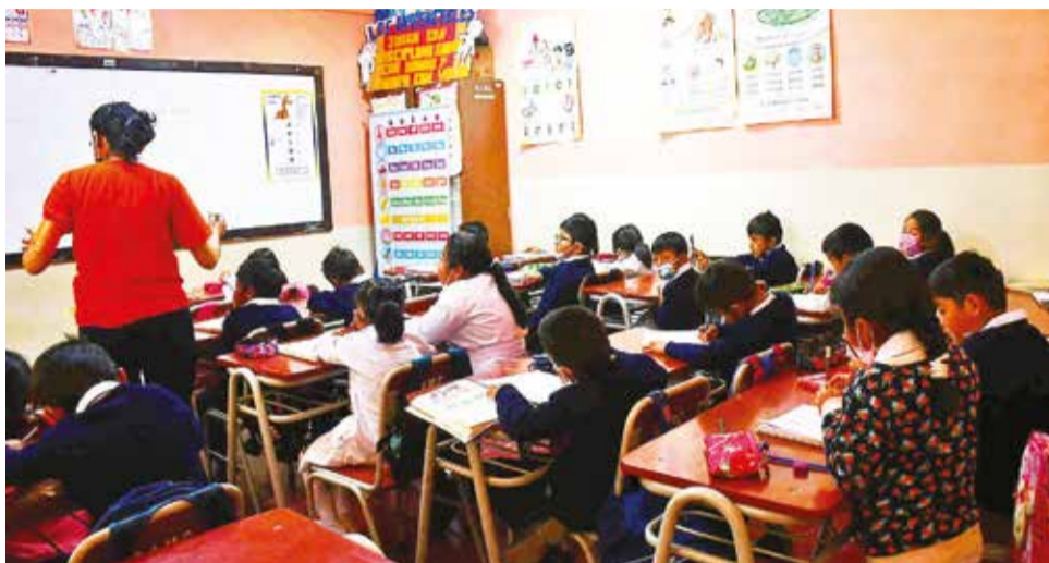
Estudiantes pasas clases presenciales, en Cochabamba.

Los maestros cuestionan que sólo participarán 220 educadores, mucho menos que las organizaciones sociales.