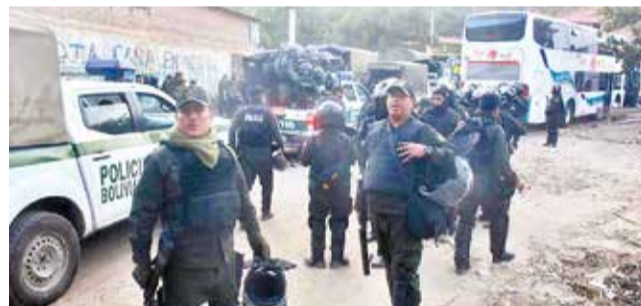
La intervención policial en la vía a Capinota. JOSÉ ROCHA

En cuanto a la salud de los policías, la directora del Hos-