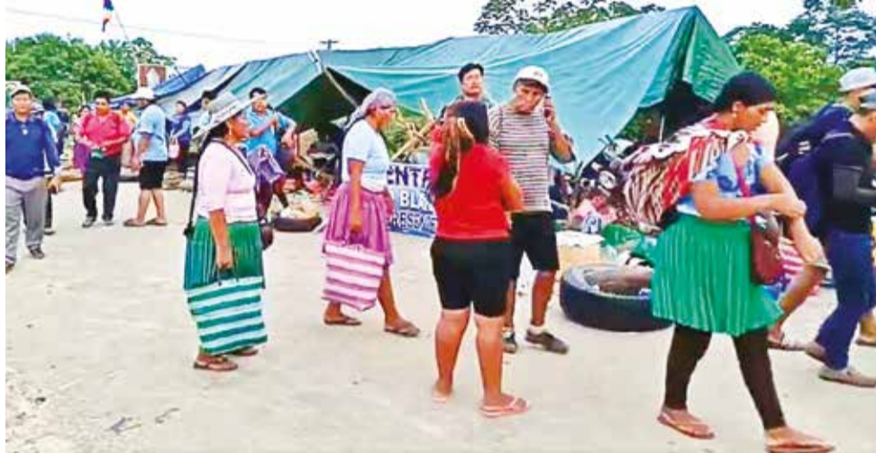
Un punto de bloqueo en la ruta que conecta Cochabamba con Santa Cruz.

“Las facturas que pedimos no están llegando en su totalidad y también hemos visto la preocupación de farmacias que están cerca a las clínicas porque hay pocos medicamentos de vitalidad, como de terapia intensiva, algunas importadores tienen, pero no abastece”, acotó.