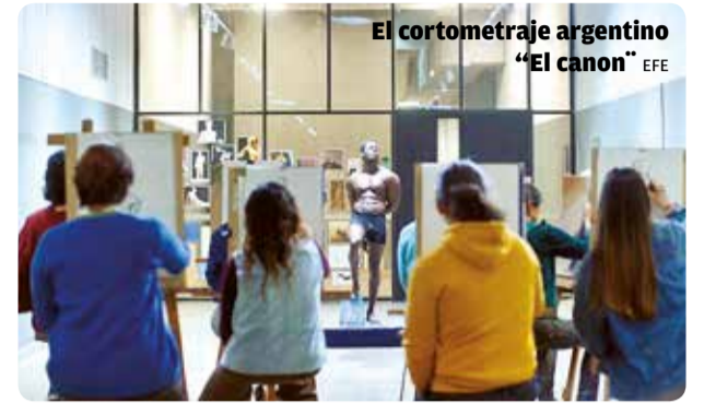
El cortometraje argentino "El canon"