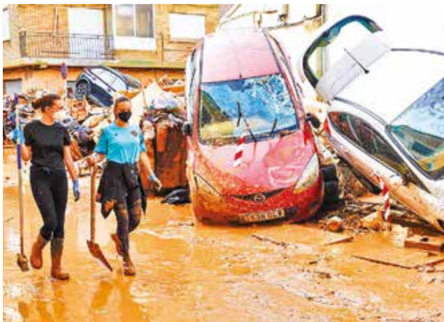
Autos apilados por la riada del martes 29 en Catarroja.

Esos casos activos corresponden exclusivamente a las denuncias donde los familiares han aportado diferentes datos y facilitado muestras biológicas que permitan la identificación posterior de sus familiares, informó el