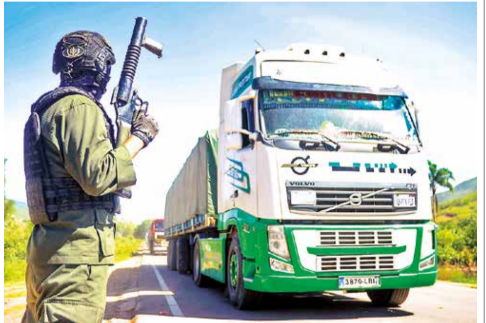
Vehículos transitan en Mairana, tras desbloqueo, ayer.