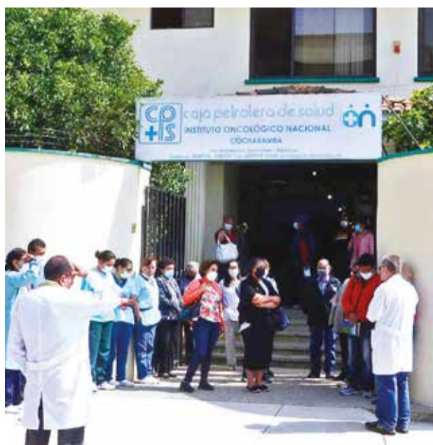
El Instituto Oncológico de la Caja Petrolera. HERNÁN ANDÍA

A esto se suma que la CPS ya tropiezan con la falta de medicamentos e insumos para atender a los pacientes. “Trabajamos como centro de referencia, pero a partir de los problemas administrativos se