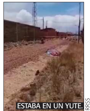
ESTABA EN UN YUTE. PRCS

Los familiares dieron algunos datos que permitirán esclarecer este caso y hallar a los asesinos.