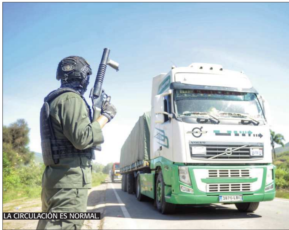
LA CIRCULACIÓN ES NORMAL.

Informe. El reporte de transitabilidad de la ABC indica que todas las rutas están expeditas