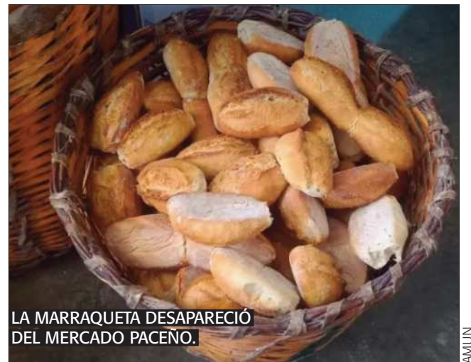
LA MARRAQUETA DESAPARECIÓ DEL MERCADO PACENO.

INSUMO Emapa distribuyó más de 20.000 bolsas de harina, cada una de 50 kilos para elaborar este tipo de pan.