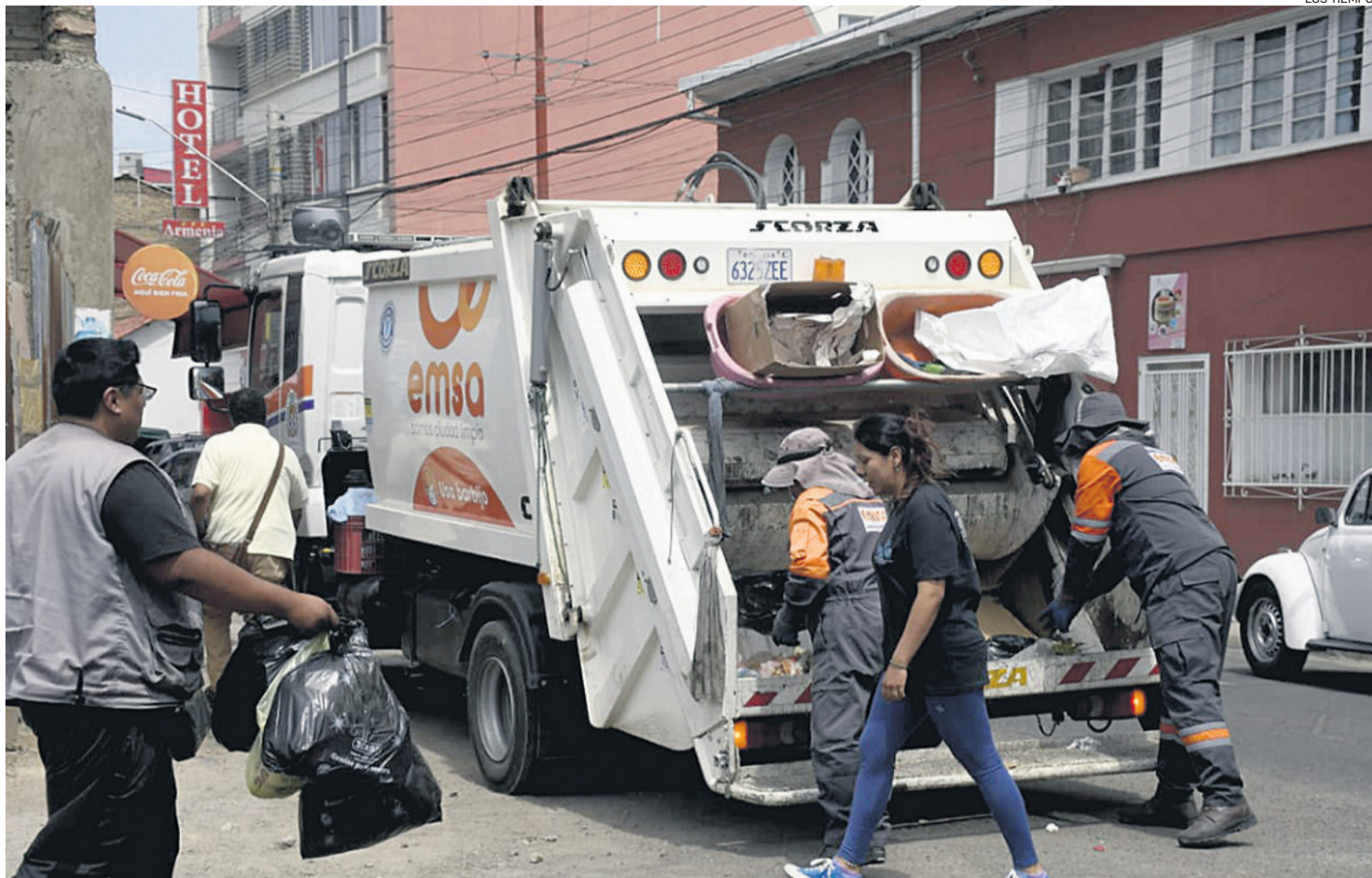
La recolección de residuos domiciliarios se redujo de tres a dos veces por semana en la ciudad de Cochabamba