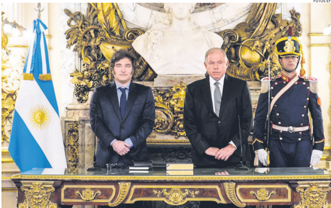
El mandatario argentino junto al nuevo canciller Gerardo Werthein, durante el acto de su posesión

Este anuncio llega pocas horas después de que el presidente, Javier Milei, tomara juramento a Werthein como nuevo canciller y le encargara una purga de diplomáticos "traidores" y "enemigos de las agendas de la libertad".