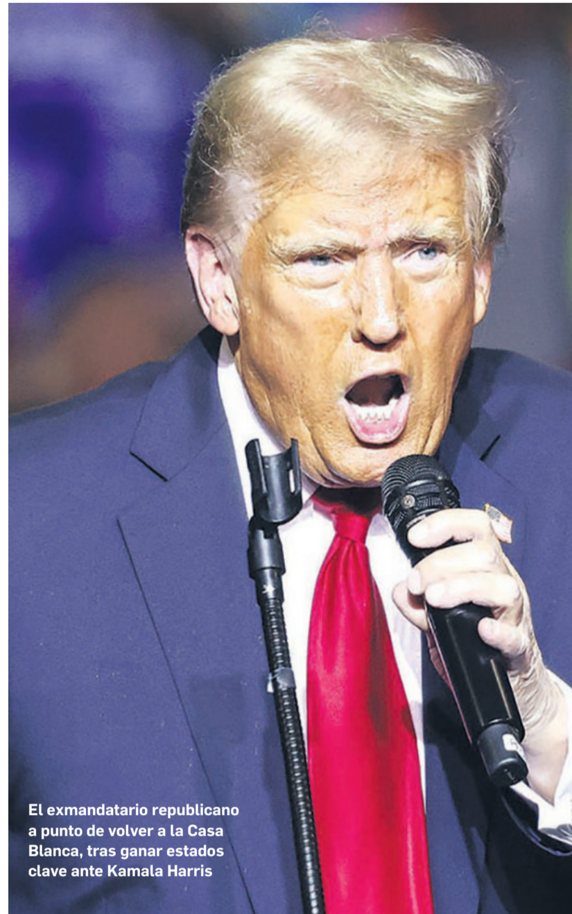
El exmandatario republicano a punto de volver a la Casa Blanca, tras ganar estados clave ante Kamala Harris

Algunas encuestas a pie de urna indican que en algunos estados la ventaja de los demócratas respecto a los republicanos entre la población que se identifica como latina o hispana ha mermado. Harris ganó entre estas comunidades, pero con menos margen respecto a la victoria de Biden hace cuatro años en una tendencia que se ha notado en la última década, especialmente entre los hombres.