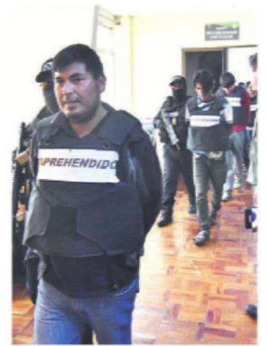
Los bloqueadores son acusados de terrorismo en La Paz

empujones entre los legisladores evistas y arcistas. La posesión mereció críticas y reclamos de la oposición. A7