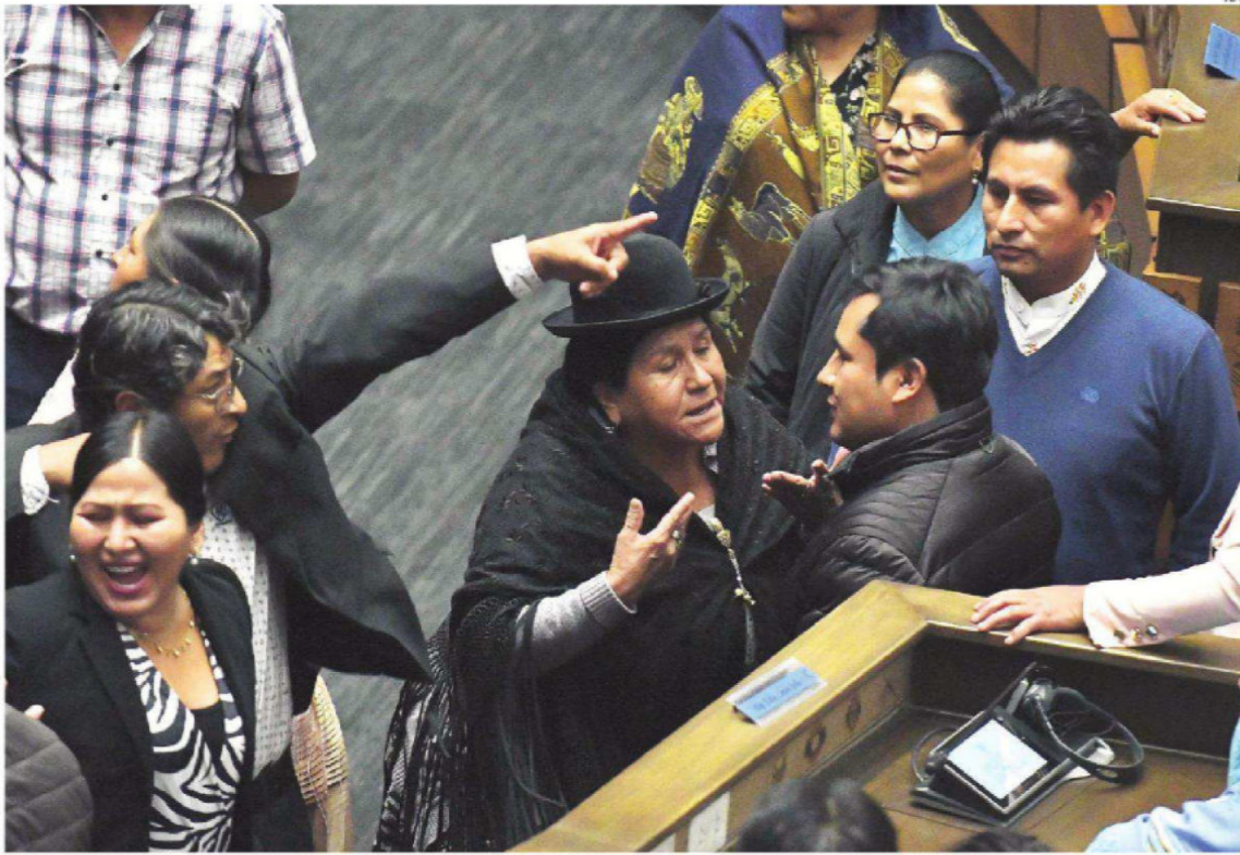
CON BOCHORNO. La sesión de la Cámara de Diputados tuvo insultos y agresiones físicas entre evistas y arcistas

DIVISIÓN. LAS TRES BANCADAS ESTÁN FRACTURADAS Y CON DENUNCIAS MUTUAS