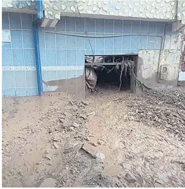
El lodo pasó por en medio de las viviendas