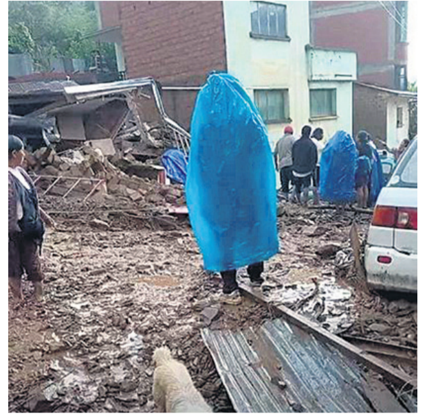
Los pobladores de La Asunta observan lo sucedido