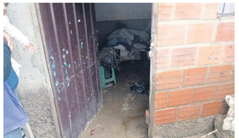
En Tarija también el agua ingresó a las casas y arrastró mercadería

Ramiro Velásquez, vecino afectado del barrio Abaroa, relató que el desborde los encontró desprevenidos y se vieron obligados a subir al techo por el ingreso de gran cantidad de agua que inundó las habitaciones. “El agua más o menos llegó a más de 1 metro y medio de altura”, expresó Velásquez.