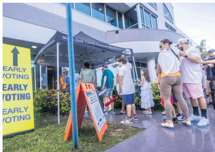
Hubo una alta asistencia de votantes a los centros habilitados

Defiendo, como Trump, la inmigración legal", explicaba Memeh. "Creo que nada de lo que haga Harris me beneficiará pero quizá cosas que haga Trump sí, respecto a la economía, los precios, las guerras...". Y si se le preguntaba por la retórica xenófoba y racista de Trump, que ha atacado a países como el suyo, él lo justificaba: "Dijo que Nigeria era un 'agujero de mierda' pero es que hay que decir la verdad. Es enormemente rico en recursos naturales. Nuestros líderes políticos, cuando necesitan atención médica vienen aquí, o envían a sus hijos para que estudien en las universidades". (EP)