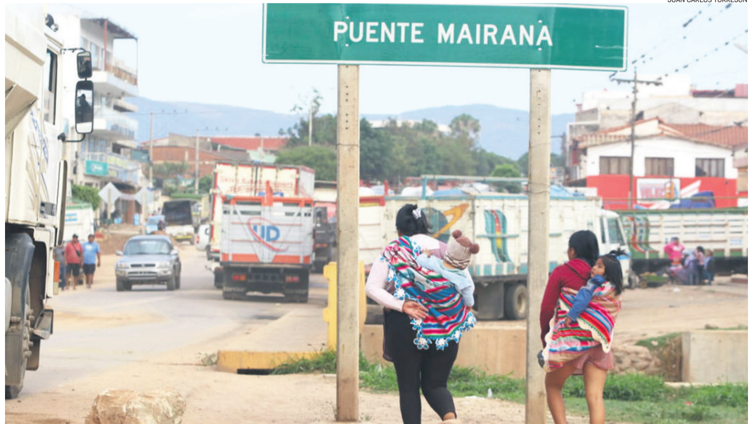
Investigan la movilización obligatoria de estudiantes de un colegio de Mairana para participar en los violentos bloqueos de carreteras