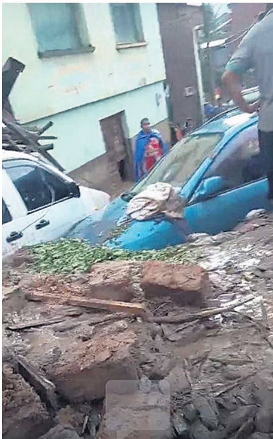
Vehículos quedaron sepultados en medio del lodo y los restos de calaminas muestran los destrozos

La zona de La Asunta, en Los Yungas, sufrió con el lodo que arrasó con lo que encontró a su paso e ingresó a casas. Tarija se declaró en situación de emergencia por el desborde de la quebrada Víbora Negra que se produjo el pasado domingo