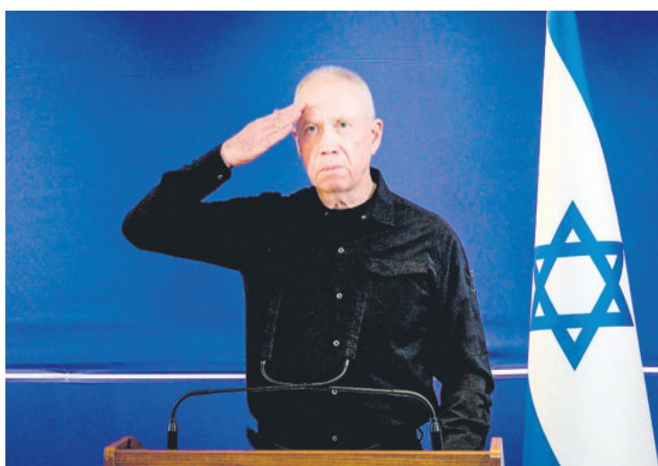
El ministro de Defensa Yoav Gallant tuvo discrepancias con Netanyahu

"Hice muchos intentos de cerrar estas brechas, pero cada vez se hacían más grandes. También llegaron al conocimiento del público de una manera inaceptable, y peor aún, llegaron al conoci-