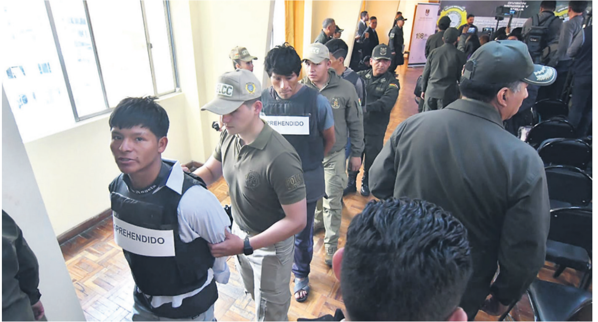
Los 17 detenidos en Mairana llegaron ayer a La Paz para que sean juzgados por terrorismo y otros delitos. Así lo dispone un decreto supremo firmado por Evo Morales en 2009.