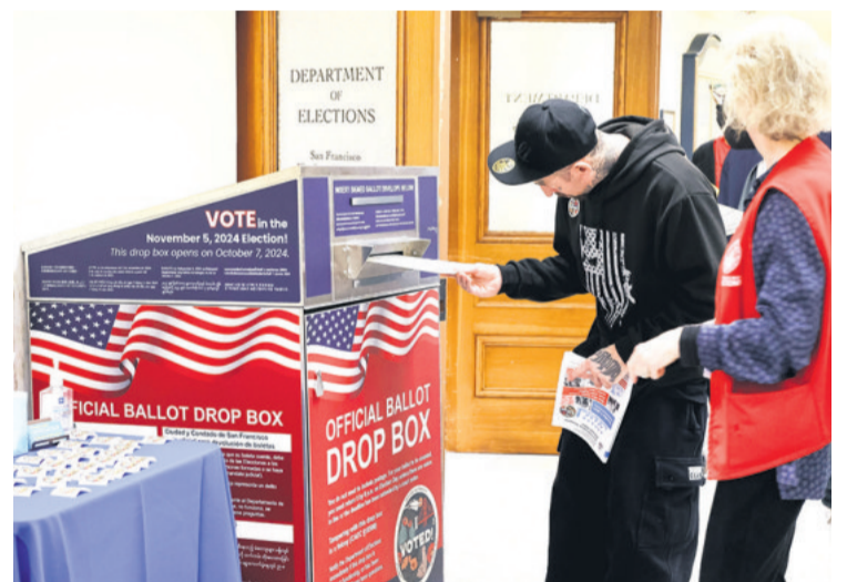
Pese a la polarización, la jornada electoral fue tranquila en el país

Sin embargo, hay grandes diferencias según los estados, en particular por el efecto de la victoria de Trump entre los puertorriqueños en Florida, donde el republicano ha arrasado.