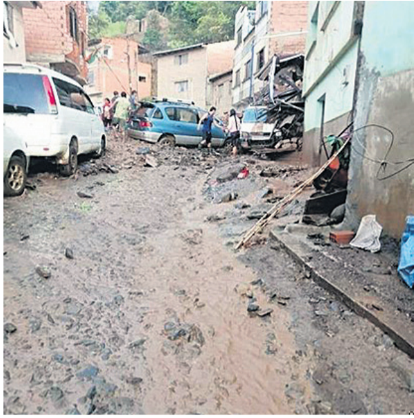
El agua corre por las calles de la localidad Las Mercedes