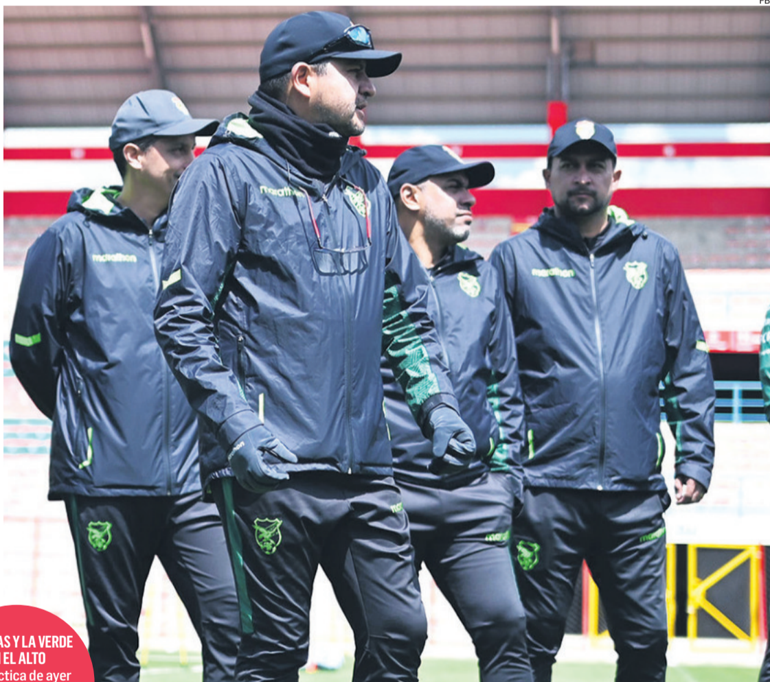
VILLEGAS Y LA VERDE EN EL ALTO La práctica de ayer fue a puertas cerradas. Se trabajó en el Titán de Villa Ingenio

Entre tanto Terceros, fue por la misma línea. “Son decisiones del profe y la tenemos que respetar; lo que me toca es poner todo de mi parte para recuperarme a pleno”. Más allá que está prácticamente descartado para el partido ante Ecuador, el 7 dijo que la mentalidad de todos es ganar. “Somos un grupo que no depen-