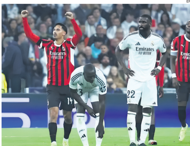
La desazón de los jugadores del Real Madrid se contrasta con la alegría de los italianos

pions'. En el polo opuesto al punto de inflexión que deseaba Ancelotti tras el varapalo del clásico. Cediendo hasta 40 remates en sus tres últimos partidos en el Santiago Bernabéu y nueve goles. Un equipo falto de intensidad que no explota el potencial ofensivo de los considerados mejores jugadores del mundo y que se adentra en un momento duro sin consecuencias por la altura de la