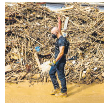
Las aguas se desbordaron

Tras el cese de Mondino, la Presidencia emitió un comunicado en el que anunció una auditoría del personal de carrera de la Cancillería con el fin de "identificar a los impulsores de agendas enemigas de la libertad".