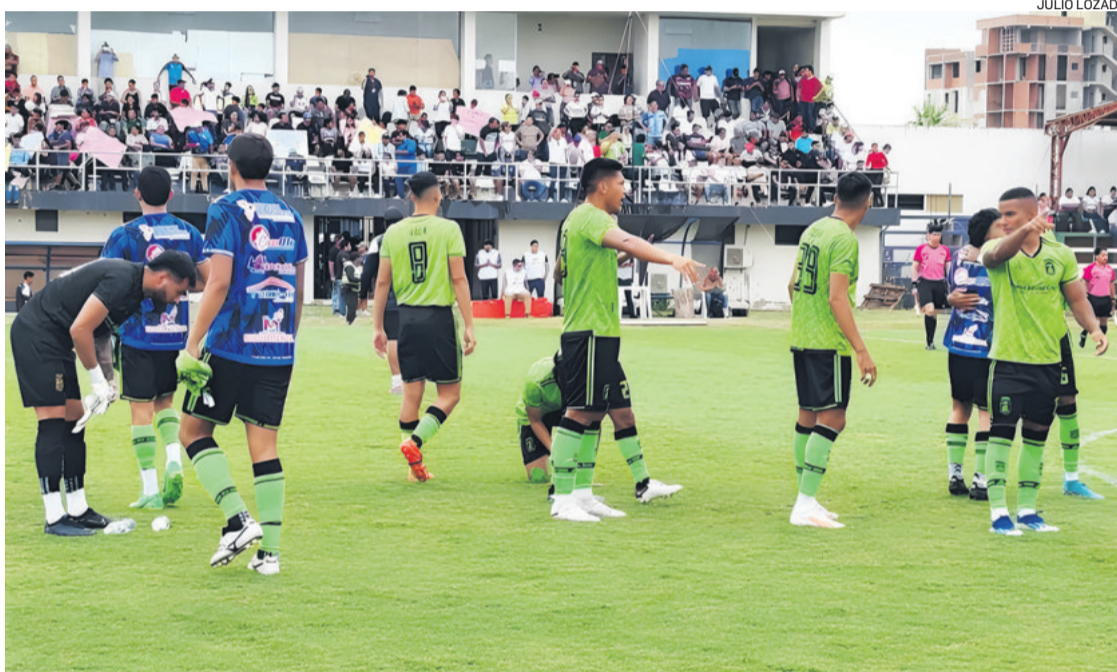
Ciudad Nueva Santa Cruz Academia FC superó el fin de semana a Wilstermann Cooperativa (4-0) y va por el primer golpe en El Alto