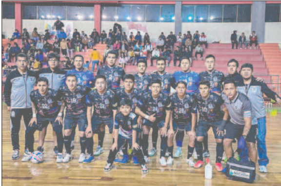
El equipo de Fantasma Morales Moralitos logró vencer en Tarija en la ida de los cuartos de final

Proyecto Redag igualó a dos goles con Córdoba (Potosí) en el coliseo "Héroes de Octubre", en El Alto. Mientras, Adu toys (La Paz) cedió un empate frente a Cooperativa Rural de Electrificación (CRE) de Santa Cruz (5-5), en el coliseo "Julio Borelli", en un final de infarto con los goles de la paridad llegando en el minuto final.