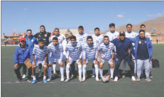
Ingenieros con la chance de volver a jugar en Copa "Simón Bolívar"

Dependiendo de otros resultados, pero aún con posibilidades, está Deportivo Rosario (16 puntos), que tiene rivales como Deportivo Shalon, AFIZ y Aurora. En igual circunstancia con 16 puntos, Rosario Central debe jugar con rivales directos en su lucha por clasificar: Ingenieros, Deportivo Escara y Sur-Car.