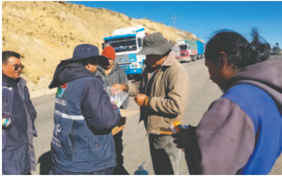
Brigada de médicos brindó atención a los transportistas

En ese sentido, la Defensoría, con apoyo de una brigada de médicos de la Fundación Abiyala, llegó al lugar para brindar atención médica y entregar algunos insumos y vitaminas a una gran cantidad de transportistas que