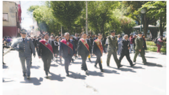
Actos protocolares marcaron el aniversario de la fundación de Oruro

"Hay problemas, pero lo que necesitamos hacer es pedir a Dios que intervenga en nuestra vida y nos ayude a cambiar a cada uno. Por eso llamo a cuidar, respetar y amar al hogar. Tenemos que buscar la felicidad de