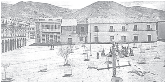
El nombre original fue tergiversado por mucho tiempo / ORURO DE ANTAÑO

El investigador además destacó, que si bien antes de esta fundación, Oruro era un Asiento de Minas, tras reconocerse como la Muy Noble y Leal Villa de San Felipe de Austria de Oruro, los primeros ciudadanos recibieron el reconocimiento como "hijos hidalgos de la Villa", porque fueron testigos del icónico momento, nombre que sobrevivió hasta el siglo XVIII.