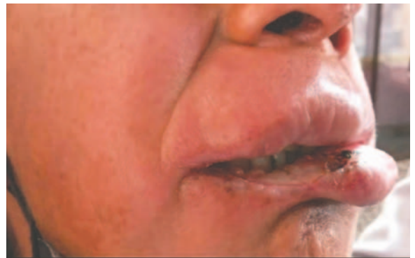
Paciente manifiesta lesiones de la enfermedad endémica desde hace diez años /SEDES

En ese sentido, una vez que se tengan los resultados, se le administrará y dispensará el medicamento respectivo en el Hospital Walter Khon. A la fecha, la persona está a la espera