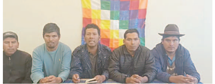
Los dirigentes “evistas” se pronunciaron mediante un video

En horas de la tarde del viernes 1 de noviembre, el expresidente Evo Morales sugirió a los movilizados dar un cuarto intermedio para evitar las confrontaciones entre los