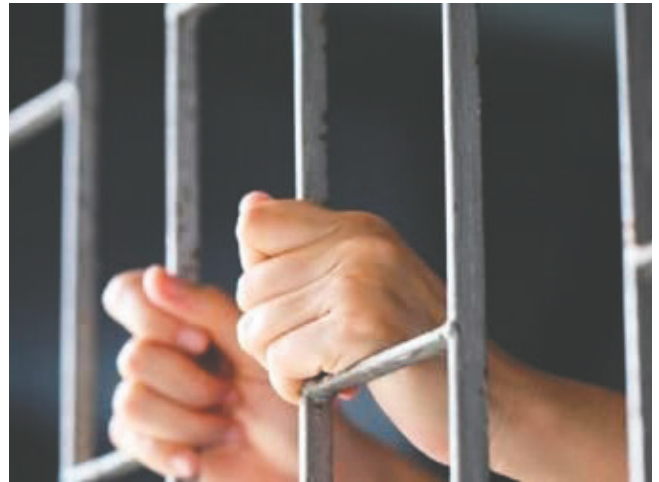
La condena impuesta deberá ser cumplida en El Abra