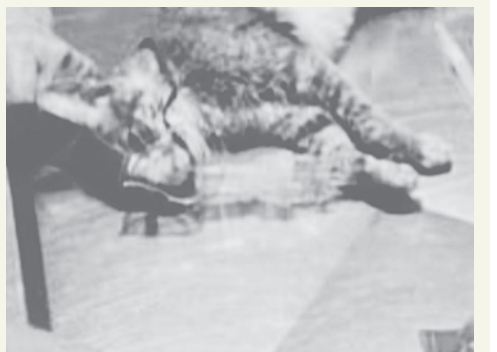
El gato fue cruelmente golpeado antes de morir por el ahora investigado

El sujeto subió videos a redes sociales intentando justificar la agresión. Por este medio, el Ministerio Público tomó conocimiento del hecho e inició la investigación de oficio por el delito de biocidio. Hasta el momento se realizaron