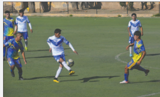
San José obligado a sumar triunfos en sus próximos encuentros

Sin duda, hay otros factores que, en cierta forma, merman el anhelo de los "santos" de volver a la división privilegiada del fútbol orureño; el más primordial es el aspecto económico, pero también las lesiones, el poco material humano con el que se cuenta y las condiciones de entrenamiento que no son de las mejores.