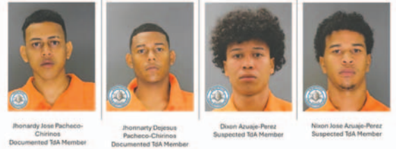
La Policía de EEUU detuvo a cuatro miembros de la banda criminal Tren de Aragua en Colorado este año

miembros de la banda se han integrado en la vida urbana, tanto entre los solicitantes de asilo en refugios como haciéndose pasar por conductores de entregas.