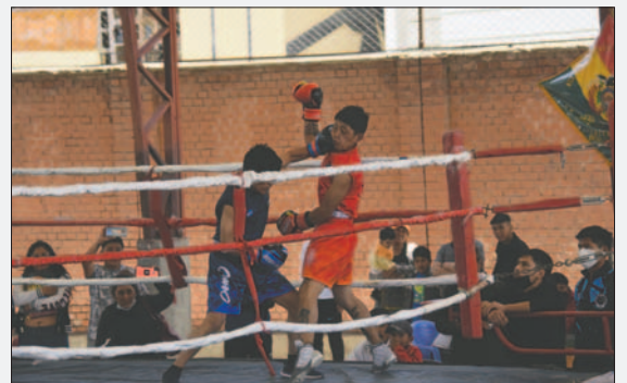
El objetivo es encontrar nuevos talentos en el deporte de los puños

Se tiene previsto que la fecha de realización de la competencia sea el próximo 15 de no-