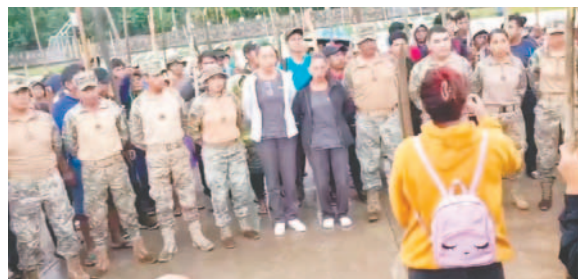
Los militares tomados como rehenes

Los simpatizantes del exmandatario demandan la no intervención en los bloqueos, el cierre