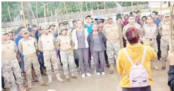
Los militares tomados como rehenes

“La toma de una instalación militar por grupos irregulares en cualquier lugar del mundo es un delito de traición a la Patria, una afrenta a la Constitución Política del Estado, a las Fuerzas Armadas y al propio pueblo boliviano, que rechaza de manera contundente los bloqueos crimi-