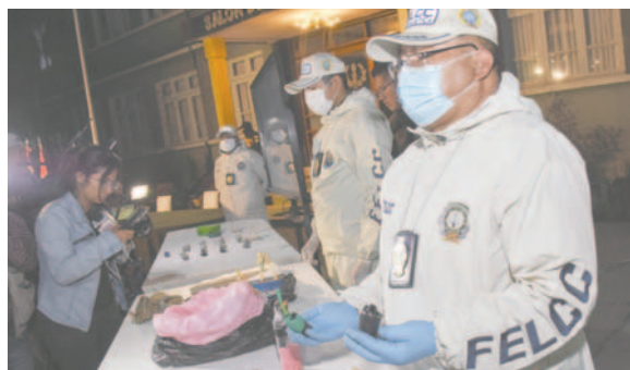
La Policía incautó explosivos y aprehendió a 66 personas vinculadas a Evo Morales

Según la autoridad, las personas detenidas portaban artefactos explosivos como dinamitas, cazabobos y otro tipo de armamento en contra de los policías que trataban de desbloquear la