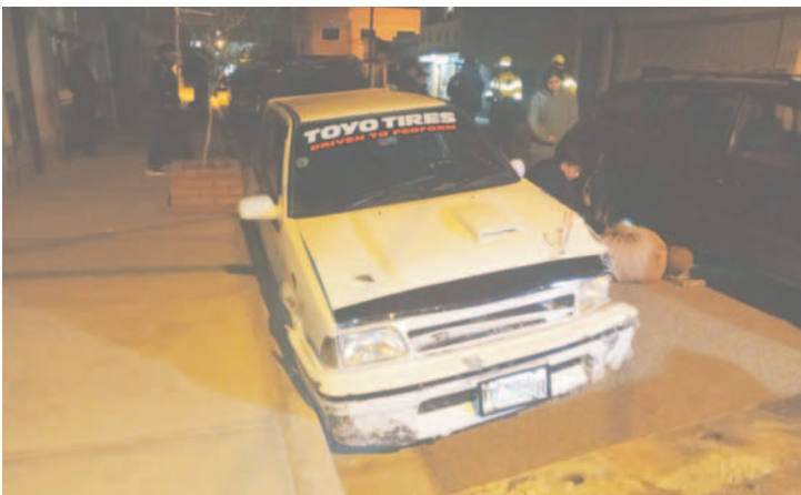
El conductor del automóvil dio positivo al control de alcoholemia

El teniente coronel Rommel Valdez detalló que los tres vehículos resultaron con daños materiales y se descartó que hubiera personas lastimadas. Además, añadió que los restantes conductores dieron negativo al consumo de alcohol.