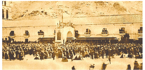
El acta de fundación comprueba el nombre correcto / ORURO DE ANTAÑO