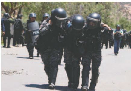
Efectivos policiales heridos son evacuados para su atención médica

Durante el enfrentamiento, los manifestantes utilizaron dinamita y piedras contra las fuerzas de seguridad, quienes respondieron con agentes químicos para retomar el control de la ruta.