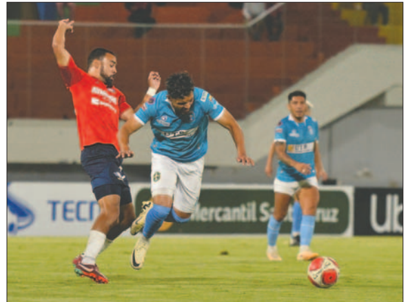
Wilstermann le tapó todos los sectores evitando las llegadas de San Antonio