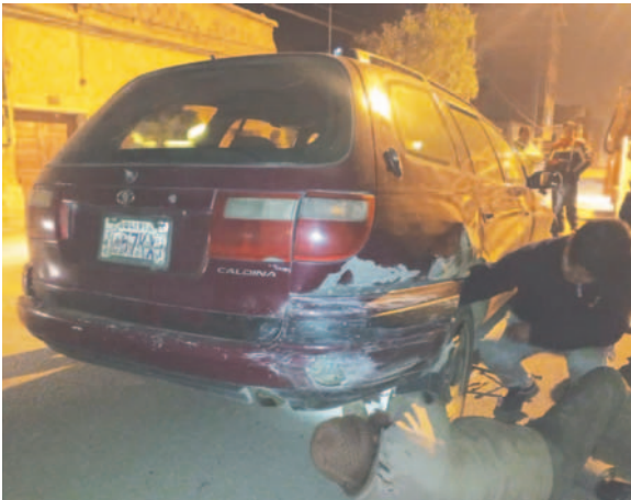
Tres vehículos resultaron dañados tras el incidente / TRÁNSITO

abreviado por este delito. “Ahora está ya imputado formalmente por el presunto delito de corrupción de niño, niña y adolescente con sus respectivas agravantes”, añadió Delgado.