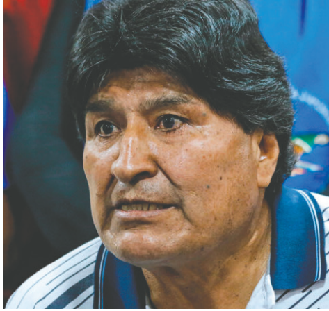
La Fundación Apolo acusa al expresidente Evo Morales de delitos vinculados a la trata de personas y abuso de menores durante su asilo en el país vecino

Ponce incluso señaló que Morales recibía “niñas como obsequios” de personas que buscaban