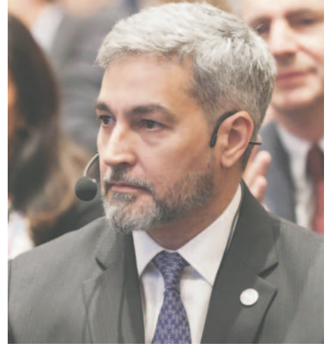
Fotografía de archivo del expresidente de Paraguay, Mario Abdo Benítez

(Paraguay), Hipólito Mejía (República Dominicana) y Luis Guillermo Solís (Costa Rica). También suscribieron la declaración Eduardo Frei (Chile), Luis Alberto Lacalle (Uruguay), Guillermo Lasso y Osvaldo Hurtado (Ecuador), Mauricio Macri (Argentina), Jamil Mahud (Ecuador), Carlos Mesa (Bolivia), Lenin Moreno (Ecuador), Mireya Moscoso (Panamá), Andrés Pastrana (Colombia), Ernesto Pérez Balladares (Panamá), Jorge Tuto Quiroga (Bolivia), Mariano Rajoy (España), Miguel Ángel Rodríguez (Costa Rica), Álvaro Uribe (Colombia) y Juan Carlos Wasmoy (Paraguay).