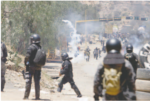
Enfrentamientos en Parotani

Durante los 19 días de bloqueos de caminos, hubo varios heridos entre policías y bloqueadores. Los hechos se suscitaron en el departamento de Cochabamba, donde existen más puntos de bloqueo. Ayer, una gran cantidad de efectivos del “verde olivo” y militares lograron desbloquear la carretera que conecta Oruro y Cochabamba.