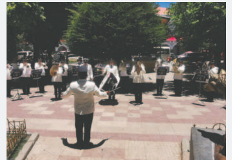
Los músicos deleitaron a todos los transeúntes