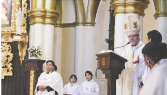
Obispo de la Diócesis de Oruro, Monseñor Cristóbal Bialasik, pidió respeto y amor a Bolivia

"Empezamos desde el 1 de octubre entregando obras para el municipio. Se ha hecho una inversión de 48 millones de bolivianos en proyectos de salud, educación, infraestructura vial y alcantarillado. Se prevé para el 10 de febrero nuevos proyectos", aseveró el burgomaestre.: