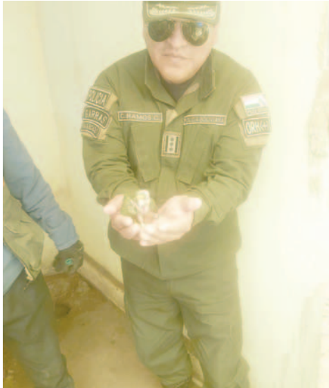
Agentes del orden rescataron 18 loros adultos, 19 loros polluelos y seis pajaritos

Desde la Policía se informó que las 40 aves silvestres entre ellas 18 loros adultos, 19 loros polluelos y seis pajaritos fueron