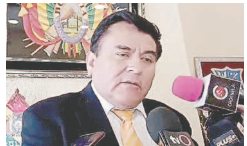
El fiscal Morales detalló que la familia del menor optó por tratarlo con medicina tradicional antes de llevarlo a un médico

“Los padres, por la carencia de recursos económicos, han optado por