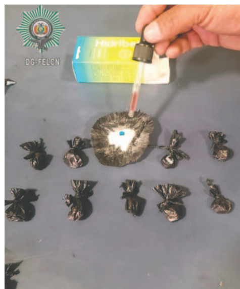
La prueba de narcotest dio positivo para cocaína

Resultados del operativo incluyen tres bolsas de nylon de color verde, diez bolsas de nylon de color celeste, once bolsas de nylon de color negro con clorhidrato de cocaína y cinco bolsas tipo “Ziploc” transparentes que contenían tusi (cocaína rosa). El caso pasó a conocimiento del Ministerio Público.