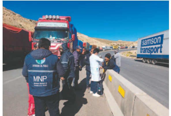
Transportistas varados en carretera recibieron ayuda