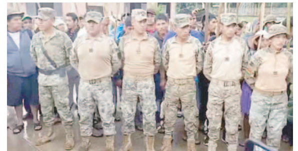
Militares retenidos en otro su regimiento

“Quienes participan en estos hechos están violando leyes nacionales e internacionales y no están siendo bien asesorados. Les instamos a deponer sus acciones y abandonar las ins-