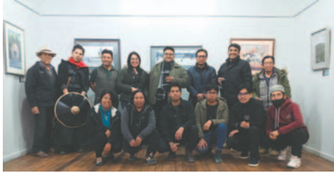
El autor de las acuarelas junto con otros compañeros luego de la inauguración / ABAP ORURO

“El agua tiene bastantes caminos y en el transcurso del tiempo hemos podido experimentar la acuarela, espero que aquí se note esa experimenta-