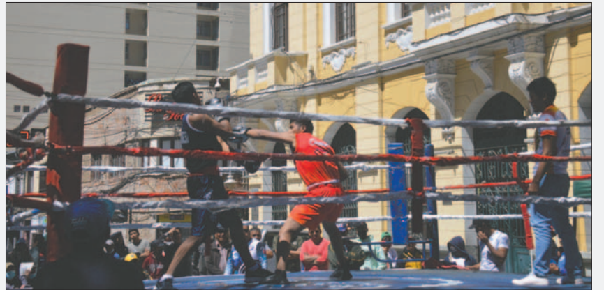
Novedoso torneo estudiantil es el que se desarrollará en Oruro desde el 15 de noviembre

La intención es poder captar nuevos talentos que se pueden encontrar en los establecimientos educativos, para luego mejorar su técnica y que puedan ser futuros representantes en eventos nacionales e internacionales.