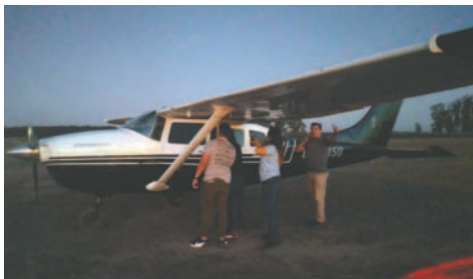
Las autoridades argentinas incautaron la aeronave

El oficial de la FAB, en reserva activa, habría estado