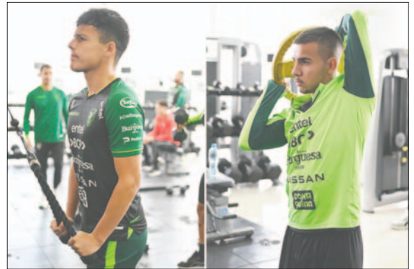
En primer día de trabajo estuvo dedicado a la parte física / FFB