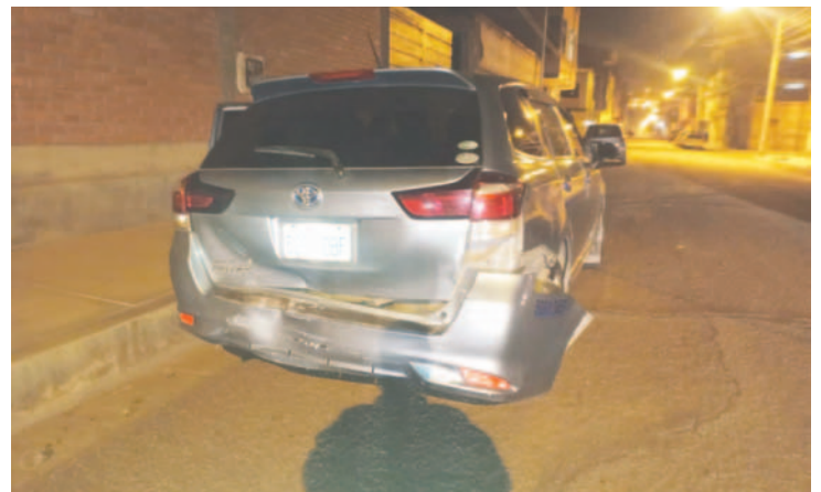
El incidente se registró la noche del jueves 31 de octubre en la zona Este de Oruro / TRÁNSITO