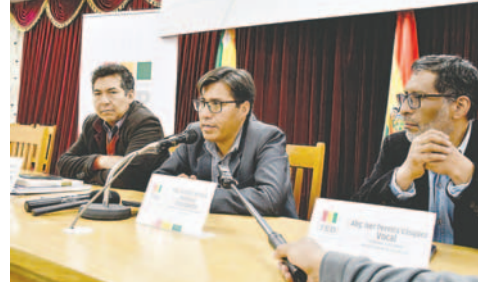
Autoridades del TED Oruro informaron sobre la suspensión de actividades del calendario electoral

“El Tribunal Supremo Electoral comunicó de manera oficial a los tribunales electorales departamentales la suspensión