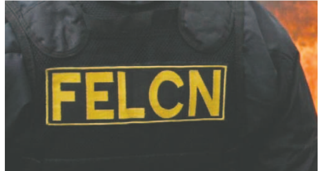
Efectivos de Umopar fueron exfiltrados tras permanecer días sin alimentos ni agua en una retención presuntamente vinculada a afines al expresidente Evo Morales / REFERENCIAL

En un video difundido la noche del jueves, los agentes policiales de-