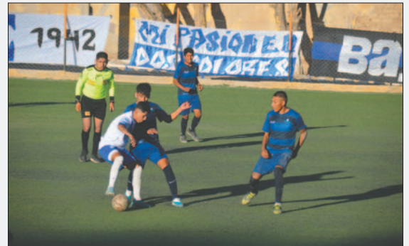
El siguiente encuentro de San José será contra JCDT Bolivia / LA PATRIA

Tomando en cuenta que este año los equipos que subirán a la Primera "A" serán tres, además de un cuarto cupo para luchar por el ascenso indirecto, el cuadro "santo" deberá lograr la mayor cantidad de triunfos y esperar un traspie de los que se encuentran en zona de clasificación, para te-