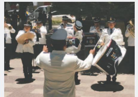
Se interpretaron piezas alusivas a la fecha

En el homenaje se pudieron apreciar reconocidas piezas en todos los ritmos característicos de Oruro y su Carnaval, Obra Maestra del Patrimonio Oral e Intangible de la Humanidad.