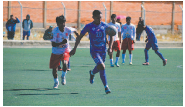
Escara tiene partidos difíciles, pero con un pie en la Copa "Simón Bolívar"

Andrés Fernando Irahola Zalles (AFIZ) es uno de los elencos que ha ido de menos a más en el torneo. Con