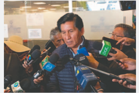
El senador del Movimiento Al Socialismo (MAS), Félix Ajpi