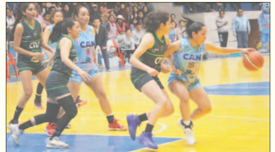
El equipo de CAN esta segundo en la tabla de posiciones de la Libofem

El cuadro celeste tiene descanso en la cuarta fecha de la Libofem y volverá a la acción en la quinta jornada cuando reciba al elenco de Ingavi de Llalagua, encuentro que aún no tiene fecha de confirmación por parte de la Federación Boliviana de Básquetbol (FBB). Esta situación también genera cierta preocupación en la dirigencia, ya que una suspensión prolongada significa romper la planificación que se tiene para la campaña de este año.