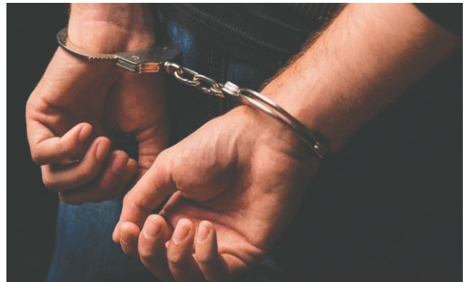
El implicado aprovechaba el tiempo a solas con su hija para agredirla sexualmente / REFERENCIAL

El agresor fue aprehendido el mismo día del hecho. La condena impuesta será cumplida en el penal de San Sebastián Varones. Este caso resalta la importancia del apoyo institucional para las víctimas de violencia sexual y la necesidad de una respuesta rápida por parte de las autoridades.