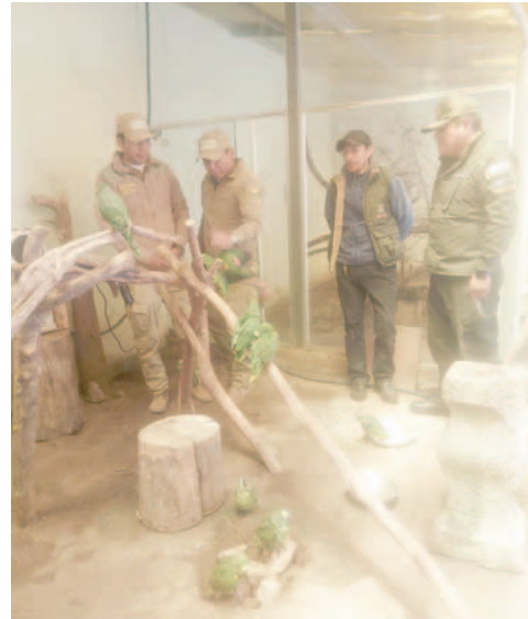
Fueron trasladados al Bioparque Andino Municipal de Oruro

entregadas a la Secretaría de Medio Ambiente. El Comando Departamental de Policía de Oruro publicó en su página de Facebook los detalles del rescate y decomiso.