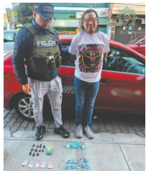
El implicado vendía cocaína en la ciudad de La Paz