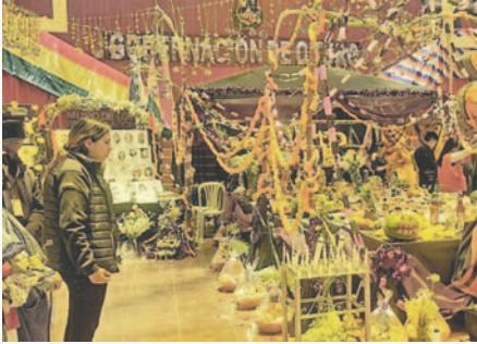
Mesa para recibir a las almas /LA PATRIA