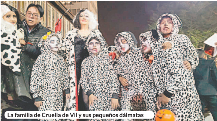
La familia de Cruella de Vil y sus pequeños dálmatas