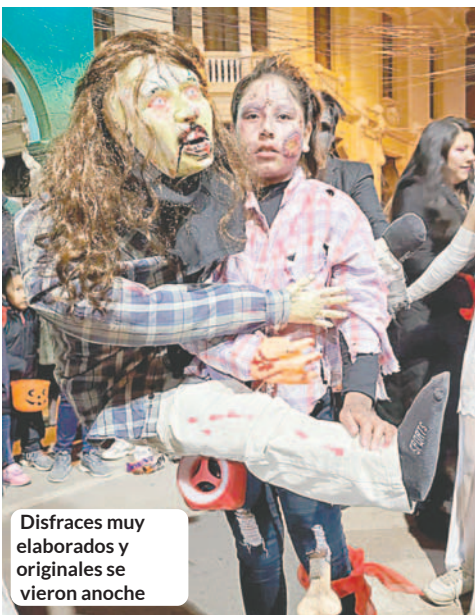
Disfraces muy elaborados y originales se vieron anoche