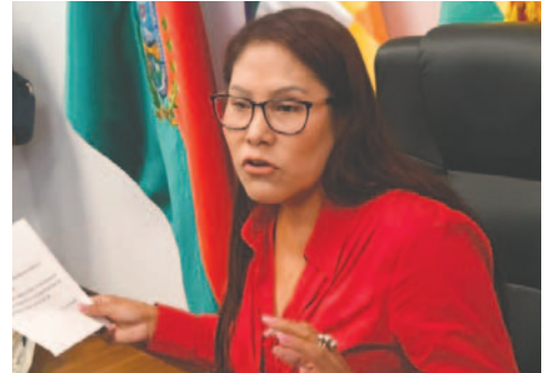
La senadora “evista” Lucy Escobar

de tres Hércules; en total serían siete aviones que aterrizan para enfrentar a los manifestantes. Indicó que la información ha sido proporcionada por personas que sí “sienten por el país”, incluso desde la misma Policía. El gabinete ministerial aprobó el Decreto Supremo 5265, que establece un “Reconocimiento Económico al Esfuerzo” para la Policía Boliviana, en medio de 17 días de bloqueos de carreteras promovidos por organizaciones sociales afines al exmandatario Evo Morales, principalmente en Cochabamba. La norma busca compensar a los servidores públicos de la institución policial que desempeñan su labor en situaciones de riesgo para su vida e integridad física. El artículo único del decreto indica que se establece el “Reconocimiento Económico al Esfuerzo”,