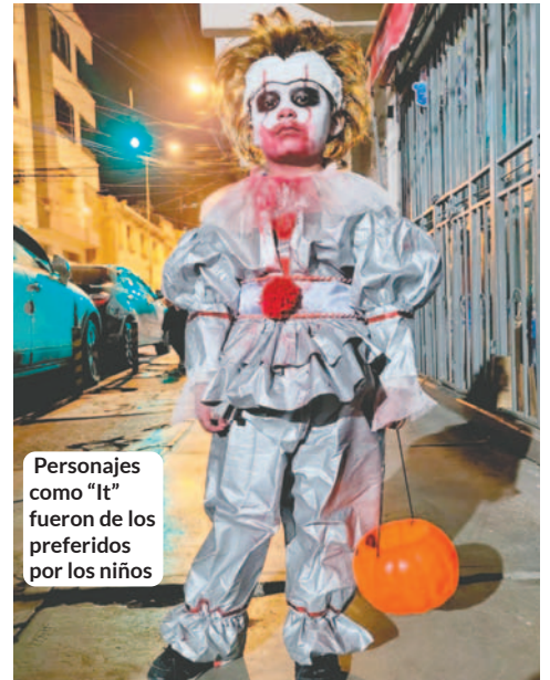
Personajes como "It" fueron de los preferidos por los niños