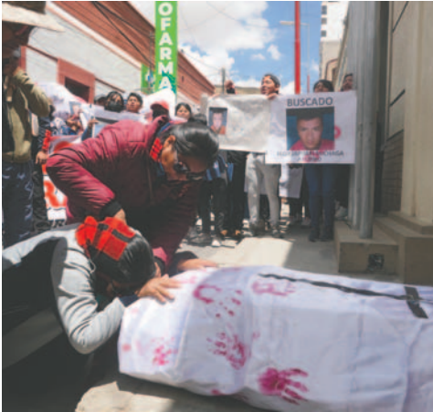
En puertas del Comando de Policía, la madre exige justicia por la muerte de su hija