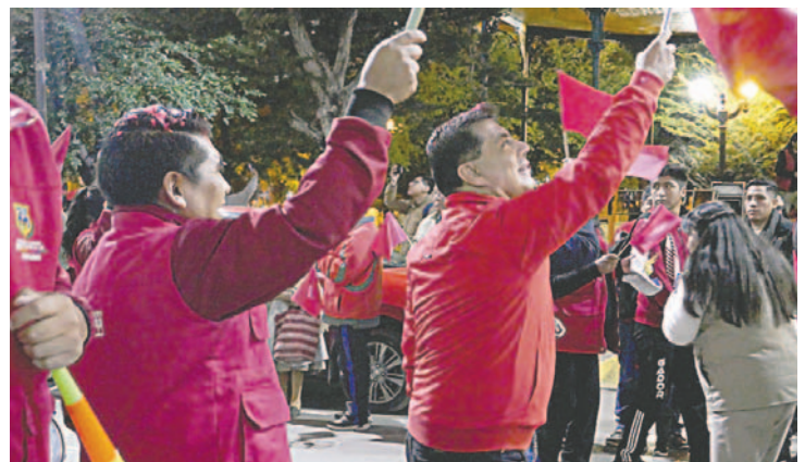
Gobernador Johnny Vedia derrocho entusiasmo