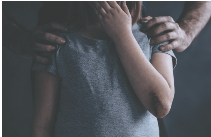
El individuo cumplirá una pena de 25 años de presidio por violar a su vecina /REFERENCIAL