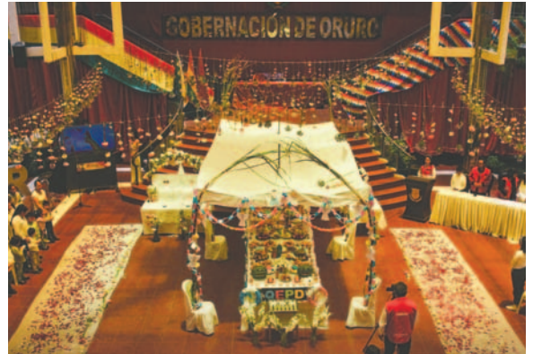
Instalan mesa simbólica para angelitos, actividad que, según la creencia, inicia Todos Santos

La mesa de angelitos se instaló a media mañana del 31 de octubre en el Hall de la Gobernación y permaneció hasta horas de