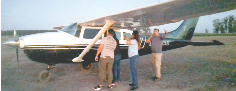
Incautan avioneta con sustancias controladas en el vecino país