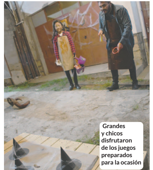
Grandes y chicos disfrutaron de los juegos preparados para la ocasión