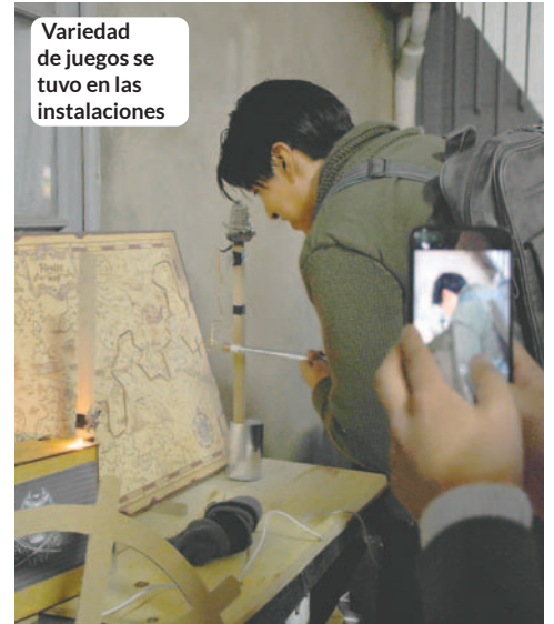
Variedad de juegos se tuvo en las instalaciones