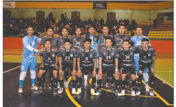
Fantasma Morales Moralitos quiere cimentar su camino hacia un nuevo título

go será la misma, con presión alta para condicionar al rival hacia el error y aprovechar la velocidad y calidad técnica de sus jugadores para abrir los espacios y marcar los goles.