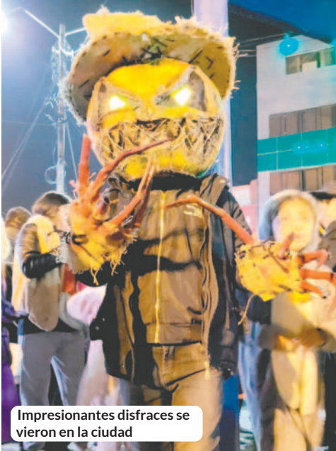
Impresionantes disfraces se vieron en la ciudad