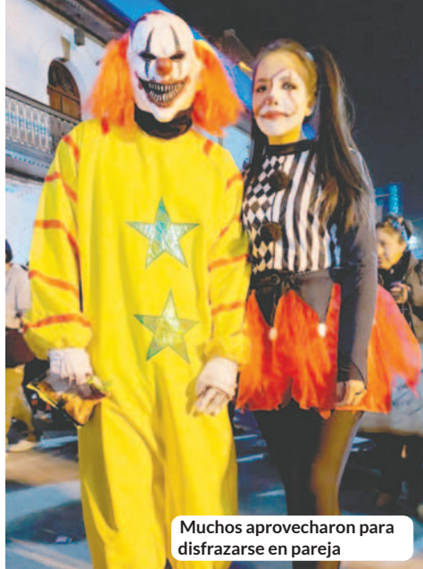
Muchos aprovecharon para disfrazarse en pareja