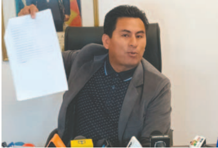
El diputado "evista" del Movimiento Al Socialismo, Gualberto Arispe