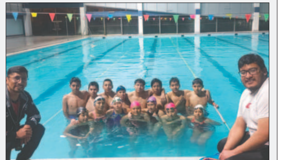
Los nadadores orureños que participarán en la competencia internacional