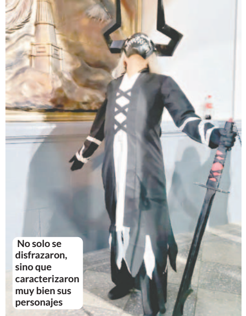
No solo se disfrazaron, sino que caracterizaron muy bien sus personajes