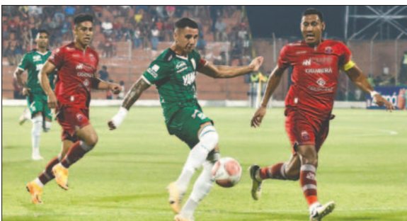
Oriente Petrolero se descuidó en el final y terminó perdiendo el partido