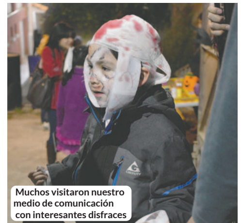
Muchos visitaron nuestro medio de comunicación con interesantes disfraces