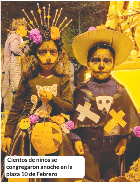
Cientos de niños se congregaron anoche en la plaza 10 de Febrero