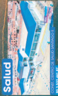
CONST. CENTRO DE SALUD SANTIAGO I BS 3.632.481,87