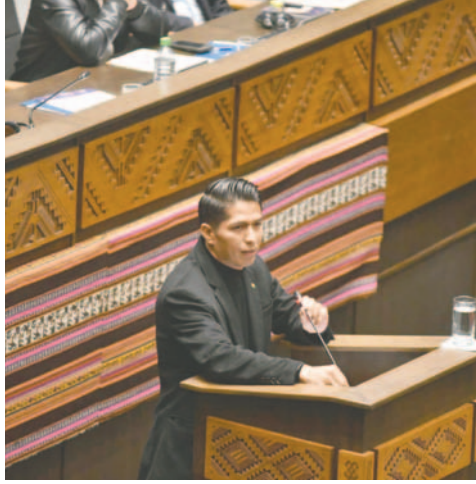
El presidente del Senado también rindió un informe detallado del trabajo hecho