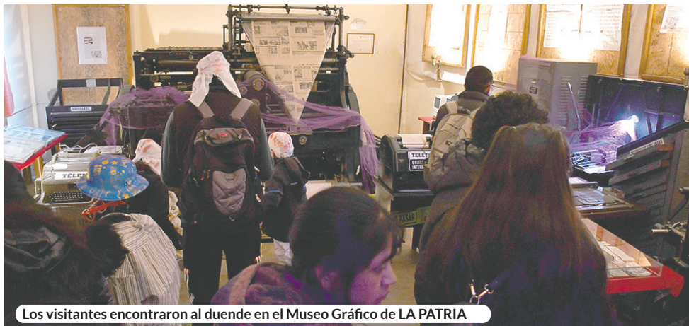
Los visitantes encontraron al duende en el Museo Gráfico de LA PATRIA