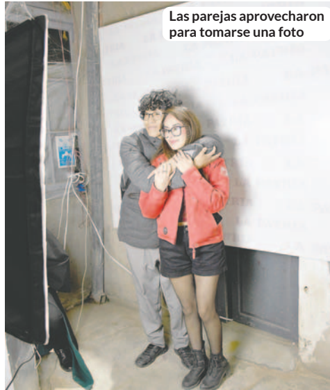
Las parejas aprovecharon para tomarse una foto