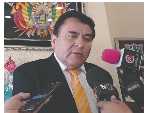
El fiscal departamental de Oruro, Aldo Morales, señaló que pedirán la prisión preventiva del implicado

Morales adelantó que el adulto está siendo investigado por el presunto delito de corrupción de menores y que solicitará su prisión preventiva mientras avanza la causa penal. Asimismo, señaló que el departamento de psicología valorará a ambas víctimas para determinar si es la primera vez que consumen bebidas alcohólicas o si han sido reiteradas.