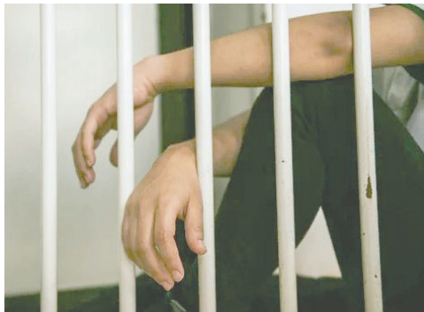
El autor del crimen sexual fue hallado culpable por la justicia /REFERENCIAL