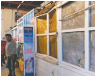
Escasea el pollo y no todos los puestos se abren por falta del producto

En un recorrido que LA PATRIA hizo por los mercados Campero, Bolívar y adyacentes, donde se vende este producto, se pudo evidenciar que no todos los puntos de venta están abiertos.