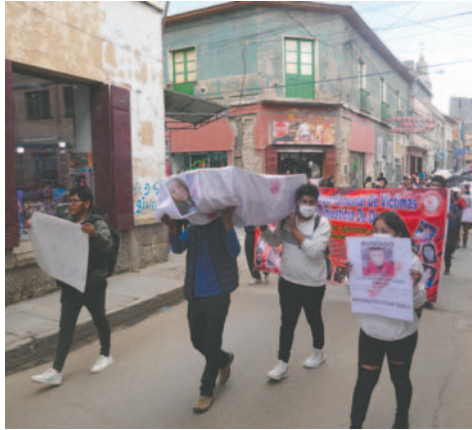
Simbólicamente, llevan un ataúd pidiendo que aceleren las investigaciones y puedan capturar al autor