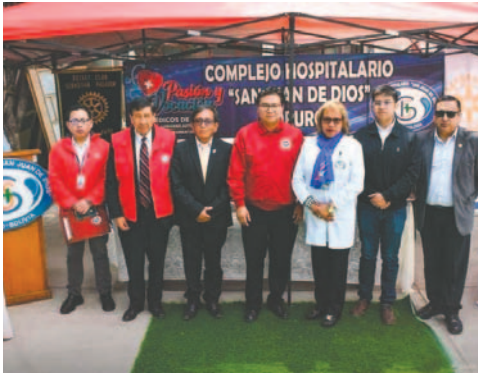
Hospital General es beneficiado con entrega de equipos para el laboratorio