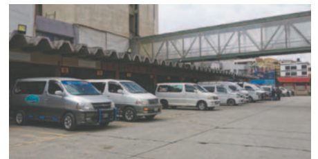
Lo surubíes a Cochabamba salen de la Terminal Hernando Siles y van por desvíos

Por los bloqueos, hasta la fecha, no hay salidas a Cochabamba desde la Estación de Autobuses Oruro, ante la desesperación varios pasajeros se arriesgan a tomar rutas alternas en vehículos particulares, autos contratados, “surubíes” o avión, pero por mayor precio, ya que tampoco se puede encontrar pasajes diarios por esta vía.