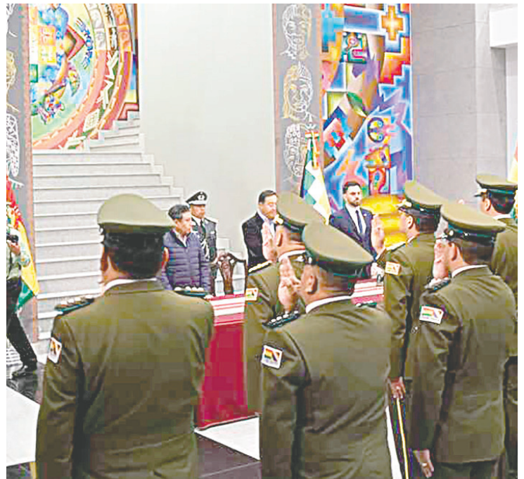
Policías recibirán reconocimiento económico por la labor y riesgo que enfrentaron en los recientes acontecimientos /REFERENCIAL

Presidente Luis Arce lanzó un ultimátum al exmandatario Evo Morales para que levante los bloqueos y que, de no hacerlo, ejercerá sus facultades constitucionales para precautelar el interés