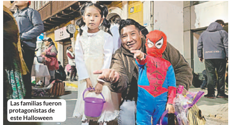
Las familias fueron protagonistas de este Halloween