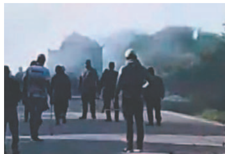
La madrugada de ayer, civiles se enfrentaron al intentar desbloquear una vía, generando disturbios y caos en las calles /REFERENCIAL

El representante de la UJC aclaró que ellos han dado 48 horas a la Policía para desbloquear. Indicó que, tomando en cuenta Todos Santos, la Unión realizaría acciones el lunes.