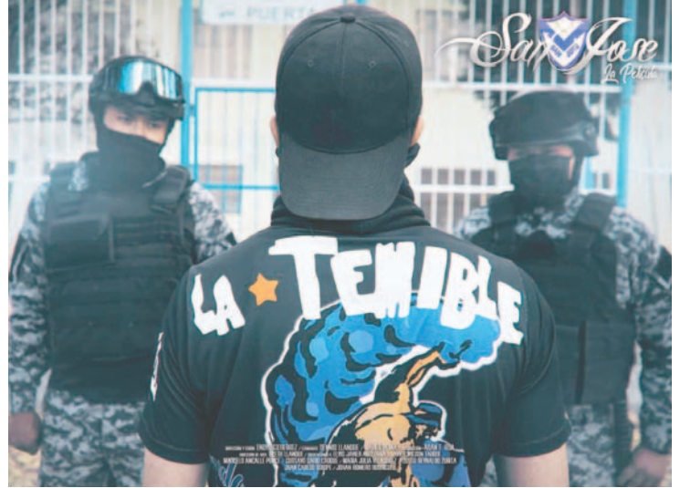
La barra brava, elemento protagonista de la película