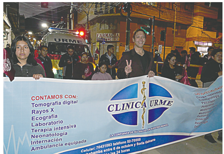
Clínica Urme dijo presente en la caravana