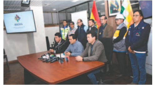
Distintas autoridades del Ejecutivo negaron que vayan a "abandonar el barco"

chos suscitados en 2019, cuando le pidieron la renuncia a Morales; ahora este se convirtió en quien pide que den un paso al costado.