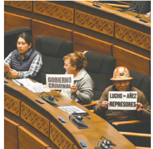
Algunos asambleístas aprovecharon para criticar al Gobierno