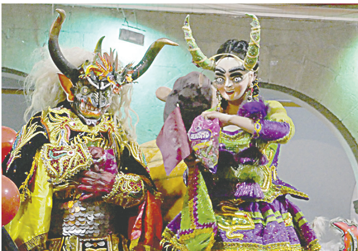
Caravana mostró lo mejor de Oruro