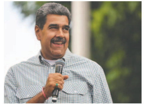
Foto de archivo del presidente de Venezuela, Nicolás Maduro

La ONG Utopix contabilizó 125 víctimas de feminicidios entre enero y agosto de este año, lo que computa un promedio de una mujer asesinada cada 47 horas. Generalmente estas muertes son a manos de hombres