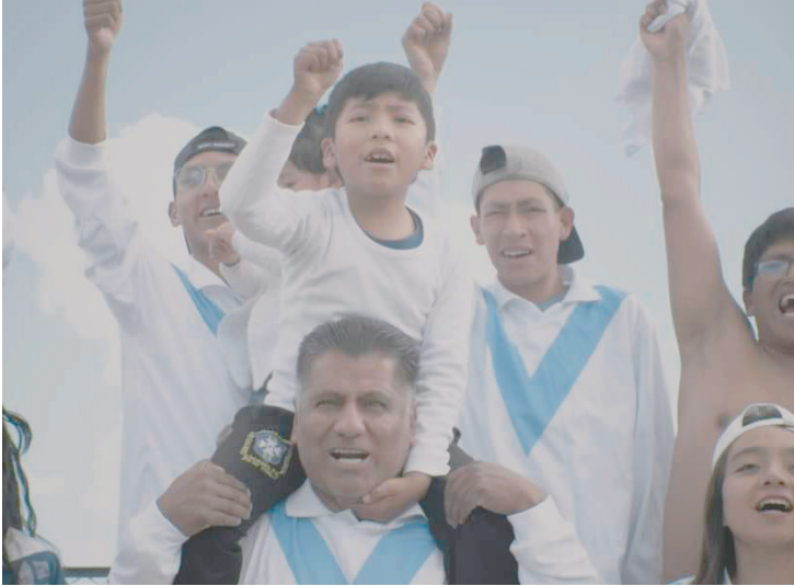
La película rinde honores a una pasión de los orureños