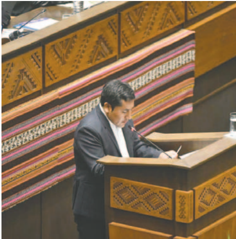
Huaytari brindó su informe de cierre de gestión