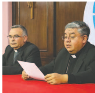
La Conferencia Episcopal pide a las autoridades tener un diálogo urgente

de gasolina y diésel, el incremento desproporcionado de los precios de la canasta familiar, entre otros perjuicios, se han convertido en una realidad que está generando el sufrimiento del pueblo boliviano", dice el pronunciamiento de la CEB.