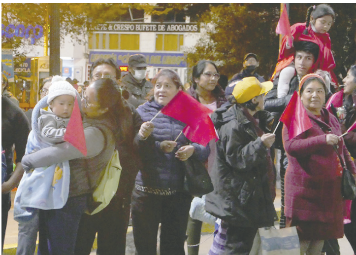
Familias disfrutaron de la caravana