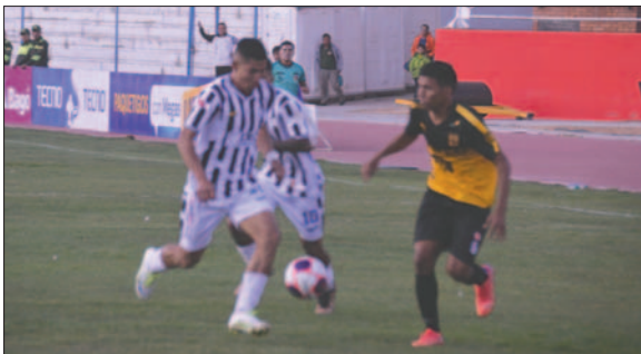
Oruro Royal va por el pase a los cuartos de final

No se tienen bajas en el equipo y se pondrá el mejor elemento para sacar a flote un resultado positivo e ingresar con fuerza a los cuartos de final del torneo nacional.