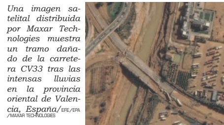
Una imagen satelital distribuida por Maxar Technologies muestra un tramo dañado de la carretera CV33 tras las intensas lluvias en la provincia oriental de Valencia, España.