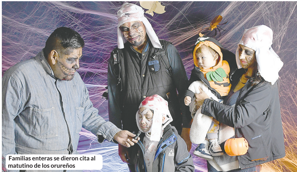
Familias enteras se dieron cita al matutino de los orureños