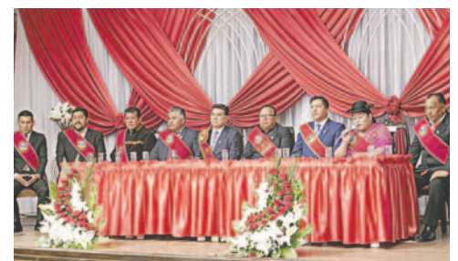
Solemne Sesión por los 418 años de fundación de Oruro

En cuanto a proyectos, resaltó que en total la Gobernación encara 46, 33 de ellos que serán entregados en su gestión, y de los cuales 18 son en la ciudad de Oruro, superando los