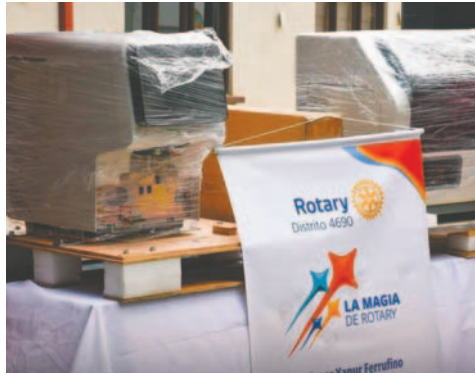
Donación de parte del Rotary Club Sebastián Pagador /GADOR