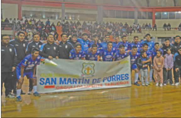
San Martín tratará de hacer respetar su casa