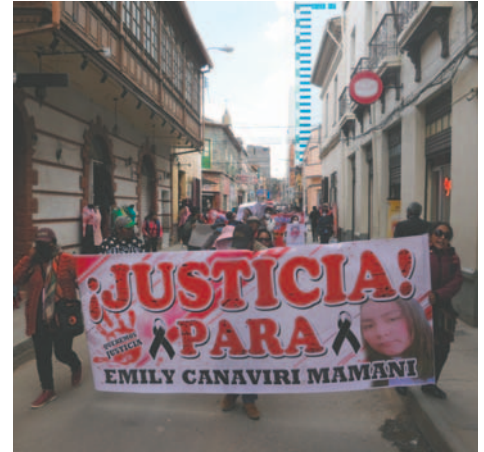
La marcha de protesta recorrió distintas calles de la ciudad de Oruro