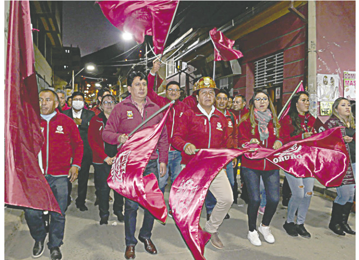
Alcalde Adhemar Wilcarani demostró su espíritu orureño

En la caravana, los orureños lucieron los distintivos más representativos de la ciudad, como el Casco del Minero, las poleras (camisetas) del Club San José y caretas (máscaras) de diablos que representan al Carnaval de Oruro, Obra Maestra del Patrimonio Oral e Intangible de la Humanidad.