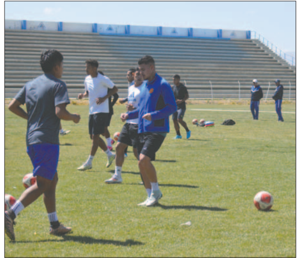
El equipo volverá a los entrenamientos el siguiente lunes