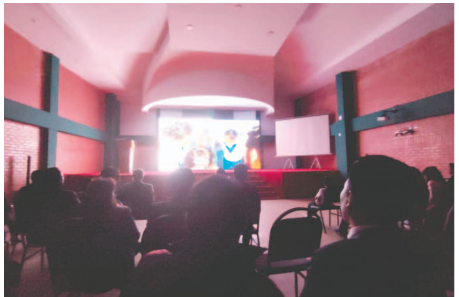
La avant premier se vivió con mucha emoción

Los pasajes más importantes de la historia del club se reflejan en una maravillosa película que espera ser descubierta por aquellos que desean ver nuevamente jugar a su equipo en ese histórico estadio “Jesús Bermúdez”, porque, como dice el canto: “Volveremos, volveremos. Volveremos otra vez”. “San José - La Película” los espera en el Multicines Plaza este 3 de noviembre.