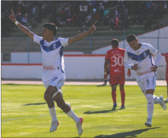
El próximo encuentro para GV San José será ante Aurora

El primer plantel retornará a las prácticas el próximo lunes 4 de noviembre, con la mirada puesta en el encuentro a jugarse ante Aurora, correspondiente a la fecha 20 del torneo, que debía disputarse el viernes 25 de octubre, pero que fue postergado debido a que el "equipo del pueblo" no pudo conseguir los pasajes para el viaje a la capital del Pagador.