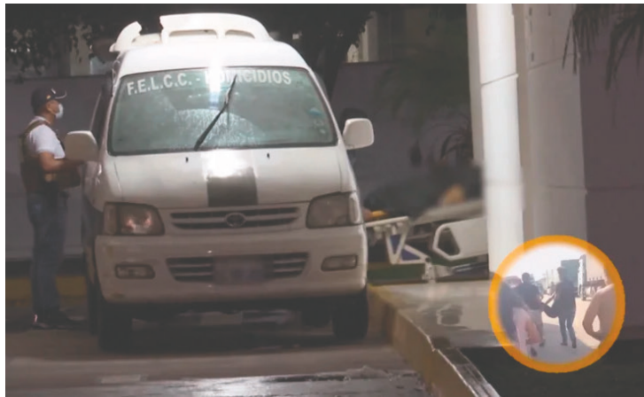
Personal de Homicidios y agentes antinarcóticos se trasladaron al nosocomio tras identificar que la mujer llevaba cápsulas de droga

El cuerpo de la mujer permanece en el morgue judicial de la Pampa de la Isla, y hasta el momento, nadie ha acudido a reclamarlo. Las autoridades continúan investigando para dar con su identidad y esclarecer detalles sobre el origen de la droga y el destino final de la trágica carga.