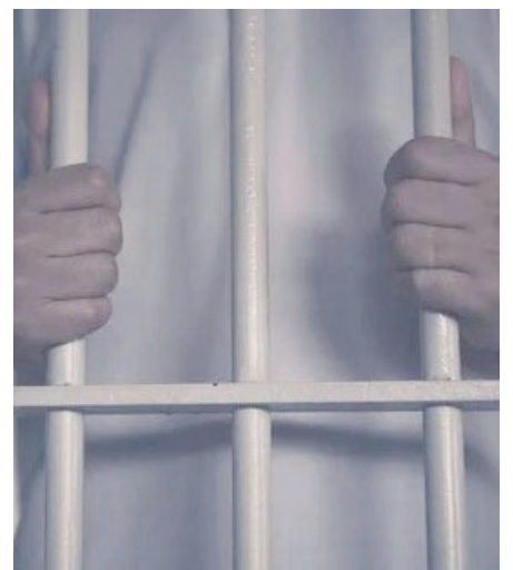
El inmigrante fue aprehendido por la Policía y la Fiscalía le abrió un expediente penal por robo /REFERENCIAL

La autoridad fiscal detalló que también iniciaron un expediente penal contra un hombre de 36 años que arrebató el celular de un joven sobre la avenida Tomás Barrón, zona Norte de la urbe orureña. El implicado del robo se dio a la fuga, pero la víctima, junto a efectivos del Centro de Adiestramiento de Canes (CAC), en una persecución lograron su captura.