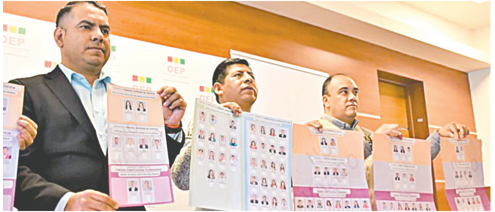
Los comicios para el Órgano Judicial se pospone

Inicialmente, el Órgano Electoral determinó que las elecciones para magis-