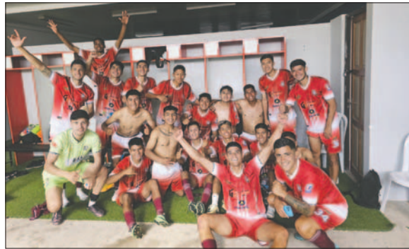
El decano recibirá a CD Alemán con la ventaja del 3-0 que logró en Sucre / ORURO ROYAL CLUB