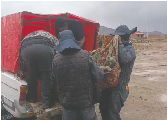
Vecinos socorren al trabajador a un centro de salud

Contó a LA PATRIA que cuando empezó la tormenta, ingresó a una vivienda techada