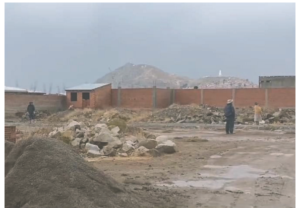
El incidente sucedió la tarde del martes 29 de octubre en la zona Sur de Oruro

talón quedó destrozado, sino también su chompa y una gorra, y que luego de perder el conocimiento por un momento, se arrastró hasta su celular para pedir ayuda.