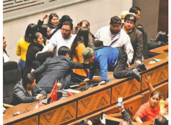
Agresión durante una sesión de la Cámara Baja

Otra de las dificultades que tuvo la Asamblea Legislativa Plurinacional fue la preselección de los candidatos a autoridades del Órgano Judicial. Desde una pasada legislatura no pudieron realizar la acción