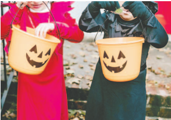
Los niños fueron los principales protagonistas desde siempre