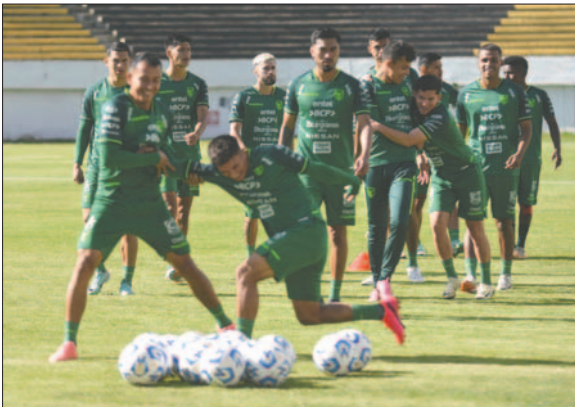
La preparación de los seleccionados se realizará desde el fin de semana