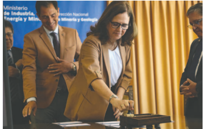
La ministra de Industria, Energía y Minería de Uruguay, Elisa Facio

La ministra también enfatizó la importancia de este suceso para el país. "Es un hito muy importante porque es el primer proyecto concreto. Hemos visto estos proyectos en el mundo (...) y entendemos que Uruguay tiene una gran oportunidad para que se transforme en otro sector de exportación. Tenemos es-