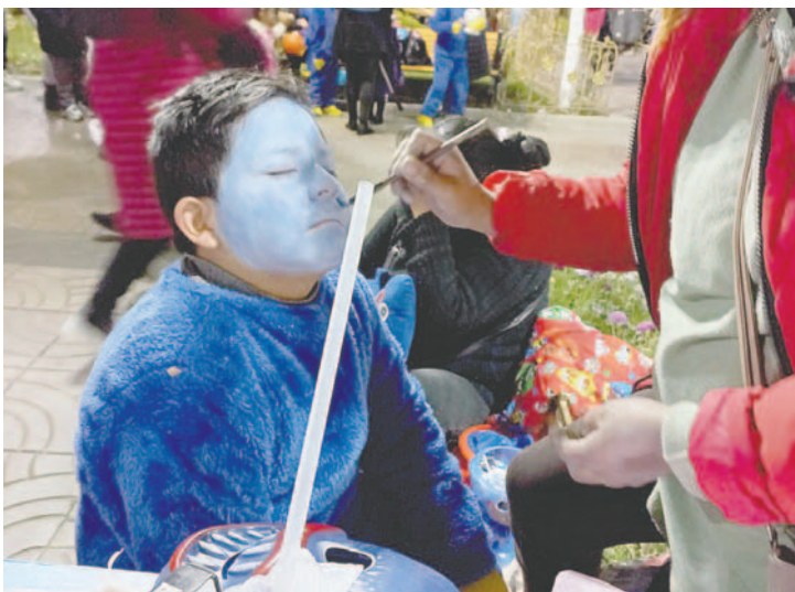
Muchos aprovechan para realizar actividades comerciales en esta fecha