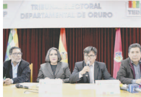
Mañana se realizará el sorteo de jurados electorales en Oruro / LA PATRIA

Ayer, la vocal del Tribunal Supremo Electoral (TSE), Nancy Gutiérrez, exhortó a la ciudadanía a cumplir con su deber de ser jurado electoral el domingo 1 de diciembre, ejerciendo el cargo de