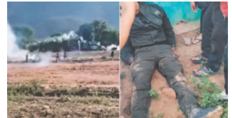
Afines a Evo Morales agredieron a policías y periodistas en Mairana