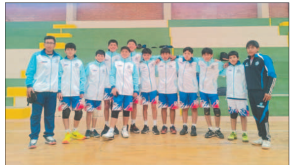
Anglo Americano el mejor en el voleibol varones

En fútbol, el colegio Simón Bolívar de Oruro se quedó con el primer puesto, dejando al municipio de Huanuni en segundo lugar, Antequera en tercera posición y a Challapata en cuarto lugar. En damas, Bolivia Vinto de Oruro clasificó a la tercera fase, dejando en el segundo puesto a Challapata, Huanuni en tercer puesto y a Caracollo en cuar-