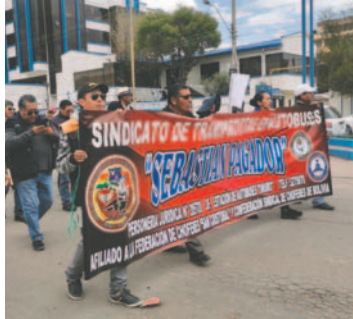
La marcha recorrió varias calles de la ciudad y concluyó en la Estación de Autobuses Oruro

Operadores de autobuses interdepartamentales realizaron una marcha de protesta denunciando perjuicios y afectación a sus fuentes de trabajo, ante varios días de bloqueos en carreteras que provocaron la suspensión de viajes a Cochabamba y rutas alternas a otros destinos.