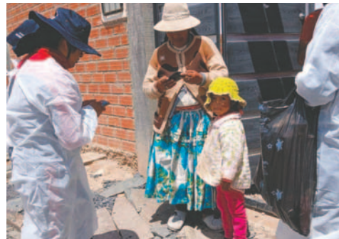
Búsqueda de niños sin vacunas se intensificará / SEDES

Asimismo, se abordó el tema de la administración de los micronutrientes en establecimientos de salud priorizados del área urbana que presentan bajas coberturas de vacunación, trabajo que se realiza en alianza estratégica con universidades e institutos formadores en salud en la carrera de enfermería.