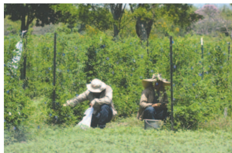
Cultivadores durante la recolecta de semillas de frijol para ser investigadas por el Centro Internacional de Agricultura Tropical (CIAT), en Palmira (Colombia)