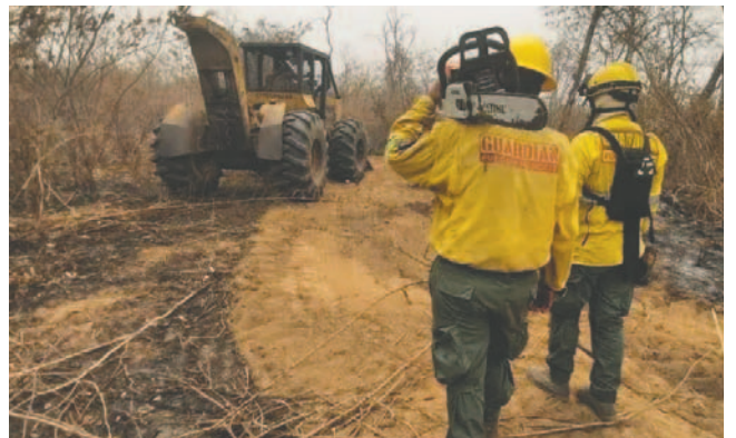
El único municipio afectado es Concepción, según reportes del COED