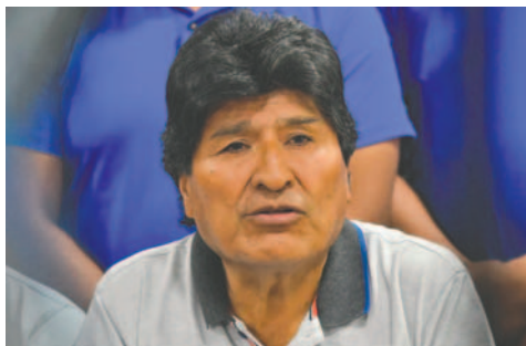
El expresidente de Bolivia Evo Morales

En su mensaje al país, Arce pidió a Morales le-