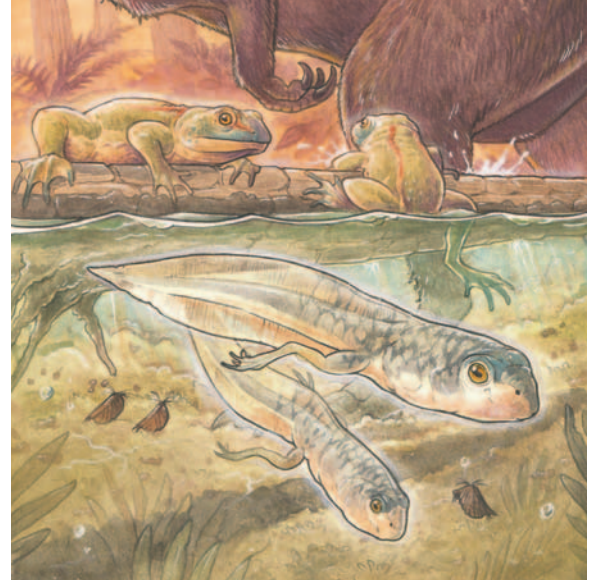
Recreación de renacuajos y adultos de "Notobatrachus degiustoi" en una laguna del Jurásico Medio de Patagonia

El descubrimiento es relevante porque permite entender mejor la evolución del peculiar ciclo de vida de los anuros, grupo que incluye ranas, sapos y escuerzos. Estos son los únicos vertebrados vivientes que atraviesan modificaciones extremas en su morfología y ecología entre la fase larval y la adulta reproductiva.