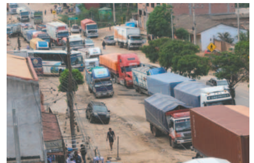
Los transportistas están varados debido a los bloqueos