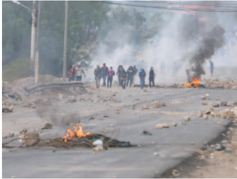
Hay varios procesos por conflictos sociales

Mariaca hizo un llamado a la reflexión a las personas involucradas en los hechos que está investigando la Fiscalía, ya que hay quienes desean la libre transpirabilidad y el abastecimiento de los productos de la canasta familiar.