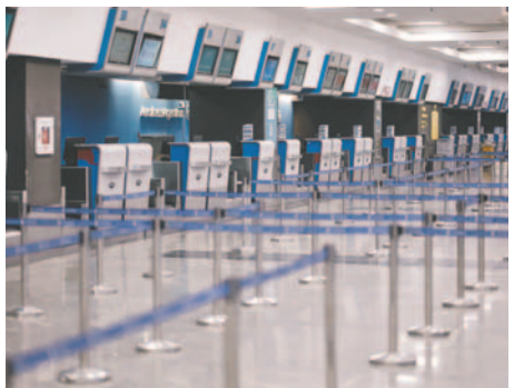
‘Counters’ de distintas aerolíneas permanecen vacíos, sin trabajadores ni pasajeros, este miércoles, en el Aeropuerto Internacional Jorge Newbery en Buenos Aires (Argentina)

LA PATRIA / EFE La ciudad de Buenos Aires amaneció este miércoles 30 de octubre con largas filas en las paradas de autobuses, el único medio de transporte que opera en la capital argentina a causa de una huelga de 24 horas que afecta a los aviones, trenes, metro capitalino (Subte) y taxis. “Me he coordinado con un vecino para ir a trabajar en su auto”, explicó a EFE Erika, una mujer que vive en un suburbio capitalino y va cada día a trabajar al centro de la capital, lo que supone, en su caso, recorrer más de 20 kilómetros. Quienes pudieron organizarse con allegados están llegando a sus puestos de trabajo, pero aquellos que dependen del transporte público ferroviario y viven en las periferias están atravesando dificultades para llegar a su destino. Por esa razón, muchos trabajadores no acudieron a sus puestos, según confirmaron a EFE varios afectados. “La gente que vive lejos y no tiene auto se está quedando en casa, no está yendo a trabajar. Sin trenes no se accede a la capital”, afirmó un ciudadano porteño. En la ciudad de Buenos Aires solo operan los autobuses urbanos (colectivos), por eso las filas desde la madrugada están siendo la nota dominante en esta jornada de huelga, a la que mañana se sumarán los conductores de autobuses si