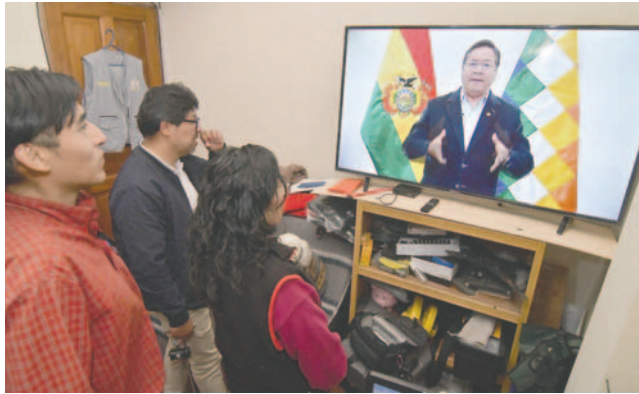
El Presidente ayer emitió un comunicado televisado

El primer mandatario expresó que los intereses del expresidente Evo Morales no pueden estar por encima del bien común, ya que los bloqueadores son seguidores de Morales y no es la primera vez que durante el año hubo movilizaciones. Además, las medidas de presión tienen un doble discurso, ya que con la acción están afectando la economía del Estado por la “imposición” de la candidatura del