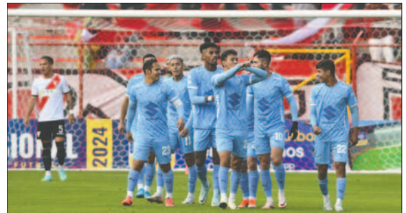
Jugadores de Bolívar celebran el "festín" de goles que se dieron en El Alto