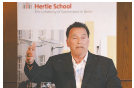
Fotografía de archivo del actor y exgobernador republicano de California Arnold Schwarzenegger

"Siempre seré estadounidense antes que republicano. Por eso, esta semana votaré por Kamala Harris y