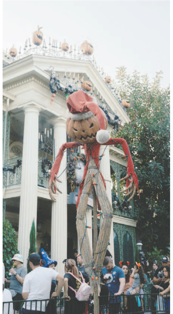
Los desfiles de Halloween persisten desde los inicios de esta fiesta

Por otro lado, esta fiesta también ha impactado el comercio local. Disfraces, pelucas y elementos decorativos son ofertados por numerosos comerciantes. Cientos de ciudadanos realizan compras para celebrar Halloween, destacando que los niños son quienes más disfrutan del evento.