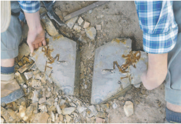
Laja con huesos del renacuajo de "Notobatrachus"