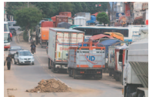
Los bloqueos llevan 17 días