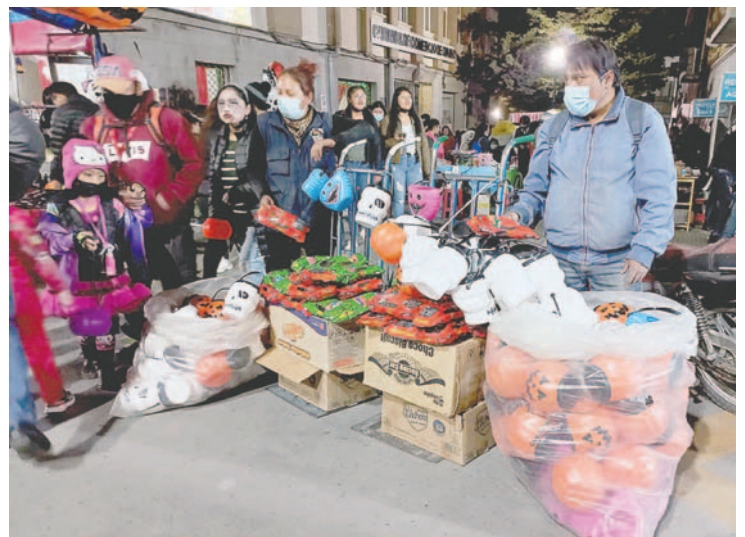
Muchos consideran la fiesta de Halloween como algo comercial