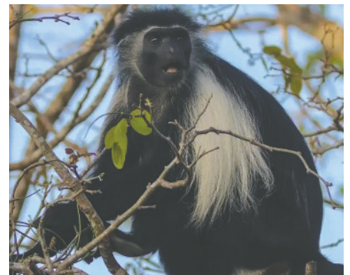
El consumo de alcohol en la vida salvaje resultó ser más común de lo pensado