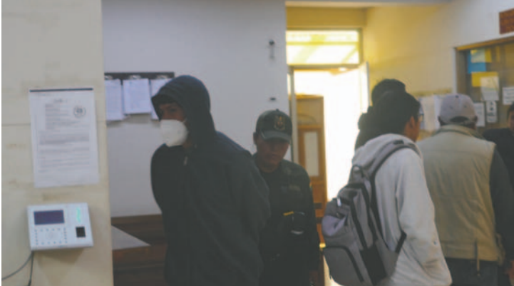
El implicado fue enviado a la cárcel por tiempo indefinido mientras avanza la investigación