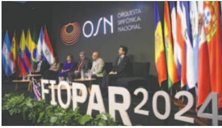
Autoridades se reúnen para la inauguración de la XIX Asamblea General de la Federación Iberoamericana del Ombudsperson (FIO)

LA PATRIA Defensores del Pueblo de 22 países iberoamericanos expresaron su preocupación por los efectos del cambio climático y la contaminación en los derechos humanos de las poblaciones vulnerables y pueblos indígenas, durante la inauguración de la XIX Asamblea General de la Federación Iberoamericana del Ombudsperson (FIO) en Asunción, Paraguay, el miércoles.