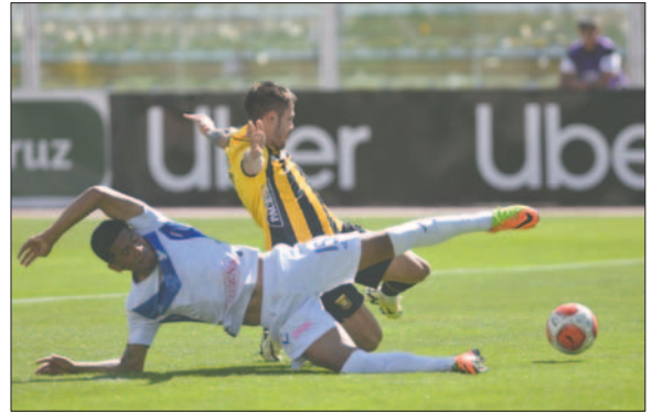
Una acción del partido que finalizó con victoria "atigrada" 3 a 2

Sin embargo, el "tigre" aumentó la cuenta, a los 89 minutos, con una