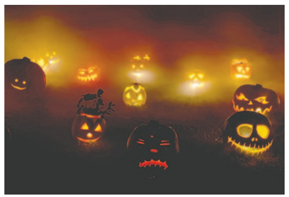
Las calabazas se volvieron la característica principal de esta celebración