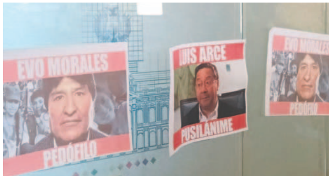
Los carteles que el diputado puso en la Asamblea Legislativa

Las acciones que tomó el diputado al pegar los carteles se dieron tras los incidentes violentos que involucraron a fuerzas policiales y medios de comunicación. Astorga también