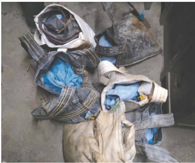
Tres personas fueron aprehendidas por robo de mineral en Huanuni

Morales anunció que se imputará al conductor por el presunto delito de robo de mineral y que solicitará su detención preventiva en el penal de San Pedro mientras avanza la etapa preparatoria.