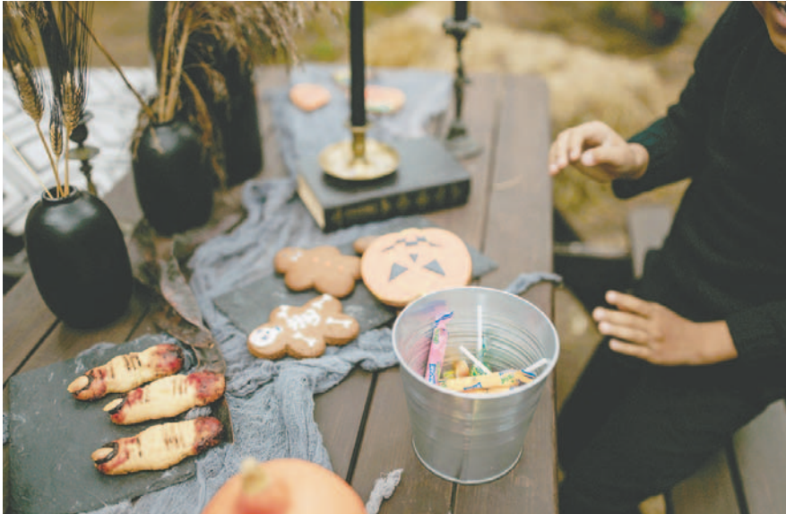
La fiesta de Halloween cobró más fuerza con el pasar de los años