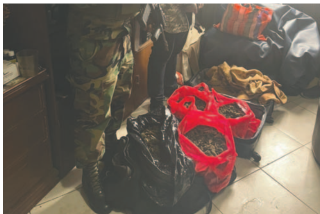
La droga fue secuestrada para fines investigativos

El hecho se registró cuando efectivos de inteligencia de la Felcn realiza-