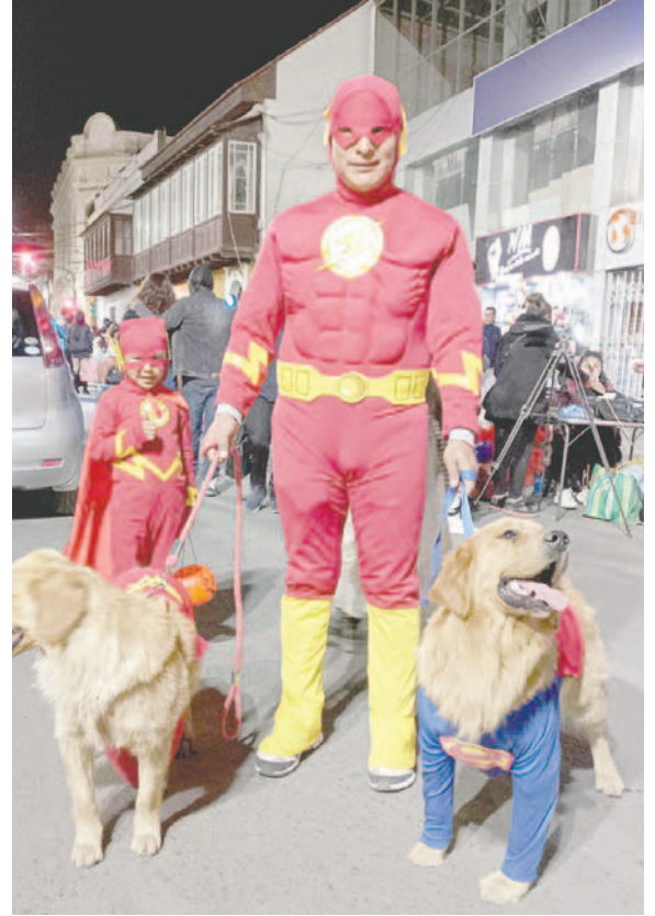
Halloween cada año cobra más fuerza en Bolivia

"Mañana (hoy) veremos la participación masiva de grupos familiares en esta actividad. Ante este 'avasallamiento' cultural, tremendo paquete y difusión que tiene Halloween, será difícil