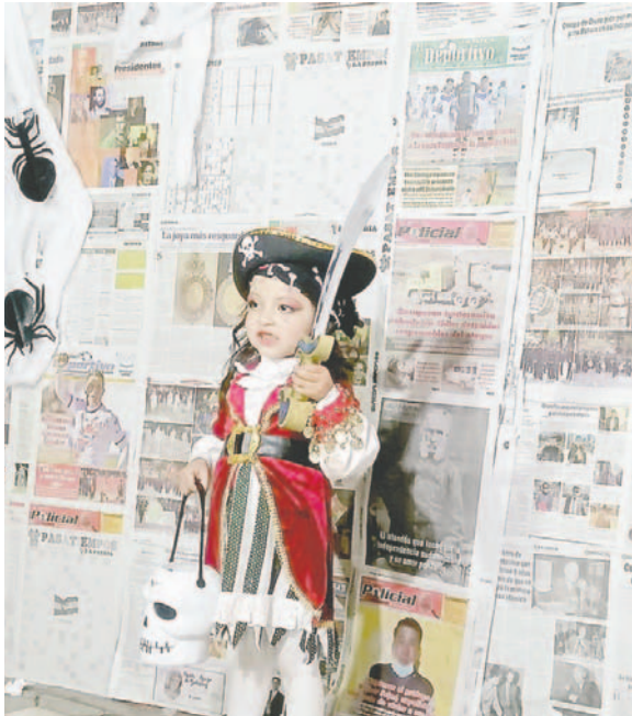
Los niños son quienes principalmente están presentes en la jornada /LA PATRIA

Ahora, se busca que los personajes andinos cobren con el tiempo esa relevancia y, según estos dos autores, sean también la temática favorita de las familias.