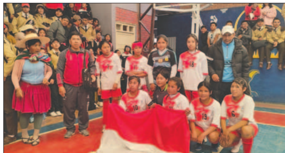
Bolivia Vinto el mejor en el fútbol de salón femenino / LA PATRIA

En voleibol femenino, el colegio Alemán de Oruro ocupó el primer puesto, seguido de Poopó en segundo lugar, Challapata en tercera posición y Huanuni en cuarto lugar. En voleibol masculino, el primer puesto se lo llevó el colegio Anglo Americano de Oruro, Challapata en segundo puesto, Escara en tercer lugar y Huanuni en la cuarta casilla.