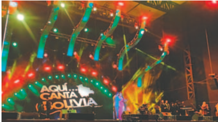
Festival de la Canción Boliviana 2023