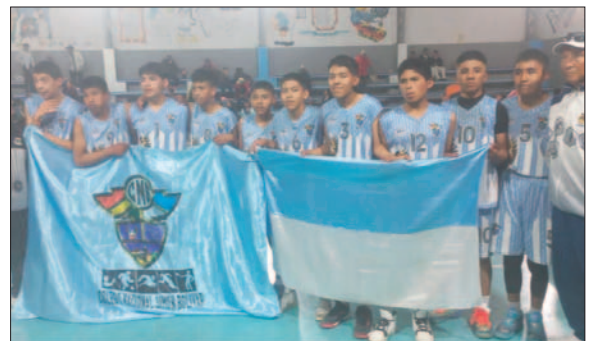
Simón Bolívar primero en el baloncesto masculino / LA PATRIA