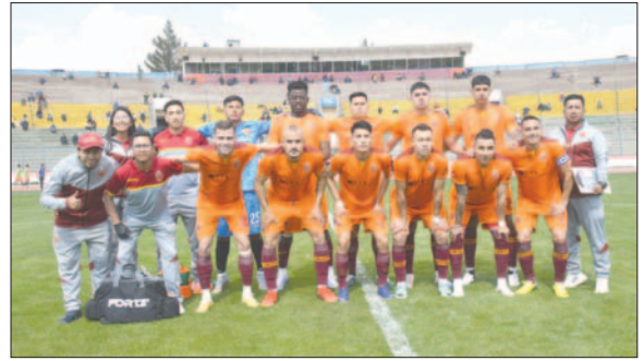
CDT Real Oruro jugará de visita ante Tiquipaya FC con la ventaja de 2-1

En el cotejo de ida, el elenco realista ganó difícilmente en Oruro por 2 goles contra 1, por lo que lleva cierta ventaja para este partido de vuelta.