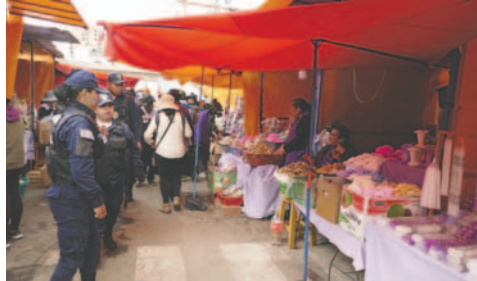
Feriantes movieron sus puestos de venta

“Entramos en quiebra este año porque nuestras cosas se han destrozado. Todas estábamos en nuestros puestos, pero viendo que no se estaba vendiendo, tuvimos que salir. Espero que tengan la comprensión absoluta los vecinos. Hemos hecho todo lo posible para estar así, pero no había venta.