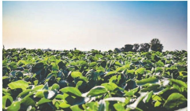
La soya HB4® utiliza el gen hahb-4 que proviene del girasol

La HB4®, desarrollada por la empresa argentina Bioceres junto con el Consejo Nacional de Investigaciones Científicas y Técnicas (Conicet) y la Universidad Nacional del