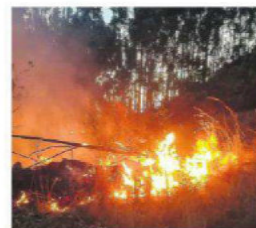
Unas 2.000 ha en la reserva

bierno respondió que "se quiere negociar abiertamente en beneficio de nuestro país y no de una persona". A4-6