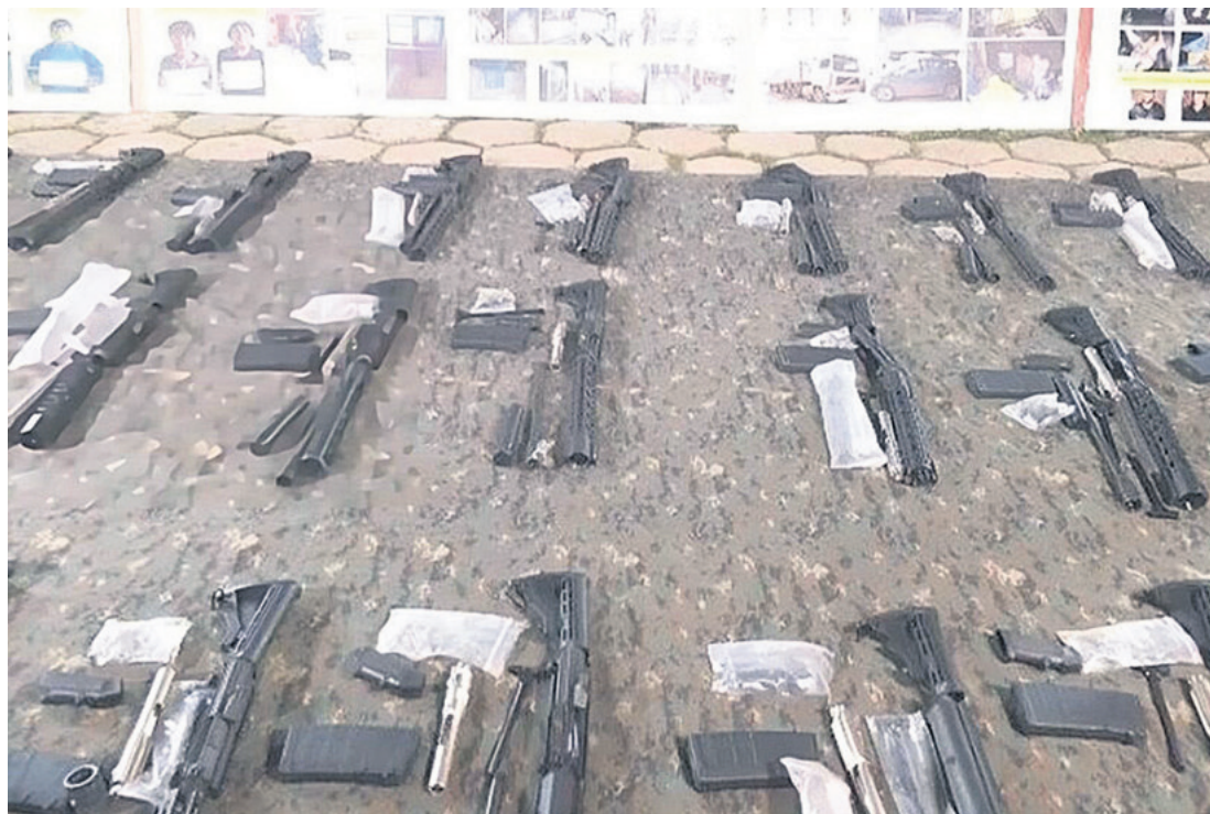
Las armas de fuego en Bolivia tienen que pasar por un registro. Evo Morales tiene dos escopetas.