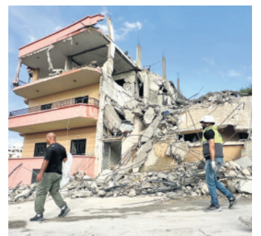
Civiles evalúan los daños

Más de 2.900 personas han muerto en Líbano desde hace un año, cuando empezó el conflicto.