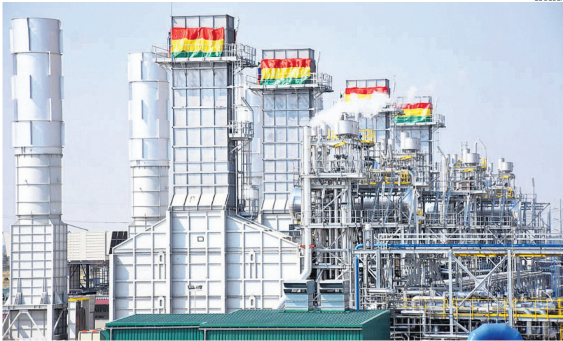
En el ámbito de la electricidad, la variación alcanzó un 6,91%, según el informe oficial del INE