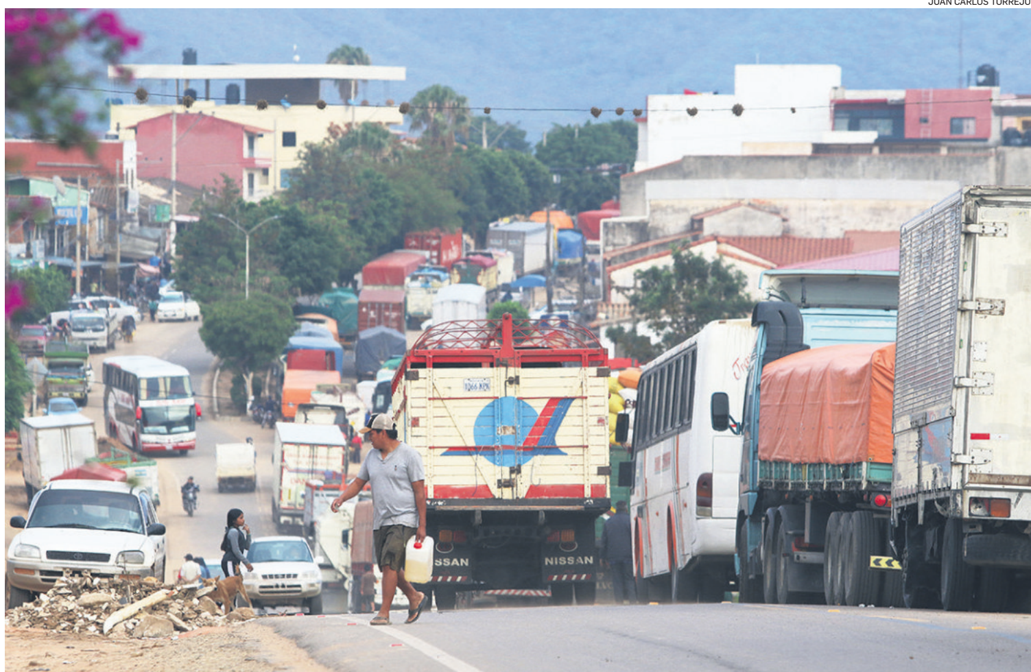
Cientos de motorizados perjudicados no pueden pasar desde hace semanas en Mairana, donde ya se registraron duros enfrentamientos