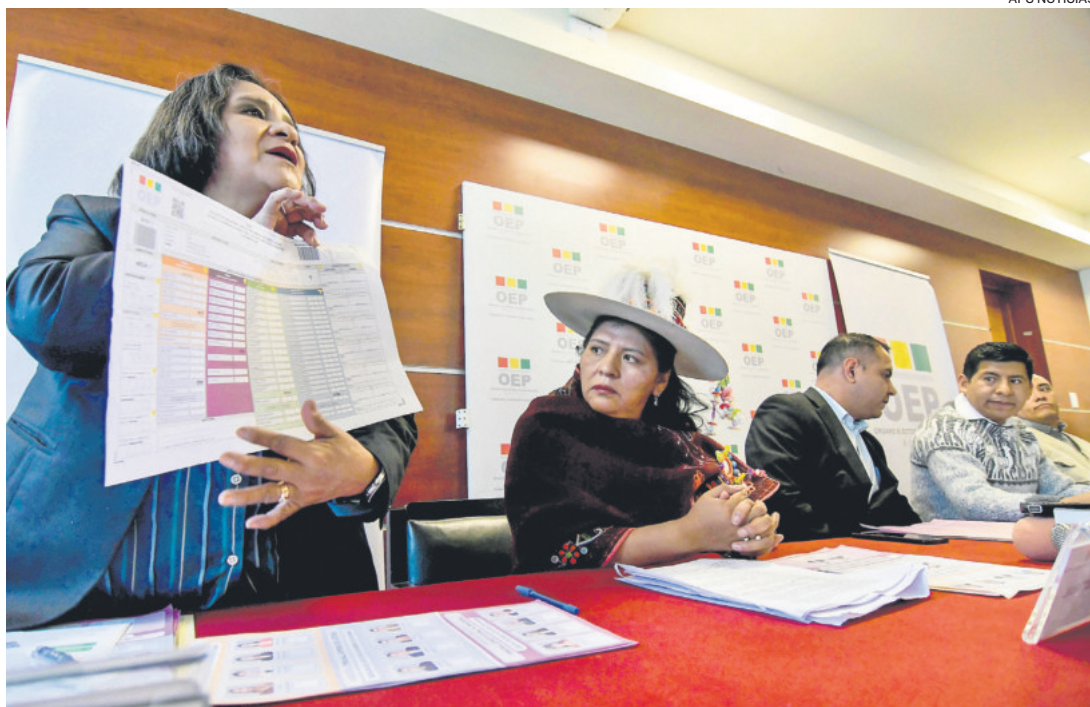
Los vocales electorales tienen planificado llevar adelante las elecciones judiciales el 15 de diciembre