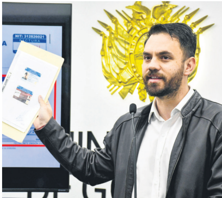
El ministro Eduardo Del Castillo volvió a atacar a Evo Morales

Boliviana se ha movilizado para poder garantizar la transitabilidad. Del gran contingente movilizado en los 21 días, tenemos 92 policías heridos. Solo en el último operativo son cerca de 44 policías", informó Del Castillo.