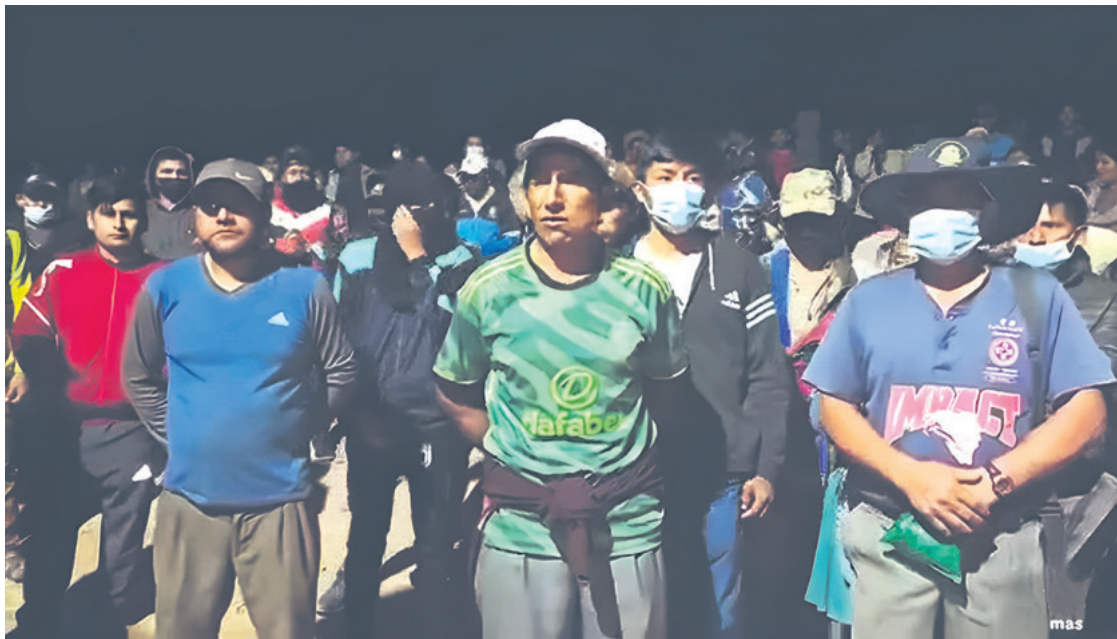
La Policía ya tiene identificados a numerosos cabecillas encapuchados, armados con dinamita

La movilización empezó con el traslado de un contingente con todos sus equipos de protección desde el aeropuerto El Trompillo, en un avión Hércules de la Fuerza Aérea Boliviana (FAB) directo