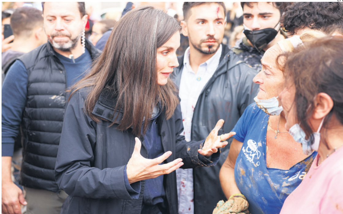
La reina Letizia habla con damnificados por las inundaciones, durante su visita a Paiporta el domingo

Con la cara manchada de barro, igual que su abrigo, el monarca, acompañado por momentos por Mazón, siguió avanzando por una de las calles principales de la localidad y dialogó con alguno de los vecinos