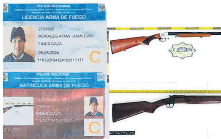
El ministro Del Castillo acusó a Evo Morales de tener tres armas.