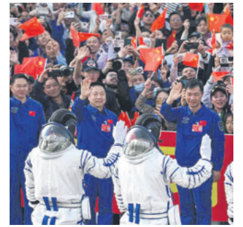
Los tres astronautas en China

Otro de los focos de la jornada está puesto en un centro comercial en las inmediaciones del pueblo de Aldaia, golpeado fuertemente por la tragedia.