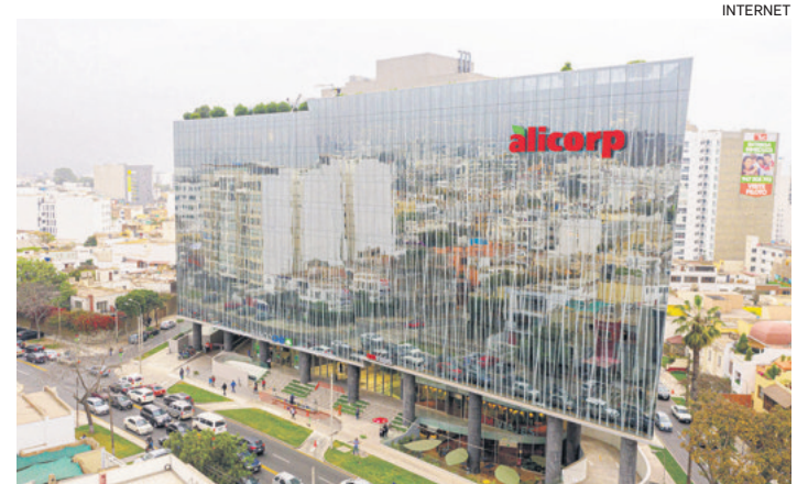
Alicorp siente el efecto de la menor demanda en mercado de Perú

En línea con este enfoque, la compañía planea seguir desarrollando productos y servicios para captar consumidores, mientras monitoriza el mercado para identificar la recuperación.