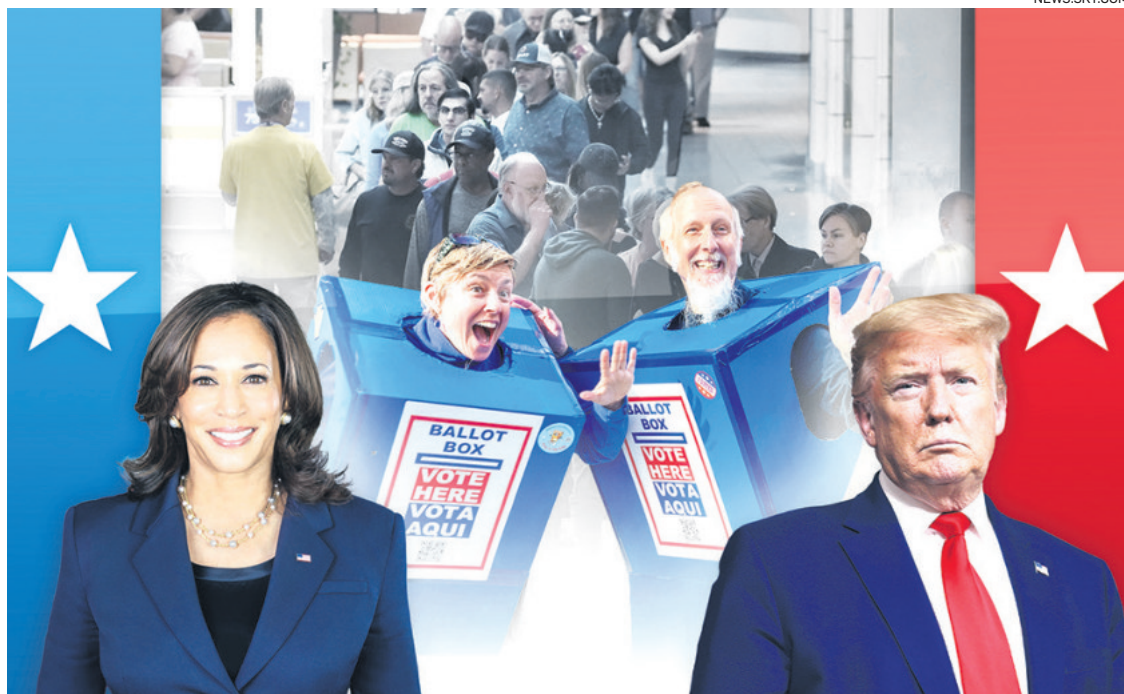
Harris y Trump compiten por votos en las elecciones estadounidenses, que se realizarán el martes