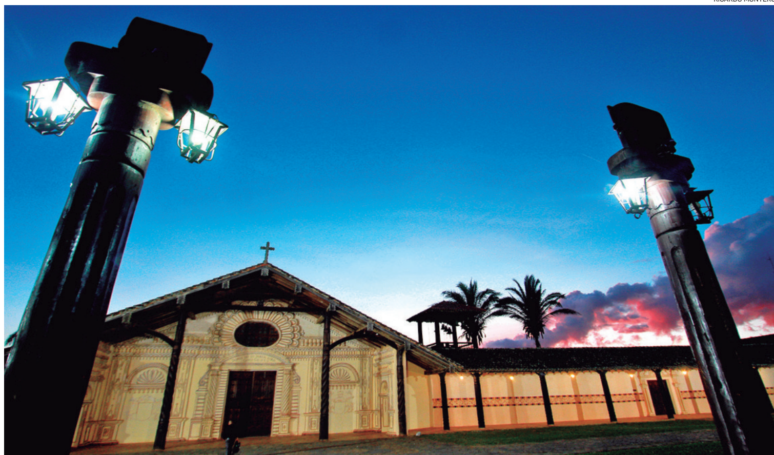
Las Misiones Jesuíticas en el departamento cruceño y beniano son los puntos más visitados por el turista en la región oriental del país.

Cámara Boliviana de Turismo (Cabotur), dijo que estas cifras muestran que aún no se ha alcanzado los números que se tenían en 2019 y por lo tanto se tiene “una recuperación demorada e insuficiente” en lo que viene a ser la llegada de visitantes del exterior del país.