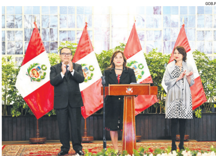
El gobierno peruano anunció las cinco ciudades sede de APEC Perú 2024

Según el documento, los representantes del Ejecutivo pidieron autorizar "el ingreso de personal militar extranjero con armas de guerra al territorio". El Congreso aceptó y el grupo de agentes estadounidenses llegará al Perú entre el 4 y el 24 de noviembre, un plazo