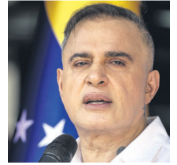
El fiscal que fue ratificado

Y en Carolina del Norte, con otros 16 compromisarios, Trump está por delante por 1,1 puntos: 48,4 % frente a 47,3 %.