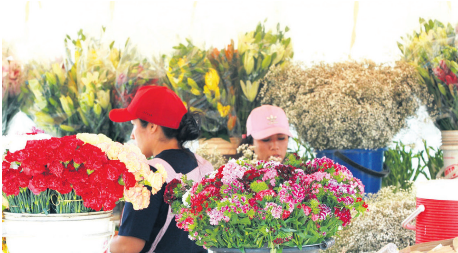
Los camposantos estarán abiertos hoy y mañana de 08:00 a 22:00 para que las familias puedan visitar a sus seres queridos que partieron