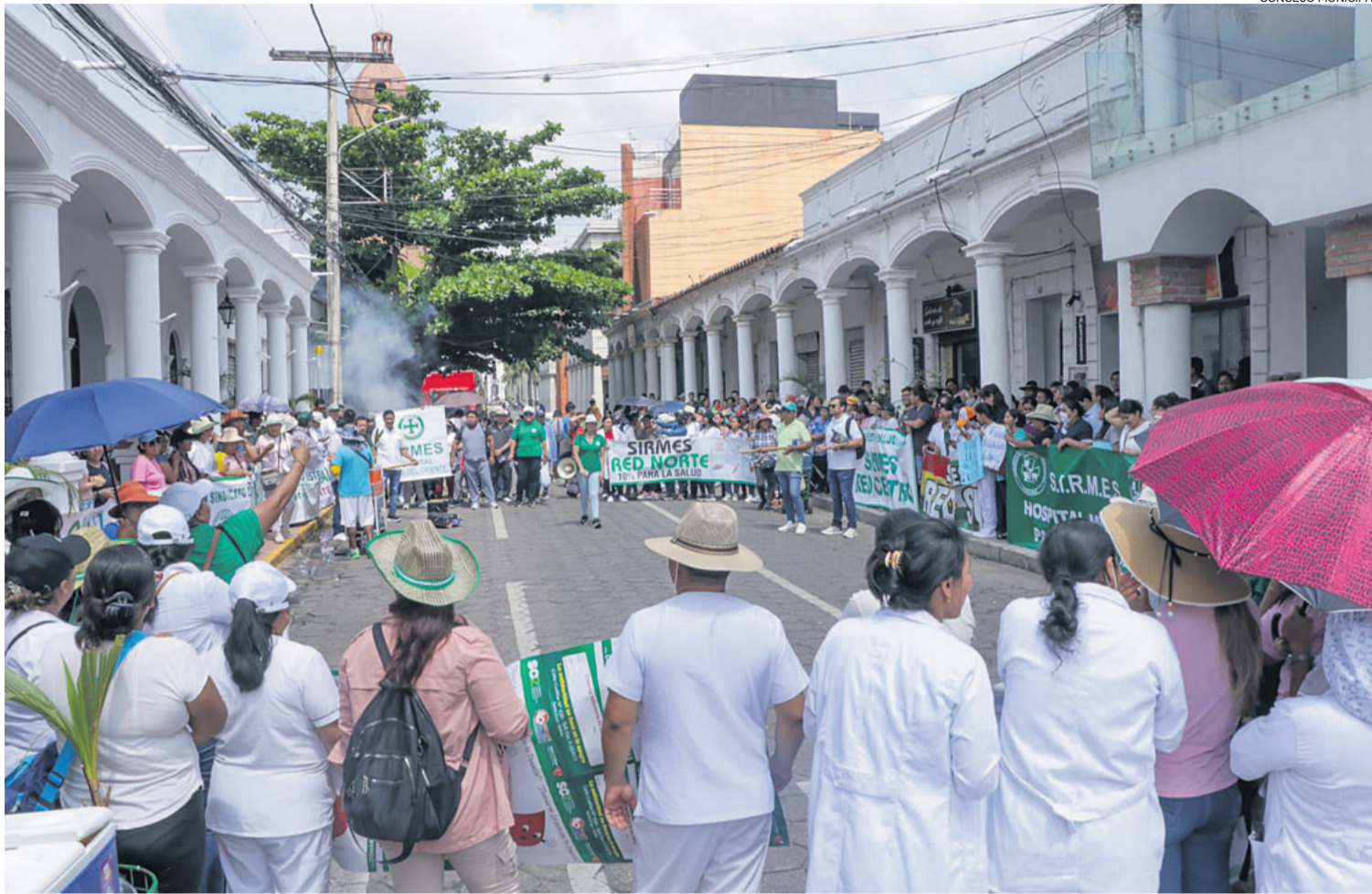
La protesta que hicieron los médicos y profesionales de salud en puertas del Concejo Municipal, donde llegaron a exponer las carencias