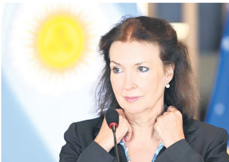
La excanciller Diana Mondino que dejó su cargo de ministra

difundidas desde Cancillería de que el voto de ayer en la ONU en favor de Cuba había sido una directriz de Presidencia, el portavoz respondió: "A mi no me consta y no importa lo que ocurra en segundo plano, lo que importa es que la agenda del presidente es muy clara, y en tal caso, quien no la pueda cumplir, porque no quiere, porque no puede, o por lo que sea, no importa, debe retirarse".