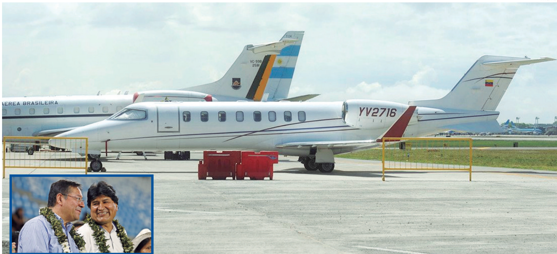
Aviones de Pdvsa son utilizados por Evo Morales desde que dejó de ser presidente boliviano. Además, el líder cocalero usa vehículos a nombre de un militar venezolano.