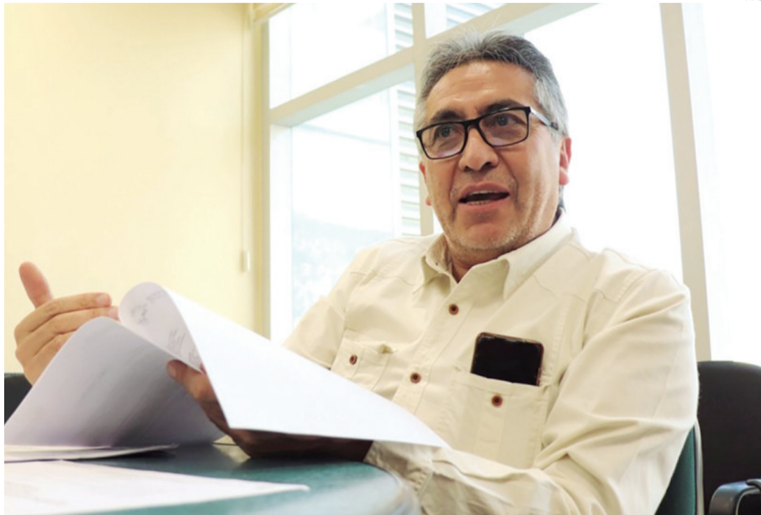
Gustavo Torrico, desempeñó diversos cargos en el MAS. Actualmente es viceministro en la gestión Arce