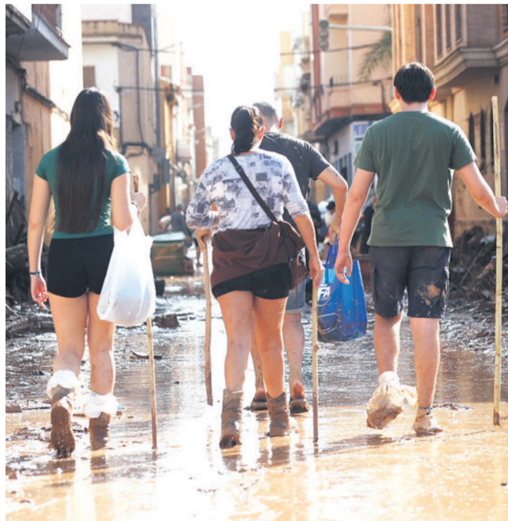
El penoso retorno de algunas personas a sus viviendas

Las imágenes devastadoras que deja la depresión aislada en niveles altos (dana) a su paso muestran calles convertidas en ríos, coches amontonados como