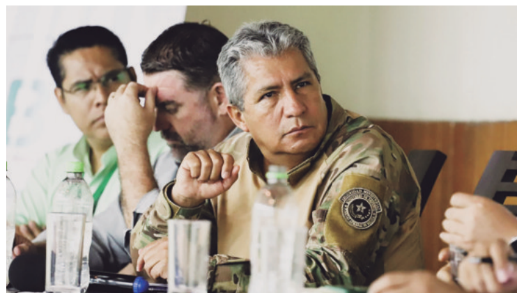
Edmundo Novillo, ministro de Defensa, aseguró que no renunció al cargo