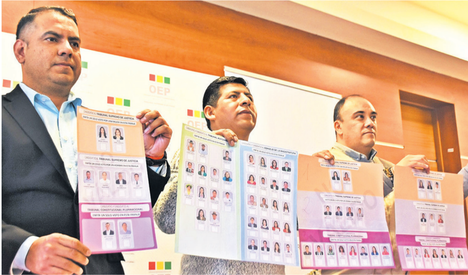
Vocales del TSE muestran las papeletas electorales que ya se mandaron a imprimir para que 7,3 millones de electores acudan a las urnas.