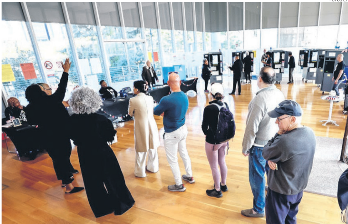
Las votaciones adelantadas se efectúan en varios estados a la espera de los comicios el 5 de noviembre

Es en estos estados donde las campañas han concentrado su inversión publicitaria y donde los candidatos están dedicando la mayor parte de su tiempo, lo