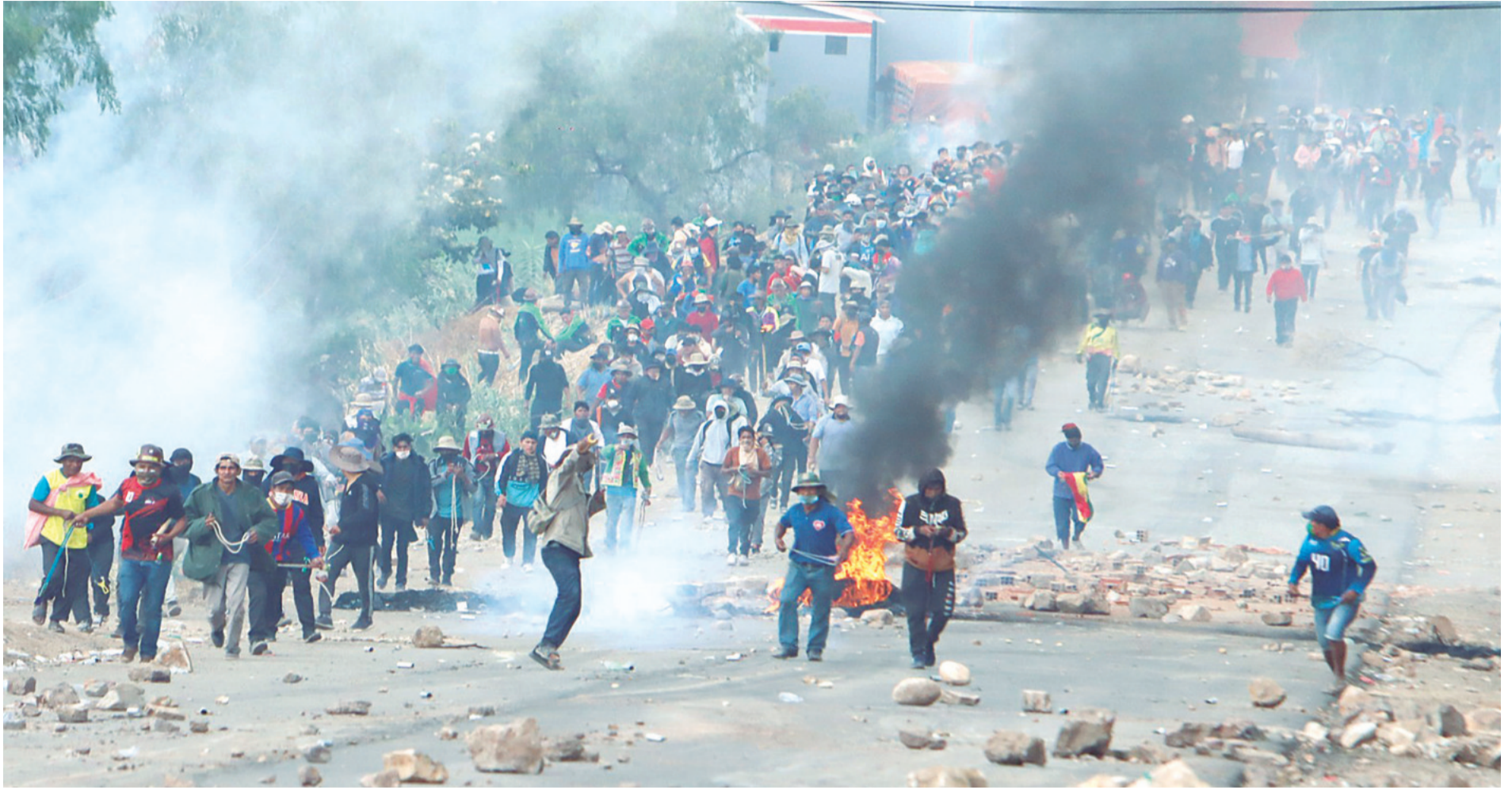
Policías y bloqueadores se enfrentaron en Parotani. Los movilizados recurrieron a dinamitas, piedras y palos para frenar la avanzada policial

UN EXDIRIGENTE HABLA DE 'SUBVERSIÓN ARMADA'